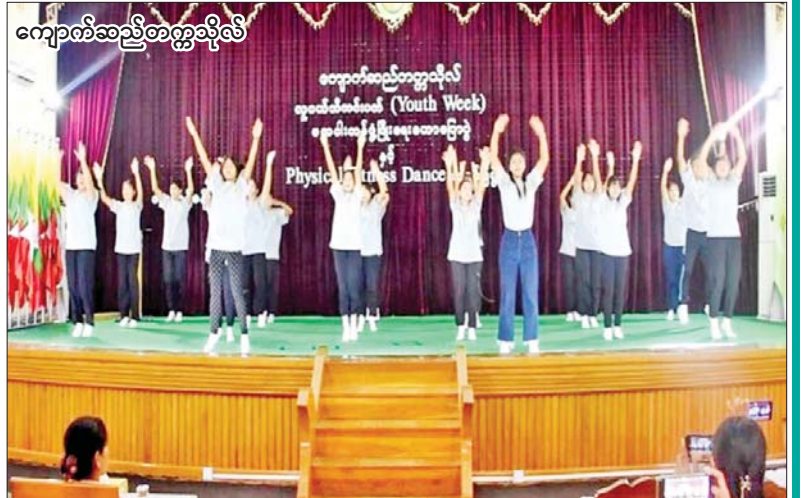
ကျောက်ဆည်တက္ကသိုလ်