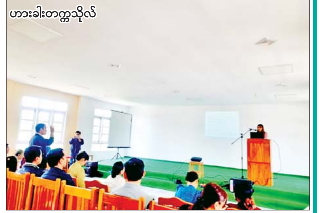
ဟားခါးတက္ကသိုလ်