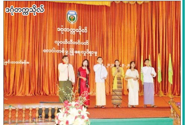
ဒဂုံတက္ကသိုလ်