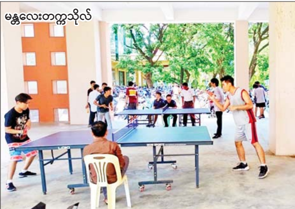
မန္တလေးတက္ကသိုလ်