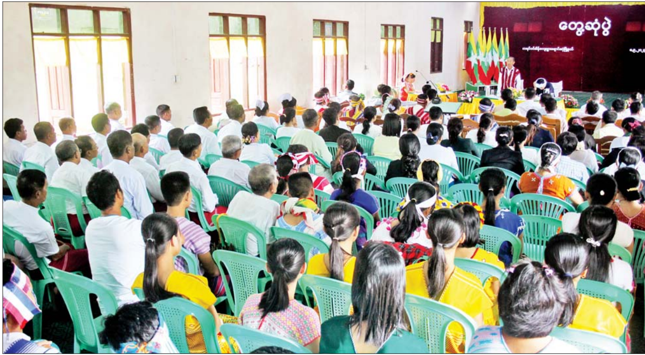
နိုင်ငံတော်စီမံအုပ်ချုပ်ရေးကောင်စီအဖွဲ့ဝင် မန်းငြိမ်းမောင် ချောင်းဆုံမြို့နယ်ရှိ တိုင်းရင်းသားပြည်သူများအား တွေ့ဆုံအမှာစကားပြောကြားစဉ်။

ထို့နောက် နိုင်ငံတော်စီမံအုပ်ချုပ်ရေးကောင်စီအဖွဲ့ဝင်များ၊ ပြည်နယ်ဝန်ကြီးချုပ်နှင့် ပြည်နယ်အစိုးရအဖွဲ့ဝင် ဝန်ကြီးများသည် ကရင်ဝင်းစိန် တောင်ပေါ်ကြီးကျောင်းတိုက် ဆရာတော် ဦးဝိမလအား ဖူးမြော်ကြည့်ကာ ဆရာတော်ထံ လှူဖွယ်ဝတ္ထုပစ္စည်းများ ဆက်ကပ်လှူဒါန်းကြသည်။ ညနေပိုင်းတွင် နိုင်ငံတော်စီမံအုပ်ချုပ်ရေးကောင်စီအဖွဲ့ဝင်များ၊ ပြည်နယ်ဝန်ကြီးချုပ်နှင့် ပြည်နယ်အစိုးရအဖွဲ့ဝင် ဝန်ကြီးများသည် မော်လမြိုင်မြို့ မြစေတီစာသင်တိုက်ကြီးသို့ ရောက်ရှိပြီး မြစေတီစာသင်တိုက် ဦးစီးပဓာန နာယက ဆရာတော် ဝိနယပိဋိပါရဂူ အဂ္ဂမဟာပဏ္ဍိတ ဘဒ္ဒန္တဝိမလဗုဒ္ဓိအရှင်သူမြတ်အား ဖူးမြော်ကြည့်၍ လှူဖွယ်ပစ္စည်းများ ဆက်ကပ်လှူဒါန်းပြီး ဩဝါဒခံယူခဲ့ကြကြောင်း သိရသည်။ သတင်းစဉ်