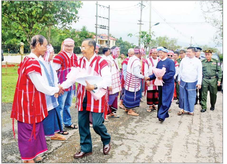
နိုင်ငံတော်စီမံအုပ်ချုပ်ရေးကောင်စီအဖွဲ့ဝင် မန်းငြိမ်းမောင်နှင့် ခွန်စုံလွင်တို့အား သထုံမြို့နယ်ရှိ တိုင်းရင်းသားပြည်သူများက ရင်းရင်းနှီးနှီးကြိုဆိုနှုတ်ဆက်ကြစဉ်။

ခွန်စုံလွင်က နိုင်ငံတော်၏ နိုင်ငံရေး၊ စီးပွားရေး၊ လူမှုရေး ချမှတ်အကောင်အထည်ဖော် ဆောင်ရွက်နေမှုများနှင့် ပတ်သက်၍ ရှင်းလင်းပြောကြားသည်။ ထို့နောက် ပအိုဝ်းတိုင်းရင်းသားများက ဒေသလိုအပ်ချက်များကို တင်ပြကြရာ နိုင်ငံတော်စီမံအုပ်ချုပ်ရေးကောင်စီအဖွဲ့ဝင် ခွန်စုံလွင်က တက်ရောက်လာသည့် ဌာနဆိုင်ရာတာဝန်ရှိသူများနှင့် ပေါင်းစပ်ညှိနှိုင်းကာ ဖြည့်ဆည်းဆောင်ရွက်ပေးသည်။ ယင်းနောက် နိုင်ငံတော်စီမံအုပ်ချုပ်ရေးကောင်စီ အဖွဲ့ဝင် ခွန်စုံလွင်က ပအိုဝ်းအမျိုးသား ဗိမာန်တော် တည်ဆောက်နိုင်ရေးအတွက် အလှူငွေကျပ်သိန်း ၂၀ ကို ပေးအပ်လှူဒါန်းရာ ပအိုဝ်းစာပေနှင့် ယဉ်ကျေးမှုအဖွဲ့မှ တာဝန်ရှိသူက လက်ခံရယူပြီး ဒေသထွက် အသီးအနှံနှင့် လက်ဆောင်ပစ္စည်းများ ပေးအပ်ကာ စုပေါင်းမှတ်တမ်းဓာတ်ပုံရိုက်ကြသည်။