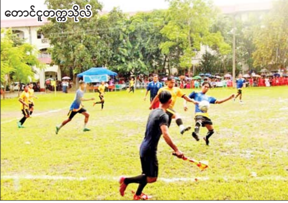
တောင်ငူတက္ကသိုလ်