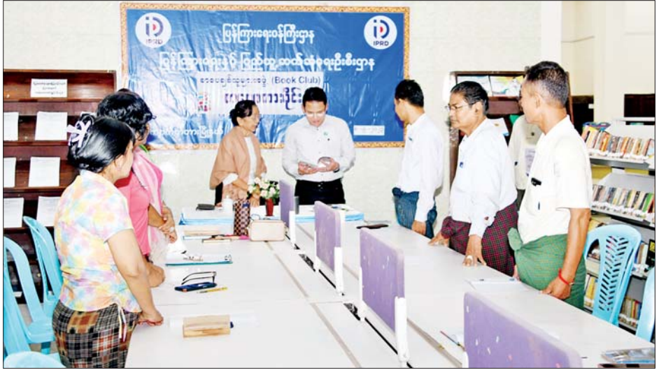
ပြည်ထောင်စုဝန်ကြီး ဦးမောင်မောင်အုန်း ပညာအလင်း ခေတ်မီစာကြည့်တိုက်တွင် ကျောက်တံတား မြို့နယ် စာပေချစ်သူများအဖွဲ့မှ စာရေးဆရာများ စာပေစကားဝိုင်း၌ စာပေဆွေးနွေးနေမှုကို ကြည့်ရှု အားပေးစဉ်။