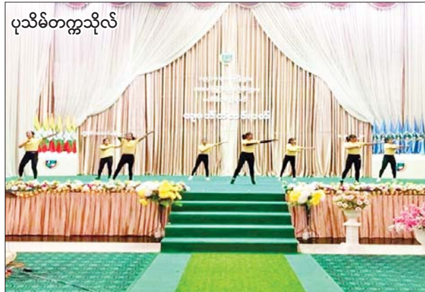
ပုသိမ်တက္ကသိုလ်