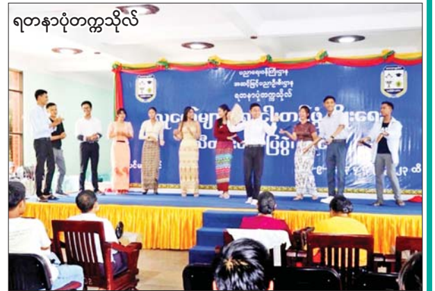
ရတနာပုံတက္ကသိုလ်