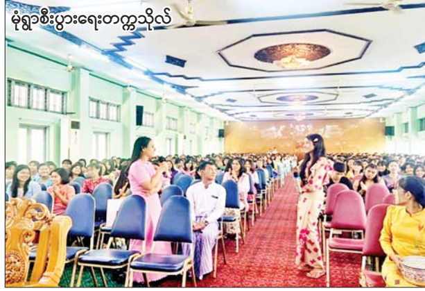
မုံရွာစီးပွားရေးတက္ကသိုလ်