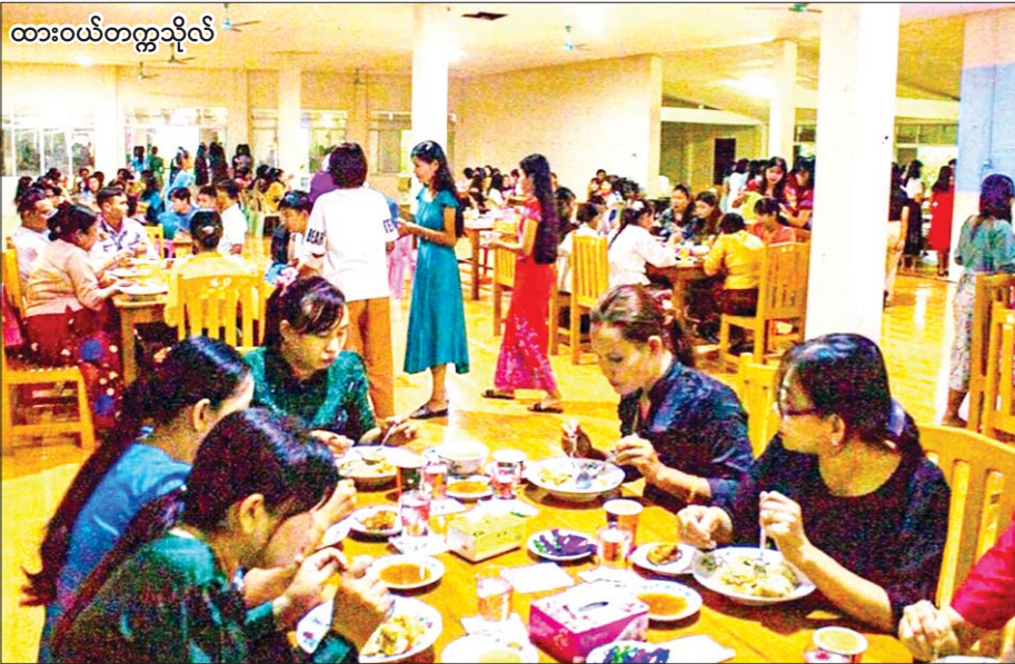
ထားဝယ်တက္ကသိုလ်