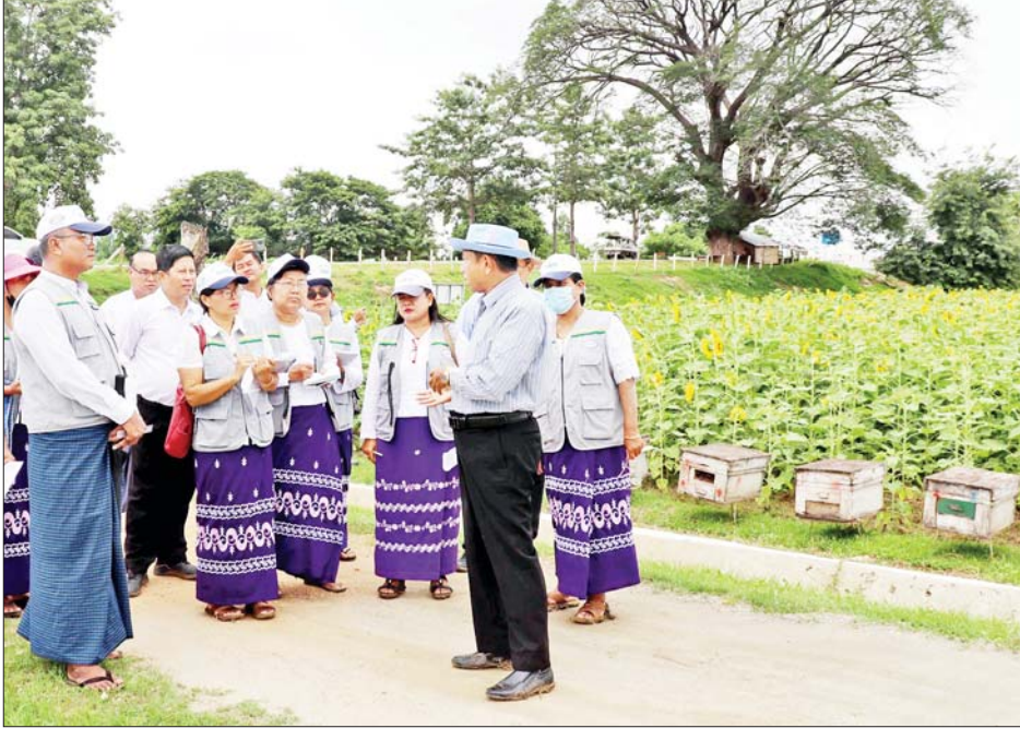
ရမည်းသင်းမြို့နယ် သာစည်ကျေးရွာရှိ ရွှေဒါး မျိုးသန့်ခြံ၌ ဝါမျိုးသစ် ရှစ်မျိုးစမ်းသပ်စိုက်ပျိုးထား ရှိမှုနှင့် အပင်ဖြစ်ထွန်းမှု၊ ဝါဝမ်းမွေးအရည်အသွေးနှင့် ဆွေးနွေးမှာကြားခဲ့ကြောင်း သိရသည်။ သတင်းစဉ်