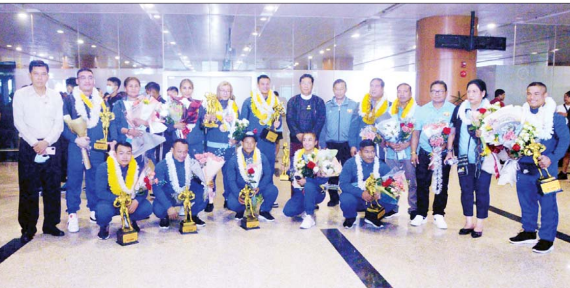
(၅၅)ကြိမ်မြောက် အာရှကာယဗလနှင့် ကာယကြံ့ခိုင်မှုအားကစားပြိုင်ပွဲတွင် ရွှေ၊ ငွေ၊ ကြေး ဆုတံဆိပ်များရရှိခဲ့သည့် မြန်မာကာယဗလအားကစားအဖွဲ့ကို တွေ့ရစဉ်။

နီပေါနိုင်ငံ ခတ္တမန္တမြို့၌ စက်တင်ဘာ ၁ ရက်မှ ၇ ရက်အထိကျင်းပခဲ့သည့် (၅၅)ကြိမ်မြောက် အာရှကာယဗလနှင့် ကာယကြံ့ခိုင်မှုအားကစားပြိုင်ပွဲတွင် ရွှေ၊ ငွေ၊ ကြေး ဆုတံဆိပ်များရရှိခဲ့သည့် မြန်မာကာယဗလအားကစားအဖွဲ့သည် ယနေ့နံနက်ပိုင်းက ရန်ကုန်အပြည်ပြည်ဆိုင်ရာလေဆိပ်သို့ ပြန်လည်ရောက်ရှိလာသည်။