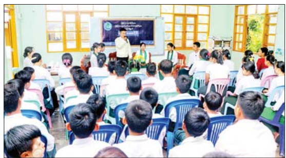
ပိုင်းကို ဆွေးနွေးခဲ့ကြပြီး တက်ရောက်လာကြသည့် ကျောင်းသားကျောင်းသူများက သိရှိလိုသည့် အချက်များကို မေးမြန်းဆွေးနွေးခဲ့ကြရာ တာဝန်ရှိသူများက ပြန်လည်ရှင်းလင်း ဖြေကြားပေးခဲ့သည်။

ထို့နောက် အလက(ခွဲ)၂၂၁ ကျောင်းမှ Grade-9 (စနစ်သစ်) ကျောင်းသား ကျောင်းသူများက “လူငယ်နှင့် ပညာရေး”၊ “လူတော်ဖြစ်အောင်ကြိုးစား လူကောင်းဖြစ်အောင်ကျင့်ကြံ”၊ “ခေတ်သစ်လူငယ်များနှင့်အနာဂတ်”၊ “ဗလင်းတန်ပြည့်စုံသော လူငယ်မောင်မယ်များ” စသည့်ခေါင်းစဉ်များဖြင့် လူငယ်စကား