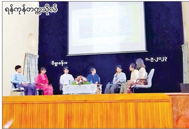
ရန်ကုန်တက္ကသိုလ်