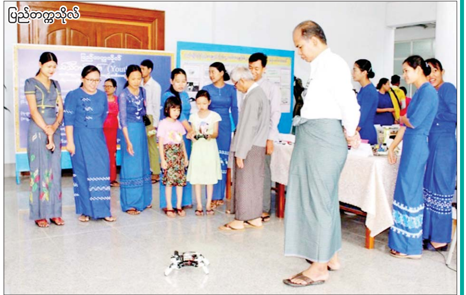
ပြည်တက္ကသိုလ်