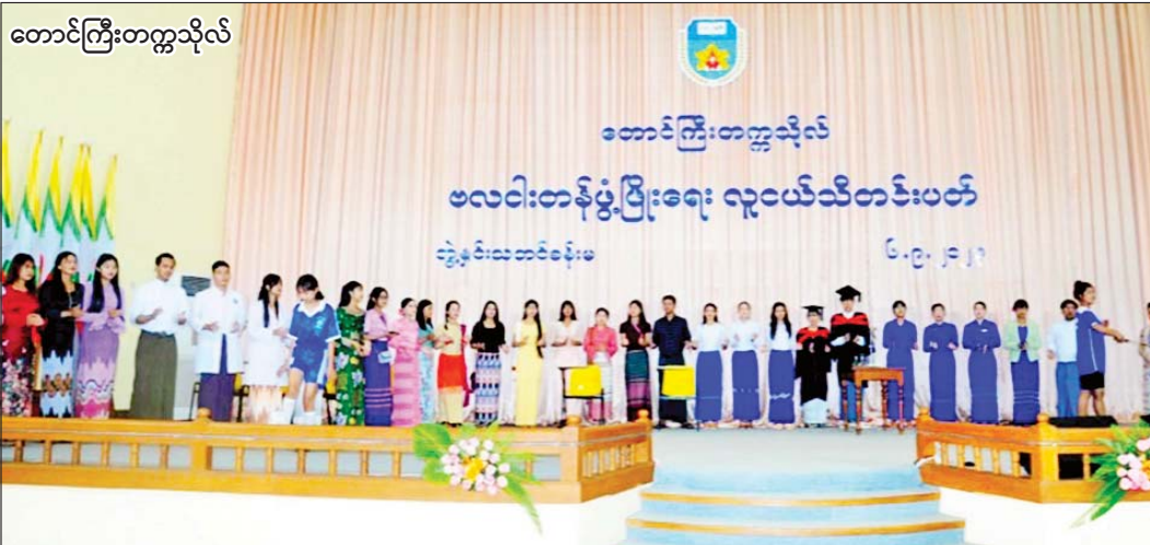
တောင်ကြီးတက္ကသိုလ်