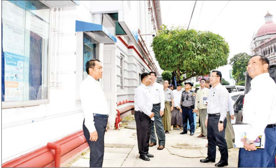
ပြည်ထောင်စုဝန်ကြီး ဦးမောင်မောင်အုန်း ပန်းဆိုးတန်းလမ်းရှိ ပြန်ကြားရေးနှင့်ပြည်သူ့ဆက်ဆံရေး ဦးစီးဌာနရုံးအဆောက်အအုံအား အကြီးစားပြင်ဆင်မွမ်းမံထားရှိမှုကို ကြည့်ရှုစစ်ဆေးစဉ်။