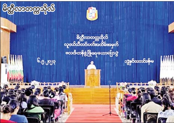
မိတ္ထီလာတက္ကသိုလ်