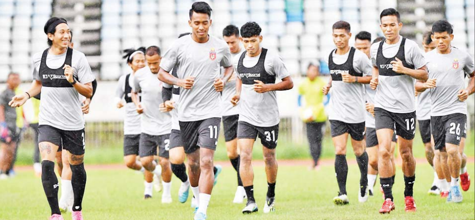
မြန်မာ့လက်ရွေးစင်အသင်း ကစားသမားများကို တွေ့ရစဉ်။

နှစ်ပွဲစလုံး သုဝဏ္ဏကွင်း၌ ယှဉ်ပြိုင်ကစားသွား မည်ဖြစ်သည်။ မြန်မာ့လက်ရွေးစင်အသင်းသည် အောက်တိုဘာလတွင် ယှဉ်ပြိုင်ရမည့် ၂၀၂၆ ကမ္ဘာ့ ဖလား အာရှဇုန် ပထမအဆင့်ခြေစစ်ပွဲအတွက် ကြိုတင်ပြင်ဆင်သည့်အနေဖြင့် ယှဉ်ပြိုင်ကစား ခြင်းဖြစ်ပြီး နှစ်ပေါင်းအနည်းငယ်အကြာတွင် အိမ်ကွင်း၌ ခြေစမ်းပွဲ ပြန်လည်ကစားခြင်းဖြစ်သည်။ စာမျက်နှာ ၁၅ ကော်လံ ၁ သို့ ၀