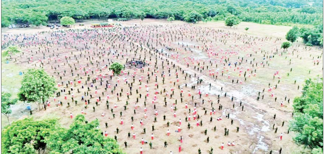
ကာကွယ်ရေးဦးစီးချုပ်ရုံး(ကြည်း၊ ရေ၊ လေ)မိသားစုများ၏ ၂၀၂၃ ခုနှစ် စတုတ္ထအကြိမ် မိုးရာသီသစ်ပင်စိုက်ပျိုးပွဲ ကျင်းပစဉ်။

စနစ်ထိန်းသိမ်းရေးအတွက် ကာကွယ်ရေးဦးစီးချုပ်ရုံး(ကြည်း၊ ရေ၊ လေ) မိသားစုများအနေဖြင့် ၂၀၁၁ ခုနှစ်မှ ၂၀၂၃ ခုနှစ် စတုတ္ထအကြိမ် သစ်ပင်စိုက်ပျိုးပွဲအထိ