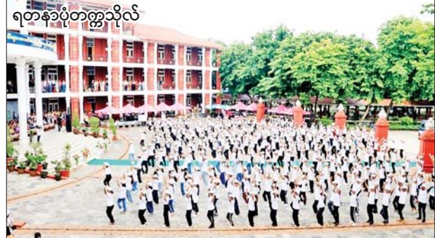
ရတနာပုံတက္ကသိုလ်