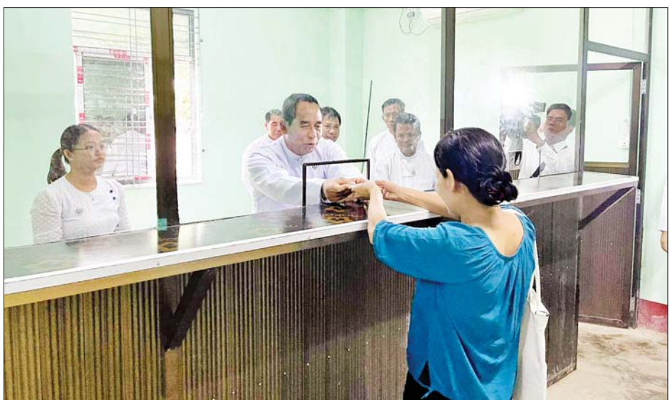
ပြည်ထောင်စုဝန်ကြီး ဦးမြင့်နောင် ပြည်ပသို့သွားရောက်အလုပ်လုပ်ကိုင်မည့် လုပ်သားတစ်ဦးအား ပြည်ပအလုပ်အကိုင် အလုပ်သမားသက်သေခံကတ်(OWIC) ပေးအပ်စဉ်။

ပြည်ပအလုပ်အကိုင်အကျိုးဆောင်လိုင်စင်ရအေဂျင်စီအစီအစဉ်ဖြင့် ပြည်ပနိုင်ငံများသို့ သွားရောက်လုပ်ကိုင်မည့် အလုပ်သမားများနှင့် မိမိအစီအစဉ်ဖြင့် ပြည်ပနိုင်ငံများသို့ သွားရောက်လုပ်ကိုင်မည့် အလုပ်သမားများအတွက် အလုပ်သမားညွှန်ကြားရေးဦးစီးဌာန ရွှေ့ပြောင်းအလုပ်သမားဌာနစု(မြောက်ဒဂုံ) ပင်လုံခန်းမ (၄၃) ရပ်ကွက်ဗိုလ်မင်းရောင်လမ်းနှင့် မင်းရဲကျော်စွာလမ်းထောင့် မြောက်ဒဂုံမြို့နယ် ရန်ကုန်တွင်လည်းကောင်း၊