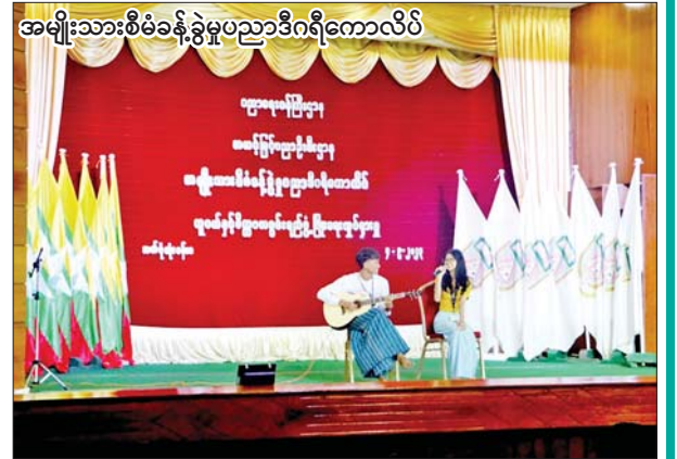
အမျိုးသားစီမံခန့်ခွဲမှုပညာဒီဂရီကောလိပ်