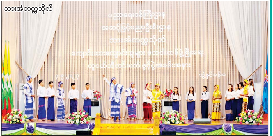
ဘားအံတက္ကသိုလ်