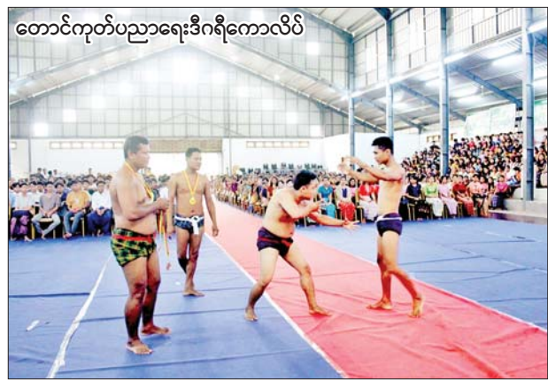
တောင်ကုတ်ပညာရေးဒီဂရီကောလိပ်