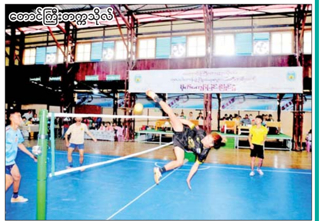
တောင်ကြီးတက္ကသိုလ်