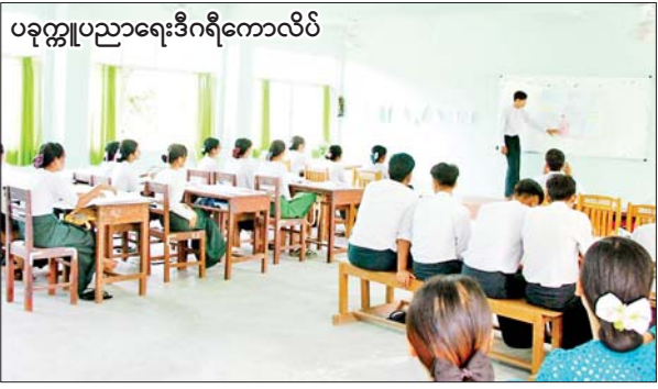
ပခုက္ကူပညာရေးဒီဂရီကောလိပ်