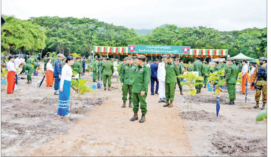
နိုင်ငံတော်စီမံအုပ်ချုပ်ရေးကောင်စီဥက္ကဋ္ဌ တပ်မတော်ကာကွယ်ရေးဦးစီးချုပ် ဗိုလ်ချုပ်မှူးကြီးမင်းအောင်လှိုင် အရာရှိစစ်သည် မိသားစုများ၏ စုပေါင်းသစ်ပင်စိုက်ပျိုးနေမှုကို ကြည့်ရှုအားပေးစဉ်။

ဦးစွာ နိုင်ငံတော်စီမံအုပ်ချုပ်ရေးကောင်စီဥက္ကဋ္ဌ တပ်မတော်ကာကွယ်ရေးဦးစီးချုပ်နှင့် ဇနီးတို့က ရတနာတန်းဝင် ကျွန်းပင်ကို ဦးဆောင်စိုက်ပျိုးပေးကြ