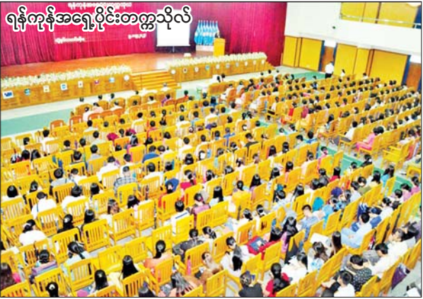
ရန်ကုန်အရှေ့ပိုင်းတက္ကသိုလ်