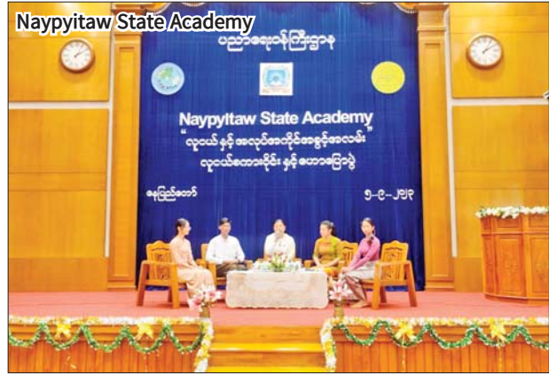
Naypyitaw State Academy