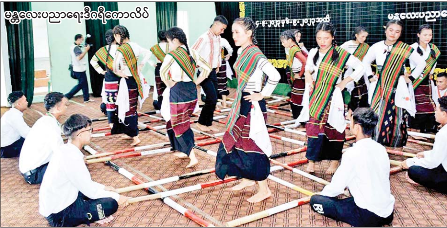
မန္တလေးပညာရေးဒီဂရီကောလိပ်