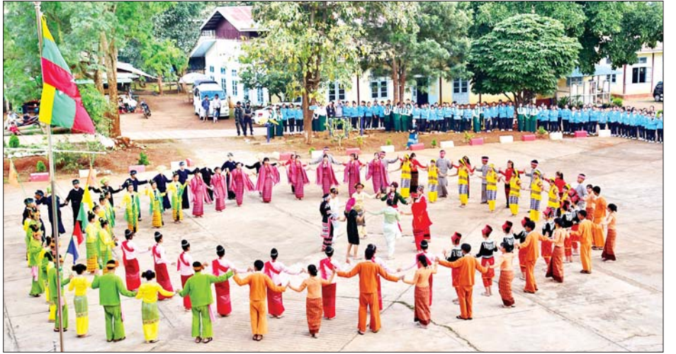
များက စာရိတ္တနှင့် ပြည်သူ့နီတိသင်ရိုးဝင်ဇာတ်လမ်း သရုပ်ဖော်တင်ဆက်ပြသခြင်း၊ မိတ္တဗလနှင့်ဘောဂ ဗလစွမ်းရည်ကိုဖွံ့ဖြိုးရေးဌာန၊ ICTဌာန ကျောင်းသား ကျောင်းသူများက ပြသကြပြီး ရှမ်းပြည်နယ် ဝန်ကြီးချုပ်က လူငယ်သီတင်းပတ်လှုပ်ရှားမှုအတွက် ဂုဏ်ပြုချီးမြှင့်ပေးအပ်ရာ တောင်ကြီးပညာရေး ဒီဂရီကောလိပ် ကျောင်းအုပ်ဆရာမကြီးက လက်ခံ ရယူကြောင်း သိရသည်။ ပြည်နယ်(ပြန်/ဆက်)

ယင်းနောက် ဉာဏဗလစွမ်းရည်ပြသရာ ဒုတိယနှစ်(ဒုတိယနှစ်ဝက်)ကျောင်းသား ကျောင်းသူ လေးများက သင်ရိုးသစ်၏ လုပ်ငန်းစဉ်ဖြင့်ပြသခြင်း၊ စာရိတ္တဗလစွမ်းရည်တွင် ကျောင်းသား ကျောင်းသူ