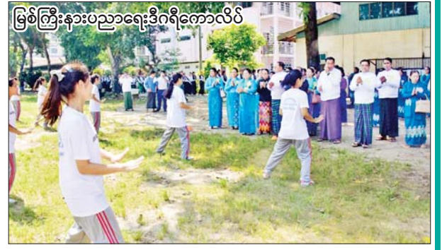
မြစ်ကြီးနားပညာရေးဒီဂရီကောလိပ်