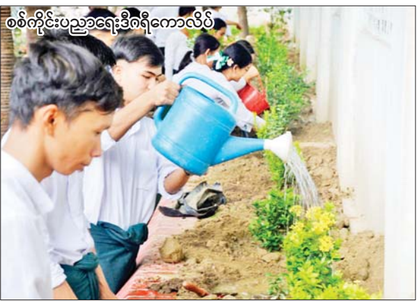
စစ်ကိုင်းပညာရေးဒီဂရီကောလိပ်