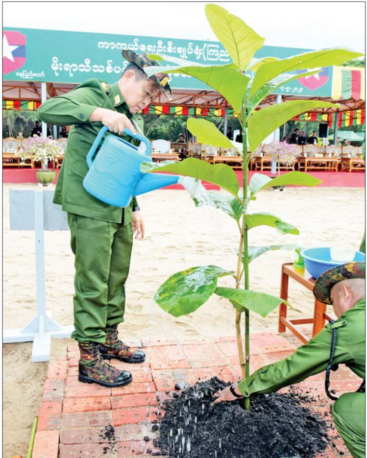
နိုင်ငံတော်စီမံအုပ်ချုပ်ရေးကောင်စီ ဒုတိယဥက္ကဋ္ဌ ဒုတိယတပ်မတော်ကာကွယ်ရေးဦးစီးချုပ် ကာကွယ်ရေးဦးစီးချုပ် (ကြည်း) ဒုတိယဗိုလ်ချုပ်မှူးကြီးစိုးဝင်း ရတနာတန်းဝင်ကျွန်းပင်ကို စိုက်ပျိုးပေးစဉ်။