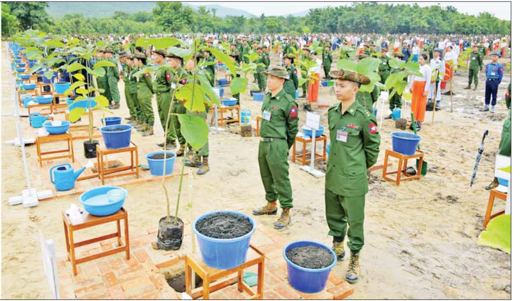
နိုင်ငံတော်စီမံအုပ်ချုပ်ရေးကောင်စီဥက္ကဋ္ဌ တပ်မတော်ကာကွယ်ရေးဦးစီးချုပ် ဗိုလ်ချုပ်မှူးကြီး မင်းအောင်လှိုင် ကာကွယ်ရေးဦးစီးချုပ်ရုံး(ကြည်း၊ ရေ၊ လေ) မိသားစုများ၏ ၂၀၂၃ ခုနှစ် စတုတ္ထအကြိမ် မိုးရာသီသစ်ပင်စိုက်ပျိုးပွဲတွင် အမှာစကားပြောကြားစဉ်။