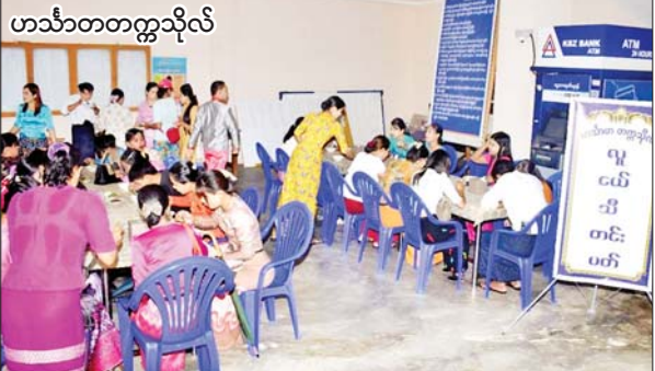
ဟင်္သာတတက္ကသိုလ်