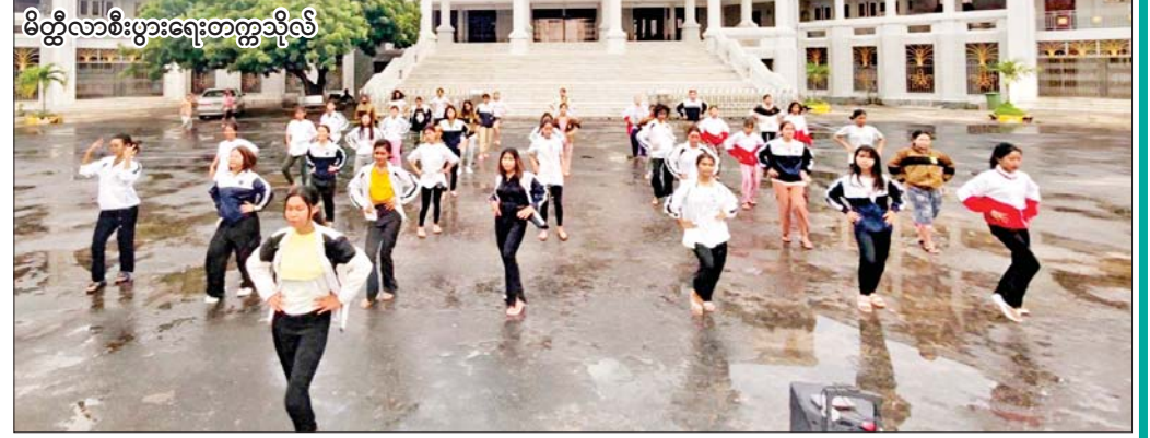
မိတ္ထီလာစီးပွားရေးတက္ကသိုလ်