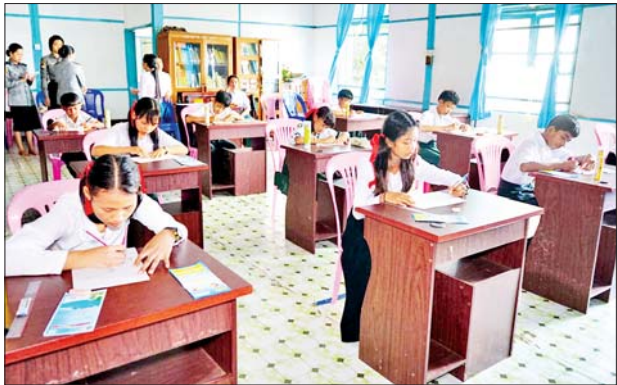
၂၀ နှင့် မူလတန်းအဆင့် ပန်းချီပြိုင်ပွဲကို ကျောင်းသား ကျောင်းသူ ၁၀ ဦး တို့ ဝင်ရောက်ယှဉ်ပြိုင်ခဲ့ကြကြောင်း သိရသည်။ ခင်စန်းမြင့် (ပြန်/ဆက်)

မော်လမြိုင် စက်တင်ဘာ ၇ ၂၀၂၃ခုနှစ် စက်တင်ဘာ ၁၃ ရက်တွင် ကျရောက်မည့်(၁၁) ကြိမ်မြောက် မြန်မာနိုင်ငံလူကုန်ကူးမှုတိုက်ဖျက်ရေးနေ့ အထိမ်းအမှတ် အဖြစ် မွန်ပြည်နယ် အမှတ် (၉) လူကုန်ကူးမှု တားဆီးနှိမ်နင်းရေး တပ်ဖွဲ့စု(မော်လမြိုင်)နှင့် ခရိုင်ပြန်ကြားရေးနှင့် ပြည်သူ့ဆက်ဆံရေး ဦးစီးဌာနတို့ပူးပေါင်း၍ အထက်တန်းအဆင့် စာစီစာကုံးနှင့် မူလတန်း အဆင့် ပန်းချီပြိုင်ပွဲကို ယနေ့တွင် ပြန်ကြားရေးနှင့် ပြည်သူ့ဆက်ဆံရေး ဦးစီးဌာန လူထုအခြေပြုဗဟိုဌာနခန်းမ၌ ကျင်းပသည်။