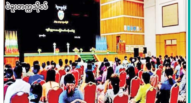
ဖဲနူးတက္ကသိုလ်