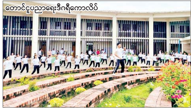
တောင်ငူပညာရေးဒီဂရီကောလိပ်