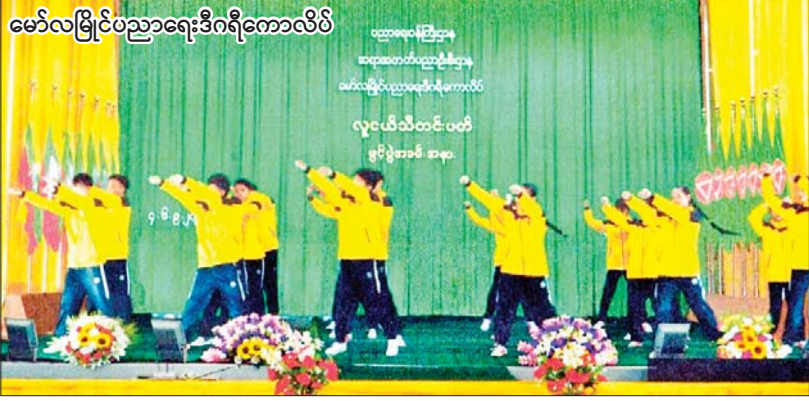
မော်လမြိုင်ပညာရေးဒီဂရီကောလိပ်