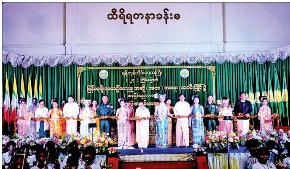
ဖဲကြိုးဖြတ် ဖွင့်လှစ်ပေးကြပြီး ဒဂုံမြို့နယ် အမှတ်(၁) ကျောင်း၊ ဒဂုံမြို့သစ်(တောင်ပိုင်း) မြို့နယ် အမှတ်(၂) အခြေခံပညာအထက်တန်းကျောင်း၊ ကမာရွတ် အခြေခံပညာအထက်တန်းကျောင်း၊ မင်္ဂလာဒုံမြို့နယ် မြို့နယ် အမှတ်(၂) အခြေခံပညာ အထက်တန်း အမှတ်(၂) အခြေခံပညာ အထက်တန်းကျောင်း၊

နေပြည်တော် စက်တင်ဘာ ၆ ရန်ကုန်တိုင်းဒေသကြီး၏ (၂၄) ကြိမ်မြောက် မြန်မာ့ရိုးရာယဉ်ကျေးမှု အဆို၊ အက၊ အရေး၊ အတီး ပြိုင်ပွဲ (အခြေခံပညာအဆင့်) ဖွင့်ပွဲကို ယနေ့နံနက် တွင် အလုံမြို့နယ်ရှိ အမှတ်(၄)အခြေခံပညာအထက် တန်းကျောင်း သီရိရတနာခန်းမ၌ ကျင်းပရာ တိုင်းဒေသကြီးဝန်ကြီးချုပ် ဦးစိုးသိန်း၊ ရန်ကုန်တိုင်း စစ်ဌာနချုပ် တိုင်းမှူး ဗိုလ်ချုပ်ဇော်ဟိန်းနှင့် တိုင်းဒေသကြီး ဝန်ကြီးများ၊ မြန်မာနိုင်ငံ ဂီတ၊ သဘင် အစည်းအရုံး၊ ပြိုင်ပွဲကျင်းပရေးဦးစီးကော်မတီနှင့် ဆက်သွယ်ရေးကော်မတီတို့မှ တာဝန်ရှိသူများ၊ ပြိုင်ပွဲအကဲဖြတ် ပညာရှင်များ၊ ပြိုင်ပွဲဝင် မျိုးဆက်သစ်များနှင့် မိသားစု ဝင်များ၊ အနုပညာချစ်မြတ်နိုးသူများ တက်ရောက် ကြည့်ရှုသည်။