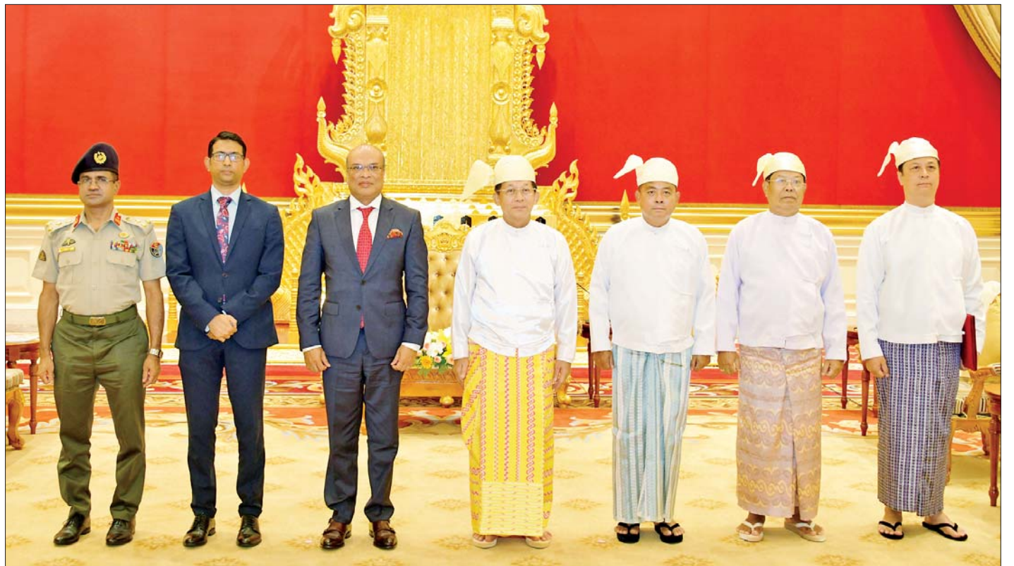
နိုင်ငံတော်စီမံအုပ်ချုပ်ရေးကောင်စီဥက္ကဋ္ဌ နိုင်ငံတော်ဝန်ကြီးချုပ် ဗိုလ်ချုပ်မှူးကြီးမင်းအောင်လှိုင်နှင့် မြန်မာနိုင်ငံဆိုင်ရာ ဘင်္ဂလားဒေ့ရှ်နိုင်ငံ သံအမတ်ကြီး H.E. Dr. Md. Monwar Hossain တို့ တာဝန်ရှိသူများနှင့်အတူ စုပေါင်းမှတ်တမ်းတင် ဓာတ်ပုံရိုက်စဉ်။