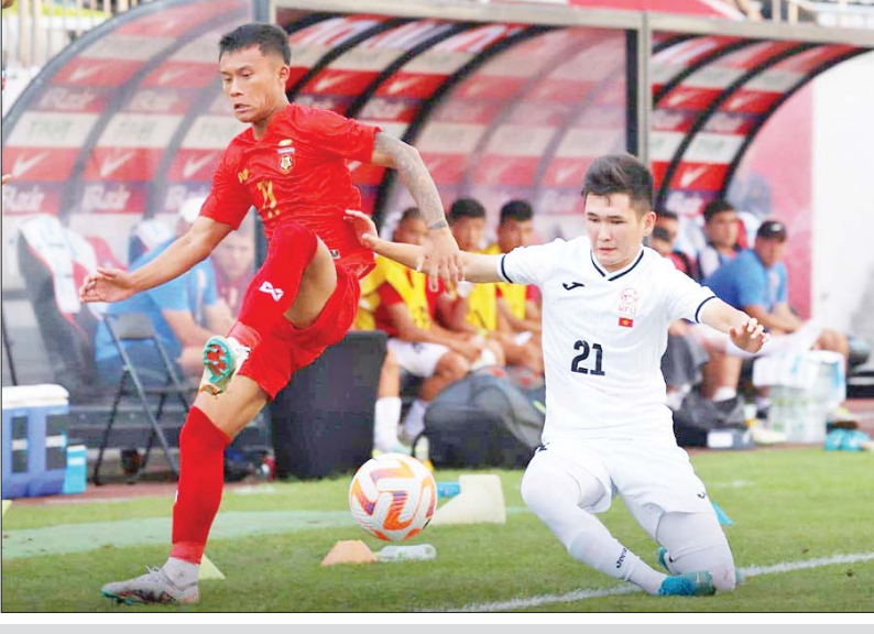
မြန်မာအသင်းနှင့် ကာဂျစ္စတန်အသင်းတို့ ယှဉ်ပြိုင်ကစားကြစဉ်။