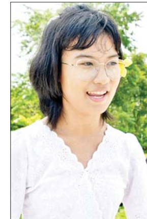
မရည်မွန်အောင်

မတိုင်ခင်ကတော့ လူဝင်ကြေးပါ ငွေကျပ် ၁၀၀၀ ပေးဆောင်ရမယ်လို့ ထုတ်ပြန်ထားတာ တွေ့ရတယ်။ အခုတော့ လူဝင်ကြေးက အခမဲ့ပါ။ ဘာပဲဖြစ်ဖြစ် ဗုဒ္ဓဘာသာဝင်အားလုံးက ဘုရား၊ ကျောင်းသွားရင် ကိုယ်တတ်နိုင်တဲ့ အလှူဒါနတော့ ပြုလုပ်လေ့ရှိပါတယ်။ ဒါပေမယ့် ဝင်ကြေးကောက်ခံတဲ့နေရာမှာ ကားတွေကို ဘုရားကြီးပရိဝုဏ်အပြင်ဘက်မှာ ရပ်ထားခဲ့မယ်ဆိုရင် ဝင်ကြေးပေးဆောင်စရာ မလိုပါဘူး။ အပြင်မှာလည်း ကားပါကင်တွေက အကျယ်ကြီးပါ။ ပြီးတော့ လုံခြုံမှုလည်းရှိပါတယ်။ ဖုန်းတွေဆိုရင်လည်း မှတ်တမ်းတွေယူလို့ရတဲ့အတွက် ငွေကျပ် ၁၀၀၀ ဆိုတာ ဈေးတွက်နဲ့တွက်မယ်ဆိုရင် အများကြီးတန်ပါတယ်။ ဒါလည်း အလှူတစ်ခု နေ့စဉ်ပြုနေကြတဲ့ ကျွန်မတို့ ဗုဒ္ဓဘာသာဝင်တွေအတွက် အလှူတစ်ခုလိုပဲ သဘောထားမယ်ဆိုရင် ကုသိုလ်ကောင်းမှုတွေ တိုးပွားလာကြမှာပါ။