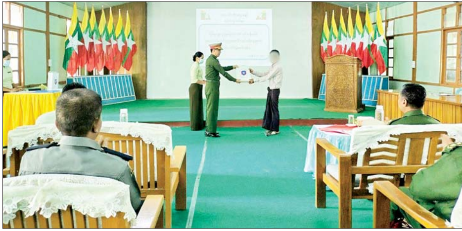
ဌာနချုပ် နယ်မြေခံတပ်နယ်မှ တာဝန်ရှိသူများ၊ ခရိုင်/မြို့နယ်စီမံအုပ်ချုပ်ရေးအဖွဲ့ဝင်များ၊ ဌာနဆိုင်ရာတာဝန်ရှိသူများ၊ ဥပဒေဘောင်အတွင်း ဝင်ရောက်လာသူများနှင့် ၎င်းတို့၏ မိဘအုပ်ထိန်းသူများ တက်ရောက်ကြသည်။

နေပြည်တော် စက်တင်ဘာ ၆ နိုင်ငံတော်စီမံအုပ်ချုပ်ရေးကောင်စီသည် PDF အပါအဝင် အဖွဲ့အစည်းအမျိုးမျိုးအမည်ခံ၍ လက်နက်ကိုင် ဆန့်ကျင်လျက်ရှိသည့် အဖွဲ့အစည်းများအတွင်း ရောက်ရှိနေသူများအား ဥပဒေဘောင်အတွင်းသို့ ပြန်လည်ဝင်ရောက်ရန် ဖိတ်ခေါ်၍ ဥပဒေဘောင်အတွင်းသို့ ဝင်ရောက်လာသူများကို လိုအပ်သည့် ကူညီပံ့ပိုးမှုများ ဆောင်ရွက်ပေးသွားမည်ဖြစ်ကြောင်း နှင့် လက်နက်/ခဲယမ်းများဖြင့် ဝင်ရောက်လာသူများကို ဆုကြေးငွေများ ထောက်ပံ့ပေးသွားမည်ဖြစ်ကြောင်း ထုတ်ပြန်ထားရှိပြီးဖြစ်ရာ ယနေ့မွန်းလွဲပိုင်းတွင် ပြစ်မှုကျူးလွန်ခြင်းမရှိသော PDF အဖွဲ့မှ အလင်းဝင်ရောက်လာသူများအား မိဘအုပ်ထိန်းသူများထံ ပြန်လည်လွှဲပြောင်းပေးအပ်ခြင်းကို မန္တလေးတိုင်းဒေသကြီး စဉ့်ကူးမြို့နယ်စီမံအုပ်ချုပ်ရေးအဖွဲ့ရုံးအစည်းအဝေးခန်းမ၌ပြုလုပ်ရာ အလယ်ပိုင်းတိုင်းစစ်