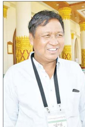
ဦးတင်အောင်ထွန်း