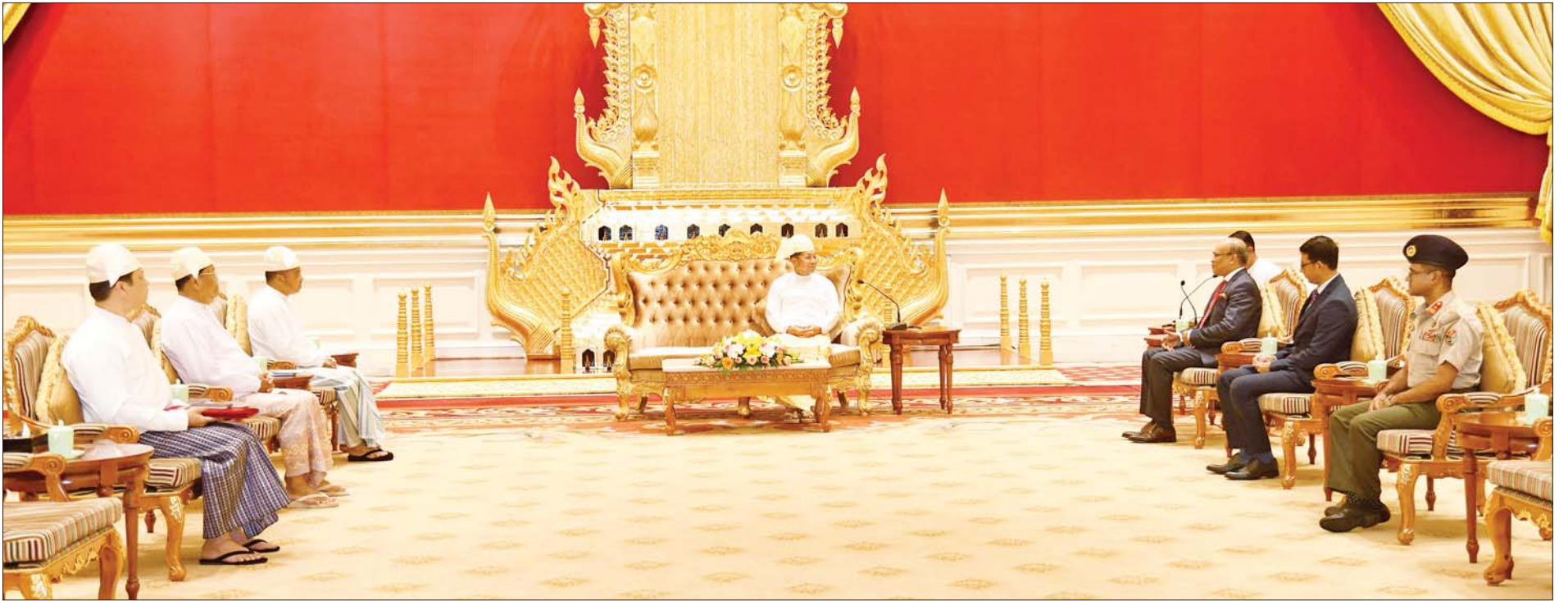
နိုင်ငံတော်စီမံအုပ်ချုပ်ရေးကောင်စီဥက္ကဋ္ဌ နိုင်ငံတော်ဝန်ကြီးချုပ် ဗိုလ်ချုပ်မှူးကြီးမင်းအောင်လှိုင် မြန်မာနိုင်ငံဆိုင်ရာ ဘင်္ဂလားဒေ့ရှ်နိုင်ငံ သံအမတ်ကြီး H.E. Dr. Md. Monwar Hossain အား လက်ခံတွေ့ဆုံစဉ်။