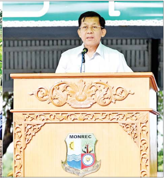
နိုင်ငံတော်စီမံအုပ်ချုပ်ရေးကောင်စီဥက္ကဋ္ဌ နိုင်ငံတော်ဝန်ကြီးချုပ် ဗိုလ်ချုပ်မှူးကြီးမင်းအောင်လှိုင် ပြည်ထောင်စုနယ်မြေ နေပြည်တော် ၂၀၂၃ ခုနှစ် တတိယအကြိမ် မိုးရာသီသစ်ပင်စိုက်ပျိုးပွဲတွင် အမှာစကား ပြောကြားစဉ်။