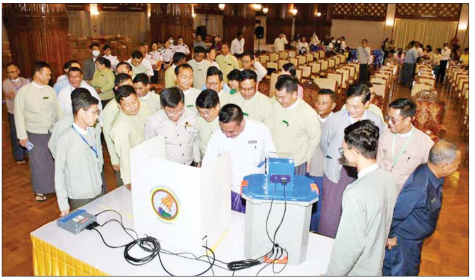
ထမ်းများ၏ လက်တွေ့မဲပေးမှု အတွေ့အကြုံများမှ အကြံပြု ဆွေးနွေးချက်များရှိပါ ကလည်း ယင်းအကြံပြုချက်များ အပေါ် သုံးသပ်၍ ပိုမိုကောင်းမွန် သိရသည်။ ဆောင်ရွက်သွားမည်ဖြစ်ကြောင်း သတင်းစဉ်

ရှင်းလင်းဆွေးနွေးခြင်းများကို မဲဆန္ဒရှင်အသိပညာပေးလုပ်ငန်းတစ်ရပ်အနေဖြင့် စနစ်တကျ ဆောင်ရွက်လျက်ရှိရာ ယနေ့အထိ ရန်ကုန်တိုင်းဒေသကြီးအစိုးရအဖွဲ့ အပါအဝင် ဝန်ကြီးဌာနအဖွဲ့အစည်း ၃၂ ခု၌ အရာထမ်း၊ အမှုထမ်းစုစုပေါင်း ၆၃၁၄ ဦးတို့က လက်တွေ့စမ်းသပ်မဲပေးခြင်းများ ဆောင်ရွက်ခဲ့ပြီး ဖြစ်သော်လည်း စက်နှင့်ပတ်သက်၍ ချို့ယွင်းချက်တစ်စုံတစ်ရာမျှ ဖြစ်ပေါ်ခြင်းမျိုး မရှိသည့်အတွက် MEVM စက် အသုံးပြုမှုအပေါ်တွင် စိတ်ချယုံကြည်စွာ ဆောင်ရွက်နိုင်မည်ဖြစ်သည်။ စမ်းသပ်မဲပေးခဲ့ကြသည့် ဝန်ကြီးဌာနအဖွဲ့အစည်းများမှ အရာထမ်း၊ အမှု