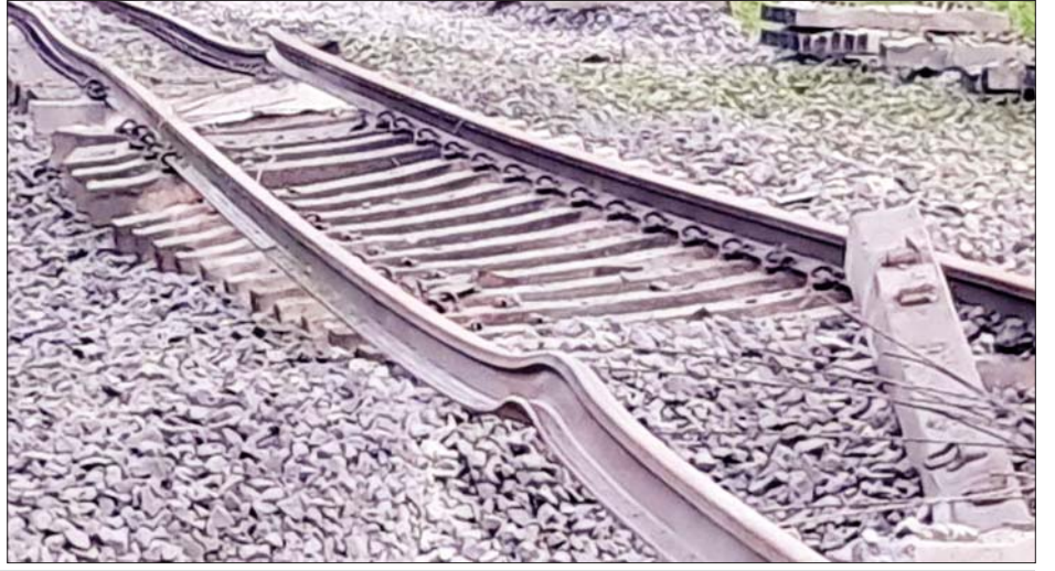
ရန်ကုန်-မန္တလေးရထားလမ်းပိုင်း ပိန်းဇလုပ်ဘူတာနှင့် တော်ဝိဘူတာအကြားရှိ ရထားလမ်းကို အကြမ်းဖက်သောင်းကျန်းသူများက မိုင်းထောင်ဖောက်ခွဲဖျက်ဆီးထားသောကြောင့် သံလမ်းများ ပြတ်တောက်ပျက်စီးနေသည်ကို တွေ့ရစဉ်။

○ ကျော့ဖုံးမှ နံနက် ၃ နာရီ ၃၂ မိနစ်တွင် ရောက်ရှိစဉ် ရထား မီး ရောင်အောက်၌ တံတားအမှတ်(BR-137)ပေါ် နှင့် ရထားလမ်းအနီးတစ်ဝိုက်တွင် အကြမ်းဖက် သောင်းကျန်းသူများက မိုင်းဖောက်ခွဲထားသော ကြောင့် သံလမ်းများပြတ်တောက်ပျက်စီးနေကြောင်း တွေ့ရှိရသဖြင့် စက်ခေါင်းမောင်းက ရထားအား အချိန်မီရပ်တန့်ပြီး ပိန်းဇလုပ်ဘူတာသို့ နောက်ပြန် ဆုတ်ခွာရပ်တန့်၍ လမ်းပိုင်းအား နံနက် ၄ နာရီ ၁၀