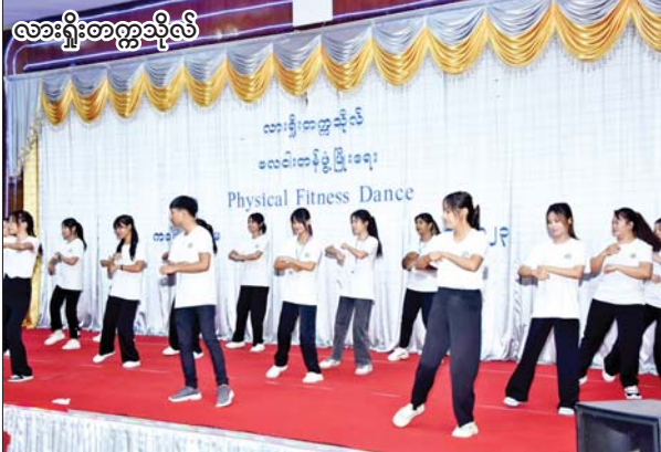
လားရှိုးတက္ကသိုလ်