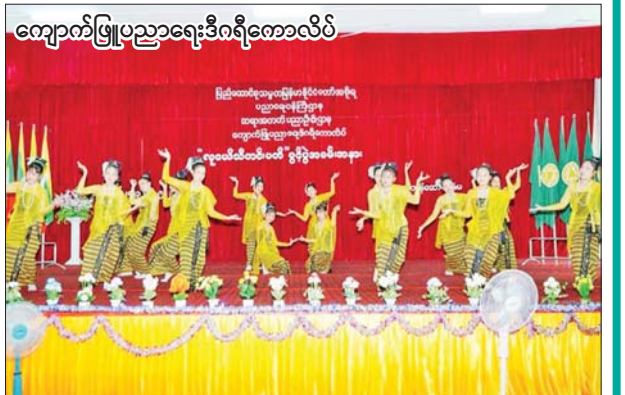
ကျောက်ဖြူပညာရေးဒီဂရီကောလိပ်