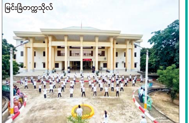
မြင်းခြံတက္ကသိုလ်