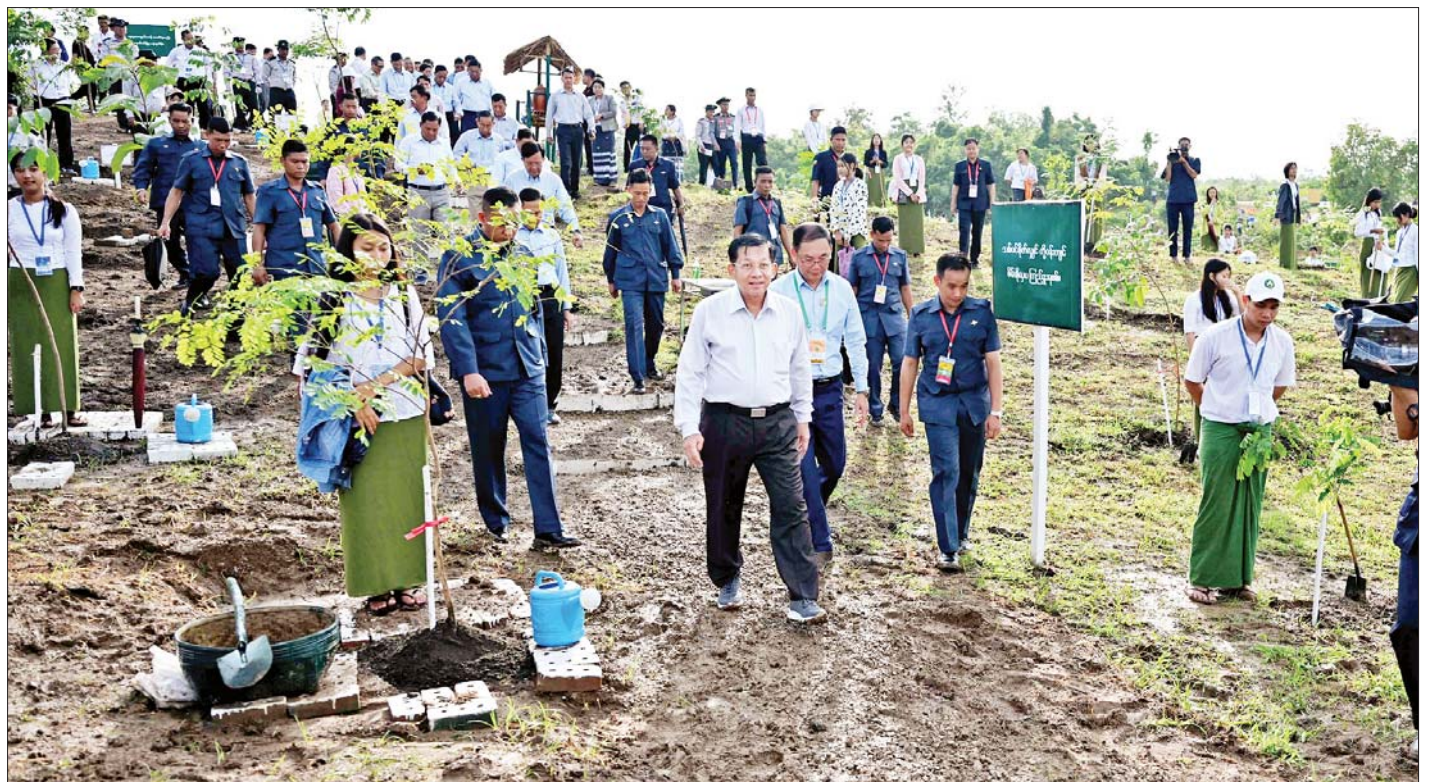
နိုင်ငံတော်စီမံအုပ်ချုပ်ရေးကောင်စီဥက္ကဋ္ဌ နိုင်ငံတော်ဝန်ကြီးချုပ် ဗိုလ်ချုပ်မှူးကြီးမင်းအောင်လှိုင်နှင့်အဖွဲ့ဝင်များ ၂၀၂၃ ခုနှစ် တတိယအကြိမ် မိုးရာသီသစ်ပင် စိုက်ပျိုးပွဲတွင် တက်ရောက်လာကြသူများက ပျိုးပင်များအား တပျော်တပါး စိုက်ပျိုးနေမှုကို လှည့်လည်ကြည့်ရှုအားပေးကြစဉ်။

၂၀၂၃ ခုနှစ် မေ ၁၄ ရက်၌ ရခိုင်ပြည်နယ်တွင် တိုက်ခတ်ခဲ့သည့် မိုခါမုန်တိုင်းကြောင့် စစ်တွေမြို့ အပါအဝင် မုန်တိုင်းဒဏ်ခံခဲ့ရသည့် မြို့နယ် ၁၀ မြို့နယ်ကို ပြန်လည်ထူထောင်ရေးလုပ်ငန်းများ တွင် တစ်ခုအပါအဝင်ဖြစ်သည့် သစ်ပင်စိုက်ပျိုး ထိန်းသိမ်းခြင်းကို သဘာဝဘေးအန္တရာယ်များမှ ကြံ့ကြံခိုင်ရန် အရှိန်အဟုန်ဖြင့် ဆောင်ရွက်ပေးနေ သည်ကို အားလုံးအသိပင်ဖြစ်ပါကြောင်း၊ ထို့ကြောင့် သဘာဝဘေးအန္တရာယ်များ တားဆီးကာကွယ်နိုင်ရန် အတွက် သစ်တောပြုန်းတီးမှု လျော့နည်းရေးနှင့်