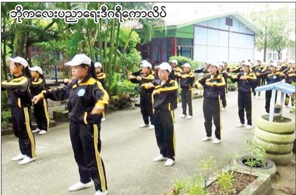
ဘိုကလေးပညာရေးဒီဂရီကောလိပ်