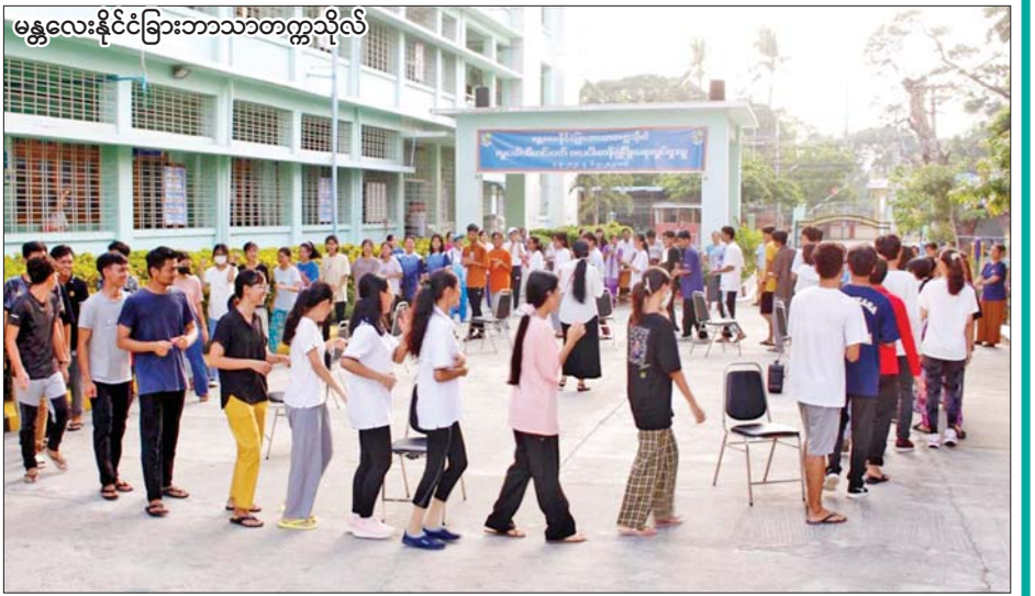
မန္တလေးနိုင်ငံခြားဘာသာတက္ကသိုလ်