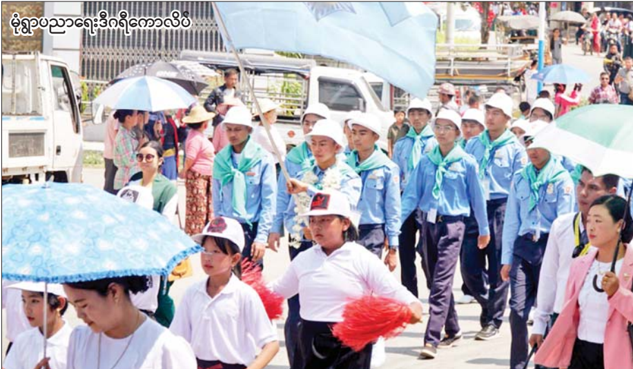
မုံရွာပညာရေးဒီဂရီကောလိပ်