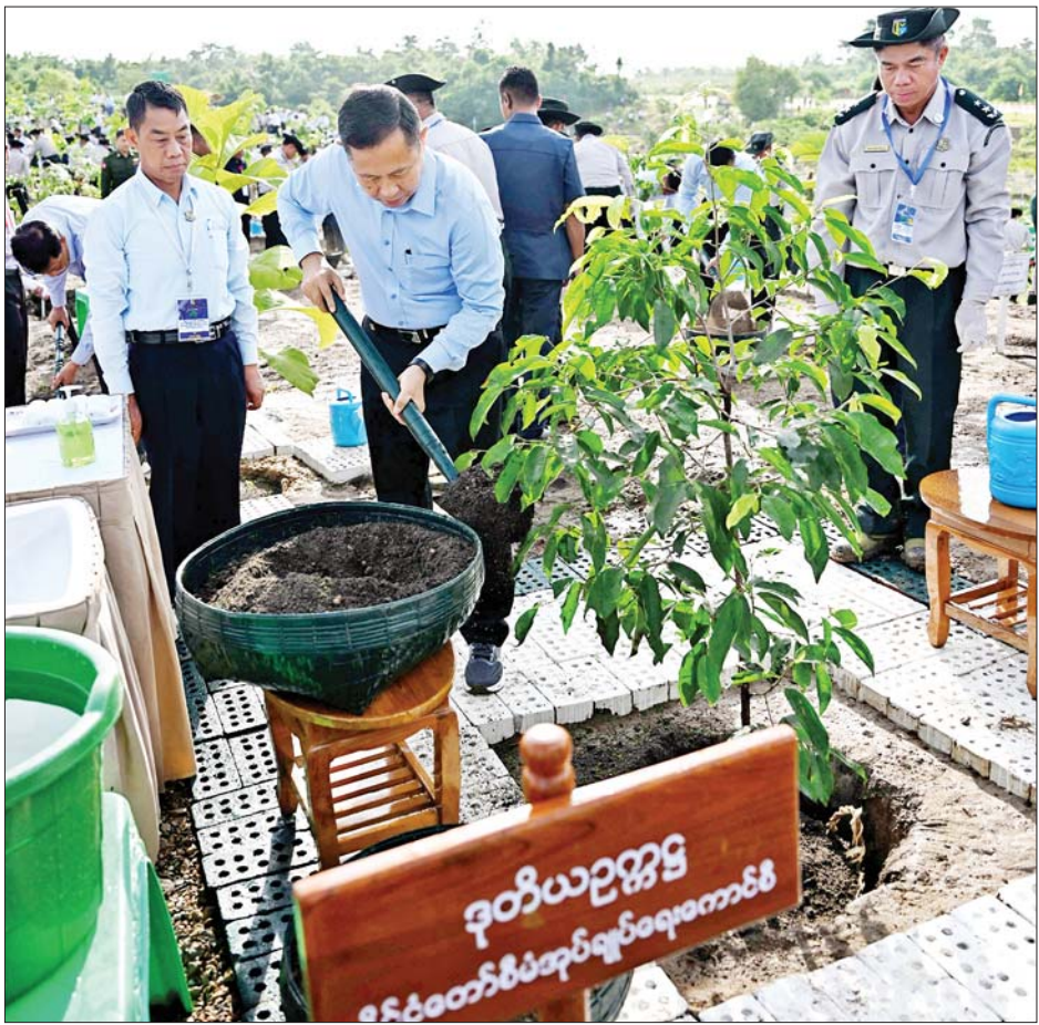
နိုင်ငံတော်စီမံအုပ်ချုပ်ရေးကောင်စီ ဒုတိယဥက္ကဋ္ဌ ဒုတိယဝန်ကြီးချုပ် ဒုတိယဗိုလ်ချုပ်မှူးကြီး စိုးဝင်း ၂၀၂၃ ခုနှစ် တတိယအကြိမ် မိုးရာသီသစ်ပင်စိုက်ပျိုးပွဲတွင် ပျိုးပင်ကို စိုက်ပျိုးပေးစဉ်။

ယနေ့ကျင်းပပြုလုပ်သည့် ၂၀၂၃ ခုနှစ် တတိယ အကြိမ် မိုးရာသီသစ်ပင်စိုက်ပျိုးပွဲ အခမ်းအနားတွင် ကွဲကော်၊ ခရေ၊ ကျွန်း၊ ပိတောက် စသည့်သစ်မျိုးများ အပါအဝင် သစ်မျိုး ၁၅ မျိုး၊ အပင်ပေါင်း ၂၅၀ ကို လှူထု လှူပေးမှုအသွင်ဖြင့် စိုက်ပျိုးခဲ့ခြင်းဖြစ်ကြောင်း၊ သစ်ပင်များကို တစ်နိုင်လုံး အရှိန်အဟုန်ဖြင့် နှစ်စဉ် စိုက်ပျိုးလျက်ရှိပြီး အခုနှစ်မိုးရာသီတွင် နိုင်ငံပိုင် သစ်တောစိုက်ခင်းများအပါအဝင် သစ်ပင်ပေါင်း ၂၄ ဒသမ ၆၂၉ သန်း စိုက်ပျိုးတည်ထောင်ခဲ့ကြောင်း သိရသည်။ သတင်းစဉ်