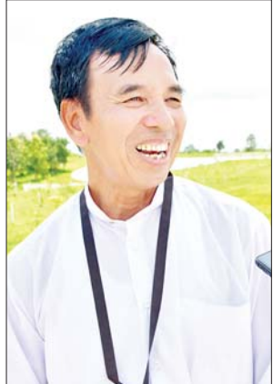
ဦးဝင်းတင်

ပြည်ထောင်စုနယ်မြေ နေပြည်တော် ဒက္ခိဏသီရိမြို့နယ်ရှိ ဗုဒ္ဓဥယျာဉ်ဝတ္ထုကံတော်တွင် တည်ထားပူဇော်ထားသော ကမ္ဘာပေါ်ရှိထိုင်တော်မူ ကျောက်ဆစ်ဗုဒ္ဓရုပ်ပွားတော်များအနက် ဉာဏ်တော်အမြင့်ဆုံးဖြစ်သည့် မာရဝိဇယဗုဒ္ဓရုပ်ပွားတော်မြတ်ကြီးအား ဩဂုတ် ၈ ရက်မှစ၍ အခမဲ့ဖူးမြော်ခွင့်ပြုခဲ့ရာ စက်တင်ဘာ ၅ ရက်အထိ အနယ်နယ်အရပ်ရပ်မှ ရဟန်းရှင်လူ ဘုရားဖူးပြည်သူများဖြင့် အထူးစည်ကားလျက်ရှိသည်။