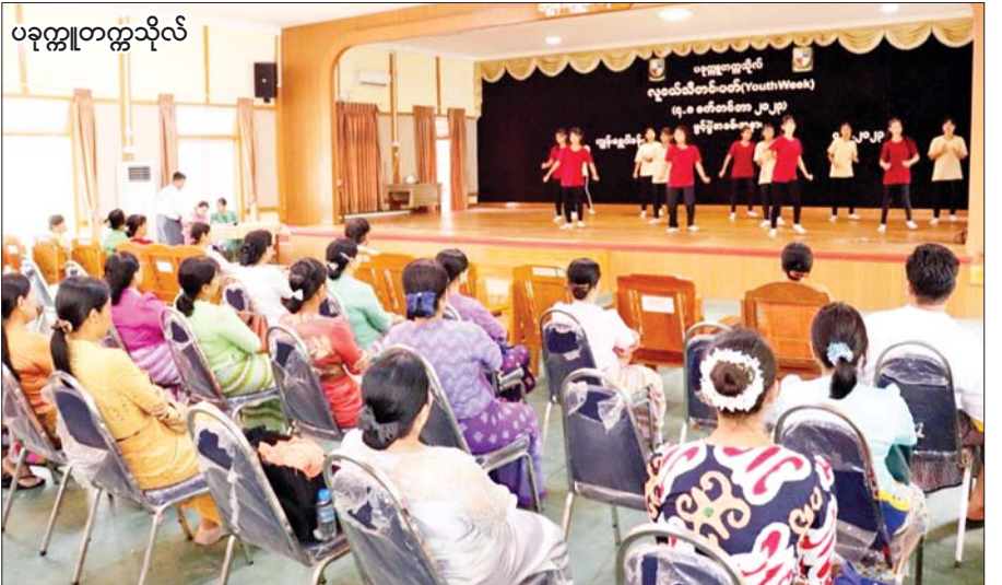
ပခုက္ကူတက္ကသိုလ်