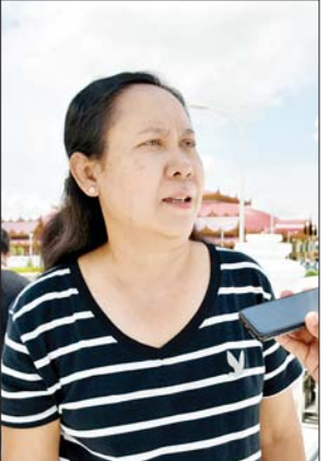
ဒေါ်နိုင်နိုင်လွင်

ထိုသို့ ဘုရားဖူးရောက်ရှိလာသော မြန်မာနိုင်ငံတစ်ဝန်းမှ မိဘ ပြည်သူများနှင့်တွေ့ဆုံပြီး ၎င်းတို့၏ ရင်တွင်းခံစားရသော စကားသံ များ၊ သာဓုအနုမောဒနာ ခေါ်ဆိုသံများ၊ အနာဂတ်ဗုဒ္ဓသာသနာအတွက် မြော်တွေး၍ တက်ကြွသောစကားသံများကို နိဗ္ဗာန်အကျိုးမျှော်ကာ နှိုးဆော်၍ ပြန်လည်ရေးသား မှုဝေလိုက်ရပါသည်။