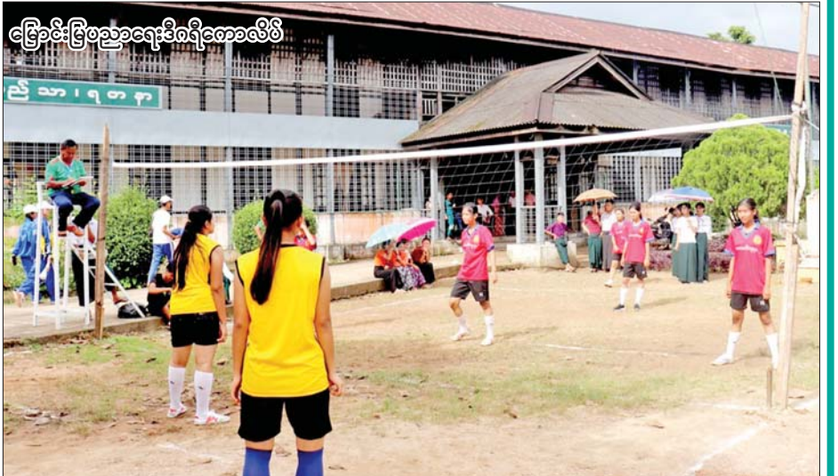
ငြောမ်းငြောပညာရေးဒီဂရီကောလိပ်