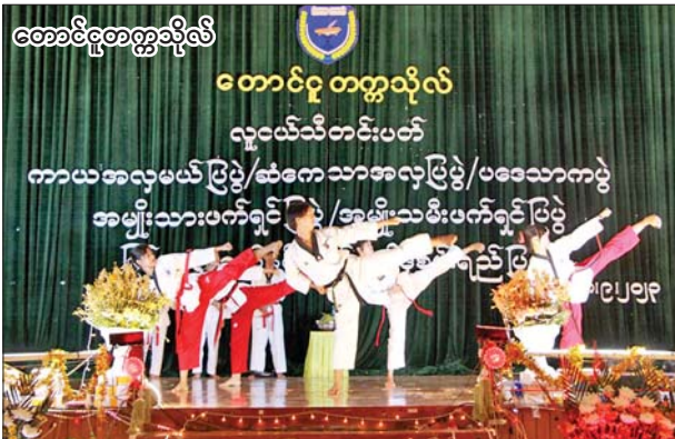
တောင်ငူတက္ကသိုလ်