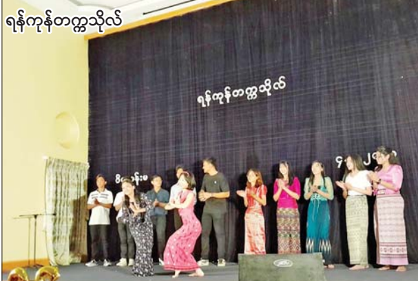
ရန်ကုန်တက္ကသိုလ်