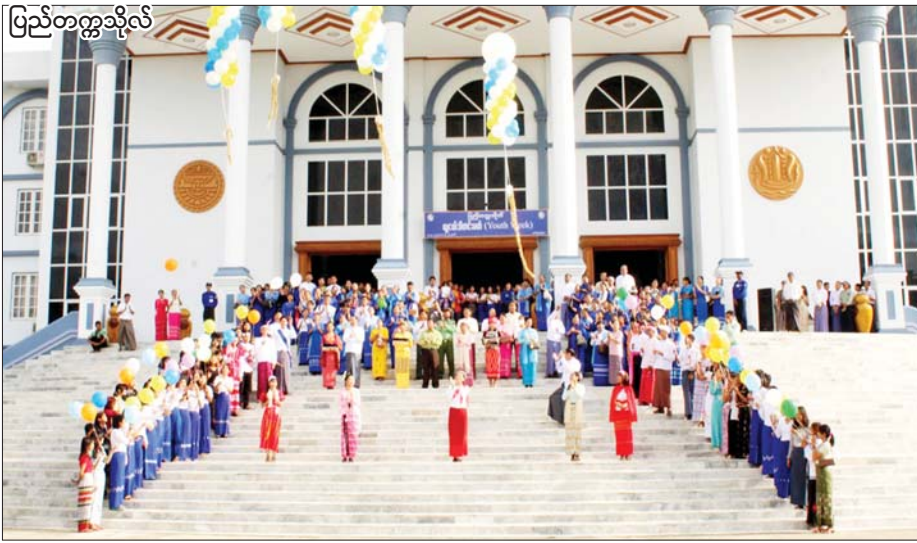
ပြည်တက္ကသိုလ်