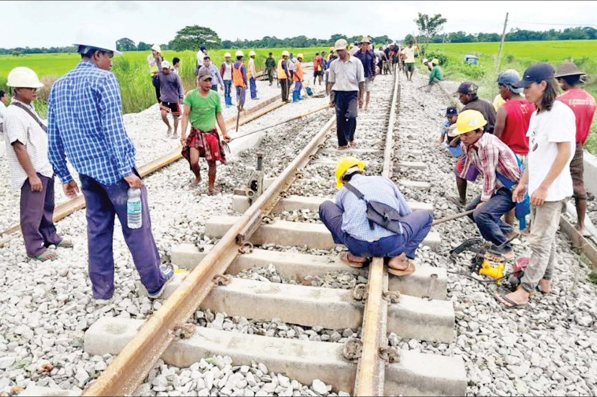
ရန်ကုန်-မန္တလေးရထားလမ်းပိုင်း ပိန်းဇလုပ်ဘူတာနှင့် တော်ဝိဘူတာအကြားရှိ ရထားလမ်းအား မြန်မာ့မီးရထားမှ ပြုပြင်ဆောင်ရွက်နေသည်ကို တွေ့ရစဉ်။

နေပြည်တော် စက်တင်ဘာ ၅ ရက် (မ) - မြန်မာ့မီးရထား တိုင်းအမှတ်(၆)နယ်မြေ ပဲခူးတိုင်းဒေသကြီး၊ ညောင်လေးပင်မြို့နယ် ပိန်းဇလုပ်ဘူတာ၏ တောင်ဘက် (တော်ဝိဘူတာဘက်ခြမ်း)၌ ယနေ့နံနက် ၂ နာရီခွဲခန့် တွင် ပေါက်ကွဲသံကြားရသဖြင့် မန္တလေး-ရန်ကုန် အမှတ်(၆)အစုန် လူစီးအမြန်ရထား၏ စက်ခေါင်းမောင်းသည် ပိန်းဇလုပ်ဘူတာကို နံနက် ၃ နာရီ ၂၃ မိနစ်တွင် ဖြတ်သန်းခဲ့ပြီး ဆက်လက်၍သတိပြုမောင်းနှင်လာရာပိန်းဇလုပ်ဘူတာနှင့် တော်ဝိဘူတာအကြား မိုင်တိုင် (၉၉/၈-၇)သို့ စာမျက်နှာ ၁၆ ကော်လံ ၁ သို့ ၀