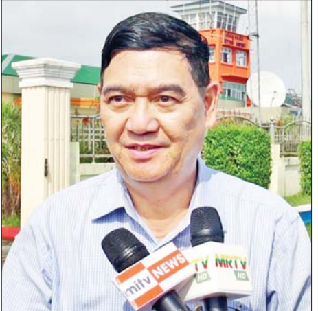
ရခိုင်ပြည်နယ်ဝန်ကြီးချုပ် ဦးထိန်လင်း

အခုရောက်ရှိလာတဲ့ သံတမန်တွေက ဒီကအခြေ အနေတွေကို သူတို့ အံ့ဩသွားတယ်။ မိုခါမုန်တိုင်း တိုက်ခတ်ခဲ့တာ တကယ်ဟုတ်ရဲ့လားဆိုပြီး သူတို့ အံ့ဩတာတွေပါတယ်။ ဘာကြောင့်လဲဆိုတော့ ကျွန်တော်တို့အနေနဲ့ အချိန်တိုအတွင်းမှာ ပုံမှန် အနေအထားရောက်အောင် ဆောင်ရွက်နိုင်ခဲ့တယ်။