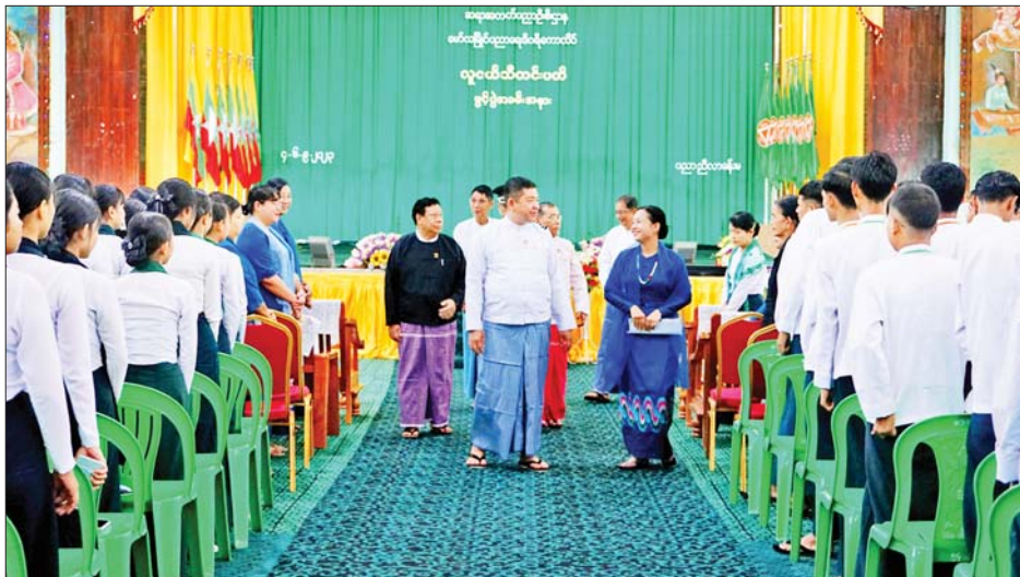
ဖဲကြိုးဖြတ်ဖွင့်လှစ်ပေးသည်။ ယင်းနောက် ပြည်နယ်ဝန်ကြီးချုပ်က လူငယ်များသည် နောင်တစ်ချိန်တွင် နိုင်ငံ့တာဝန်များကို

မော်လမြိုင် စက်တင်ဘာ ၄ မွန်ပြည်နယ်အနေဖြင့် ပြည်နယ်အတွင်း ဘက်စုံဖွံ့ဖြိုးတိုးတက်ရေးကို ဦးတည်လျက် ပညာရေး၏ အခြေခံဖြစ်သည့် လူငယ်၊ လူရွယ်များ၏ ကာယဗလ၊ ဉာဏဗလ၊ စာရိတ္တဗလ၊ မိတ္တဗလနဲ့ ဘောဂဗလဆိုသည့် ဗလငါးတန် ဖွံ့ဖြိုးတိုးတက်ရန် အတွက် အထူးအလေးထား ဆောင်ရွက်လျက်ရှိရာ စက်တင်ဘာ ၄ ရက် နံနက်ပိုင်းက မော်လမြိုင် ပညာရေးဒီဂရီကောလိပ် လူငယ်သီတင်းပတ်ဖွင့်ပွဲ အခမ်းအနားကို ကျင်းပသည်။