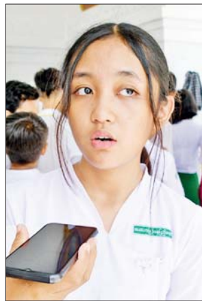
မစိမ်းလဲ့ဆူး