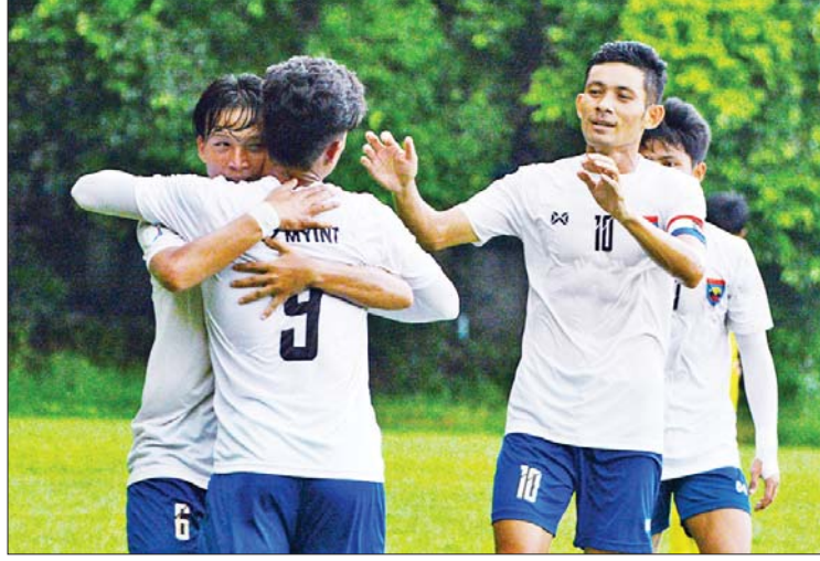
သစ္စာအားမာန်အသင်းကစားသမားများကို တွေ့ရစဉ်။

၂၀၂၃ ရာသီ MNL-2 (ပထမတန်း) ပြိုင်ပွဲ ပွဲစဉ် (၁၇) ကို စက်တင်ဘာ ၂ ရက်မှ ၄ ရက်အထိ ကျင်းပရာ ပြိုင်ပွဲပြီးဆုံးရန် လက်ကျန်တစ်ပွဲအလိုတွင် သစ္စာအားမာန်အသင်း ချန်ပီယံဆု ရရှိခဲ့သည်။