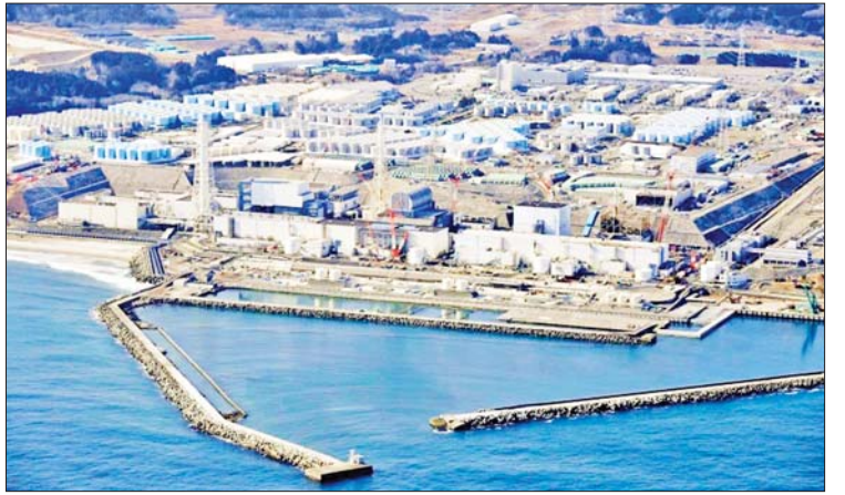
စတင်ချိန်မှစ၍ TEPCO၊ ပတ်ဝန်းကျင် နမူနာများ၌ ထရီတီယမ်ပါဝင်မှုသည် ထိန်းသိမ်းရေးဝန်ကြီးဌာနနှင့် ဖူကူရှီးမား များစွာလျော့နည်းနေကြောင်း တွေ့ရှိရစီရင်စုမှ တာဝန်ရှိသူများအကြား ပြုလုပ်သည်။ ကိုးကား - အင်အိတ်ချီကေ သော စစ်ဆေးမှုများတွင် ပင်လယ်ရေ ဘာသာပြန် - စိုးသူရ

အတွက် အထောက်အကူပြုရေးစင်တာများကို ဖူကူရှီးမားစီရင်စုနှင့် ဆန်ဒိုင်းမြို့တို့တွင် ဖွင့်လှစ်သွားမည်ဖြစ်သည်။ ကုမ္ပဏီသည် လုပ်ငန်းလုပ်ကိုင်သူများ ရင်ဆိုင်နေရသော ပြဿနာများကို ဂရုတစိုက် ကိုင်တွယ်မည်ဖြစ်ပြီး ရပ်တည်မှု ထိခိုက်မှုရှိကြောင်း အတည်ပြုပြီးပါက လျော်ကြေးကို ဆောင်ရွက်ပေးလျော်မည်ဖြစ်ကြောင်း TEPCO မှ တာဝန်ရှိသူ Yoshida Takahiko က ပြောကြားခဲ့သည်။ သန့်စင်ထားသောရေများ စွန့်ထုတ်မှု