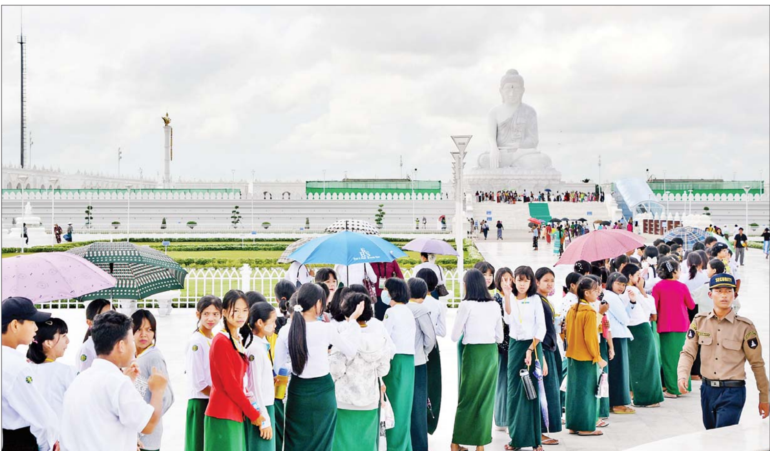
အရွယ်ကြီးရင့်သူများနှင့် ကျန်းမာ ရေး မကောင်းသူများအတွက်သာ ဘာဂီအခမဲ့စီးနင်းနိုင်ရန် စီစဉ် ထားပါကြောင်း မေတ္တာရပ်ခံလျက် အသိပေးချက်ထုတ်ပြန်ထားသည် ကို တွေ့ရသည်။

အသိပေးထုတ်ပြန်ထား ဩဂုတ် ၈ ရက်မှစတင်၍ ဗုဒ္ဓ ဥယျာဉ်တော်အတွင်းသို့ ရဟန်း ရှင်လူ ပရိသတ်အပေါင်းတို့အား အခမဲ့ ဝင်ရောက်ဖူးမြော်ခွင့်ပြုခဲ့ ရာမှ ယနေ့စတင်ဘာ ၄ ရက်မှ စတင်၍ လာရောက်ဖူးမြော်ကြသူ ဘုရားဖူးပြည်သူများအား မာရ ဝိဇယ ဗုဒ္ဓရုပ်ပွားတော်မြတ်ကြီး နှင့် ဗုဒ္ဓဥယျာဉ်တော်ကြီး ရေရှည် တည်တံ့ခိုင်မြဲစေရန် လိုအပ်သည့် ပြုပြင် ထိန်းသိမ်းရေးလုပ်ငန်းများ ဆောင်ရွက်ရာတွင် ကုသိုလ်တော် အဖြစ် ပါဝင်နိုင်ရေးအတွက် ၁။လူဝင်ကြေးအခမဲ့၊ ၂။ဖုန်းတစ်လုံး (ကင်မရာပါ)ကျပ် ၁၀၀၀(ကင်မရာ ပါသော ဖုန်းများသာကောက်ခံပြီး key pad ဖုန်းများ မကောက်ခံပါ)၊ ၃။အပျော်ရိုက်ကင်မရာ၊ အလှ ဓာတ်ပုံရိုက်/ video(pre wedding အပါအဝင်) နှစ်နာရီအတွက် ကျပ် ၅၀၀၀ နှင့် နာရီဝက်အချိန် ပိုတိုင်း ကျပ် ၅၀၀၊ ၅။ဥယျာဉ် တော်အတွင်း ယာဉ်ရပ်နားကွင်း၌ ယာဉ်ငယ်တစ်စီး ကျပ် ၂၀၀၀၀ (အိမ်စီး ယာဉ်ငယ်များကိုသာ ဥယျာဉ်တော်အတွင်း ဝင်ခွင့်ပြုပါ သည်) ယာဉ်ကြီးများနှင့်မော်တော် ဆိုင်ကယ်များ ဥယျာဉ်တော်ပြင်ပ တွင်သာရပ်နားရန် (ဥယျာဉ်တော် ပြင်ပတွင် ရပ်နားသောယာဉ်များ ယာဉ်ရပ်နားခ ကင်းလွတ်ကြောင်း) နှင့် ဘာဂီစီးနင်းရာတွင် အသက်