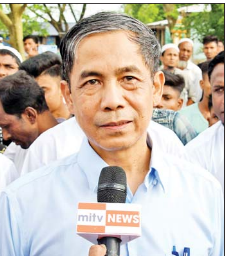
ပြည်ထောင်စုဝန်ကြီး ဦးကိုကိုလှိုင်

အဆိုပါ လေ့လာရေးခရီးစဉ်နှင့်စပ်လျဉ်း၍ ပြည်ထောင်စုဝန်ကြီး၊ ပြည်နယ်ဝန်ကြီးချုပ်နှင့် မြန်မာနိုင်ငံအခြေစိုက် သံရုံးများမှ တာဝန်ရှိသူများ၏ စကားသံများကို စုစည်းဖော်ပြလိုက်ရပါသည် - ပြည်ထောင်စုဝန်ကြီး ဦးကိုကိုလှိုင် ပြည်ထောင်စုအစိုးရအဖွဲ့ရုံးဝန်ကြီးဌာန(၂) ဒုတိယဥက္ကဋ္ဌ(၁)၊ ရခိုင်ပြည်နယ်တည်ငြိမ် အေးချမ်းရေးနှင့် ဖွံ့ဖြိုးတိုးတက်ရေးဆိုင်ရာ လုပ်ငန်းများ ညှိနှိုင်းပေါင်းစပ်ရေးကော်မတီ