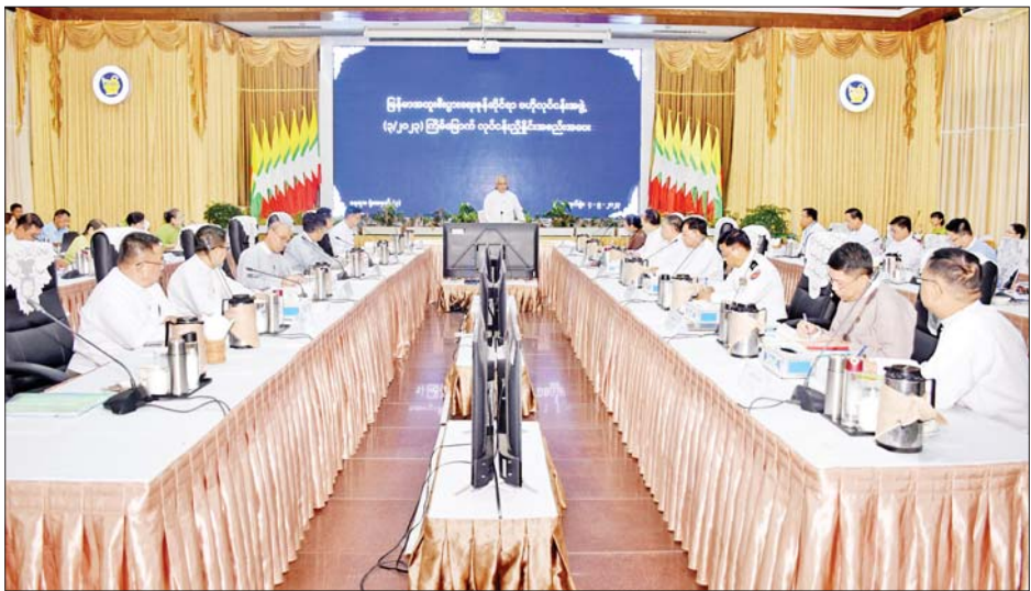
များ၊ သီလဝါ၊ ကျောက်ဖြူနှင့် ခန့်ခွဲမှုကော်မတီ ဥက္ကဋ္ဌများနှင့် တက်ရောက်ကြကြောင်း သိရ ထားဝယ် အထူးစီးပွားရေးဇုန် စီမံ ဌာနဆိုင်ရာများမှ တာဝန်ရှိသူများ သည်။ သတင်းစဉ်

အထူးစီးပွားရေးဇုန် စီမံခန့်ခွဲမှု ကော်မတီအသီးသီးမှ ဥက္ကဋ္ဌများ၊ ဗဟိုလုပ်ငန်းအဖွဲ့ အဖွဲ့ဝင်များနှင့် ဌာနဆိုင်ရာများမှ တာဝန်ရှိသူများက အထူးစီးပွားရေးဇုန်အလိုက် ဆောင်ရွက်ရန်ကိစ္စများ၊ လုပ်ငန်းများ ဖွံ့ဖြိုးတိုးတက်ရေးနှင့် ပတ်သက်သည့် အစီအစဉ်များကို ပိုင်းဝန်းဆွေးနွေး အကြံပြုတင်ပြ ကြရာ မြန်မာအထူးစီးပွားရေးဇုန်ဆိုင်ရာ ဗဟိုလုပ်ငန်းအဖွဲ့ ဥက္ကဋ္ဌက လိုအပ်သည်များကို ပေါင်းစပ် ညှိနှိုင်း ဆောင်ရွက်ပေးသည်။ အစည်းအဝေးသို့ မြန်မာအထူးစီးပွားရေးဇုန်ဆိုင်ရာ ဗဟိုလုပ်ငန်းအဖွဲ့ ဒုတိယဥက္ကဋ္ဌများနှင့် အဖွဲ့ဝင်