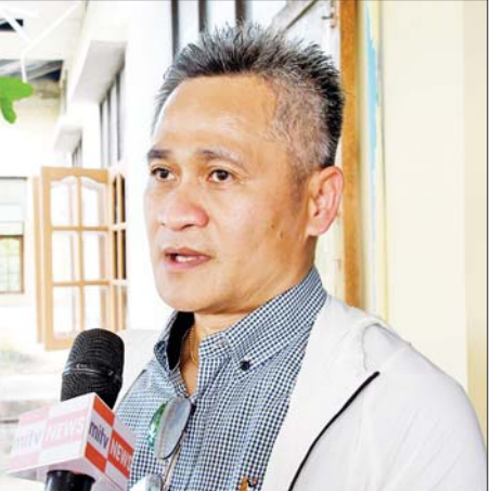
မစ္စတာ မုံခွန်း ဝိစစ်စတန်

ကျွန်တော်တို့ ထိုင်းနိုင်ငံအနေနဲ့ မိုခါဘေးသင့် ခဲ့တဲ့ ရခိုင်ပြည်နယ်က ပြည်သူတွေ၊ တခြားနေရာ တွေက ပြည်သူတွေရဲ့ ထိခိုက်ခံစားမှုကို စာနာ နားလည်ပါတယ်။ ထိုင်းဘုရင် အပါအဝင် ထိုင်း ပြည်သူတွေက စာနာထောက်ထားမှုအကူအညီ တွေကို မြန်မာပြည်သူတွေထံ ပေးခဲ့ပါတယ်။ မိုခါ