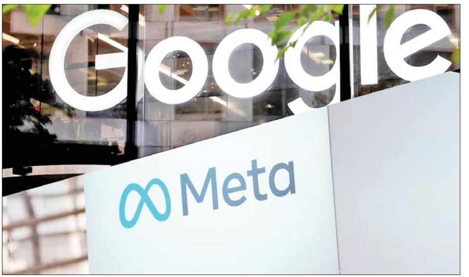
ဖွဲ့စည်းပုံသည် ပြည်သူများ ဘေးကင်းရေးထက် အမြတ်အစွန်းများရရှိရေးကိုသာ ဦးစားပေးနေသည် ဟု ၎င်းကဆိုသည်။ ကိုးကား - အင်န်အိတ်ချ်ကော့ဘာသာပြန် - အောင်ကျော်ကျော်

ကနေဒါဝန်ကြီးချုပ် ဂျက်စတင် ထရူးဒေါသည် ယခုနေ့ရာသီတွင် ကနေဒါနိုင်ငံ၌ ဖြစ်ပွားခဲ့သည့် လူထုထောင်ပေါင်းများစွာ ဘေးလွတ်ရာသို့ ရွှေ့ပြောင်းခဲ့ရသည့် တောမီးလောင်ကျွမ်းမှုသတင်းများကို ပိတ်ပင်ထားခြင်းကြောင့် မီတာကို ဝေဖန်ခဲ့သည်။