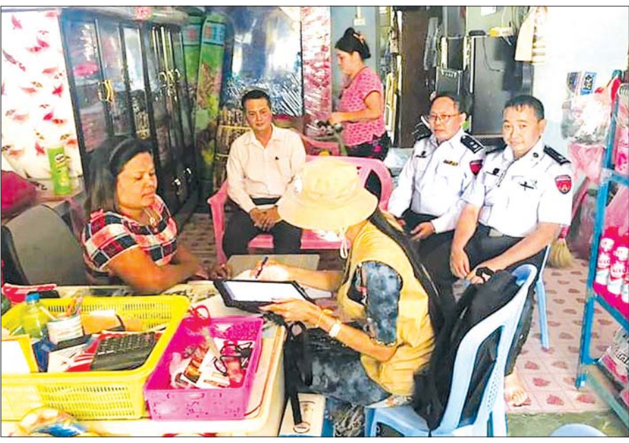
လူဝင်မှုကြီးကြပ်ရေးနှင့် ပြည်သူ့အင်အားဝန်ကြီးဌာနမှ တာဝန်ရှိသူများ သန်းခေါင်စာရင်းကောက်ယူနေမှုကို တွေ့ရစဉ်။

မြန်မာနိုင်ငံတွင် သန်းခေါင်စာရင်းကောက်ယူခြင်းလုပ်ငန်းကို ကိုလိုနီလက်အောက် ကျရောက်နေချိန်ကတည်းက ကောက်ယူဆောင်ရွက်ခဲ့ကြောင်း အထောက်အထား မှတ်တမ်းများအရ သိရှိရသည်။ လွတ်လပ်ရေးရပြီးချိန် ၁၉၇၃ ခုနှစ်နှင့် ၁၉၈၃ ခုနှစ်တို့တွင် ပြည်လုံးကျွတ်အဆင့် သန်းခေါင်စာရင်း ကောက်ယူနိုင်ခဲ့ပြီးနောက်ပိုင်း အကြောင်းအမျိုးမျိုးကြောင့် ဆောင်ရွက်နိုင်ခြင်း မရှိခဲ့ပေ။ ဒီမိုကရေစီအစိုးရအဖြစ် စတင်အုပ်ချုပ်ချတာဝန်ယူခဲ့သည့် သမ္မတကြီးဦးသိန်းစိန် အစိုးရလက်ထက် ၂၀၁၄ ခုနှစ်တွင်မှ လူဦးရေနှင့် အိမ်အကြောင်းအရာ သန်းခေါင်စာရင်းကို တစ်နိုင်ငံလုံးအတိုင်းအတာဖြင့် အောင်မြင်စွာ ကောက်ယူနိုင်ခဲ့သည်။ သို့ရာတွင် စာရင်းသဘောတရားအရ ၁၀ နှစ်ခန့်ကြာလျှင် စာရင်းကွာဟမှု ကြီးမားလာသဖြင့် ၂၀၂၄ ခုနှစ်တွင် ပြည်လုံးကျွတ်အဆင့် သန်းခေါင်စာရင်း ပြန်လည်ကောက်ယူရပေတော့မည်။