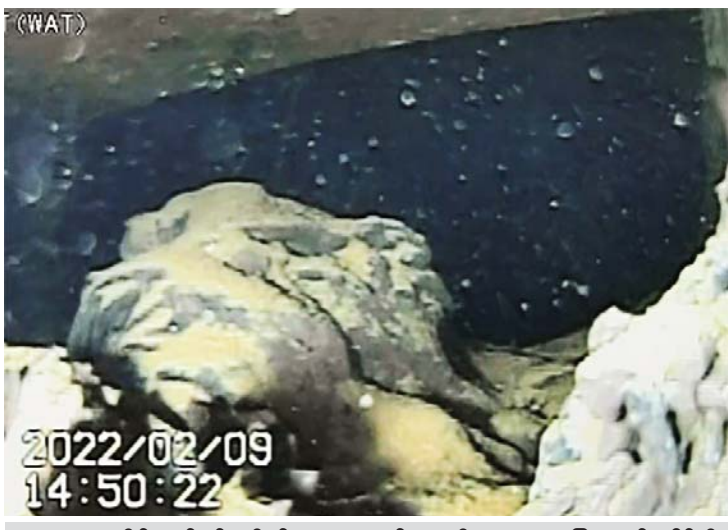
အဝေးထိန်းစက်ရုပ်မှ ရိုက်ကူးပေးသည့် ဖူကူရီးမား အဏုမြူဓာတ်ပေါင်းဖို အတွင်းပိုင်းရှိ အရည်ပျော်နေသည့် လောင်စာများ။

ယခုလိုပိတ်ပင်ခဲ့တဲ့ တရုတ်နဲ့ ဟောင်ကောင်တို့ဟာ ဂျပန်ရဲ့ပင်လယ်စာ