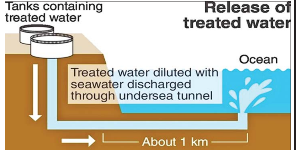
ဖူကူရှီးမားအဏုမြူဓာတ်ပေါင်းဖိုမှ အဏုမြူဓာတ်သတ္တိကြွပစ္စည်းများ ပြန်လည်သန့်စင်ပြီးရေများ ပစ်ဖိတ်သမုဒ္ဒရာအတွင်း လိုက်ခေါင်းတူး၍ ပြန်လည်စွန့်ပစ်သည့်အစီအစဉ်။

ဂျပန်နိုင်ငံ ဖူကူရှီးမားဓာတ်ပေါင်းဖိုက အဏုမြူသတ္တိကြွရေတွေကို ပြန်လည်သန့်စင်ပြီး ပင်လယ်ပြင်တွင်း စွန့်ပစ်တဲ့ဖြစ်စဉ်ကြောင့် လူသားတွေအတွက် ရေရှည်ဘေးထွက်ဆိုးကျိုးတွေ ရှိလာနိုင်မလားဆိုတာ ကမ္ဘာ့နိုင်ငံတွေအနေနဲ့ အနည်းနဲ့အများတော့ စိတ်ပူပင်ကြမှာဖြစ်တယ်ဆိုတာ မငြင်းနိုင်တဲ့အချက်ဖြစ်ပါတယ်။ ဒီစွန့်ပစ်မှုကနေ မည်သည့်ဘေးထွက်ဆိုးကျိုးမှ ဖြစ်မလာစေဖို့လည်း အားလုံးကမျှော်လင့်ကြမှာဖြစ်ပါတယ်။ ဂျပန်အစိုးရတာဝန်ရှိသူတွေကတော့ သန့်စင်ပြီးရေတွေ ပြန်လည်စွန့်ပစ်တဲ့နေ့ကစပြီး ဖူကူရှီးမားအဏုမြူဓာတ်ပေါင်းဖိုအနီး ပင်လယ်ပြင်မှာ ထရစ်တီယံ (Tritium) ဓာတ်သတ္တိကြွမှုတွေ မြင့်တက်လာနိုင်မှုကို နေ့စဉ်တိုင်းတာမှုတွေ ပြုလုပ်လျက်ရှိမှာ မြင့်တက်လာမှုရှိတာကို တွေ့မြင်ရတယ်လို့ ထုတ်ပြန်ခဲ့