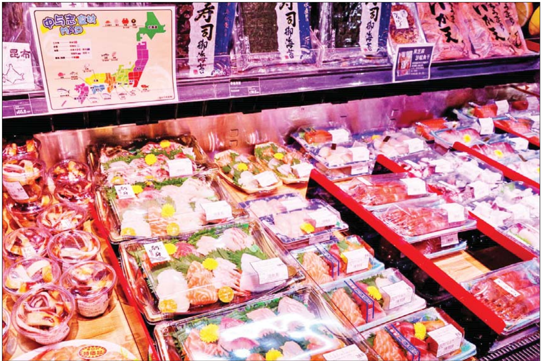
ဟောင်ကောင်ဈေးဝယ်စင်တာတစ်ခုတွင် ဂျပန်နိုင်ငံမှတင်သွင်းလာသည့် ပင်လယ်စာများ ခင်းကျင်းပြသရောင်းချနေစဉ်။

ပင်လယ်ရေထွက်ကုန်တွေဟာ လူတွေ စားသောက်ဖို့ လုံခြုံစိတ်ချရမှုရှိတယ် ဆိုတာပြန်စစ်ဖို့ ဩဂုတ်လ ၃၀ ရက်နေ့က ဝန်ကြီးချုပ်ရုံးမှာ ဖူကူရှီးမားဒေသက ပင်လယ်ရေထွက် အစားအစာတွေနဲ့ နေ့လယ်စာ စားပြခဲ့ပါတယ်။