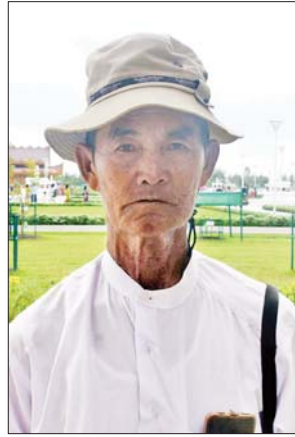
ဦးလှညွန့်