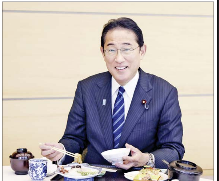
ဖူကူရှီးမားဒေသမှထွက်ရှိသည့် ပင်လယ်ရေထွက်ကုန် အစားအစာများသည် အန္တရာယ်ကင်းရှင်းကြောင်းပြသနိုင်ရန် ဝန်ကြီးချုပ် ကိုရိုဒါက နေ့လယ်စာ သုံးဆောင်ပြနေစဉ်။

ဖြစ်စဉ်ပြီးရင် ဖူကူရှီးမား အဏုမြူဓာတ်ပေါင်းဖို ထိခိုက်ပျက်စီးမှုဖြစ်စဉ်ဟာ သမိုင်းမှာအဆိုးဆုံးဖြစ်စဉ်တစ်ခုဖြစ်ပါတယ်။ ဒီသဘာဝဘေးကြောင့် ဖူကူရှီးမားဒေသတွင်းမှာသာ မကဘဲ ကျန်ပတ်ဝန်းကျင်ဒေသတွေ ဖြစ်တဲ့ အီဝါတေး (Iwate)၊ မိယာဂီ (Miyagi) ပြည်နယ်တွေကိုလည်း ထိခိုက်ခဲ့ပါတယ်။ တိုဟိုကုဒေသ (Tohoku region) တွင်းမှာရှိတဲ့ လူပေါင်း ၁၉၈၂၄ ဦး အသက်ဆုံးရှုံးခဲ့ရသလို လူ ၁၀ သန်းကျော်ကို ဘေးလွတ်ရာဒေသတွေကို ရွှေ့ပြောင်းပေးခဲ့ရပါတယ်။ ဒီဒေသရဲ့ စတုရန်းကီလိုမီတာ ၁၇၀၀ ကျော် မြေနေရာတွေဟာ အဏုမြူဓာတ်ရောင်ခြည်ပစ္စည်းတွေ သက်ရောက်မှုရှိခဲ့ပါတယ်။ ဒေသတွင်းမှာရှိတဲ့ ကုန်ထုတ်လုပ်မှုလုပ်ငန်းတွေ၊ လယ်ယာစိုက်ပျိုးရေးနဲ့ ငါးဖမ်းလုပ်ငန်း စတဲ့စီးပွားရေးလုပ်ငန်း