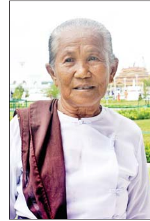
ဒေါ်ခိုင်