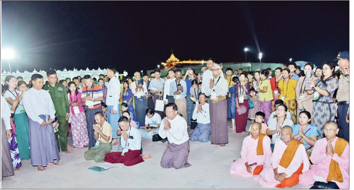
ဦးဆောင်ဘုရားဒါယကာ နိုင်ငံတော်စီမံအုပ်ချုပ်ရေးကောင်စီဥက္ကဋ္ဌ နိုင်ငံတော်ဝန်ကြီးချုပ် ဗိုလ်ချုပ်မှူးကြီးမင်းအောင်လှိုင် မာရဝိဇယ ဗုဒ္ဓရုပ်ပွားတော်မြတ်ကြီးအား ဖူးမြော်ကြည်ညိုစဉ်။

● ရှေးဖိုးမှ ပြည်ထောင်စုဝန်ကြီး ဦးမျိုးသန့်၊ ကာကွယ်ရေး ဦးစီးချုပ်ရုံး (ကြည်း)မှ ဒုတိယဗိုလ်ချုပ်ကြီး ကျော်စွာလင်း၊ ဒုတိယဗိုလ်ချုပ်ကြီး ကံမြင့်သန်းနှင့် တပ်မတော်အရာရှိ ကြီးများ၊ နေပြည်တော်တိုင်းစစ် ဌာနချုပ်တိုင်းမှူးနှင့် တာဝန် ရှိသူများ တက်ရောက်ကြသည်။