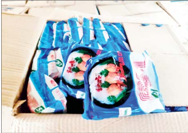
မရမ်းချောင်းအမြဲတမ်းစစ်ဆေးရေးစခန်း၌ သိမ်းဆည်းရမိမှု။

ထို့အတူ ဩဂုတ် ၂၈ ရက်တွင် ရန်ကုန်တိုင်းဒေသကြီး တရားမဝင်ကုန်သွယ်မှုတိုက်ဖျက်ရေး အထူးအဖွဲ့၏ စီမံခန့်ခွဲမှုဖြင့် တာဝန်ကျ ပူးပေါင်းအဖွဲ့က စစ်ဆေးမှုများ ဆောင်ရွက်ခဲ့ရာ ရန်ကုန်-ပဲခူးလမ်းမကြီး အမှတ်(၂)လမ်းခွဲအနီး၌ ယာဉ်တစ်စီးပေါ်မှ သွင်းကုန်ကြေညာလွှာ တွင် ကြေညာထားခြင်းမရှိသည့် Valence Adhesive ၂၈၈ ခု အပါအဝင် ကုန်ပစ္စည်းလေးမျိုး (ခန့်မှန်းတန်ဖိုးငွေကျပ် ၃၆၃၆၂၅၀)နှင့် အဆိုပါ ပစ္စည်းများတင်ဆောင်လာသော Nissan Diesel Tractor Head တစ်စီး နှင့် နောက်တွဲယာဉ်တစ်စီး (ခန့်မှန်းတန်ဖိုးငွေကျပ် ၇၀၀၀၀၀၀) ကို လည်းကောင်း၊ ရန်ကုန်တိုင်းဒေသကြီးအတွင်း ပဲခူးမြို့ ရှောင်လမ်းမ ပေါ်၌ မူဆယ်မြို့မှ ရန်ကုန်မြို့သို့ မောင်းနှင်လာသော ယာဉ်တစ်စီးပေါ် မှ သွင်းကုန်ကြေညာလွှာတွင် ကြေညာထားခြင်းမရှိသည့် TECNO Back Bag အခ ၃၅၀၀ အပါအဝင် ကုန်ပစ္စည်းခြောက်မျိုး (ခန့်မှန်းတန်ဖိုး ငွေကျပ် ၃၄၁၂၅၅၀)နှင့် အဆိုပါပစ္စည်းများ တင်ဆောင်လာသည့် Hino Profia တစ်စီး (ခန့်မှန်းတန်ဖိုးငွေကျပ် ၄၀၀၀၀၀၀)ကိုလည်း