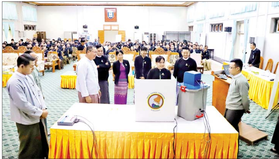
တက်ရောက်ကြသည်။ ဦးစွာ ပြည်ထောင်စုရွေးကော်မရှင် အဖွဲ့ဝင် ဦးအောင်လွင်ဦးနှင့် ဦးကိုကိုလွင်၊ ပြည်ထောင်စု ရွေးကော်မရှင်ကော်မရှင်များမှ တာဝန်ရှိသူများက မြန်မာအီလက်ထရောနစ် မဲပေးစက်နှင့်စပ်လျဉ်း၍ ရှင်းလင်းဆွေးနွေးပြီး စမ်းသပ်မဲပေးခြင်းများကို ဆောင်ရွက်ကြသည်။ ရှင်းလင်းဆွေးနွေးခြင်းနှင့် သရုပ်ပြပွဲများသို့ ရင်းနှီး

နေပြည်တော် ဩဂုတ် ၃၁ ပြည်ထောင်စုရွေးကောက်ပွဲကော်မရှင်က မြန်မာ အီလက်ထရောနစ်မဲပေးစက်နှင့်စပ်လျဉ်းပြီး ရှင်းလင်း ပြသခြင်းနှင့် လက်တွေ့သရုပ်ပြစမ်းသပ်မဲပေးခြင်းကို ယနေ့နံနက်ပိုင်းတွင် ရင်းနှီးမြှုပ်နှံမှုနှင့် နိုင်ငံခြား စီးပွားဆက်သွယ်ရေးဝန်ကြီးဌာန အစည်းအဝေး ခန်းမနှင့် မွန်လွဲပိုင်းတွင် ဥပဒေရေးရာဝန်ကြီးဌာန အစည်းအဝေးခန်းမတို့၌ ကျင်းပသည်။