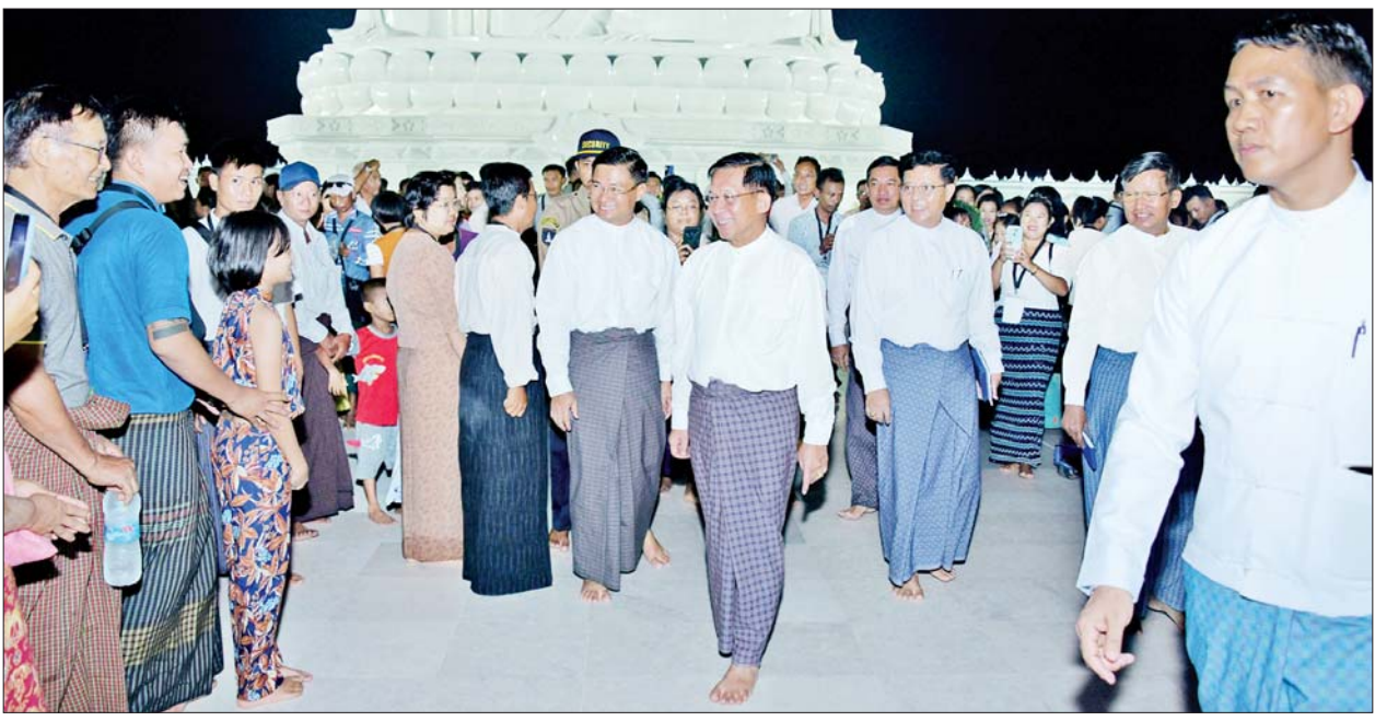
ဦးဆောင်ဘုရားဒါယကာ နိုင်ငံတော်စီမံအုပ်ချုပ်ရေးကောင်စီဥက္ကဋ္ဌ နိုင်ငံတော်ဝန်ကြီးချုပ် ဗိုလ်ချုပ်မှူးကြီးမင်းအောင်လှိုင် ဘုရားဖူးလာပြည်သူများကို ရင်းရင်းနှီးနှီး နှုတ်ဆက်စဉ်။

လာရောက်ဖူးမြော်ကြည်ညို ဦးစွာနိုင်ငံတော်စီမံအုပ်ချုပ်ရေး ကောင်စီဥက္ကဋ္ဌ၏အကြံပေးပုဂ္ဂိုလ် ဒုတိယဗိုလ်ချုပ်ကြီး ညိုစောက နိုင်ငံတော်စီမံအုပ်ချုပ်ရေးကောင်စီ ဥက္ကဋ္ဌ နိုင်ငံတော်ဝန်ကြီးချုပ်၏ လမ်းညွှန်ချက်များနှင့် အညီ ဘုရားဖူးလာပြည်သူများ အေးငြိမ်း ချမ်းသာစွာဖြင့် ဘုရားဖူးနိုင်ရေး စီမံဆောင်ရွက်ထားရှိမှု အနယ်နယ် အရပ်ရပ်မှ ရဟန်းရှင်လူပြည်သူ များ၊ ဝန်ထမ်းများ၊ ကျောင်းသား ကျောင်းသူများနှင့် ပြည်ပမှ နိုင်ငံခြားသား ဧည့်သည်များ နေ့အလိုက် လာရောက်ဖူးမြော် ကြည်ညိုလျက်ရှိရာ စတင်ဖွင့်လှစ် သည့်နေ့မှ ယခုလ ၃၀ ရက်အထိ ဘုရားဖူးလာ သံဃာတော် ၈၂၄၁ ပါး၊ သီလရှင် ၁၉၉၈ ပါး၊ လူပုဂ္ဂိုလ် ၃၂၇၈၇၁ ဦး စုစုပေါင်း ၃၃၈၁၀၀ လာရောက်ဖူးမြော်ကြည်ညိုခဲ့မှု၊ ရဟန်း၊ သံဃာ၊ သီလရှင်များ၊ ကျောင်းအစီအစဉ်ဖြင့် လာရောက်