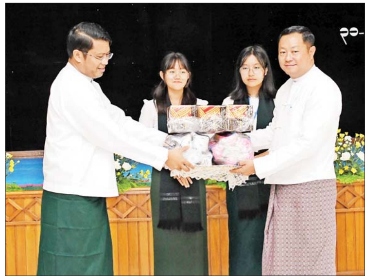
ဒုတိယဝန်ကြီး ဦးဇင်မင်းထက် အားကစားပစ္စည်းများကို ပေးအပ်ရာ ကျောင်းအုပ်ဆရာမကြီး ဦးဝင်းခိုင် လက်ခံရယူစဉ်။

ထို့နောက် ခန်းမအပြင်ဘက်၌ မြန်မာနိုင်ငံ တစ်ဝန်းလုံးတွင်ရှိသည့် အထင်ကရနေရာများကို ကျောင်းသားလူငယ်များ ဗဟုသုတရရှိစေရန် “လှပသာယာပြည်မြန်မာ” ရောင်စုံဓာတ်ပုံပြပွဲခင်းကျင်းပြုသဖြင့်၊ ကျောင်းသားလူငယ်များ ဗလင်းတန်ဖွံ့ဖြိုးရေးနှင့်ပတ်သက်သည့် စာအုပ်စာစောင်များ လေ့လာဖတ်ရှုနိုင်ရန် လူထုအခြေပြုဗဟိုဌာန (ပျဉ်းမနား) မှ ရွှေလျားစာကြည့်တိုက် မော်တော်ယာဉ်ထားရှိပေးထားခြင်း၊ စကားပုံဆက်၊ ရုပ်ပုံဆက်၊ ခွက်နင်းလမ်းလျှောက်ပြိုင်ပွဲများစီစဉ်ပေးထားခြင်း၊ MRTV - 4 ရုပ်သံမှ အနုပညာရှင်များက ကျောင်းသားကျောင်းသူများနှင့်အတူ ပျော်ရွှင်ဖွယ် Game များ ကစား၍ အနိုင်ရရှိသူများအား ဆုများချီးမြှင့်ခြင်း၊ ဟာသပညာရှင် ဒိန်းဒေါင်၊ စိန်နှင့် ချစ်စုတို့က အမှတ်တရ လက်မှတ်ရေးထိုးပေးခြင်း၊ ကလေးများနှင့်အတူ ဆော့ကစားခြင်း စသည့် အစီအစဉ်များကိုလည်း ထည့်သွင်းထားရှိရာ ကျောင်းသား ကျောင်းသူများ စိတ်ပါဝင်စား ပျော်ရွှင်စွာဖြင့် ပါဝင်ဆင်နွှဲကြည့်ရှုလေ့လာကြသည်။ သတင်းစဉ်