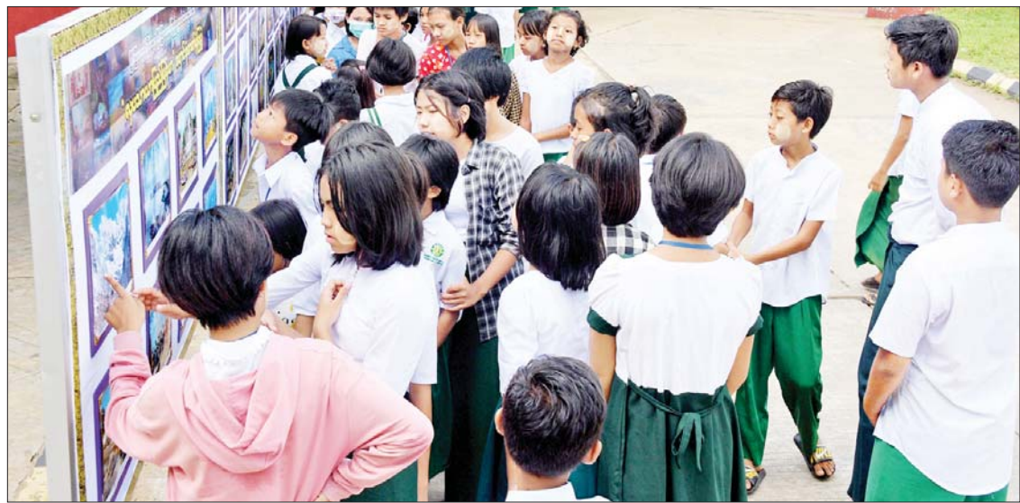
ကျောင်းသား ကျောင်းသူများ ဗလင်းတန်ဖွံ့ဖြိုးရေး လူငယ်အသိပညာပေးဟောပြောပွဲတွင် ခင်းကျင်းပြသထားသည့်များကို စိတ်ဝင်တစား ကြည့်ရှုလေ့လာကြစဉ်။

လူငယ်များ စာပေအတတ်ပညာသာမက ဘဝအတွက် လိုအပ်သည့် အသိပညာများပါ တိုးတက်အောင် ဆောင်ရွက်နိုင်ရန် ရည်ရွယ်၍ ယခုကဲ့သို့ ဟောပြောပွဲ၊ ဆွေးနွေးပွဲများ ဆောင်ရွက်နေခြင်းဖြစ်ပါကြောင်း၊ ထို့ကြောင့် ကျောင်းသားလူငယ်များအနေဖြင့်လည်း ဘက်စုံထူးချွန်သည့် ဗလင်းတန်ဖွံ့ဖြိုးပွဲသည့် ကျောင်းသားကျောင်းသူများ ဖြစ်အောင် ကြိုးစားကြစေလိုကြောင်း၊ ဆရာဆရာမများကလည်း တပည့်သားသမီးများကို ဘက်စုံထူးချွန်သည့် နိုင်ငံတော်က အားထားရမည့် လူငယ်များဖြစ်အောင်