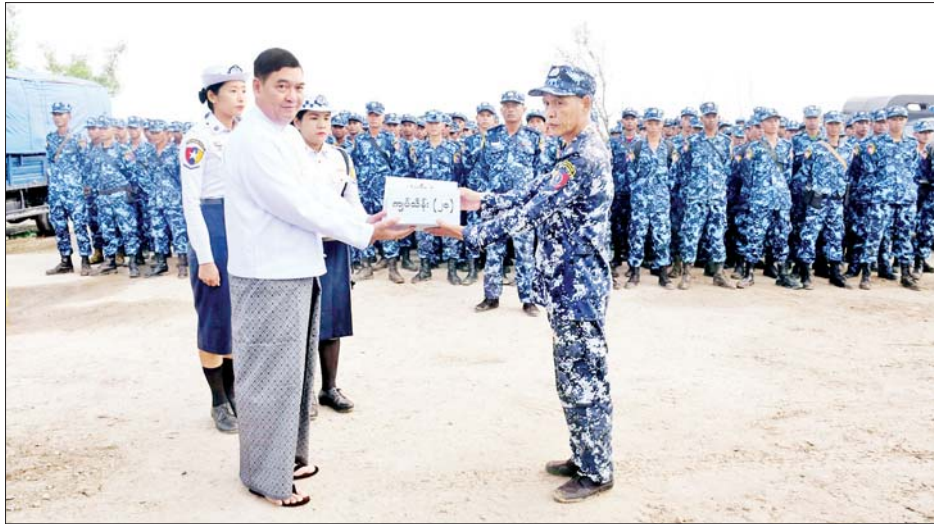
မှ ပြန်လည်ထူထောင်ရေးလုပ်ငန်းတွင် မြန်မာနိုင်ငံရဲတပ်ဖွဲ့ဝင်များအား ရေချမ်းပြင်ဆိပ်ကမ်း၌ တွေ့ဆုံကာ ဂုဏ်ပြုချီးမြှင့်ငွေများ ပေးအပ်သည်။

ရခိုင်ပြည်နယ် သဘာဝဘေးအန္တရာယ်ဆိုင်ရာ စီမံခန့်ခွဲမှုအဖွဲ့ဥက္ကဋ္ဌ ရခိုင်ပြည်နယ်ဝန်ကြီးချုပ် ဦးထိန်လင်းသည် ပြည်နယ်ဝန်ကြီးများ၊ ဌာနဆိုင်ရာ တာဝန်ရှိသူများနှင့်အတူ ယနေ့နံနက်ပိုင်းက ဆိုင်ကလုန်းမုန်တိုင်း(မိုခါ) တိုက်ခတ်ပြီးနောက် ရခိုင်ပြည်နယ်အတွင်း ကူညီကယ်ဆယ်ရေးနှင့် ပြန်လည်ထူထောင်ရေးလုပ်ငန်းများတွင် ပိုင်းဝန်း ကူညီဆောင်ရွက်ခဲ့ကြသည့် မြန်မာနိုင်ငံရဲတပ်ဖွဲ့ဝင် များအား စစ်တွေမြို့နယ် ရေချမ်းပြင်ဆိပ်ကမ်း၌ တွေ့ဆုံကာ ဂုဏ်ပြုချီးမြှင့်ငွေများ ပေးအပ်သည်။