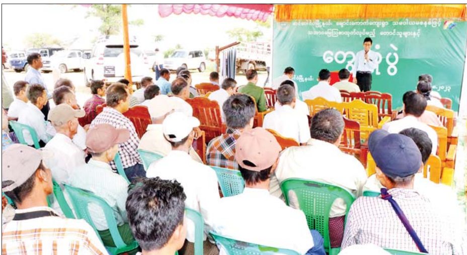
ဆင်ပေါင်ဝဲမြို့နယ် ချောင်းကောက်ကျေးရွာ၌ အောင်ကောင်းမြတ် လယ်ယာကုန်ထုတ်နှင့် အထွေထွေစီးပွားရေးလုပ်ငန်း သမဝါယမအသင်းမှ အမှုဆောင်များ၊ အသင်းသူ အသင်းသားများနှင့်တွေ့ဆုံ၍ နိုင်ငံစီးပွားမြှင့်တင်ရေး ရန်ပုံငွေဖြင့် ဆောင်ရွက်နေသော စီမံကိန်းလုပ်ငန်းဆိုင်ရာများ၊ စိုက်ပျိုးမွေးမြူရေး သမဝါယမအသင်းများ ဖွဲ့စည်းဆောင်ရွက်နေမှုနှင့် သမဝါယမနှင့် ကျေးလက်ဖွံ့ဖြိုးရေး ဝန်ကြီးဌာနက ဆောင်ရွက်လျက်ရှိသော ကျေးလက်ဒေသ ဖွံ့ဖြိုးတိုးတက်ရေး လုပ်ငန်းဆိုင်ရာများကို

နေပြည်တော် ဩဂုတ် ၃၁ သမဝါယမနှင့် ကျေးလက်ဖွံ့ဖြိုးရေးဝန်ကြီးဌာန သမဝါယမဦးစီးဌာန သမဝါယမစာရင်းရေး၊ စာရင်းကိုင် သက်မွေးပညာ သင်တန်းကျောင်း အာရ်စီနစ်ထပ်စာသင်ဆောင် ပန္နက်တင်အခမ်းအနားကို ယမန်နေ့ နံနက်ပိုင်းတွင် မကွေးမြို့ရှိ အဆိုပါ သက်မွေးပညာသင်တန်းကျောင်း၌ ကျင်းပရာ မကွေးတိုင်းဒေသကြီး ဝန်ကြီးချုပ် ဦးတင်လွင်၊ သမဝါယမနှင့် ကျေးလက်ဖွံ့ဖြိုးရေးဝန်ကြီးဌာန ဒုတိယဝန်ကြီး ဦးမြင့်စိုးနှင့် တိုင်းဒေသကြီး အစိုးရအဖွဲ့ဝင် ဝန်ကြီးများ တက်ရောက်၍ ပန္နက်ရိုက်ပေးကြသည်။ ထို့နောက် ဒုတိယဝန်ကြီးသည် တာဝန်ရှိသူများနှင့်အတူ