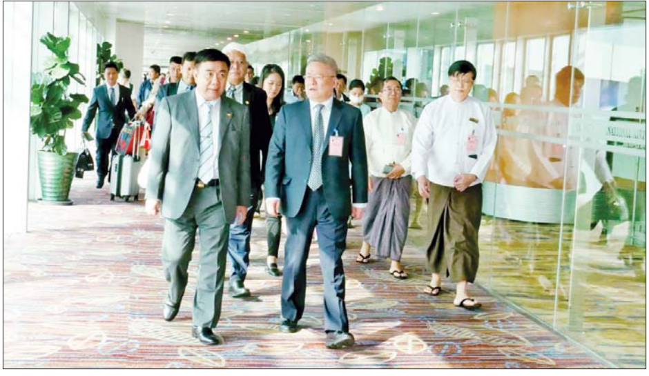
ပူးပေါင်းဆောင်ရွက်ရေး၊ ပညာရေးဖလှယ်မှုနှင့် ရေးတို့ကို ဆွေးနွေးခဲ့ကြကြောင်း သိရသည်။ ပူးပေါင်းဆောင်ရွက်မှု ခိုင်မြဲစွာမြှင့်တင်ဆောင်ရွက် သတင်းစဉ်

ကိုယ်စားလှယ်အဖွဲ့အား ပါမောက္ခချုပ်များနှင့် တာဝန်ရှိသူများ၊ မြန်မာနိုင်ငံဆိုင်ရာ တရုတ်ပြည်သူ့ သမ္မတနိုင်ငံသံရုံးမှ တာဝန်ရှိသူများက ရန်ကုန် အပြည်ပြည်ဆိုင်ရာလေဆိပ်၌ ကြိုဆိုနှုတ်ဆက်ကြ သည်။ ၂၀၂၃ ခုနှစ် တရုတ်-အာဆီယံ ပညာရေးပူးပေါင်း ဆောင်ရွက်ရေး ရက်သတ္တပတ်အခမ်းအနားကို ဩဂုတ် ၂၈ ရက်မှ စက်တင်ဘာ ၂ ရက်အထိ ကျင်းပ လျက်ရှိပြီး ကွေ့ကျိုးတက္ကသိုလ်နှင့် ပညာရေးဝန်ကြီး ဌာနရှိ တက္ကသိုလ်များအကြား ပညာရေးဆိုင်ရာ