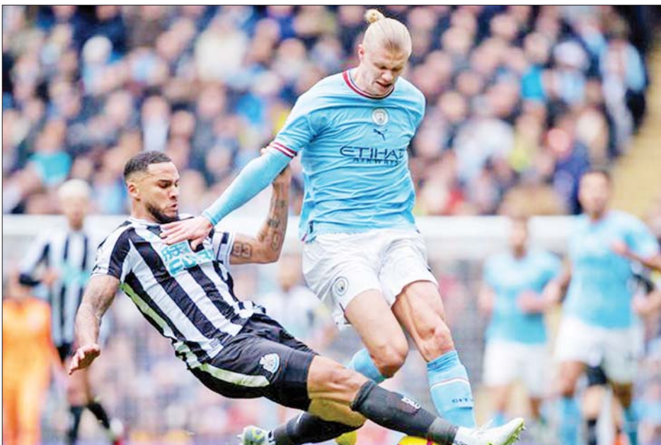
မန်စီးတီးအသင်းနှင့် နယူးကာဆယ်အသင်းတို့ ယှဉ်ပြိုင်ကစားကြစဉ်။

ကာရာဘောင်ဖလားပြိုင်ပွဲရဲ့ တတိယအဆင့်ပွဲစဉ်တွေ ထွက်ပေါ်လာတဲ့အချိန်မှာ တစ်ရာသီအတွင်း ဆုဖလားသုံးလုံးသိမ်းပိုက်နိုင်ခဲ့တဲ့ မန်စီးတီးအသင်းဟာ နယူးကာဆယ်အသင်းနဲ့ ယှဉ်ပြိုင်ကစားရမှာဖြစ်ပြီး လက်ရှိကာရာဘောင်ဖလား ချန်ပီယံ မန်ယူအသင်းကတော့ ခရစ္စတယ်ပဲလေ့အသင်းနဲ့ ယှဉ်ပြိုင်ကစားရမှာလည်း ဖြစ်ပါတယ်။ အခြားသောပွဲစဉ်တွေမှာတော့ အက်စ်တွန်ဗီလာအသင်းနဲ့ အဲဗာတန်အသင်း၊ ဘရန်ဖီးဒ်အသင်းနဲ့ အာဆင်နယ်အသင်း၊ ဘရီဂျန်အသင်းနဲ့ ချယ်လီဆီးအသင်းတို့ တွေ့ဆုံနေတာဖြစ်ပါတယ်။ စာမျက်နှာ ၁၇ ကော်လံ ၁ သို့ ၀