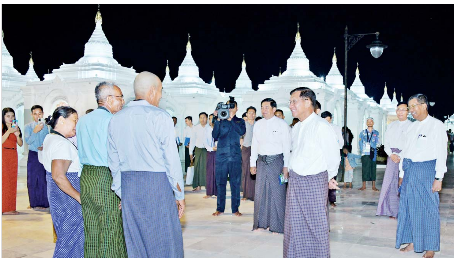
ဦးဆောင်ဘုရားဒါယကာ နိုင်ငံတော်စီမံအုပ်ချုပ်ရေးကောင်စီဥက္ကဋ္ဌ နိုင်ငံတော်ဝန်ကြီးချုပ် ဗိုလ်ချုပ်မှူးကြီးမင်းအောင်လှိုင် ဘုရားဖူးလာပြည်သူများကို ရင်းရင်းနှီးနှီးနှုတ်ဆက်စဉ်။

တက်ရောက် အစည်းအဝေးသို့ ဦးဆောင်ဘုရားဒါယကာ နိုင်ငံတော်စီမံအုပ်ချုပ်ရေးကောင်စီဥက္ကဋ္ဌ နိုင်ငံတော်ဝန်ကြီးချုပ် ဗိုလ်ချုပ်မှူးကြီး မင်းအောင်လှိုင်၊ နိုင်ငံတော် စီမံအုပ်ချုပ်ရေးကောင်စီဥက္ကဋ္ဌ၏ အကြံပေးပုဂ္ဂိုလ် ဒုတိယဗိုလ်ချုပ်ကြီး ညိုစော၊ သာသနာရေးနှင့် ယဉ်ကျေးမှုဝန်ကြီးဌာန ပြည်ထောင်စုဝန်ကြီး ဦးတင်ဦးလွင်၊ စွမ်းအင်ဝန်ကြီးဌာန ပြည်ထောင်စုဝန်ကြီး ဦးကိုကိုလွင်၊ ဆောက်လုပ်ရေးဝန်ကြီးဌာန စာမျက်နှာ ၃ ကော်လံ ၁ သို့