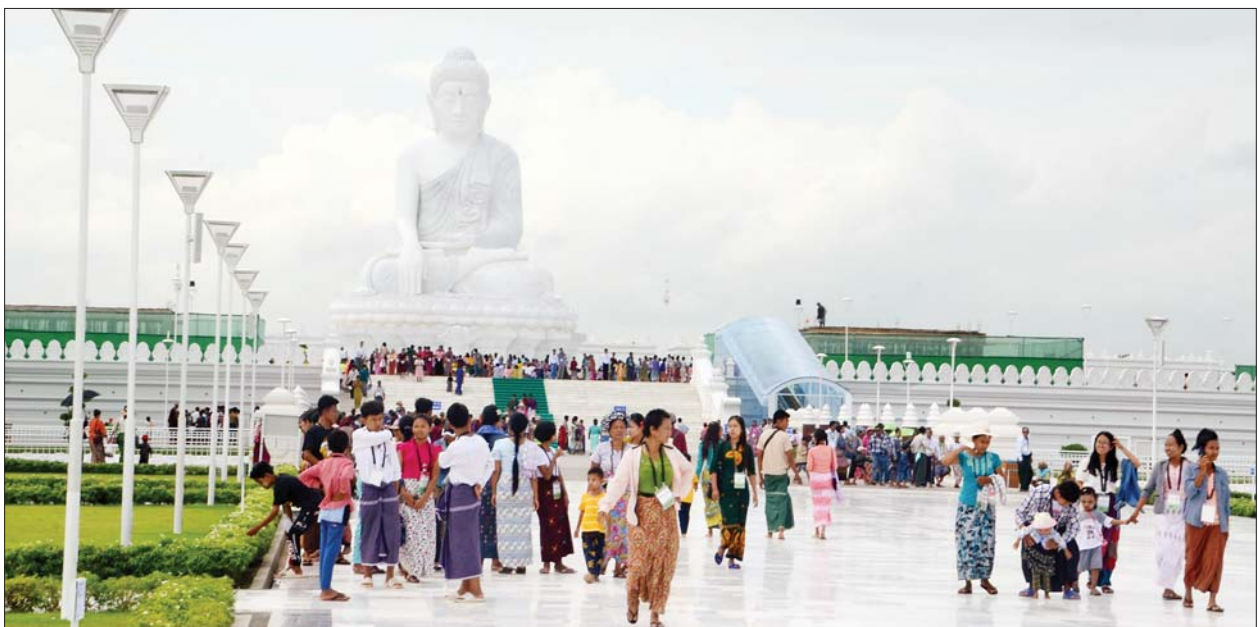
တော်မြတ်ကြီးသို့ လာရောက် ဖူးမြော် ကြည်ညိုကြသည့် ဘိုးဘွားများအား ကျန်းမာရေး

ဗုဒ္ဓရုပ်ပွားတော်မြတ်ကြီး၊ ဂန္ဓကုဋ် တိုက်များ၊ သုဓမ္မာဇရပ်များ၊ မုစလိန္နကန်နှင့် နဂါးရုံဘုရား၊ ရေပန်းရင်ပြင်၊မာရဝိဇယ ကျောင်း တော်၊ အဂ္ဂိမိပတိသာသနာ့ဗိမာန် တော်ကြီး၊ သဒ္ဓါမိပတိခေါင်း လောင်းတော်နှင့် ကျောက်စာရုံ စေတီတော်များအပါအဝင် အခြား ဘာသာရေးဆိုင်ရာ အဆောက် အအုံများ၊ တံတား၊ ဥယျာဉ်များကို စိတ်အေးချမ်းသာစွာဖြင့် ဖူးမြော် ကြည်ညိုလေ့လာခြင်း၊ တရား ဘာဝနာပွားများခြင်း၊ အသင်း အဖွဲ့အလိုက် ဝတ်ရွတ်ပူဇော်ခြင်း များ ဆောင်ရွက်၍ ကြည်ညိုသဒ္ဓါ ပွားများလျက်စေတနာသဒ္ဓါတရား ထက်သန်စွာဖြင့် အလှူငွေများကို ပေးအပ်လှူဒါန်းကြသည်။ အဆိုပါ မာရဝိဇယ ဗုဒ္ဓရုပ်ပွား