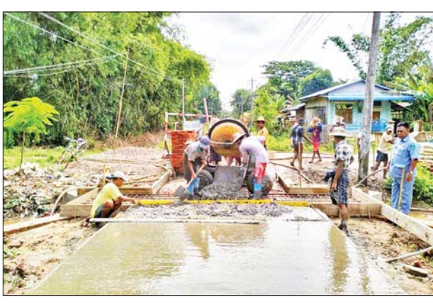
ထိုသို့ဆောင်ရွက်ရာတွင် လုပ်ငန်းများ စနစ်တကျရှိစေရေးအတွက် အရည်အသွေးစစ်ဆေးရေးအဖွဲ့နှင့် တာဝန်ရှိသူများက ကွင်းဆင်း ကြီးကြပ်စစ်ဆေးခြင်းများ ဆောင်ရွက်လျက်ကြောင်း သိရသည်။

ငါးသိုင်းချောင်း ဩဂုတ် ၃၀ ရော့တီတိုင်းဒေသကြီး ငါးသိုင်းချောင်းမြို့ စည်ပင်သာယာရေး အဖွဲ့က မြို့သစ်ရပ်ကွက် အနော်ရထာလမ်းအား ကွန်ကရစ်လမ်းနှင့် Box Culvert အဆင့်မြှင့်တင်ခြင်းလုပ်ငန်းများ ဆောင်ရွက်လျက်ရှိသည်။ ဆောင်ရွက် ထိုသို့ ဆောင်ရွက်ရာတွင် မြို့သစ်ရပ်ကွက် အနော်ရထာလမ်းအား အရှည် ၄၄၅ ပေ၊ အကျယ် ၁၀ ပေ၊ အမြင့် ရှစ်လက်မကို ၂၀၂၃-၂၀၂၄ ဘဏ္ဍာနှစ် ငွေလုံးငွေရင်းရန်ပုံငွေကျပ် ၁၆ ဒသမ ၈ သန်းဖြင့် ဆောင်ရွက် လျက်ရှိပြီး အနော်ရထာလမ်းနှင့် ဗိုလ်ပန်းလမ်း Box Culvert ကိုလည်း ရန်ပုံငွေကျပ် ၂ ဒသမ ၆၃ သန်းဖြင့် အလျား ၁၀ ပေ၊ အနံ ၂ ဒသမ ၆ ပေ နှင့် အမြင့်သုံးပေအား တစ်ပါတည်း ဆောင်ရွက်ပေးလျက်ရှိသည်။