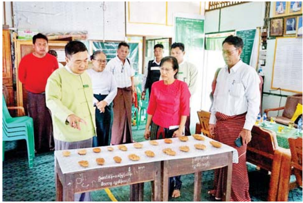
အကြိမ်တွင် အထက(၂) ကျောင်းဝင်းအတွင်း၌ အဆူရေ ၂၀၀ ကျော်နှင့် ယခု တူးဖော်တွေ့ရှိသော ရှေးဟောင်းအုတ်ခွက်ဘုရားများမှာ ပဉ္စမ အကြိမ် တူးဖော်တွေ့ရှိခြင်း ဖြစ်ကြောင်း သိရသည်။ ခရိုင်(ပြန်/ဆက်)

အုတ်ခွက်ဘုရားများကို သတ်မှတ် သည့် သင်ကြားမှုကာလပြီးဆုံးလျှင် စာတတ် မြောက်မှုပဟိုက် စစ်ဆေးသည့်နည်းလမ်းအတိုင်း စစ်ဆေးသည်။ စာတတ်ခါစသက်ကြီးများ စာဖတ် ရှိန် မြင့်မားလာစေရန်လည်း စာပဒေသာစာစဉ်များ၊ လုံးချင်းစာစဉ်များ ဖြန့်ဝေကာ စာဖတ်ပိုင်းများ ဖွဲ့စည်းစာဖတ်ခဲ့သည်။ အားလုံးကို ခြုံလိုက်လျှင် ထိုအချိန်က မိတ္ထီလာသားတို့၏ စိတ်ဝင်စားမှု၊ စိတ်အားထက်သန်မှု၊ စာမတတ်သူ မိမိရပ်ရွာ ဆွေမျိုးသားချင်းများအပေါ် ကိုယ်ချင်းစာမှု၊ စာနာမှု၊ စေတနာထားမှုနှင့် ဒေသဆိုင်ရာ အာဏာပိုင်များ နှင့် ဒေသခံလူထု၏အဘက်ဘက်က ပူးပေါင်းပါဝင် မှု၊ ပံ့ပိုးမှုတို့ကြောင့် ဆရာကြီးဦးသံဃင်၏ နည်းသစ်