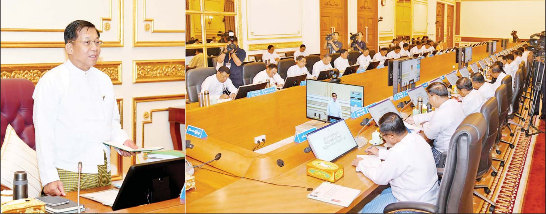
နိုင်ငံတော်စီမံအုပ်ချုပ်ရေးကောင်စီဥက္ကဋ္ဌ နိုင်ငံတော်ဝန်ကြီးချုပ် ဗိုလ်ချုပ်မှူးကြီးမင်းအောင်လှိုင် ပြည်ထောင်စုအစိုးရအဖွဲ့အစည်းအဝေးအမှတ်စဉ် (၄/၂၀၂၃)တွင် အမှာစကားပြောကြားစဉ်။

နေပြည်တော် ဩဂုတ် ၃၀ ပြည်ထောင်စုအစိုးရအဖွဲ့အစည်းအဝေးအမှတ်စဉ် (၄/၂၀၂၃)ကို ယနေ့မုန်းလွဲပိုင်းတွင် နေပြည်တော်ရှိ နိုင်ငံတော်စီမံအုပ်ချုပ်ရေး ကောင်စီဥက္ကဋ္ဌရုံး အစည်းအဝေးခန်းမ၌ ကျင်းပရာ နိုင်ငံတော်စီမံ အုပ်ချုပ်ရေးကောင်စီဥက္ကဋ္ဌ နိုင်ငံတော်ဝန်ကြီးချုပ် ဗိုလ်ချုပ်မှူးကြီး မင်းအောင်လှိုင် တက်ရောက်အမှာစကားပြောကြားသည်။ အစည်းအဝေးသို့ နိုင်ငံတော်စီမံအုပ်ချုပ်ရေးကောင်စီ ဒုတိယဥက္ကဋ္ဌ ဒုတိယဝန်ကြီးချုပ် ဒုတိယဗိုလ်ချုပ်မှူးကြီးစိုးဝင်းနှင့် ပြည်ထောင်စု ဝန်ကြီးများ၊ ပြည်ထောင်စုအဆင့်ပုဂ္ဂိုလ်များ တက်ရောက်ကြပြီး တိုင်းဒေသကြီးနှင့် ပြည်နယ်ဝန်ကြီးချုပ်များက Video Conferencing ဖြင့် တက်ရောက်ကြသည်။