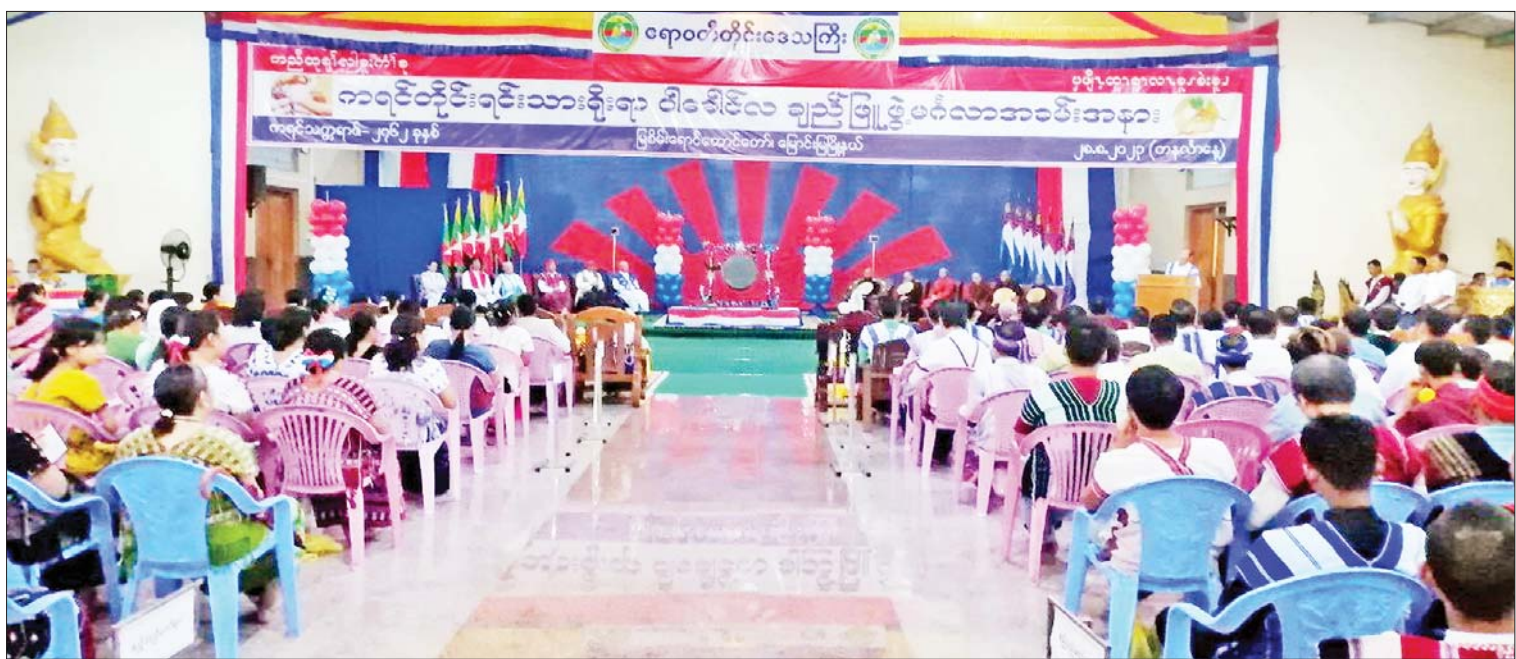
မြောင်းမြမြို့၌ ကရင်တိုင်းရင်းသားရိုးရာ ဝါခေါင်လ ချည်ဖြူဖွဲ့ မင်္ဂလာအခမ်းအနား ကျင်းပစဉ်။

ယင်းနောက် တိုင်းဒေသကြီး တိုင်းရင်းသားရေးရာဝန်ကြီး ဦးစောလင်းခယ်က အခမ်းအနား ကျင်းပခြင်းနှင့် ပတ်သက်၍ ရှင်းလင်းပြောကြားပြီး ဧရာဝတီတိုင်းဒေသကြီး ကရင်တိုင်းရင်းသား စာပေနှင့်