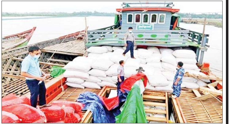
၂၀၂၃ ခုနှစ် ဩဂုတ် ၂၇ ရက် ၁၁ နာရီ အချိန် ပြင်ပငွေလဲနှုန်းမှာ တစ်ဒေါ်လာ လျှင် ၃၅၆၅ ကျပ် ၁၁၈ ဒသမ ၁၀ တာကာ၊ ၁၀၀ ကျပ်လျှင် လေးတာကာ၊ တစ်တာကာလျှင် ကျပ် ၃၀ ဖြစ်ပေါ် လျက်ရှိကြောင်း သိရသည်။

၁ ဒသမ ၅ တန်၊ တညင်းသီး ၁၂၄ ဒသမ ၅ တန်၊ နှင်းတက် ငါးတန်၊ ကွမ်းသီး ၆၆ တန်၊ ထန်းလျက် လေးတန်၊ ငါးမြစ်ချင်း ၇၆၇ ဒသမ ၆၆ တန်၊ ငါးနီတူခြောက် ၈ တန်၊ ငါးကုန်းညိုခြောက် ၁၅ ဒသမ ၅ တန်၊ ငါးစုံလေးခြောက် တန် ၁၃၀၊ ငါးခေါင်းပွ ၃၂ ဒသမ ၄၈ တန်၊ ဆီးယိုထုပ် ၂၀ ဒသမ ၅ တန်၊ ဆန်ကြာဆံ တစ်တန်၊ ထွန်းရွှေပါ လိမ်းဆေး ခြောက်တန်၊ သနပ်ခါးခဲ ၆ ဒသမ ၅ တန်၊ မုန့်ဖတ်ခြောက် ၂ ဒသမ ၅ တန်နှင့် အမျိုးသမီးဝတ်အင်္ကျီ သူညီ ၁ ဒသမ ၁ တန် တင်ပို့ခဲ့သည်။