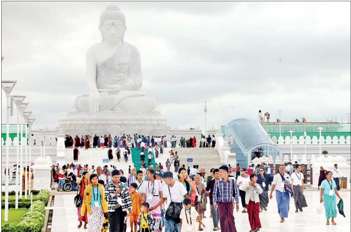
မြတ်ကြီးအား ရဟန်းရှင်လူအများပြည်သူ များ အခမဲ့လာရောက်ဖူးမြော်ကြည်ညိုနိုင်ရန် စက်တင်ဘာ ၃ ရက်အထိ နံနက် ၆ နာရီမှ ည ၈ နာရီအတွင်း ဖွင့်လှစ်ထားရှိ ကြောင်း သိရသည်။ သတင်းစဉ်

ပေးအပ်လှူဒါန်း ယနေ့တွင်လည်း အနယ်နယ်အရပ်ရပ် မှ ရဟန်းရှင်လူ ပြည်သူများနှင့် ဘိုးဘွား များသည် ဗုဒ္ဓဥယျာဉ်တော်အတွင်းရှိ မာရဝိဇယ ဗုဒ္ဓရုပ်ပွားတော်မြတ်ကြီး၊ ဂန္ဓကုဋ်တိုက်များ၊ သုဓမ္မာဇရပ်များ၊ မုစလိန္နကန်နှင့် နဂါးရုံဘုရား၊ ရေပန်း ရင်ပြင်၊ မာရဝိဇယကျောင်းတော်၊ အဂ္ဂိ ဝိပတိသာသနာ့ဗိမာန်တော်ကြီး၊ သဒ္ဓါ ဝိပတိခေါင်းလောင်းတော်နှင့် ကျောက်စာရုံ စေတီတော်များအပါအဝင် အခြားဘာသာ