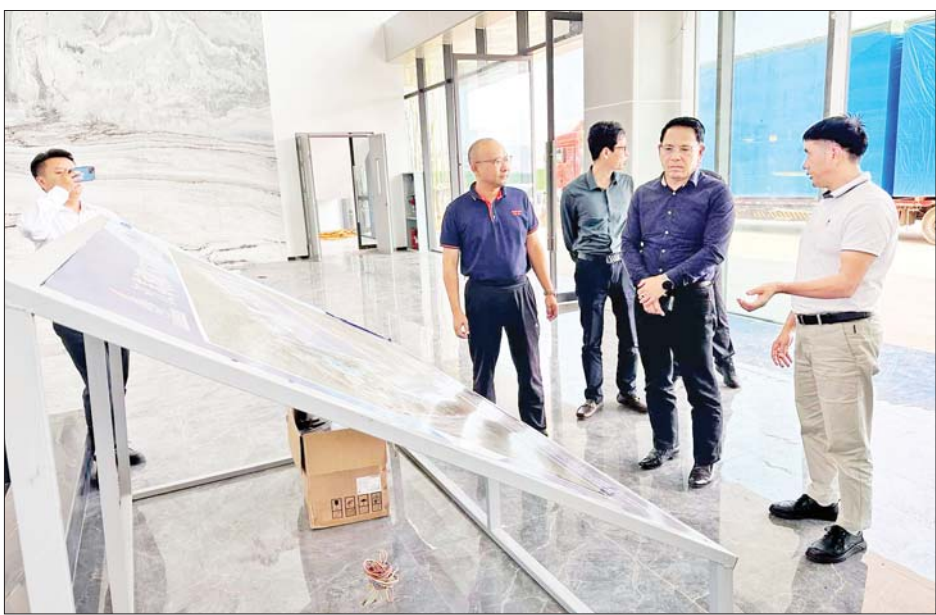
ပြည်ထောင်စုဝန်ကြီး ဦးမောင်မောင်အုန်း ယူနန်ပြည်နယ် Qujing Jingkai ခရိုင် Nanhai စက်မှုဇုန်ရှိ Yunnan Runyang century Phobovoltaic Technology ကုမ္ပဏီလီမိတက်မှ တည်ထောင်လျက်ရှိသည့် စွမ်းဆောင်ရည်မြင့် ဆိုလာဆဲလ်ထုတ်လုပ်မှုလုပ်ငန်းခွင်တွင် ကြည့်ရှုလေ့လာစဉ်။

ယနေ့ နံနက်ပိုင်းတွင် ပြည်ထောင်စုဝန်ကြီးအား China International Cooperation Association of SMES Executive Director Global Business,