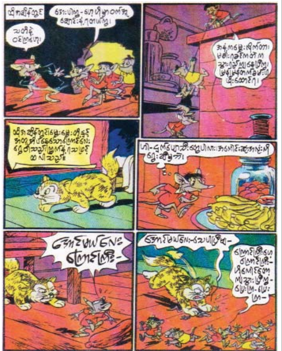
(ဆက်လက်ဖော်ပြပါမည်)

ဓာတ်လှေကား မောင်းတဲ့သူက လူငယ်ကောင်လေးကို ပြောလိုက်တယ်။ “ကောင်းပြီလေ ကွာ၊ အိုကေပဲ၊ အပြင်ထွက် ပေတော့ သားရေ” ကောင်လေးက ပြန်မေးလိုက်တယ်။ “ခင်ဗျား ဘာဖြစ်လို့ ကျွန်တော့်ကို သားလို့ ခေါ်ရ တာလဲဗျ” ထိုလူက ပြန်ဖြေလိုက်တယ်။ “ဒီလိုလေကွာ မင်းကို ငါက အမြင့်ကို တင်ပေးခဲ့တယ်လေ မဟုတ်ဘူးလားလို့”