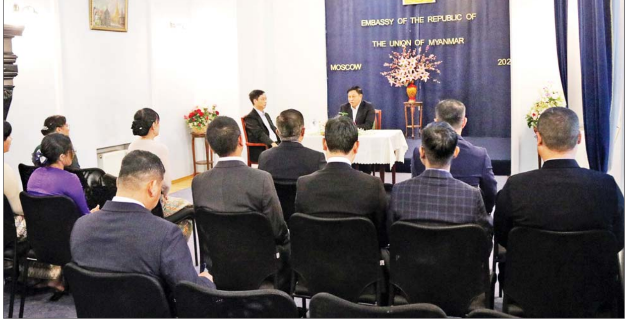
နိုင်ငံတော်စီမံအုပ်ချုပ်ရေးကောင်စီဝင် ဒုတိယဝန်ကြီးချုပ်နှင့် ပြည်ထောင်စုဝန်ကြီး ဗိုလ်ချုပ်ကြီးတင်အောင်စန်း မော်စကိုမြို့ရှိ မြန်မာစစ်သံရုံး၌ သံအမတ်ကြီး၊ စစ်သံမှူးကြီး၊ ရေ၊ လေနှင့် စစ်သံရုံးမှ အရာရှိ၊ စစ်သည်၊ မိသားစုများနှင့် တွေ့ဆုံစဉ်။

သို့ ရောက်ရှိပြီး သံအမတ်ကြီး၊ စစ်သံမှူးကြီး၊ ရေ၊ လေနှင့် စစ်သံရုံးမှ အရာရှိ၊ စစ်သည်၊ မိသားစုများနှင့် တွေ့ဆုံ၍ နိုင်ငံ တော်၏လက်ရှိဖြစ်ပေါ်တိုးတက်မှု အခြေအနေများကို ရှင်းလင်း ပြောကြားပြီး စစ်သံရုံးမိသားစု များအတွက် လက်ဆောင်ပစ္စည်း များ ပေးအပ်သည်။ ဩဂုတ် ၁၇ ရက်တွင် ဒုတိယ ဝန်ကြီးချုပ်နှင့် ပြည်ထောင်စု ဝန်ကြီးသည် ရုရှားဖက်ဒရေရှင်း နိုင်ငံ ကာလုဂါပြည်နယ် အတနာမီ ကမ္ဘာ့ယဉ်ကျေးမှုမြို့တော်အတွင်း တည်ထားသည့် ရွှေစည်းခုံ (ပုံတူ) စေတီတော်သို့ သွားရောက် ဖူးမြော်ခဲ့ကာ နိုင်ငံစုံမှပြသထား သည့် ပြကွက်များကို လှည့်လည် ကြည့်ရှုပြီး ရုရှားတပ်မတော်ပင်မ ဘုရားကျောင်းကြီး (Main Cathedral of the Russian Armed Forces) ဝင်းအတွင်း လှည့်လည်ကြည့်ရှုကာ စစ်ပွဲ များတွင် သိမ်းဆည်းရမိခဲ့သည့် ပြည်ပနိုင်ငံထုတ် စစ်လက်နက် ပစ္စည်းများ ခင်းကျင်းပြသထား မှုကို ကြည့်ရှုလေ့လာသည်။ ဩဂုတ် ၁၈ ရက်တွင် ဒုတိယ ဝန်ကြီးချုပ်နှင့် ပြည်ထောင်စု ဝန်ကြီး ဗိုလ်ချုပ်ကြီး တင်အောင်စန်း ဦးဆောင်သည့် ကိုယ်စားလှယ်အဖွဲ့သည် မော်စကို မြို့ရှိ မြန်မာဘုန်းတော်ကြီး ကျောင်းသို့သွားရောက်၍ ဆရာ တော်အား ဖူးမြော်ကြည့်ညိုပြီး လှူဖွယ်ပစ္စည်း၊ ဝတ္ထုငွေများနှင့် နေ့ဆွမ်း ဆက်ကပ်လှူဒါန်းခဲ့ ကြောင်း သိရသည်။ သတင်းစဉ်