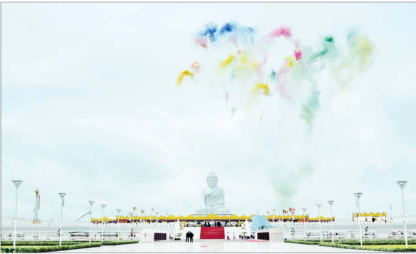
မာရဝိဇယရုပ်ပွားတော်မြတ်ကြီး ဗုဒ္ဓါဘိသေက အနေကဇာတင် အခမ်းအနား ကျင်းပစဉ်။

ထိုဂါထာကို ဗုဒ္ဓ၏တရားဦး ဓမ္မစက္ကပဝတ္တန ဓမ္မစကြာတရားဦးကို နာကြားကြသော (ပဉ္စဝဂ္ဂိ ငါးဦးအနက် အသက်အငယ်ဆုံး) ရှင်အဿဇိသည် ညဘက် တရားနာ၊ နေ့ဘက် ကိုယ်တိုင်ဆွမ်းခံမြဲ ဖြစ်၏။ တစ်နေ့သ၌ ရှင်အဿဇိဆွမ်းခံနေသည်ကို တွေ့ရသော သိဉ္စည်းဆရာကြီးထံ တပည့်ခံပညာယူ နေသည့် ဥပတိဿ (ရှင်သာရိပုတ္တရာလောင်းလျာ) က မြင်လိုက်ရ၏။ ရှင်အဿဇိ၏ ဣန္ဒြေသိက္ခာ ရင့်ကျက်သောအနေအထားကို မြင်ရသော ဥပတိဿက ဤပုဂ္ဂိုလ်တွင် တရားထူး (ပညာထူး) ရှိမည်ဟု တွက်ဆကာ ရှင်အဿဇိနောက်လိုက်ပါပြီး သင်ရရှိလေသော တရားထူးရှိက ပြောပြပါဟု တောင်းပန်စဉ် ရှင်အဿဇိက အထက်ပါအတိုင်း ထိုသို့မျှသာ ဖြေကြားပေးခဲ့သည်။ မိမိလည်း ယခု တော့ ဤမျှသာသိပေးသည်၊ ပြောနိုင်ပါသေး သည်ဟုဆိုသည်။ ဥပတိဿသည် ဉာဏ်ရည် တော်သူ (နောင် ဗုဒ္ဓ၏လက်ယာတော်ရံ၊ ဉာဏ်အရာ တွင် ဧတဒဂ်ရသည့်ရဟန္တာ) ဖြစ်၍ သဘောပေါက် ကာ အတူပညာသင်ဖက် ကောဋီတ (ရှင်မဟာ