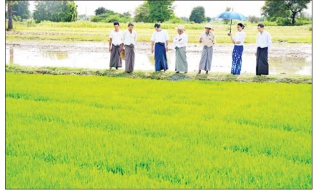
သမဝါယမအသင်းသားတောင်သူ ၁၇၉ ဦးက မိုးစပါး ၆၇၂၀ နှင့် ဝါ ၇၈ ဒဿမ ၅ ဧက စိုက်ပျိုးထားရှိကြောင်း သိရသည်။ ချမ်းသာ(မိတ္ထီလာ)

မိတ္ထီလာ ဩဂုတ် ၂၁ မိတ္ထီလာမြို့နယ် သမဝါယမအသင်းစု ရန်ပုံငွေနှင့် တိုင်းဒေသကြီး ဘဏ္ဍာရန်ပုံငွေတို့ဖြင့် ရေဝေကျေးရွာ မြာရဝေစိုက်ပျိုးထုတ်လုပ်ရေး အသင်းမှ အသင်းသားတောင်သူများစိုက်ပျိုးထားရှိသော မိုးစပါးစိုက်ခင်းများနှင့် မြို့နယ်သမဝါယမအသင်းစုရန်ပုံငွေဖြင့် လှည်းပွဲကျေးရွာ ရွှေဝါမြေစိုက်ပျိုးထုတ်လုပ်ရေးသမဝါယမအသင်းမှ အသင်းသား တောင်သူများ စိုက်ပျိုးထားသော မိုးစပါးစိုက်ခင်းများနှင့် Pilot Project ဖြင့် ဆောင်ရွက်နေသည့် ဝါစိုက်ခင်းများကို မန္တလေးတိုင်းဒေသကြီးသမဝါယမဦးစီးဌာန တိုင်းဒေသကြီးဦးစီးမှူး ဦးကျော်မိုးတင့်နှင့် တာဝန်ရှိသူများက ယမန်နေ့တွင် ကွင်းဆင်းကြည့်ရှုစစ်ဆေးခဲ့ကြောင်း သိရသည်။ မိတ္ထီလာမြို့နယ်၌ မြို့နယ်သမဝါယမအသင်းစုရန်ပုံငွေဖြင့် မကျီးကန်၊ လှည်းပွဲ၊ ကုက္ကိုကုန်း၊ ရေဝေနှင့် အင်းကျေးရွာတို့တွင်