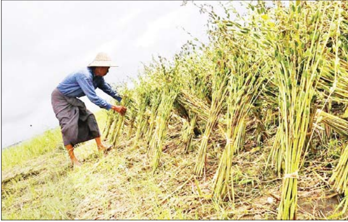
ငွေကျပ် ၇၆၀၀၀ ဖြစ်ရာ တစ်ဧကလျှင် ငွေကျပ် ၂၁၂၀၀၀ ခန့် အကျိုးအမြတ် ရရှိကြောင်း သိရသည်။

ယခင်နှစ် မိုးနှမ်းသီးနှံတစ်ဧကလျှင် စိုက်ပျိုးမှုကုန်ကျစရိတ်အနေဖြင့် ငွေကျပ် ၂၆၂၀၀၀ ခန့်ရှိခဲ့ပြီး အထွက်နှုန်းအနေဖြင့် နှမ်း ၆ ဒဿမ ၅ တင်းခန့် ထွက်ရှိခဲ့ကြောင်း၊ ဈေးနှုန်းအနေဖြင့် နှမ်းတစ်တင်းလျှင် ငွေကျပ် ၅၀၆၀၀ ရရှိရာ အကျိုးအမြတ်အနေဖြင့် ငွေကျပ် ၆၆၉၀၀ ရရှိကြောင်း သိရသည်။ ယခုနှစ်တွင် မိုးနှမ်းတစ်ဧကလျှင် စိုက်ပျိုးမှုကုန်ကျစရိတ်အနေဖြင့် ငွေကျပ် ၃၅၈၀၀၀ ခန့်ရှိပြီး လက်ရှိနှမ်းခင်းများ၏ အခြေအနေအရ တစ်ဧကလျှင် ၇ ဒဿမ ၅ တင်းခန့် ထွက်ရှိနိုင်ပြီး လက်ရှိနှမ်းဈေးနှုန်းအနေဖြင့် နှမ်းတစ်တင်းလျှင်