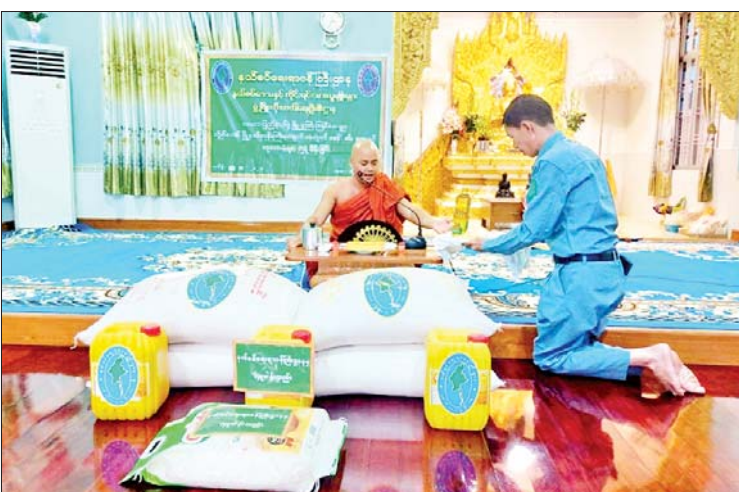
ဆက်ကပ်လှူဒါန်းသည်။ တော် အခက်အခဲရှိသော ဘုန်းတော်ကြီး နယ်စပ်ရေးရာဝန်ကြီးဌာနအနေဖြင့် ကျောင်းများသို့ ဆက်လက်လှူဒါန်းသွား ကယားပြည်နယ်အတွင်းရှိ ဆွမ်းဆန် မည်ဖြစ်ကြောင်း သိရသည်။ သတင်းစဉ်