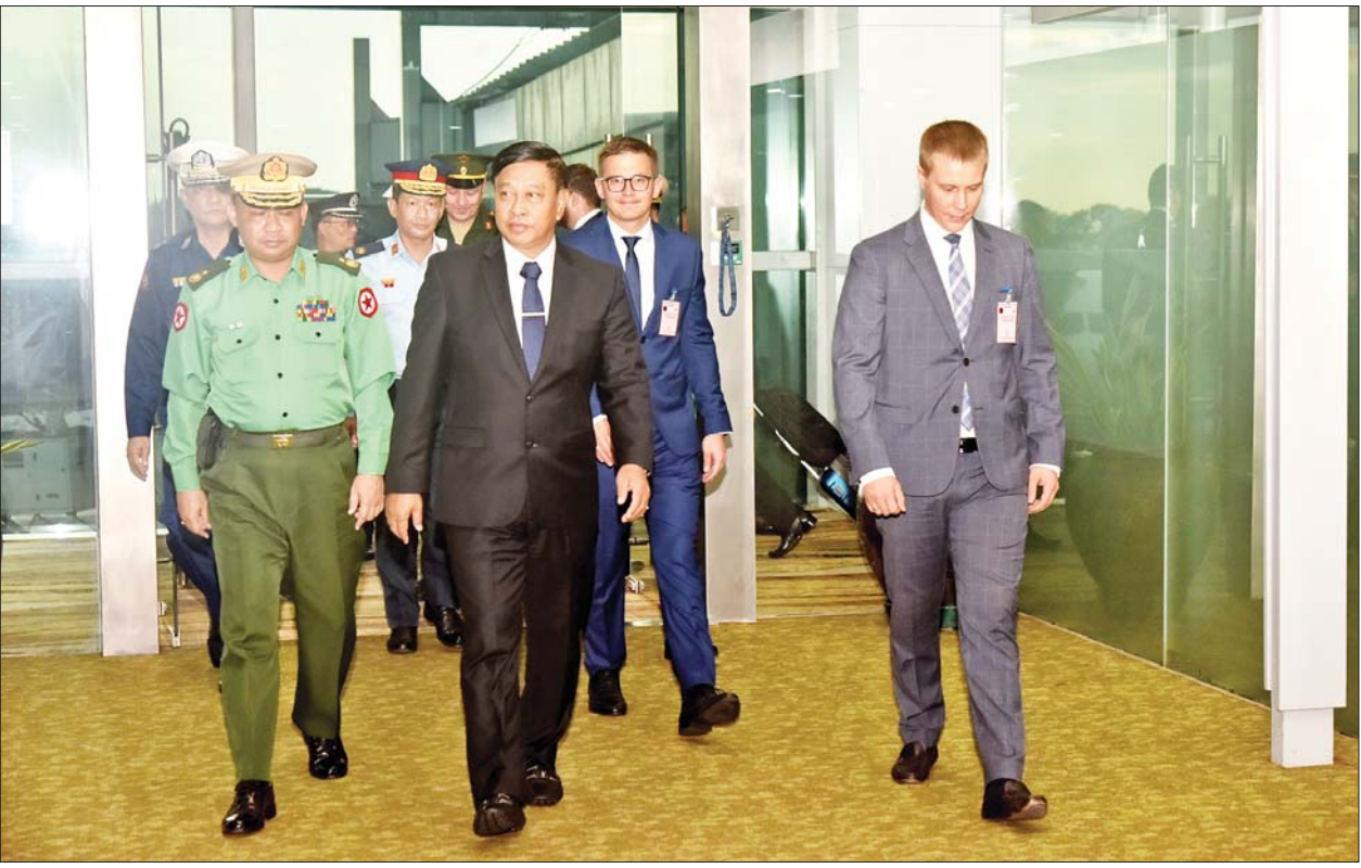
နိုင်ငံတော်စီမံအုပ်ချုပ်ရေးကောင်စီဝင် ဒုတိယဝန်ကြီးချုပ်နှင့် ပြည်ထောင်စုဝန်ကြီး ဗိုလ်ချုပ်ကြီးတင်အောင်စန်း ဦးဆောင်သည့် ကိုယ်စားလှယ်အဖွဲ့ ရန်ကုန်အပြည်ပြည်ဆိုင်ရာလေဆိပ်သို့ ရောက်ရှိစဉ်။

ထို့နောက် နိုင်ငံတကာစစ်ဘက် နည်းပညာဖိုရမ် (ARMY-2023) ဖွင့်ပွဲအခမ်းအနား ကျင်းပမည့် မျိုးချစ်ပန်းခြံ (Patriot Park) သို့ ရောက်ရှိပြီး အစည်းအဝေးခန်းမ ၌ ဒုတိယဝန်ကြီးချုပ်နှင့် ပြည်ထောင်စုဝန်ကြီးသည် ရုရှား နိုင်ငံ ကာကွယ်ရေးဝန်ကြီးဌာန ဒုတိယဝန်ကြီး Colonel General