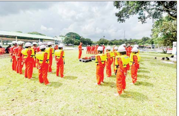
အရာရှိသင်တန်းသားသင်တန်းသူများအနေဖြင့် အင်းလျားကန်အတွင်းစက်လှေများ တစ်စီးချင်း မောင်းနှင်ခြင်း၊ နှစ်စီးရင်ပေါင် တန်း မောင်းနှင်ခြင်း၊ လေးစီးရင်ပေါင်တန်း မောင်းနှင်ခြင်း၊ ရေနစ်နေသူအား Intelligent Lifebuoy နှင့် Line Shooter

အသုံးပြုကယ်ဆယ်ခြင်းနှင့် ရေပြင်အတွင်း မီးငြိမ်းသတ်ရေး နည်းစနစ်များ သရုပ်ပြလေ့ကျင့်သင်ကြားပေးကြသည်။ ကြည့်ရှုအားပေး အဆိုပါသင်တန်း လေ့ကျင့်သင်ကြားမှုကို ဒုတိယညွှန်ကြားရေးမှူးချုပ် ဦးရဲမင်းသူက လာရောက် ကြည့်ရှုအားပေးကာ စနစ်တကျ လေ့ကျင့်သင်ကြားရေး လမ်းညွှန်မှာကြားခဲ့သည်။ သင်တန်းကို ရန်ကုန်တိုင်းဒေသကြီး မီးသတ်ဦးစီးမှူးက အနီးကပ်ကြီးကြပ်ပေးလျက်ရှိပြီး လေ့ကျင့်သင်ကြားမှုကို ငါးရက်ကြာ ပို့ချသွားမည်ဖြစ်ကြောင်း သိရသည်။ စိမ်းလှ(ပြန်/ဆက်)