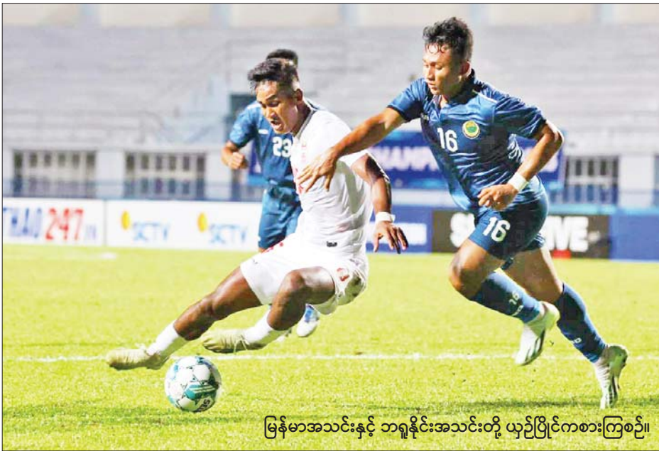
မြန်မာအသင်းနှင့် ဘရူနိုင်းအသင်းတို့ ယှဉ်ပြိုင်ကစားကြစဉ်။

ရန်ကုန် ဩဂုတ် ၂၁ ၂၀၂၃ အာဆီယံ ယူ-၂၃ ချန်ပီယံရှစ်ပြိုင်ပွဲ အုပ်စု (က) နောက်ဆုံးနေ့ကို ဩဂုတ် ၂၁ ရက်က ထိုင်းနိုင်ငံ၌ ဆက်လက်ကျင်းပရာ မြန်မာအသင်း ဂိုးပြတ်အနိုင်ရခဲ့သည်။ လေးဂိုး-တစ်ဂိုးဖြင့်အနိုင်ရ အုပ်စုနောက်ဆုံးနေ့ကို မြန်မာစံတော်ချိန် ည ၇ နာရီခွဲတွင် တစ်ချိန်တည်း ယှဉ်ပြိုင်ကစားခဲ့ပြီး မြန်မာအသင်းက ဘရူနိုင်းအသင်းကိုလေးဂိုး-တစ်ဂိုး၊ အိမ်ရှင်ထိုင်းအသင်းက ကမ္ဘောဒီးယားအသင်းကို နှစ်ဂိုး-ဂိုးမရှိဖြင့် အနိုင်ရခဲ့သည်။ စာမျက်နှာ ၁၄ ကော်လံ ၁ သို့ *