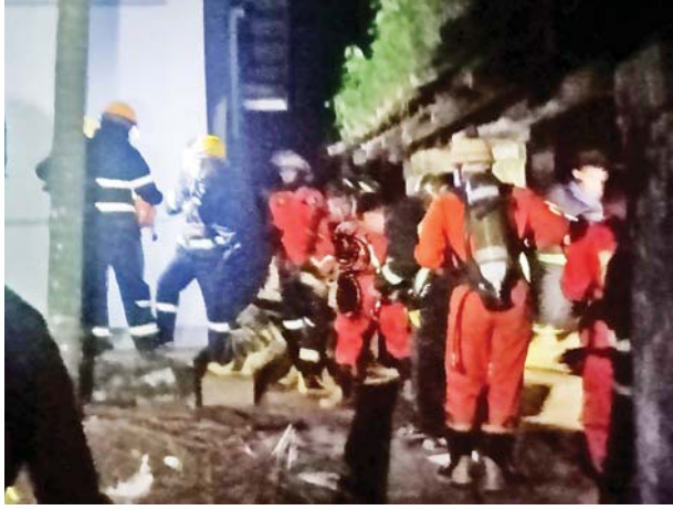
သန္ဓေမီးသတ်တပ်ဖွဲ့ဝင်များဖြင့် ရှင်းလင်းရေးလုပ်ငန်းများ ဆောင်ရွက် ခဲ့ကြောင်းနှင့် လူထုခိုက်မှုမရှိကြောင်း သိရသည်။ စီမံလုံခြုံရေး(ပြန်/ဆက်)

ရန်ကုန်တိုင်းဒေသကြီး ကမာရွတ်မြို့နယ် အမှတ်(၉)ရပ်ကွက် တက္ကသိုလ်ရိပ်သာလမ်း ရန်ကုန်တက္ကသိုလ် ဓာတုဗေဒဌာန Lab အခန်းဖြစ်သော CE-3 ခန်းမ၌ လွန်ခဲ့သော သုံးရက်ခန့်ကလက် တွေ့ခန်းတွင် အသုံးပြုရန် ခွဲတန်းရရှိထားသည့် အလူမီနီယံဆာလဖိတ် ဓာတ်ပြုပြီး ဓာတ်ငွေ့ယိုစိမ့်မှုတစ်ခု ယနေ့ ညနေ ၆ နာရီ မိနစ် ၄၀ ခန့်က ဖြစ်ပွားခဲ့ကြောင်း သိရသည်။ ထိုသို့အလူမီနီယံဆာလဖိတ် ယိုစိမ့်မှုဖြစ်ပွားကြောင်း သတင်းရရှိ သဖြင့် မြို့နယ်မီးသတ်တပ်ဖွဲ့များနှင့် ပရဟိတအသင်းများက ကူညီ ရှင်းလင်းရေးလုပ်ငန်းများ ဆောင်ရွက်ပေးခဲ့သည်။