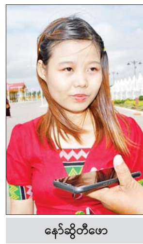
နော်ဆွိတီဖော