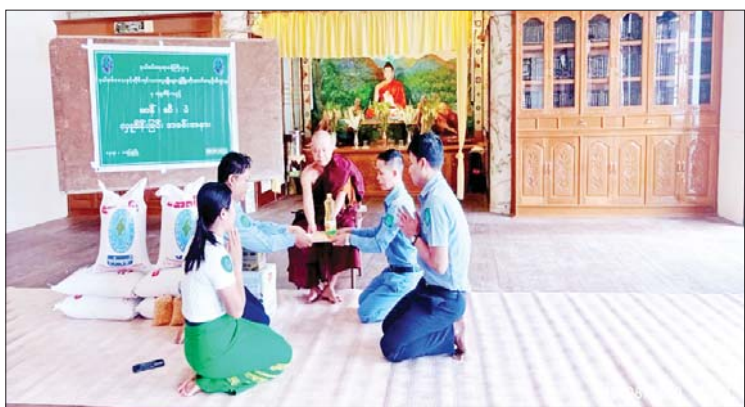
ဦးသူရိယထံသို့ ဆွမ်းဆန်တော် ခုနစ်အိတ်၊ ဆီ ငါးပိဿာ၊ ကုလားပဲ ငါးပိဿာနှင့် လှူဖွယ်ပစ္စည်းများ ဆက်ကပ်လှူဒါန်းခဲ့ကြောင်း သိရသည်။ သတင်းစဉ်

ထိုသို့လှူဒါန်းလျက်ရှိရာ ယနေ့နံနက်ပိုင်းတွင် ရေဖြူမြို့နယ် (ဃ)ရပ်ကွက်ရှိ သာသနာ့ပိလကျောင်းသို့ ရေဖြူမြို့နယ် ဖွံ့ဖြိုးမှုကြီးကြပ်ရေးရုံးမှ တာဝန်ရှိသူများ သွားရောက်၍ ကျောင်းထိုင်ဆရာတော်