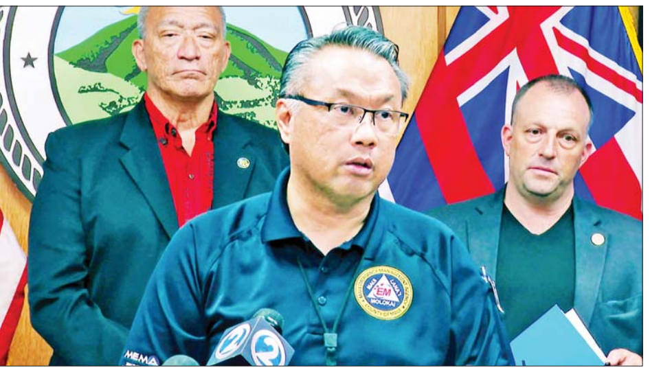
အရေးပေါ်အခြေအနေအမျိုးမျိုးတွင် ဥဩအချက်ပေးသံများကို အသုံးပြုရန်လိုအပ်ကြောင်း ယင်းဗီဒီယိုတွင် ဖော်ပြထားသည်။ အရေးပေါ်စီမံခန့်ခွဲမှု အကြီးအကဲ ဟာမန်အန်ဒါယာ၏ နေရာတွင် အခြားတစ်ဦးကို အမြန်ဆုံးရွေးချယ်သွားမည်ဖြစ်ကြောင်း မြို့တော်ဝန်က ဆိုသည်။ တောမီးလောင်ကျွမ်းမှုကြောင့် သေဆုံးသူ ၁၁၀ ဦးရှိကြောင်းနှင့် တောမီးလောင်ကျွမ်းသည့် မြေဧရိယာ၏ ၄၀ ရာခိုင်နှုန်းအထိ ရှာဖွေကယ်ဆယ်မှုများ ဆောင်ရွက်ပြီးဖြစ်ကြောင်း သိရသည်။ ကိုးကား - အင်န်အိတ်ချီကော ဘာသာပြန် - အောင်ကျော်ကျော်

မှတ်ခဲ့ခြင်းအပေါ် နောင်တမရကြောင်း သတင်းစာရှင်းလင်းပွဲတစ်ရပ်တွင် ပြောကြားခဲ့သည်။ အချက်ပေးဥဩစနစ်သည် တောမီးလောင်ကျွမ်းမှုအတွက် မဟုတ်ဘဲ ဆူနာမီရေလှိုင်းအတွက်သာ ဒီဇိုင်းထုတ်ထားကြောင်း ၎င်းက ဆိုသည်။ ဥဩသံမြည်သည့် အချိန်တွင် ပိုမိုမြင့်မားသောနေရာများကို ရှာဖွေရန် ဒေသခံပြည်သူများအား လေ့ကျင့်ပေးထားကြောင်း လည်း ၎င်းက ပြောကြားသည်။ ဥဩသံမြည်သည့်အချိန်တွင် ပြည်သူများသည် အနီးဝန်းကျင်ရှိတောင်စောင်းဘက်သို့ အပြေးအလွှား သွားကြမည်ဖြစ်ကြောင်း အရေးပေါ်စီမံခန့်ခွဲမှု အကြီးအကဲ ဟာမန်အန်ဒါယာက ဆိုသည်။ သို့သော် ဒေသန္တရအာဏာပိုင်များမှ ထုတ်လုပ်သည့် ဗီဒီယိုသည် ဟာမန်အန်ဒါယာ၏ ပြောကြားချက်နှင့် ကိုက်ညီမှုမရှိပေ။ တောမီးများအပါအဝင်