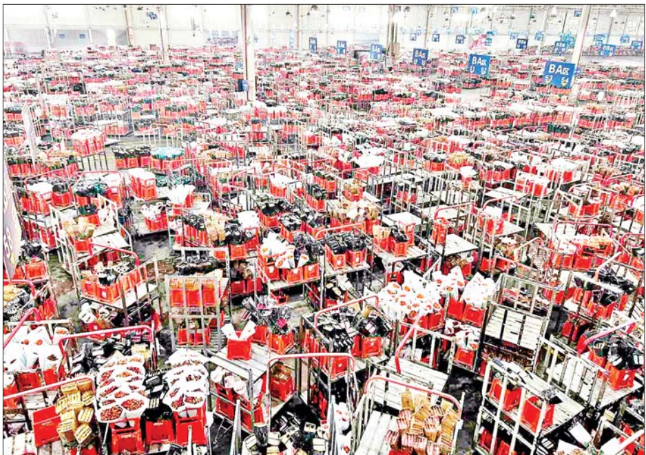
ကူမင်းနိုင်ငံတကာ ပန်းရောင်းဝယ်ရေးစင်တာကို တွေ့ရစဉ်။