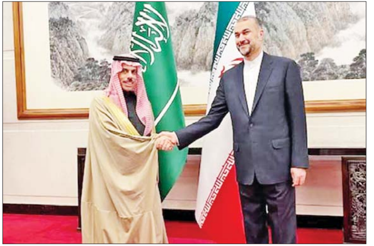
မူသည် ဒေသတွင်း တည်ငြိမ်ရေး စောင့်ကြည့်လေ့လာသူများက ဆိုသည်။ ဖြစ်ပေါ်စေမည်လားဆိုသည်ကိုဆက်လက် ကိုးကား - အင်န်အိတ်ချီကော စောင့်ကြည့်ရမည်ဖြစ်ကြောင်း နိုင်ငံရေး ဘာသာပြန် - အောင်ကျော်ကျော်

ရည်ရွယ်ထားကြောင်း သံအမတ်ကြီး အလီရီဇာ အီနာယာတီက ပြောသည်။ နှစ်နိုင်ငံအနေဖြင့် ပင်လယ်ကွေ့ဒေသအတွင်း စီးပွားရေးဖွံ့ဖြိုးတိုးတက်မှုနှင့် ပူးပေါင်းဆောင်ရွက်မှုအပေါ် အခြေခံပြီး လုံခြုံရေးဆိုင်ရာ ကိစ္စရပ်များကိုလည်း ထူထောင်နိုင်မည်ဟု မျှော်လင့်ကြောင်း အလီရီဇာ အီနာယာတီက ဆိုသည်။ ဆော်ဒီအာရေဗျနိုင်ငံသည် အမေရိကန်၏အကူအညီဖြင့် အစွဲအမူနှင့် ပိုမိုကောင်းမွန်သော ဆက်ဆံရေးရရှိရန် ကြိုးပမ်းလျက်ရှိကြောင်း သိရသည်။ အီရန် - ဆော်ဒီအာရေဗျနှစ်နိုင်ငံ ဆက်ဆံရေး ပုံမှန်ပြန်လည်ဖြစ်ထွန်း