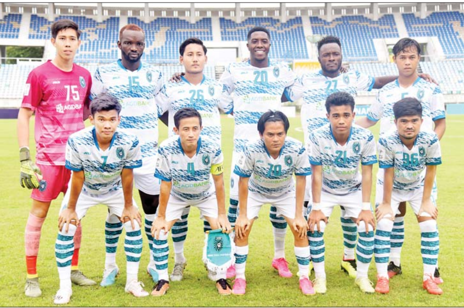
ရန်ကုန်ယူနိုက်တက်အသင်း ကစားသမားများကို တွေ့ရစဉ်။

ရန်ကုန် ဩဂုတ် ၁၈ ၂၀၂၃-၂၀၂၄ ရာသီ AFC Cup ပြိုင်ပွဲ အာဆီယံဇန် ခြေစစ်ပွဲအောင်မြင်ရေး အဆုံးအဖြတ်ပွဲအဖြစ် မြန်မာကလပ် ရန်ကုန်ယူနိုက်တက်အသင်းသည် အဝေးကွင်းပွဲစဉ် ယှဉ်ပြိုင်ကစားရမည်ဖြစ်သည်။ ယှဉ်ပြိုင်ကစားမည့် ရန်ကုန်ယူနိုက်တက်အသင်းသည် AFC Cup အာဆီယံဇန် အကြိုခြေစစ်ပွဲတွင် ဘရူနိုင်းကလပ် DPMM အသင်းကို နှစ်ဂိုး-တစ်ဂိုးဖြင့်အနိုင်ရခဲ့သဖြင့် ခြေစစ်ပွဲ Play-off အဆင့် တက်ရောက်နိုင်ခဲ့ခြင်းဖြစ် သည်။ အာဆီယံဇန်ခြေစစ်ပွဲ Play-off ပွဲစဉ်များကို ဩဂုတ် ၂၃ ရက်တွင် ကျင်းပမည်ဖြစ်ပြီး အင်ဒိုနီးရှား ကလပ် မာကာဆာအသင်းနှင့် မြန်မာကလပ် ရန်ကုန် ယူနိုက်တက်အသင်း၊ စင်ကာပူကလပ် တမ်ပနီစ်ရီဗာ အသင်းနှင့် ကမ္ဘောဒီးယားကလပ် ဖန္ဒမ်းပင်ခရောင်း အသင်းတို့ ယှဉ်ပြိုင်ကစားရမည်ဖြစ်သည်။ စာမျက်နှာ ၁၈ ကော်လံ ၅ သို့ □