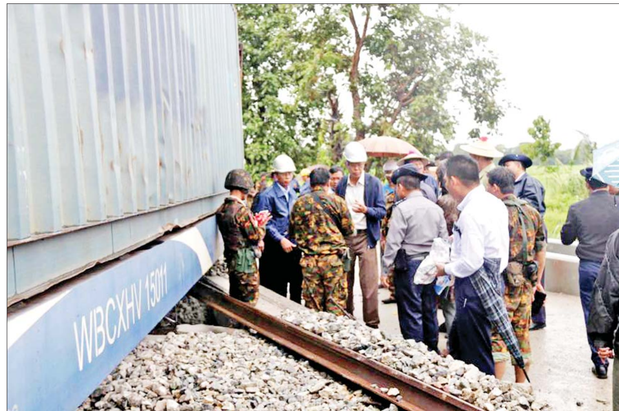
ပြည်ထောင်စုဝန်ကြီး ဗိုလ်ချုပ်ကြီး မြထွန်းဦး၊ မန္တလေး-ရန်ကုန်ခရီးစဉ်ပြေးဆွဲနေသော မြန်မာ့မီးရထား ကုန်တင်ရထားကို အကြမ်းဖက်သမားများက မိုင်းထောင်ဖောက်ခွဲတိုက်ခိုက်သည့် နေရာတွင် ကြည့်ရှုစစ်ဆေးစဉ်။

သဖြင့် စက်ခေါင်း နှစ်ခေါင်း၊ နားနေတွဲ တစ်တွဲနှင့် ကုန်တွဲခြောက်တွဲတို့သည် လမ်း၏ညာဘက်သို့ လမ်းချော်ခြင်း၊ ရထားသံလမ်း ပေ ၁၅၀ ခန့် တွန့်လိမ်ပျက်စီးခြင်းနှင့် ဇေလီဖားတုံးများ ကျိုးပဲ့ပျက်စီးမှုများ ဖြစ်ပေါ်ခဲ့ပြီး ခရီးသည်များ ထိခိုက်ဒဏ်ရာရရှိမှု မရှိကြောင်း သိရသည်။ ညှိနှိုင်းဆောင်ရွက်ပေး ဖြစ်စဉ် ဖြစ်ပွားရာနေရာသို့ ဒုတိယဝန်ကြီးချုပ်နှင့် ပို့ဆောင်ရေးနှင့် ဆက်သွယ်ရေးဝန်ကြီးဌာန ပြည်ထောင်စုဝန်ကြီး ဗိုလ်ချုပ်ကြီး မြထွန်းဦးနှင့် အဖွဲ့သည် မွန်းလွဲပိုင်းတွင် သွားရောက်စစ်ဆေးကာ လမ်းချော်ကျ တိမ်းမှောက်သွားသော စက်ခေါင်းနှင့် ကုန်တွဲများကို အမြန်ဆုံးပြန်လည်မတင်နိုင်ရေးနှင့် လမ်းပိုင်းအမြန်ပြုပြင်၍ ရထားများ ပုံမှန်ပြေးဆွဲနိုင်ရေးတို့အတွက် မြန်မာ့မီးရထားရုံးချုပ်မှ ဌာနအကြီးအကဲများ ကိုယ်တိုင်အနီးကပ် ကြီးကြပ် ဆောင်ရွက်သွားရန်မှာကြားပြီး လိုအပ်သည်များကို ပေါင်းစပ်ညှိနှိုင်းဆောင်ရွက်ပေးသည်။