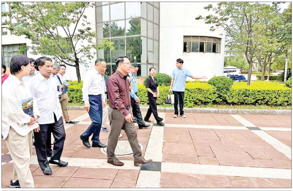
ပြည်ထောင်စုဝန်ကြီး ဦးမောင်မောင်အုန်း ယူနန်စိုက်ပျိုးရေးတက္ကသိုလ်တွင် ကြည့်ရှုလေ့လာစဉ်။

ကူမင်း ဩဂုတ် ၁၈ တရုတ်နိုင်ငံ ကူမင်းမြို့၌ ရောက်ရှိ နေသော ပြန်ကြားရေးဝန်ကြီးဌာန ပြည်ထောင်စုဝန်ကြီး ဦးမောင်မောင်အုန်း နှင့်အဖွဲ့သည် မဲခေါင်ဒေသနိုင်ငံများမှ ကိုယ်စားလှယ်အဖွဲ့များနှင့်အတူ ယနေ့ တွင် ကူမင်းမြို့ရှိ ယူနန်စိုက်ပျိုးရေး တက္ကသိုလ်၊ လော့စစ်ဝမ်နိုင်ငံတကာ ကူးသန်းရောင်းဝယ်ရေးနှင့် ကူမင်းနိုင်ငံ တကာပန်းရောင်းဝယ်ရေး စင်တာတို့ကို သွားရောက်လေ့လာကြသည်။