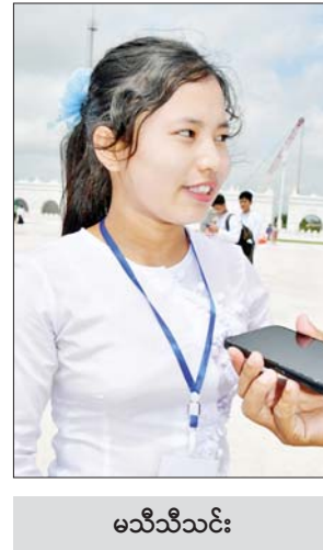
မသီသီသင်း

အင်္ဂလိပ်စာသင်ပြနေတဲ့ ဆရာမ ပါ။ ဘုရားကြီးက ကမ္ဘာမှာ ဉာဏ်တော်အမြင့်ဆုံးဖြစ်တယ်။ သဘာဝ စကျင်ကျောက်သား စစ်စစ်ကို ခေတ်မီစက်ကိရိယာ တွေအသုံးပြုပြီးထုဆစ်ထားတယ် ဆိုတာကို ကျောင်းသား ကျောင်းသူ တွေ ဗဟုသုတရရှိအောင်နဲ့ ဖူးမြော် ကြည့်ညိုနိုင်အောင် လာရောက် ပို့ဆောင်ပေးခြင်း ဖြစ်ပါတယ်။ ဘုရားကြီးကို ဖူးမြော်ရတာလည်း ကြည့်ညိုစရာ ကောင်းတယ်။ ဘုရားကြီးက တန်ခိုးလည်းကြီး ရတာနဲ့ပဲ ဝမ်းသာပီတိ ကျေနပ်မိ ပါတယ်။ ပြီးတော့လည်း အသိ ပညာ၊ ဗဟုသုတတွေ ကြွယ်ဝစေဖို့ ကျောင်းသား ကျောင်းသူတွေကို နောက်ထပ်ပို့ဖို့ အစီအစဉ်ရှိပါသေး တယ်။ နော်ဆွိတီဖော(တောင်ငူမြို့) မာရဝိဇယ ဗုဒ္ဓရုပ်ပွားတော် မြတ်ကြီးက ကြည့်ညိုစရာကောင်း ပါတယ်။ ပြီးတော့ သူငယ်ချင်းတွေ