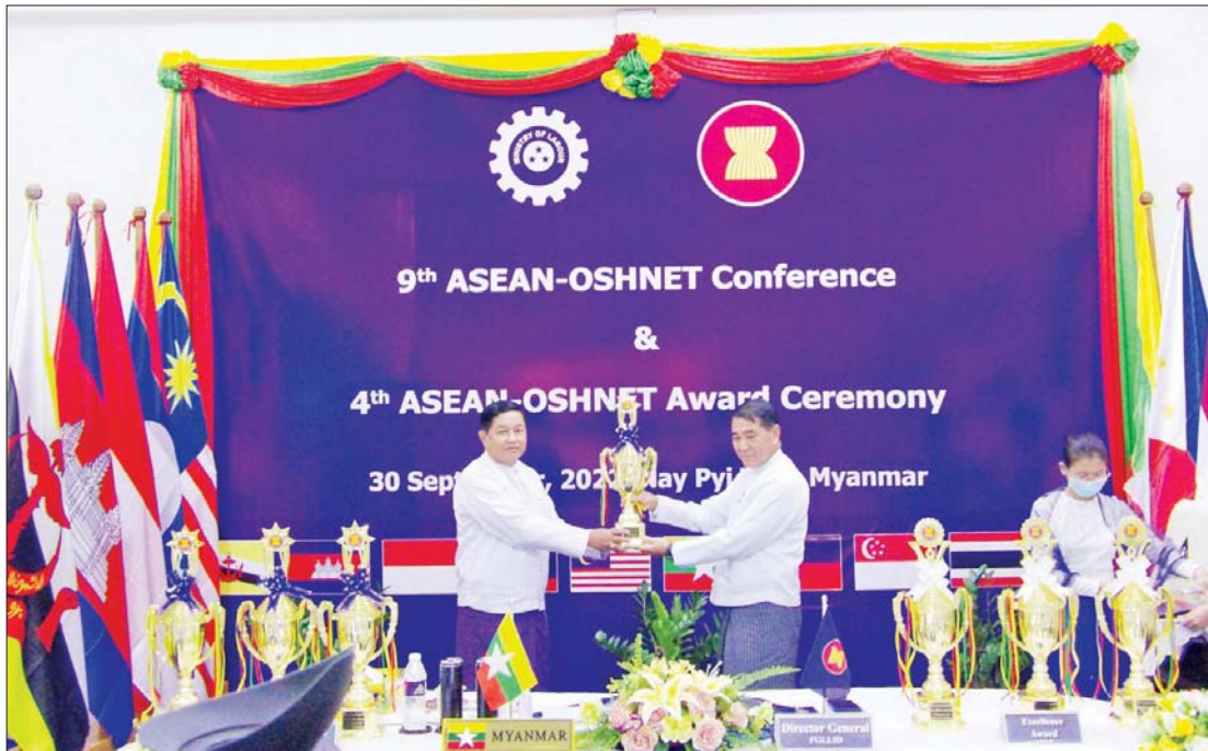
၂၀၂၂ ခုနှစ် (၄) ကြိမ်မြောက် ASEAN-OSHNET လုပ်ငန်းခွင်ဘေးအန္တရာယ်ကင်းရှင်းရေးနှင့် ကျန်းမာရေးဆုချီးမြှင့်ပွဲ အခမ်းအနားတွင် မြန်မာနိုင်ငံကိုယ်စားပြုလုပ်ငန်းရှင်တစ်ဦးအား ဆုချီးမြှင့်စဉ်။

ASEAN-OSHNET Excellence Award နှင့် ASEAN-OSHNET Best Practices Award ဟူ၍ ဆုအမျိုးအစား