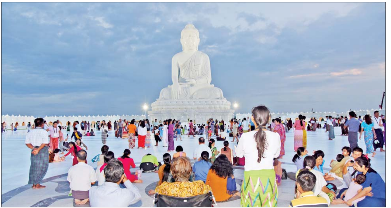
အဆိုပါ မာရဝိဇယဗုဒ္ဓရုပ်ပွားတော်မြတ်ကြီးကို အနယ်နယ်အရပ်ရပ်မှ လာရောက်ဖူးမြော်ကြည်ညိုကြသည့် ရဟန်း၊ ရှင်လူဘုရားဖူးပြည်သူများဖြင့် အထူးစည်ကားလျက်ရှိသည်ကို တွေ့ရှိရသဖြင့် ရုပ်နီ၊ ရပ်ဝေးမှ ဘုရားဖူးပြည်သူများ စိတ်အေးချမ်းသာစွာဖြင့် လာရောက်ဖူးမြော်ကြည်ညိုနိုင်ရန်အတွက် စက်တင်ဘာ ၃ ရက်အထိ ထပ်မံ၍ ရက်သတ်မှတ်တိုးမြှင့် အခမဲ့ဖူးမြော်ကြည်ညိုခွင့်ပြုပေးသွားမည်ဖြစ်ကြောင်း သိရသည်။

ထို့ပြင် မာရဝိဇယဗုဒ္ဓရုပ်ပွားတော်မြတ်ကြီးသို့ အနယ်နယ်အရပ်ရပ်မှ လာရောက်ဖူးမြော်ကြည်ညိုကြသော ရဟန်း၊ ရှင်လူအများပြည်သူများအား ခုနစ်ရက်သားသမီး အလှူရှင်များကလည်း သက်သတ်လွတ်သီးစုံဒီပေါက်ဘူးများ၊ ရေသန့်ဘူးများဖြင့် အာဟာရဒါနလာရောက်လှူဒါန်း၍ ကုသိုလ်ယူကြသည်။