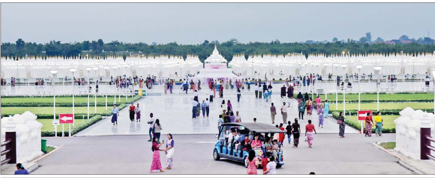
မာရဝိဇယ ဗုဒ္ဓရုပ်ပွားတော်မြတ်ကြီး၏ ပရိဝုဏ်အတွင်းရှိ ကျောက်စာရုံစေတီတော်များအား သပွယ်စွာဖူးတွေ့ရစဉ်။

ဘူမိဗဿမုဒြာဟန် စကျင်ကျောက်နဲ့ထွင်းထုပူဇော်ထားတဲ့ မာရဝိဇယဗုဒ္ဓရုပ်ပွားတော်ကြီးဟာ နေပြည်တော် ဒက္ခိဏသီရိမြို့နယ်ရှိ ဗုဒ္ဓဥယျာဉ်တော် အတွင်း တည်ထားကိုးကွယ်ထားပြီး မြန်မာနိုင်ငံရှိ စကျင်ကျောက် ရုပ်ပွားတော်တွေအနက် ကမ္ဘာ့အမြင့်ဆုံးနဲ့ အလေးချိန်အများဆုံး ထူးမြတ်လှတဲ့ ရုပ်ပွားတော်တစ်ဆူဖြစ်တယ်လို့