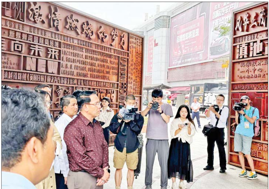
ပြည်ထောင်စုဝန်ကြီး ဦးမောင်မောင်အုန်း လော့စစ်ဝမ် နိုင်ငံတကာ ရောင်းဝယ်ရေးမြို့တော်တွင် ကြည့်ရှုလေ့လာစဉ်။

တည်ဆောက်၍ အဝတ်အထည်၊ လူသုံး ကုန်နှင့် လျှပ်စစ်ပစ္စည်းများဖြင့် အဆောက်အအုံ သုံးခုတွင် ဇန်အလိုက် ခွဲခြားဆောင်ရွက်နေကြောင်း၊ ပြည်တွင်း ထုတ်ကုန်များကို အခြေခံပြီး တောင်အာရှ နှင့် အရှေ့တောင်အာရှသို့ဖြန့်ချိသည့် လက်ကားရောင်းဝယ်ရေးစင်တာဖြစ်လာ စေရေး ကြိုးပမ်းဆောင်ရွက်လျက်ရှိ ကြောင်း ရှင်းလင်းတင်ပြပြီး စင်တာ အတွင်း လိုက်လံရှင်းလင်းပြသသည်။ တိုးတက်အောင်မြင်လျက်ရှိ အဆိုပါ လက်ကားဈေးမှာ တရုတ် နိုင်ငံ အနောက်တောင်ပိုင်းတွင် အကြီးဆုံး ဖြစ်ပြီး တရုတ်နိုင်ငံ၌ တတိယအကြီးဆုံး ဖြစ်ကာ လုပ်ငန်းများ တိုးတက်အောင်မြင် လျက်ရှိကြောင်း သိရသည်။ ညနေပိုင်းတွင် ကူမင်းနိုင်ငံတကာ ပန်းရောင်းဝယ်ရေးစင်တာ (Kumming International Flora Auction Trading Center) သို့ ရောက်ရှိကြရာ တာဝန်ရှိသူ များက ၎င်းတို့စင်တာသည် ကမ္ဘာပေါ်တွင် နံပါတ်(၂)အကြီးဆုံးနှင့် အာရှနှင့်တရုတ် နိုင်ငံတွင် အကြီးဆုံးဖြစ်ပြီး ပန်းစိုက် ဧက သုံးသိန်းခွဲခန့်ဖြင့် တစ်နှစ်ပတ်လုံး စဉ်ဆက် မပြတ် စိုက်ပျိုးထုတ်လုပ်ရောင်းဝယ်နေ ကြောင်း၊ နေ့စဉ် ပန်းစည်း လေး၊ ငါးသန်း ခန့်အား ပြည်တွင်းသို့ ၉၀ ရာခိုင်နှုန်းနှင့် ကျန် ၁၀ ရာခိုင်နှုန်းကို ပြည်ပသို့ ရောင်းချ တင်ပို့နေကြောင်း၊ ပန်းများ အဆင်းအနံ့ အရည်အသွေး တိုးတက်စေရန် မြှင့်တင် ဆောင်ရွက်လျက်ရှိကြောင်း ရှင်းလင်း တင်ပြပြီး စင်တာအတွင်း လိုက်လံ ရှင်းလင်းပြသခဲ့သည်။ သတင်းစဉ်