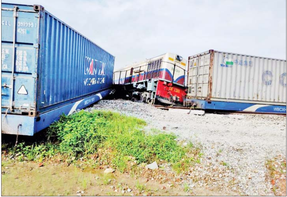
အကြမ်းဖက်သမားများက မိုင်းထောင်ဖောက်ခွဲတိုက်ခိုက်ခဲ့သည့် မန္တလေး-ရန်ကုန်ခရီးစဉ်ပြေးဆွဲနေသော မြန်မာ့မီးရထား ကုန်တင်ရထားကို တွေ့ရစဉ်။

ဇေယျာမိုး မုံရွာခရိုင်တွင် ဆီထွက်သီးနှံစိုက်တောင်သူများကို သက်ဆိုင်ရာ မြို့နယ်စိုက်ပျိုးရေးဦးစီးဌာနက ဆီထွက်သီးနှံ စိုက်ဧရိယာများကို GAP စနစ်ဖြင့် စိုက်ပျိုးရန် အရည်အသွေးကောင်း၍ ပန်းတိုင်အထွက်နှုန်း ထွက်ရှိလာစေရန် သက်ဆိုင်ရာ ဧရိယာအတွင်း ဆီဖူလုံမှုရှိ၍ အခြားဒေသများသို့ တင်ပို့ရောင်းချနိုင်ရန် နည်းပညာပေးဆောင်ရွက်လျက်ရှိကြောင်း သိရသည်။ ဆောင်းသီးနှံစိုက်ပျိုးရန် ၁၄၅၉၅၁ ဧကလျာထား ထို့အပြင် ဆောင်းသီးနှံစိုက်ပျိုးရာ၌ မုံရွာခရိုင်တွင် ဆီထွက်သီးနှံများ စိုက်ပျိုးရန်အတွက် မြို့နယ်အလိုက် လျာထားမှုအနေဖြင့် မုံရွာမြို့နယ်တွင် ၂၇၇၈၁ ဧက၊ ချောင်းဦးမြို့နယ်တွင် ၂၆၉၄၁ ဧက၊ ဘုတလင်မြို့နယ်တွင် ၄၆၅၉၇ ဧကနှင့် အရာတော်မြို့နယ်တွင် ၄၄၆၃၂ ဧက စုစုပေါင်း ၁၄၅၉၅၁ ဧက ဖြစ်ကြောင်း သိရသည်။ ခရိုင်(ပြန်/ဆက်)