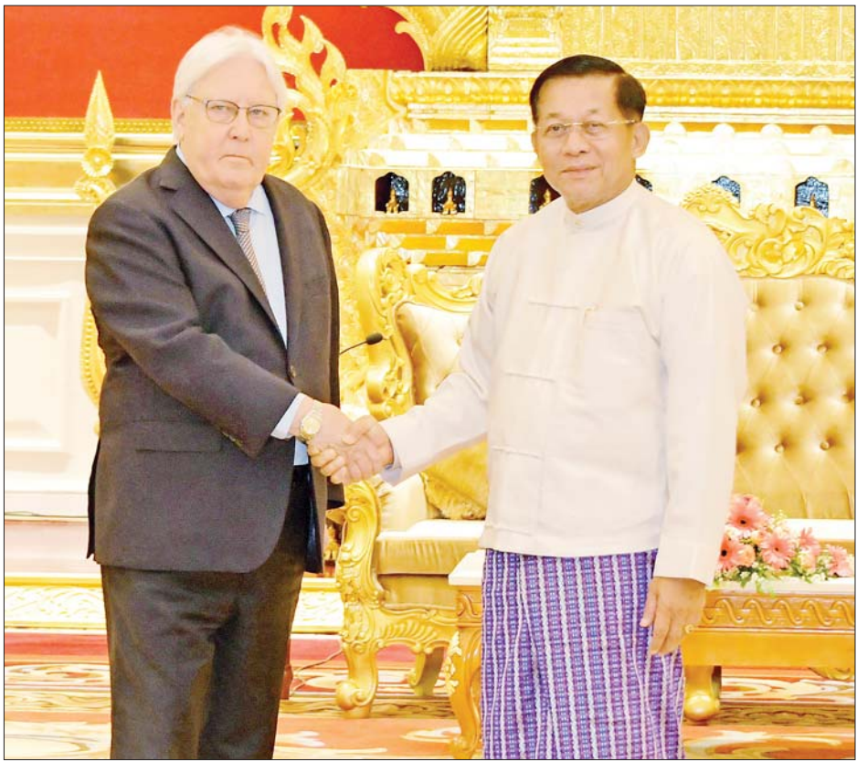
နိုင်ငံတော်စီမံအုပ်ချုပ်ရေးကောင်စီဥက္ကဋ္ဌ နိုင်ငံတော်ဝန်ကြီးချုပ် ဗိုလ်ချုပ်မှူးကြီးမင်းအောင်လှိုင် ကုလသမဂ္ဂလူသားချင်းစာနာထောက်ထားမှုဆိုင်ရာနှင့် အရေးပေါ်ကယ်ဆယ်ရေးဆိုင်ရာ ညှိနှိုင်းရေးမှူးနှင့် ကုလသမဂ္ဂလူသားချင်း စာနာထောက်ထားမှုဆိုင်ရာညှိနှိုင်းရေးမှူး (UNOCHA)၏ အကြီးအကဲဖြစ်သူ Under Secretary General Mr. Martin Griffiths အား ရင်းရင်းနှီးနှီး နှုတ်ဆက်စဉ်။