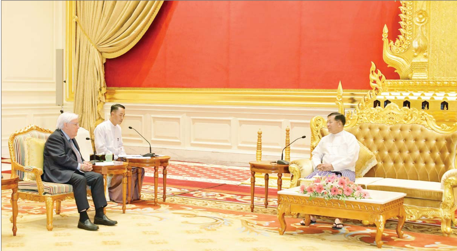
နိုင်ငံတော်စီမံအုပ်ချုပ်ရေးကောင်စီဥက္ကဋ္ဌ နိုင်ငံတော်ဝန်ကြီးချုပ် ဗိုလ်ချုပ်မှူးကြီးမင်းအောင်လှိုင် ကုလသမဂ္ဂလူသားချင်းစာနာထောက်ထားမှုဆိုင်ရာနှင့် အရေးပေါ်ကယ်ဆယ်ရေးဆိုင်ရာ ညှိနှိုင်းရေးမှူးနှင့် ကုလသမဂ္ဂလူသားချင်းစာနာထောက်ထားမှုဆိုင်ရာညှိနှိုင်းရေးရုံး(UNOCHA)၏ အကြီးအကဲဖြစ်သူ Under Secretary General Mr. Martin Griffiths ဦးဆောင်သော ကိုယ်စားလှယ်အဖွဲ့အား လက်ခံတွေ့ဆုံစဉ်။

နေပြည်တော် ဩဂုတ် ၁၅ နိုင်ငံတော် စီမံအုပ်ချုပ်ရေးကောင်စီဥက္ကဋ္ဌ နိုင်ငံတော်ဝန်ကြီးချုပ် ဗိုလ်ချုပ်မှူးကြီး မင်းအောင်လှိုင်ထံ ကုလသမဂ္ဂလူသားချင်း စာနာထောက်ထားမှုဆိုင်ရာနှင့် အရေးပေါ်ကယ်ဆယ်ရေးဆိုင်ရာ ညှိနှိုင်းရေးမှူးနှင့် ကုလသမဂ္ဂလူသားချင်းစာနာထောက်ထားမှုဆိုင်ရာ ညှိနှိုင်းရေးရုံး(UNOCHA)၏ အကြီးအကဲဖြစ်သူ Under Secretary General Mr. Martin Griffiths ဦးဆောင်သော ကိုယ်စားလှယ်အဖွဲ့သည် ယနေ့ ဗွန်းလုံပိုင်းတွင် နေပြည်တော်ရှိ နိုင်ငံတော်စီမံအုပ်ချုပ်ရေးကောင်စီဥက္ကဋ္ဌရုံး သံတမန်ဆောင်ရွက်ခန်းမ၌ လာရောက်တွေ့ဆုံသည်။ တက်ရောက် အဆိုပါတွေ့ဆုံပွဲသို့ နိုင်ငံတော်စီမံအုပ်ချုပ်ရေး ကောင်စီဥက္ကဋ္ဌ နိုင်ငံတော်ဝန်ကြီးချုပ်နှင့် အတူကောင်စီတွဲဖက် အတွင်းရေးမှူး ဒုတိယဗိုလ်ချုပ်ကြီး ရဲဝင်းဦး၊ ပြည်ထောင်စုဝန်ကြီးများ ဖြစ်ကြသည့် ဦးသန်းဆွေ၊ ဦးကိုကိုလှိုင်၊ စာမျက်နှာ ၃ ကော်လံ ၁ သို့ ။