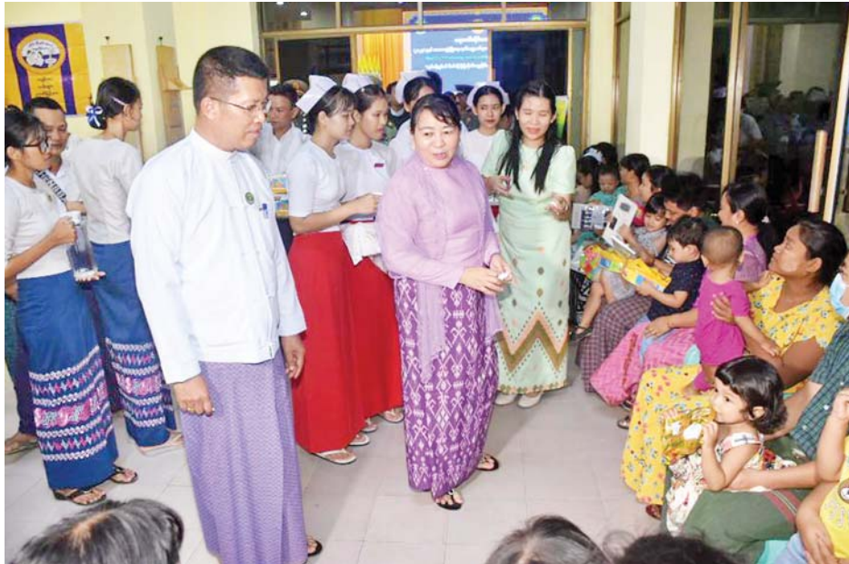
မိခင်အထူးဆုနှင့် နှစ်သိမ့်ဆု ရရှိသူများအား လည်းကောင်း ဆုများချီးမြှင့်ခဲ့သည်။ ထို့နောက် ဝန်ကြီးချုပ်နှင့် တာဝန်ရှိသူများသည် ငါးနှစ်အောက် ကလေးများအား ဗီတာမင်အေ တိုက်ကျွေးခြင်းနှင့် သန်ချဆေးများ တိုက်ကျွေးခြင်း၊ ကိုယ်ဝန်ဆောင် မိခင်များအား အဏုအာဟာရဆေးဝါးများ

ရောဂါတိုင်းဒေသကြီး အာဟာရဖွံ့ဖြိုးရေး ရက်သတ္တပတ်များလှုပ်ရှားမှု အထိမ်းအမှတ် အခမ်းအနားကို ပုသိမ်မြို့ မြို့တော်ခန်းမ၌ ယနေ့နေ့ မွန်းလွဲပိုင်းက ပြုလုပ်ခဲ့ရာ တိုင်းဒေသကြီး ဝန်ကြီးချုပ် ဦးတင်မောင်ဝင်းနှင့် ဇနီး၊ အနောက်တောင်တိုင်းစစ်ဌာနချုပ် တိုင်းမှူး၊ အစိုးရအဖွဲ့ဝင် ဝန်ကြီးများနှင့် ၎င်းတို့၏ဇနီးများ၊ တိုင်းဒေသကြီး အဆင့်ဌာနဆိုင်ရာများ၊ မိခင်နှင့်ကလေးစောင့်ရှောက်မှု ကြီးကြပ်ရေးအဖွဲ့များ၊ အမျိုးသမီးရေးရာအဖွဲ့များ၊ ကိုယ်ဝန်ဆောင်များနှင့် ရင်သွေးမိခင်များ တက်ရောက်ခဲ့ကြသည်။