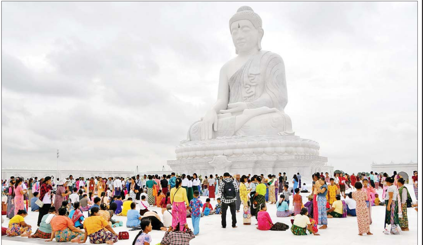
မာရဝိဇယရုပ်ပွားတော်မြတ်ကြီးအား အနယ်နယ်အရပ်ရပ်မှ ပြည်သူများ စည်ကားသိုက်မြိုက်စွာ လာရောက်ဖူးမြော်ကြည့်ညိုကြသည့်ကို ဩဂုတ် ၁၄ ရက်က တွေ့ရစဉ်။

ဒီပင်္ကရာမြတ်စွာဘုရားမှစပြီး နှစ်ကျပ်လေးဆူ