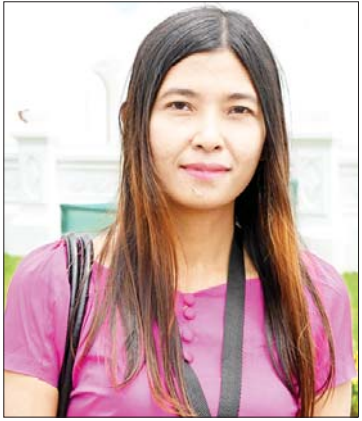
မဆုမြတ်မွန်