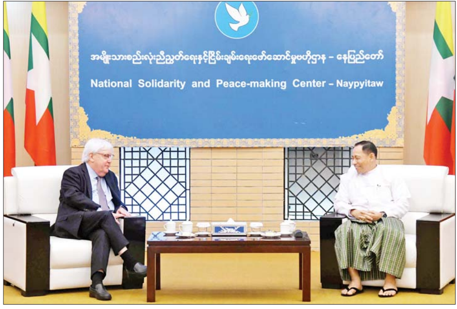
အမျိုးသားစည်းလုံးညီညွတ်ရေးနှင့် ငြိမ်းချမ်းရေးဖော်ဆောင်မှုဗဟိုဌာန - နေပြည်တော် National Solidarity and Peace-making Center - Naypyitaw

နေပြည်တော် ဩဂုတ် ၁၅ နိုင်ငံတော် စီမံအုပ်ချုပ်ရေးကောင်စီအဖွဲ့ဝင် အမျိုးသားစည်းလုံးညီညွတ်ရေးနှင့် ငြိမ်းချမ်းရေးဖော်ဆောင်မှုညှိနှိုင်းရေးကော်မတီဥက္ကဋ္ဌ ပြည်ထောင်စုဝန်ကြီး ဒုတိယဗိုလ်ချုပ်ကြီး ရာပြည့်သည် ကုလသမဂ္ဂအဖွဲ့အစည်း၏ တတိယအဆင့်ရှိ အဆင့်မြင့်အရာရှိကြီးနှင့် ကုလသမဂ္ဂလူသားချင်းစာနာထောက်ထားမှုဆိုင်ရာ ညှိနှိုင်းရေးမှူး (UNOCHA)၏ အကြီးအကဲဖြစ်သူ ကုလသမဂ္ဂလူသားချင်းစာနာထောက်ထားမှုဆိုင်ရာနှင့် အရေးပေါ်ကယ်ဆယ်ရေးဆိုင်ရာ ညှိနှိုင်းရေးမှူး Under Secretary General Mr. Martin Griffiths ဦးဆောင်သည့် ကိုယ်စားလှယ်အဖွဲ့အား ယနေ့နံနက်ပိုင်းတွင် နေပြည်တော်ရှိ အမျိုးသားစည်းလုံးညီညွတ်ရေးနှင့် ငြိမ်းချမ်းရေးဖော်ဆောင်မှုဗဟိုဌာန အစည်းအဝေးခန်းမ၌ လက်ခံတွေ့ဆုံသည်။ တွေ့ဆုံစဉ် လူသားချင်းစာနာထောက်ထားမှုဆိုင်ရာ အကူအညီပေးရေးကိစ္စရပ်များ၊ မြန်မာနိုင်ငံ၏ ငြိမ်းချမ်းရေးလုပ်ငန်းစဉ်ဆိုင်ရာ ကိစ္စရပ်များနှင့် အရေးပေါ်ကယ်ဆယ်ရေးဆိုင်ရာ ကိစ္စရပ်များအပေါ် အမြင်ချင်းဖလှယ်ဆွေးနွေးခဲ့ကြသည်။ တက်ရောက် တွေ့ဆုံဆွေးနွေးပွဲသို့ အမျိုးသားစည်းလုံးညီညွတ်ရေးနှင့် ငြိမ်းချမ်းရေးဖော်ဆောင်မှု ညှိနှိုင်းရေးမှူး ဒုတိယဗိုလ်ချုပ်ကြီး မင်းနိုင်၊ မြန်မာနိုင်ငံဆိုင်ရာ ညှိနှိုင်းရေးမှူး Mr. Ramanatha Balakrishnan၊ မြန်မာနိုင်ငံ၏ ကုလသမဂ္ဂလူသားချင်းစာနာထောက်ထားမှုဆိုင်ရာ ညှိနှိုင်းရေးမှူး(UNOCHA) အကြီးအကဲ Mr. Sajjad Mohammadi၊ မြန်မာနိုင်ငံ၏ ကုလသမဂ္ဂ လူသားချင်းစာနာထောက်ထားမှုဆိုင်ရာ ညှိနှိုင်းရေးမှူး (UNOCHA) ဒုတိယအကြီးအကဲ Ms. Danielle Parry နှင့် တာဝန်ရှိသူများ ပါဝင် တက်ရောက်ကြပြီး အမှတ်တရလက်ဆောင်ပစ္စည်းများ ပေးအပ်ခဲ့ကြောင်း သိရသည်။