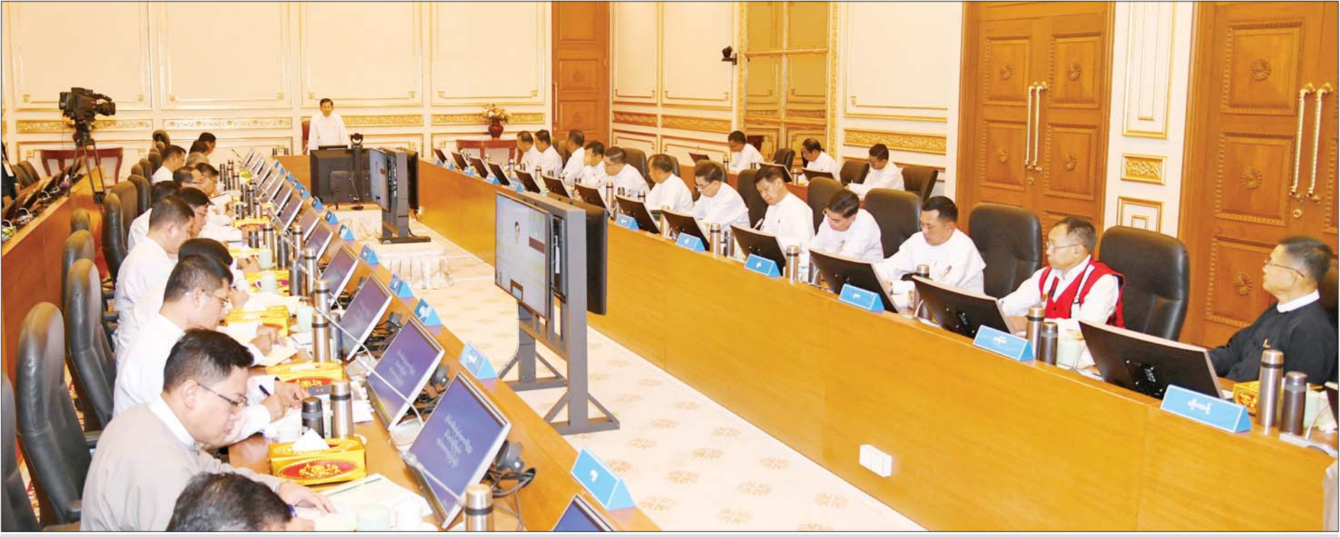
နိုင်ငံတော်စီမံအုပ်ချုပ်ရေးကောင်စီဥက္ကဋ္ဌ နိုင်ငံတော်ဝန်ကြီးချုပ် ဗိုလ်ချုပ်မှူးကြီးမင်းအောင်လှိုင် တိုင်းဒေသကြီးနှင့် ပြည်နယ်ဝန်ကြီးချုပ်များ၊ ကိုယ်ပိုင်အုပ်ချုပ်ခွင့်ရဒေသနှင့် တိုင်းဥက္ကဋ္ဌများအား တွေ့ဆုံအမှာစကားပြောကြားစဉ်။