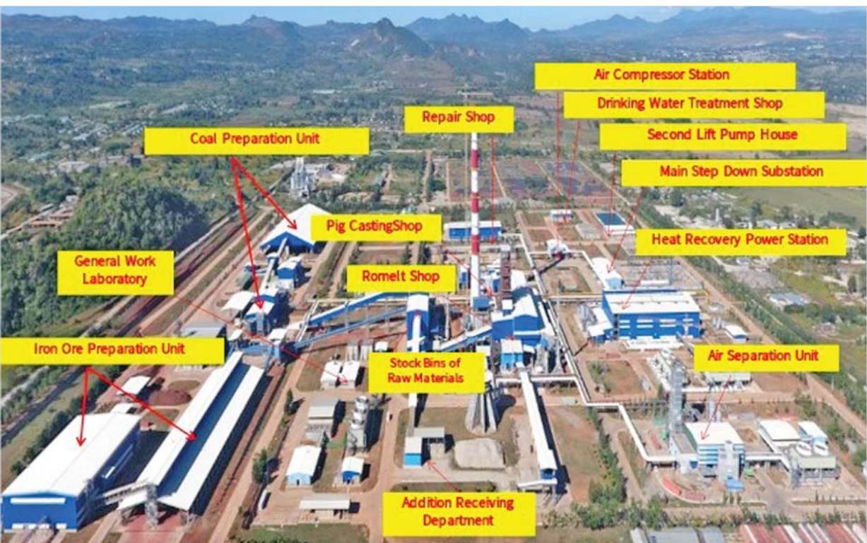
အမှတ်(၂)သံမဏိစက်ရုံ (ပင်းပက်) ရှိ အဓိကအလုပ်ရုံများကို တွေ့ရစဉ်။

စက်ရုံ၏အဓိကထုတ်ကုန်မှာ သံစိမ်း (Pig Iron) ဖြစ်ပြီး တစ်နှစ်လျှင် တန်ချိန်နှစ်သိန်း ထုတ်လုပ်မည်ဖြစ်ပါသည်။ စက်ရုံအတွက် အဓိကလိုအပ်သောကုန်ကြမ်းငါးမျိုးမှာ သံရိုင်း (ဟိမင် တိုက်နှင့် လီမွန်နိုက်)၊ ထုံးကျောက်၊ ဒိုလိုမိုက်ကျောက်၊ ဆီလီကာသံနှင့် ကျောက်မီးသွေးတို့ဖြစ် ပါသည်။ ကျောက်မီးသွေးမှအပ ကျန်သောကုန်ကြမ်းလေးမျိုးမှာ စက်ရုံဧရိယာအနီးဝန်းကျင်တွင် ရှိပါသည်။ စက်ရုံ၏ထုတ်လုပ်နိုင်မည့် သက်တမ်းအနေဖြင့် ပင်းပက်ဒေသရှိ သံရိုင်းထွက်ရှိနိုင်မည့် တန်ချိန် သန်း ၇၀ အပေါ်တွင် မူတည်တွက်ချက်ပါက နှစ်ပေါင်း ၁၁၀ အထိ ထုတ်ယူသုံးစွဲနိုင်မည် ဖြစ်ပါသည်။ စက်ရုံအတွက် အသုံးပြုမည့်ရေကို စက်ရုံအရှေ့ဘက် ကပ်လျက်တည်ရှိသည့် နမ့်တစ်ဖက် ချောင်းမှ ရရှိမည်ဖြစ်ပြီး သဘာဝဓာတ်ငွေ့ကို ကျောက်ဖြူ-ကူမင်း ရွှေသဘာဝဓာတ်ငွေ့ပိုက်လိုင်းမှ ရယူထား