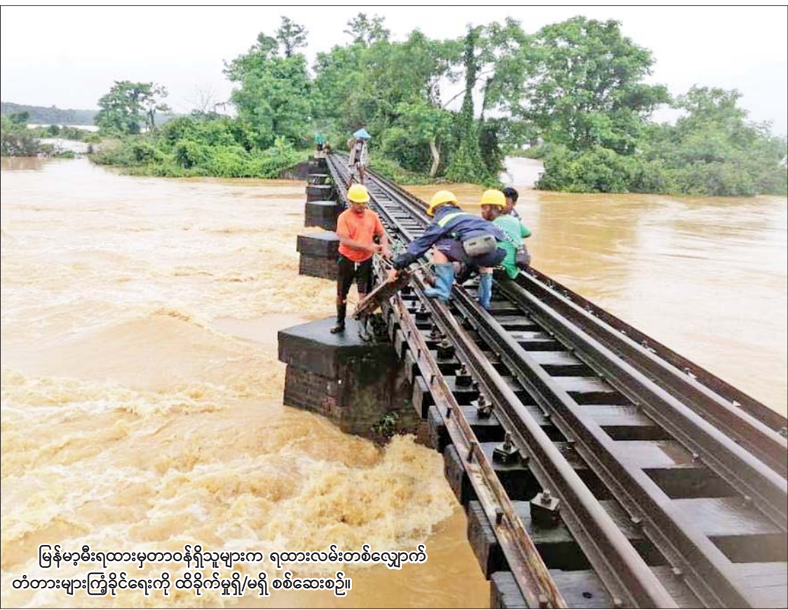
မြန်မာ့စီးရထားမှတာဝန်ရှိသူများက ရထားလမ်းတစ်လျှောက် တံတားများကြံ့ခိုင်ရေးကို ထိခိုက်မှုရှိ/မရှိ စစ်ဆေးစဉ်။

စောင့်ဆိုင်းလျက်ရှိ အဆိုပါ ဖြစ်စဉ်ကြောင့် ရန်ကုန်မှ ထွက်ခွာလာသော အမှတ်(၈၁)အဆန် လူစီးအမြန်ရထားနှင့် အမှတ်(၈၉)အဆန် RBE အမြန်ရထားတို့သည် နှင်းပုလဲ ဘူတာ၌ လည်းကောင်း၊ မော်လမြိုင်မှ ထွက်ခွာလာသော အမှတ်(၈၂)အစုန် လူစီးအမြန်ရထားသည် တောင်စွန်းဘူ တာနှင့် အမှတ်(၉၀)အစုန် RBE အမြန် ရထားသည် စာမျက်နှာ ၉ ကော်လံ ၁ သို့ ❖