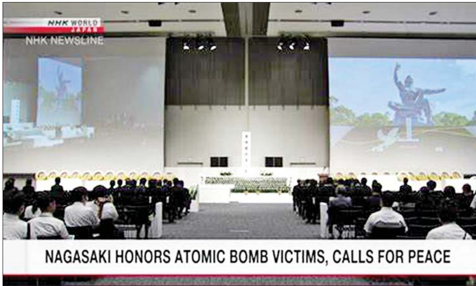
NAGASAKI HONORS ATOMIC BOMB VICTIMS, CALLS FOR PEACE

ဒုတိယကမ္ဘာစစ်အတွင်း ဂျပန်နိုင်ငံ နာဂါဆာကီ မြို့အပေါ် အဏုမြူဗုံးကြဲချခြင်း (၇၈) နှစ်မြောက် အခမ်းအနားကို ဩဂုတ် ၉ ရက်တွင် ဂျပန်နိုင်ငံ၌ ကျင်းပသည်။ ဗုံးကြဲချမှုကြောင့် ဂျပန်နိုင်ငံသား အများအပြားသေဆုံးခဲ့ပြီး ယင်းဖြစ်စဉ်အရ နိုင်ငံ တကာမှ ခေါင်းဆောင်များအား နျူးကလီးယား လက်နက်ဖျက်သိမ်းရေးအတွက် ဂျပန်နိုင်ငံက တောင်းဆိုခဲ့သည်။ ဗုံးကြဲချသည့်နေရာအနီးတွင် တည်ရှိသည့် နာဂါဆာကီပန်းခြံသို့ ဆုတောင်းရန် ဒေသခံများ ယနေ့နံနက်ပိုင်းက ရောက်ရှိခဲ့သည်။