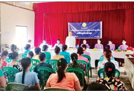
အစာများ ပြင်ဆင်ချက်ပြုတ်ပြသခြင်းနှင့် မိခင်များအား သံဓာတ်ဆေးပြားနှင့် Vitamin B တိုက်ကျွေးကြကြောင်း သိရသည်။

လက်ပံတန်း ဩဂုတ် ၉ ပဲခူးတိုင်းဒေသကြီး လက်ပံတန်းမြို့ မြို့နယ်အထွေထွေအုပ်ချုပ်ရေးဦးစီးဌာနခန်းမ၌ ဩဂုတ် ၈ ရက် နံနက် ၁၀ နာရီက ကမ္ဘာ့မိခင်နို့တိုက်ကျွေးရေးနှင့် အာဟာရဖွံ့ဖြိုးရေး အထိမ်းအမှတ် အခမ်းအနားကျင်းပကြောင်း သိရသည်။