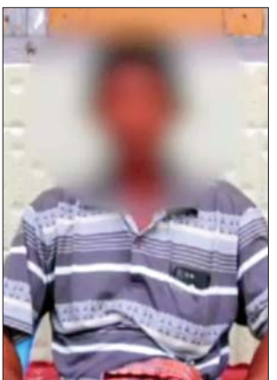
ဖမ်းဆီးခေါ်ဆောင်ခံရသည့် ကျေးရွာသားတစ်ဦး

ကျွန်တော်တို့ ဩဂုတ် ၅ ရက်နေ့မှာ PDF အကြမ်းဖက်သမားများက ကျွန်တော်တို့ တောင်သူတွေ၊ နွားကျောင်းသားတွေ၊ လယ်ယာ လုပ်ကိုင်သူတွေကို လူ ၂၀ / ၂၅ လောက် ကျွန်တော်တို့ရွာရဲ့ အနောက်ဘက်မှာ လာရောက်ပြီးတော့ ပျိုးနတ်သမားတွေကို ဖမ်းဆီးလာခဲ့တယ်။ နောက် နွားကျောင်းသားတွေ၊ ဆိတ်ကျောင်းသားတွေကိုလည်း ဖမ်းဆီးလာခဲ့တယ်။ ကျွန်တော်