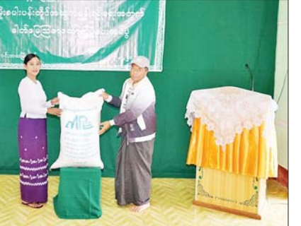
ပင်းတယ်မြို့နယ်၌ မိုးစပါးပန်းတိုင်အထွက်နှုန်းရရှိရေး တောင်သူများအား ယူရီးယားဓာတ်မြေဩဇာ ထောက်ပံ့

ဆက်လက်၍ ပုသိမ်ခရိုင် စီမံအုပ်ချုပ်ရေးမှူးနှင့် တာဝန်ရှိ သူများသည် ပုသိမ်မြို့ အမှတ်(၇) ရပ်ကွက် စိုက်ပျိုးရေးဦးစီးဌာန ဝိုင်းဝန်းတွင် သစ်စိမ်းမြေဩဇာ (ပိုက်ဆံလျှော်) မျိုးစေ့စုဆောင်း ထားရှိမှုများကို ကွင်းဆင်း ကြည့်ရှုစစ်ဆေးခဲ့ကြောင်း သိရ သည်။