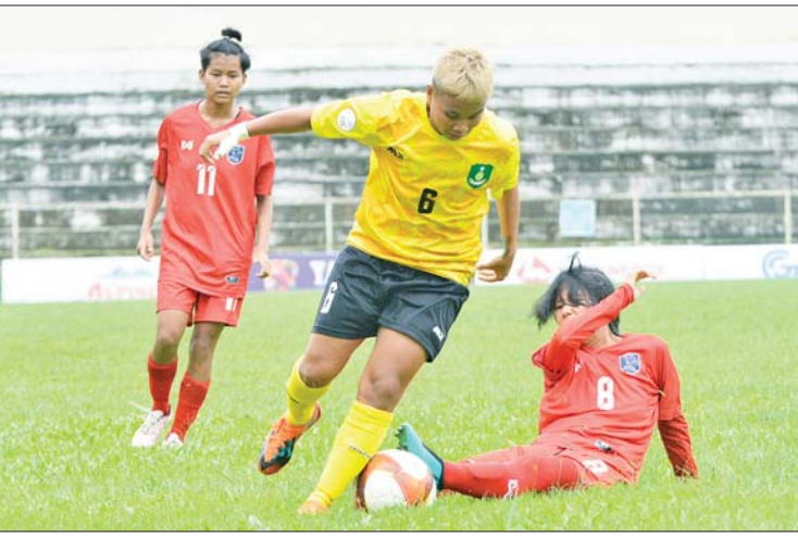
မြဝတီအသင်းနှင့် Young Lionesses အသင်းတို့ ယှဉ်ပြိုင်ကစားကြစဉ်။