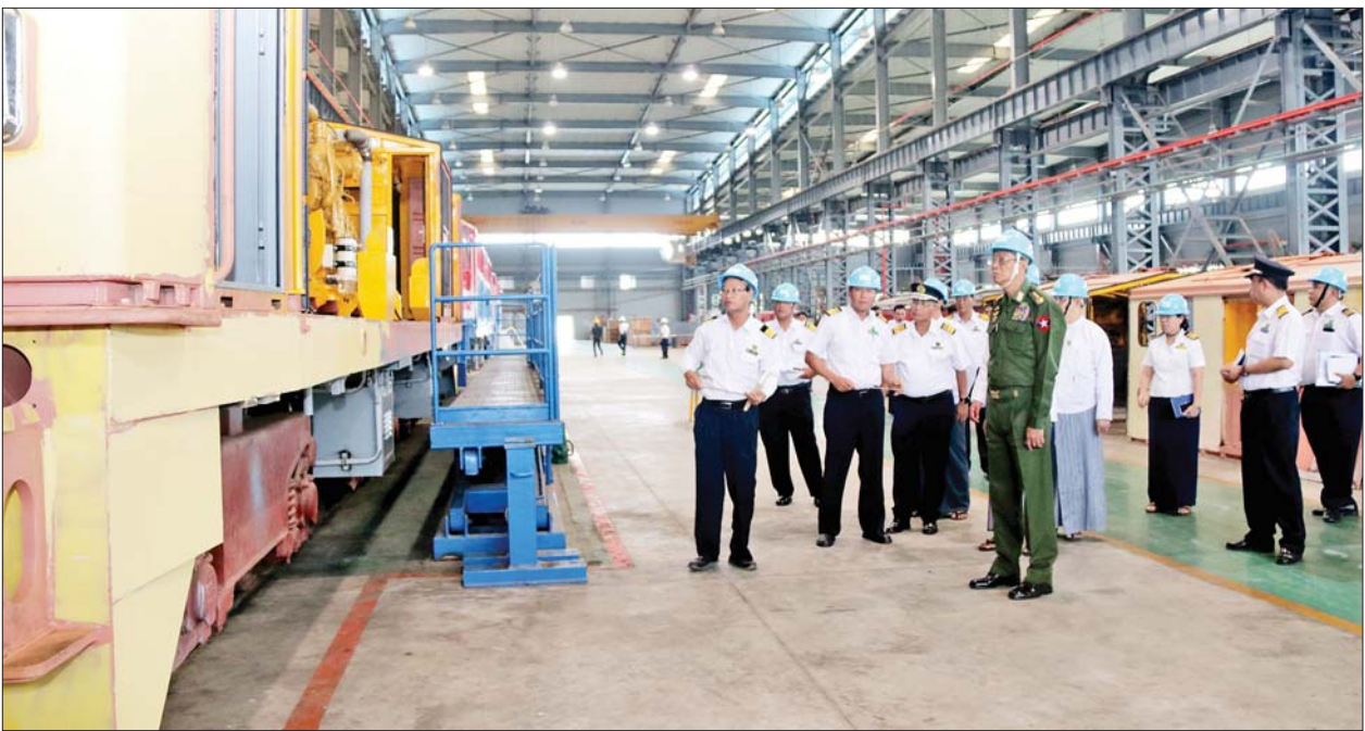
အနက်ထား ဆောင်ရွက်ရေးတို့ကိုမှာကြားပြီး လိုအပ်သည်များကို ဖြည့်ဆည်းဆောင်ရွက်ပေးသည်။ ထို့နောက် ပြည်ထောင်စုဝန်ကြီးနှင့်အဖွဲ့သည် နေပြည်တော် စက်ခေါင်းသစ်တပ်ဆင်ထုတ်လုပ်ရေးစက်ရုံအတွင်းရှိ စက်ခေါင်းသစ် အတွက်လိုအပ်သည့် ကိုယ်ထည်နှင့် ဘီးဘိုဂီအစိတ်အပိုင်းများ ထုတ်လုပ်

ဦးစွာ စက်ရုံအစည်းအဝေးခန်းမ၌ မြန်မာ့မီးရထားဦးဆောင် ညွှန်ကြားရေးမှူးနှင့် တာဝန်ရှိသူများက စက်ရုံ၏နေရာခံသမိုင်းနှင့် ဒီဇယ်လျှပ်စစ်စက်ခေါင်းသစ်များ တပ်ဆင်ထုတ်လုပ်နေမှု အခြေအနေ များကို ရှင်းလင်းတင်ပြကြရာ ပြည်ထောင်စုဝန်ကြီးက စက်ခေါင်းများ လက်ရှိသုံးစွဲနိုင်မှု၊ အနာဂတ်ရည်မှန်းချက်နှင့် စက်ခေါင်းထပ်မံလို အပ်မှုအခြေအနေတို့ကို ကြိုတင်မြေငြော့၍ စက်ခေါင်းအမျိုးအစား၊ အရေအတွက်တို့ကို လက်တွေ့ကျစွာ လျာထားတပ်ဆင်ထုတ်လုပ် နိုင်ရန် စီမံဆောင်ရွက်ရေး၊ စက်ရုံကြီး၌ တပ်ဆင်ထားသော စက်ကိရိယာ ပစ္စည်းများ၊ ကျွမ်းကျင်ဝန်ထမ်းများ၏ အတွေ့အကြုံများကို အသုံးပြု၍ နောင်တွင် စက်ခေါင်းသစ်တပ်ဆင်တည်ဆောက်မှုလုပ်ငန်းများကို ကိုယ့်အားကိုယ်ကိုး ဆောင်ရွက်နိုင်အောင် ကြိုးပမ်းရေး၊ ပစ္စည်းလိုအပ် ချက်အပေါ် ဆက်စပ်ဝန်ကြီးဌာနများ၊ အဖွဲ့အစည်းများနှင့်ဆက်သွယ်၍ ပြည်တွင်း၌ ထုတ်လုပ်၊ ဝယ်ယူရရှိနိုင်အောင် ဆောင်ရွက်ခြင်းဖြင့် နိုင်ငံတော်၏ နိုင်ငံခြားငွေသုံးစွဲမှုကို ချွေတာနိုင်စေရေး၊ ပစ္စည်းဝယ်ယူ ရေး တင်ဒါလုပ်ငန်းစဉ်များတွင် လုပ်ထုံးလုပ်နည်းနှင့်အညီ ဂရုပြု ဆောင်ရွက်ရေး၊ စက်ရုံ၏လုံခြုံရေး၊ ဝန်ထမ်းများ၏လုံခြုံရေးကို အလေး