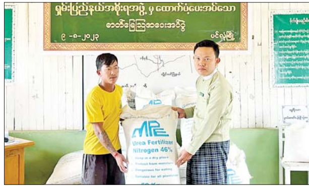
(ပိုက်ဆံလျှော်) ကွင်းသရုပ်ပြပွဲကို ဆက်လက်ဆောင်ရွက်ခဲ့ကြောင်း သိရသည်။ မြို့နယ်(ပြန်/ဆက်)

ပင်လုံ ဩဂုတ် ၉ ရှမ်းပြည်နယ်(တောင်ပိုင်း) ပင်လုံမြို့ စိုက်ပျိုးရေးနှင့်ဆည်မြောင်း ဝန်ကြီးဌာန စိုက်ပျိုးရေးဦးစီးဌာနရုံးခန်းမ၌ ရှမ်းပြည်နယ် အစိုးရအဖွဲ့ က ထောက်ပံ့သော ယူရီးယားဓာတ်မြေဩဇာဖြန့်ဖြူးပေးအပ်ပွဲကို ယနေ့ နံနက် ၉ နာရီက ကျင်းပသည်။