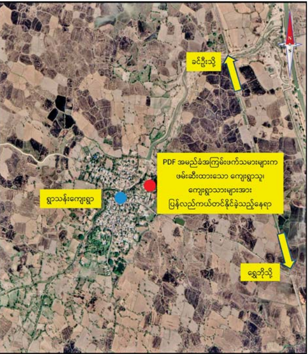
NUG၊ CRPH တို့၏ လက်ဝေခံ PDF အမည်ခံ အကြမ်းဖက်သမားများ၏ မတရားအနိုင်ကျင့်ဖမ်းဆီးချုပ်နှောင်ထားသူများအား လုံခြုံရေးတပ်ဖွဲ့ဝင်များက ကောင်းမွန်စွာ ပြန်လည်ကယ်တင်နိုင်ခဲ့သည့် နေရာပြပုံ။

အချိန်မှာ ကြော်ကိုယ်ကတော့ မိသားပြီဆိုတော့ ကျွန်တော်တို့ကတော့ ငါတို့ကတော့ သေလုပ်။ ဒီအချိန်မှာ သူတို့သတ်ရင် သေရမှာဆိုတဲ့အတွေးနဲ့ သူတို့ကို ကျွန်တော်တို့က ပြန်မပြောဘဲ ဒီအတိုင်းပဲနေခဲ့ရတယ်။ နေတဲ့အချိန်မှာ အဲဒီအချိန်ကျမှ ဒီတစ်ယောက်ချင်းကို ခင်ဗျားတို့ထွက်ပြေး တစ်ယောက်ချင်းထွက်ပြေး ခိုင်းတယ်။ မပြေးရဘူး ကျွန်တော်တို့လည်း။ ဒီလူတွေဟာ သေအတူ ရှင်အတူနေမယ်ဆိုပြီး ကျွန်တော်တို့လည်း နေခဲ့တယ်။ နေခဲ့တဲ့အချိန်မှာ ကျွန်တော်တို့ ကြားနားဝရိုထားတယ်။ မင်းတို့ခင်ဗျားတို့ ပိုက်ဆံပေး။ ခင်ဗျားတို့ ပြန်ချင်ရင် ပိုက်ဆံနဲ့ ရွေးခိုင်းရမယ်။ အဲဒီအချိန်မှာ ကျွန်တော်တို့က ပိုက်ဆံနဲ့လည်း ရွေးစရာမရှိတော့ဘူး။ နွားတွေ ဘာတွေကလည်း ပါနေတဲ့အချိန်မှာ ကျွန်တော်တို့က အဲဒီပိုက်ဆံရွေးခိုင်းတဲ့အချိန်ဘေးမှာလည်း ကြားထားတယ်။ တစ်ရွာတွေက မိလာတဲ့လူတွေကို PDF အကြမ်းဖက် တွေကနေပြီးမှ ပိုက်ဆံတောင်းတယ်။ ပိုက်ဆံမပေးရင်သတ်ပြစ်တယ်။ သတ်ပစ်တဲ့အပြင် ဘာတွေလုပ်လဲဆိုရင် ကျွန်တော်တို့က ကြားထားတာ မူးချောင်းထဲမှာ ရေမျှောတယ်။ ဇက်ဖြတ်တယ်။ ကျွန်တော်တို့ကိုယ်တွေ့ကို မြင်နေရတာ။ ကန်တော်အတွင်းထဲမှာ တွေ့တယ်။ တွေ့နေတဲ့အချိန်မှာ ကျွန်တော်တို့က မပြောရဲတဲ့အတွက် ကျွန်တော်တို့က ဒီအတိုင်းပဲနေ လိုက်တယ်။ အဲဒီအချိန်မှာ ကျွန်တော်တို့လို ဘေးရွာကလည်း ချုပ်နှောင်ထားတဲ့သူ အဲဒီအထဲမှာရှိပါတယ်။ ရှိတဲ့အချိန် ကျွန်တော်တို့ လူ ၂၁ ယောက်က အချိန်မှာ ၉ ရက် ၈ လ ၂၀၂၃ ခုနှစ်မှာ ၅ နာရီလောက်မှာ သေနတ်သံတွေကြားရော။ ကြားတဲ့အချိန်မှာ ကျွန်တော်တို့ကလည်း ဝပ်နေရတယ်။ ဝပ်နေ