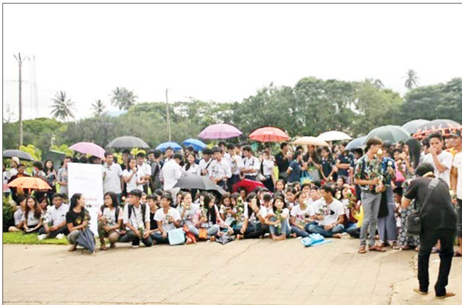
မော်လမြိုင်မြို့၌ အပြည်ပြည်ဆိုင်ရာလူငယ်များနေ့အခမ်းအနား ကျင်းပစဉ်။

အနာဂတ်ကမ္ဘာကို ပုံဖော်ရေးဆွဲကြမည့် လူ့စွမ်းအားအရင်းအမြစ်များ လူငယ်များသည် နောင်တစ်ချိန်တွင် နိုင်ငံ့ တာဝန်များကို ပခုံးပြောင်းတာဝန်ယူကြရမည် ဖြစ်ပြီး အနာဂတ်ကမ္ဘာကို ပုံဖော်ရေးဆွဲကြမည့် လူ့စွမ်းအားအရင်းအမြစ်များ ဖြစ်ကြပါသည်။ နိုင်ငံတော်အတွက် တန်ဖိုးမဖြတ်နိုင်သော ကြီးမား သည့် လူ့စွမ်းအားအရင်းအမြစ်များဖြစ်ပြီး နိုင်ငံ တော် ဖွံ့ဖြိုးတိုးတက်ရေးအတွက် ထူးခြားသည့် အင်အားစုတစ်ရပ်ဖြစ်၍ အနာဂတ်ခေါင်းဆောင် များလည်း ဖြစ်ကြပါသည်။ ထို့အတွက် လူငယ် မျိုးဆက်သစ်များသည် တစ်ခေတ်ထက်တစ်ခေတ် ပိုမိုထူးချွန်ထက်မြက်ပြီး လက်ရှိရင်ဆိုင်ကြုံတွေ့ နေရသည့် စိန်ခေါ်မှုများနှင့် အခက်အခဲများကို ကျော်လွှားနိုင်စွမ်းရှိရန် လွန်စွာအရေးကြီးလှပါ သည်။ လူငယ်များ၏အသံ၊ လူငယ်များ၏