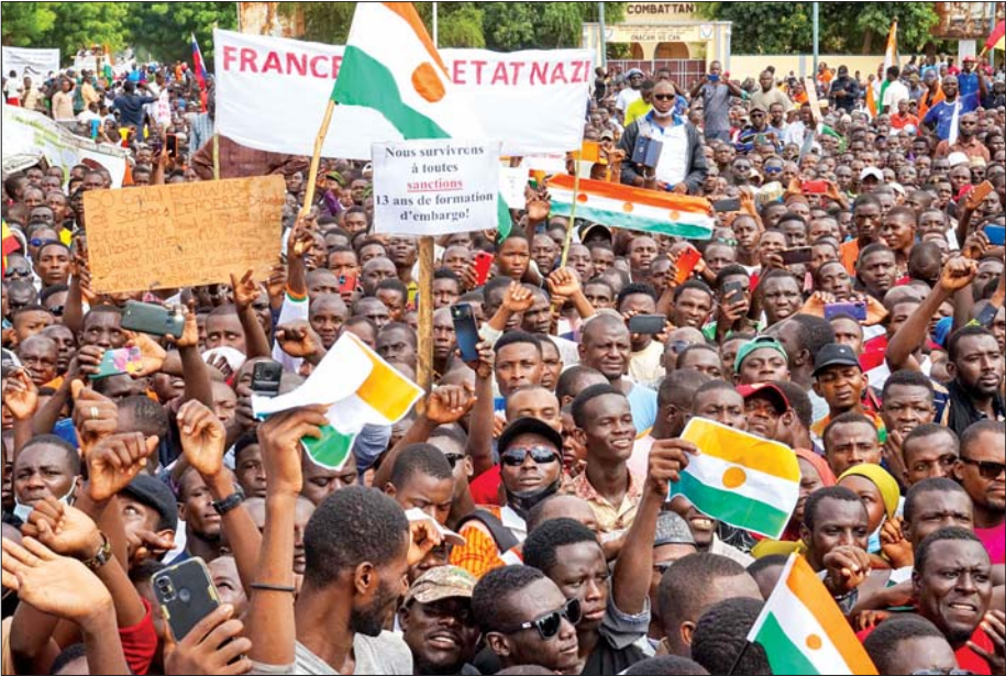
နိုင်ငံတကာ အရေးယူပိတ်ဆို့မှုများကို ဆန့်ကျင်ဆန္ဒပြနေသည့် နိုင်ငံပြုပြည်သူများကို တွေ့ရစဉ်။

တကယ်တော့ မိဟာမက်ဘဇွန်းဟာ ဒီမိုကရေစီနည်းကျ ရွေးကောက်ခံသမ္မတတစ်ဦးပါ။ ပြင်သစ်ကိုလိုနီဖြစ်ခဲ့ဖူးပြီး ပြင်သစ်ဩဇာခံအရပ် သားအစိုးရဆိုရင်လည်း မမှားဘူးပေါ့။ အမေရိကန်နဲ့ အနောက်အုပ်စုရဲ့ အခိုင်အမာထောက်ခံမှုနဲ့ သူတို့ ဆီက စစ်ရေးအထောက်အပံ့အပေါ်အဝင် အကူအညီ အမြောက်အမြားရထားတဲ့ နိုင်ငံတစ်နိုင်ငံလည်း ဖြစ်ပါတယ်။ နိုင်ငံအခြေအနေတော့ လက်ရှိမှာ တင်းမာနေဆဲပါပဲ။ အာဏာသိမ်းတပ်မတော်ကို အာဖရိကသမဂ္ဂ၊ နိုင်ဂျီးရီးယားသမ္မတ ဥက္ကဋ္ဌအဖြစ် ဆောင်ရွက်နေပြီး ၁၅ နိုင်ငံပါဝင်တဲ့ Economic Community of West African States (ECOWAS) လို့ခေါ်တဲ့ အာဖရိကအနောက်ပိုင်းနိုင်ငံများ စီးပွားရေးပူးပေါင်းဆောင်ရွက်ရေး အဖွဲ့ဝင်နိုင်ငံ အချို့နဲ့ ထုံးစံအတိုင်း ဥရောပသမဂ္ဂလိုအနောက် တိုင်းအဖွဲ့တွေကတော့ မထောက်ခံစီးပွားရေး ပိတ်ဆို့ကန့်ကွက်ကြတော့တာပါပဲ။ ဒါပေမဲ့ ECOWAS အဖွဲ့ဝင်အဖြစ် ဆိုင်းငံ့ထားရတဲ့အိမ်နီး ချင်း မာလီနဲ့ ဘူကီနာဖတ်ဆိုနိုင်ငံများကတော့ အာဏာသိမ်းနိုင်ငံပြုခေါင်းဆောင် အဗ္ဗုဒ္ဓရမိန်းချီရာနီ ဦးဆောင်တဲ့ အခြေကျကျယ်စောင့်ရှောက်ရေး အမျိုးသားကောင်စီကို တစ်သွေးထဲတစ်သွေးထဲ အခိုင်အမာထောက်ခံကြပါတယ်။