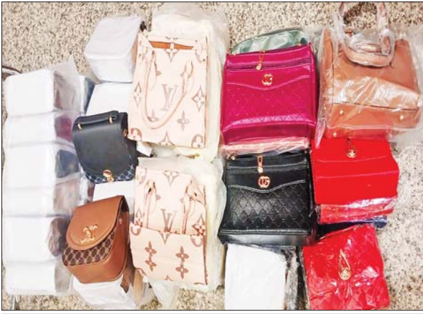
ရန်ကုန်အပြည်ပြည်ဆိုင်ရာလေဆိပ်၊ လေဆိပ်(သွင်းကုန်)၌ သိမ်းဆည်းရမိမှု မှတ်တမ်းဓာတ်ပုံ။

လျက်ရှိသည်။ ထို့ပြင် ဩဂုတ် ၅ ရက်တွင် ပဲခူးတိုင်းဒေသကြီး တရားမဝင်ကုန်သွယ်မှုတိုက်ဖျက်ရေးအဖွဲ့၏ စီမံခန့်ခွဲမှုဖြင့် ခရိုင်သစ်တောဦးစီးဌာန ဦးဆောင်သော ပူးပေါင်းအဖွဲ့က ပဲခူးခရိုင်အတွင်း စစ်ဆေးမှုများဆောင်ရွက်ခဲ့ရာ တရားမဝင်ကျွန်းသစ် ၇ ဒသမ ၀၅၃ တန်၊ သစ်မာသုည ၃ဒသမ ၅၆၂ တန်နှင့် အခြားသစ် ၃ ဒသမ ၅၇၅ တန် (ခန့်)၊ မှန်တန်ဖိုးငွေကျပ် ၂၀၀၃၆၉၀)ကို သိမ်းဆည်းရမိခဲ့ပြီး သစ်တောဥပဒေနှင့်အညီ အရေးယူဆောင်ရွက်လျက်ရှိသည်။ သို့ဖြစ်ပါ၍ ဩဂုတ် ၃ ရက်နှင့် ၅ ရက်တို့တွင် သိမ်းဆည်းရမိမှု စုစုပေါင်းမှာ အမှုတွဲ ခုနစ်မှု (ခန့်)၊ မှန်တန်ဖိုးငွေကျပ် ၄၆၄၀၄၉၅၆) ဖြစ်ကြောင်း တရားမဝင်ကုန်သွယ်မှုတိုက်ဖျက်ရေး ဦးဆောင်ကော်မတီမှ သိရသည်။ သတင်းစဉ်