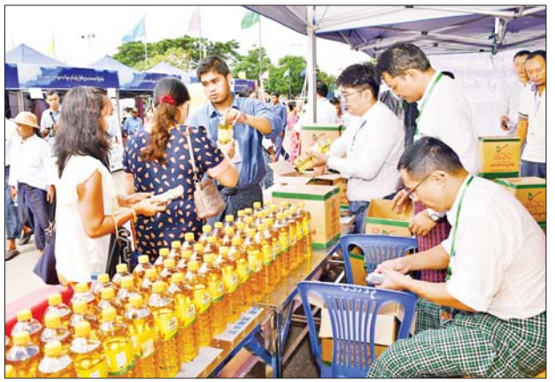
မြန်မာနိုင်ငံဆီကုန်သည်နှင့်ဆီလုပ်ငန်းရှင်များအသင်းမှ စားသုံးသူ ပြည်သူများအတွက် သက်သာသောဈေးနှုန်းဖြင့် စားသုံးဆီများကို ရောင်းချပေးနေစဉ်။

Entertainment Zone များကိုစီစဉ်ပေးထားပြီး မိုးရာသီဈေးရောင်းပွဲတော်စက်မှုထုတ်ကုန်ပြပွဲနှင့် လျှပ်စစ်ကား (EV) ပြပွဲတွင် UMFCCI နှင့် ညီနောင်အသင်းများဖြစ်သည့် မြန်မာနိုင်ငံဆန်စပါးအသင်းချုပ်၊ မြန်မာနိုင်ငံဆီကုန်သည်နှင့် ဆီလုပ်ငန်းရှင်များအသင်း၊ MSME လုပ်ငန်းရှင်များ၊ မြန်မာနိုင်ငံလက်လီရောင်းချသူများအသင်း၊ မြန်မာနိုင်ငံ စားသောက်ကုန်ထုတ်လုပ်တင်ပို့ရောင်းချသူများအသင်း၊ သမဝါယမအသင်းများ၏ ထုတ်ကုန်အရောင်းပြခန်းများ၊ ဆန်၊ ဆီနှင့် ဟင်းသီးဟင်းရွက်အရောင်းဆိုင်ခန်းကြီးများ၊ စိုက်ပျိုးရေးနှင့်မွေးမြူရေးထုတ်ကုန်အရောင်းပြခန်းများ၊ စားသောက်ဆိုင်ခန်းများအပါအဝင်ဆိုင်ခန်း