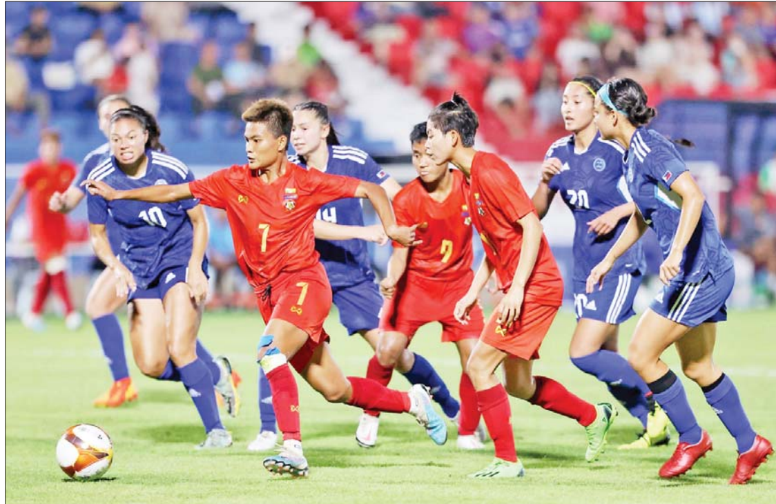
(၃၂)ကြိမ်မြောက် ဆီးဂိမ်းပြိုင်ပွဲ အမျိုးသမီးဘောလုံး အုပ်စုအဆင့်တွင် မြန်မာအသင်းနှင့် ဖိလစ်ပိုင်အသင်း တွေ့ဆုံခဲ့စဉ်။

ရန်ကုန် ဩဂုတ် ၅ တရုတ်နိုင်ငံ ဟန်ကျိုးမြို့၌ကျင်းပ မည့် (၁၉) ကြိမ်မြောက် အာရှအားကစား ပြိုင်ပွဲတွင် မြန်မာဘောလုံး အမျိုးသားနှင့် အမျိုးသမီးအသင်းများ ဝင်ရောက်ယှဉ်ပြိုင် မည်ဖြစ်ပြီး အုပ်စုပွဲများ ထွက်ပေါ်လာပြီ ဖြစ်သည်။ အမျိုးသား ဘောလုံးပြိုင်ပွဲကို စက်တင်ဘာ ၁၉ ရက်မှ အောက်တိုဘာ ၇ ရက်အထိ ကျင်းပမည်ဖြစ်ပြီး အသင်း စုစုပေါင်း ၂၃ သင်း ဝင်ရောက်ယှဉ်ပြိုင်မည် ဖြစ်ကာ အုပ်စုခြောက်ခုခွဲ၍ ကျင်းပမည် ဖြစ်သည်။ အုပ်စုတစ်ခုစီမှ ပထမနှင့် ဒုတိယနေရာရ ၁၂ သင်း၊ တတိယနေရာရ အသင်းများအနက် အကောင်းဆုံးလေး သင်း စုစုပေါင်း ၁၆ သင်းမှာ နောက်တစ်ဆင့် တက်ရောက်ခွင့်ရမည်ဖြစ်သည်။ အုပ်စု မဲခွဲမှုအရ အုပ်စု (A) တွင် အိမ်ရှင် တရုတ်၊ ဘင်္ဂလားဒေ့ရှ်၊ မြန်မာ၊ အိန္ဒိယ၊ အုပ်စု (B) တွင် ဗီယက်နမ်၊ ဆော်ဒီအာရေဗျ၊ အီရန်၊ စာမျက်နှာ ၁၈ ကော်လံ ၅ သို့ ၀