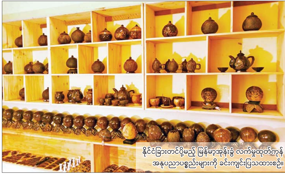
နိုင်ငံခြားတင်ပို့မည့် မြန်မာ့အုန်းခွံ လက်မှုထုတ်ကုန် အနုပညာပစ္စည်းများကို ခင်းကျင်းပြသထားစဉ်။

ရန်ကုန် ဩဂုတ် ၅ မြန်မာ့အုန်းခွံလက်မှုထုတ်ကုန် အနုပညာ ပစ္စည်းများကို အာရှနိုင်ငံများ၊ ဥရောပနိုင်ငံများနှင့် ဒူဘိုင်းမှ စိတ်ဝင်စားနေပြီး ဈေးကွက်ရရှိနေ ကြောင်း အုန်းလက်မှုထုတ်ကုန်လုပ်ငန်းရှင်ထံမှ သိရ သည်။ အာရှနိုင်ငံများ ဝယ်ယူအားပေး လက်ရှိအချိန်တွင် မြန်မာ့အုန်းခွံ လက်မှု အနုပညာပစ္စည်းများကို အာရှနိုင်ငံများဖြစ်သည့် စင်ကာပူ၊ မလေးရှား၊ ထိုင်း၊ ဂျပန် စသည့်နိုင်ငံများမှ ဝယ်ယူအားပေးလျက်ရှိပြီး ဥရောပနိုင်ငံများဖြစ်သည့် UK နှင့် US တို့မှလည်း မှာယူမှုများရှိနေသည်။ “မြန်မာ့အုန်းခွံ လက်မှုအနုပညာပစ္စည်းတွေကို စင်ကာပူ၊ ဂျပန်၊ မလေးရှား၊ ထိုင်း စတဲ့ အာရှနိုင်ငံတွေက မှာယူကြတယ်။ စာမျက်နှာ ၄ ကော်လံ ၅ သို့ ၀