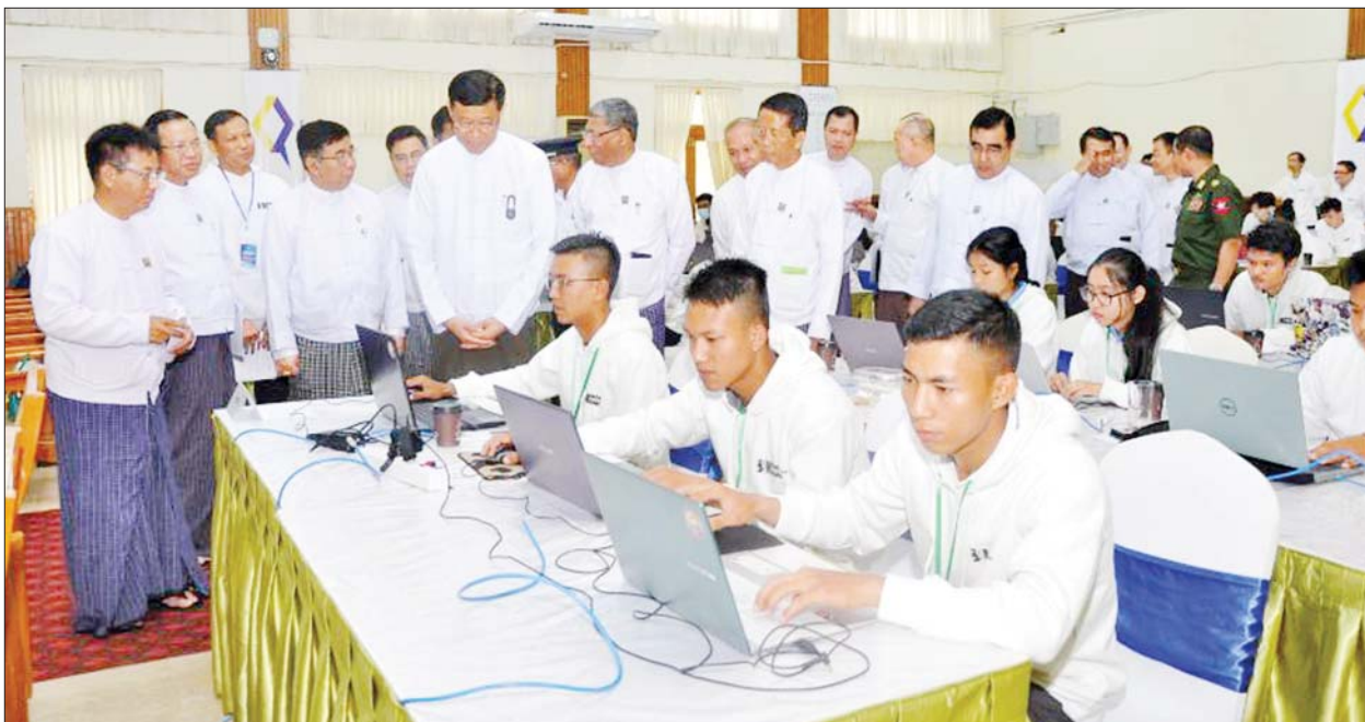
မြန်မာနိုင်ငံတွင် Myanmar Cyber Security Challenge ပြိုင်ပွဲကို ၂၀၂၅ ခုနှစ်မှစတင်၍ နှစ်စဉ်ကျင်းပခဲ့ပြီး ကိုဗစ်-၁၉ ရောဂါ အကန့်အသတ်ကြောင့် ၂၀၂၀ ပြည့်နှစ်နှင့် ၂၀၂၁ ခုနှစ်တို့တွင် ကျင်းပနိုင်ခြင်း မရှိခဲ့ဘဲ ၂၀၂၂ ခုနှစ်တွင် ပြန်လည်ကျင်းပခဲ့ကာ ယခု ၂၀၂၃ ခုနှစ်တွင် (၇)ကြိမ်မြောက် ကျင်းပနိုင်ခဲ့ခြင်းဖြစ်သည်။ အဆိုပါပြိုင်ပွဲမှ အနိုင်ရထားသူများကို အာဆီယံဒေသတွင်း နိုင်ငံများတွင် ကျင်းပသည့် ဆိုက်ဘာလုံခြုံရေးဆိုင်ရာ ပြိုင်ပွဲများသို့ စေလွှတ်ယှဉ်ပြိုင်လျက်ရှိကြောင်း သိရသည်။ သတင်းစဉ်

နေပြည်တော် ဩဂုတ် ၅ Myanmar Cyber Security Challenge 2023 (အလွတ်တန်းအဆင့်) ပြိုင်ပွဲကို ယနေ့နံနက် ၉ နာရီမှ ညနေ ၄ နာရီအထိ နေပြည်တော်ရှိ ပို့ဆောင်ရေးနှင့် ဆက်သွယ်ရေးဝန်ကြီးဌာန၌ ကျင်းပသည်။ အဆိုပါ ပြိုင်ပွဲတွင် နိုင်ငံတော်စီမံအုပ်ချုပ်ရေးကောင်စီအဖွဲ့ဝင် ဒုတိယဝန်ကြီးချုပ်နှင့် ပို့ဆောင်ရေးနှင့်ဆက်သွယ်ရေးဝန်ကြီးဌာန ပြည်ထောင်စုဝန်ကြီး ဗိုလ်ချုပ်ကြီးမြထွန်းဦးနှင့် ပြည်ထောင်စုဝန်ကြီးများ၊ ဒုတိယဝန်ကြီးများ၊ အမြဲတမ်းအတွင်းဝန်များ၊ ဌာနဆိုင်ရာအကြီးအကဲများ၊ ဖိတ်ကြားထားသူများနှင့် အသင်းအုပ်ချုပ်သူများ တက်ရောက်ကြသည်။ ဦးစွာ နိုင်ငံတော်စီမံအုပ်ချုပ်ရေးကောင်စီအဖွဲ့ဝင် ဒုတိယဝန်ကြီးချုပ်နှင့် ပို့ဆောင်ရေးနှင့်ဆက်သွယ်ရေးဝန်ကြီးဌာန ပြည်ထောင်စုဝန်ကြီး ဗိုလ်ချုပ်ကြီးမြထွန်းဦးက အဖွင့်အမှာစကားပြောကြားပြီး ပြိုင်ပွဲအခမ်းအနားကို ဖွင့်လှစ်ပေးသည်။ ပြိုင်ပွဲသို့ တပ်မတော်နည်းပညာတက္ကသိုလ်၊ တိုင်းဒေသကြီးနှင့် ပြည်နယ်အသီးသီးမှ နည်းပညာတက္ကသိုလ်များ၊ ကွန်ပျူတာတက္ကသိုလ်များနှင့် အစိုးရနည်းပညာကောလိပ်/သိပ္ပံများမှ အသင်း ၂၅ သင်း၊ ကျောင်းသား ကျောင်းသူစုစုပေါင်း ၇၅ ဦးတို့ ပါဝင်ယှဉ်ပြိုင်ခဲ့ကြပြီး (UI Team) အသင်းက ပထမ၊ (n00b_779082) အသင်းက ဒုတိယနှင့် (U_SH3LL) အသင်းက တတိယရရှိခဲ့ပြီး ပို့ဆောင်ရေးနှင့် ဆက်သွယ်ရေးဝန်ကြီးဌာနမှ တာဝန်ရှိသူများက ဆုရရှိသည့်အသင်းများကို ဆုများပေးအပ်ချီးမြှင့်ကြသည်။