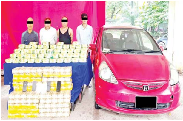
သိမ်းဆည်းရမိသည့် မူးယစ်ဆေးဝါးများနှင့်အတူ တွေ့ရစဉ်။