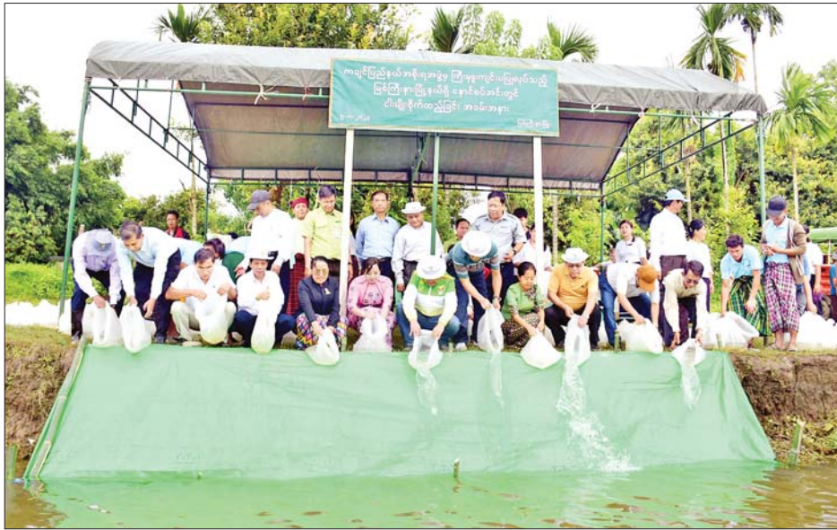
မြစ်ကြီးနားမြို့ လယ်ကုန်းရပ်ကွက်အတွင်းရှိ နောင်စပ်အင်းသို့ သွားရောက်ပြီး နောင်စပ်အင်းအတွင်း ငါးမြစ်ချင်းငါးသားပေါက်ကောင်ရေ တစ်သိန်းနှင့် ငါးခုံးမကြီးငါးသားပေါက်ကောင်ရေ ငါးသောင်းတို့ကို တောင်သူများနှင့်အတူ စုပေါင်းစိုက်ထည့်ပေးကြကာ နောင်စပ်အင်းအား မြစ်ကြီးနားမြို့တွင်း စိမ်းလန်းစိုပြည်၍ အများပြည်သူအပန်းဖြေအနားယူနိုင်သည့် ရေကန်တစ်ခုအဖြစ် အကောင်

ကချင်ပြည်နယ်အတွင်း ငါးစားသုံးမှုဖူလုံစေရေးနှင့် ငါးထုတ်လုပ်မှု တိုးတက်မြှင့်တင်ရေးအတွက် မြစ်ကြီးနားမြို့နယ်အတွင်း နောင်စပ်အင်းနှင့် တာလောကြီးအင်းအတွင်း ငါးမျိုးစိုက်ထည့် မွေးမြူရန် ငါးသားပေါက်နှင့် ငါးအစာအိတ်များ ပေးအပ်ခြင်း အခမ်းအနားကို ယနေ့နံနက် ၉ နာရီက ပြည်နယ်အစိုးရအဖွဲ့ရုံးဝင်းအတွင်းရှိ ဆမားဒူဝါ ဆင်ဝါးနော်ခန်းမ၌ ကျင်းပသည်။