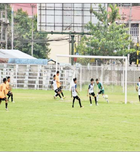
အသီးသီးရှိအားကစားကဏ္ဍအလိုက် အားပေးမြှင့်တင်လျက်ရှိရာ ယခုကဲ့သို့ အားကစားစိတ်ဓာတ် မြှင့်မားသည့် Patheon League 2023 ပြိုင်ပွဲ ကျင်းပနိုင်ခြင်းဟာလည်း တိုင်းဒေသကြီး၏ဘောလုံးအားကစား