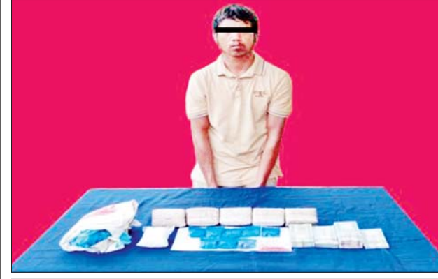
စိုင်းပန်တီအား သိမ်းဆည်းရမိသည့် မူးယစ်ဆေးဝါးများနှင့်အတူ တွေ့ရစဉ်။