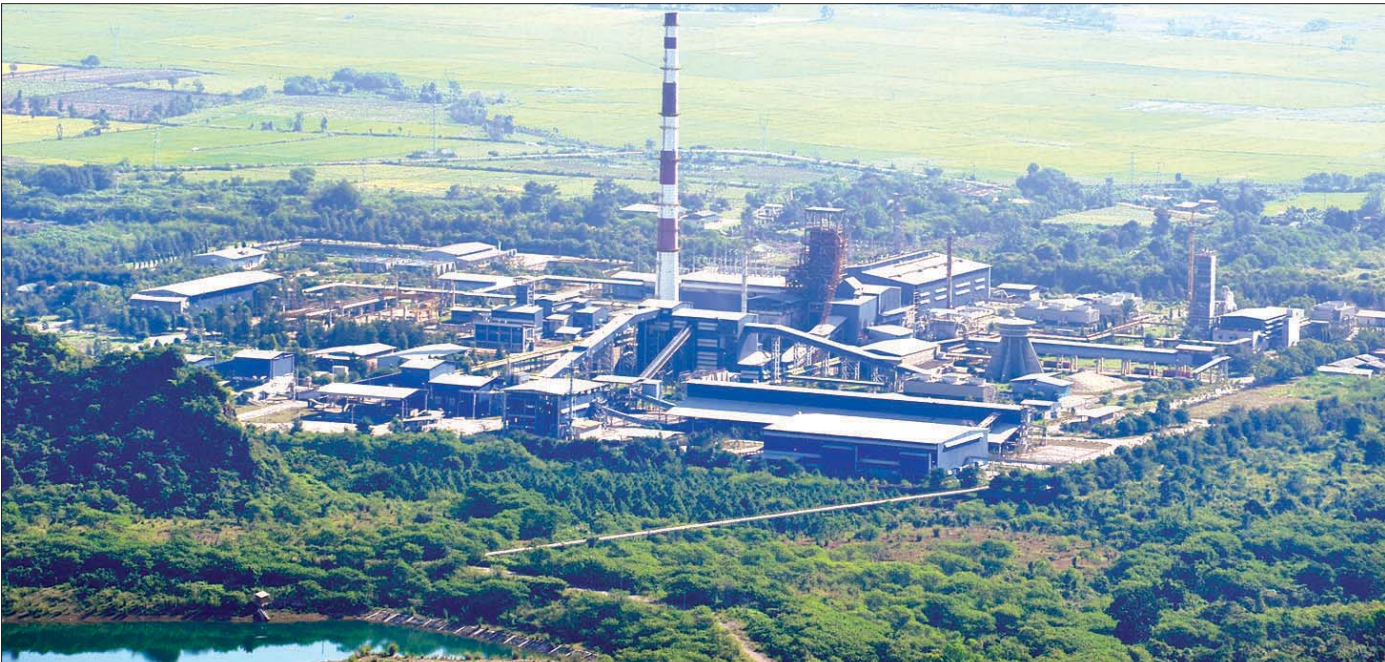
အမှတ်(၂)သံမဏိစက်ရုံ (ပင်းပက်)

နိုင်ငံတော်စီမံအုပ်ချုပ်ရေးကောင်စီ အစိုးရလက်ထက်တွင် နိုင်ငံတော်စီမံအုပ်ချုပ်ရေးကောင်စီ ဥက္ကဋ္ဌ နိုင်ငံတော်ဝန်ကြီးချုပ်က “နိုင်ငံတော်၏ စီးပွားရေးလုပ်ငန်းများ ဖွံ့ဖြိုးတိုးတက်ရန်အလို့ငှာ အစိုးရ၏ စီမံခန့်ခွဲမှုအောက်တွင်ရှိပြီး ရပ်နားထားရသည့် စက်ရုံ၊ အလုပ်ရုံများထဲမှ ပုဂ္ဂလိကပိုင် ပြုလုပ်နိုင်ခြင်းမရှိသော စက်ရုံ၊ အလုပ်ရုံများ ပြန်လည်လည်ပတ်နိုင်အောင် ပိုင်းဝန်းကူညီ ပံ့ပိုးပေးရန်နှင့်