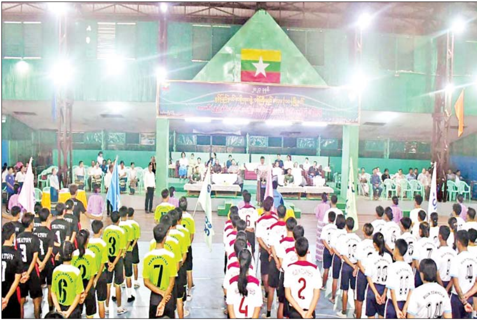
သို့သော်လည်းကောင်း၊ အမျိုးသား နှစ်ယောက် တွဲ ပိုက်ကျော်ခြင်းပြိုင်ပွဲဖြစ်သော မုဒုံမြို့နယ်အသင်းနှင့် မော်လမြိုင် မြို့နယ်အသင်းတို့ ယှဉ်ပြိုင်ကစား နေမှုကို ကြည့်ရှုအားပေးကြသည်။ ကြောင်း သိရသည်။ အထိ ယှဉ်ပြိုင်ကစားသွားမည်ဖြစ် အဆိုပါပြိုင်ပွဲကို ဩဂုတ် ၇ ရက် သတင်းစဉ်

နေပြည်တော် ဩဂုတ် ၃ ၂၀၂၃ ခုနှစ် မွန်ပြည်နယ်အစိုးရ အဖွဲ့ ဝန်ကြီးချုပ်ဖလားအတွက် ၁၀ မြို့နယ်မှ အသက် ၂၅ နှစ် အောက် အမျိုးသား အမျိုးသမီး ပိုက်ကျော်ခြင်းပြိုင်ပွဲဖွင့်ပွဲကို ယနေ့ နံနက်ပိုင်းတွင် မော်လမြိုင်မြို့ ပြည်နယ် အားကစားခန်းမ၌ ပြုလုပ်ရာ မွန်ပြည်နယ်ဝန်ကြီးချုပ် ဦးအောင်ကြည်သိန်း၊ အရှေ့တောင် တိုင်းစစ်ဌာနချုပ် တိုင်းမှူး ဗိုလ်မှူးချုပ်စိုးမင်းနှင့် တာဝန် ရှိသူများ၊ ဌာနဆိုင်ရာ တာဝန်ရှိသူ များ၊ အားကစားဝါသနာရှင်များနှင့် ပြိုင်ပွဲဝင် အားကစားသမားများ တက်ရောက်ကြသည်။ ဦးစွာ ပြည်နယ်ဝန်ကြီးချုပ်က အမှာစကား ပြောကြားသည်။ ထို့နောက် ပြည်နယ်ဝန်ကြီးချုပ်၊ တိုင်းမှူးနှင့် တက်ရောက်လာကြ