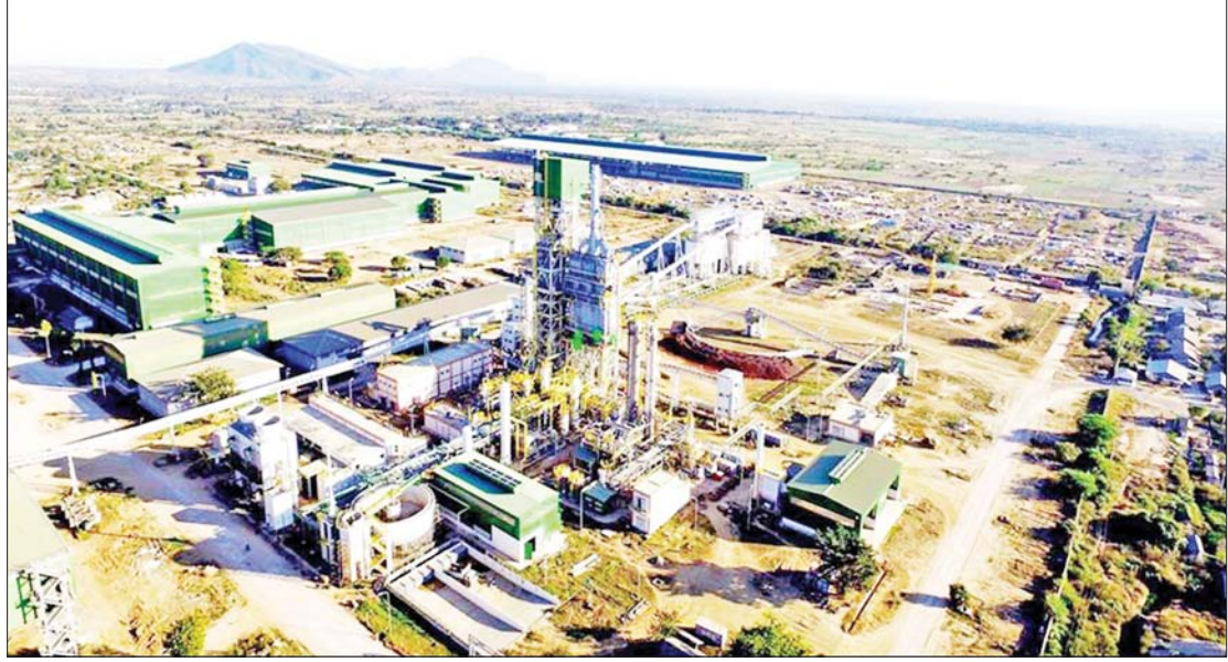
အမှတ်(၁) သံမဏိစက်ရုံ(မြင်းခြံ)

အမှတ်(၁)သံမဏိစက်ရုံ(မြင်းခြံ) စီမံကိန်းအနေ ဖြင့် Steel Billets နှင့် Steel Slabs ကို တစ်နှစ်လျှင် တန်ချိန်နှစ်သိန်း ထုတ်လုပ်ပေးမည့် သံရည်ကျို အလုပ်ရုံ (Melt Shop-1)နှင့် ဆက်စပ်အလုပ်ရုံများ တည်ဆောက်ရန် ပထမအဆင့်စီမံကိန်းကို ၂၀-၁၁-၂၀၀၄ ရက်နေ့တွင် လက်မှတ်ရေးထိုး၍ စတင် တည်ဆောက်ခဲ့သည်။ စီမံကိန်းပထမအဆင့်ကို ဆောင်ရွက်ပြီးနောက် Steel Billets နှင့် Slabs များ တစ်ပြိုင်နက်ထုတ်လုပ်မည့် စာမျက်နှာ ၁၁ သို့