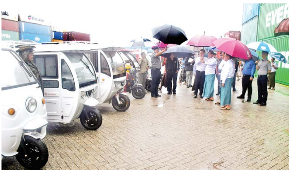
များကို ဆောင်ရွက်နေကြောင်း သိရသည်။ Asia Pacific Aotomaker Co Ltd. က တင်သွင်းလာခြင်းဖြစ်ကြောင်းနှင့် ယခုရက် သတ္တပတ်အကုန်၌ ဒဂုံမြို့နယ် ပြည်သူ့ရင်ပြင်တွင် မိုးရာသီ ဈေးရောင်းပွဲတော် စက်မှု ထုတ်ကုန်ပြပွဲနှင့် EV ကားပြပွဲ တွင်လည်း ပြသသွားမည် ဖြစ်ကြောင်း သိရသည်။ တိုင်းဒေသကြီး(ပြန်/ဆက်)

ရန်ကုန် ဩဂုတ် ၃ လျှပ်စစ်သုံးယာဉ်များတင်သွင်းမှုကို ဦးဆောင်ကော်မတီ၏ ခွင့်ပြုချက်ဖြင့် တင်သွင်းလျက် ရှိရာ ယမန်နေ့ညနေပိုင်းက အလုံမြို့နယ် Asia World ဆိပ်ကမ်း၌ ရောက်ရှိနေသည့် ဘက်ထရီအသုံးပြုယာဉ်များအား ရန်ကုန် တိုင်းဒေသကြီးဝန်ကြီးချုပ် ဦးစိုးသိန်းနှင့်တိုင်းဒေသကြီးဝန်ကြီးများက သွားရောက် ကြည့်ရှုစစ်ဆေးကြသည်။ ဘက်ထရီအသုံးပြုယာဉ် ၅၀ ယခု ရောက်ရှိလာသည့် ဘက်ထရီအသုံးပြုယာဉ်အစီး ၅၀ သည် ရန်ကုန်မြို့ရှိ Asia World ဆိပ်ကမ်းသို့ ဇူလိုင် ၂၃ ရက်တွင် ရောက်ရှိပြီး ဆိပ်ကမ်းတွင် Import Declaration ဖွင့်လှစ်၍ အကောက်ခွန်ဆိုင်ရာ လုပ်ငန်းများကို ဆောင်ရွက်နေကြောင်း သိရသည်။ အဆိုပါဘက်ထရီအသုံးပြုယာဉ်အစီး ၅၀ တွင် Wheel Motorcycle အစီး ၅၀ တွင် အမျိုးအစားကိုးမျိုး ပါဝင်ပြီး