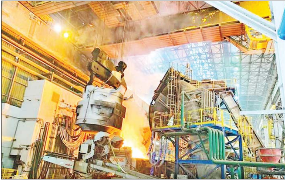
အမှတ်(၁) သံမဏိစက်ရုံ(မြင်းခြံ)၏ သံရည်ကျိုအလုပ်ရုံ(၁)ကို တွေ့မြင်ရစဉ်။

သံမဏိသည် လူသားတို့ဘဝရှင်သန်တိုးတက် ရေးအတွက် အခြေခံအကျဆုံးပစ္စည်းအဖြစ် ရပ်တည်လျက်ရှိသည်။ သံမဏိသည် ၁၀၀ ရာခိုင် နှုန်း ပြန်လည်အသုံးပြုနိုင်သည့် တည်ဆောက်ရေး လုပ်ငန်းသုံးပစ္စည်းဖြစ်ခြင်း၊ အခြားမည်သည့်သတ္တု နှင့်မျှ မတူညီသည့် ထူးခြားဆန်းပြားသော အရည် အသွေးနှင့်ပြည့်စုံခြင်းတို့ကြောင့် ဖွံ့ဖြိုးဆဲနိုင်ငံများ ၏ ဆောက်လုပ်ရေးလုပ်ငန်းနယ်ပယ်တွင် လိုအပ် ချက်မြင့်မားလျက်ရှိရာ မြန်မာနိုင်ငံအနေဖြင့် နှစ်စဉ်