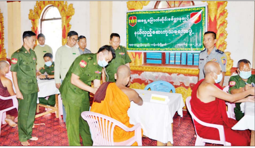
နယ်လှည့်ဆေးကုသရေးအဖွဲ့များက တန့်ယန်းမြို့နယ်၌ ရဟန်းသံဃာ၊ ရှင်သာမဏေများအား ကျန်းမာရေးစောင့်ရှောက်မှုဆောင်ရွက်ပေးစဉ်။

နေပြည်တော် ဩဂုတ် ၃ ကချင်ပြည်နယ် မြစ်ကြီးနားမြို့ရှိ အံတော်ရှင် တောင်တန်းသာသနာပြုကျောင်းတိုက်၌ ယနေ့နံနက်ပိုင်းတွင် မြောက်ပိုင်းတိုင်းစစ်ဌာနချုပ် နယ်မြေခံ ဆေးကုသရေးအဖွဲ့က မြစ်ကြီးနားမြို့ပေါ်ရှိ သံဃာတော် ၅၅ ပါးတို့ကို ကျန်းမာရေးစောင့်ရှောက်မှုလုပ်ငန်းများ ဆောင်ရွက်ပေးသည်။ ထိုသို့ဆောင်ရွက်ပေးရာတွင် ဆေးကုသရေးအဖွဲ့က ခွဲစိတ်ကုသမှုဆိုင်ရာရောဂါ၊ အရိုးအကြောရောဂါ၊ အထွေထွေရောဂါတို့နှင့် ပတ်သက်၍ လိုအပ်သည့် ကျန်းမာရေးစောင့်ရှောက်မှုလုပ်ငန်းများ ဆောင်ရွက်ပေးခြင်း၊ ECG စက်ဖြင့် နှလုံးစမ်းသပ်ပေးခြင်း၊