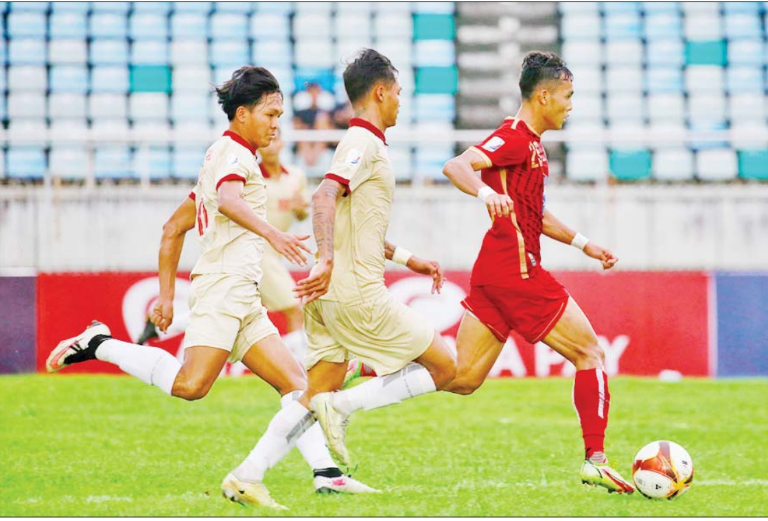
ရှမ်းယူနိုက်တက်အသင်းနှင့် ဧရာဝတီအသင်းတို့ ယှဉ်ပြိုင်ကစားကြစဉ်။

ရန်ကုန် ဩဂုတ် ၃ ၂၀၂၃ ရာသီ MNL အမှတ်ပေးပြိုင်ပွဲ ပွဲစဉ် (၁၅) ပထမနေ့ကို ဩဂုတ် ၃ ရက်က ဆက်လက်ကျင်းပရာ လက်ရှိချန်ပီယံ ရှမ်းယူနိုက်တက်အသင်း ဂိုးပြတ်အနိုင် ရခဲ့သည်။