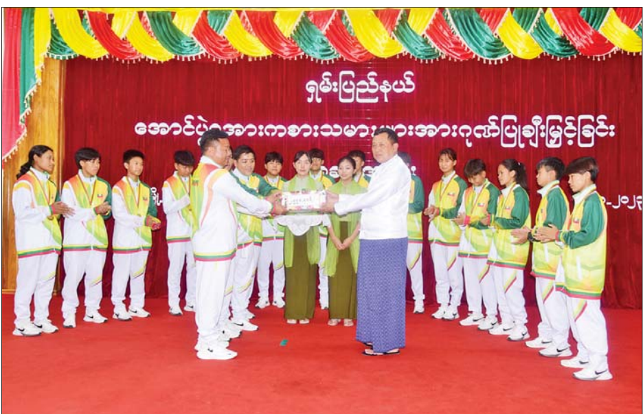
ဗိုလ်ချုပ်အောင်မြင်မှုရရှိခဲ့သော အားကစားသမားများအား ဂုဏ်ပြုချီးမြှင့်ခြင်း ပြုလုပ်ပေးနေသည့် ဦးအောင်ဇော်အေး (ပြန်/ဆက်)

ဒုတိယဆုရရှိခဲ့သော အမျိုးသားဖူဆယ်အသင်းအား ဂုဏ်ပြုဆုငွေများကို ပြည်နယ်တရားလွှတ်တော် တရားသူကြီးချုပ်ဦးသန်းဦးလွင်၊ ဒုတိယဆုရရှိခဲ့သော U-18 အမျိုးသား ဘောလုံးအသင်းအား ဂုဏ်ပြုဆုငွေများကို ပြည်နယ်လုံခြုံရေးနှင့်နယ်စပ်ရေးရာဝန်ကြီး၊ ပြေးခုန်ပစ်ပြိုင်ပွဲတွင် ရွှေတံဆိပ်ဆုရရှိခဲ့သော အားကစားသမားများအား ဂုဏ်ပြုဆုငွေကို ပြည်နယ်စီးပွားရေးရာဝန်ကြီး၊ ပြေးခုန်ပစ်ပြိုင်ပွဲတွင် ဒုတိယဆုရရှိခဲ့သော အားကစားသမားများအား ဂုဏ်ပြုဆုငွေကို ပြည်နယ်သယံဇာတရေးရာဝန်ကြီး၊ ပြေးခုန်ပစ်ပြိုင်ပွဲတွင် တတိယဆုရရှိခဲ့သော အားကစားသမားများအား ဂုဏ်ပြုဆုငွေကို ပြည်နယ်လူမှုရေးရာဝန်ကြီး၊ ဗိုလ်ချုပ်ပြိုင်ပွဲတွင် ပထမ၊ ဒုတိယ၊ တတိယဆုရရှိခဲ့သော အားကစားသမားများအား ဂုဏ်ပြုဆုငွေများကို ပြည်နယ် လမ်းပန်းဆက်သွယ်ရေးဝန်ကြီး၊ ပြည်နယ်တိုင်းရင်းသားရေးရာဝန်ကြီး၊ ပြည်နယ် ဥပဒေချုပ်တို့က ချီးမြှင့်ပေးပြီး ရှမ်းပြည်နယ်