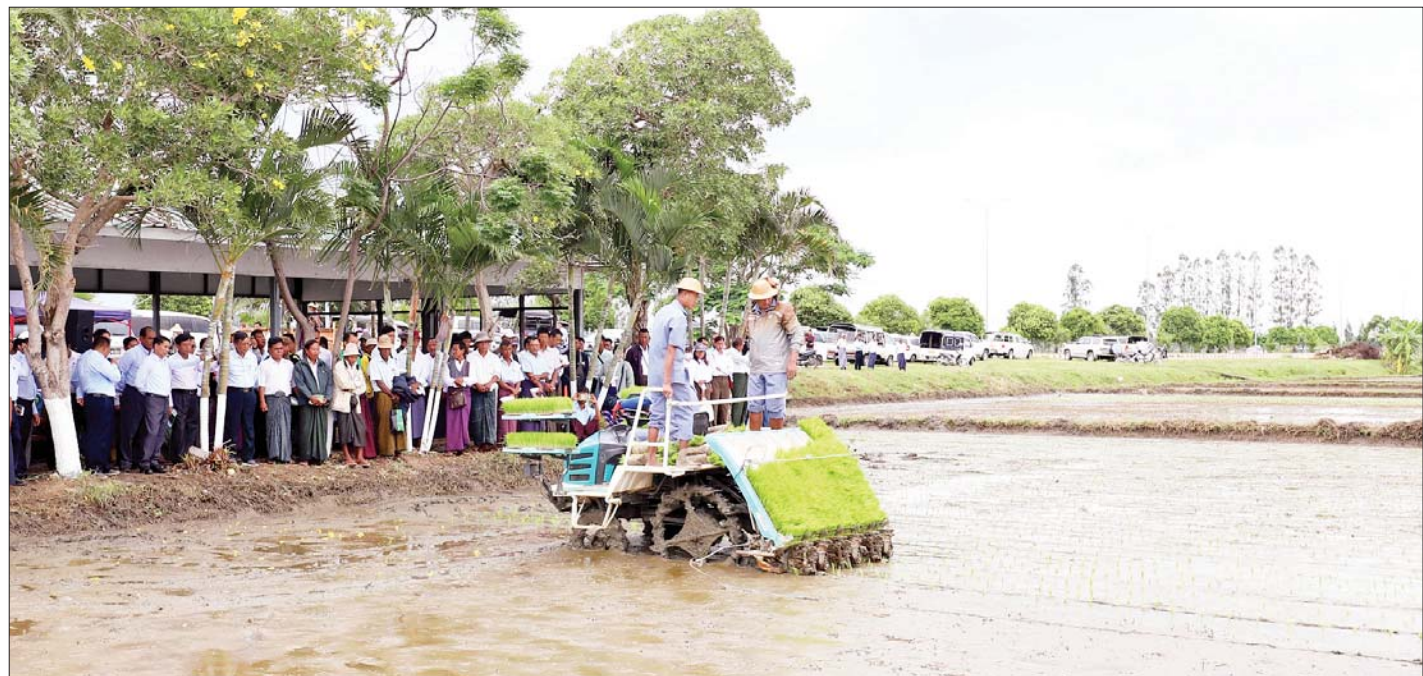
နေပြည်တော် ဩဂုတ် ၂ ကောက်စိုက်စက်၊ ကောက်စိုက်စက်နှင့်တွဲဖက်သုံး မျိုးစေ့ချက်ရိယာဖြင့် မိုးစပါးစိုက်ပျိုးခြင်း အခမ်းအနားကို ယနေ့နံနက်ပိုင်းတွင် နေပြည်တော် မြေဩဇာမြို့နယ် တဲကြီးကုန်းကျေးရွာ ကွင်းအမှတ်(၁၆၅၉)၌ ကျင်းပသည်။ စာမျက်နှာ ၁၁ ကော်လံ ၁ သို့ *