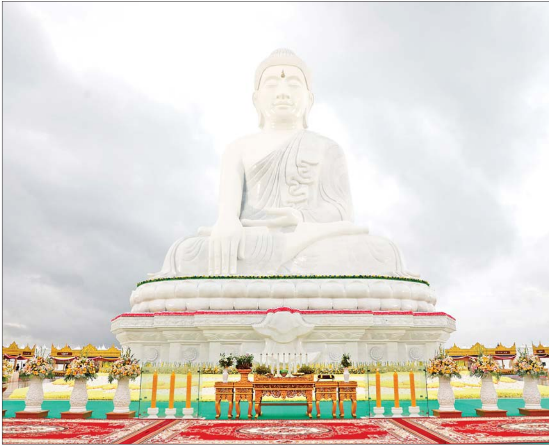
တိုက်များ၊ သုဓမ္မာဇရပ်များ၊ ရေပန်း ဘုရားဖူးလာ မိဘပြည်သူများအနေ သုံးပုံတော်လာအဋ္ဌကထာဋီကာကျမ်းစာ ရင်ပြင်၊ မာရဝိဇယကျောင်းတော်၊ ဖြင့် ဗုဒ္ဓရုပ်ပွားတော်မြတ်ကြီးအား များကို တစ်ပါတည်း လေ့လာနာယူ အဂ္ဂိမိပတိ သသာနာဗိမာန်တော်ကြီးနှင့် လာရောက်ဖူးမြော်ချိန်တွင် ပိဋကတ် ကြည့်ညှိနိုင်ရေး စတင်ကျောက်ချပ်များ

နေပြည်တော် ဩဂုတ် ၂ ပြည်ထောင်စုနယ်မြေ နေပြည်တော် ဒက္ခိဏသီရိမြို့နယ်ရှိ ဗုဒ္ဓဥယျာဉ် ဝတ္ထုကံတော်တွင် တည်ထားပူဇော် အောင်မြင်ခဲ့သည့် ကမ္ဘာပေါ်ရှိ ထိုင်းတော် မူ ကျောက်ဆစ်ဗုဒ္ဓရုပ်ပွားတော်များ အနက် ဉာဏ်တော်အမြင့်ဆုံးဖြစ်သည့် မာရဝိဇယ ဗုဒ္ဓရုပ်ပွားတော်မြတ်ကြီး ဗုဒ္ဓဘိသေက အနေကဇာတင်၍ ဗုဒ္ဓဘိသိက် သွန်းလောင်းပူဇော်ခြင်း၊ ကျောက်စာရုံ စေတီတော်များအား ရွှေထီးတော် တင်လှူပူဇော်ခြင်းနှင့် ရေစက်ချအောင်ပွဲမင်္ဂလာ ကုသိုလ်တော် မဟာမင်္ဂလာ အခမ်းအနားများကို ဩဂုတ် ၁ ရက် ဒုတိယဝါဆိုလပြည့်နေ့ တွင် အောင်မြင်စွာ ကျင်းပပြုလုပ်ခဲ့ပြီး ဖြစ်သည်။ ထည့်သွင်းတည်ဆောက်ထား မာရဝိဇယဗုဒ္ဓရုပ်ပွားတော်မြတ်ကြီး နှင့် ဗုဒ္ဓဥယျာဉ်တော်အတွင်း ဘုရား၊ ကျောင်း၊ ကန်၊ သိမ်၊ ဇရပ်၊ တံတား၊ ဥယျာဉ်များ ပြည့်စုံစွာဖြင့် ထည့်သွင်း တည်ဆောက်ထားရှိပြီး၊ ဘုရားဖူးလာ ပြည်သူများ အနားယူနိုင်ရန်နှင့် ရုပ်ပွား တော်မြတ်ကြီးအား စိတ်အေးချမ်းသာ စွာဖြင့် ဖူးမြော်ကြည့်ညှိနိုင်ရန် ဂန္ဓကုဋ်