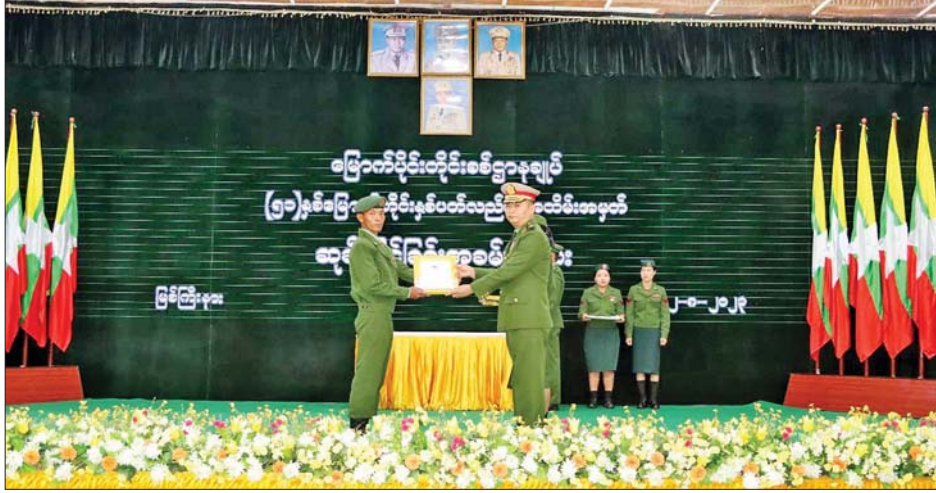
ထောင်သည်လိုင်း စိုက်ပျိုး/ သင်တန်းများတွင် ထူးချွန်ဆု ပေးအပ်ချီးမြှင့်ခဲ့ကြကြောင်း သိရ မွေးမြူရေးနှင့် သန့်ရှင်းရေး ရရှိသူများအား တိုင်းမှူးနှင့် သည်။ သတင်းစဉ် အကောင်းဆုံး ဆုရရှိသူများ၊ တာဝန်ရှိသူများက ဆုများ