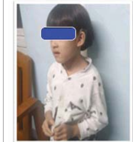
၂၀၂၂ ခုနှစ်အတွင်း အတွင်းနားအကြားအာရုံနိုးဆွစက် တပ်ဆင်ကုသမှုပေးခဲ့သော ကလေးငယ်များ။ (ကလေးများကို အကြားအာရုံပြန်လည်စမ်းသပ် စစ်ဆေးရာ အကြားအာရုံတိုးတက်ကောင်းမွန်လာပြီး စကားပြောဆိုနိုင်စွမ်းရှိလာသည်ကို တွေ့ရှိရပါသည်။)