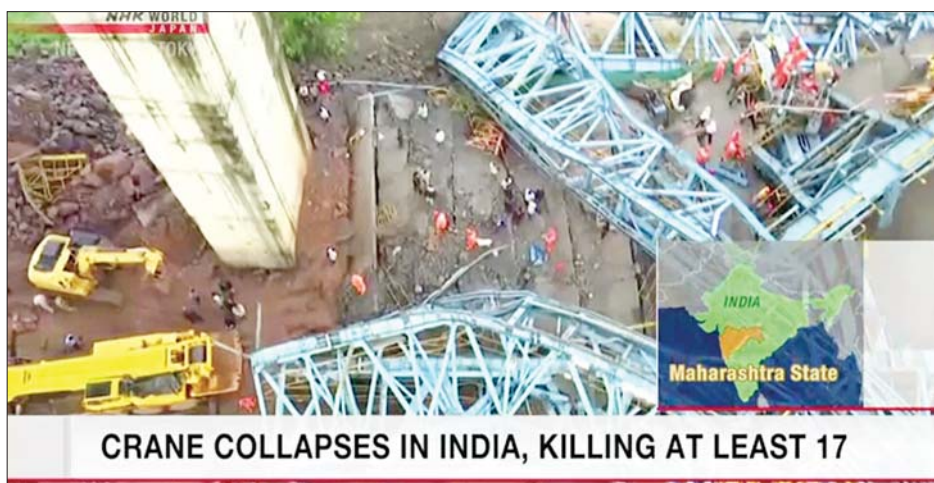
CRANE COLLAPSES IN INDIA, KILLING AT LEAST 17

ကယ်ဆယ်ရေး ဝန်ထမ်းများက ထိခိုက်ဒဏ်ရာ ရရှိသူများကို ဆေးကုသမှုခံယူရန် နီးစပ်ရာ ဆေးရုံများသို့ ပို့ဆောင်ပေးခဲ့ရ သည်။ လက်ရှိအချိန်အထိ ပျောက်ဆုံးလျက်ရှိသူ အများ အပြားရှိနေသေးကြောင်း ဒေသခံ