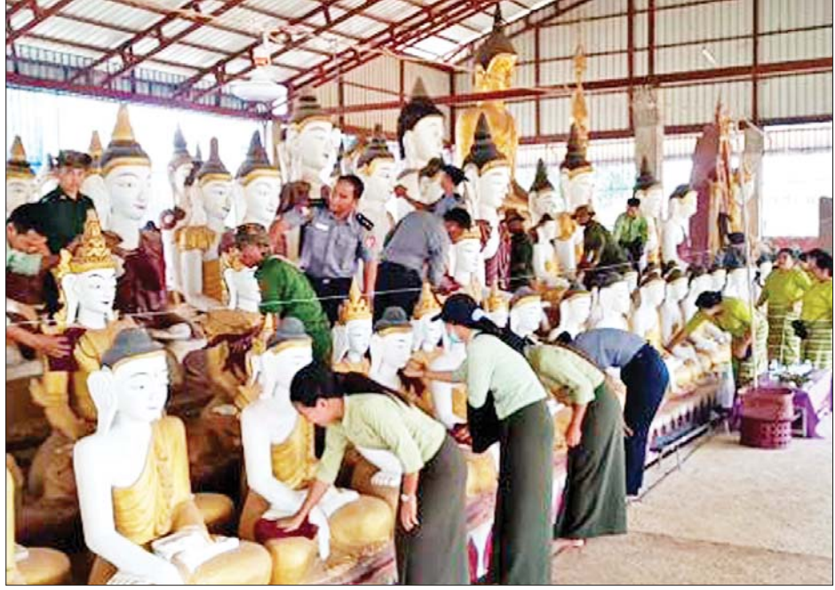
ရှမ်းပြည်နယ်(မြောက်ပိုင်း) တန့်ယန်းမြို့ရှိ နယ်မြေခံတပ်မတော်သားများက ဌာနဆိုင်ရာ ဝန်ထမ်းများနှင့်အတူ အောင်မင်္ဂလာကျောင်းတိုက်၌ ထုံးသင်္ကန်းနှင့် သန့်ရှင်းရေးများ ဆောင်ရွက်စဉ်။

ရှမ်းပြည်နယ်(မြောက်ပိုင်း)ရှိ မြို့နယ်လေးမြို့နယ် ၌လည်းကောင်း၊ ရှမ်းပြည်နယ် (တောင်ပိုင်း)ရှိ မြို့နယ် သုံးမြို့နယ်၌ လည်းကောင်း၊ ရှမ်းပြည်နယ်(အရှေ့ပိုင်း)ရှိ မြို့နယ် ခုနစ် မြို့နယ်၌လည်းကောင်း၊ ဘုရားစေတီပုထိုး ဝန်းကျင်နှင့် ဘုန်းတော်ကြီးကျောင်းဝင်းအတွင်း/ အပြင်တို့၌ ချုံနွယ်ပေါင်းမြက်များ ခုတ်ထွင် ရှင်းလင်းခြင်း၊ အမှိုက်များရှင်းလင်းခြင်း၊ ရေစီးရေ လာကောင်းမွန်စေရေး ရေနုတ်မြောင်းများတူးဖော် ပေးခြင်းနှင့် ဘုရားရင်ပြင်တော်များကို သန့်ရှင်း ရေးလုပ်ငန်းများ ဆောင်ရွက်ပေးသည်။ ယင်းသို့ ဆောင်ရွက်ပေးနေမှုများကို သက်ဆိုင်ရာတိုင်းစစ် ဌာနချုပ်များမှ တာဝန်ရှိသူများက သွားရောက် ကြည့်ရှုအားပေးပြီး လိုအပ်သည်များ ညှိနှိုင်း ဆောင်ရွက်ပေးသည်။ သတင်းစဉ်