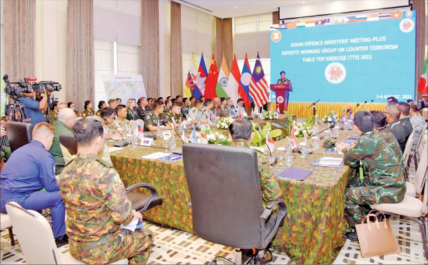
ညှိနှိုင်းကွပ်ကဲရေးမှူး(ကြည်း၊ ရေ၊ လေ) ဗိုလ်ချုပ်ကြီး မောင်မောင်အေး အာဆီယံအပေါင်း အကြမ်းဖက်မှု တန်ပြန်တိုက်ဖျက်ရေးဆိုင်ရာ ကျွမ်းကျင်လုပ်ငန်းအဖွဲ့၏ စားပွဲတင်လေ့ကျင့်ခန်း(Table Top Exercise) ဖွင့်ပွဲအခမ်းအနားတွင် အဖွင့်မိန့်ခွန်းပြောကြားစဉ်။