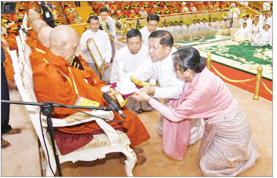
ဦးဆောင်ဘုရားဒါယကာ နိုင်ငံတော်စီမံအုပ်ချုပ်ရေးကောင်စီဥက္ကဋ္ဌ နိုင်ငံတော်ဝန်ကြီးချုပ် ဗိုလ်ချုပ်မှူးကြီး မင်းအောင်လှိုင် နှင့်ဇနီး ဒေါ်ကြူကြူလှတို့က သန်လျင်မြို့ မင်းကျောင်းပထမပြန်စာသင်တိုက် ပဓာနနာယက၊ အဂ္ဂမဟာပဏ္ဍိတ အဂ္ဂမဟာ သဒ္ဓမ္မဇောတိကဓဇ ဒေါက်တာ ဘဒ္ဒန္တစန္ဒိမာဘိဝံသထံ ဉာဏ်တော်ကိုးလက်မရှိ မာရဝိဇယဗုဒ္ဓရုပ်ပွားတော်မြတ်အား ဆက်ကပ် လှူဒါန်းစဉ်။

၈ အထိ မြေလျင်ဒဏ်ခံနိုင်ရေးနှင့် လျှပ်စီးမိုးကြိုးများကြောင့် ဆင်းတုတော်ကြီး ထိခိုက်မှုမရှိစေရေးတို့အတွက် အင်ဂျင်နီယာရှုထောင့်မှ စနစ်တကျ တွက်ချက် တည်ဆောက်ခဲ့ပါကြောင်း၊ ဆင်းတုတော်ကြီး၏ ကျောက်တုံးတော်ကြီးများကို တွဲဆက်ခြင်းများ ဆောင်ရွက် ရာတွင်လည်း သမားရိုးကျနည်းလမ်း များနှင့် ခေတ်မီနည်းလမ်းများ ပေါင်းစပ် တည်ဆောက်ခဲ့ရာ ဉာဏ်တော် ၆၃ ပေ၊ ပလ္လင်တော် ၁၈ ပေ၊ စုစုပေါင်း ၈၁ ပေ အမြင့်ဆောင်သည့် မာရဝိဇယဗုဒ္ဓရုပ်ပွား တော်မြတ်ကြီးကို ရတနာပုံခေတ်ဟန် အတိုင်း ခေတ်မီနည်းစနစ်ဖြင့် ပေါင်းစပ် ကာ ကြည်ညိုဖွယ် သပွယ်လှသည့် ကမ္ဘာ့အကြီးဆုံး ရုပ်ပွားတော်မြတ်ကြီး အဖြစ် အောင်မြင်စွာ တည်ထားပူဇော် နိုင်ခဲ့ပြီဖြစ်သည်ကို ဝမ်းမြောက်ဂုဏ်ယူ ဖွယ်ရာ လျှောက်ထားအပ်ပါကြောင်း၊ ကျောက်တုံးတော်ကြီး စတင်တူးဖော်ချိန် မှ ယနေ့အထိ ရုပ်ပွားတော်မြတ်ကြီး တည်ဆောက်ရာမှာ ပါဝင်သူ တစ်ဦး တစ်ယောက်မျှ ကြီးမားသည့် ထိခိုက် ဒဏ်ရာရမှုများ မရှိခဲ့ပါကြောင်း။ ရုပ်ပွားတော်မြတ်ကြီး၏ ရင်ပြင် တော်ကို စကျင်ကျောက်ခင်းရုံသာမက မန္တလေးမြို့၊ အတုမရှိ ကျောင်းတော်ကြီး ပုံစံအတိုင်း မြတ်စွာဘုရားဟောကြား သည့် တရားတော်များအနက် အကြီး မြတ်ဆုံးဖြစ်တော်မူသော ပဋ္ဌာန်းမြတ် ဒေသနာ ၂၄ ပစ္စည်းကို ရည်စူးလျက်