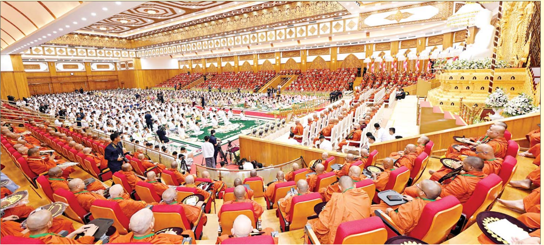
အဂ္ဂိဗိပတိသာသနာဗိမာန်တော်ကြီးအတွင်း၌ ရေစက်ချအောင်ပွဲမင်္ဂလာ ကုသိုလ်တော် မဟာမင်္ဂလာအခမ်းအနားများ ကျင်းပစဉ်။