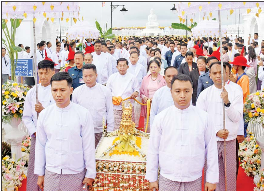
ဦးဆောင်ဘုရားဒါယကာ နိုင်ငံတော်စီမံအုပ်ချုပ်ရေးကောင်စီဥက္ကဋ္ဌ နိုင်ငံတော်ဝန်ကြီးချုပ် ဗိုလ်ချုပ်မှူးကြီးမင်းအောင်လှိုင် နှင့် ဇနီးဒေါ်ကြူကြူလှတို့က ရတနာစိန်ဖူးတော်နှင့် ငှက်မြတ်နားတော်တို့ကို ပင့်ဆောင်၍ မင်္ဂလာမော်ကွန်းကျောက်စာရုံစေတီ တော်အား လက်ယာရစ် လှည့်လည်ပူဇော်စဉ်။

ယနေ့ကျင်းပသည့် မဟာမင်္ဂလာအခမ်း အနားများသို့ ခရီးလမ်းပင်ပန်းမှု စသည် ကို ဥပေက္ခာပြုလျက် မေတ္တာတရား ရှေ့ထားကာ ကြွရောက်ချီးမြှင့်တော်မူ ကြပါသော ပြည်တွင်း၊ ပြည်ပမှ ဆရာတော်ကြီးများအား ကျန်းမာရွှင်လန်း စွာဖြင့် စုံစုံညီညီ ဖူးမြော်ခွင့်ရရှိပြီး မာရဝိဇယ ဗုဒ္ဓရုပ်ပွားတော်မြတ်ကြီး တည်ထားပူဇော်ခြင်းနှင့် စပ်လျဉ်း၍ ရှင်းလင်းလျှောက်ထားခွင့် ရရှိသည့် အတွက် ပီတိသောမနဿ ကုသိုလ်စိတ် များ တိုးပွားဖြစ်ပေါ်ရပါသည်ကို ဦးစွာ လျှောက်ထားအပ်ပါကြောင်း။ မာရဝိဇယဗုဒ္ဓရုပ်ပွားတော်မြတ်ကြီး တည်ထားရာတွင် ရည်ရွယ်ချက်လေး ရပ်ထားရှိခဲ့ပြီး နိုင်ငံတော်တွင် ထေရဝါဒ ဗုဒ္ဓဘာသာခိုင်မာစွာ ထွန်းလင်းတောက်ပ နေမှုကို ကမ္ဘာကိုပြသနိုင်ရန်၊ မြန်မာ နိုင်ငံ၌ ထေရဝါဒဗုဒ္ဓဘာသာကိုးကွယ်မှု၏ ဗဟိုချက်အဖြစ် သာသနာတော်ပြန့်ပွား ရေးလုပ်ငန်းများကို ဆက်လက်ဆောင် ရွက်နိုင်ရန်တို့အပြင် ပြည်သူပြည်သား အားလုံး အေးအေးချမ်းချမ်းဖြင့် နေထိုင် လုပ်ကိုင် စားသောက်နိုင်ပြီး ပျော်ပျော် ရွှင်ရွှင် ပညာသင်ကြားနိုင်စေရန် ဗုဒ္ဓမြတ်စွာ၏ အေးမြသည့် မေတ္တာရိပ် အောက်၌ အားလုံးလိုမြဲအေးချမ်းစွာဖြင့် သာယာပျော်ရွှင်စွာ နေထိုင်နိုင်ရန် အတွက် နိုင်ငံတော်ကြီး သာယာဝပြောမှု ရှိစေရန်လည်း စာမျက်နှာ ၅ သို့