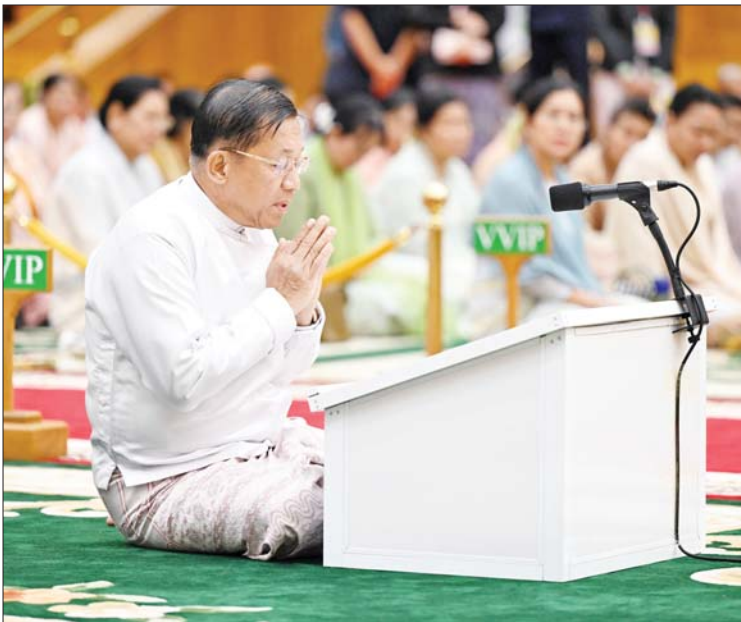
ဦးဆောင်ဘုရားဒါယကာ နိုင်ငံတော်စီမံအုပ်ချုပ်ရေးကောင်စီဥက္ကဋ္ဌ နိုင်ငံတော် ဝန်ကြီးချုပ် ဗိုလ်ချုပ်မှူးကြီးမင်းအောင်လှိုင်က မာရဝိဇယဗုဒ္ဓရုပ်ပွားတော်မြတ်ကြီး တည်ထားကိုးကွယ်ရခြင်းနှင့်စပ်လျဉ်း၍ လျှောက်ထားစဉ်။

စာမျက်နှာ ၅ မှ အဆိုပါ ပင့်ထောင်ခြင်းလုပ်ငန်းနှင့် ပင့်ဆောင်ခြင်းလုပ်ငန်းများကို အမှားအယွင်းမရှိစေရေး ခက်ခက်ခဲခဲဖြင့် ဆောင်ရွက်နိုင်ခဲ့ပါကြောင်း၊ ယခုနှစ် ဇန်နဝါရီ ၂၆ ရက်တွင် ဆင်းတုတော် အပိုင်း(၁၊ ၂)တို့ကို ရတနာပလ္လင်တော် ထက်သို့ စတင်ပင့်ဆောင်ပူဇော်ခြင်း အခမ်းအနားကို ပြုလုပ်ခဲ့ပြီး ဇန်နဝါရီ ၃၁ ရက်တွင် ပလ္လင်တော်ထက်ကို အောင်မြင်စွာ ပင့်ဆောင်ပူဇော်နိုင်ခဲ့ပါကြောင်း၊ ဇန်နဝါရီ ၂၇ ရက်တွင် ပထမအကြိမ် ဌာပနာထည့်သွင်းပူဇော်ခြင်း မဟာမင်္ဂလာအခမ်းအနားနှင့် ဖေဖော်ဝါရီ ၁၀ ရက်တွင် ဒုတိယအကြိမ် ဌာပနာထည့်သွင်းပူဇော်ခြင်း မဟာမင်္ဂလာ အခမ်းအနားတို့ကို ဆောင်ရွက်ခဲ့ရာ ပြည်ထောင်စုမြန်မာနိုင်ငံတော် တစ်ဝန်း လုံးမှ(၇)ရက်သား၊ သမီး၊ ဘုရားဒါယကာ၊ ဒါယိကာမများ၊ စေတနာရှင်၊ အလှူရှင် များက ကုသိုလ်ပြုလှူဒါန်းထားသည့် အဖိုးတန်ကျောက်မျက်ရတနာ ဌာပနာ တော်ကုသိုလ်ပစ္စည်းများ ဌာပနာသွင်းလှူ ပူဇော်နိုင်ခဲ့ပါကြောင်း၊ ရုပ်ပွားတော်မြတ်ကြီး ရေရှည်တည်တံ့ခိုင်မြဲစေရန်အတွက် တန်ချိန် ၂၀၀၀၀ ထိ ခံနိုင်သည့် အောက်ခံအမာရရှိရေး၊ တစ်နာရီ လေတိုက်နှုန်း မိုင် ၁၂၀ ရှိသည့် လေပြင်း မုန်တိုင်း တိုက်ခတ်မှုဒဏ်ခံနိုင်ရေး၊ မြန်မာနိုင်ငံတွင် အမြင့်ဆုံး လှုပ်ခတ်နိုင် သည့် Earthquake Magnitude ၈ ဒသမ