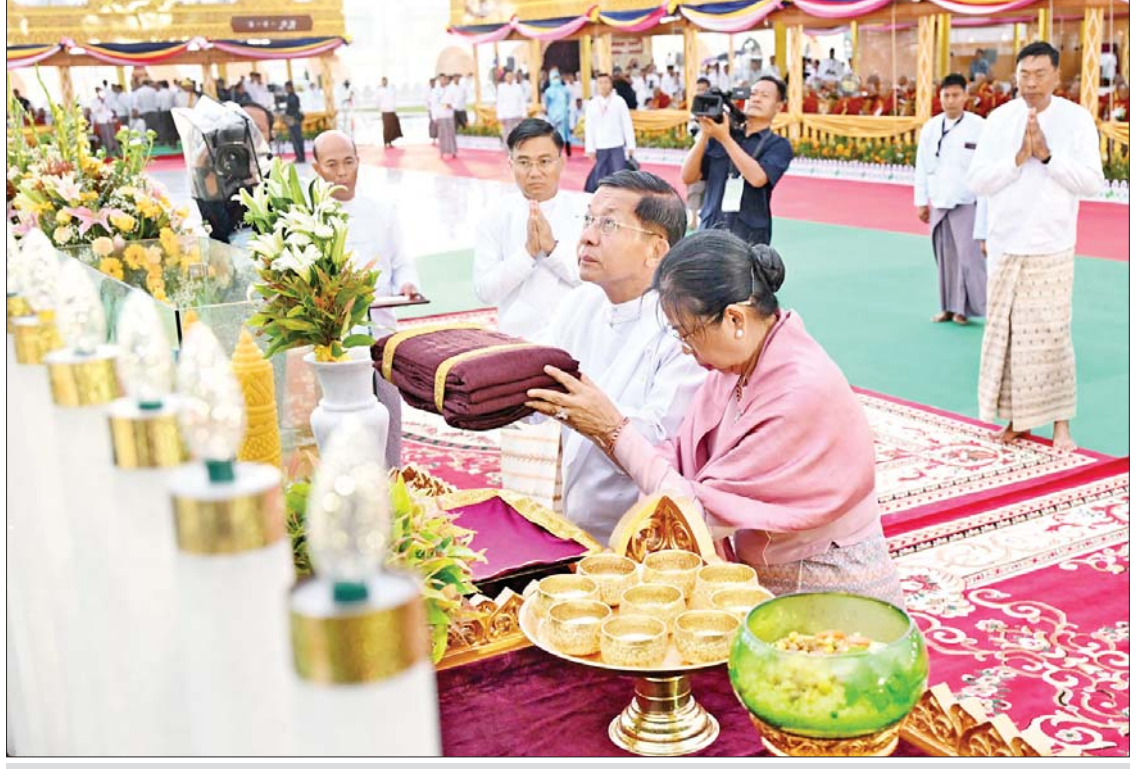
ဦးဆောင်ဘုရားဒါယကာ နိုင်ငံတော်စီမံအုပ်ချုပ်ရေးကောင်စီဥက္ကဋ္ဌ နိုင်ငံတော်ဝန်ကြီးချုပ် ဗိုလ်ချုပ်မှူးကြီးမင်းအောင်လှိုင် နှင့် ဇနီး ဒေါ်ကြူကြူလှတို့က မာရဝိဇယဗုဒ္ဓရုပ်ပွားတော်မြတ်ကြီးအား ဖူးမြော်ကြည်ညို၍ ရွှေကြာသင်္ကန်းတော် ဆက်ကပ် လှူဒါန်းစဉ်။

ကျောက်စာရုံစေတီများအား ရွှေထီးတော်တင်လှူပူဇော်ခြင်း ထို့နောက် အခမ်းအနားအစီအစဉ် ဒုတိယပိုင်းအဖြစ် ကျောက်စာရုံစေတီများ အား ရွှေထီးတော်တင်လှူပူဇော်ခြင်း အစီအစဉ်ကို ဆက်လက်ကျင်းပရာ အလှ ပန်းစိုက် ငွေဖလားကိုင်၊ သာသနာ့အလံ ကိုင်၊ ထီးဖြူတော်ကိုင်၊ မင်္ဂလာဝေါယာဉ် တော်ကိုင် ဥပါသကာများ၊ ဒေဝါဝင်း၊ ရာဇာဝင်းများ၊ ပန်းကြွအဖွဲ့နှင့် ဝတ်အသင်းအဖွဲ့များက ကျောက်စာရုံ စေတီတော်အဝင်မုခ်ဦးရှိ သတ်မှတ်နေရာ များတွင် နေရာယူကြပြီး တာဝန်ရှိသူများ က မဟာထေရ်ဆရာတော်ကြီး ၁၁ ပါး အား ထေရဝါဒနာမဏ္ဍပ်သို့ ပင့်ဆောင်ပေး ကြသည်။ ယင်းနောက် ဘုရားဒါယကာ၊ ဒါယိကာမများက ရတနာစိန်ဖူးတော်နှင့် ၎င်းမြတ်နိုးတော်တို့ကို ပင့်ဆောင်၍ မင်္ဂလာမော်ကွန်း ကျောက်စာရုံစေတီ တော်အား လက်ယာရစ် လှည့်လည်ပူဇော် ကာ အပူဇော်ခံနေရာသို့ ပို့ဆောင်ပြီး ကုသိုလ်တော်မဏ္ဍပ်တွင် နေရာယူကြ သည်။ ဆက်လက်၍ ဆရာတော်ကြီးများက ဒုက္ခပတ္တာ စနိဒ္ဓါက္ခာ-ဂါထာ၊ သဗ္ဗိတိယော ဝိဝဇ္ဇန္တီ-ဂါထာနှင့် ဘဝတု- သုံးဂါထာတို့ ကို ရွတ်ဆို၍ မေတ္တာပြုပူဇော်ကြပြီး ဘုရားဒါယကာ၊ ဒါယိကာမများက ရတနတ္ထယူဇာဂါထာနှင့် သဗ္ဗသင်္ဂါဟက မေတ္တာပို့ လင်္ကာနှစ်ပိုဒ်ကို သံပြိုင်ညီညာ ရွတ်ဆိုပွားများ ပူဇော်ကြသည်။ စာမျက်နှာ ၄ သို့ ❁