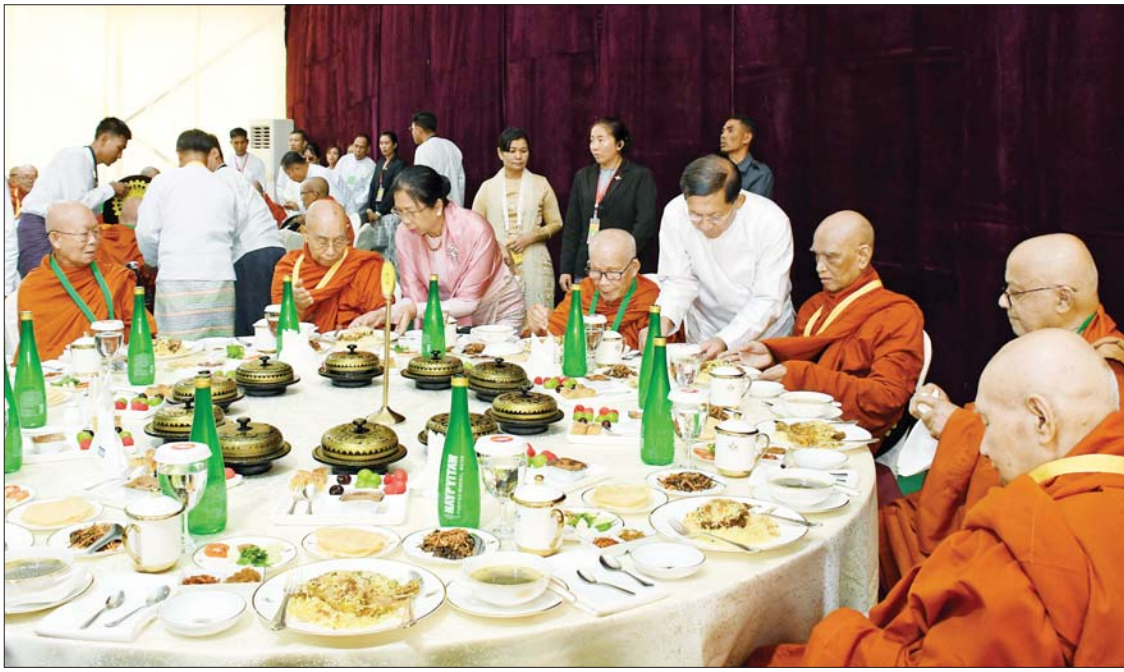
ဦးဆောင်ဘုရားဒါယကာ နိုင်ငံတော်စီမံအုပ်ချုပ်ရေးကောင်စီဥက္ကဋ္ဌ နိုင်ငံတော်ဝန်ကြီးချုပ် ဗိုလ်ချုပ်မှူးကြီးမင်းအောင်လှိုင် နှင့်ဇနီး ဒေါ်ကြူကြူလှတို့က ပြည်တွင်း၊ ပြည်ပမှ ဆရာတော်၊ သံဃာတော်များအား နေ့ဆွမ်းဆက်ကပ်လှူဒါန်းစဉ်။

ကျောက်စာများပေါ်တွင် ခေတ်မီ စက်ကိရိယာများအသုံးပြု၍ ပါဠိအက္ခရာ Romanize Language တို့ဖြင့် ကျောက်စာတော်များ ထွင်းထုထည့်သွင်း၍ တည်ထားဆောင်ရွက်ခြင်း ဖြစ်ပါကြောင်း၊ ကျောက်စာရုံစေတီတော်များကို မန္တလေးမြို့ မဟာကုသိုလ်တော်ဘုရား ကျောက်စာရုံများပုံစံယူ၍ ကျောက်စာရုံစေတီ ၇၂၀ နှင့် မော်ကွန်းကျောက်စာစေတီတော်တစ်ဆူတို့ကို တည်ဆောက်ခဲ့ပါကြောင်း၊ နှစ်ဘာသာဖြင့် ရေးထွင်းပူဇော်ခြင်းဖြစ်၍ ကျောက်စာချပ်ရေ ၁၄၄၀ ချပ်ရှိပါကြောင်း၊ ကျောက်စာများ ရေးထိုးရာတွင်လည်း မှားယွင်းမှုမရှိစေရေးအတွက် အပြည်ပြည်ဆိုင်ရာထေရဝါဒပုဒ္ဒတ္တသီလီ (ရန်ကုန်၊ မန္တလေး) နှင့် သီတဂူသာသနာ့တက္ကသိုလ်တို့မှ ပါမောက္ခချုပ်များ ဦးဆောင်မှုဖြင့် ဆရာတော်ကြီးများက နေ့စဉ်တည်းဖြတ်