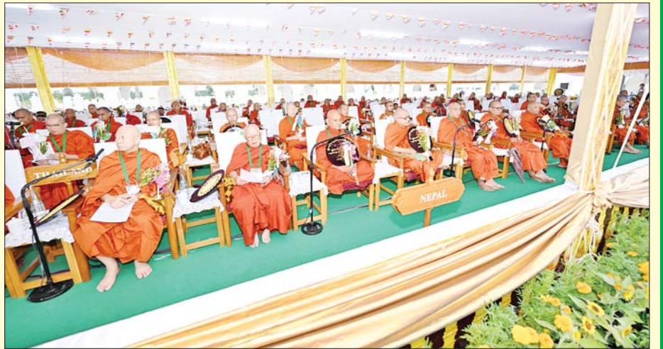
ပြည်တွင်း ပြည်ပမှ သံဃာတော်များက မာရဝိဇယဗုဒ္ဓရုပ်ပွားတော်မြတ်ကြီးအား ဗုဒ္ဓါဘိသေက အနေကဇာတင်၍ ဗုဒ္ဓါဘိသိက် သွန်းတော်မူကြစဉ်။