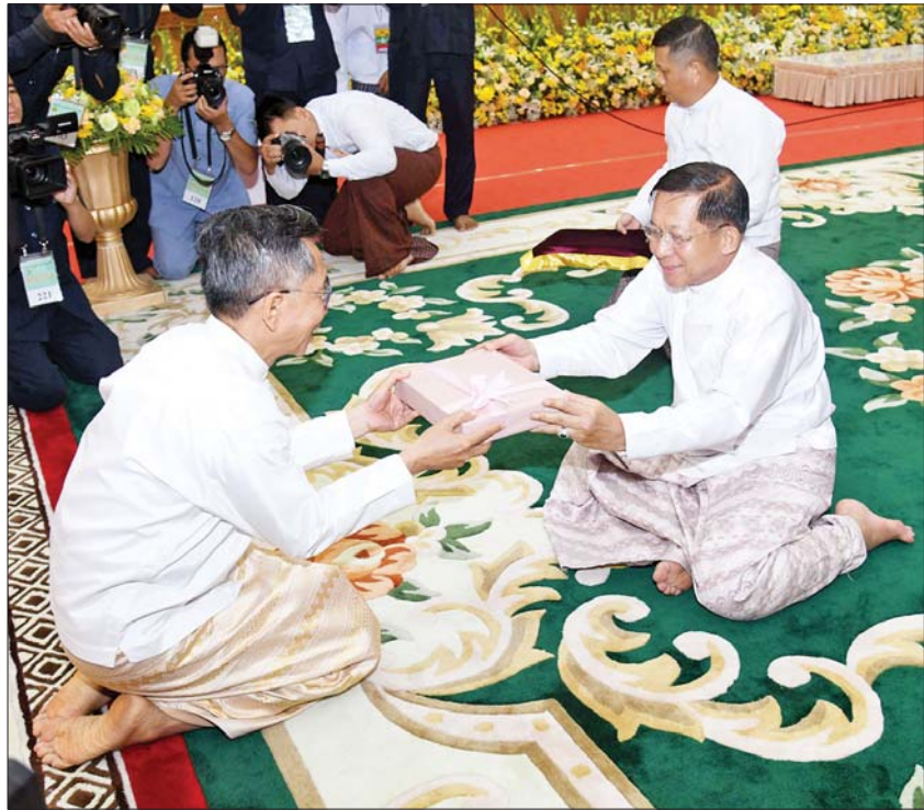
ဦးဆောင်ဘုရားဒါယကာ နိုင်ငံတော် စီမံအုပ်ချုပ်ရေးကောင်စီဥက္ကဋ္ဌ နိုင်ငံတော်ဝန်ကြီးချုပ် ဗိုလ်ချုပ်မှူးကြီးမင်းအောင်လှိုင်က ဗိသုကာ အင်ဂျင်နီယာများကို ဂုဏ်ပြုလက်ဆောင် ပစ္စည်းများ ပေးအပ်ချီးမြှင့်စဉ်။

၍ မိမိဦးဆောင်သော အများပြည်သူများ စုပေါင်းပြီး လှူဒါန်းပူဇော်ကြပါကြောင်း ဝမ်းမြောက်ဖွယ်စကား လျှောက်ထားအပ်ပါကြောင်း။