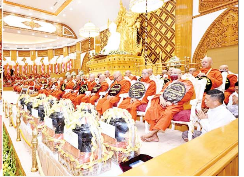
ဦးဆောင်ဘုရားဒါယကာ နိုင်ငံတော်စီမံအုပ်ချုပ်ရေးကောင်စီဥက္ကဋ္ဌ နိုင်ငံတော်ဝန်ကြီးချုပ် ဗိုလ်ချုပ်မှူးကြီးမင်းအောင်လှိုင်နှင့်ဇနီး ဒေါ်ကြူကြူလှ၊ ဧည့်ပရိသတ်များက နိုင်ငံတော်သံဃမဟာနာယကအဖွဲ့ အကျိုးတော်ဆောင် သန်လျင်မြို့ မင်းကျောင်းပထမပြန်စာသင်တိုက် ပဓာနနာယက၊ အဂ္ဂမဟာပဏ္ဍိတ အဂ္ဂမဟာသဒ္ဓမ္မဇောတိကဓဇ ဒေါက်တာ ဘဒ္ဒန္တ စန္ဒိမာဘိဝံသထံမှ ကိုးပါးသီလ ခံယူဆောက်တည်ကြစဉ်။