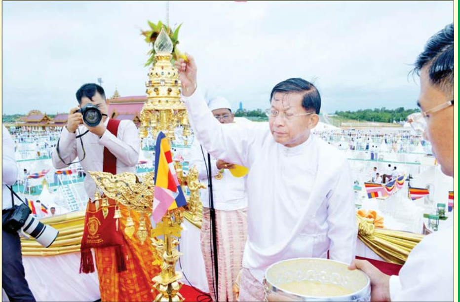
ဦးဆောင်ဘုရားဒါယကာ နိုင်ငံတော်စီမံအုပ်ချုပ်ရေးကောင်စီဥက္ကဋ္ဌ နိုင်ငံတော်ဝန်ကြီးချုပ် ဗိုလ်ချုပ်မှူးကြီး မင်းအောင်လှိုင်နှင့် ဆရာတော်ကြီးများက ရွှေထီးတော်များအား ပရိတ်နံ့သာရည်၊ တရော်ကင်ပွန်းရည်၊ ရေစင်ရေသန့်တို့ဖြင့် ပက်ဖျန်းသန့်စင်သွန်းလောင်းပူဇော်ကြစဉ်။