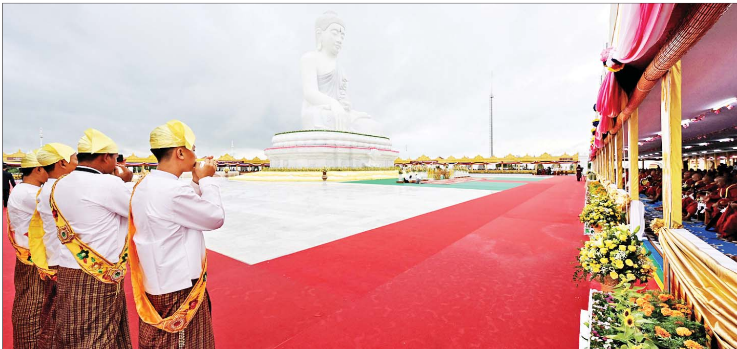
မာရဝိဇယဗုဒ္ဓရုပ်ပွားတော်မြတ်ကြီးအား ဗုဒ္ဓါဘိသေက အနေကဇာတင်၍ ဗုဒ္ဓါဘိသိက်သွန်းလောင်းပူဇော်ခြင်း မင်္ဂလာအခမ်းအနားကို နမောတဿ သုံးကြိမ်ရွတ်ဆို ဘုရားကန်တော့ဖွင့်လှစ်ပြီး မာရဝိဇယဗုဒ္ဓပူဇော်ပေးခြင်းဖြင့်ပူဇော်၍ မင်္ဂလာငွေခရုနှင့် အောင်စည်အောင်မောင်း သုံးကြိမ်တီးခတ်ပူဇော်စဉ်။

ဒါန၊ သီလ၊ ဘာဝနာ ကုသိုလ်ဆည်းပူးခြင်း ယင်းနောက် အခမ်းအနားအစီအစဉ် တတိယပိုင်းအဖြစ် ဒါန၊ သီလ၊ ဘာဝနာ ကုသိုလ်ဆည်းပူးခြင်း အစီအစဉ်ကို အဂ္ဂိမိပတိ သာသနာဗိမာန်တော်ကြီး အတွင်း၌ ကျင်းပပြုလုပ်ရာ တက်ရောက် လာသည့် ဧည့်ပရိသတ်များက အခမ်း အနားကို နမောတဿ သုံးကြိမ်ရွတ်ဆို ဘုရားကန်တော့ဖွင့်လှစ်ပြီး နိုင်ငံတော် သံဃမဟာနာယကအဖွဲ့ အကျိုးတော် ဆောင် သန်လျင်မင်းကျောင်းဆရာတော် ကြီးထံမှ ကိုးပါးသီလခံယူဆောင်တည် ကြကာ သံဃာတော်အရှင်သူမြတ်များ ရွတ်ပွားချီးမြှင့်တော်မူသည့် မေတ္တာသုတ်၊ ရတနာသုံးပါးဂုဏ်တော်နှင့် ပဗ္ဗဏှသုတ် ပရိတ်တရားတော်များကို နာယူကြည့်ညို့ ကြသည်။ ထို့နောက် ဦးဆောင်ဘုရားဒါယကာ နိုင်ငံတော်ဝန်ကြီးချုပ်က မာရဝိဇယ ရုပ်ပွားတော်မြတ်ကြီး တည်ထားကိုးကွယ် ရခြင်းနှင့်စပ်လျဉ်း၍ လျှောက်ထားရာတွင်