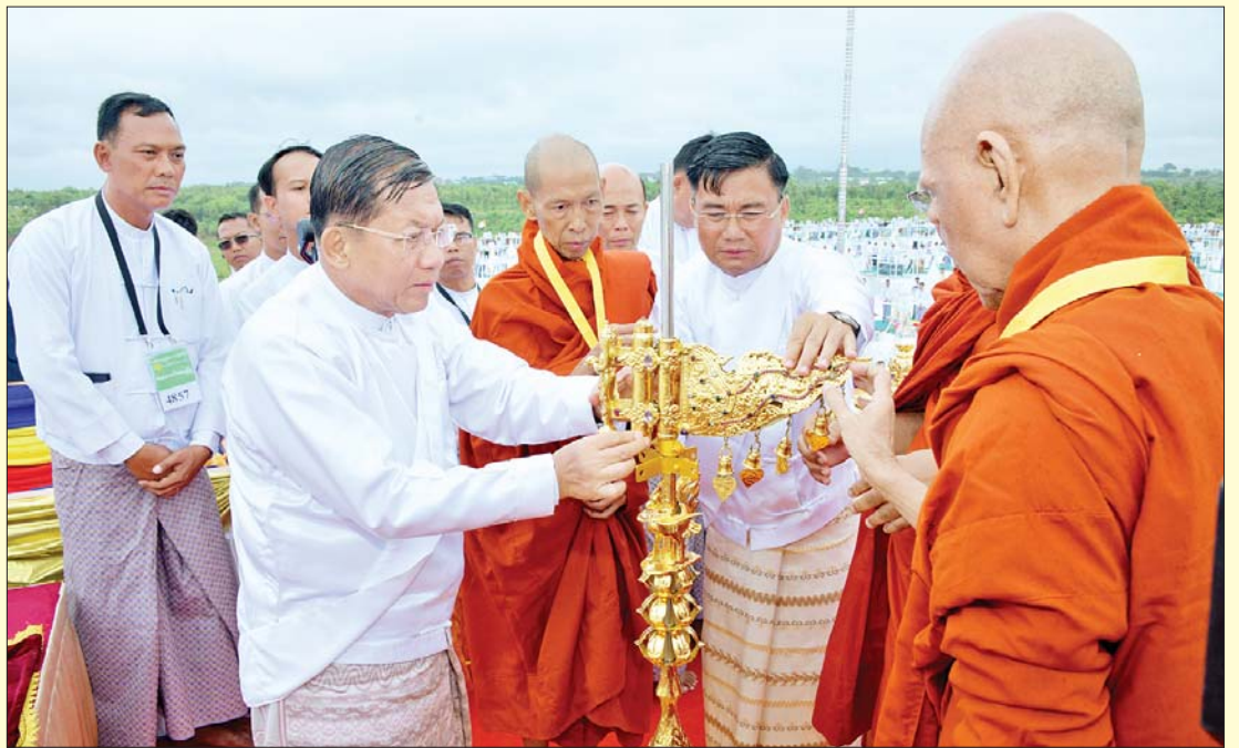
ဦးဆောင်ဘုရားဒါယကာ နိုင်ငံတော်စီမံအုပ်ချုပ်ရေးကောင်စီဥက္ကဋ္ဌ နိုင်ငံတော်ဝန်ကြီးချုပ် ဗိုလ်ချုပ်မှူးကြီးမင်းအောင်လှိုင် မင်္ဂလာမော်ကွန်းကျောက်စာရုံစေတီတော်အား ရွှေထီးတော်ဘုံအဆင့်များ၊ ရတနာငှက်မြတ်နားတော်နှင့် ရတနာစိန်ဖူးတော်တို့ကို အစဉ်အတိုင်း တင်လှူပူဇော်စဉ်။