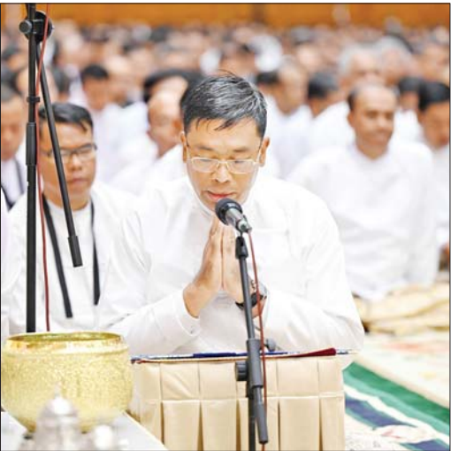
ဗိသုကာ အင်ဂျင်နီယာများ ကိုယ်စားတာဝန်ရှိသူ တစ်ဦးက မာရဝိဇယ ဗုဒ္ဓရုပ်ပွားတော်မြတ်ကြီးကို မူလအရင်းဖြစ်သည့် ဘုရားဒါယကာ၊ ဒါယိကာမများထံ ပြန်လည်အပ်နှံစဉ်။

တပည့်တော် ဆက်လက်လျှောက်ထားလိုသည်မှာ မာရဝိဇယဗုဒ္ဓရုပ်ပွားတော်မြတ်ကြီး၏ အခြံအရံကုသိုလ်တော်အဖြစ် သာသနာ့ဗိမာန်တော်ကြီးကို နိုင်ငံတစ်ဝန်းလုံးရှိ အများပြည်သူများက တည်ဆောက်လှူဒါန်း ပူဇော်ထားခြင်းဖြစ်ပါကြောင်း၊ ဆဋ္ဌသင်္ဂါယနာတင်သည့် အချိန်ကာလတွင် ယခင်ဝန်ကြီးချုပ်ဟောင်း ဦးနု ဦးဆောင်သော ပြည်သူများက စုပေါင်းတည်ဆောက်လှူဒါန်းခဲ့သည့် မဟာပါသာဏ လိုဏ်ဂူတော်ကြီးကို နမူနာယူ၍ ခေတ်မီဒီဇိုင်းဖြင့် တည်ဆောက်ခဲ့ခြင်း ဖြစ်ပါကြောင်း၊ အလျား ၂၉၆ ပေ၊ အနံ ၂၁၃ ပေ၊ အမြင့် ၉၄ ပေရှိ အဂ္ဂါမိပတိသာသနာ့ဗိမာန်တော်ကြီးသည် ဝိသုကာမသိမ်တော်ကြီးလည်းဖြစ်ပြီး သံဃာအပါး ၉၀၀၊ လူပုဂ္ဂိုလ် ၁၂၀၀ ဝင်ဆုံ၍ နိုင်ငံတော်အဆင့်သာသနာရေးဆိုင်ရာ အခမ်းအနားများ ကျင်းပနိုင်ရန် ရည်ရွယ်တည်ဆောက်ထားခြင်းဖြစ်ပါကြောင်း၊ ထိုမျှမက ၂၅၅ ဧက ကျယ်ဝန်းသည့် ဗုဒ္ဓဥယျာဉ်တော်ကြီးအတွင်း၌ ရေပန်းရင်ပြင်၊ ရတနာပုံခေတ် သုဗ္ဗောဇရပ် ခြောက်ဆောင်၊ မော်ကွန်းပြတိုက်၊