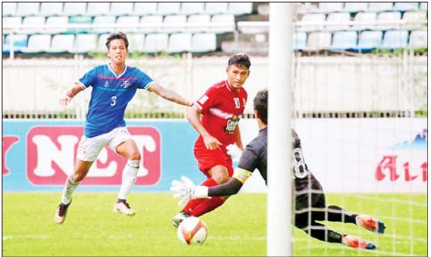
ဟံသာဝတီအသင်းနှင့် ကချင်ယူနိုက်တက်အသင်းတို့ ယှဉ်ပြိုင် ကစားကြစဉ်။