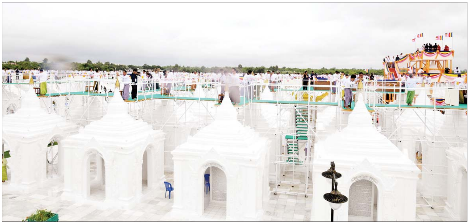
အလှူရှင် ဘုရားဒါယကာများက အရံစေတီတော်လေးဆူနှင့် ကျောက်စာရုံစေတီတော်များအား ရွှေထီးတော်များ တင်လှူပူဇော်ကြစဉ်။

ကျောက်တုံးတော်ကြီးများကို သယ်ယူ ရေးစီစဉ်ဆောင်ရွက်ခဲ့ရာတွင် ကုန်းလမ်း ကသယ်ယူရန် အခက်အခဲများရှိသည့် အတွက် စကျင်တောင်မှ ဧရာဝတီမြစ်၊ ၎င်းမှ ဆီမီးခုံဆိပ်ကမ်း၊ ထိုမှတစ်ဆင့်