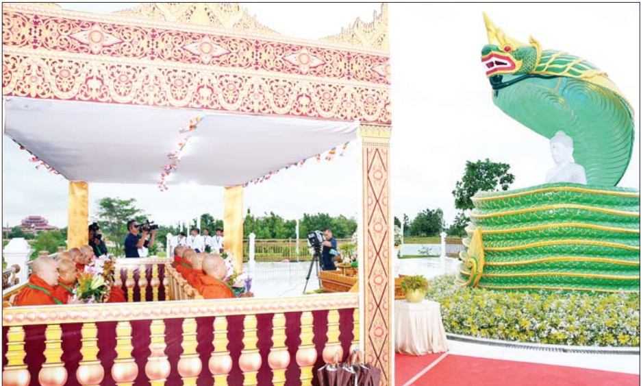
ပျဉ်းမနားမြို့ ပါဠိတက္ကသိုလ် မင်္ဂလာဇေယျကျောင်းတိုက်ပဓာနနာယက အဂ္ဂမဟာပဏ္ဍိတ အဂ္ဂမဟာ သဒ္ဓမ္မဇောတိကဓဇ ဘဒ္ဒန္တဝိမလဗုဒ္ဓိ အမျိုးပြုသော သံဃာတော် ၁၂ ပါးတို့က သာသနာဗိမာန်တော်နှင့် မုစလိန္နတို့၌ ဗုဒ္ဓါဘိသေက အနေကဇာတင်၍ ဗုဒ္ဓါဘိသိက်သွန်းတော်မူကြစဉ်။

စာမျက်နှာ ၃ မှ ထို့နောက် ဆရာတော်ကြီး သုံးပါး၊ ဦးဆောင်ဘုရားဒါယကာနှင့် ဘုရား ဒါယကာများက စေတီတော်အထွတ်ငြိမ်း ထက်သို့ တက်ရောက်နေရာယူပြီးချိန်တွင် အရံစေတီတော် လေးဆူနှင့် ကျောက်စာရုံ စေတီ အဆူ ၇၂၀ တို့အား ရွှေထီးတော် တင်လှူကြမည့် အလှူရှင်ဘုရားဒါယကာ များကလည်း စေတီတော်အထွတ်ငြိမ်း ထက်သို့ ဆက်လက်တက်ရောက်နေရာ ယူကြသည်။ ယင်းနောက် အခမ်းအနားမှူးက မင်္ဂလာအခါတော်ဟု ကြွေးကြော်လိုက် သည်နှင့် တစ်ပြိုင်တည်း ဦးဆောင်ဘုရား ဒါယကာက ရွှေထီးတော်တုံအဆင့်များ၊ ရတနာငှက်မြတ်နားတော်နှင့် ရတနာ စိန်ဖူးတော်တို့ကို အစဉ်အတိုင်း တင်လှူ ပူဇော်ပြီး စေတီတော်အထွတ်တွင် သာသနာ့အောင်လံတော်ကို လွှင့်ထူပူဇော် သည်။ ထို့အတူ အလှူရှင် ဘုရားဒါယကာ များက အရံစေတီတော်လေးဆူနှင့် ကျောက်စာရုံ စေတီတော်များအား ရွှေထီးတော်များ တင်လှူပူဇော်ကြပြီး ရွှေထီးတော်မြတ်များအား ပရိတ်နံ့သာ ရေ၊ တရော်ကင်ပွန်းရေ၊ ရေစင်ရေသန့်တို့ ဖြင့် ပက်ဖျန်းသန့်စင် သွန်းလောင်း ပူဇော်ကြသည်။ ဆက်လက်၍ ဦးဆောင်ဘုရား ဒါယကာ နိုင်ငံတော်စီမံအုပ်ချုပ်ရေး