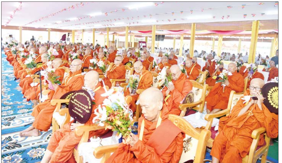
ပြည်တွင်း ပြည်ပမှ သံဃာတော်များက မာရဝိဇယ ဗုဒ္ဓရုပ်ပွားတော်မြတ်ကြီးအား ဗုဒ္ဓါဘိသေက အနေကဇာတင်၍ ဗုဒ္ဓါဘိသိက်သွန်းတော်မူကြစဉ်။

ရှေ့ဖုံးမှ သီတဂူ ကမ္ဘာ့ဗုဒ္ဓတက္ကသိုလ်များ၏ အဓိပတိ အဘိဓမ္မမဟာရဋ္ဌဂုရု အဘိဓမ္မ အဂ္ဂမဟာ သဒ္ဓမ္မဇောတိက ဒေါက်တာ ဘဒ္ဒန္တဉာဏိဿရနှင့် ပျဉ်းမနားမြို့ ပါဠိတက္ကသိုလ် မင်္ဂလာဇေယျကျောင်း တိုက်ပဓာနနာယက၊ အဂ္ဂမဟာပဏ္ဍိတ အဂ္ဂမဟာ သဒ္ဓမ္မဇောတိကဓမ္မ ဘဒ္ဒန္တ ဝိမလဗုဒ္ဓိ အမျိုးပြုသော ပြည်တွင်း၊ ပြည်ပမှ ဆရာတော်၊ သံဃာတော်အပါး ၉၀၀၊ သာသနာ့နွယ်ဝင် သီလရှင်ဆရာ ကြီး အပါး ၂၀ တို့ ကြွရောက်ချီးမြှင့်တော် မူကြပြီး ဦးဆောင်ဘုရားဒါယကာ နိုင်ငံတော်စီမံအုပ်ချုပ်ရေးကောင်စီဥက္ကဋ္ဌ နိုင်ငံတော်ဝန်ကြီးချုပ် ဗိုလ်ချုပ်မှူးကြီး မင်းအောင်လှိုင်နှင့် ဇနီးဒေါ်ကြူကြူလှ တို့က မာရဝိဇယဗုဒ္ဓရုပ်ပွားတော်မြတ်ကြီး အား ဖူးမြော်ကြည်ညို၍ မြသပိတ်ဆွမ်း တော်၊ ရွှေကြာသင်္ကန်းတော်၊ သစ်သီး ပန်းမန်၊ သောက်တော်ရေချမ်းနှင့် ဆီမီး တို့ကို ဆက်ကပ်လှူဒါန်းသည်။