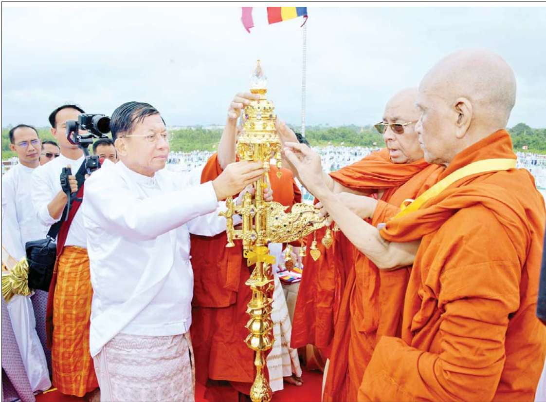
ဦးဆောင်ဘုရားဒါယကာ နိုင်ငံတော်စီမံအုပ်ချုပ်ရေးကောင်စီဥက္ကဋ္ဌ နိုင်ငံတော်ဝန်ကြီးချုပ် ဗိုလ်ချုပ်မှူးကြီးမင်းအောင်လှိုင် မင်္ဂလာမော်ကွန်းကျောက်စာရုံစေတီတော်အား ရွှေထီးတော်ဘုံအဆင့်များ၊ ရတနာငှက်မြတ်နားတော်နှင့် ရတနာစိန်ဖူးတော်တို့ကို အစဉ်အတိုင်း တင်လှူပူဇော်စဉ်။