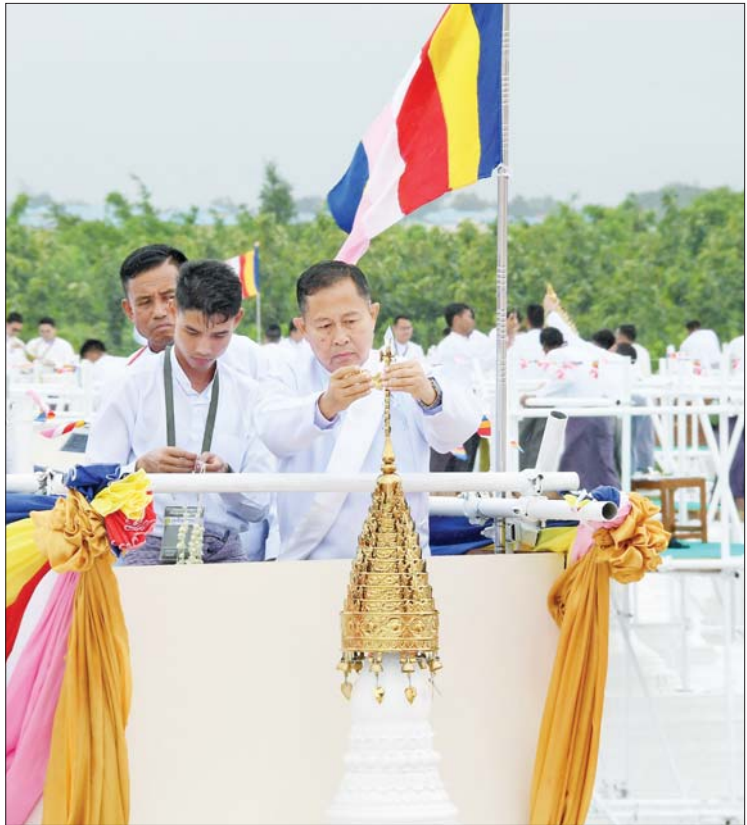
နိုင်ငံတော်စီမံအုပ်ချုပ်ရေးကောင်စီ ဒုတိယဥက္ကဋ္ဌ ဒုတိယဝန်ကြီးချုပ် ဒုတိယ ဗိုလ်ချုပ်မှူးကြီးစိုးဝင်း ကျောက်စာရုံစေတီတော်အား ရွှေထီးတော်တင်လှူပူဇော် စဉ်။