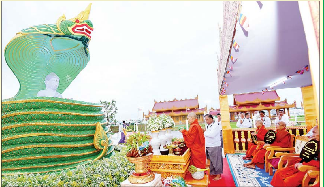
ပျဉ်းမနားမြို့ ပါဠိတက္ကသိုလ် မင်္ဂလာဇေယျကျောင်းတိုက်ပဓာနနာယက အဂ္ဂမဟာပဏ္ဍိတ အဂ္ဂမဟာ သဒ္ဓမ္မဇောတိကဇောဒ္ဓန္တဝိမလဗုဒ္ဓိ အမှူးပြုသော သံဃာတော် ၁၂ ပါးတို့က မုစလိန္ဒနဂါးရုံဘုရားကျောင်းဆောင်တော်၌ ဗုဒ္ဓါဘိသေက အနေကဇာတင်၍ ဗုဒ္ဓါဘိသိက်သွန်းတော်မူကြစဉ်။