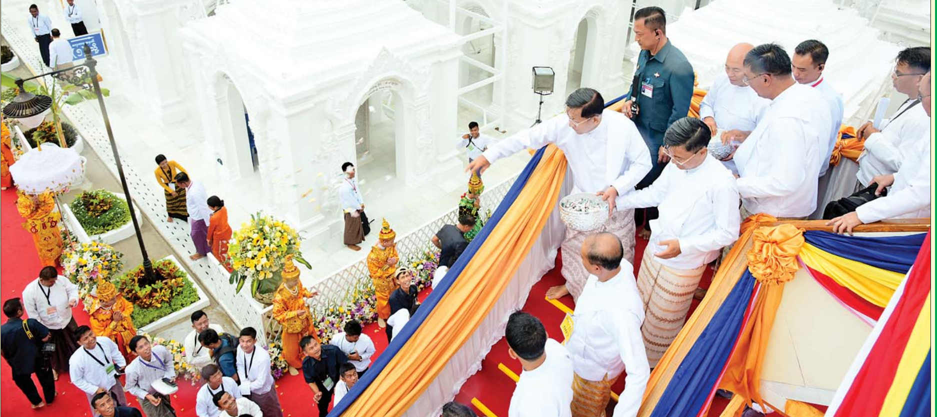
ဦးဆောင်ဘုရားဒါယကာ နိုင်ငံတော်စီမံအုပ်ချုပ်ရေးကောင်စီဥက္ကဋ္ဌ နိုင်ငံတော်ဝန်ကြီးချုပ် ဗိုလ်ချုပ်မှူးကြီး မင်းအောင်လှိုင်က မဟာမင်္ဂလာအခမ်းအနားများ အောင်မြင်ခြင်းအထိမ်းအမှတ်အဖြစ် ရတနာရွှေမိုး ငွေမိုးများ ရွှာသွန်းပြီးစဉ်။