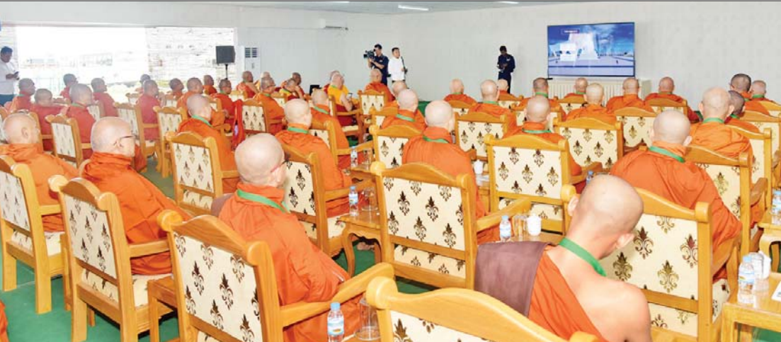
မာရဝိဇယ ဗုဒ္ဓရုပ်ပွားတော်မြတ်ကြီး တည်ထားကိုးကွယ်ထားရှိမှုနှင့်ပတ်သက်၍ ပြည်ပနိုင်ငံများမှ ကြွရောက်လာကြသည့် ဆရာတော်ကြီးများအား တာဝန်ရှိသူတစ်ဦးက ရှင်းလင်းပြသစဉ်။

ဗဟိုချက်မဖြစ်လာမည်ကိုလည်း ယုံကြည် မိပါကြောင်းဖြင့် ပြန်လည်မိန့်ကြားတော်မူ ကြသည်။ တွေ့ဆုံမိတ်ဆက်မှုများအပြီးတွင် ဦးဆောင်ဘုရားဒါယကာ နိုင်ငံတော် စီမံအုပ်ချုပ်ရေးကောင်စီဥက္ကဋ္ဌ နိုင်ငံတော် ဝန်ကြီးချုပ်က ကြွရောက်လာကြသည့် ပြည်ပနိုင်ငံများမှ ဆရာတော်ကြီးများ ထံသို့ မာရဝိဇယ ဗုဒ္ဓရုပ်ပွားတော်မြတ် ပုံစံတူ ကျောက်ဆစ်ဗုဒ္ဓရုပ်ပွားတော်မြတ် များကို ဆက်ကပ်လှူဒါန်းခဲ့သည်။ ထို့နောက် ပြည်ပနိုင်ငံများမှ ဆရာတော် ကြီးများက ဓမ္မလက်ဆောင်များနှင့် မာရဝိဇယ ဗုဒ္ဓရုပ်ပွားတော်မြတ်ကြီး တည်ထားကိုးကွယ်မှုအတွက် အလှူငွေ များကို ပေးအပ်လှူဒါန်းကြရာ ဦးဆောင် ဘုရားဒါယကာ နိုင်ငံတော်စီမံအုပ်ချုပ်ရေး ကောင်စီဥက္ကဋ္ဌ နိုင်ငံတော်ဝန်ကြီးချုပ်က လက်ခံရယူသည်။ အလားတူ ပြည်ပ နိုင်ငံများမှ ဆရာတော်ကြီးများနှင့်အတူ လိုက်ပါလာသူများကလည်း မာရဝိဇယ ဗုဒ္ဓရုပ်ပွားတော်မြတ်ကြီး တည်ထား