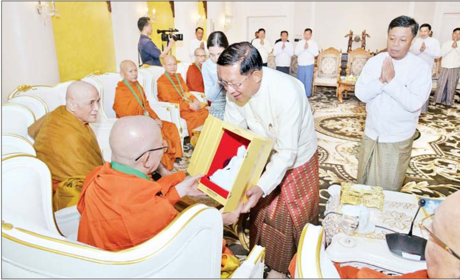
ဦးဆောင်ဘုရားဒါယကာ နိုင်ငံတော်စီမံအုပ်ချုပ်ရေးကောင်စီဥက္ကဋ္ဌ နိုင်ငံတော်ဝန်ကြီးချုပ် ဗိုလ်ချုပ်မှူးကြီးမင်းအောင်လှိုင် ထိုင်းနိုင်ငံမှ ကြွရောက်လာသည့် ဆရာတော်ကြီးထံ မာရဝိဇယ ဗုဒ္ဓရုပ်ပွားတော်မြတ် ပုံစံတူကျောက်ဆစ်ဗုဒ္ဓရုပ်ပွားတော်မြတ်ကို ဆက်ကပ်လှူဒါန်းစဉ်။