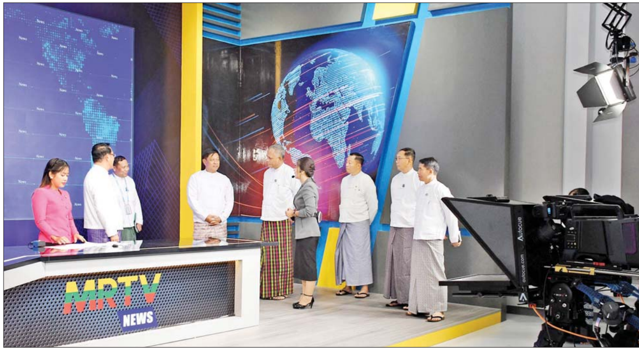
ဒုတိယဝန်ကြီးချုပ်နှင့် ပြည်ထောင်စုဝန်ကြီး ဗိုလ်ချုပ်ကြီးတင်အောင်စန်း၊ ပြည်ထောင်စုဝန်ကြီး ဦးမောင်မောင်အုန်းနှင့် အဖွဲ့ဝင်များ ရုပ်မြင်သံကြား သတင်းထုတ်လွှင့်မှုအခမ်းအနားကို ကြည့်ရှုအားပေးစဉ်။

Channel နှင့် MRTV Sports Channel အဆင့်မြှင့်တင်ထုတ်လွှင့်မှု (Channel Rebranding) ဖွင့်လှစ်ခြင်းအခမ်းအနားကို ယနေ့ မွန်းလွဲ ၂ နာရီတွင် နေပြည်တော် တပ်ကုန်းမြို့နယ်ရှိ မြန်မာ့အသံနှင့် ရုပ်မြင်သံကြား Auditorium ခန်းမ၌ ကျင်းပသည်။ တက်ရောက် အခမ်းအနားသို့ နိုင်ငံတော်စီမံအုပ်ချုပ်ရေးကောင်စီ အဖွဲ့ဝင် ဒုတိယဝန်ကြီးချုပ်နှင့် ပို့ဆောင်ရေးနှင့် ဆက်သွယ်ရေးဝန်ကြီးဌာန ဖွင့်လှစ်ခြင်းအခမ်းအနားနှင့် ပြည်ထောင်စုဝန်ကြီး ဦးမောင်မောင်အုန်းနှင့် ဇနီး၊ ဦးမင်းနောင်၊ ဦးခင်မောင်ရီနှင့် ဦးအောင်နိုင်ဦး၊ ဒုတိယဝန်ကြီး ဦးရဲတင်၊ ဦးဇင်မင်းထက်၊ ဌာနဆိုင်ရာ အကြီးအကဲများ၊ Hey Play Co., Ltd မှ တာဝန်ရှိသူများ၊ အနုပညာရှင်များ၊ မြန်မာ့အသံနှင့်ရုပ်မြင်သံကြားမှ ဝန်ထမ်းများ၊ တာဝန်ရှိသူများနှင့် ဖိတ်ကြား