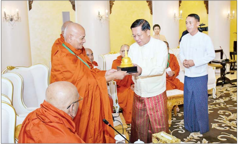
ဦးဆောင်ဘုရားဒါယကာ နိုင်ငံတော်စီမံအုပ်ချုပ်ရေးကောင်စီဥက္ကဋ္ဌ နိုင်ငံတော်ဝန်ကြီးချုပ် ဗိုလ်ချုပ်မှူးကြီးမင်းအောင်လှိုင်ထံ နီပေါနိုင်ငံမှ ကြွရောက်လာသည့် ဆရာတော်ကြီးက ဓမ္မလက်ဆောင် ပေးအပ်စဉ်။