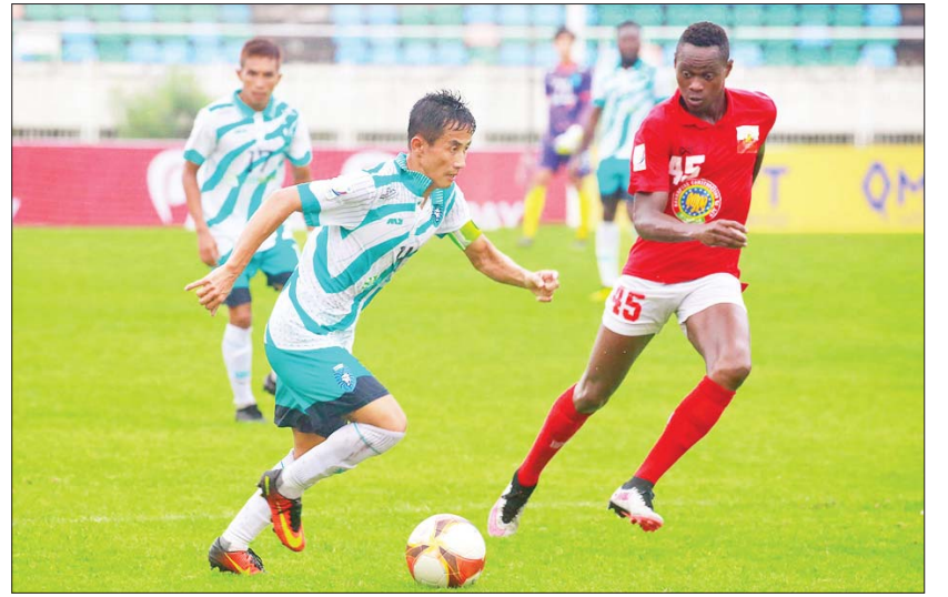
ရန်ကုန်အသင်းနှင့် ရခိုင်ယူနိုက်တက်အသင်းတို့ ယှဉ်ပြိုင်ကစားကြစဉ်။

MNL ပြိုင်ပွဲတွင် နာမည်ကြီး ရန်ကုန်အသင်း နိုင်ပွဲပြန်လည်ရရှိ ရန်ကုန် ဇူလိုင် ၃၁ ၂၀၂၃ ရာသီ MNL အမှတ်ပေးပြိုင်ပွဲ ပွဲစဉ် (၁၄) တတိယနေ့ကို ဇူလိုင် ၃၁ ရက်က ဆက်လက်ကျင်းပရာ နာမည်ကြီး ရန်ကုန်အသင်း နိုင်ပွဲပြန်ရပြီး အား/ကာသိပွဲနှင့် GFA အသင်းတို့ သရေကျခဲ့သည်။ သုဝဏ္ဏကွင်း၌ ကျင်းပသည့်ပွဲတွင် ရန်ကုန်အသင်းက ရခိုင်ယူနိုက်တက်အသင်းကို လေးဂိုး-တစ်ဂိုးဖြင့် အနိုင်ရခဲ့သည်။ ပြီးခဲ့သည့် ပွဲစဉ်(၁၃)တွင် မြဝတီကို အရေးနိမ့်ပြီးနောက် နည်းပြအပြောင်းအလဲ ပြုလုပ်ထားသည့် ရန်ကုန်အသင်းသည် ယာယီနည်းပြ ဦးတင်မောင်ထွန်းလက်ထက်တွင် နိုင်ပွဲရယူနိုင်ခဲ့သည်။ ရခိုင်ယူနိုက်တက်အသင်းသည် ပထမအကျော့တွင် စာမျက်နှာ ၁၄ ကော်လံ ၅ သို့