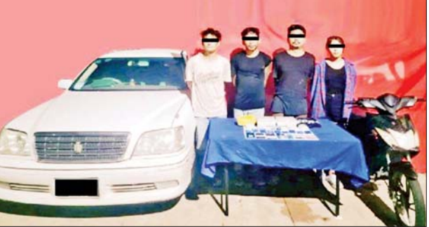
ပြစ်မှုကျူးလွန်သူများအား သိမ်းဆည်းရမိသည့် စိတ်ကြွေးသွပ်ဆေးပြားများနှင့်အတူ တွေ့ရစဉ်။ စိတ်ကြွေးသွပ်ဆေးပြား ၂၉၂၅၀ ဇူလိုင် ၂၈ ရက် ည ၈ နာရီတွင် ပြင်ဦးလွင်မြို့ ရပ်ကွက်ကြီး(၁၁) ရဲပြန်ကြား