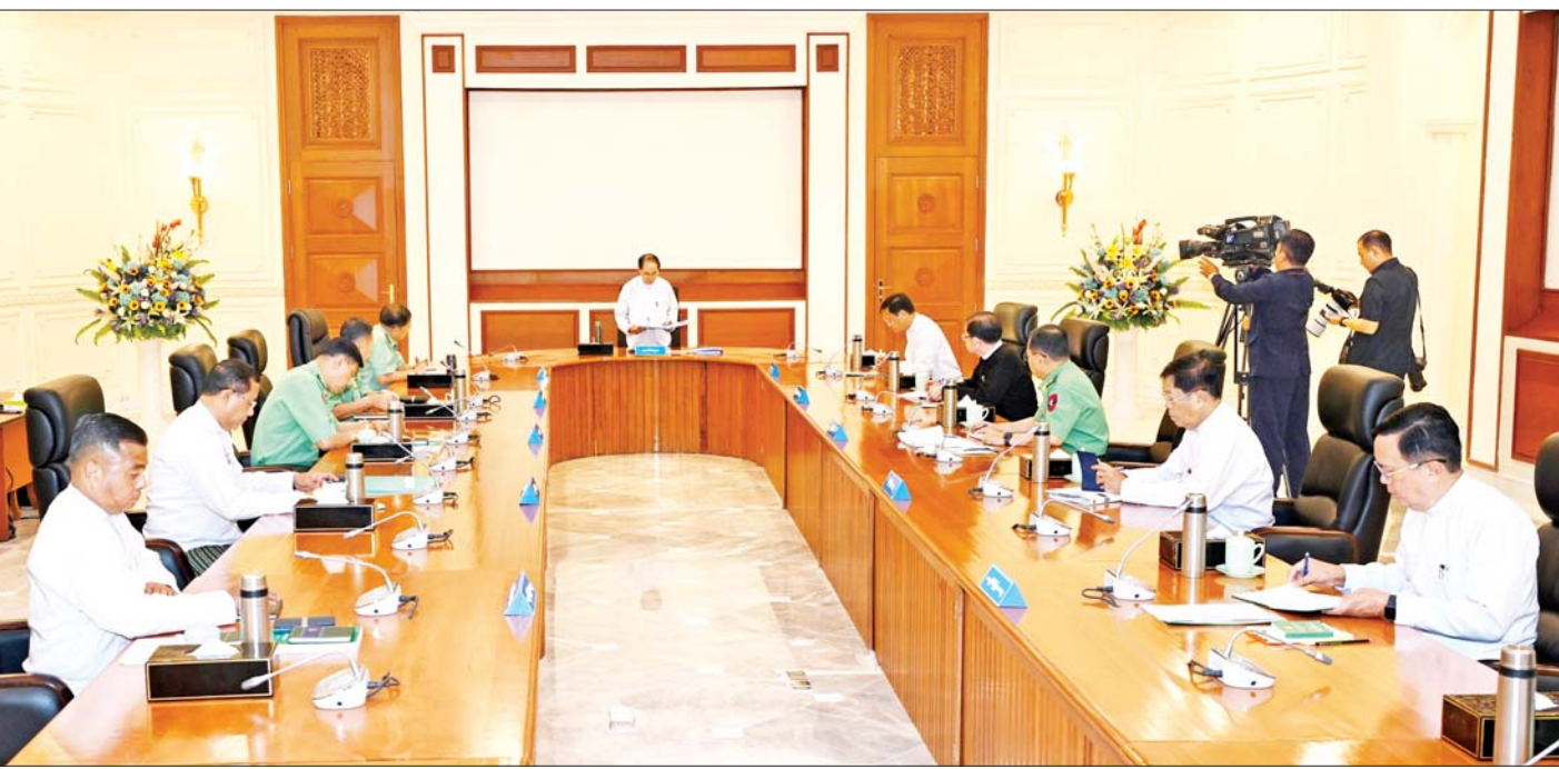
ပြည်ထောင်စုသမ္မတမြန်မာနိုင်ငံတော် အမျိုးသားကာကွယ်ရေးနှင့် လုံခြုံရေးကောင်စီအစည်းအဝေး(၂/၂၀၂၃)ကျင်းပစဉ်။

အချို့သောအကြမ်းဖက်မှုအားပေး ပြည်ပဝင်ရောက်စွက်ဖက်မှု၊ PDF အမည်ခံ အကြမ်းဖက်အဖွဲ့များနှင့် အချို့သော EAO များ၏ အကြမ်းဖက်လုပ်ရပ်များကြောင့် အကြမ်းဖက်တိုက်ခိုက်ခံရမှုများ ရှိနေဆဲပင်ဖြစ်ပါကြောင်း၊ အကြမ်းဖက်သမားများ၏ သတ်ဖြတ်မှုများကြောင့် ၂၀၂၃ ခုနှစ် ဖေဖော်ဝါရီ ၁ ရက်မှ ဇူလိုင် ၃၀ ရက်အထိ ရဟန်းသံဃာနှင့် သီလရှင် လေးပါး၊ အပြစ်မဲ့ပြည်သူများသေဆုံးမှု ၇၇၂ ဦးနှင့် နိုင်ငံ့ဝန်ထမ်း ၂၈ ဦး သေဆုံးခဲ့ရပါကြောင်း၊ ထို့ပြင် အကြမ်းဖက်ဖျက်ဆီးမှုများကြောင့် ကျန်းမာရေးဆိုင်ရာအဆောက်အအုံ တစ်လုံး၊ ဘာသာရေးဆိုင်ရာအဆောက်အအုံ ၁၁ လုံး၊ လူနေအဆောက်အအုံ ၇၆ လုံး၊ လမ်း၊ တံတားနှင့် တိုးဂိတ်အဆောက်အအုံ စုစုပေါင်း ၉၄ ခု လျှပ်စစ်နှင့် ဆက်သွယ်ရေးတာဝါတိုင် ၂၆ ခု အပါအဝင် အခြားအဆောက်အအုံများ ပျက်စီးဆုံးရှုံးခဲ့ရပါကြောင်း။ မိမိတို့အနေဖြင့် နိုင်ငံသူ၊ နိုင်ငံသားများ၏ ပညာရည်မြင့်မားရေးကို အထူးအလေးထား