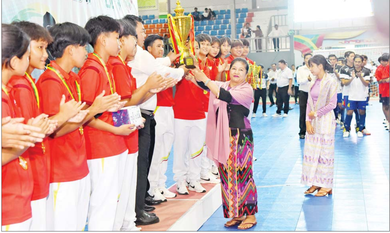
နိုင်ငံတော်စီမံအုပ်ချုပ်ရေးကောင်စီဝင် ဒေါ်ဒွေဘူက အမျိုးသမီးဖူဆယ်ပြိုင်ပွဲတွင် ပထမဆုရရှိသည့် ရှမ်းပြည်နယ်အသင်းကို တံခွန်စိုက်ဆုပေးလား ပေးအပ်ချီးမြှင့်စဉ်။

အမျိုးသား ဖူဆယ်ပြိုင်ပွဲတွင် တတိယဆုရရှိသည့် ရန်ကုန်တိုင်း ဒေသကြီးအသင်း၊ နိုင်ငံတော်စီမံ