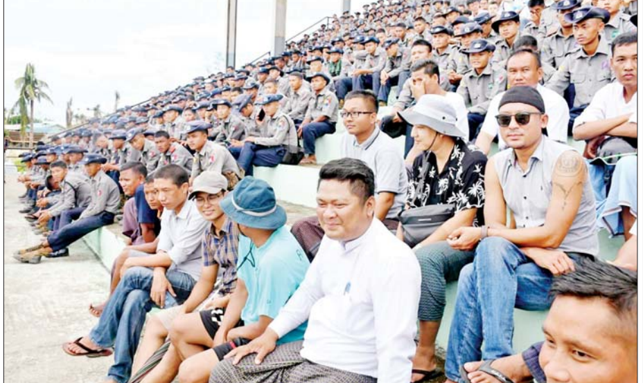
ဘောလုံးပွဲသို့ လာရောက်အားပေးကြည့်ရှုကြသော ပရိသတ်နှင့် ဌာနဆိုင်ရာဝန်ထမ်းများကို တွေ့ရစဉ်။