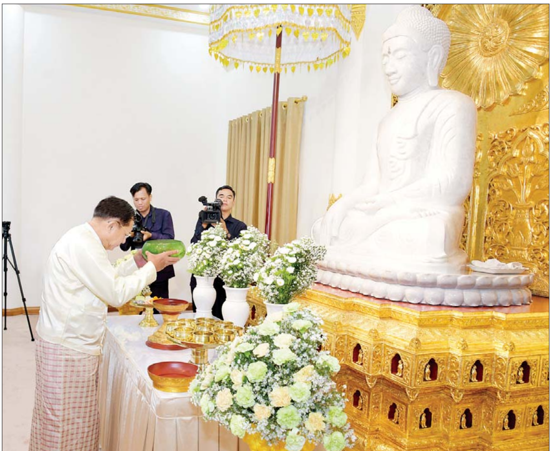
ဦးဆောင်ဘုရားဒါယကာ နိုင်ငံတော်စီမံအုပ်ချုပ်ရေးကောင်စီဥက္ကဋ္ဌ နိုင်ငံတော်ဝန်ကြီးချုပ် ဗိုလ်ချုပ်မှူးကြီးမင်းအောင်လှိုင် မာရဝိဇယကျောင်းဆောင်တော်အတွင်းရှိ ဗုဒ္ဓရုပ်ပွားတော်မြတ်အား မြသပိတ်ဆွမ်းတော်၊ သစ်သီးနှင့် ပန်း၊ ရေချမ်းများ ကပ်လှူပူဇော်စဉ်။

အကျဉ်းတို့ကို တင်ပြသည်။ ယင်းနောက် အခမ်းအနားကို “နမော တဿ” သုံးကြိမ်ရွတ်ဆို ဘုရားရှိခိုး၍ ဖွင့်လှစ်ပြီး ဦးဆောင်ဘုရားဒါယကာ နိုင်ငံ တော်စီမံအုပ်ချုပ်ရေးကောင်စီ ဥက္ကဋ္ဌ နိုင်ငံတော်ဝန်ကြီးချုပ်နှင့် ဇနီး၊ အခမ်း အနား တက်ရောက်လာကြသူများက ပါဠိဆရာတော်ကြီးထံမှ ငါးပါးသီလံယူ ဆောက်တည်ကြသည်။ နာယူကြည်ညို ထို့နောက် သံဃာတော်အရှင်သူမြတ် များ ရွတ်ပွားသရဇ္ဈာယ်တော်မူကြသည့် မင်္ဂလာသုတ်၊ မေတ္တသုတ် ပရိတ်တရား တော်များကို နာယူကြည်ညိုကြသည်။ ယင်းနောက် အခမ်းအနားမှူးက ကျောင်းအပ်စာတမ်းလွှာကို ဖတ်ကြား လျှောက်ထားပြီး ဦးဆောင်ဘုရားဒါယကာ နိုင်ငံတော်စီမံအုပ်ချုပ်ရေးကောင်စီ ဥက္ကဋ္ဌ နိုင်ငံတော်ဝန်ကြီးချုပ်နှင့် ဇနီး၊ မိသားစု များက ကျောင်းထိုင်ဆရာတော် အဂ္ဂ မဟာပဏ္ဍိတ ဘဒ္ဒန္တနေမိန္ဒထံ ကျောင်း အပ်စာတမ်းလွှာကို ဆက်ကပ်ပြီး သာဓု အနုမောဒနာ ခေါ်ဆိုကြသည်။ ထို့နောက် ဦးဆောင် ဘုရား ဒါယကာ နိုင်ငံတော်စီမံအုပ်ချုပ်ရေး ကောင်စီဥက္ကဋ္ဌ နိုင်ငံတော်ဝန်ကြီးချုပ်နှင့် ဇနီးတို့က ပါဠိဆရာတော်ဘုရားကြီးနှင့် စာမျက်နှာ ၄ သို့ □