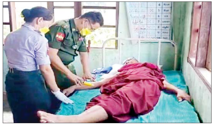
သစ်တောနဲ့သစ်ပင် ချစ်ခင်တဲ့လူမျိုး သစ်ပင်ကိုနှစ်စဉ်စိုက် ရွှေတိုက်ကိုစိုး

နေပြည်တော် ဇူလိုင် ၃၀ ရခိုင်ပြည်နယ် ဘူးသီးတောင်မြို့နယ် ကင်းတောင်ကျေးရွာအုပ်စု ဒုံသိမ် ကျေးရွာ ဘုန်းတော်ကြီးကျောင်း၌ ယနေ့တွင် အနောက်ပိုင်းတိုင်းစစ်ဌာနချုပ်၊ နယ်မြေခံဆေးကုသရေးအဖွဲ့က အဆိုပါကျေးရွာနှင့် ပတ်ဝန်းကျင်ကျေးရွာများမှ ဒေသခံပြည်သူ ၃၀၈ ဦးတို့ကို ကျန်းမာရေးစောင့်ရှောက်မှုလုပ်ငန်းများ ဆောင်ရွက် ပေးသည်။ ထိုသို့ဆောင်ရွက်ပေးရာတွင် ဆေးကုသရေးအဖွဲ့က မျက်စိရောဂါ၊ အရေပြား ရောဂါ၊ နား၊ နှာခေါင်း၊ လည်ချောင်းရောဂါ၊ သားဖွားမီးယပ်ရောဂါ၊ သွားနှင့်ခံတွင်း ရောဂါ၊ ကလေးရောဂါ၊ အထွေထွေရောဂါတို့နှင့်ပတ်သက်၍ လိုအပ်သည့် ကျန်းမာရေးစောင့်ရှောက်မှုလုပ်ငန်းများ ဆောင်ရွက်ပေးသည်။ ယင်းသို့ ဆောင်ရွက်ပေးနေမှုများကို နယ်မြေခံတပ်မှ တာဝန်ရှိသူများက သွားရောက်ကြည့်ရှုအားပေးပြီး အာဟာရပြည့်စုံစားသောက်ဖွယ်ရာများ ပေးအပ်ကာ ကျေးရွာဘုန်းတော်ကြီးကျောင်း ဆရာတော်အား ဖူးမြော်ကြည်ညိုပြီး