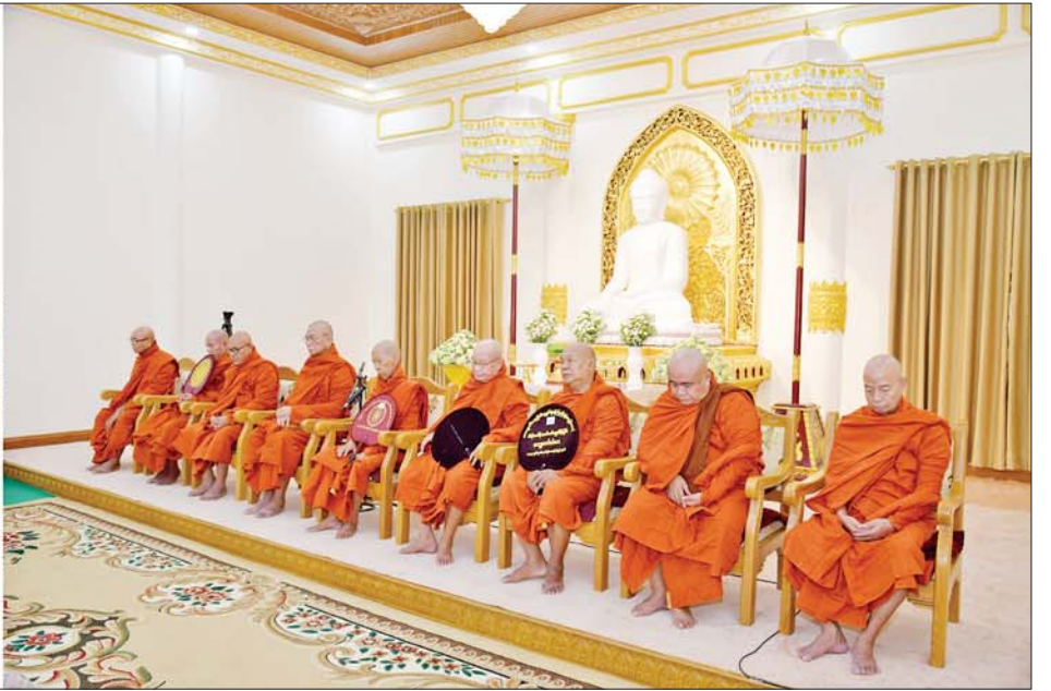
ဦးဆောင်ဘုရားဒါယကာ နိုင်ငံတော်စီမံအုပ်ချုပ်ရေးကောင်စီဥက္ကဋ္ဌ နိုင်ငံတော်ဝန်ကြီးချုပ် ဗိုလ်ချုပ်မှူးကြီးမင်းအောင်လှိုင်နှင့် ဇနီး ဒေါ်ကြူကြူလှ၊ အခမ်းအနား တက်ရောက်လာကြသူများက သံဃာတော်အရှင်သူမြတ်များ ရွတ်ပွားသရဇ္ဈာယ်တော်မူကြသည့် မင်္ဂလာသုတ်၊ မေတ္တသုတ် ပရိတ်တရားတော်များကို နာယူကြည်ညိုကြစဉ်။

□ ရှေးဦးမှ ဦးဆောင်ဘုရားဒါယကာ နိုင်ငံတော် စီမံအုပ်ချုပ်ရေးကောင်စီဥက္ကဋ္ဌ နိုင်ငံတော် ဝန်ကြီးချုပ် ဗိုလ်ချုပ်မှူးကြီး မင်းအောင်လှိုင်နှင့် ဇနီး ဒေါ်ကြူကြူလှနှင့် မိသားစုဝင်များ၊ ကောင်စီဒုတိယဥက္ကဋ္ဌ ဒုတိယဝန်ကြီးချုပ် ဒုတိယဗိုလ်ချုပ်မှူးကြီး စိုးဝင်းနှင့် ဇနီး ဒေါ်သန်းသန်းနွယ်၊ ညိုနှိုင်းကွပ်ကဲရေးမှူး (ကြည်း၊ ရေ လေ) ဗိုလ်ချုပ်ကြီး မောင်မောင်အေးနှင့် ဇနီး၊ ပြည်ထောင်စုဝန်ကြီးများနှင့် ဇနီးများ၊ ကာကွယ်ရေးဦးစီးချုပ်ရုံးမှ အဆင့်မြင့် တပ်မတော်အရာရှိကြီးများနှင့် ဇနီးများ၊ နေပြည်တော်ကောင်စီဥက္ကဋ္ဌ နေပြည်တော် တိုင်းစစ်ဌာနချုပ်တိုင်းမှူးနှင့် တာဝန် ရှိသူများ တက်ရောက်ပူဇော်ကြသည်။