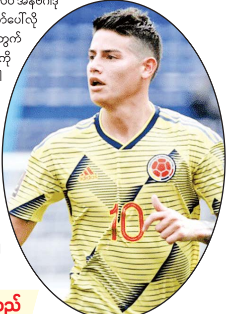
ဌေးကြယ် - ရေးသားသည်

ကိုလံဘီယာတိုက်စစ်မှူး ဂျိမ်းစ်ရီဒရိုဂက်စ်ဟာ ဘရာဇီးကလပ် ဆော်ပေါလိုအသင်းသို့ နှစ်နှစ်သက်တမ်းရှိစာချုပ်တစ်ရပ်ချုပ်ဆိုကာ ပြောင်းရွှေ့ခဲ့တယ်လို့ ဘရာဇီးစီးရီးအေကလပ် ဆော်ပေါလိုအသင်းက ပြောကြားခဲ့ပါတယ်။ အသက် ၃၂ နှစ်အရွယ်ရှိ တိုက်စစ်မှူး ဂျိမ်းစ်ရီဒရိုဂက်စ်ဟာ ဂရိကလပ် အိုလံပီယာ ကိုလံဘီယာအသင်းနဲ့ ဧပြီလအတွင်းက လမ်းခွဲခဲ့ပြီးနောက် လက်ရှိအချိန်မှာ ဆော်ပေါလိုအသင်းဆီကို အလွတ်ပြောင်းရွှေ့ကြေးနဲ့ ပြောင်းရွှေ့ခဲ့တာဖြစ်ပါတယ်။ တိုက်စစ်မှူး ဂျိမ်းစ်ရီဒရိုဂက်စ်ဟာ ပရော်ဖက်ရှင်နယ်ကစားသမားဘဝကို ၂၀၀၆ ခုနှစ်အတွင်းက ကိုလံဘီယာကလပ် အန်ဗီဂါဒိုအသင်းနဲ့အတူ စတင်ခဲ့ပြီး ဆော်ပေါလိုအသင်းဟာ ဂျိမ်းစ်ရီဒရိုဂက်စ်အတွက် ၁၀ သင်းမြောက်ကလပ်အသင်းကို ပြောင်းရွှေ့ခြင်းလည်း ဖြစ်ပါတယ်။ တိုက်စစ်မှူး ဂျိမ်းစ်ရီဒရိုဂက်စ်ဟာ ကစားသမားဘဝ တစ်လျှောက်မှာ ရီးယဲလ်မက်ဒရစ်အသင်း၊ ဘိုင်ယန်မြူးနစ်အသင်း၊ အဲဗာတန်အသင်း၊ မိုနာကိုအသင်း၊ ပေါ်တိုအသင်း စတဲ့အသင်းတွေမှာလည်း ပါဝင်ကစားခဲ့သူ ဖြစ်ပါတယ်။