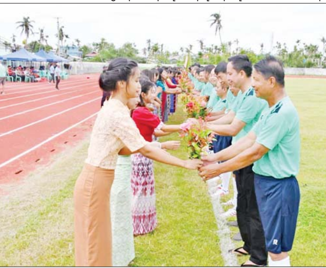
နှစ်ဖက်ဘောလုံးအားကစားသမားများအား စစ်တွေတက္ကသိုလ် ကျောင်းသူလေးများက ဂုဏ်ပြုပန်းစည်းပေးအပ်စဉ်။