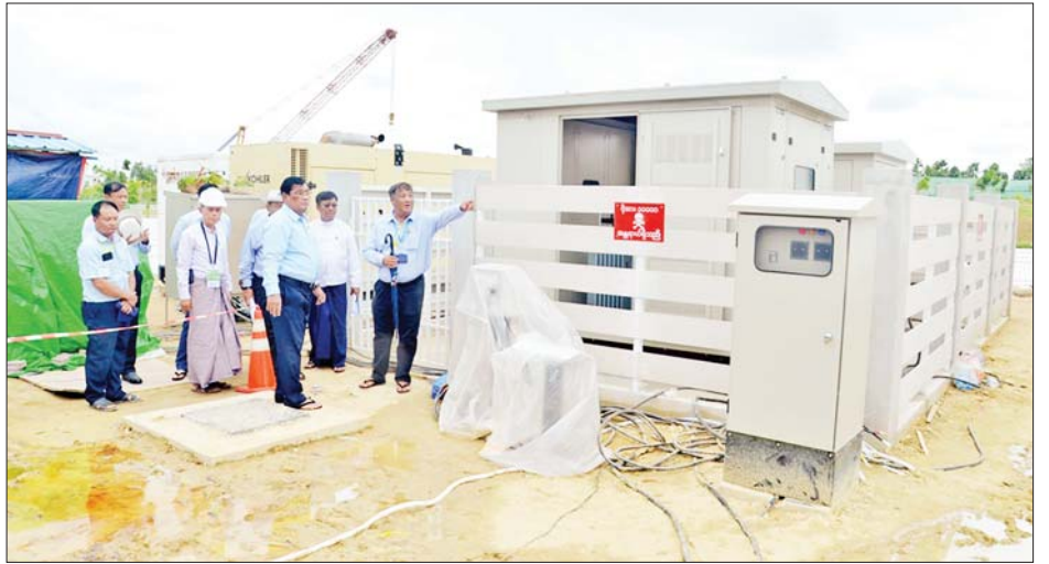
ခွဲရုံများနှင့် အရန်မီးစက်များ နေရာချထားမှုကို ဖြည့်ဆည်းဆောင်ရွက်ပေးခဲ့ကြောင်း သိရသည်။ လိုက်လံကြည့်ရှုစစ်ဆေးပြီး လိုအပ်သည်များ သတင်းစဉ်

ယင်းနောက် ပြည်ထောင်စုဝန်ကြီးနှင့်အဖွဲ့သည် မာရဝိဇယ ဗုဒ္ဓရုပ်ပွားတော်မြတ်ကြီး ဗုဒ္ဓါဘိသေက အနေကဇာတင်လှူခြင်း အခမ်းအနားများ ကျင်းပပြုလုပ်မည့်နေရာ၊ သံဃာတော်များ သီတင်းသုံးမည့် နေရာ၊ ဓာတ်အားပို့လွှတ်ဖြန့်ဖြူးပေးမည့် ဓာတ်အား