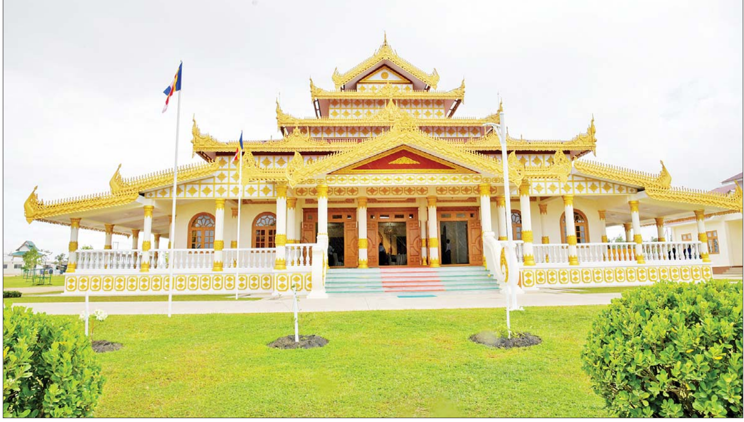
မာရဝိဇယဗုဒ္ဓဥယျာဉ်ဝတ္ထုကံတော်အတွင်းရှိ မာရဝိဇယကျောင်းတော်ကို တွေ့ရစဉ်။

မာရဝိဇယကျောင်းတော် အတွင်း ဘုရားခန်း၊ စာချ၊ ဝတ်ပြုခြင်းများ ပြုလုပ်ရန် နေရာ၊ အိပ်ခန်းများ၊ စာကြည့်တိုက်နှင့် စာဖတ် ခန်းများ၊ ဆွမ်းစားခန်း၊ သန့်စင်ခန်းများ၊ ဆွမ်းချက် ဆောင်နှင့် ကပ္ပိယဆောင် များကို စနစ်တကျဖြင့် ပြည့်စုံစွာ ထည့်သွင်းတည် ဆောက် ထားရှိသဖြင့် သံဃာတော်များ သပ္ပာယ် မျှတစွာဖြင့် သီတင်းသုံး နိုင်မည်