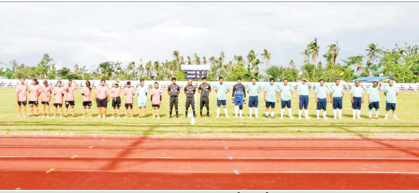
ဘောလုံးအားကစားသမားများကို တွေ့ရစဉ်။

နိုင်ငံတော်အကြီးအကဲ၏ လမ်းညွှန်ချက်နှင့် အညီ မုန်တိုင်းသင့်ရခိုင်ဒေသ၏ ပညာရေး၊ ကျန်းမာရေးလုပ်ငန်းများကို အရှိန်အဟုန်ဖြင့် ပြန်လည်မြှင့်တင်ဆောင်ရွက်ပေးရန် လိုသကဲ့သို့ ရခိုင်ပြည်နယ်အတွင်း မှီတင်းနေထိုင်ကြသော လူငယ်လူရွယ်များ၏ စိတ်ဓာတ်၊ အတွေးအခေါ်၊ ခံယူချက်များ မြင့်မားတိုးတက်လာစေရေးအတွက် အားကစားကဏ္ဍကိုလည်း ပိုမိုဖွံ့ဖြိုးတိုးတက်အောင် ဆောင်ရွက်ပေးရန် လိုပါသည်။ ယနေ့ အားကစားပွဲကို ဝန်ကြီးချုပ် ဦးထိန်လင်း တက်ရောက် အမှာစကားပြောကြားရာ၌ မိုခါမုန်တိုင်း တိုက်ခတ်မှုကြောင့် ပြည်နယ်အတွင်း အားကစားကွင်းများ၊ အားကစားရုံများ ပျက်စီးခဲ့၍ အားကစားပြိုင်ပွဲများ ရပ်တန့်သွားခဲ့ကြောင်း၊ တတ်နိုင်သမျှ အမြန်ဆုံး ပြန်လည်ပြုပြင်ပေးနေကြောင်း၊ ယနေ့ ကျင်းပသည့်ဘောလုံးပြိုင်ပွဲမှ အစပြု၍ နောက်ပိုင်းတွင် အားကစားပြိုင်ပွဲများကို စဉ်ဆက်မပြတ် ကျင်းပပြုလုပ်ပေးသွားမည်ဖြစ်ကြောင်း၊ အားကစားကို မြှင့်တင်ခြင်းသည် မိမိဒေသ၊ မိမိနိုင်ငံတော်ကို မြှင့်တင်ခြင်းဖြစ်ကြောင်း၊ ရခိုင်ပြည်နယ်အနေဖြင့် နိုင်ငံ့ဂုဏ်ဆောင် မြန်မာ့လက်ရွေးစင် အားကစားသမားများစွာ မွေးထုတ်ပေးခဲ့သည့် အစဉ်အလာ ရှိကြောင်း၊ ဖိလစ်ပိုင်နိုင်ငံ၌ ကျင်းပခဲ့သည့် (၃၂)