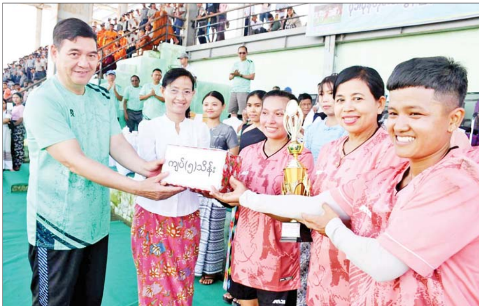
ရခိုင်ပြည်နယ်ဝန်ကြီးချုပ် ဦးထိန်လင်းနှင့်ဇနီးတို့က စစ်တွေတက္ကသိုလ်ကျောင်းသူများအသင်းအား ဆုဖလားနှင့် ဂုဏ်ပြုချေငွေများ ပေးအပ်ချီးမြှင့်စဉ်။

ဖိတ်စာလေးတွေလိုက်ရကတည်းက ကျွန်တော် စိတ်အလျဉ်သည် စစ်တွေမြို့မှ ခေတ္တခဏ ခွာတုံ ပြုကာ ၁၉၉၆ ခုနှစ်တွင် ကျွန်တော်နေထိုင်ခဲ့ဖူးသည့် ရှမ်းပြည်နယ်(တောင်ပိုင်း) မြန်မာ-ထိုင်း နယ်စပ် အနီးရှိ ဟိုမိန်းမြို့လေးသို့ ရောက်ရှိသွားပါတော့ သည်။ နေထိုင်ခဲ့ဖူးသည်ဟု ကျွန်တော်သုံးနှုန်းလိုက်