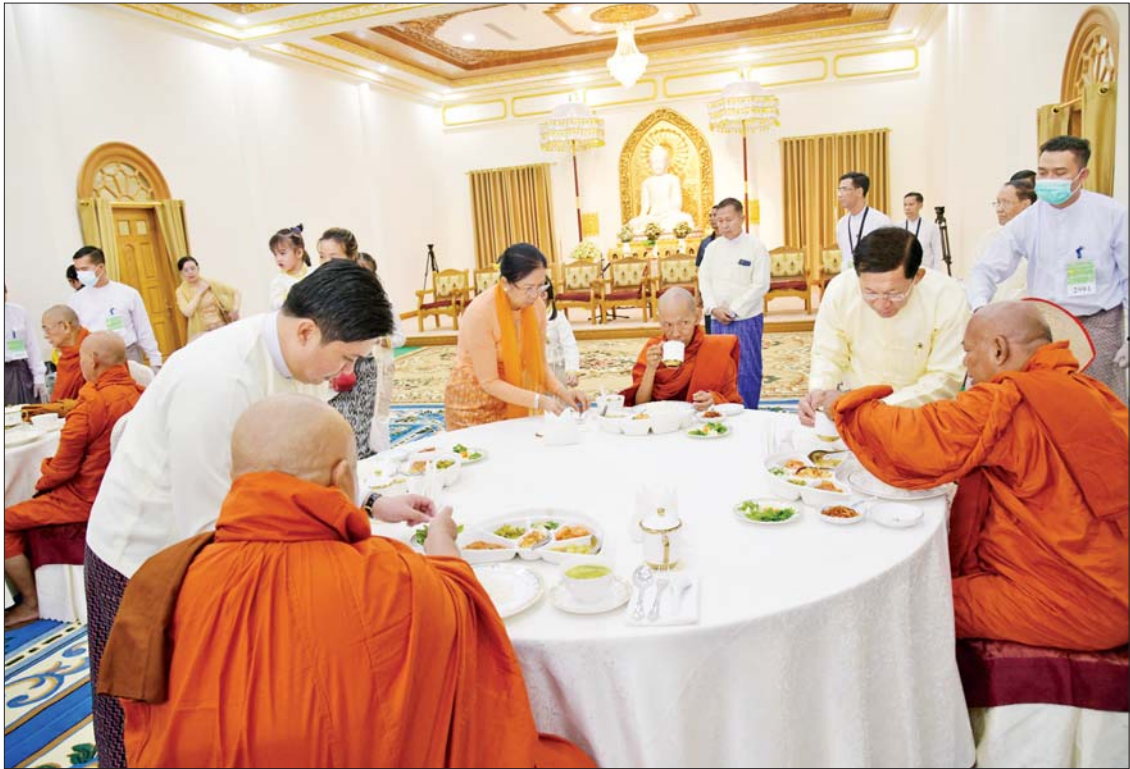
ဦးဆောင်ဘုရားဒါယကာ နိုင်ငံတော်စီမံအုပ်ချုပ်ရေးကောင်စီဥက္ကဋ္ဌ နိုင်ငံတော်ဝန်ကြီးချုပ် ဗိုလ်ချုပ်မှူးကြီး မင်းအောင်လှိုင် နှင့်ဇနီး ဒေါ်ကြူကြူလှ၊ မိသားစုဝင်များက ပျဉ်းမနားမြို့၊ ပါဠိတက္ကသိုလ်မင်္ဂလာဇေယျကျောင်းတိုက် ပဓာနနာယက အဂ္ဂမဟာပဏ္ဍိတ အဂ္ဂမဟာသဒ္ဓမ္မဇောတိကဓဇ ဘဒ္ဒန္တ ဝိမလဗုဒ္ဓိ အမှူးပြုသည့် ဆရာတော်ကြီးများအား နေ့ဆွမ်းဆက်ကပ် လှူဒါန်းစဉ်။

ဆရာတော်ကြီးအမှူးပြုသည့် ဆရာတော် ကြီးများအား နေ့ဆွမ်း ဆက်ကပ်လှူဒါန်း ကြသည်။ စုပေါင်းတည်ဆောက်လှူဒါန်း အဆိုပါ မာရဝိဇယကျောင်းတော် သည် မာရဝိဇယဗုဒ္ဓရုပ်ပွားတော်မြတ် ကြီး ဦးဆောင်ဘုရားဒါယကာ နိုင်ငံတော် စီမံအုပ်ချုပ်ရေးကောင်စီဥက္ကဋ္ဌ နိုင်ငံတော် ဝန်ကြီးချုပ်နှင့် ဇနီး ဒေါ်ကြူကြူလှတို့ အမှူးပြုသော ခုနစ်ရက်သားသမီး ဓမ္မ မိတ်ဆွေအလှူရှင်များ စုပေါင်းတည် ဆောက်လှူဒါန်းခဲ့သည့် ဘုန်းတော်ကြီး ကျောင်းဖြစ်ကြောင်း၊ အဆိုပါကျောင်းတော် အတွင်း ဘုရားခန်း၊ စာချ၊ ဝတ်ပြုခြင်းများ ပြုလုပ်ရန်နေရာ၊ အိပ်ခန်းများ၊ စာကြည့်တိုက်နှင့် စာဖတ်ခန်းများ၊ ဆွမ်း စားခန်း၊ သန့်စင်ခန်းများ၊ ဆွမ်းချက်ဆောင် နှင့် ကပ္ပိယဆောင်များကို စနစ်တကျဖြင့် ပြည့်စုံစွာ ထည့်သွင်းတည်ဆောက်ထား ရှိသဖြင့် သံဃာတော်များ သပ္ပာယ်မျှတစွာ ဖြင့် သီတင်းသုံးနိုင်မည်ဖြစ်ကြောင်းနှင့် ကျောင်းလွတ်ပူဇော် မင်္ဂလာအခမ်းအနား ကို ယနေ့တွင် အောင်မြင်စွာ ကျင်းပ ပြုလုပ်ခဲ့ခြင်းဖြစ်ကြောင်း သိရသည်။ သတင်းစဉ်