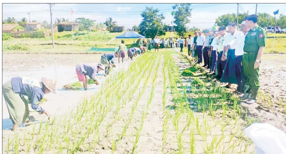
စာစောင်များ ဖြန့်ဝေပေးသည်။ ယင်းနောက် ကွန်တိုင်းကျေးရွာ၌ စုပေါင်းကောက်စိုက်နေမှုနှင့် စပါးစိုက်ပျိုးပြီးစီးမှုအခြေအနေများအား လိုက်လံကြည့်ရှုအားပေးပြီး နန်းရာကုန်းကျေးရွာရှိ ပုဂ္ဂလိကပိုင် တစ်ပိုင်

နေပြည်တော် ဇူလိုင် ၃၀ ဆိုင်ကလုနီးမုန်တိုင်း(မိုခါ) တိုက်ခတ်မှုကြောင့် ထိခိုက်ပျက်စီးခဲ့သည့် ဒေသများတွင် ပြန်လည်ထူထောင်ရေးလုပ်ငန်းများ ဆောင်ရွက်နိုင်ရန် ဒေသအလိုက် တပ်မတော်အရာရှိကြီးများကို တာဝန်ပေးအပ်ထားရှိရာ ယနေ့တွင် ရခိုင်ပြည်နယ် ဘူးသီးတောင်မြို့၌ ရောက်ရှိနေသော ကာကွယ်ရေးဦးစီးချုပ်ရုံး(ကြည်း)မှ ဒုတိယဗိုလ်ချုပ်ကြီး အေးဝင်းသည် ဌာနဆိုင်ရာတာဝန်ရှိသူများနှင့်အတူ နန်းရာကုန်းကျေးရွာအုပ်စု ကုတိုင်းဆိပ်ကျေးရွာတွင် ပြုလုပ်သည့် မိုးစပါးမျိုးစေ့ထုတ်စိုက်ကွက်၌ စုပေါင်းကောက်စိုက်ခြင်း၊ တီစူပါမြေဩဇာမြေခံကြပ်ပက်ခြင်းနှင့် စုပေါင်းထွန်ယက်နေမှုများကို ကြည့်ရှုအားပေးပြီး တောင်သူများအား တီစူပါမြေဩဇာအိတ်များ အခမဲ့ထောက်ပံ့ပေးအပ်ကာ စိုက်ပျိုးရေးပညာပေး လက်ကမ်း