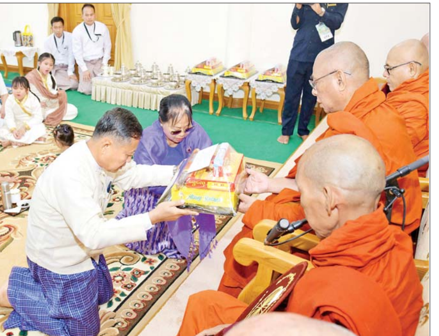
ဦးဆောင်ဘုရားဒါယကာ နိုင်ငံတော်စီမံအုပ်ချုပ်ရေးကောင်စီဥက္ကဋ္ဌ နိုင်ငံတော်ဝန်ကြီးချုပ် ဗိုလ်ချုပ်မှူးကြီး မင်းအောင်လှိုင်နှင့် ဇနီး ဒေါ်ကြူကြူလှ၊ မိသားစုများက ကျောင်းထိုင်ဆရာတော် အဂ္ဂမဟာပဏ္ဍိတ ဘဒ္ဒန္တနေမိန္ဒ ထံ ကျောင်းအပ်စာတမ်းလွှာကို ဆက်ကပ်စဉ်။