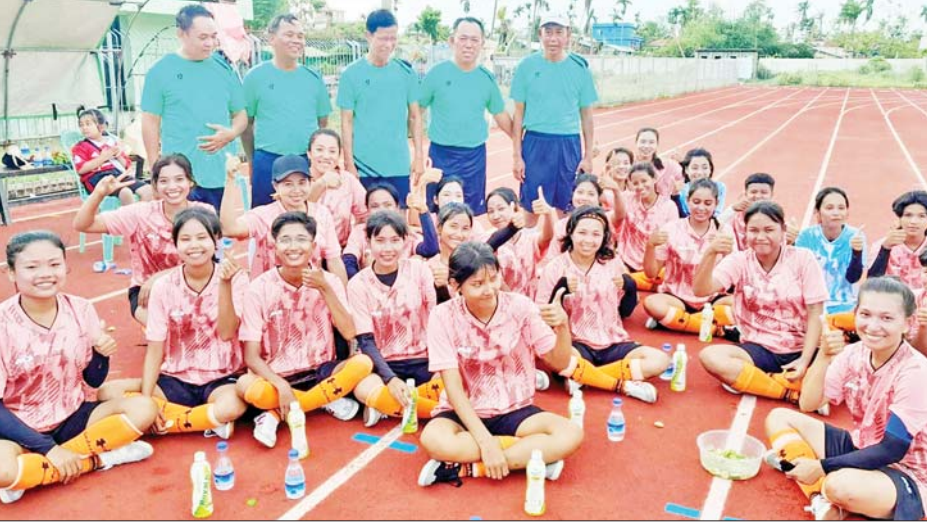
စစ်တွေတက္ကသိုလ် ကျောင်းသူအားကစားသမားများနှင့် စာရေးသူတို့အဖွဲ့ကို တွေ့ရစဉ်။

မိုခါမုန်တိုင်းဒဏ်သင့် ရခိုင်ဒေသ ပြန်လည်ထူထောင်ရေးအတွက် ကြိုးပမ်းဆောင်ရွက်ချက်များ ဆောင်းပါးအမှတ်စဉ် (၆) ကို ရေးသားခဲ့စဉ်က ရခိုင်ပြည်နယ်ဇာတိဖွား နိုင်ငံ့ဂုဏ်ဆောင် ရွှေ၊ ငွေ၊ ကြေး ဆုတံဆိပ်များ ရယူပေးခဲ့ကြသော ဘောလုံး၊ ပြေးခုန်ပစ် အားကစားသမားကြီးများမှသည် ပြီးခဲ့သည့် (၃၂) ကြိမ်မြောက် ဆီးဂိမ်း၌ အမျိုးသမီးဘောလုံးပြိုင်ပွဲ ငွေတံဆိပ်ဆုရ မြန်မာ့လက်ရွေးစင်ဘောလုံးသမား နော်ထက်ထက်ဝေအထိ ဂုဏ်ပြုဖော်ပြပေးခဲ့ပါသည်။ ပြည်နယ်အစိုးရအဖွဲ့၏ အားပေးချီးမြှောက်မှု၊ ရက္ခိုတစ်စိတ်ထားဖြင့် အားကစားသမားများ၏ ကြိုးစားအားထုတ်မှုတို့ကြောင့် ပို၍ပို၍လည်း နိုင်ငံ့ဂုဏ်ဆောင် အားကစားသမားများ ပေါ်ထွက်လာပါဦးမည်။ ပေါ်ထွက်မည်ဟုလည်း စာရေးသူအနေဖြင့် အလေးအနက် ယုံကြည်မိပါသည်။ ရခိုင်ပြည်နယ် အားကစားအစဉ်ထာဝရ မြင့်မားတိုးတက်ပါစေ။ ။