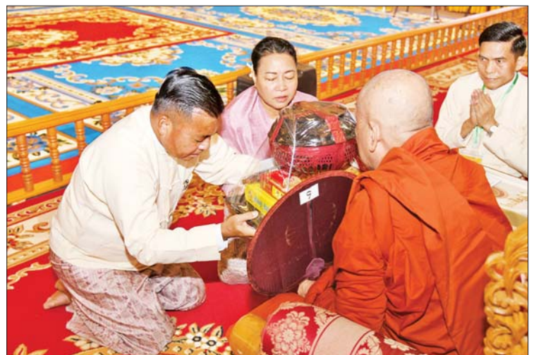
နိုင်ငံတော်စီမံအုပ်ချုပ်ရေးကောင်စီ တွဲဖက်အတွင်းရေးမှူး ဒုတိယဗိုလ်ချုပ်ကြီး ရဲဝင်းဦးနှင့်ဇနီးတို့က ဆရာတော်ထံ ဝါဆိုသင်္ကန်းနှင့် လှူဖွယ်ပစ္စည်းများ ဆက်ကပ်လှူဒါန်းစဉ်။