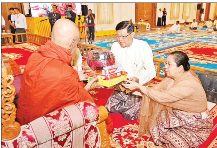
နိုင်ငံတော်စီမံအုပ်ချုပ်ရေးကောင်စီအဖွဲ့ဝင် ဒုတိယဝန်ကြီးချုပ်နှင့် ပြည်ထောင်စုဝန်ကြီး ဗိုလ်ချုပ်ကြီး မြထွန်းဦးနှင့်ဇနီးတို့က ဆရာတော်ထံ ဝါဆိုသင်္ကန်းနှင့် လှူဖွယ်ပစ္စည်းများ ဆက်ကပ်လှူဒါန်းစဉ်။