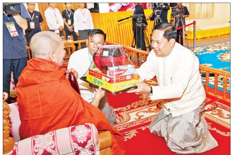
နိုင်ငံတော်စီမံအုပ်ချုပ်ရေးကောင်စီအဖွဲ့ဝင် ဒုတိယဗိုလ်ချုပ်ကြီး မိုးမြင့်ထွန်းက ဆရာတော်ထံ ဝါဆိုသင်္ကန်းနှင့် လှူဖွယ်ပစ္စည်းများ ဆက်ကပ်လှူဒါန်းစဉ်။