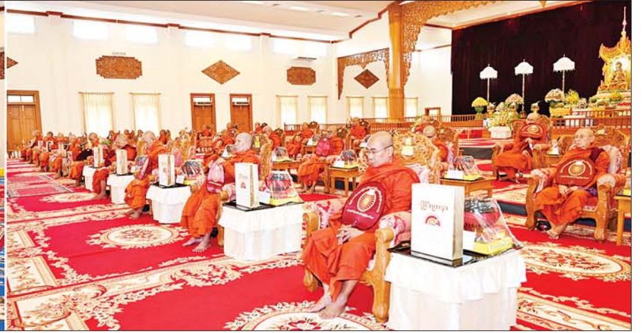
နိုင်ငံတော်စီမံအုပ်ချုပ်ရေးကောင်စီဥက္ကဋ္ဌ နိုင်ငံတော်ဝန်ကြီးချုပ် ဗိုလ်ချုပ်မှူးကြီး မင်းအောင်လှိုင်နှင့် ဇနီး ဒေါ်ကြူကြူလှ၊ အခမ်းအနားတက်ရောက်လာကြသူများက သန်လျင်မြို့ မင်းကျောင်းပထမပြန်စာသင်တိုက် ပဓာနနာယက အဂ္ဂမဟာပဏ္ဍိတ အဂ္ဂမဟာသဒ္ဓမ္မဇောတိကဓဇ ဒေါက်တာဘဒ္ဒန္တစန္ဒိမာဘိဝံသထံမှ ကိုးပါးသီလခံယူဆောင်တည်ကြစဉ်။