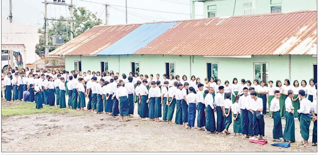
ဝေဠုဝန်ဘုန်းတော်ကြီးသင်ပညာရေးကျောင်းမှ ကျောင်းသား ကျောင်းသူလေးများ။