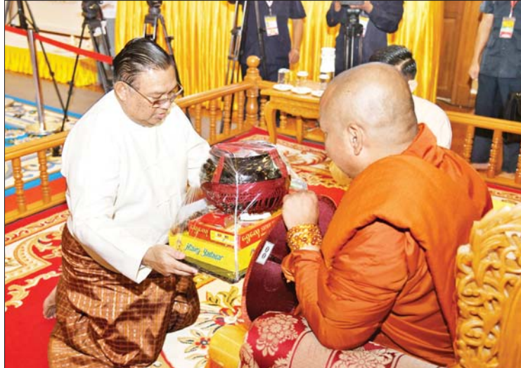
နိုင်ငံတော်စီမံအုပ်ချုပ်ရေးကောင်စီအဖွဲ့ဝင် ဦးဝဏ္ဏမောင်လွင်က ဆရာတော် ထံ ဝါဆိုသင်္ကန်းနှင့် လှူဖွယ်ပစ္စည်းများ ဆက်ကပ်လှူဒါန်းစဉ်။

အခမ်းအနားအပြီးတွင် နိုင်ငံတော် စီမံအုပ်ချုပ်ရေးကောင်စီဥက္ကဋ္ဌ နိုင်ငံတော် ဝန်ကြီးချုပ်နှင့်ဇနီး၊ အခမ်းအနား တက်ရောက်လာကြသူများသည် ဆရာ တော်၊ သံဃာတော်များအား နေ့ဆွမ်း ဆက်ကပ်လှူဒါန်းခဲ့ကြောင်း သိရသည်။ သတင်းစဉ်