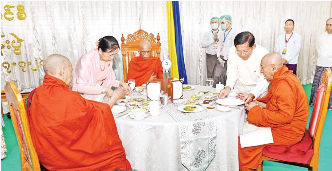
နိုင်ငံတော်စီမံအုပ်ချုပ်ရေးကောင်စီဥက္ကဋ္ဌ နိုင်ငံတော်ဝန်ကြီးချုပ် ဗိုလ်ချုပ်မှူးကြီး မင်းအောင်လှိုင်နှင့် ဇနီး ဒေါ်ကြူကြူလှ တို့က သန်လျင်မြို့ မင်းကျောင်းပထမပြန်စာသင်တိုက်ပဓာနနာယက အဂ္ဂမဟာပဏ္ဍိတ အဂ္ဂမဟာသဒ္ဓမ္မဇောတိကဓဇ ဒေါက်တာ တာဒန္တစန္ဒိမာဘိဝံသ အမှူးပြုသည့် ဆရာတော် သံဃာတော်များအား နေ့ဆွမ်းဆက်ကပ်လှူဒါန်းစဉ်။