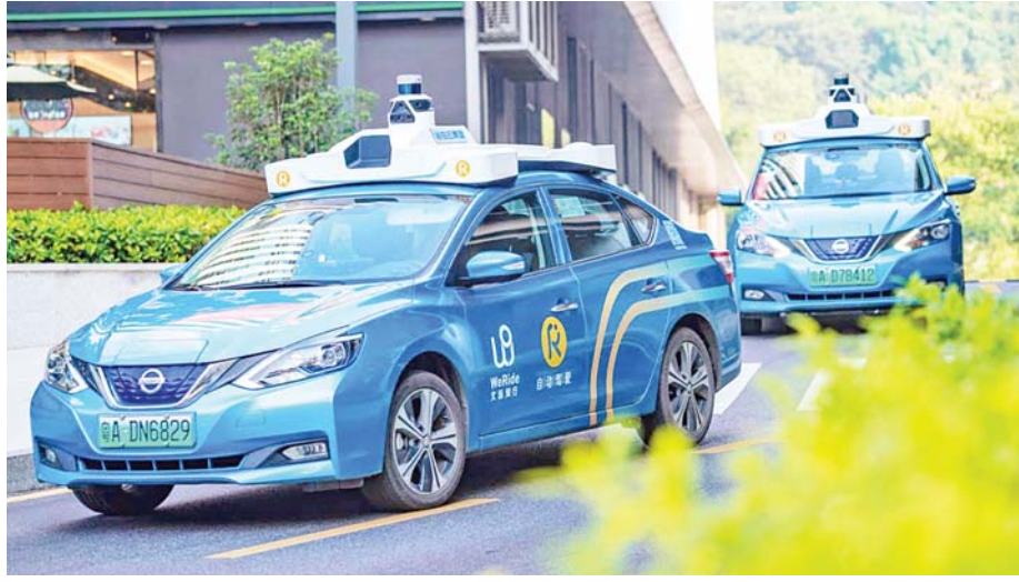
အလိုအလျောက်မောင်းနှင်နိုင်သည့် Nissan Taxi များ။

ထွန်းသစ်စက်မှုလုပ်ငန်းဆိုသည်မှာ ဖွံ့ဖြိုးတိုးတက်မှု၏ အစပိုင်းအဆင့်တွင်ရှိသော ထုတ်ကုန်အသစ် သို့မဟုတ် စိတ်ကူးသစ်တစ်ခုဖြင့် ဖွဲ့စည်းတည်ထောင်ထားသော စက်မှုလုပ်ငန်းစုတစ်ခုဖြစ်သည်။ ထွန်းသစ်စက်မှုလုပ်ငန်းတစ်ခုတွင် ပုံမှန်အားဖြင့် ကုမ္ပဏီအနည်းငယ်သာ ပါဝင်ပြီး နည်းပညာအသစ်များကို အဓိကထားလေ့ရှိသည်။ နည်းပညာတစ်ခုသည် တစ်စုံတစ်ခုအကြံပြုနေချိန် ၎င်းနည်းပညာဟောင်းနေရာကို အစားထိုးမည့်အခါတွင် ထွန်းသစ်စက်မှုလုပ်ငန်းများ ပေါ်ပေါက်လာပါသည်။