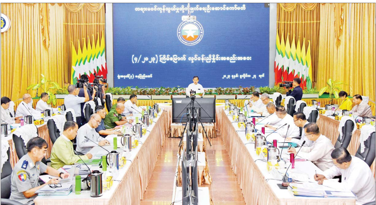
နိုင်ငံတော်စီမံအုပ်ချုပ်ရေးကောင်စီဒုတိယဥက္ကဋ္ဌ ဒုတိယဝန်ကြီးချုပ် ဒုတိယဗိုလ်ချုပ်မှူးကြီးစိုးဝင်း တရားမဝင်ကုန်သွယ်မှုတိုက်ဖျက်ရေးဦးဆောင်ကော်မတီ လုပ်ငန်း ညှိနှိုင်းအစည်းအဝေး(၄/၂၀၂၃)တွင် အမှာစကား ပြောကြားစဉ်။

တက်ရောက် အစည်းအဝေးသို့ ပြည်ထောင်စု ဝန်ကြီးများ ဖြစ်ကြသည့် ဒုတိယ ဗိုလ်ချုပ်ကြီး စိုးထွဋ်၊ ဦးဝင်းရှိန်နှင့် ဦးအောင်နိုင်ဦး၊ ဒုတိယဝန်ကြီးများ၊ နေပြည်တော်ကောင်စီဝင်၊ အခွန် အယူခံ ခုံအဖွဲ့ဥက္ကဋ္ဌ၊ အမြဲတမ်း အတွင်းဝန်များ၊ ညွှန်ကြားရေးမှူး ချုပ်များနှင့် တာဝန်ရှိသူများ စာမျက်နှာ ၅ ကော်လံ ၁ သို့ ၀