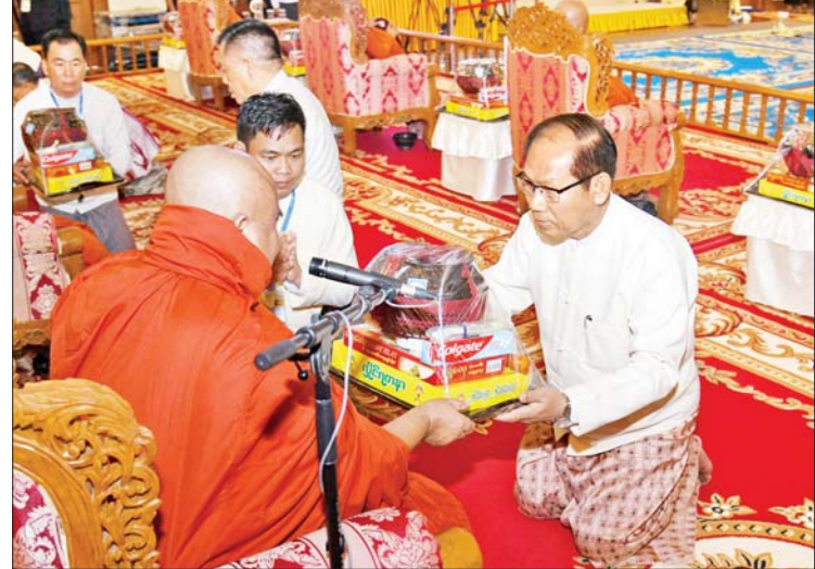
နိုင်ငံတော်စီမံအုပ်ချုပ်ရေးကောင်စီအဖွဲ့ဝင် ဒေါက်တာအောင်ကျော်မင်းက ဆရာတော်ထံ ဝါဆိုသင်္ကန်းနှင့် လှူဖွယ်ပစ္စည်းများ ဆက်ကပ်လှူဒါန်းစဉ်။