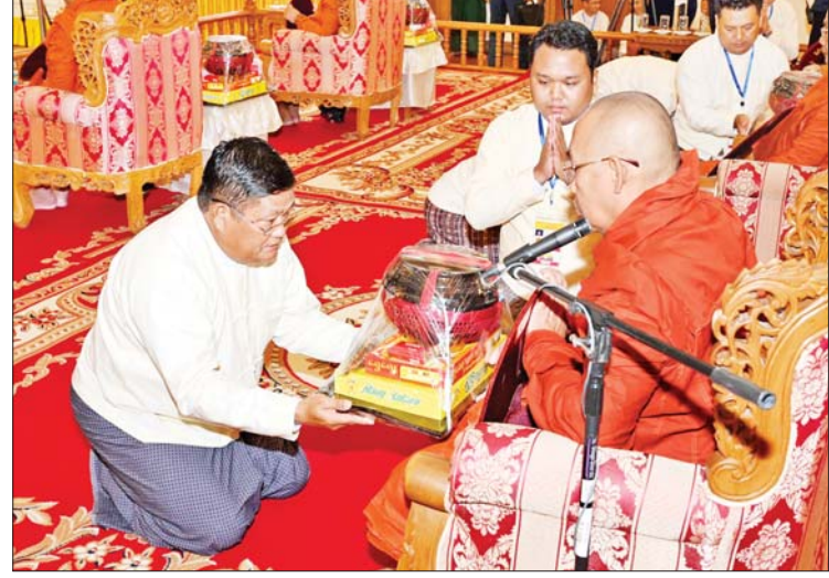
နိုင်ငံတော်စီမံအုပ်ချုပ်ရေးကောင်စီအဖွဲ့ဝင် ဦးရန်ကျော်က ဆရာတော်ထံ ဝါဆိုသင်္ကန်းနှင့် လှူဖွယ်ပစ္စည်းများ ဆက်ကပ်လှူဒါန်းစဉ်။