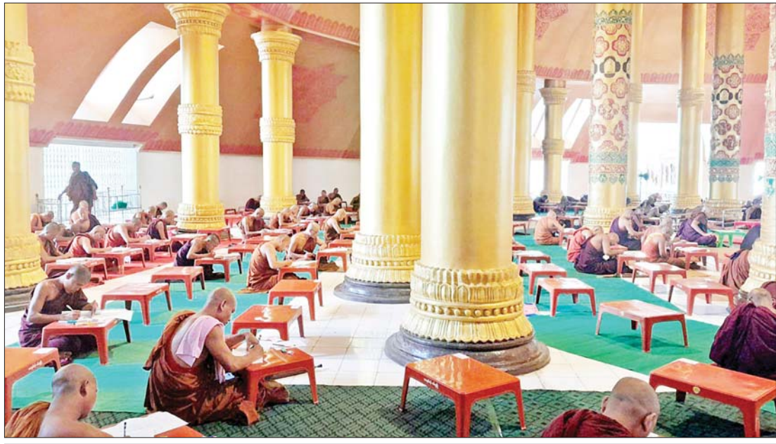
လောကနန္ဒာစေတီတော်ကြီးအတွင်း၌ နိကာယ် ၅ ရပ် စာမေးပွဲ ကျင်းပနေစဉ်။

သာသနာရေးဆိုင်ရာ အဆောက်အအုံများ ထိခိုက်ပျက်စီးမှု ရခိုင်ပြည်နယ်အတွင်းရှိ မြို့နယ် ၁၇ မြို့နယ်တွင် မိုခါမုန်တိုင်းဒဏ်ကို မြောက်ပိုင်း ၁၀ မြို့နယ်က ပိုမိုပြင်းထန်စွာခံခဲ့ရသည်။ ကျန်ခဲ့သော မြို့နယ်တွင်လည်း အနည်းငယ်မျှ ပျက်စီးဆုံးရှုံးမှုနှင့် ကြုံကြရသေးသည်။ များသောအားဖြင့် အမိုးလန်ခြင်း၊ မျက်နှာကြက် ပြုတ်ကျခြင်းများဖြစ်သည်။ ထီးတော်စောင်းခြင်း၊ ကျိုးပြတ်ကျခြင်းများလည်း ရှိခဲ့သည်။ ရခိုင်ပြည်နယ် တစ်ခုလုံးအနေဖြင့် ပျက်စီးဆုံးရှုံးမှုကို မှတ်တမ်းပြုတင်ပြရလျှင် ကျောင်းတိုက်ပေါင်း ၁၆၄၇ ခု၊ စေတီ ၂၄၄ ခု၊ သိမ်ကျောင်း ၆၅၅ ခု၊ ကျောင်းဆောင် ၁၉၄၃ ခု၊ ဓမ္မာရုံ ၈၇၂ ရုံ၊ ဆွမ်းစားဆောင် ၄၆၃ ခု၊ ကုဋီ ၁၀၃၅ လုံးတို့ ဖြစ်သည်။