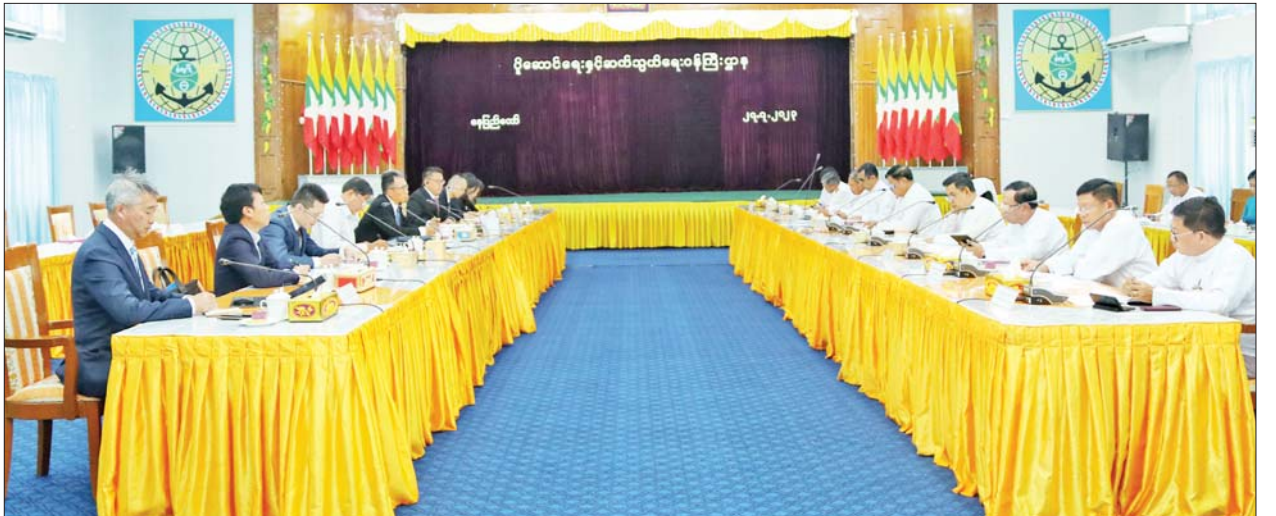
တွေ့ဆုံပွဲသို့ ပို့ဆောင်ရေးနှင့် ဆက်သွယ်ရေးဝန်ကြီးဌာန ဒုတိယ ဝန်ကြီး၊ ဌာနအကြီးအမှူးများ၊ ချန်ဒူးဒေသစီးပွားရေးလုပ်ငန်းအဖွဲ့ ကိုယ်စားလှယ်များနှင့် တာဝန်ရှိသူများ တက်ရောက်ခဲ့ကြောင်း သိရသည်။

တွေ့ဆုံစဉ် ကုန်သွယ်မှုတိုးမြှင့်ရေးအတွက် နယ်စပ်ဝင်/ထွက်ပေါက်များတွင် လုပ်ငန်းများ လွယ်ကူချောမွေ့စေရေး၊ ထောက်ပံ့ပို့ဆောင်ရေးလုပ်ငန်းများဖွံ့ဖြိုးရေး၊ ကျောက်မျက်ရတနာများ၊ ရေထွက်ကုန်များနှင့် အသီးအနှံများကို ကုန်တင်လေယာဉ်များဖြင့် တရုတ်နိုင်ငံသို့ ပို့ဆောင်ရေးနှင့် မြန်မာနိုင်ငံ၌ လေယာဉ်မောင်းသင်တန်းကျောင်း တည်ထောင်ဖွင့်လှစ်ဆောင်ရွက်နိုင်ရေးကိစ္စရပ်များကို ခင်မင်ရင်းနှီးစွာ နှစ်ဖက်အမြင်ချင်းဖလှယ်ဆွေးနွေးခဲ့ကြသည်။