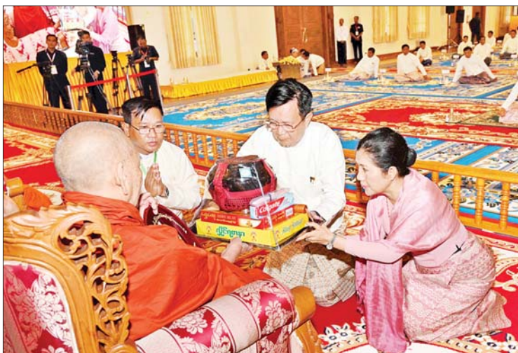
နိုင်ငံတော်စီမံအုပ်ချုပ်ရေးကောင်စီ အတွင်းရေးမှူး ဒုတိယဗိုလ်ချုပ်ကြီး အောင်လင်းဒွေးနှင့်ဇနီးတို့က ဆရာတော်ထံ ဝါဆိုသင်္ကန်းနှင့် လှူဖွယ်ပစ္စည်းများ ဆက်ကပ်လှူဒါန်းစဉ်။

ထို့နောက် နိုင်ငံတော်စီမံအုပ်ချုပ်ရေးကောင်စီဥက္ကဋ္ဌ နိုင်ငံတော်ဝန်ကြီးချုပ်နှင့်ဇနီး၊ အခမ်းအနား တက်ရောက်လာကြသူများက စာမျက်နှာ ၄ သို့ ❖