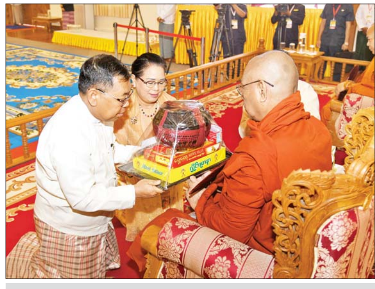
နိုင်ငံတော်စီမံအုပ်ချုပ်ရေးကောင်စီအဖွဲ့ဝင် ဒုတိယဝန်ကြီးချုပ်နှင့် ပြည်ထောင်စု ဝန်ကြီး ဒုတိယဗိုလ်ချုပ်ကြီး စိုးထွဋ်နှင့်ဇနီးတို့က ဆရာတော်ထံ ဝါဆိုသင်္ကန်းနှင့် လှူဖွယ်ပစ္စည်းများ ဆက်ကပ်လှူဒါန်းစဉ်။