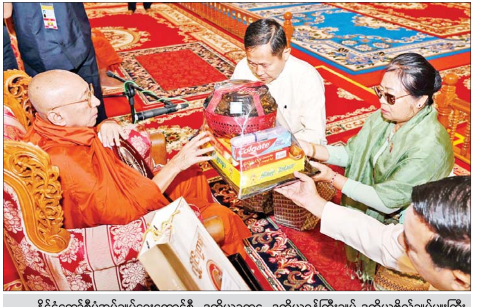
နိုင်ငံတော်စီမံအုပ်ချုပ်ရေးကောင်စီဥက္ကဋ္ဌ နိုင်ငံတော်ဝန်ကြီးချုပ် ဗိုလ်ချုပ်မှူးကြီး မင်းအောင်လှိုင်နှင့် ဇနီး ဒေါ်ကြူကြူလှတို့က သန်လျင်မြို့ မင်းကျောင်းပထမပြန်စာသင်တိုက် ပဓာနနာယက အဂ္ဂမဟာပဏ္ဍိတ အဂ္ဂမဟာသဒ္ဓမ္မဇောတိကဓဇ ဒေါက်တာဘဒ္ဒန္တစန္ဒိမာဘိဝံသထံ ဝါဆိုသင်္ကန်း ဆက်ကပ်လှူဒါန်းစဉ်။