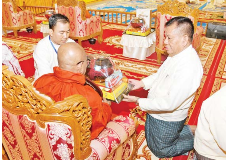
နိုင်ငံတော်စီမံအုပ်ချုပ်ရေးကောင်စီအဖွဲ့ဝင် ဦးမောင်ကိုက ဆရာတော်ထံ ဝါဆိုသင်္ကန်းနှင့် လှူဖွယ်ပစ္စည်းများ ဆက်ကပ်လှူဒါန်းစဉ်။