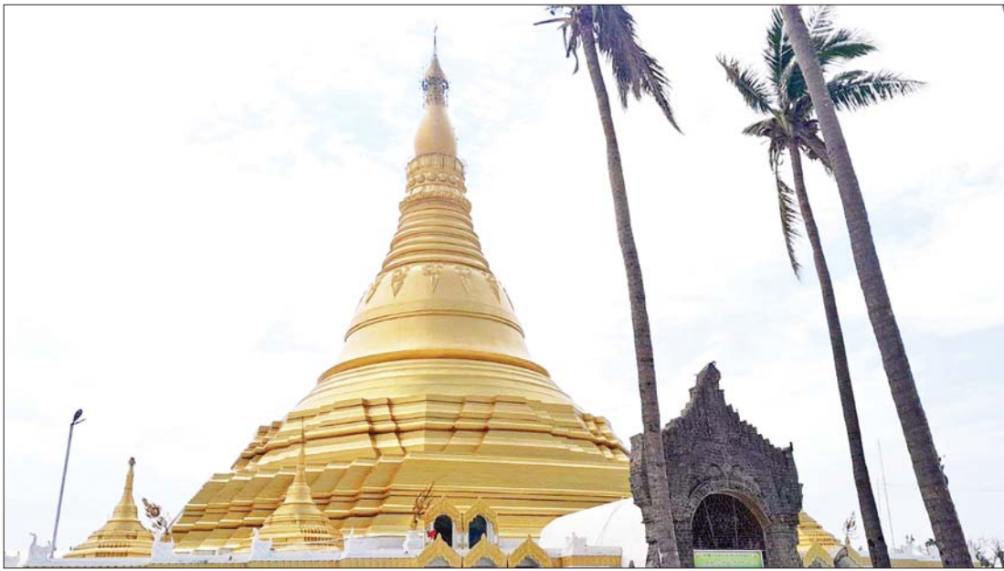
စစ်တွေမြို့ရှိ လောကနန္ဒာစေတီတော်မြတ်ကြီး။

မိုခါမုန်တိုင်းဒဏ်သင့် ရခိုင်ဒေသ ပြန်လည်ထူထောင်ရေး လုပ်ငန်းများ ဆောင်ရွက်ရန်အတွက် မေလ ၁၉ ရက် နေ့တွင် စစ်တွေမြို့သို့ ရောက်ရှိခဲ့ သည်။ စစ်တွေလေဆိပ်သို့ လေယာဉ် ဆင်းခါနီး လောကနန္ဒာစေတီတော် မြတ်ကြီးကို လှမ်း၍ဖူးတွေ့လိုက်ရ၏။ ရွှေရောင်တဝင်းဝင်းနှင့် တင့်တယ် သပ္ပာယ်လှပေစွာ ဘုရားပရိဝုဏ် အတွင်းရှိ အဆောက်အအုံတချို့မှာ မုန်တိုင်းဒဏ်သင့်ခဲ့၍ အမိုးလန်နေသည် ကို တွေ့မြင်နေရသည်။ တိုက်တိုက် ဆိုင်ဆိုင်ပင် နောက်တစ်နေ့ဖြစ်သော မေလ ၂၀ ရက်နေ့၌ ဒုတိယဝန်ကြီးချုပ်နှင့် ပို့ဆောင်ရေးနှင့် ဆက်သွယ်ရေးဝန်ကြီး ဌာန ပြည်ထောင်စုဝန်ကြီး ဗိုလ်ချုပ်ကြီး တင်အောင်စန်း၊ နယ်စပ်ရေးရာဝန်ကြီး ဌာန ပြည်ထောင်စုဝန်ကြီး ဒုတိယ ဗိုလ်ချုပ်ကြီးထွန်းထွန်းနောင်၊ ရခိုင် ပြည်နယ်ဝန်ကြီးချုပ် ဦးထိန်လင်းနှင့် ဒုတိယဝန်ကြီးများအဖွဲ့ သွားရောက် ကြည့်ရှုခဲ့သောနေရာသည်လောကနန္ဒာ ဘုရားဝင်းဖြစ်နေပါသည်။ မိုခါမုန်တိုင်း သည် စေတီတော်မြတ်ကြီးအား ထိခိုက် ပျက်စီးအောင် ဓမ္မစီးသွားခဲ့ပါ။ ကြီးမား လှသောပျက်စီးမှုမတွေ့ရ။ အဝင်ယာယီ စောင်းတန်းများ ပြုလဲသွားမှုကို အမြန် ဆုံး ရှင်းလင်းထားပြီးဖြစ်သည်။ အရန်စေတီအချို့တွင်သာ ထီးတော် ပျက်စီးခြင်း၊ အချို့တိုင်းစောင်းသွားသော ထီးတော်များကို ပြန်လည်တည်မတ် ရန် လိုခြင်းများတွေ့ရှိရပြီး ဘုရားကြီး ဝင်းထဲရှိ သာသနာဗိမာန်တော်၊ မဟာ ဝေယနိဗိမာန်တော် အမိုးလန်ပျက်စီးမှု များကို ဆောက်လုပ်ရေးဝန်ကြီးဌာန က ပြန်လည်ပြုပြင်တည်ဆောက်ပေး သွားမည်ဖြစ်သည်။ စကြာမုနိသိမ် ကျောင်းတော်၌ ဘုံကိုးဆင့်မှ ပန်းဆွဲများ