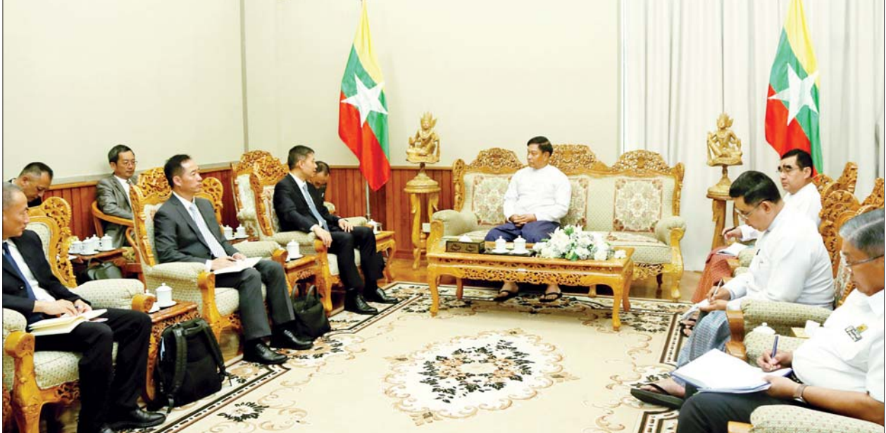
ဖလှယ် ဆွေးနွေးကြသည်။ တွေ့ဆုံပွဲသို့ ပို့ဆောင်ရေးနှင့် ဆက်သွယ်ရေးဝန်ကြီးဌာန ဒုတိယ ဝန်ကြီး၊ ဌာနအကြီးအကဲများ၊ တရုတ်နိုင်ငံဘက်မှ ကိုယ်စားလှယ်များနှင့် တာဝန်ရှိသူများ တက်ရောက်ကြကြောင်း သိရသည်။ သတင်းစဉ်

တွေ့ဆုံစဉ် တဲဟုန်ပြည်နယ် မြို့တော်မန်စီနှင့် မန္တလေးခရီးစဉ်ကို Ruili Airlineက တစ်ပတ်လေးကြိမ်ပြေးဆွဲမှု၊ မြန်မာအမျိုးသားလေကြောင်း က ရန်ကုန်- မန္တလေး- မန်စီ- မန္တလေး- ရန်ကုန်ခရီးစဉ်ကို တစ်ပတ် သုံးကြိမ် ပြေးဆွဲမှုများအပြင် အလားအလာရှိသောမြို့များသို့ ခရီးသည် နှင့် ကုန်တင်လေယာဉ်များ ပိုမိုတိုးချဲ့ပြေးဆွဲရေး၊ တရုတ်နိုင်ငံ၏ အမြန် ရထားလမ်းကွန်ရက်သည် ၂၀၂၇ ခုနှစ်တွင် ရွှေလီမြို့အထိ တည်ဆောက် ပြီးစီးမည်ဖြစ်ရာ နှစ်နိုင်ငံကုန်သွယ်မှု တိုးမြှင့်ရေးအတွက် မြန်မာနိုင်ငံ၏ ရထားလမ်းကွန်ရက်နှင့် ချိတ်ဆက်ရေး၊ နယ်စပ်ဖြတ်ကျော် ပို့ဆောင်မှု များ လွယ်ကူချောမွေ့စေရေးအတွက် နားလည်မှုစာချွန်လွှာ လက်မှတ် ရေးထိုးရေးနှင့် တရုတ်နိုင်ငံ ထွက်ကုန်များကို ရန်ကုန်ဆိပ်ကမ်းမှတစ်ဆင့် ဖြတ်သန်းပို့ဆောင်ရေးကိစ္စရပ်များကို ခင်မင်ရင်းနှီးစွာ အမြင်ချင်း