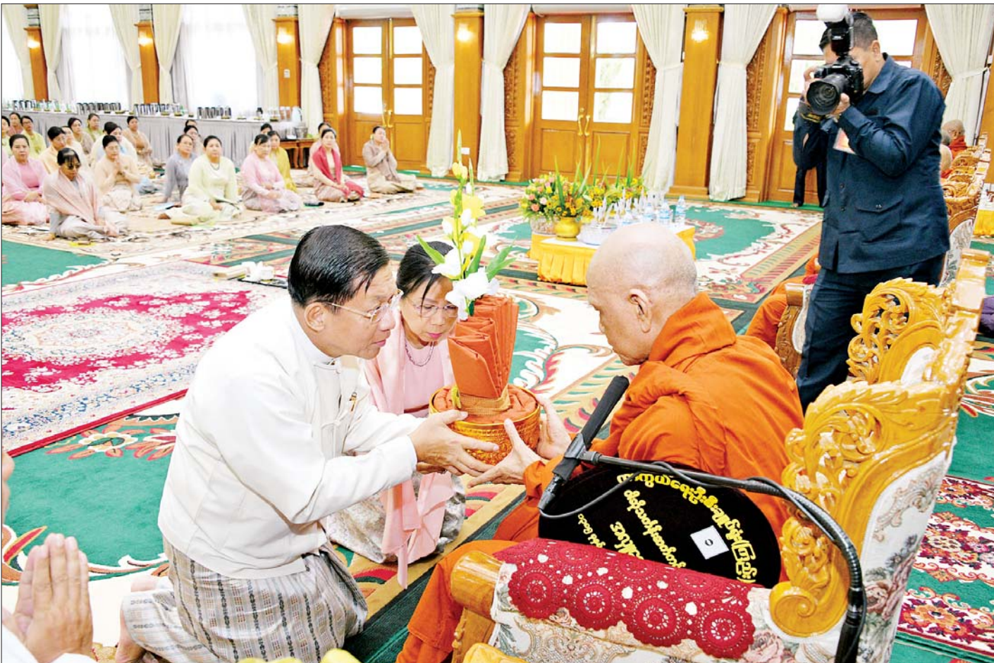
နိုင်ငံတော်စီမံအုပ်ချုပ်ရေးကောင်စီဥက္ကဋ္ဌ တပ်မတော်ကာကွယ်ရေးဦးစီးချုပ် ဗိုလ်ချုပ်မှူးကြီးမင်းအောင်လှိုင်နှင့် ဇနီး ဒေါ်ကြူကြူလှတို့က သန်လျင်မြို့ မင်းကျောင်းပထမပြန်စာသင်တိုက် ပဓာနနာယက၊ အဂ္ဂမဟာပဏ္ဍိတ အဂ္ဂမဟာသဒ္ဓမ္မဇောတိကဓဇ ဒေါက်တာဘဒ္ဒန္တစန္ဒိမာဘိဝံသထံ ဝါဆိုသင်္ကန်း ဆက်ကပ် လှူဒါန်းစဉ်။

နေပြည်တော် ဇူလိုင် ၂၆ ၂၀၂၃ ခုနှစ် ကာကွယ်ရေးဦးစီးချုပ်ရုံး(ကြည်း၊ ရေ၊ လေ) မိသားစုများ ဝါဆိုသင်္ကန်းဆက်ကပ်လှူဒါန်း ပွဲ မဟာမင်္ဂလာအခမ်းအနားကို ယနေ့နံနက်ပိုင်းတွင် ကာကွယ်ရေးဦးစီးချုပ်ရုံး(ကြည်း) အနော်ရထာခန်းမ ၌ ကျင်းပပြုလုပ်ရာ နိုင်ငံတော်စီမံအုပ်ချုပ်ရေး ကောင်စီဥက္ကဋ္ဌ တပ်မတော်ကာကွယ်ရေးဦးစီးချုပ် ဗိုလ်ချုပ်မှူးကြီးမင်းအောင်လှိုင်နှင့် ဇနီး ဒေါ်ကြူကြူလှ တို့ တက်ရောက်ကြည့်ညိ၍ ဝါဆိုသင်္ကန်း၊ လှူဖွယ် ပစ္စည်းများနှင့် နေ့ဆွမ်းတို့ကို ဆက်ကပ်လှူဒါန်း သည်။