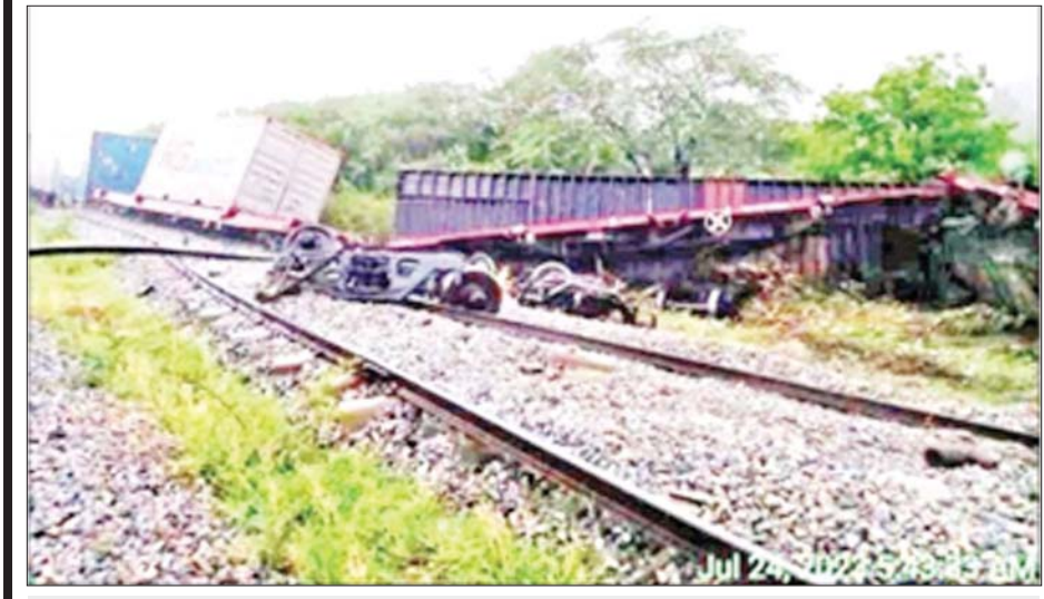
မြန်မာ့မီးရထားပိုင် ရထားသံလမ်းဆက်ပြား၊ သံလမ်းဆက်မူလီများနှင့် သံလမ်းထိန်းကလစ်များ ဖြုတ်ယူဖျက်ဆီးမှုကြောင့် မန္တလေး-ရန်ကုန် ရထားလမ်းပိုင်းအတွင်း မြစ်ငယ်မှ ရွာသာကြီး ခရီးစဉ် ပြေးဆွဲသော ကုန်ရထားလမ်းချော်မှုဖြစ်ပွားစဉ်။

လူမျိုး၊ ကိုးကွယ်ရာဘာသာ၊ ကျား/မ (သို့မဟုတ်) မည်သူမည်ဝါဖြစ်သည် ဆိုသည့် အကြောင်းအရာတို့အပေါ် အခြေပြု၍ လူပုဂ္ဂိုလ်တစ်ဦး (သို့မဟုတ်) လူအုပ်စုတစ်စုကို မျှတမှုမရှိစွာ ဝေဖန် သည့် (သို့မဟုတ်) မလိုမုန်းထားမှုကို ဖော်ပြသည့် ဆက်ဆံမှုတစ်မျိုးမျိုး ကို ရည်ညွှန်းပြီး အကြမ်းဖက်ရန် လှုံ့ဆော်ခြင်းသည် အမုန်းစကားပင်ဖြစ် သည်။ အမုန်းစကား ပြန့်ပွားခြင်းသည် လူ့ များတွင် အားလုံးပါဝင်ရန်နှင့် ပိုမိုအား ပေးရမည်။ အကြမ်းဖက်မှုကိုဖြစ်ပေါ်စေပြီး ဂုဏ် သိက္ခာရှိစွာနေထိုင်ရန်နှင့် ငြိမ်းချမ်းပြီး ညီညွတ်သည့် လူ့အဖွဲ့အစည်း တည် ဆောက်ရန် မျှော်မှန်းချက်တို့ကို ထိခိုက် စေသည့်အပြင် အကျင့်စာရိတ္တကိုလည်း ထိပါးစေသည်။ သို့ဖြစ်၍ ပြည်သူများအနေဖြင့် အမုန်းစကားများကို ရှုတ်ချရန်နှင့် တားဆီးရန် စီမံဆောင်ရွက်ရမည်။ အမုန်းစကားဆန့်ကျင်သည့် လှုပ်ရှားမှု များတွင် အားလုံးပါဝင်ရန်နှင့် ပိုမိုအား ပေးရမည်။