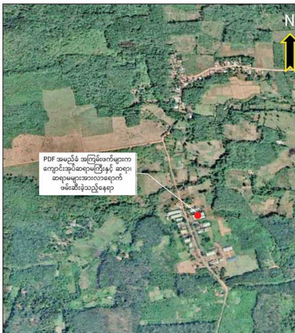
လောင်းလုံးမြို့နယ် စိုက်ပျိုးရေးသိပ္ပံ (ထားဝယ်) နေရာပြပုံ။

နေပြည်တော် ဇူလိုင် ၂၆ NUG အမည်ခံ အကြမ်းဖက်အဖွဲ့နှင့် ၎င်းတို့၏လက်ဝေခံ PDF အမည်ခံ အကြမ်းဖက်သမားများသည် အနာဂတ်ရင်သွေးငယ်များ၏ ပညာသင်ကြား သင်ယူခွင့် အခွင့်အလမ်းများ ပျက်ပြား၍ ပညာမဲ့လူတန်းစားများ ဖြစ်ပေါ်လာစေရန်နှင့် ၎င်းတို့ကို အကြောက်တရားဖြင့် ထောက်ခံအားပေးလာစေရန် ယုတ်မာရိုင်းစိုင်းသော ရည်ရွယ် ချက်များဖြင့် ကျောင်းသား ကျောင်းသူ၊ ဆရာ ဆရာမများနှင့် မိဘများအား ခြိမ်းခြောက် အကျပ်ကိုင်ခြင်း၊ ဖမ်းဆီးခေါ်ဆောင်သတ်ဖြတ်ခြင်း၊ ပညာရေးဆိုင်ရာ အဆောက်အဦ များအား မီးရှို့ဖျက်ဆီးခြင်း၊ မိုင်းထောင်ဖောက်ခွဲခြင်း၊ အထောက်အကူပြုပစ္စည်းများနှင့် ကျောင်းသုံးပုံနှိပ်စာအုပ်များ၊ ကျောင်းသုံးစာအုပ်များအား မီးရှို့ဖျက်ဆီးခြင်း၊ အတင်း အဓမ္မလှူယူခြင်း စသည့်နည်းလမ်းမျိုးစုံ အသုံးပြုကာ အနာဂတ်မျိုးဆက်သစ် လူငယ် များ၏ ပညာရေးကဏ္ဍမြင့်မားရေးကို နှောင့်ယှက်ဖျက်ဆီးလျက်ရှိသည်။ ထိုသို့ လုပ်ဆောင်လျက်ရှိရာ ဇူလိုင် ၂၀ ရက်က တနင်္သာရီတိုင်းဒေသကြီး လောင်းလုံး မြို့နယ် စခန်းကြီးကျေးရွာရှိ စိုက်ပျိုးရေးသိပ္ပံကျောင်း (ထားဝယ်)မှ ကျောင်းအုပ်ဆရာမကြီး နှင့် အသက် ၁၁ နှစ်အရွယ် ၎င်း၏ သားဖြစ်သူ အပါအဝင် ဆရာ ဆရာမ ငါးဦး စုစုပေါင်း ခုနစ်ဦးတို့အား PDF အမည်ခံ အကြမ်းဖက်သမားများက အတင်းအဓမ္မ ဖမ်းဆီးခေါ်ဆောင် သွားခဲ့ကြောင်း သိရှိရသည်။ စာမျက်နှာ ၁၂ ကော်လံ ၁ သို့ ☸