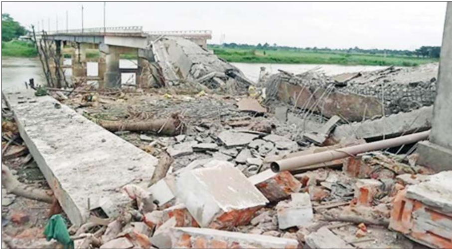
အကြမ်းဖက်သမားများ မိုင်းထောင်ဖောက်ခွဲဖျက်ဆီးမှုကြောင့် ပျက်စီးသွားသည့် တံတားတစ်စင်းကို တွေ့ရစဉ်။

ဂျီနီဗာကွန်ဗင်းရှင်းများကို ကြီးလေးစွာ ချိုးဖောက်ခြင်းတွင်ပါဝင်သည့် အကြောင်းမဲ့ သတ်ဖြတ်ခြင်း၊ စစ်ရေးလိုအပ်ချက်အတွက် မဟုတ်ဘဲ ကြီးမားကျယ်ပြန့်စွာ ဖျက်ဆီးခြင်းနှင့် ပစ္စည်းဥစ္စာများကို သိမ်းပိုက်ခြင်းတို့အား အကြောင်းမဲ့ တမင်လုပ်ဆောင်ခြင်း၊ ဓားစာခံအဖြစ်ဖမ်းဆီးခြင်း၊ ပြည်တွင်းလက်နက်ကိုင်ပဋိပက္ခများတွင် လက်နက် ကိုင်ပဋိပက္ခဆိုင်ရာဥပဒေနှင့် ဓလေ့ထုံးစံများကို ချိုးဖောက်ခြင်းတွင်ပါဝင်သည့် အရပ်သားပြည်သူ