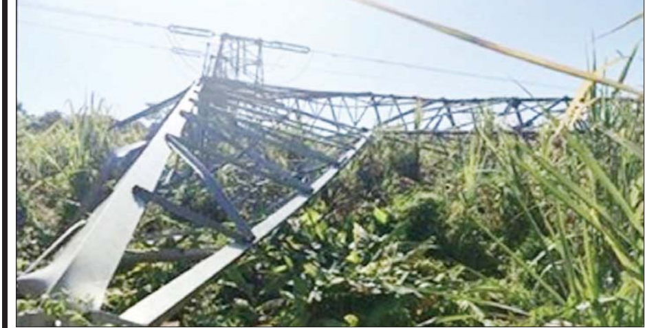
ထီးချိုင့်မြို့နယ် တကောင်းနီကယ်စက်ရုံသို့ သွယ်တန်းထားသော လျှပ်စစ်ဓာတ်အားလိုင်း တာဝါတိုင် များကို PDF အမည်ခံအကြမ်းဖက်သမားများ၏ မိုင်းခွဲခံရသည့် မှတ်တမ်းဓာတ်ပုံ။

ဆူးငြောင့်ခလုတ်များ တားဆီးကာကွယ် တိုက်ဖျက် နိုင်ငံရေးနှင့် လူမျိုးရေးအစွန်းရောက်ပြီး လက်နက်ကိုင်ပဋိပက္ခကို ၎င်းတို့၏ကိုယ်ကျိုးစီးပွား အတွက် အသုံးချလျက်ရှိသည့် လက်နက်ကိုင် သောင်းကျန်းသူများ၏ စစ်ရာဇဝတ်မှုကျူးလွန်မှု များသည် နိုင်ငံတော်အစိုးရက မျှော်မှန်းဆောင်ရွက် လျက်ရှိသည့် ထာဝရငြိမ်းချမ်းရေးခရီးလမ်းအတွက် ခလုတ်တံသင်းများဖြစ်သကဲ့သို့ နိုင်ငံရေးဝါဒ မှိုင်းတိုက်ထားမှုကြောင့် အစွန်းရောက်အကြမ်းဖက် လုပ်ရပ်များကို ကျူးလွန်လျက်ရှိသည့် အကြမ်းဖက် အုပ်စုများသည် နိုင်ငံတော်စီမံအုပ်ချုပ်ရေးကောင်စီ ၏ ရှေ့လုပ်ငန်းစဉ်(၅) ရပ်နှင့်အညီ ဆက်လက် ဆောင်ရွက်မည့် ရှေ့ခရီးလမ်းအတွက် ဆူးငြောင့် ခလုတ်များဖြစ်ပါသည်။ သို့ဖြစ်ပါ၍ လက်နက်ကိုင် သောင်းကျန်းသူများ၏ စစ်ရာဇဝတ်မှုများနှင့် အကြမ်းဖက်သမားများ၏ အကြမ်းဖက်မှုအန္တရာယ် များကို နိုင်ငံတော်အစိုးရ၊ ပြည်သူ့လူထုနှင့် တပ်မတော်တို့၏ စုပေါင်းညီညွတ်မှုစွမ်းအားဖြင့် တားဆီးကာကွယ် တိုက်ဖျက်သွားရမည်ဖြစ်ပါ ကြောင်း ရေးသားတင်ပြလိုက်ရပေသည်။ ။