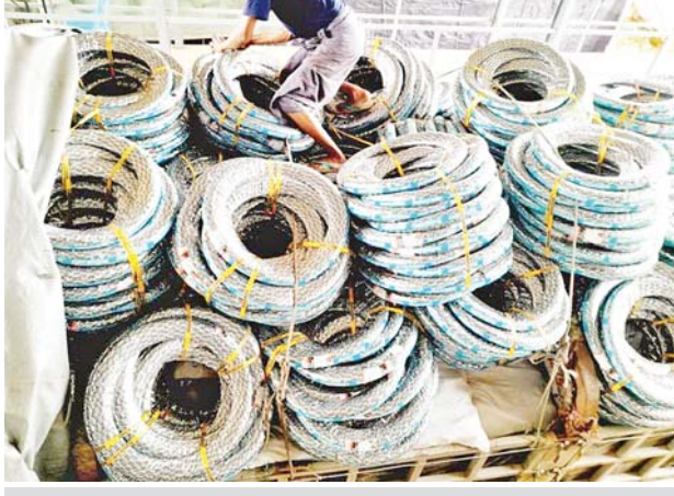
ကရင်ပြည်နယ်၌ ဖမ်းဆီးရမိမှု။

တိုက်ဖျက်ရေးအထူးအဖွဲ့၏ စီမံခန့်ခွဲမှုဖြင့် တာဝန်ကျပူးပေါင်းအဖွဲ့က ရေပူအမြဲတမ်းစစ်ဆေးရေးစခန်း၌ စစ်ဆေးမှုများ ဆောင်ရွက်ခဲ့ရာ မူဆယ်မြို့မှ လားရှိုးမြို့သို့ မောင်းနှင်လာသော ယာဉ်နှစ်စီးပေါ်မှ တရားဝင် စာရွက်စာတမ်း အထောက်အထား တင်ပြနိုင်ခြင်းမရှိသည့် ပိတ်လိပ်များ (ဆိုဒ်စုံ) ၂၃၀ ကီလိုဂရမ် (ခန့်မှန်းတန်ဖိုးငွေကျပ် ၅၀၆၀၀၀)နှင့် မဝတ် အင်္ကျီအထည် (ဆိုဒ်စုံ) ၃၅၀ (ခန့်မှန်းတန်ဖိုးငွေကျပ် ၇၀၀၀၀) စုစုပေါင်းခန့်မှန်းတန်ဖိုးငွေကျပ် ၁၂၀၆၀၀၀)ကို သိမ်းဆည်းရမိခဲ့ပြီး အကောက်ခွန် လုပ်ထုံးလုပ်နည်းများနှင့်အညီ အရေးယူဆောင်ရွက် လျက်ရှိသည်။ ထို့အတူ ဇူလိုင် ၂၅ ရက်တွင် အကောက်ခွန်ဦးစီးဌာန၏ စီမံခန့်ခွဲ မှုဖြင့် တာဝန်ကျအကောက်ခွန်အဖွဲ့က ထီးတန်းဆိပ်ကမ်း၌ စစ်ဆေး မှုများဆောင်ရွက်ခဲ့ရာ ကုန်သေတ္တာတစ်လုံးအတွင်းမှ သွင်းကုန်ကြေညာ လွှာတွင် ကြေညာထားသည်ထက် ပိုမိုပါရှိလာသည့် Personal Goods Gift Bag ၄၉၈၀ ကီလိုဂရမ် အပါအဝင် ကုန်ပစ္စည်းသုံးမျိုး (ခန့်မှန်း တန်ဖိုးငွေကျပ် ၁၄၀၃၆၄၀၀)ကို သိမ်းဆည်းရမိခဲ့ပြီး အကောက်ခွန် လုပ်ထုံးလုပ်နည်းများနှင့်အညီ အရေးယူဆောင်ရွက်လျက်ရှိသည်။ သို့ဖြစ်ပါ၍ ဇူလိုင် ၂၄ ရက်နှင့် ၂၅ ရက်တို့တွင် သိမ်းဆည်းရမိမှု စုစုပေါင်းမှာ အမှုတွဲ ၁၁ မှု (ခန့်မှန်းတန်ဖိုးငွေကျပ် ၁၇၅၄၃၇၀၀) ဖြစ်ကြောင်း တရားမဝင်ကုန်သွယ်မှုတိုက်ဖျက်ရေး ဦးဆောင်ကော်မတီ မှ သိရသည်။ သတင်းစဉ်