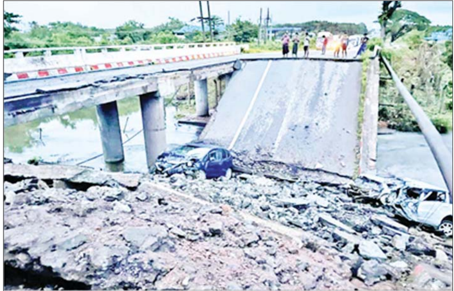
KNLA အဖွဲ့မှ အကြမ်းဖက်မှုလိုလားသူများနှင့် PDF အမည်ခံ အကြမ်းဖက်ပူးပေါင်းအဖွဲ့က မိုင်းထောင်ဖောက်ခွဲဖျက်ဆီးခဲ့သည့် ကျိုအိတ်တံတားကို တွေ့ရစဉ်။

အကြမ်းဖက်မှုတိုက်ဖျက်ရေးဥပဒေပုဒ်မ ၃၊ ပုဒ်မခွဲ(ခ)ပုဒ်မခွဲငယ်(၁၀) အရ အများပြည်သူ၏လုံခြုံရေးကိုဖြစ်စေ၊ အသက်အိုးအိမ်စည်းစိမ်ကို ဖြစ်စေ၊ အများပြည်သူ သို့မဟုတ် တစ်ဦးတစ်ယောက်အတွက် အရေးကြီး သော အခြေခံအဆောက်အအုံများကိုဖြစ်စေ၊ နိုင်ငံပိုင်အဆောက်အအုံ၊ ယာဉ်၊ စက်ပစ္စည်းကိရိယာနှင့် အသုံးအဆောင်ပစ္စည်းများကိုဖြစ်စေ ပြင်းထန်စွာထိခိုက်ဆုံးရှုံးစေရန် ပြုလုပ်မှုများသည် အကြမ်းဖက်မှုပင်ဖြစ်ပါ သည်။ ထို့အပြင် အကြမ်းဖက်မှုကိုကျူးလွန်သော သို့မဟုတ် ကျူးလွန် မည်ဖြစ်သော အကြမ်းဖက်သမားတစ်ဦးဦးကိုဖြစ်စေ၊ အကြမ်းဖက်အုပ်စု တစ်ခုခုကိုဖြစ်စေ အားပေးကူညီရာရောက်သော ငွေကြေးထောက်ပံ့မှုသည် လည်း အကြမ်းဖက်မှုဖြစ်