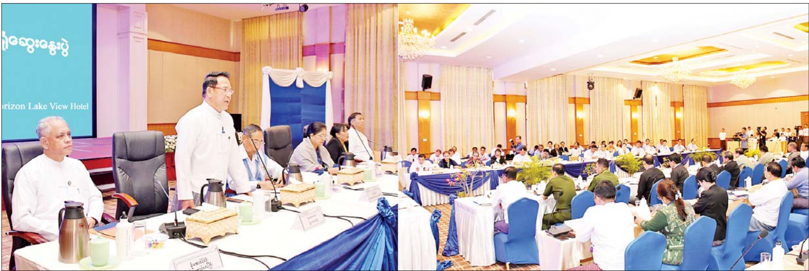
ပြည်ထောင်စုဝန်ကြီး ဦးမောင်မောင်အုန်း နိုင်ငံသားများ၏ သတင်းသိပိုင်ခွင့်ကို ဖြည့်ဆည်းပေးနိုင်ရန် မဏ္ဍိုင်(၄)ရပ် အလုပ်ရုံဆွေးနွေးပွဲတွင် အမှာစကားပြောကြားစဉ်။

နေပြည်တော် ဇူလိုင် ၂၆ ဥပဒေပြုရေး၊ အုပ်ချုပ်ရေး၊ တရားစီရင်ရေးနှင့် စတုတ္ထမဏ္ဍိုင် ဖြစ်သည့် သတင်းမီဒီယာတို့ အကြား သတင်းမီဒီယာကျင့်ဝတ်ကို အခြေခံ၍ အပြန်အလှန် လေးစားမှုရှိသော ဆက်ဆံမှုတည်ဆောက်ရေးနှင့် ဟန်ချက်ညီပူးပေါင်းဆောင်ရွက်မှု တိုးတက်စေရေး၊ မြန်မာနိုင်ငံသတင်းမီဒီယာကဏ္ဍ ဖွံ့ဖြိုးတိုးတက်ရေး၊ လွတ်လပ်စွာ သတင်းရယူပိုင်ခွင့် ပိုမိုရရှိရေးနှင့် မဏ္ဍိုင်(၄)ရပ်တို့ ဆက်ဆံရေး ပိုမိုကောင်းမွန်ရေး၊ ရှေ့ဆက်လက်ဆောင်ရွက်နိုင်မည့် နည်းလမ်းများအကြံဉာဏ်ကောင်းများကို ဖော်ဆောင်နိုင်ရေး၊ သတင်းအချက်အလက် ရယူခွင့်နှင့်ပတ်သက်၍ အပြန်အလှန် ပူးပေါင်း ဆောင်ရွက်နိုင်ရေးတို့ကို ရည်ရွယ်၍ မဏ္ဍိုင်(၄)ရပ် အလုပ်ရုံ ဆွေးနွေးပွဲကို ယနေ့နံနက် ၉ နာရီတွင် နေပြည်တော်ရှိ Horizon Lake View ဟိုတယ်၌ ကျင်းပသည်။