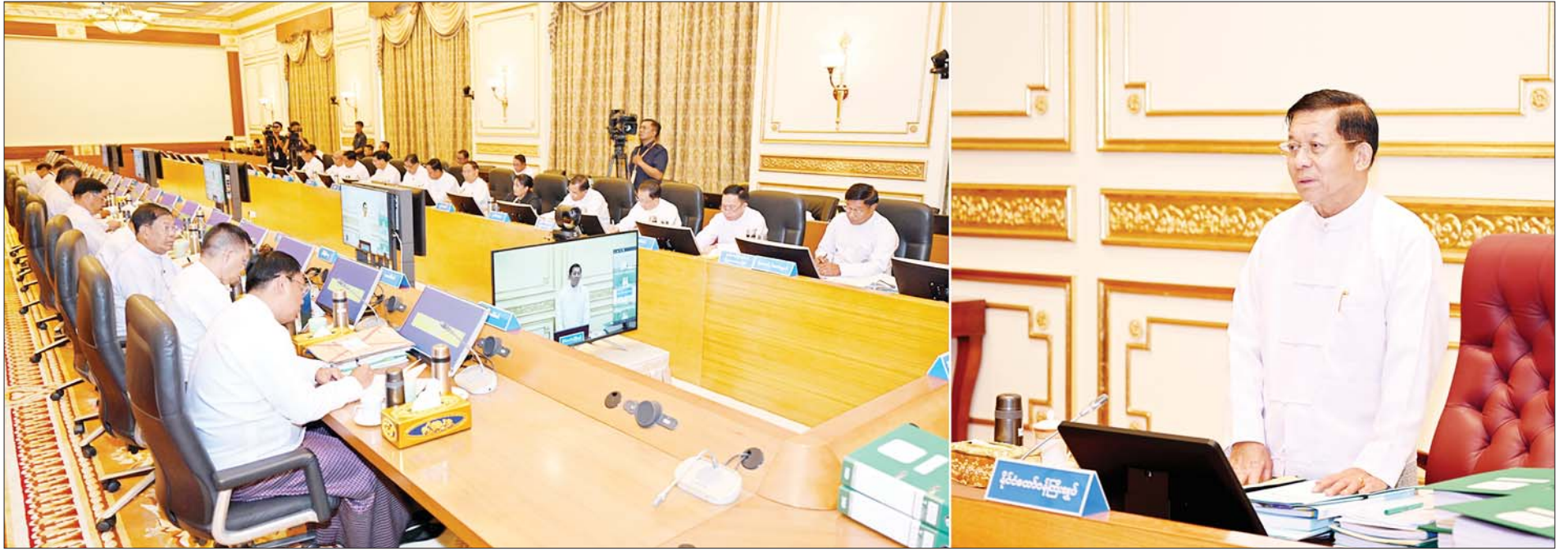
နိုင်ငံတော်စီမံအုပ်ချုပ်ရေးကောင်စီဥက္ကဋ္ဌ နိုင်ငံတော်ဝန်ကြီးချုပ် ဗိုလ်ချုပ်မှူးကြီး မင်းအောင်လှိုင် ပြည်ထောင်စုသမ္မတမြန်မာနိုင်ငံတော် စီးပွားရေးရာကော်မတီအစည်းအဝေး အမှတ်စဉ်(၆/၂၀၂၃)တွင် အမှာစကားပြောကြားစဉ်။