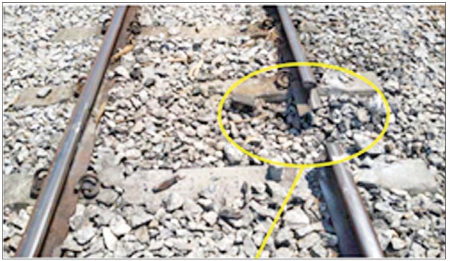
PDF အမည်ခံအကြမ်းဖက်သမားများ၏ ရက်စက်ကြမ်းကြုတ်စွာ မိုင်းခွဲတိုက်ခိုက်မှုကြောင့် ရထားသံလမ်းထိခိုက်ပျက်စီးမှုကို တွေ့ရစဉ်။

* စာမျက်နှာ ၆ မှ အများပြည်သူဆိုင်ရာ အဆောက်အအုံများကို ဗုံးခွဲတိုက်ခိုက်ခြင်း၊ မီးရထားလမ်းများကို ဖျက်ဆီးခြင်း၊ လမ်းတံတားများကို မိုင်းထောင် ဖျက်ဆီးခြင်း၊ ဆရာ ဆရာမများကို ခြိမ်းခြောက် ဖမ်းဆီးသတ်ဖြတ်ခြင်း စသည့်အကြမ်းဖက်မှုများကို ကျူးလွန်လျက်ရှိကြပါသည်။ အဆိုပါအကြမ်းဖက်မှုများကို တိုက်ဖျက်ရေး သည် ပြည်သူတစ်ရပ်လုံး၏ အမျိုးသားရေးတာဝန် ဖြစ်ပါသည်။ နိုင်ငံတော်အစိုးရက နိုင်ငံတော် တည်ငြိမ်အေးချမ်းရေး၊ ပြည်သူ့လူထု၏ လူမှုစီးပွား ဘဝများဖွံ့ဖြိုးတိုးတက်ရေး၊ ငြိမ်းချမ်းရေးနှင့်နိုင်ငံတော် ဖွံ့ဖြိုးတိုးတက်ရေးကို အစွမ်းကုန်ကြိုးပမ်း ဆောင်ရွက်နေသည့်အချိန်တွင် စစ်ရာဇဝတ်မှုများ ကို ပြောင်ပြောင်တင်းတင်း ကျူးလွန်နေကြသည့် လက်နက်ကိုင်သောင်းကျန်းသူများ၊ အကြမ်းဖက် လုပ်ရပ်များကို ပြောင်ပြောင်တင်းတင်းကျူးလွန်