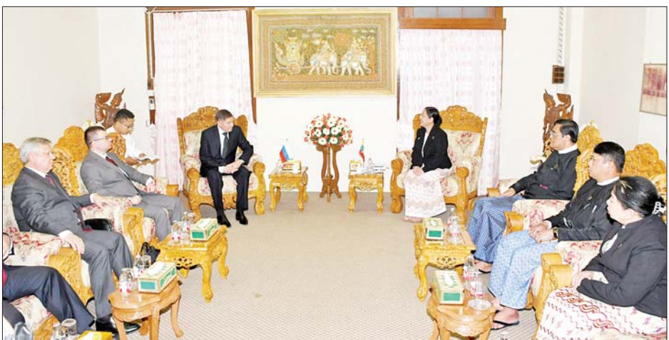
တိုင်းဒေသကြီး တရားလွှတ်တော် အစည်းအဝေး များကို ရင်းနှီးပွင့်လင်းစွာ ဆွေးနွေးခဲ့ကြကြောင်း ခန်းမ၌ တွေ့ဆုံကြပြီး တရားစီရင်ရေးဆိုင်ရာကိစ္စရပ် သိရသည်။ သတင်းစဉ်

တရားသူကြီးချုပ်ဒေါ်စန္ဒာသွယ်နှင့် တရားလွှတ်တော် တရားသူကြီးများက ရန်ကုန်အပြည်ပြည်ဆိုင်ရာ လေဆိပ်၌ ကြိုဆိုနှုတ်ဆက်ကြသည်။ ရင်းနှီးပွင့်လင်းစွာဆွေးနွေး မွန်းလွဲပိုင်းတွင် ဧည့်သည်တော် ရုရှား ဖက်ဒရေးရှင်းနိုင်ငံ တရားသူကြီးချုပ် ဦးဆောင်သော ကိုယ်စားလှယ်အဖွဲ့နှင့် ရန်ကုန်တိုင်းဒေသကြီး တရားလွှတ်တော်တရားသူကြီးချုပ်၊ တရားလွှတ်တော် တရားသူကြီးများ၊ တရားရေးအရာရှိများသည်