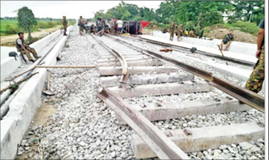
၁၈-၇-၂၀၂၃ ရက်နေ့က အကြမ်းဖက်သောင်းကျန်းသူများ၏ ရက်စက်ကြမ်းကြုတ်စွာ မိုင်းခွဲဖျက်ဆီး မှုကြောင့် ရန်ကုန်-မန္တလေးရထားလမ်း အဆင့်မြှင့်တင်ရေးစီမံကိန်း၏ ဆောင်ရွက်ပြီးစီးနေသည့် ရထားလမ်းထိခိုက်ပျက်စီးမှုကို တွေ့ရစဉ်။