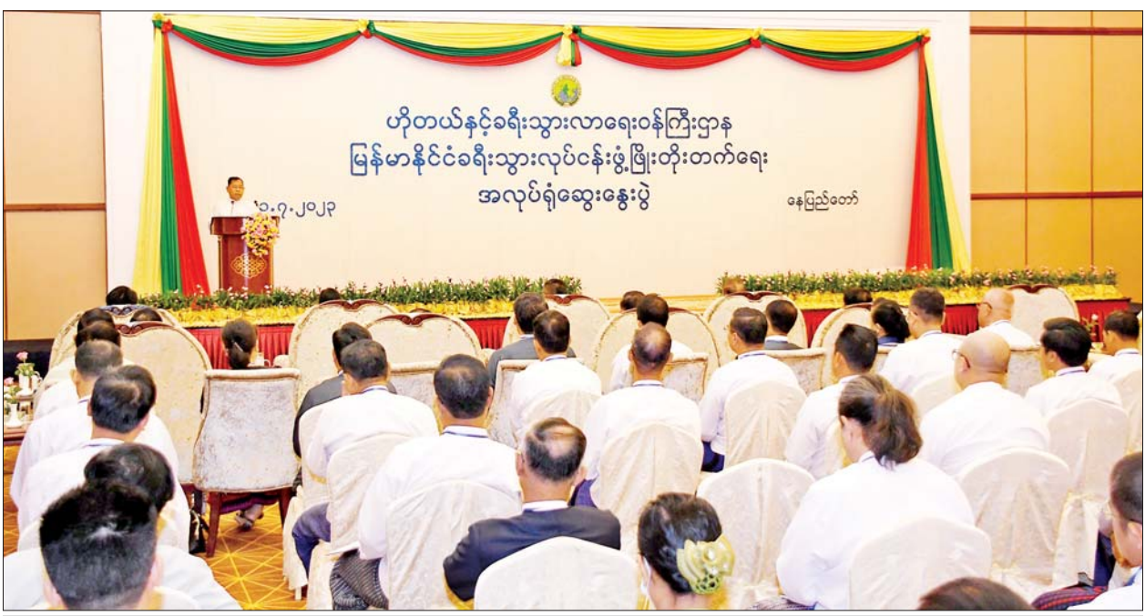
နိုင်ငံတော်စီမံအုပ်ချုပ်ရေးကောင်စီဝင် ဒုတိယဝန်ကြီးချုပ်နှင့် ပြည်ထောင်စုဝန်ကြီး ဒုတိယဗိုလ်ချုပ်ကြီး စိုးထွဋ် မြန်မာနိုင်ငံ ခရီးသွား လုပ်ငန်းဖွံ့ဖြိုးတိုးတက်ရေး အလုပ်ရုံဆွေးနွေးပွဲ ဖွင့်ပွဲအခမ်းအနားတွင် အမှာစကားပြောကြားစဉ်။

နေပြည်တော် ဇူလိုင် ၂၁ မြန်မာနိုင်ငံ ခရီးသွားလုပ်ငန်း ဖွံ့ဖြိုးတိုးတက်ရေး အလုပ်ရုံ ဆွေးနွေးပွဲ ဖွင့်ပွဲအခမ်းအနားကို ယနေ့နံနက်ပိုင်းတွင် နေပြည်တော် ရှိ Hotel Maxi Kumudra Ballroom ၌ ကျင်းပရာ အမျိုးသား ခရီးသွားလုပ်ငန်း ဖွံ့ဖြိုးတိုးတက် ရေးဗဟိုကော်မတီဥက္ကဋ္ဌ နိုင်ငံ တော်စီမံအုပ်ချုပ်ရေးကောင်စီဝင် ဒုတိယဝန်ကြီးချုပ်နှင့် ပြည်ထဲရေး ဝန်ကြီးဌာန ပြည်ထောင်စုဝန်ကြီး ဒုတိယဗိုလ်ချုပ်ကြီး စိုးထွဋ် တက်ရောက် အမှာစကား ပြောကြားသည်။