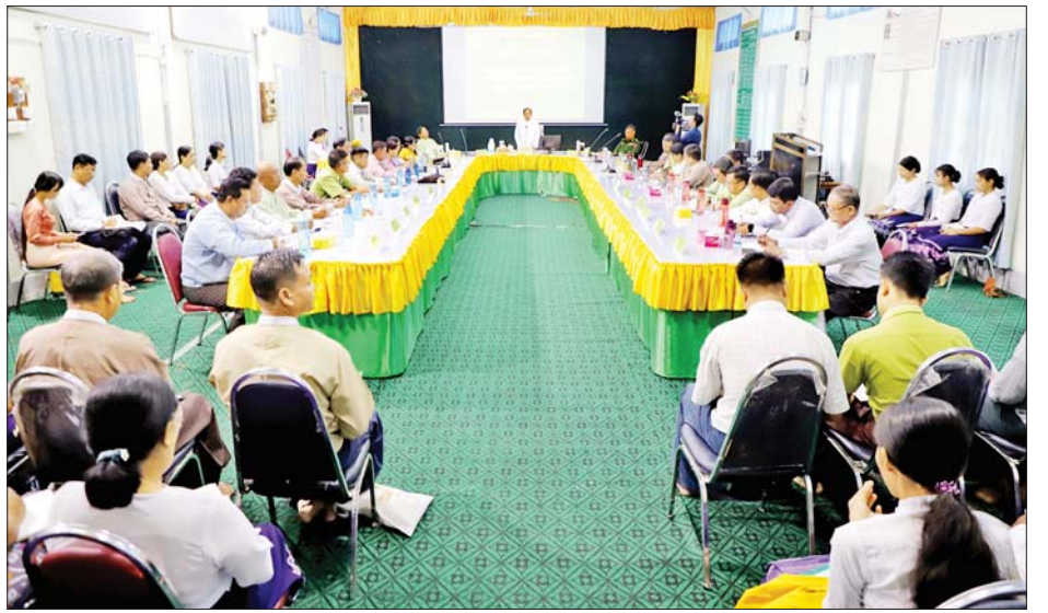
ဌာနရုံးရှိ မှီနှင့် အိမ်တွင်းအလှစိုက်ပင်မန်များ တာဝန်ရှိသူများနှင့် ဖြည့်ဆည်းပေါင်းစပ်ဆောင်ရွက်သုတေသနပညာပေးစင်တာသို့ ရောက်ရှိရာ စင်တာပေးခဲ့ကြောင်း သိရသည်။ အတွင်း လိုက်လံကြည့်ရှုပြီး လိုအပ်သည်များကို တိုင်းဒေသကြီး(ပြန်/ဆက်)

ထို့နောက် တိုင်းဒေသကြီး ဝန်ကြီးချုပ်နှင့် တာဝန်ရှိသူများသည် မုံရွာခရိုင် စိုက်ပျိုးရေးဦးစီး