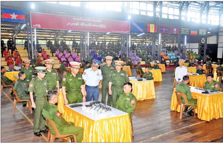
အဆိုပါ စစ်တုရင်ပြိုင်ပွဲကို တိုင်းစစ်ဌာနချုပ်ကွပ်ကဲမှုအောက် တပ်ရင်း၊ တပ်ဖွဲ့များမှ ပြိုင်ပွဲဝင် အသင်း ၁၀ သင်းဖြင့် ဇူလိုင် ၂၈ ရက်

နေပြည်တော် ဇူလိုင် ၂၁ အနောက်တောင်တိုင်း စစ်ဌာနချုပ် ၂၀၂၃ ခုနှစ် တိုင်းမှူးခိုင်းစစ်တုရင်ပြိုင်ပွဲ ဖွင့်ပွဲကို ယနေ့ နံနက်ပိုင်းတွင် တိုင်းစစ်ဌာနချုပ် တပ်နယ်အားကစားရုံ၌ ကျင်းပရာ တိုင်းမှူး ဗိုလ်မှူးချုပ် ကြည်ခိုင်နှင့် တာဝန်ရှိသူများ၊ အရာရှိ၊ စစ်သည်၊ မိသားစုဝင်များ၊ ပြိုင်ပွဲဝင်အားကစားသမားများနှင့် ခိုင်းအဖွဲ့ဝင်များ တက်ရောက်ကြသည်။