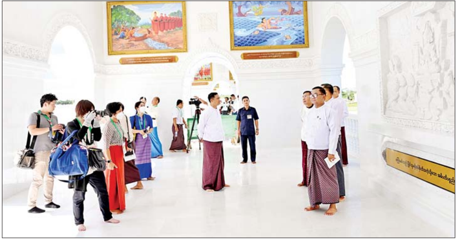
သတင်းစာရှင်းလင်းပွဲသို့ တက်ရောက်လာကြသူများ မာရဝိဇယ ဗုဒ္ဓရုပ်ပွားတော်မြတ်ကြီးနှင့် မာရဝိဇယဗုဒ္ဓဥယျာဉ်တော်အတွင်း လှည့်လည်ကြည့်ရှုဖူးမြော်ကြရာ တာဝန်ရှိသူများက လိုက်လံရှင်းလင်းပြသစဉ်။