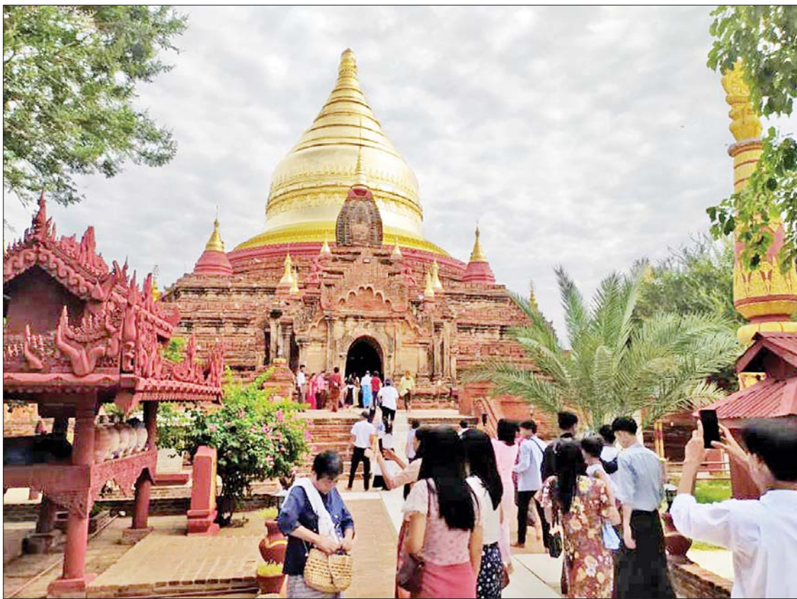
ညောင်ဦးမြို့နယ် ပုဂံရှေးဟောင်းယဉ်ကျေးမှုနယ်မြေရှိ ဓမ္မရာဇာဘုရားသို့ ဘုရားဖူးလာရောက်ကြသူများကို တွေ့ရစဉ်။