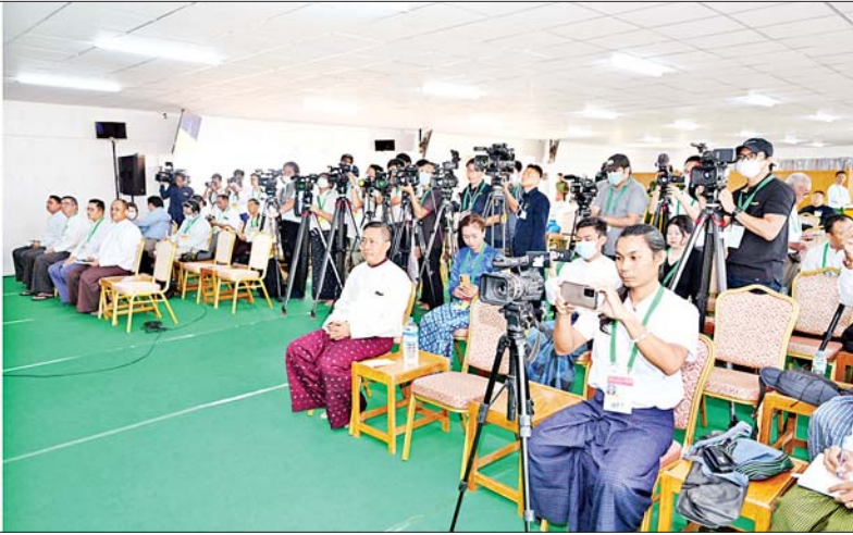
နိုင်ငံတော်စီမံအုပ်ချုပ်ရေးကောင်စီ သတင်းထုတ်ပြန်ရေးအဖွဲ့ ခေါင်းဆောင် ဗိုလ်ချုပ် ဇော်မင်းထွန်း မာရဝိဇယဗုဒ္ဓရုပ်ပွားတော်မြတ်ကြီး တည်ထားကိုးကွယ်မှုနှင့်ပတ်သက်၍ ရှင်းလင်းပြောကြားစဉ်။

သိရှိလိုသည့် မေးမြန်းမှုများကို ပြန်လည်ဖြေကြားသည်။ ဦးစွာ နိုင်ငံတော်စီမံအုပ်ချုပ်ရေးကောင်စီ သတင်းထုတ်ပြန်ရေးအဖွဲ့ ခေါင်းဆောင် ဗိုလ်ချုပ်ဇော်မင်းထွန်းက မာရဝိဇယဗုဒ္ဓရုပ်ပွားတော်မြတ်ကြီးကို မြန်မာနိုင်ငံတွင် ထေရဝါဒဗုဒ္ဓသာသနာတော်ကြီး ခိုင်မာစွာထွန်းလင်းတောက်ပလျက်ရှိမှုအား ကမ္ဘာကိုပြသရန်၊ မြန်မာနိုင်ငံသည် ထေရဝါဒဗုဒ္ဓသာသနာကိုးကွယ်မှု၏ ဗဟိုချက်ဖြစ်စေရန်၊ နိုင်ငံတော်ကြီးသာယာဝပြောမှုရှိစေရန်၊ ကမ္ဘာကြီး ငြိမ်းချမ်းသာယာမှုဖြစ်စေရန် စသည့်ရည်ရွယ်ချက် (၄)ရပ်ဖြင့် တည်ထားကိုးကွယ်ရေး ဆောင်ရွက်ခဲ့မှု၊ မာရဝိဇယဗုဒ္ဓရုပ်ပွားတော်မြတ်ကြီးဆိုင်ရာ အချက်