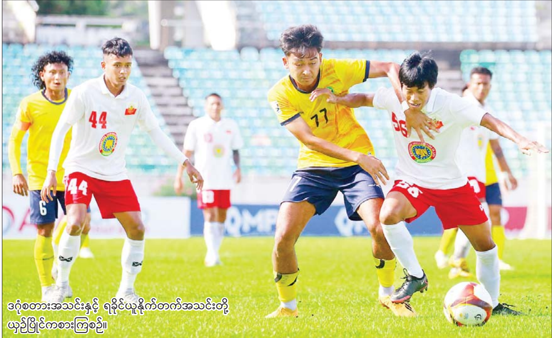
ဒဂုံစတားအသင်းနှင့် ရခိုင်ယူနိုက်တက်အသင်းတို့ ယှဉ်ပြိုင်ကစားကြစဉ်။