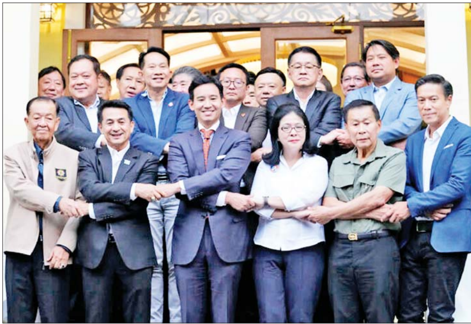
များနှင့် အထက်လွှတ်တော်အမတ်များထံမှ ထောက်ခံမှုရရှိရန် အစွမ်းကုန်ကြိုးပမ်းသွားမည် ဖြစ်ကြောင်း ဖွဲ့ထိုင်းပါတီခေါင်းဆောင် ချိုင်လန်နန်ဆို

ညွှန်ပေါင်းအဖွဲ့မှ ပါတီများသည် ဝန်ကြီးချုပ် ရာထူးနေရာအတွက် အောက်လွှတ်တော်အမတ်