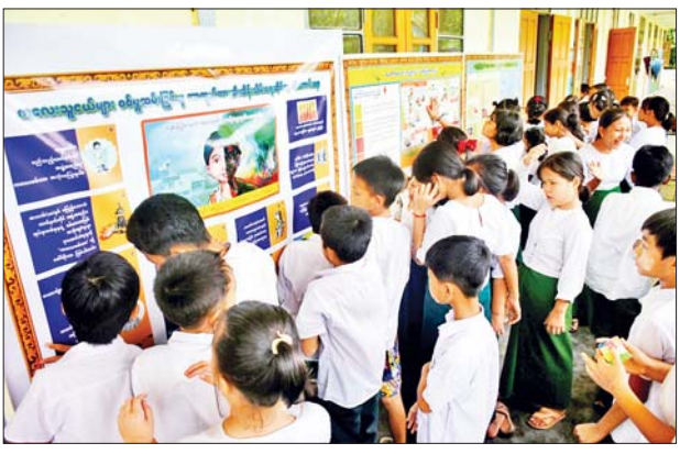
တို့ကို ဟောပြောဆွေးနွေးပြီး ယှဉ်ပြိုင်ခြင်းများ ပြုလုပ်ခဲ့ကြ ကျောင်းသား ကျောင်းသူများက ကျောင်းသား ကျောင်းသူများက စာအုပ်စာစောင်များကို စိတ်ကြိုက် အဆိုပါ စာဖတ်ရိုက်နှိပ်ဖြန့်ဖြူးခြင်းနှင့် အသိပညာပေး လုပ်ငန်းတွင် ရွေးချယ်ဖတ်ရှုကာ စာဖတ် စွမ်းရည် ပိုပြင်ပြော၊ ကဗျာရွတ်ဆို ပြန်ကြားရေးနှင့် ပြည်သူ့ဆက်ဆံ

သထုံ ဇူလိုင် ၂၁ မွန်ပြည်နယ် သထုံမြို့နယ်တွင် ယနေ့မွန်လွှဲပိုင်းက လိပ်အင်း ရပ်ကွက်ရှိ စိန်ကုန်း အခြေခံပညာ မူလတန်း(လွန်)ကျောင်း၌ နယ်လှည့် စာကြည့်တိုက် ဖွင့်လှစ်သည်။ နယ်လှည့် စာကြည့်တိုက် လိုက်လံဖွင့်လှစ်ရာတွင် ခရိုင် ပြန်ကြားရေးနှင့် ပြည်သူ့ဆက်ဆံ ရေးဦးစီးဌာနမှ ဝန်ထမ်းများက ကျောင်းသား ကျောင်းသူများ အားလပ်ချိန်ကို အကျိုးရှိစွာ အသုံးပြုကြရေး၊ ကျောင်းစာကို ကြိုးစားကြသလို ဗဟုသုတ တိုးပွားရေးအတွက် ပြင်ပစာပေ များကိုပါ လေ့လာဖတ်ရှုကြရေး