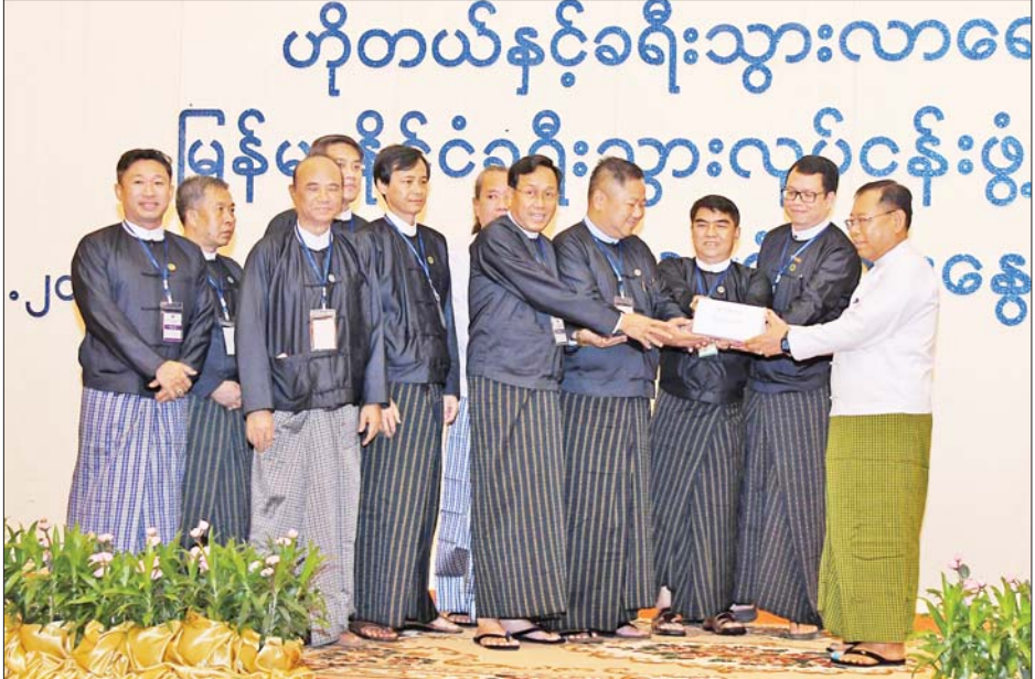
နိုင်ငံတော်စီမံအုပ်ချုပ်ရေးကောင်စီဝင် ဒုတိယဝန်ကြီးချုပ်နှင့် ပြည်ထောင်စုဝန်ကြီး ဒုတိယဗိုလ်ချုပ်ကြီး စိုးထွဋ်ထံ မြန်မာနိုင်ငံ ဟိုတယ်နှင့်ခရီးသွားလုပ်ငန်းရှင်များအသင်းမှ တာဝန်ရှိသူများက မိုခါ မုန်တိုင်းဒဏ်သင့်ဒေသများအတွက် ပြန်လည်ထူထောင်ရေးလုပ်ငန်း များဆောင်ရွက်ရန် အလှူငွေကျပ် သိန်း ၅၀၀ ကို ပေးအပ်လှူဒါန်းစဉ်။

ယနေ့ ကျင်းပပြုလုပ်သည့် အလုပ်ရုံဆွေးနွေးပွဲမှ ဖော်ထုတ် ရရှိချက်များအပေါ် ဖြေရှင်း ဆောင်ရွက်နိုင်မည့် နည်းလမ်း များ၊ အကြံပြုချက်များနှင့် စာမျက်နှာ ၄ သို့ ✕