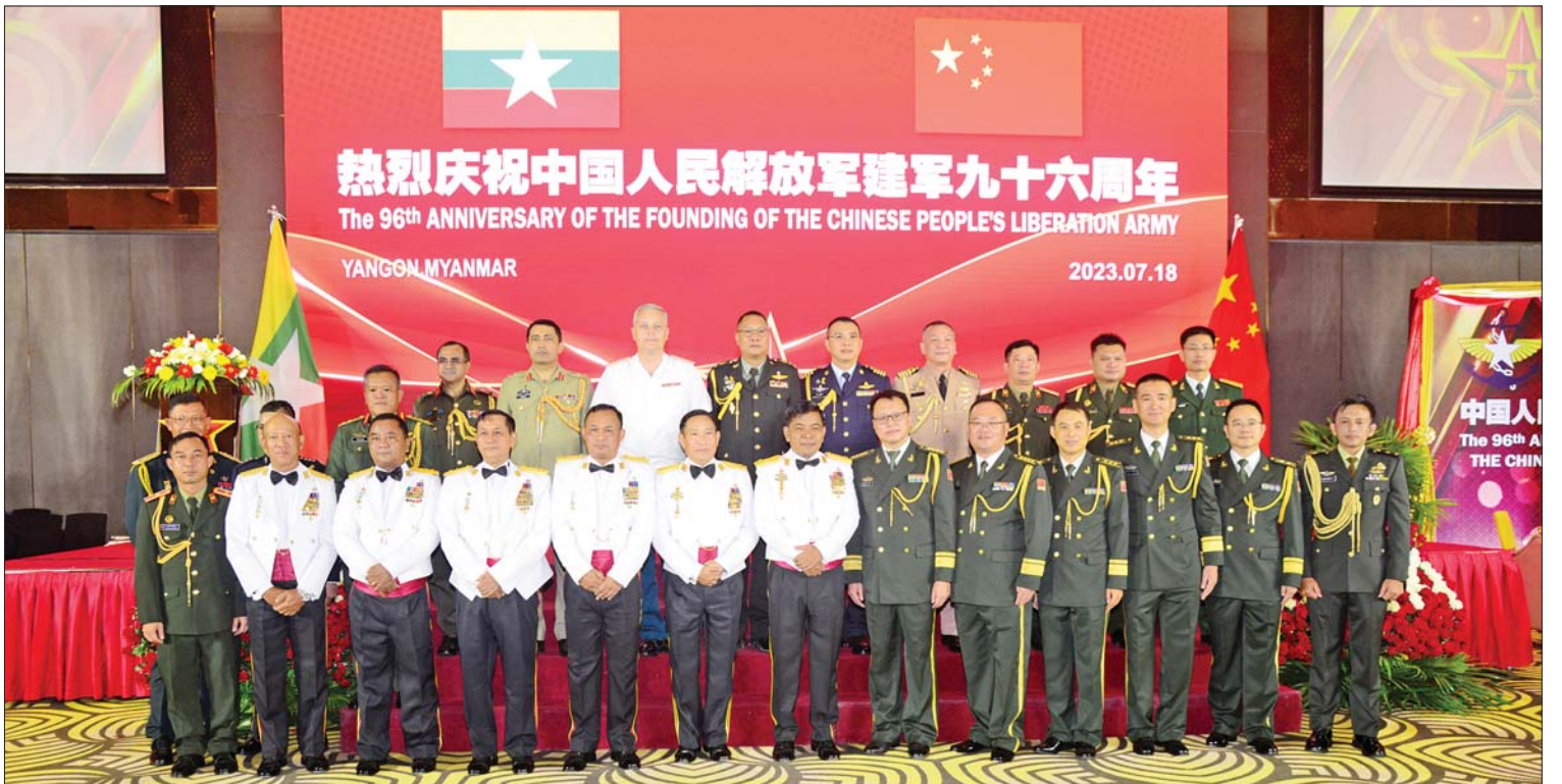
ညိုနှိုင်းကွပ်ကဲရေးမှူး(ကြည်း၊ ရေ၊ လေ) ဗိုလ်ချုပ်ကြီး မောင်မောင်အေး တရုတ်ပြည်သူ့လွတ်မြောက်ရေးတပ်မတော် တည်ထောင်သည့် (၉၆)နှစ်မြောက် အခမ်းအနားသို့ တက်ရောက်လာကြသူများနှင့်အတူ စုပေါင်းမှတ်တမ်းတင်ဓာတ်ပုံရိုက်စဉ်။