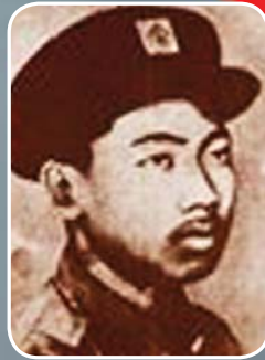
ရဲဘော်ကိုထွေး