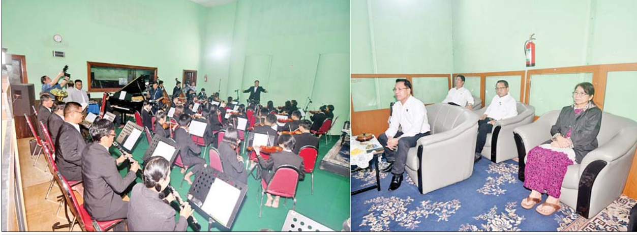
ပြည်ထောင်စုဝန်ကြီး ဦးမောင်မောင်အုန်း မြန်မာ့အသံနှင့် ရုပ်မြင်သံကြား(ရန်ကုန်)၌ သံစုံတီးဝိုင်း၏ တီးမှုတ်သီဆိုသရုပ်ပြသမှုကို ကြည့်ရှုအားပေးစဉ်။

ရန်ကုန် ဇူလိုင် ၁၈ ပြန်ကြားရေး ဝန်ကြီးဌာန ပြည်ထောင်စုဝန်ကြီး ဦးမောင်မောင်အုန်းသည် ယနေ့မွန်းလွဲပိုင်းတွင် မြန်မာ့အသံနှင့် ရုပ်မြင်သံကြား(ရန်ကုန်)၌ သံစုံတီးဝိုင်း၏ နိုင်ငံတကာ တေးသီချင်းများ လေ့ကျင့်တီးခတ်သီဆိုမှု၊ တစ်ဦးချင်း ကိုယ်ရည်ကိုယ်သွေးမြှင့်တင်ရေး သင်တန်း (Personal Grooming Course) သင်ကြားနေမှုနှင့် လူ့ရွှင်တော်စတားကောင်းထက်စီစဉ်သည့် “ဟာသမြို့တော်ရယ်စရာ စင်တင်ဟာသ တစ်ခန်းရုပ်ပြဇာတ်” ရိုက်ကူးနေမှုတို့ကို ကြည့်ရှုအားပေးပြီး ဝန်ထမ်းများအား ထောက်ပံ့ငွေများ ပေးအပ်ချီးမြှင့်သည်။ ရှေးဦးစွာ မြန်မာ့အသံနှင့် ရုပ်မြင်သံကြား(ရန်ကုန်) Studio (B)၌ မြန်မာ့အသံနှင့် ရုပ်မြင်