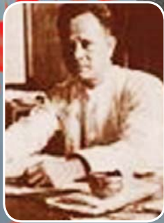
မန်းဘခိုင်