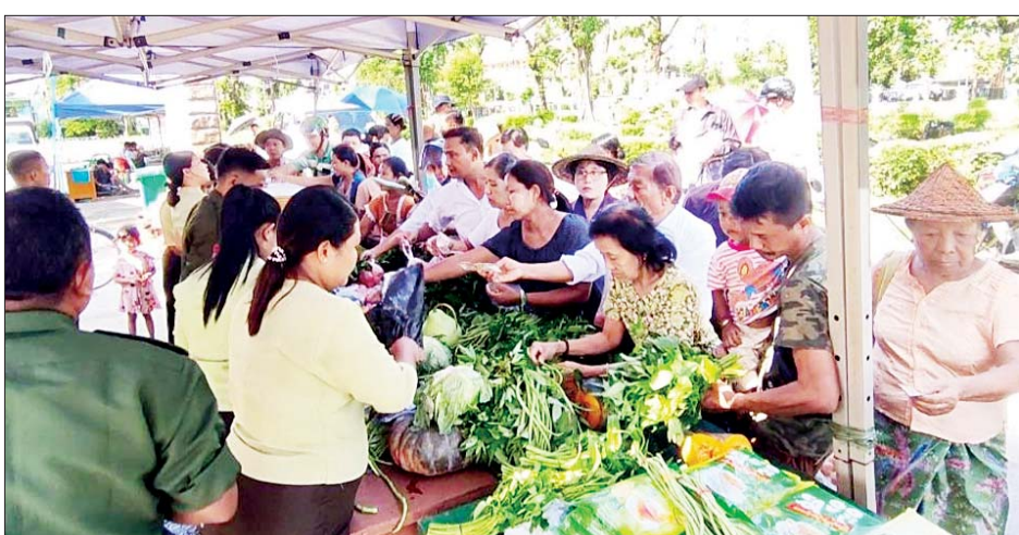
အခက်အခဲဖြစ်ပေါ်နေချိန်တွင် သက်သာသောဈေးနှုန်း အထူးပင်ကျေးဇူးတင်ရှိကြောင်း သိရသည်။ များဖြင့် ရောင်းချပေးမှုအပေါ် တာဝန်ရှိသူများအား သတင်းစဉ်

နေပြည်တော် ဇူလိုင် ၁၈ ဆိုင်ကလုနီးမုန့်တိုင်း(မိုခါ)တိုက်ခတ်မှုကြောင့် မုန့်တိုင်းဒဏ်သင့် ဒေသခံပြည်သူများနှင့် ဌာနဆိုင်ရာ ဝန်ထမ်းများ၏ စားသောက်ရေးအဆင်ပြေစေရန်နှင့် မိမိတို့အလိုရှိရာ စားသောက်ကုန်ပစ္စည်းများကို ဈေးနှုန်းသက်သာစွာဖြင့် ဝယ်ယူစားသောက်နိုင်ရေး အတွက် အနောက်ပိုင်းတိုင်းစစ်ဌာနချုပ်၊ နယ်မြေခံ တပ်မတော်သားများနှင့် တာဝန်ရှိသူများက နေ့စဉ် ရောင်းချပေးလျက်ရှိသည်။ ရောင်းချပေးလျက်ရှိ ယနေ့တွင်လည်း စစ်တွေမြို့ဦးဥတ္တမပန်းခြံနှင့် ဘူးသီးတောင်မြို့ ဦးဥတ္တမခန်းမရှေ့တို့၌ ဆန်၊ ဆီ၊ ဆား၊ အသား/ ငါး၊ ကြက်ဥ၊ ဘဲဥ၊ နို့ထွက်ပစ္စည်းများ၊ ဟင်းသီးဟင်းရွက်များ၊ ကြက်သွန်နီ၊ ကြက်သွန်ဖြူနှင့် တပ်မတော်စက်ရုံများနှင့် မြန်မာစီးပွားရေးကော်ပို