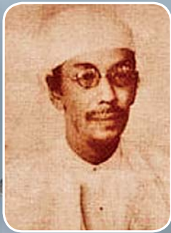
ဒီးဒုတ်ဦးဘချို