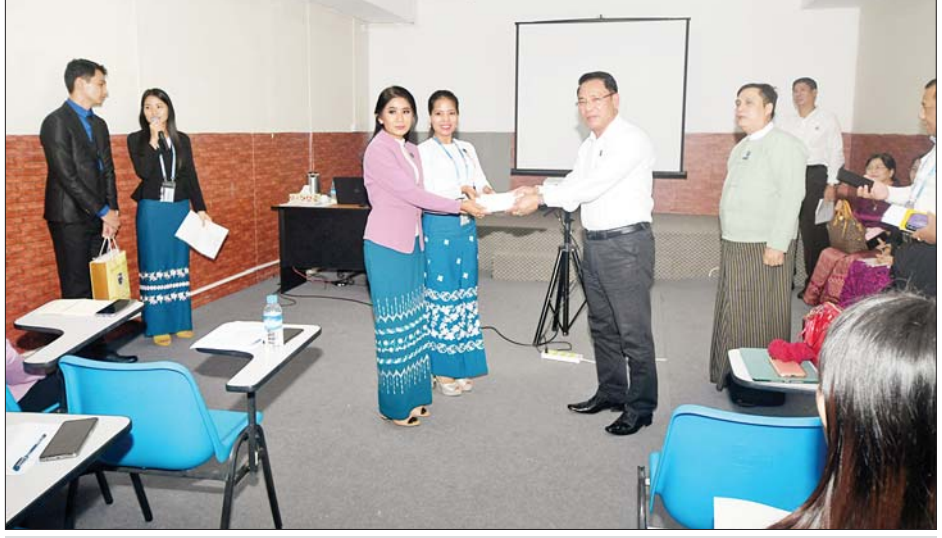
ပြည်ထောင်စုဝန်ကြီး ဦးမောင်မောင်အုန်း တစ်ဦးချင်း ကိုယ်ရည်ကိုယ်သွေး မြှင့်တင်ရေးသင်တန်းမှ သင်တန်းသားများအတွက် ထောက်ပံ့ငွေများပေးအပ်စဉ်။