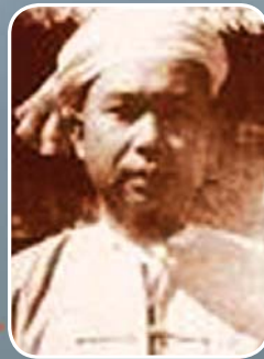
စစ်စံထွန်း