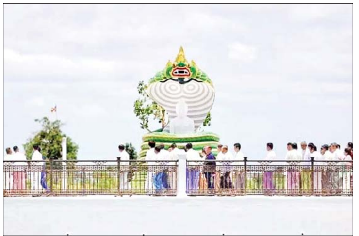
နေပြည်တော် မာရဝိဇယ ဗုဒ္ဓဥယျာဉ်တော်အတွင်းရှိ နဂါးရုံဘုရားကို တွေ့မြင်ရပုံ။

သုဓမ္မာဇရပ်နှင့်အောင်မြေ ဘုရားကြီးပေါ်သို့ တက်ရောက် ဖူးမြော်ကြည့်ညိုချိန်တွင် သုဓမ္မာဇရပ် များ၊ ကျောက်စာရုံစေတီတော်များ၊ ရေပန်းကြီး၊ ရေပန်းငယ်များဖြင့် တင့်တယ်ဝေဆာလျက်ရှိပြီး ဘုရားဖူးရာ လမ်းတစ်လျှောက် မြတ်ဗုဒ္ဓအရိပ် အာဝါသ၏ အေးမြမှု၊ စကျင်ကျောက်၏ အေးမြမှုများကြောင့် ဘုရားဖူးဓမ္မ မိတ်ဆွေများ၏ စိတ်အစဉ်ကို အေးမြ ကြည်လင်စေလျက်ရှိပါသည်။ သုဓမ္မာ ဇရပ်များသည် ကျွန်းတိုင်များအသုံးပြု၍ မြန်မာမှုလက်ရာများဖြင့် ရှေးမူမပျက် ဆောက်လုပ်ထားခြင်းဖြစ်ရာ စာရေးသူ ငယ်ငယ်က မန္တလေးတောင်ခြေသို့ သွားရင်း တစ်ထောက်နားချိန် ဆွေမျိုး များ၊ မိသားစုများနဲ့အတူ လက်ဆုံစားခဲ့ သော ရတနာပုံမြို့တည် မင်းတုန်းမင်း၏ သုဓမ္မာဇရပ်များအား ပြန်လည်အမှတ်ရ