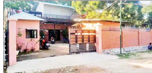
၂၀၂၂ ခုနှစ် ဒီဇင်ဘာ ၂၄ ရက်တွင် စဉ့်ကိုင်မြို့နယ် ပလိပ်မြို့ ဝန်ထမ်းကွက်သစ်ရပ်ရှိ Heart Zoom စားသောက်ဆိုင်အား အကြမ်းဖက်သမားများ က လက်လုပ်ခိုင်းဖြင့် ပစ်ခတ်မှုကြောင့် ပျက်စီးမှုမှတ်တမ်းဓာတ်ပုံ။