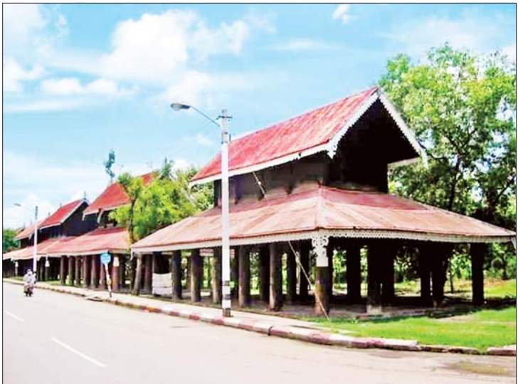
မန္တလေးတောင်ခြေရှိ မင်းတုန်းမင်း၏ ကောင်းမှုတော်ဖြစ်သော သုဓမ္မာဇရပ်များ။