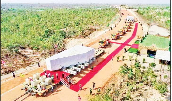
ကျောက်တုံးတော်ကြီးအား ကုန်းလမ်းခရီးဖြင့် သယ်ဆောင်ပုံ။

တာဝန်ရှိပုဂ္ဂိုလ်များ၊ သတ္တလုပ်ငန်း ကုမ္ပဏီများမှ တာဝန်ရှိပုဂ္ဂိုလ်များ ပါဝင် သည်ကို တွေ့ရှိရပါသည်။