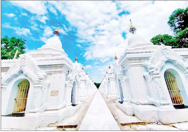
မန္တလေးမြို့ မဟာလောကမာရဇိန် ကုသိုလ်တော်ဘုရားရှိ ပိဋကတ်ကျောက်စာရုံများ။

ပူဇော်ခြင်း မဟာမင်္ဂလာအခမ်းအနား များကို ကျင်းပပြုလုပ်ခဲ့ပါသည်။ ရုပ်ပွား တော်မြတ်ကြီးသည် ဉာဏ်တော်အမြင့် ၆၃ ပေ၊ ပလ္လင်တော်အမြင့် ၁၈ ပေ စုစုပေါင်း ၈၁ ပေ အမြင့်ရှိပြီး ဆင်းတု တော် အလေးချိန် ၁၇၈၂ တန်၊ ပလ္လင် တော် အလေးချိန် ၃၅၁၀ တန် စုစုပေါင်း အလေးချိန် ၅၂၉၂ တန် ရှိပါသည်။ အဆိုပါ အလေးချိန်မှာ အာကာသယာဉ် (Space Shuttle)များထက် တန်ချိန် ပိုမိုများကာ အလေးချိန်ကို အတိအကျ တွက်ချက်ခဲ့ရပြီး ရုပ်ပွားတော်မြတ်ကြီး အား တည့်မတ်ရာတွင်လည်း အမှား အယွင်းမရှိ တွက်ချက်ဆောင်ရွက်နိုင်မှု သည် အံ့ဩဖွယ်မှတ်တမ်းတစ်ခုအဖြစ် သမိုင်းတွင်ရစ်မှတ်ဖြစ်ပါသည်။