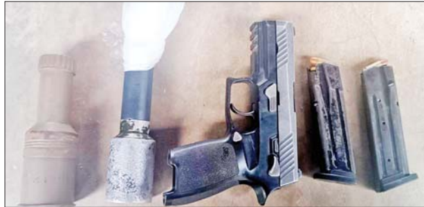
အမရပူရမြို့နယ် ဝက်ကုန်းတမာတန်းရပ်တွင် ဖမ်းဆီးရမိသည့် လက်နက်/ခဲယမ်းများအား တွေ့ရစဉ်။

အထက်ပါ ဖမ်းဆီးရမိတရားခံများအား ဥပဒေအရ ထိရောက်စွာအရေးယူနိုင်ရေး ဆက်လက်ဆောင်ရွက် သွားမည်ဖြစ်ကြောင်း၊ အကြမ်းဖက်မှု ဆောင်ရွက်နေသူ များအား ပြည်သူတစ်ရပ်လုံးက ဝိုင်းဝန်းကာကွယ် တိုက်ဖျက်ကြရန်နှင့် ဆက်စပ်တရားခံများအား အမြန်ဆုံး ဖမ်းဆီးရမိရေးအတွက် ၎င်းတို့ ပုန်းခိုရာနေရာများ၊ လှုပ်ရှားသွားလာနေထိုင်မှု သတင်းများရရှိပါက သက်ဆိုင်ရာသို့ လျှို့ဝှက်စွာ သတင်းပေးတိုင်ကြားနိုင်ပါ ကြောင်း၊ သတင်းပေးသူနှင့် ဖမ်းဆီးပေးသူများအား ထိုက်တန်စွာလျှို့ဝှက်၍ ဆုငွေများချီးမြှင့်ပေးမည် ဖြစ်ကြောင်းနှင့် မြို့ရွာများ အမြန်ဆုံး အေးချမ်းတည်ငြိမ် ရေးအတွက် ပြည်သူတစ်ရပ်လုံး ပူးပေါင်းပါဝင် ကြိုးပမ်း ဆောင်ရွက်နိုင်ပါရန် မေတ္တာရပ်ခံအပ်ပါကြောင်း အသိပေး သတင်းထုတ်ပြန်ထားသည်။ သတင်းစဉ်