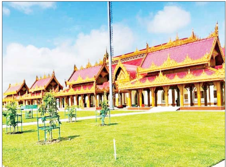
နေပြည်တော် မာရဝိဇယ ဗုဒ္ဓဥယျာဉ်တော်အတွင်းရှိ သုဓမ္မာဇရပ်များ။