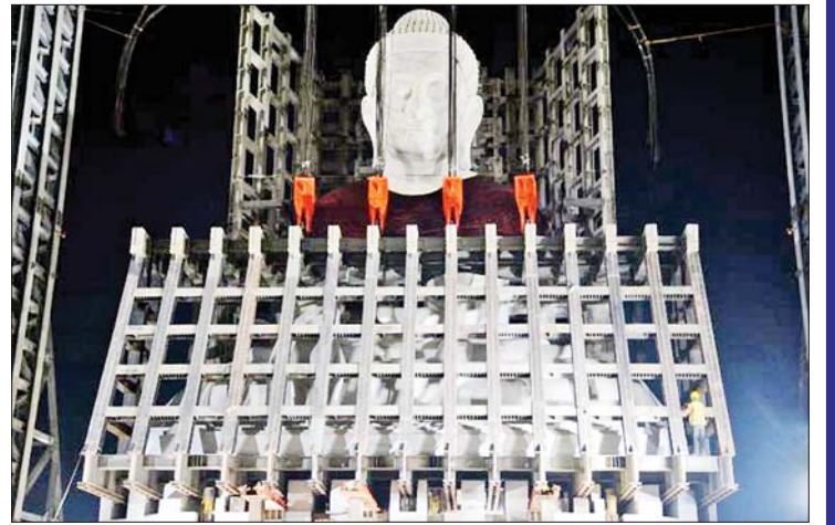
ဆင်းတုတော် အပိုင်း(၁၊ ၂၊ ၃၊ ၄) အား ရတနာပလ္လင်ထက်သို့ ပင့်ဆောင်နေပုံ။

ရာသီဥတုနှင့် အခြားသဘာဝ ဘေးဒဏ်များ ခံနိုင်ရည်ရှိရေး ဗုဒ္ဓရုပ်ပွားတော်မြတ်ကြီးအား ရာသီ ဥတုနှင့် အခြားသဘာဝဘေးဒဏ်များ ခံနိုင်ရည်ရှိရေးအတွက် ၂၀၀၈ ခုနှစ်တွင် ဖြစ်ပွားခဲ့သည့် နာဂစ်မုန်တိုင်း၏ အပြင်းဆုံးလေတိုက်နှုန်း 120 Mph နှင့် မြန်မာနိုင်ငံတွင် အမြင့်ဆုံးလှုပ်ခတ်နိုင် သည့် cလျင်လှုပ်ခတ်နှုန်း Earthquake Magnitude 8.7, 8.8 အထိ ခံနိုင်ရည်ရှိစေ ရန် Steel Rebars များ ထည့်သွင်းအား ဖြည့်ထားကာသမားရိုးကျနည်းလမ်းများ နှင့် ခေတ်မီနည်းလမ်းများ ပေါင်းစပ်၍ Composite နည်းပညာအသုံးပြုတွဲဆက် ခြင်းများ ဆောင်ရွက်ထားကြောင်း သိရှိ ရပါသည်။ နိုင်ငံတော်အကြီးအကဲက ဗုဒ္ဓရုပ်ပွားတော်ကြီး ရေရှည်တည်တံ့ ခိုင်မြဲစေရေး အသေးစိတ်စဉ်းစား တွက်ချက် ဆောင်ရွက်ထားချက်များကို ရှင်းလင်းနေစဉ်တွင် အတွေးတစ်ချက် လက်မိပါသည်။ ရှေးမြန်မာအဆက်ဆက် တည်ထားခဲ့သော ရှေးဟောင်းစေတီ ပုထိုးများသည် ခေတ်အဆက်ဆက်က သဘာဝဘေး၊ စစ်ဘေးတို့ကို အမျိုးမျိုး