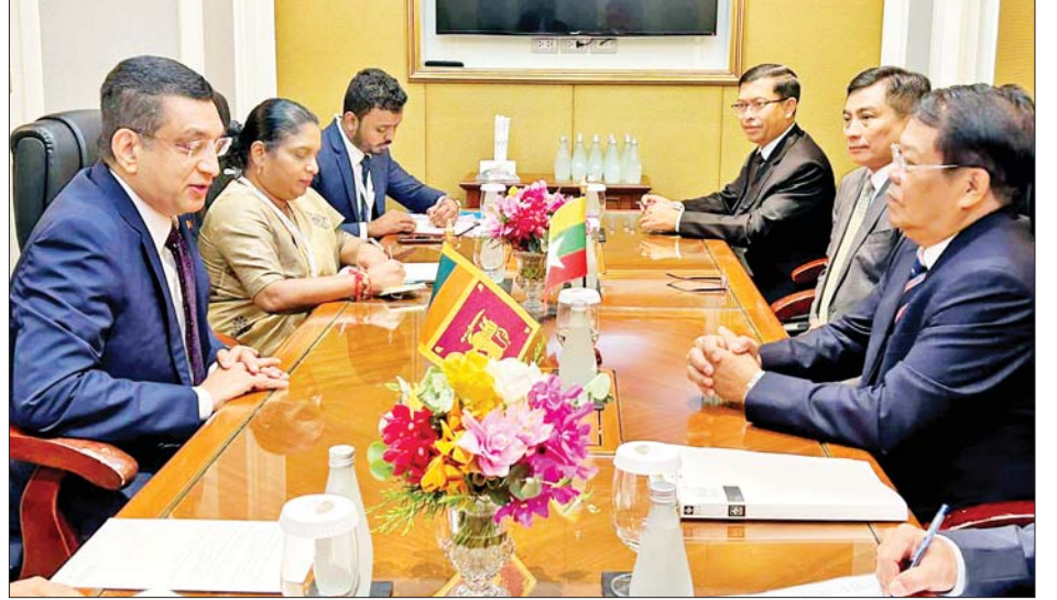
ပြည်ထောင်စုဝန်ကြီး ဦးသန်းဆွေ သီရိလင်္ကာနိုင်ငံခြားရေးဝန်ကြီး မစ္စတာ အလီဆာဘရီနှင့် တွေ့ဆုံဆွေးနွေးစဉ်။