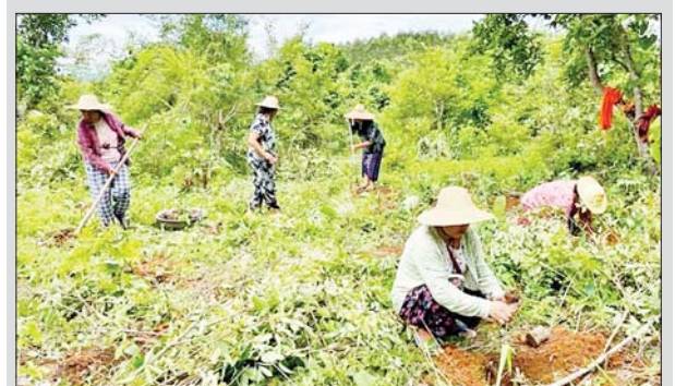
ရှမ်းပြည်နယ်(မြောက်ပိုင်း) သီပေါမြို့ ကုန်းစုံကျေးရွာ ကမ္ဘာ့ဇွန်းရိပ်သာအတွင်း မိုးရာသီသစ်ပင်စုပေါင်းစိုက်ပျိုးပွဲကို ဇူလိုင် ၁၇ ရက်က ကျင်းပရာ ဒေသခံတိုင်းရင်းသားများနှင့် အလှူရှင်များက စိုက်ပျိုးဆောင်ရွက်ကြစဉ်။ ၂၁၀

နေပြည်တော် ဇူလိုင် ၁၇ ယနေ့မုန်လွဲ ၁ နာရီခွဲ တိုင်းထွာချက်အရ ချင်းတွင်းမြစ်ရေသည် ဟုမ္မလင်းမြို့တွင် ယင်းမြို့၏ စိုးရိမ်ရေမှတ်အထက်သို့ တစ်ပေခန့် ကျော်လွန်ရောက်ရှိနေသည်။ အဆိုပါ မြစ်ရေသည် နောက်နှစ်ရက်အတွင်း ပေဝက်ခန့် မြင့်တက်လာနိုင်ပြီး ယင်းမြို့၏ စိုးရိမ်ရေမှတ်အထက် ဆက်လက်တည်ရှိနိုင်သည်။ အကြံပြုချက် သို့ဖြစ်ပါ၍ ဟုမ္မလင်းမြို့နယ်အတွင်းရှိ မြစ်ကမ်းအနီးနှင့် မြေခိုခိုပိုင်းနေထိုင်သူများ အနေဖြင့် အထူးသတိပြုနေထိုင်ကြပါရန် အကြံပြုအပ်ပါသည်။ မိုး/ဇေလ