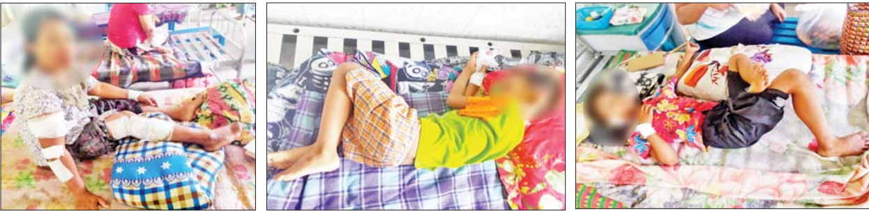
PDF အမည်ခံ အကြမ်းဖက်သမားများက လက်လုပ်စိန်ပြောင်းများဖြင့် အကြောင်းမဲ့ ပစ်ခတ်တိုက်ခိုက်ခဲ့မှုကြောင့် မိုးရာသီသစ်ပင်စိုက်ပျိုးပွဲ ပါဝင်ဆင်နွှဲခဲ့ကြသည့် ဌာနဆိုင်ရာဝန်ထမ်းများ၊ ဒေသခံပြည်သူများ၊ ကျောင်းသား ကျောင်းသူများ ထိခိုက်ဒဏ်ရာရရှိမှုကို တွေ့ရစဉ်။

PDF အမည်ခံ အကြမ်းဖက်သမားများက လက်လုပ်စိန်ပြောင်း များဖြင့် အကြောင်းမဲ့ ပစ်ခတ်တိုက်ခိုက်ခဲ့မှုကြောင့် မိုးရာသီ သစ်ပင်စိုက်ပျိုးပွဲ ပါဝင်ဆင်နွှဲခဲ့ကြသည့် ဌာနဆိုင်ရာဝန်ထမ်းများ၊ ဒေသခံပြည်သူများ၊ ကျောင်းသား ကျောင်းသူများအနက် တစ်ဦး သေဆုံး၊ အသက် ၁၀ နှစ်အောက် ကလေးငယ် သုံးဦးအပါအဝင် ၁၁ ဦး ထိခိုက်ဒဏ်ရာရရှိခဲ့သည့်ဖြစ်စဉ်ပုံ