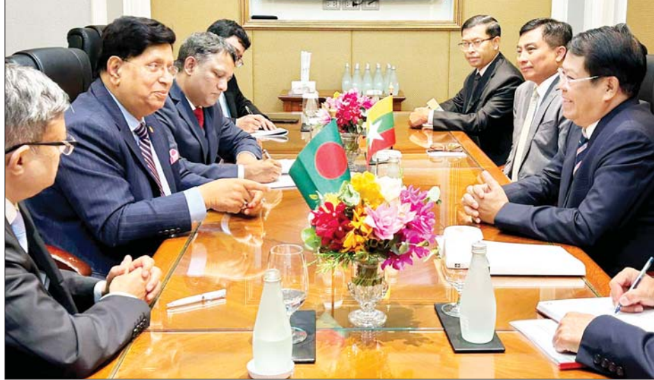
ပြည်ထောင်စုဝန်ကြီး ဦးသန်းဆွေ ဘင်္ဂလားဒေ့ရှ် နိုင်ငံခြားရေးဝန်ကြီး ဒေါက်တာအေကေ အဗ္ဗဒူလ် မိုမန်နှင့် တွေ့ဆုံဆွေးနွေးစဉ်။

သီရိလင်္ကာ နိုင်ငံခြားရေးဝန်ကြီးနှင့်တွေ့ဆုံစဉ် နှစ်နိုင်ငံအကြား ရှိရင်းစွဲ ချစ်ကြည်ရင်းနှီးသောဆက်ဆံရေး ပိုမိုတိုးတက်ခိုင်မာရေး၊ နှစ်နိုင်ငံအကြား ကုန်သွယ်ရေးနှင့် ရင်းနှီးမြှုပ်နှံမှု အထူးသဖြင့် ပညာရေး၊ သတင်းအချက်အလက်နည်းပညာ၊ ငွေကြေးကဏ္ဍများတွင် အကျိုးတူပူးပေါင်းဆောင်ရွက်မှုများတိုးမြှင့်ရေး၊ ဒေသတွင်းနှင့် နိုင်ငံတကာ မျက်နှာစာတွင် ပိုမိုပူးပေါင်းဆောင်ရွက်သွားရေးတို့ကို ခင်မင်ရင်းနှီးစွာ အမြင်ချင်းဖလှယ်ကြသည်။ သတင်းစဉ်