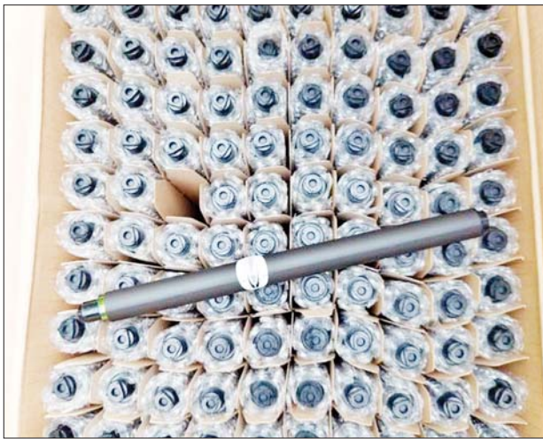
မန္တလေးတိုင်းဒေသကြီး တရားမဝင်ကုန်သွယ်မှုတိုက်ဖျက်ရေး အထူးအဖွဲ့က သတင်းအရ ဖမ်းဆီးရမိမှု။

တရားမဝင်ကုန်သွယ်မှုတိုက်ဖျက်ရေး ဦးဆောင်ကော်မတီ၏ ကြီးကြပ်ကွပ်ကဲမှုဖြင့် တရားမဝင် ကုန်သွယ်မှုများကို ဥပဒေနှင့်အညီ ထိရောက်စွာ တားဆီးအရေးယူနိုင်ရေး ဆောင်ရွက်လျက်ရှိရာ ဇူလိုင် ၁၃ ရက်တွင် မန္တလေးတိုင်းဒေသကြီး တရားမဝင်ကုန်သွယ်မှုတိုက်ဖျက်ရေးအထူးအဖွဲ့က သတင်းအရ မန္တလေး-လားရှိုး ကားလမ်း မိုင်တိုင်အမှတ် ၂၃ မိုင် ၆ ဖာလုံ၌ မူဆယ်မြို့မှ မန္တလေးမြို့သို့ မောင်းနှင်လာသော ယာဉ်နှစ်စီးကို စိစစ်၍ မန္တလေးမြို့နယ် အကောက်ခွန်ဦးစီးဌာနမှူးရုံး၌ အသေးစိတ်စစ်ဆေးမှုများဆောင်ရွက်ခဲ့ရာ သွင်းကုန်ကြေညာလွှာတွင် ကြေညာထားသည်ထက် ပိုမိုပါရှိလာသည့် PVC Reflective Sticker ၁၂၀၉၁ ကီလိုဂရမ်၊ Printer Spare Part Opc Drum ၉၄၅ ခု၊ DELL Core i5 Laptop အလုံး ၅၀ အပါအဝင် ကုန်ပစ္စည်း ၁၂ မျိုး (ခန့်မှန်းတန်ဖိုးငွေကျပ် ၁၉၇၇၆၁၂၄၄) နှင့် အဆိုပါပစ္စည်းများ တင်ဆောင်သော Nissan Diesel Tractor Head တစ်စီး၊ Mitsubishi Fuso Tractor Head တစ်စီးနှင့် နောက်တွဲယာဉ် နှစ်စီး (ခန့်မှန်းတန်ဖိုးငွေကျပ် ၁၅၅၀၀၀၀၀) စုစုပေါင်း ခန့်မှန်းတန်ဖိုးငွေကျပ် ၂၅၇၆၁၂၄၄ ကို သိမ်းဆည်းရမိခဲ့ပြီး အကောက်ခွန်လုပ်ထုံးလုပ်နည်းများနှင့်အညီ အရေးယူဆောင်ရွက်လျက်ရှိသည်။