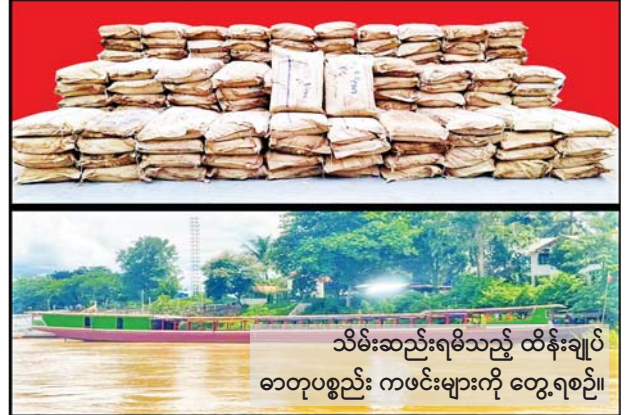
သိမ်းဆည်းရမိသည့် ထိန်းချုပ်ဓာတုပစ္စည်း ကဖင်းများကို တွေ့ရစဉ်။

ရှမ်းပြည်နယ်(အရှေ့ပိုင်း) တာချီလိတ်မြို့နယ် မဲခေါင်မြစ်အတွင်း