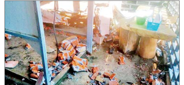
၂၀၂၂ ခုနှစ် ဒီဇင်ဘာ ၂၄ ရက်တွင် စဉ့်ကိုင်မြို့နယ် ပလိပ်မြို့ ဝန်ထမ်းကွက်သစ်ရပ်ရှိ Heart Zoom စားသောက်ဆိုင်အား အကြမ်းဖက်သမားများ က လက်လုပ်ခိုင်းဖြင့် ပစ်ခတ်မှုကြောင့် ပျက်စီးမှုမှတ်တမ်းဓာတ်ပုံ။