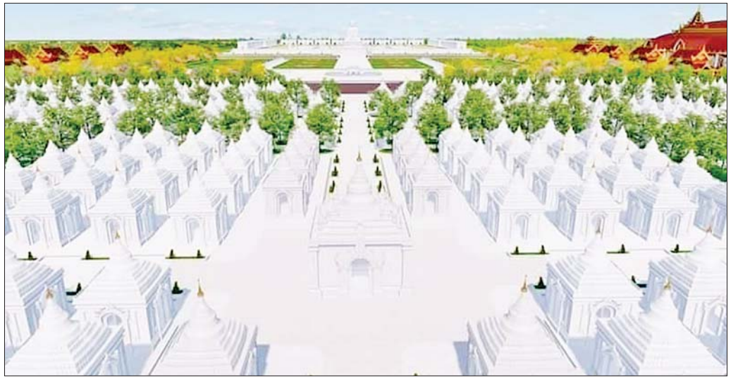
နေပြည်တော် မာရဝိဇယ ဗုဒ္ဓဥယျာဉ်တော်အတွင်းရှိ ကျောက်စာရုံစေတီများ။