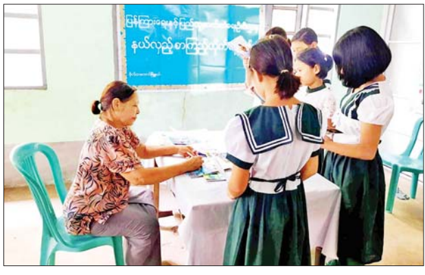
များနှင့်တွေ့ဆုံကာ ကုန်ထုတ်အောင်မြင်အောင် ဆောင်ရွက်နိုင်ညှိနှိုင်း ဆောင်ရွက်ပေးခဲ့ကြောင်း လိုအပ်သည်များ ပေါင်းစပ်သတင်းစဉ်

ထို့သို့ ဆောင်ရွက်လျက်ရှိရာ ယနေ့တွင် ကာကွယ်ရေးဦးစီးချုပ်ရုံး(ကြည်း)မှ ဒုတိယဗိုလ်ချုပ်ကြီး ဖုန်းမြတ်၊ တောင်ပိုင်းတိုင်းစစ်ဌာနချုပ် တိုင်းမှူး ဗိုလ်ချုပ်ထိန်ဝင်းနှင့် တာဝန်ရှိသူများက တောင်ငူတပ်နယ်၊ နယ်မြေခံတပ်ရင်းရှိ စံပြဘက်စိုက်ပျိုးရေးနှင့် မွေးမြူရေးလုပ်ငန်းများကို သွားရောက်ကြည့်ရှုစစ်ဆေးပြီး တာဝန်ရှိသူများနှင့်တွေ့ဆုံကာ ကုန်ထုတ်အောင်မြင်အောင် ဆောင်ရွက်နိုင်ညှိနှိုင်း ဆောင်ရွက်ပေးခဲ့ကြောင်း လိုအပ်သည်များ ပေါင်းစပ်သတင်းစဉ်