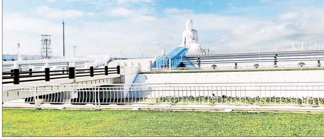
မာရဝိဇယဗုဒ္ဓရုပ်ပွားတော်မြတ်ကြီးအား အဝေးမှဖူးတွေ့ရပုံ။

“လက်တွေ့ဆောင်ရွက်ရာတွင်လည်း ပြည်ပပညာရှင်များ လုံးဝပါရှိခြင်းမရှိဘဲ မြန်မာနိုင်ငံ အင်ဂျင်နီယာအသင်းနှင့် တပ်မတော်သားအင်ဂျင်နီယာများဖြင့်သာ ဆောင်ရွက်ခဲ့ခြင်း၊ သာသနာပြု စိတ်အားထက်သန်သော ဗုဒ္ဓဘာသာဝင်အများစု ရှိသော နိုင်ငံဖြစ်ခြင်း၊ ကြီးမားသည့် စကျင်ကျောက်တောင်ကြီး တည်ရှိနေခြင်း၊ ဦးစီးဦးဆောင်ပြုသည့် ဦးဆောင်ဒါယကာနှင့် အလှူရှင်အများစု၏ သဒ္ဓါတရားပြည့်စုံခြင်း စသည့် အကြောင်း အချက်များ ပြည့်စုံ၍ ဖြစ်ပေါ်လာခြင်းဖြစ်”