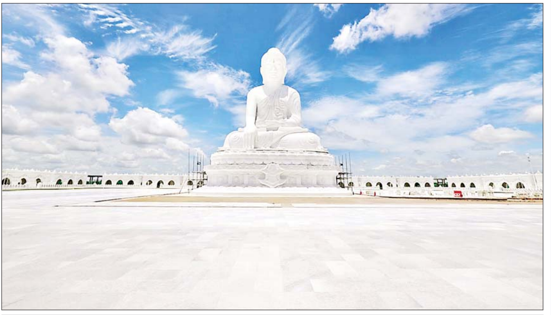
မာရဝိဇယဗုဒ္ဓရုပ်ပွားတော်မြတ်ကြီးအား အဝေးမှဖူးတွေ့ရပုံ။