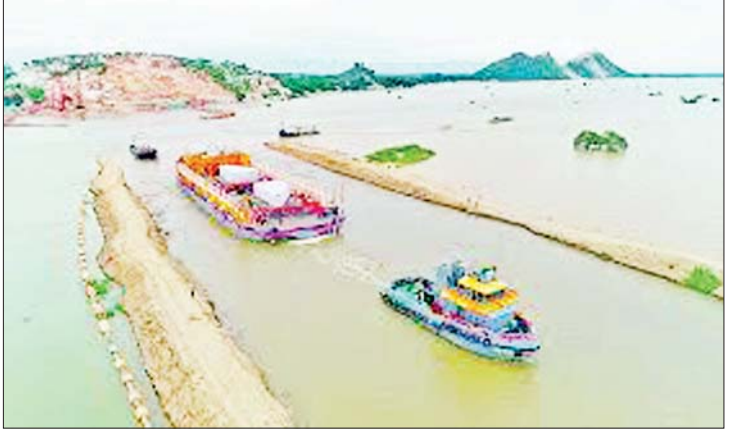
ကျောက်တုံးတော်ကြီးအား တူးမြောင်းဖောက်လုပ်၍ ရေလမ်းခရီးဖြင့် စတင်သယ်ယူပုံ။

တပ်မတော်အနေဖြင့် ယခင်အစိုးရ လက်ထက်ကတည်းကပင် ကိုဗစ်-၁၉ ကပ်ရောဂါဖြစ်ပွားခြင်းနှင့် နိုင်ငံရေးအရ အကျပ်အတည်းဖြစ်ပေါ်ခြင်း စသည့် အခြေအနေ အခက်အခဲအမျိုးမျိုးများ ကြားမှ ကမ္ဘာပေါ်တွင် ဗုဒ္ဓသာသနာ ရောင်ဝါ ထွန်းလင်းပြန့်ပွားစေရန်၊ ပြည်သူ့အများ စိတ်အေးချမ်းကြည်လင် စွာနှင့် ကြည်ညိုသဒ္ဓါပွားများစေရန် စတင်ကြိုးပမ်းဆောင်ရွက်ခဲ့ကြောင်း သိရှိရပါသည်။ တပ်မတော်သည် ထိုအခက်အခဲများကို မဆုတ်မနစ်ရင်ဆိုင် ကျော်လွှားကြိုးပမ်းနိုင်မှု မရှိခဲ့လျှင် စကျင်ကျောက်တောင်ရှိ မူလနေရာတွင် ကျောက်တုံးကြီးအနေဖြင့်သာ ရှိနေမည် ဖြစ်ပြီး ယခုကဲ့သို့ ဗုဒ္ဓဘာသာဝင်တို့၏ ကြည်ညိုဖွယ်ကောင်းသော အထွတ် အမြတ်ထား ကိုးကွယ်ရာနှင့် ကမ္ဘာပေါ်ရှိ ထိုင်တော်မူ ကျောက်ဆစ်ဗုဒ္ဓရုပ်ပွား တော်များအနက် ဉာဏ်တော်အမြင့်ဆုံး ဗုဒ္ဓရုပ်ပွားတော်ကြီး ဖြစ်လာနိုင်စေရာ အကြောင်းတရား ရှိမည်မဟုတ်ပေ။ ယခု အချိန်တွင်မူ ဗုဒ္ဓရုပ်ပွားတော်မြတ်ကြီး သည် မြန်မာနိုင်ငံ မြန်မာလူမျိုးတို့၏ အထင်ကရ ဘုရားတစ်ဆူအဖြစ် မင်းနေပြည်တော်တွင် ခမ်းနားထည်ဝါ