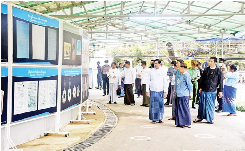
ပြည်ထောင်စုဝန်ကြီး ဦးကိုကိုနှင့် တာဝန်ရှိသူများ ဗိုလ်ချုပ်နေအိမ်ပြတိုက်အတွင်း ပြသထားရှိမှု များကို ကြည့်ရှုစစ်ဆေးစဉ်။

ရန်ကုန် ဇူလိုင် ၁၇ သာသနာရေးနှင့် ယဉ်ကျေးမှုဝန်ကြီးဌာန ပြည်ထောင်စုဝန်ကြီး ဦးကိုကို၊ ရန်ကုန်တိုင်းဒေသကြီး ဝန်ကြီးချုပ် ဦးစိုးသိန်းနှင့် တာဝန်ရှိသူများသည် ယနေ့နံနက်ပိုင်းက ဗဟန်းမြို့နယ် အာဇာနည်ဗိမာန် သို့ သွားရောက်ကြည့်ရှုစစ်ဆေးရာ (၇၆)နှစ်မြောက် အာဇာနည်နေ့အခမ်းအနား ပြင်ဆင်ရေးနှင့် စီစဉ်ရေး ဆင်ကော်မတီအတွင်းရေးမှူးနှင့် တာဝန်ရှိသူများက ပြင်ဆင်ဆောင်ရွက်ပြီးစီးမှုကို ရှင်းလင်းတင်ပြကြ သည်။