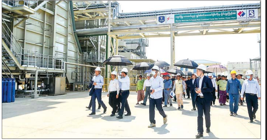
ကျောက်ဖြူသဘာဝဓာတ်ငွေ့နှင့်စွန့်ပစ်အပူသုံးလျှပ်စစ်ဓာတ်အားပေးစက်ရုံကို တွေ့ရစဉ်။