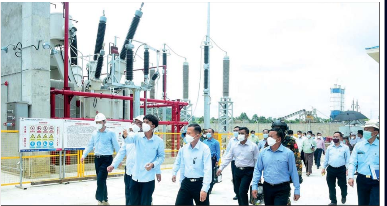
နိုင်ငံတော်စီမံအုပ်ချုပ်ရေးကောင်စီ ဒုတိယဥက္ကဋ္ဌ ဒုတိယဗိုလ်ချုပ်မှူးကြီးစိုးဝင်း ကျောက်ဖြူသဘာဝဓာတ်ငွေ့နှင့် စွန့်ပစ်အပူသုံး လျှပ်စစ်ဓာတ်အားပေးစက်ရုံ တည်ဆောက်မှုကို ဇွန် ၁၄ ရက်က လေ့လာကြည့်ရှုစဉ်။

ရခိုင်ပြည်နယ် ကျောက်ဖြူမြို့နယ်ရှိ ကျောက်ဖြူသဘာဝဓာတ်ငွေ့ နှင့် စွန့်ပစ်အပူသုံး လျှပ်စစ်ဓာတ်အားပေးစက်ရုံသည် ၂၀၂၃ ခုနှစ် မေလ ၁၉ ရက်နေ့တွင် စီးပွားဖြစ်စတင်လည်ပတ်ခြင်း (Combined Cycle Commercial Operation)ကို မူလလျာထားသတ်မှတ်ချက် ထက် ပိုမိုဆောလျင်စွာစတင်နိုင်ခဲ့ပြီး ရခိုင်ပြည်နယ်အပါအဝင် နိုင်ငံတော်ဓာတ်အားစနစ်သို့ လျှပ်စစ်ဓာတ်အားပို့လွှတ်နေပြီဖြစ် ကြောင်း သိရှိရပါသည်။ သဘာဝဓာတ်ငွေ့သုံး ဓာတ်အားပေးစက်များ မှ ၉၀ မဂ္ဂါဝပ် ထုတ်လုပ်နိုင်သည့်အပြင် သဘာဝဓာတ်ငွေ့နှင့် စွန့်ပစ် အပူသုံး ဓာတ်အားပေးစက်ရုံလည်ပတ်မှု (Combined Cycle Gas Turbine Operation) မှ မူလထက် ၄၅ မဂ္ဂါဝပ် သီးသန့်ပိုမိုရရှိစေသဖြင့် မူလ ၉၀ မဂ္ဂါဝပ်အတွက် အသုံးပြုသည့် ဓာတ်ငွေ့ပမာဏဖြင့်ပင် ၁၃၅ မဂ္ဂါဝပ် ထုတ်လုပ်လျက်ရှိပါသည်။ ကျောက်ဖြူသဘာဝဓာတ်ငွေ့ နှင့် စွန့်ပစ်အပူသုံး လျှပ်စစ်ဓာတ်အားပေးစက်ရုံမှ လျှပ်စစ်ဓာတ်အား