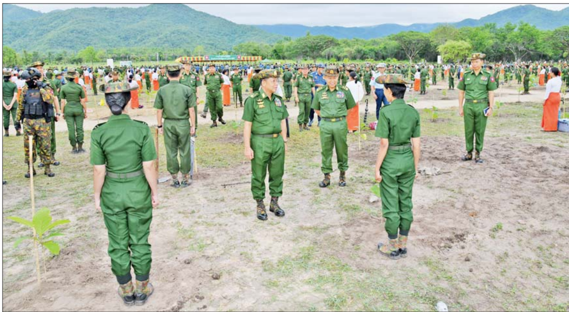
နိုင်ငံတော်စီမံအုပ်ချုပ်ရေးကောင်စီဥက္ကဋ္ဌ တပ်မတော်ကာကွယ်ရေးဦးစီးချုပ် ဗိုလ်ချုပ်မှူးကြီးမင်းအောင်လှိုင် အရာရှိ စစ်သည်မိသားစုများ၏ စုပေါင်းသစ်ပင်စိုက်ပျိုးမှုကို ကြည့်ရှုအားပေးစဉ်။