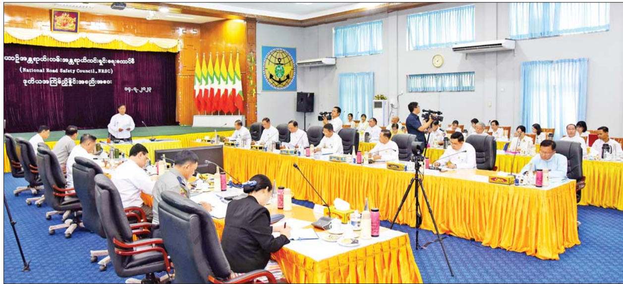
အမျိုးသားယာဉ်အန္တရာယ်၊ လမ်းအန္တရာယ်ကင်းရှင်းရေးကောင်စီဥက္ကဋ္ဌ ဒုတိယဝန်ကြီးချုပ်နှင့် ပြည်ထောင်စုဝန်ကြီး ဗိုလ်ချုပ်ကြီး တင်အောင်စန်း အမျိုးသားယာဉ်အန္တရာယ်၊ လမ်းအန္တရာယ်ကင်းရှင်းရေးကောင်စီ ဒုတိယအကြိမ် ညှိနှိုင်းအစည်းအဝေးတွင် အမှာစကား ပြောကြားစဉ်။

နေပြည်တော် ဇူလိုင် ၁၄ အမျိုးသား ယာဉ်အန္တရာယ်၊ လမ်းအန္တရာယ် ကင်းရှင်းရေး ကောင်စီ (National Road Safety Council-NRSC)၏ ဒုတိယ အကြိမ်အစည်းအဝေးကို ယနေ့ ဗုဒ္ဓဟူးနေ့ ၂ နာရီတွင် နေပြည်တော်ရှိ ပို့ဆောင်ရေးနှင့် ဆက်သွယ်ရေး ဝန်ကြီးဌာန အစည်းအဝေးခန်းမ၌ ကျင်းပသည်။