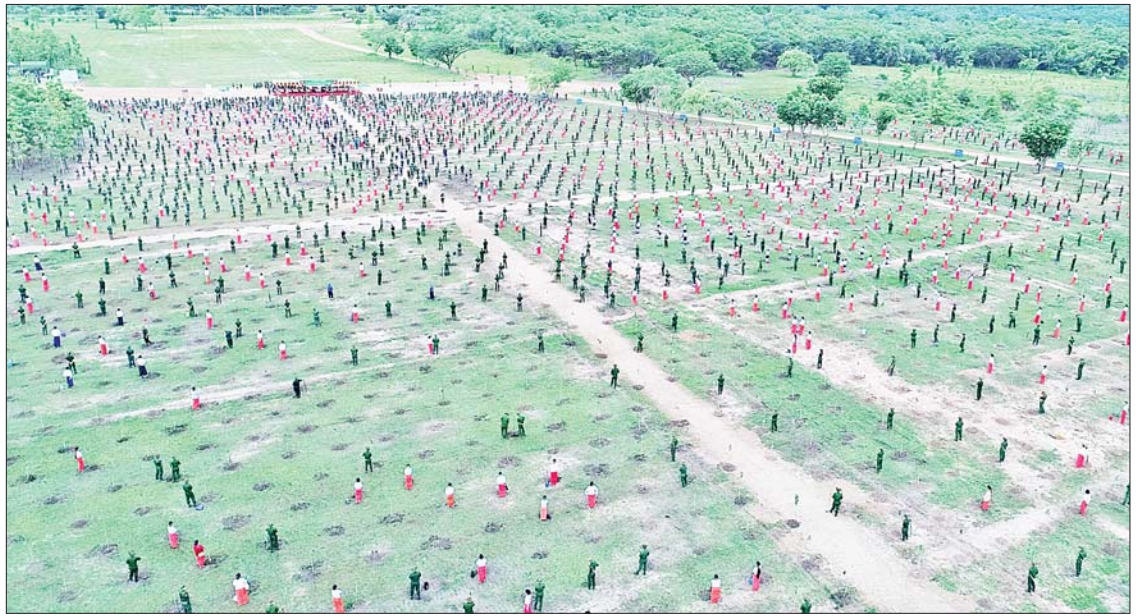
နိုင်ငံတော်စီမံအုပ်ချုပ်ရေးကောင်စီဒုတိယဥက္ကဋ္ဌ ဒုတိယ တပ်မတော်ကာကွယ်ရေးဦးစီးချုပ် ကာကွယ်ရေးဦးစီးချုပ် (ကြည်း) ဒုတိယဗိုလ်ချုပ်မှူးကြီးစိုးဝင်း ရတနာတန်းဝင် ကျွန်းပင်ကို စိုက်ပျိုးပေးစဉ်။