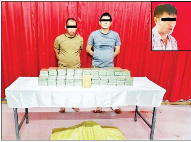
သိမ်းဆည်းရမိသည့် ဘိန်းဖြူဘလောက်တုံးများနှင့်အတူ တွေ့ရစဉ်။