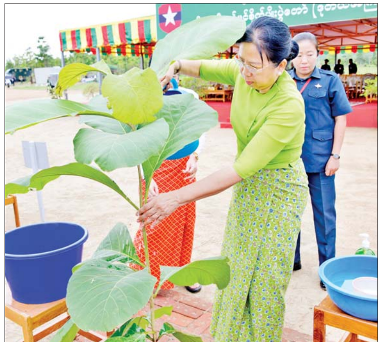
နိုင်ငံတော်စီမံအုပ်ချုပ်ရေးကောင်စီဥက္ကဋ္ဌ တပ်မတော်ကာကွယ်ရေးဦးစီးချုပ် ဗိုလ်ချုပ်မှူးကြီး မင်းအောင်လှိုင်၏ ဇနီး ဒေါ်ကြူကြူလှ ရတနာတန်းဝင်ကျွန်းပင်ကို ဦးဆောင်စိုက်ပျိုးပေးစဉ်။

☆ ရှေးဖုံးမှ အဆိုပါ အခမ်းအနားသို့ နိုင်ငံတော် စီမံအုပ်ချုပ်ရေးကောင်စီဥက္ကဋ္ဌ တပ်မတော် ကာကွယ်ရေးဦးစီးချုပ်၏ ဇနီး ဒေါ်ကြူကြူလှ၊ နိုင်ငံတော်စီမံအုပ်ချုပ်ရေး ကောင်စီဒုတိယဥက္ကဋ္ဌ ဒုတိယတပ်မတော် ကာကွယ်ရေးဦးစီးချုပ် ကာကွယ်ရေး ဦးစီးချုပ် (ကြည်း) ဒုတိယဗိုလ်ချုပ်မှူးကြီး စိုးဝင်း၊ ညိုနှိုင်းကွပ်ကဲရေးမှူးကြီး(ကြည်း) ရေ၊ လေ) ၏ ဇနီး၊ ကာကွယ်ရေးဦးစီးချုပ်(ရေ) နှင့် ဇနီး၊ ကာကွယ်ရေးဦးစီးချုပ်(လေ) နှင့် ဇနီး၊ ကာကွယ်ရေးဦးစီးချုပ်ရုံးမှ