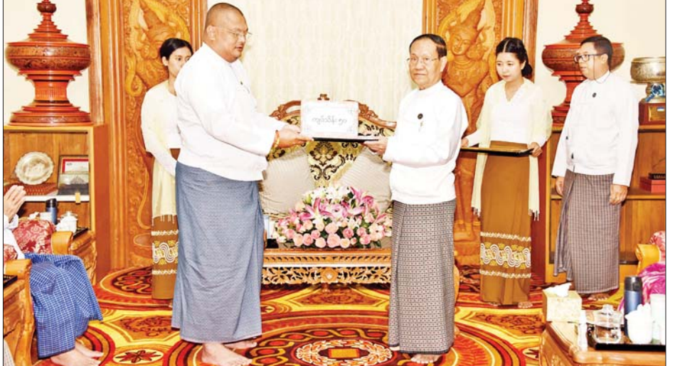
သိန်း ၅၀ နှင့် ဗုဒ္ဓဘာသာကလျာဏယုဝအသင်း မှတ်တမ်းလွှာများ ပြန်လည်ပေးအပ်ခဲ့ကြောင်း (YMBA)မှ အလှူငွေကျပ်သိန်း ၂၀ တို့ကို သိရသည်။ ပေးအပ်လှူဒါန်းရာ ပြည်ထောင်စုဝန်ကြီးက ဂုဏ်ပြု သတင်းစဉ်