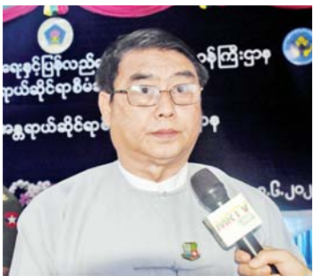
ညွှန်ကြားရေးမှူးချုပ် ဦးသိန်းတိုး

သစ်တွေ ခွဲစိတ်ဖြတ်တောက်ဖို့ အတွက် လိုအပ်တဲ့ရွှေ့လျားသစ်ခွဲစက် ၁၀ စုံ၊ Chain-saw ၃၉ လက်၊ ယန္တရား (Clark) လေးစီးနဲ့ အင်ဂျင်နီယာနဲ့ ကျွမ်းကျင်ဝန်ထမ်း ၁၂ ဦးကိုလည်း စစ်တွေမြို့ကို ပို့ဆောင်ခဲ့ပြီး ဖြစ်ပါတယ်။