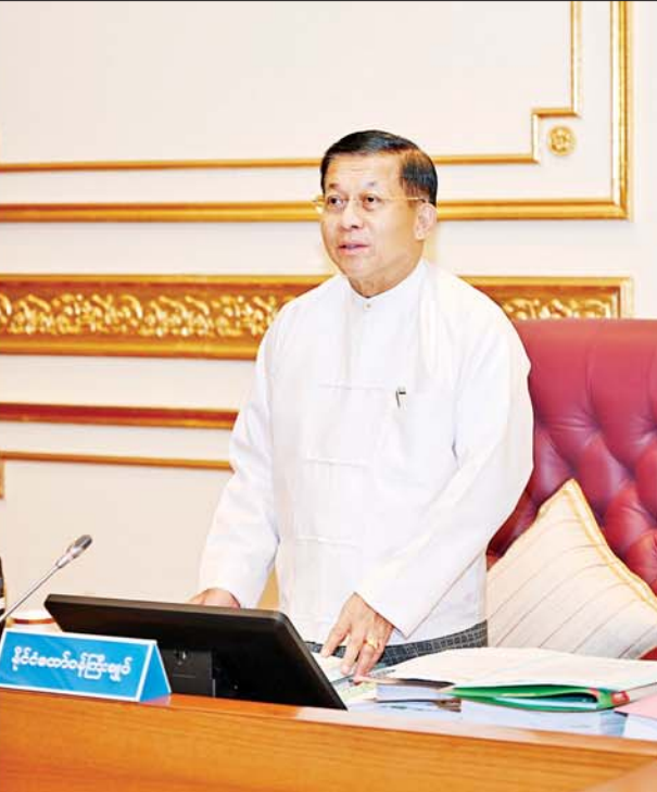
နိုင်ငံတော်စီမံအုပ်ချုပ်ရေးကောင်စီဥက္ကဋ္ဌ နိုင်ငံတော်ဝန်ကြီးချုပ် ဗိုလ်ချုပ်မှူးကြီးမင်းအောင်လှိုင် ပြည်ထောင်စုအစိုးရအဖွဲ့အစည်းအဝေးအမှတ်စဉ် (၃/၂၀၂၃)တွင် အမှာစကားပြောကြားစဉ်။

နေပြည်တော် ဇူလိုင် ၁၃ ပြည်ထောင်စုအစိုးရအဖွဲ့အစည်းအဝေး အမှတ်စဉ်(၃/၂၀၂၃)ကို ယနေ့မွန်းလွဲပိုင်းတွင် နေပြည်တော်ရှိ နိုင်ငံတော်စီမံအုပ်ချုပ်ရေး ကောင်စီဥက္ကဋ္ဌရုံး အစည်းအဝေးခန်းမ၌ကျင်းပရာ နိုင်ငံတော်စီမံအုပ်ချုပ် ရေးကောင်စီဥက္ကဋ္ဌ နိုင်ငံတော်ဝန်ကြီးချုပ် ဗိုလ်ချုပ်မှူးကြီး မင်းအောင်လှိုင် တက်ရောက်အမှာစကားပြောကြားသည်။