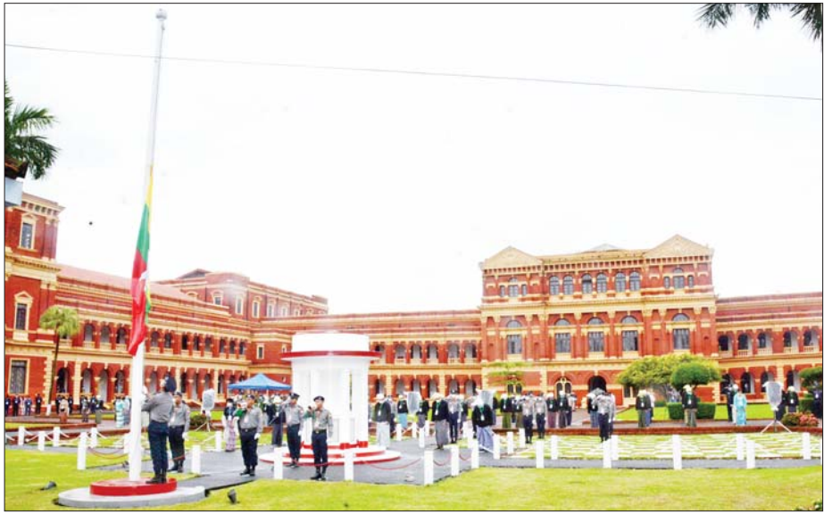
(၇၅)နှစ်မြောက် အာဇာနည်နေ့ ဝမ်းနည်းခြင်းအထိမ်းအမှတ်အဖြစ် ရန်ကုန်မြို့ဝန်ကြီးများရုံး (ယခင်အတွင်းဝန်ရုံး)၌ နိုင်ငံတော်အလံအား တိုင်ဝက်သို့ လျှော့ချလွှင့်ထူခြင်း အခမ်းအနားကျင်းပ မှုကို တွေ့ရစဉ်။

လက်နက်အားကိုးနဲ့ဖြေရှင်းခဲ့ နိုင်ငံရေးအခက်အခဲပြဿနာတွေကို နိုင်ငံရေး နည်းလမ်းနဲ့ စေ့စပ်ဆွေးနွေး အဖြေရှာကြရမယ့် အစား အကြမ်းဖက်ဝါဒ၊ လူသတ်ဝါဒကိုကိုင်စွဲပြီး လက်နက်အားကိုးနဲ့ဖြေရှင်းခဲ့ကြတဲ့ ဦးစောနဲ့ လက်ပါးစေအပေါင်းအဖော်တို့ရဲ့ လုပ်ရပ်ကြောင့် အမျိုးသားခေါင်းဆောင်ကြီး ဗိုလ်ချုပ်အောင်ဆန်း နဲ့ဝန်ကြီးများဟာ ကြေကွဲဖွယ်ရာအဖြစ်ဆိုးနဲ့ ကြုံခဲ့ ကြရတာတယ်။