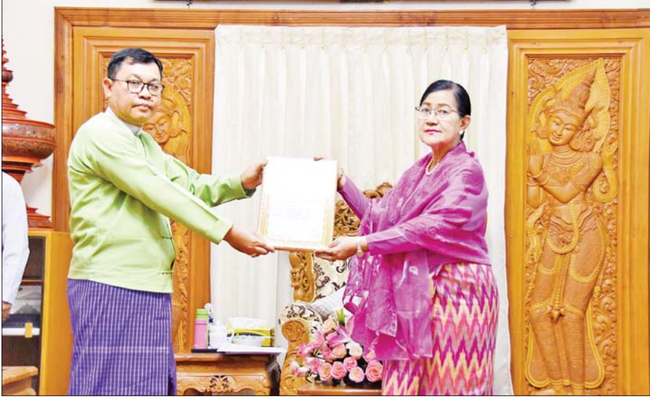
ဒုတိယဝန်ကြီး ဒေါ်နန္ဒာမာရ နိုင်ငံ တော်အစိုးရကိုယ်စား ကျေးဇူး တင်စကား ပြောကြားသည်။ ယင်းနောက် အာသောကရာမ ပရိယတ္တိစာသင်တိုက် ဆရာတော် ဘဒ္ဒန္တမင်္ဂလာဘိဝံသ ကိုယ်စား မွန်ပြည်နယ်အစိုးရအဖွဲ့ ကိုယ်စား ၃၅ မျိုးကို မော်လမြိုင်မြို့ရှိ ကျောက်မျက်ရတနာ ၃၅ မျိုးကို ပေးအပ်လှူဒါန်းရာ တင်စကား ပြောကြားသည်။ မှတ်တမ်းလွှာ ပြန်လည်ပေးအပ် သည်။ အဆိုပါ ကျောက်မျက်ရတနာ ၃၅ မျိုးကို မော်လမြိုင်မြို့ရှိ ကျောက်မျက်ရတနာ အသင်းမှ ကျွမ်းကျင်ပညာရှင် များဖြင့် အရည်အသွေးစစ်ဆေး ခဲ့ရာ ခန့်မှန်းတန်ဖိုးငွေကျပ် ၁၂၆၂၀၀၀ ရှိကြောင်း သိရ သည်။ သတင်းစဉ်

အခမ်းအနားတွင် မွန်ပြည်နယ် မော်လမြိုင်ခရိုင် မုဒုံမြို့နယ် အာသောကရာမပရိယတ္တိစာသင် တိုက် ဆရာတော်ဘဒ္ဒန္တ မင်္ဂလာ ဘိဝံသ (နိုင်ငံတော်ဗဟိုသံဃာ့ ဝန်ဆောင်)ကိုယ်စား မွန်ပြည်နယ် အစိုးရအဖွဲ့ ကိုယ်စားလှယ်က ကျောက်မျက်ရတနာ ၃၅ မျိုး လှူဒါန်းလိုခြင်းနှင့် ပတ်သက်၍ ရှင်းလင်းပြောကြားပြီး သာသနာ ရေးနှင့် ယဉ်ကျေးမှုဝန်ကြီးဌာန