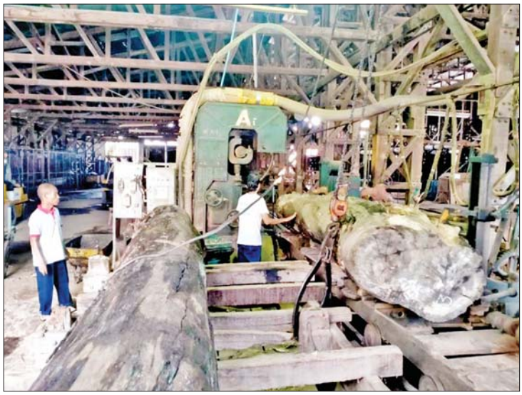
အသင့်သုံး သစ်ခွဲသားများရရှိရေး ကြိုတင်ခွဲစိတ်နေမှုကို တွေ့ရစဉ်။