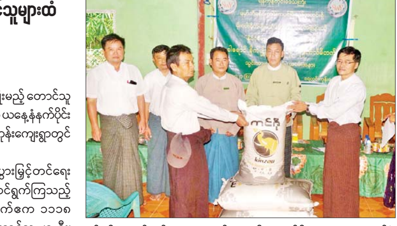
နှင့် ညီမျှသည့်သွင်းအားစု ပစ္စည်းများကို တာဝန်ရှိသူများက ပေးအပ်ခဲ့ကြောင်း သိရသည်။ ဇင်မင်းထိုက်(ထန်းတပင်)

ထန်းတပင် ဇူလိုင် ၁၃ နိုင်ငံစီးပွားမြှင့်တင်ရေးရန်ပုံငွေဖြင့် မိုးစပါးစိုက်ပျိုးမည့် တောင်သူအစုအဖွဲ့များထံသို့ သွင်းအားစုပစ္စည်းများပေးအပ်ခြင်းကို ယနေ့နံနက်ပိုင်း က ရန်ကုန်တိုင်းဒေသကြီး ထန်းတပင်မြို့နယ် ရေတွင်းကုန်းကျေးရွာတွင် ကျင်းပသည်။ အခမ်းအနားတွင် တာဝန်ရှိသူများနှင့် နိုင်ငံစီးပွားမြှင့်တင်ရေးရန်ပုံငွေဖြင့် အကျိုးတူလယ်ယာစနစ်ဖြင့် ဆောင်ရွက်ကြသည့် တောင်သူများစာချုပ်ချုပ်ဆိုခဲ့ကြပြီး မိုးစပါးစိုက်ဧက ၁၁၁၈ ဧကစိုက်ပျိုးသွားကြမည့် ရေတွင်းကုန်းကျေးရွာမှ တောင်သူ ၂၁ ဦး၊ ရေဖြူကျေးရွာမှ တောင်သူ ၅၅ ဦးနှင့် ဘောလည်ကျေးရွာမှတောင်သူ ၃၃ ဦး စုစုပေါင်း တောင်သူ ၈၃ ဦးထံသို့ တစ်ဧကစီပေးအပ်သည့် သိန်းနှစ်နန်း