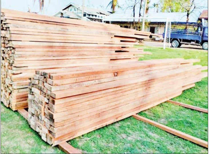
အသင့်သုံး သစ်ခွဲသားများရရှိရေး ကြိုတင်ခွဲစိတ်ထားစဉ်။