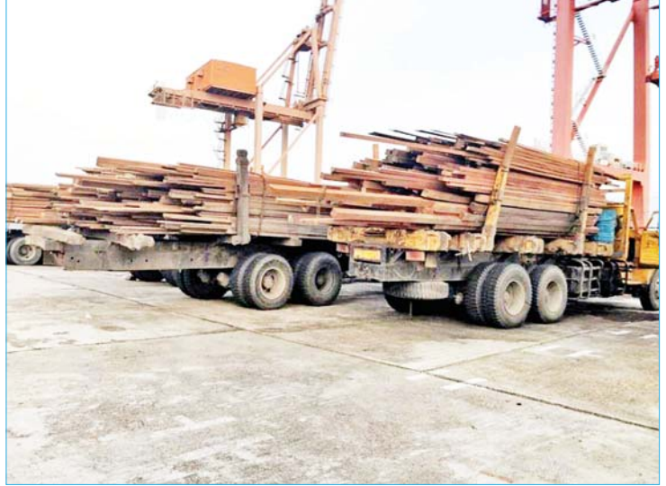
မုန်တိုင်းကျရောက်ပြီး ပြန်လည်ထူထောင်ရေးလုပ်ငန်းဆောင်ရွက်ရန် စစ်တွေသို့ သစ်ခွဲသားများ ပို့ဆောင်နေစဉ်။

မုန်တိုင်း ဒဏ်ကြောင့် ပျက်စီးဆုံးရှုံးမှု အများဆုံး ဖြစ်တဲ့ ရခိုင်ပြည်နယ်မှာ ပြန်လည် ထူထောင်ရေး လုပ်ငန်းတွေ ဆောင်ရွက် နိုင်ဖို့ ဇွန်လ ၂၉ ရက်နေ့ အထိ သစ်ခွဲသား ၂၈၈၆ တန်နဲ့ ပင်ကျပ်တိုင် ၂၉၈၂ လုံးကို စစ်တွေမြို့ကို ပို့ဆောင်ပြီး ဖြစ်ပါတယ်။ မောင်တောမြို့ သစ်တောဦးစီးဌာနက လွှဲအပ်ခဲ့တဲ့ ပင်ကျပ်တိုင် ၃၃၁ လုံးကိုလည်း မောင်တောမြို့နယ် မြို့ယူကျေးရွာကို ဇွန်လ ၁၈ ရက်နေ့က ဖြန့်ဖြူးပေးနိုင်ခဲ့