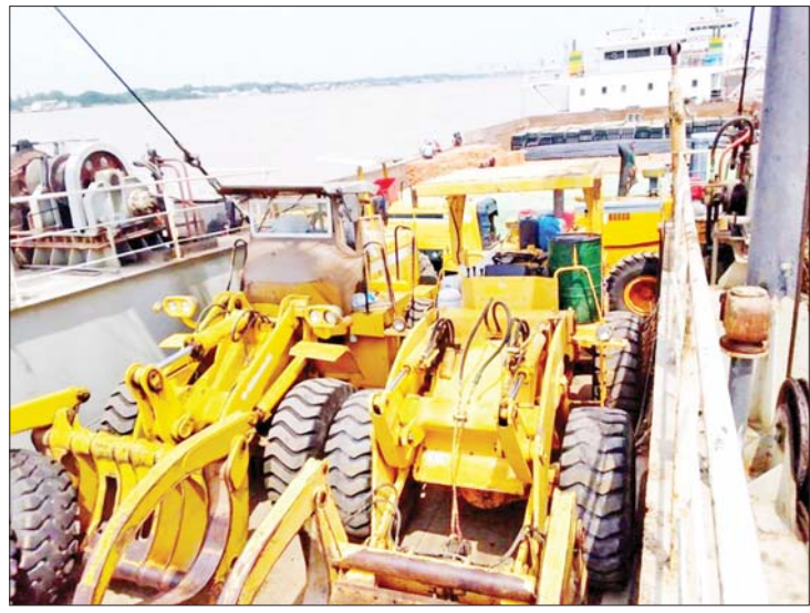
သစ်များတင်ချရန် Clark ကားများ စစ်တွေသို့တင်ပို့စဉ်။

လူမှုဝန်ထမ်း၊ ကယ်ဆယ်ရေးနှင့် ပြန်လည်နေရာချထားရေးဝန်ကြီးဌာနမှာ ဘေးအန္တရာယ်စီမံခန့်ခွဲမှု ဗဟိုဌာန (Disaster Management Centre-DMC) ကို မေလ ၈ ရက်နေ့ စတင်ဖွင့်လှစ်ချိန်ကစပြီး လုပ်ငန်းကော်မတီအတွင်းရေးမှူးဖြစ်တဲ့ ကျွန်တော်က နေ့စဉ်ဆောင်ရွက်ပြီးစီးမှု၊ တိုးတက်မှု၊ ရှေ့ဆက်လက်ဆောင်ရွက်မယ့် အစီအစဉ်တွေကို အမျိုးသားသဘာဝဘေးအန္တရာယ်ဆိုင်ရာ စီမံခန့်ခွဲမှုကော်မတီအစည်းအဝေးမှာ တင်ပြဆွေးနွေးတာတွေ ဆောင်ရွက်နေသလို ရာသီဥတု