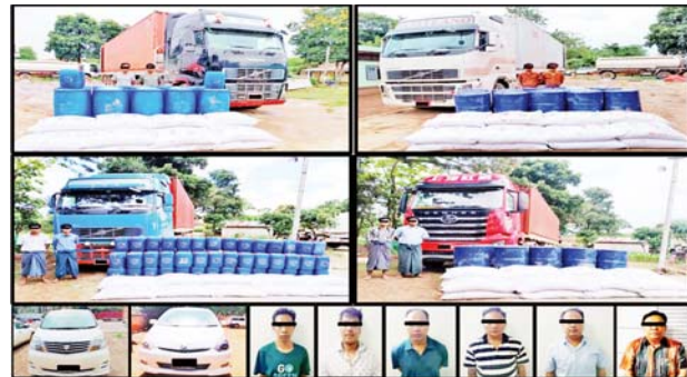
ပြစ်မှုကျူးလွန်သူများကို သိမ်းဆည်းရမိသည့် ထိန်းချုပ်စာတုပစ္စည်းများ၊ စာတုပစ္စည်းများနှင့်အတူ တွေ့ရစဉ်။