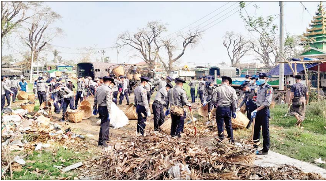
စစ်တွေမြို့၏ ကျက်သရေဆောင် အတုလမာရဇိန် ပြည်လုံးချမ်းသာဘုရားကြီးဝင်းထဲ၌ မြန်မာနိုင်ငံရဲတပ်ဖွဲ့ဝင်များ သန့်ရှင်းရေးဆောင်ရွက်ပေးနေစဉ်။

ဇူလိုင်လ ၁၀ ရက်နေ့၌ နောက်တစ်ကြိမ် ထပ်မံသွားရောက် အားပေးကြည့်ရှုခဲ့ကြသည့်နေရာကတော့ သင်ပုန်းတန်းကျေးရွာဖြစ်သည်။ ဟောဟိုမှာတွေ့လိုက်ရပြန်ပါပြီ။ ချိုင်းထောက်နှစ်ဖက်ကို အားပြုရပ်နေသော အမျိုးသမီး။ သူ ဘာရောဂါ