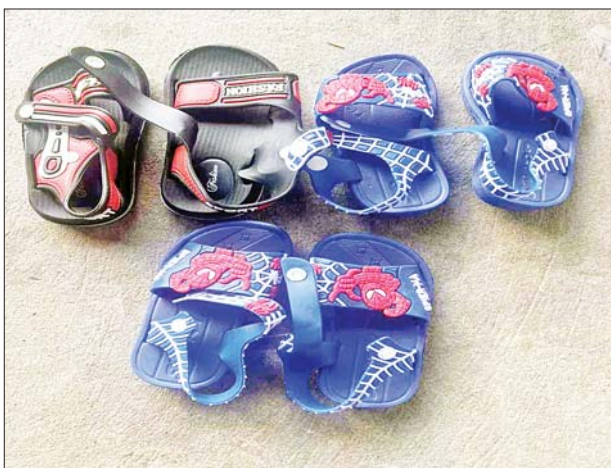
မန္တလေးတိုင်းဒေသကြီး၌ သိမ်းဆည်းရမိမှု မှတ်တမ်းဓာတ်ပုံ။

တရားမဝင်ကုန်သွယ်မှု တိုက်ဖျက်ရေးဦးဆောင်ကော်မတီ၏ ကြီးကြပ်ကွပ်ကဲမှုဖြင့် တရားမဝင်ကုန်သွယ်မှုများကို ဥပဒေနှင့်အညီ ထိရောက်စွာ တားဆီးအရေးယူနိုင်ရေး ဆောင်ရွက်လျက်ရှိရာ ဇူလိုင် ၉ ရက်တွင် မန္တလေးတိုင်းဒေသကြီးတရားမဝင်ကုန်သွယ်မှုတိုက်ဖျက်ရေးအထူးအဖွဲ့၏ စီမံခန့်ခွဲမှုဖြင့် တာဝန်ကျပူးပေါင်းအဖွဲ့က မန္တလေးတိုင်းဒေသကြီး ပြည်ကြီးတံခွန်မြို့နယ် ၁၁၂ x ၁၁၃ လမ်းကြား၊ ၇၂-A လမ်းရှိ ဂိုဒေါင်နှင့် ချမ်းမြသာစည်မြို့နယ် အိမ်အမှတ်-(၁၄/၂)၊ ၁၁၂ x ၁၁၁ လမ်းကြား၊ ၆၃-A ရှိ ဂိုဒေါင်တို့ကို သတင်းအရ စစ်ဆေးမှုများ ဆောင်ရွက်ခဲ့ရာ တရားဝင်စာရွက်စာတမ်း အထောက်အထား တင်ပြနိုင်ခြင်းမရှိသည့် တရုတ်နိုင်ငံထုတ် ကလေးစီးဖိနပ် အရန် ၅၉၆၀၀ အပါအဝင် ကုန်ပစ္စည်းသုံးမျိုး (ခန့်မှန်းတန်ဖိုးငွေကျပ် ၁၅၄၃၂၀၀၀)ကို သိမ်းဆည်းရမိခဲ့ပြီး အကောက်ခွန် လုပ်ထုံးလုပ်နည်းများနှင့်အညီ အရေးယူဆောင်ရွက်လျက်ရှိသည်။