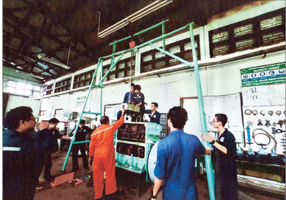
ကျောင်းသားများအား ရေကြောင်းဘက်ဆိုင်ရာ ကျွမ်းကျင်သူများဖြစ်လာစေရန် လေ့ကျင့်သင်ကြားပေးစဉ်။

သင်တန်းကာလတွင် အပြည်ပြည်ဆိုင်ရာ ရေကြောင်းအဖွဲ့ချုပ်(IMO)၏ ရေကြောင်းပညာရေးနှင့် လေ့ကျင့်ရေးစံချိန်စံညွှန်းနှင့်အညီ သင်ကြားပို့ချပေးပါသည်။ စာတွေ့လက်တွေ့အပြင် ခေတ်မီသင်ထောက်ကူပစ္စည်းများ၊ ခေတ်မီ simulator များဖြင့် လေ့ကျင့်သင်ကြားပေးနေပါသည်။ ကောလိပ်စာကြည့်တိုက်တွင် ရေကြောင်းပညာရပ်ဆိုင်ရာ စာအုပ်များ၊ အခြားဘာသာရပ်ဆိုင်ရာစာအုပ်များ၊ သုတ ရသ စာအုပ်များအပြင် ဒစ်ဂျစ်တယ်စာကြည့်ခန်းမကိုပါ မြန်နှုန်းမြင့်အင်တာနက်အသုံးပြုနိုင်ရန် စီစဉ်ထားရှိပါသည်။ ကျောင်းသားအရာရှိလောင်းများအတွက် စာကြည့်တိုက်အသုံးပြုနိုင်ရန် အချိန်သီးသန့်ပေးထားပါသည်။ ကျောင်းသားများအတွက် နေထိုင်ရန် အဆောင်များသည် သန့်ရှင်းသပ်ရပ်ပြီး စားသောက်ရေးအတွက် တစ်နေ့လျှင် မနက်စာ၊ နေ့လယ်စာ၊ ညနေစာတို့ကို တစ်ဦးလျှင် တစ်နေ့ငွေကျပ် ၄၅၀၀ နှုန်းဖြင့် ကျွေးမွေးပါသည်။ ထို့ပြင် ကိုယ်ကာယလှုပ်ရှား အားကစားလေ့ကျင့်ခန်း ပြုလုပ်ရန် အားကစားကွင်း၊ အားကစားလေ့ကျင့်ရန် ပစ္စည်းများလည်း ပြည့်စုံစွာ ထားရှိပါသည်။ ကျောင်းဆင်းရေကြောင်းအရာရှိလောင်းများသည် စာမျက်နှာ ၁၀ သို့ ❖