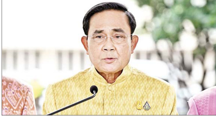
ဇူလိုင် ၁၃ ရက်တွင် ကျင်းပမည့် ဘာသာပြန် - အောင်ကျော်ကျော်

လွန်ခဲ့သည့် ကိုးနှစ်တာကာလ အတွင်း ဝန်ကြီးချုပ်ရာထူးတာဝန်များ ထမ်းဆောင်ကာ နိုင်ငံနှင့် ပြည်သူများ၏ အကျိုးစီးပွားအတွက် အစွမ်းကုန် ကြိုးစားခဲ့ကြောင်းနှင့် ယင်းသို့ ကြိုးစား မှု၏ ရလဒ်များကြောင့် အသီးအပွင့်များ ဖြစ်ထွန်းလာပြီး နိုင်ငံ၏ဘက်ပေါင်းစုံတွင် တိုးတက်မှုများ ဖြစ်ပေါ်လျက်ရှိကြောင်း ပရာယုတ်ချန်အိုချာက ဆိုသည်။ အစိုးရသစ်ဖွဲ့စည်းသည့် အချိန်အထိ