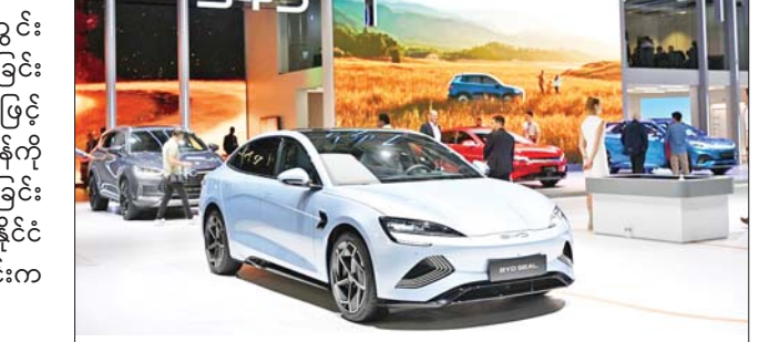
ကိုးကား-ဆင်ဟွာ ဘာသာပြန်-အလင်းသစ်

တရုတ်နိုင်ငံသည် ယခုနှစ် ပထမနှစ်ဝက်အတွင်း ခရီးသည် တင်ယာဉ် အစီးရေစုစုပေါင်း ၁ ဒသမ ၆၈ သန်းတင်ပို့နိုင်ခဲ့ခြင်း ကြောင့် ယမန်နှစ်အလားတူ ကာလနှင့် နှိုင်းယှဉ်ပါက ၉၂ ရာခိုင်နှုန်း မြင့်တက်မှုရှိခဲ့ကြောင်း သိရသည်။