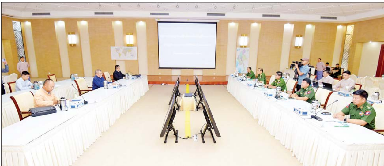
အတည်ပြု လက်မှတ်ရေးထိုးပြီး ပြန်ကြားရေးဝန်ကြီးဌာနမှ ထုတ်ဝေ လက်ဆောင်ပစ္စည်းများ ပေးအပ်ခဲ့ကြောင်း သိရသည်။ သော ကမ္ဘာရေးရာ၊ မြန်မာရေးရာ၊ တိုင်းရင်းသားရေးရာ စာအုပ်များနှင့် သတင်းစဉ်

တွေ့ဆုံဆွေးနွေးပွဲတွင် ပထမနေ့၌ မပြီးသတ်သေးသည့်ကိစ္စရပ် များအား ဆက်လက်ဆွေးနွေးညှိနှိုင်းခဲ့ကြပြီး နှစ်ရက်တာ ဆွေးနွေး ညှိနှိုင်းချက်များအရ အပြီးသတ်ရရှိလာသည့် သဘောတူညီချက်များကို