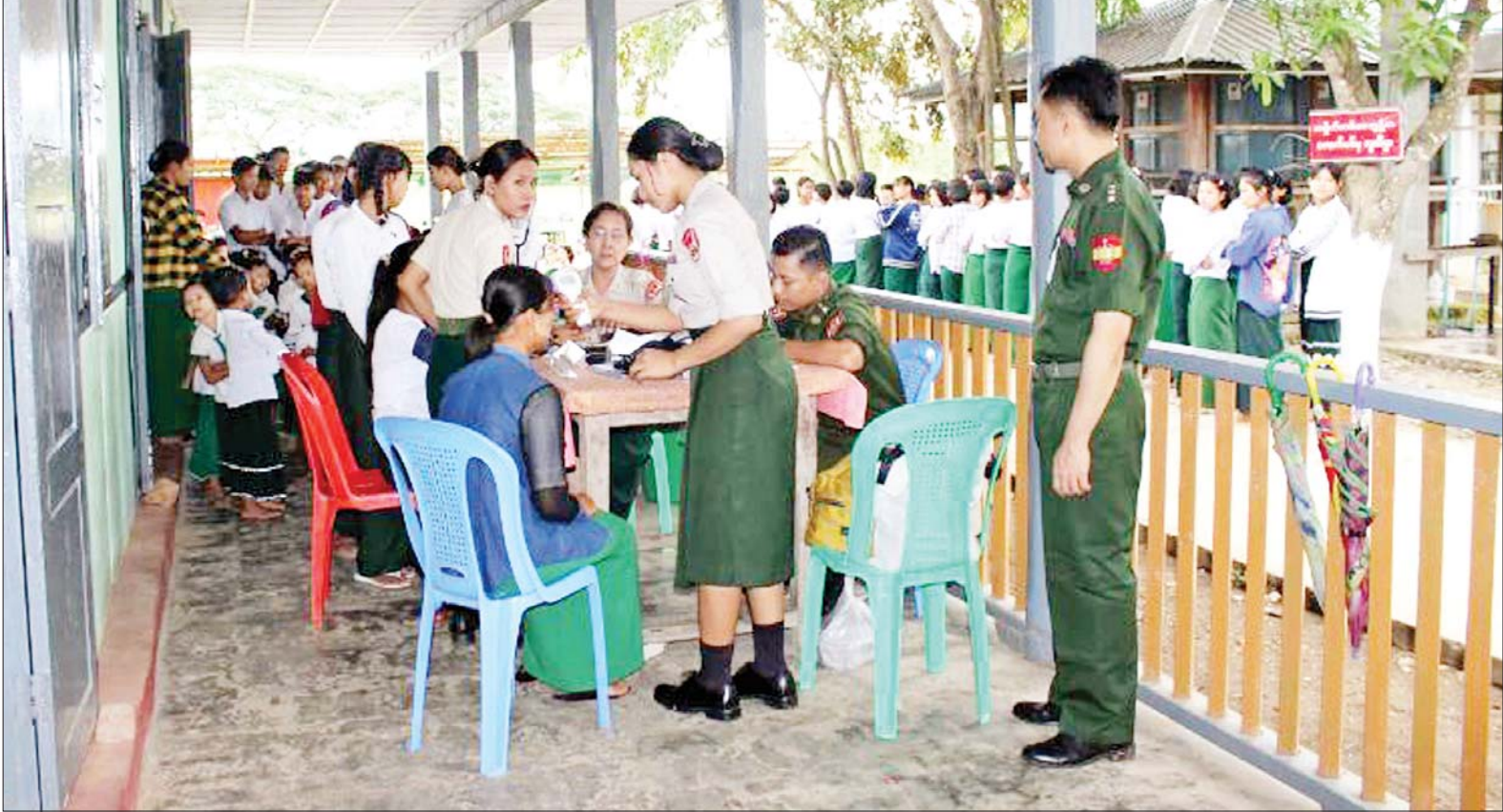
ဟုမ္မလင်းမြို့နယ် ကတ်သာကျေးရွာရှိ အခြေခံပညာအထက်တန်းကျောင်းမှ ဆရာ ဆရာမများ၊ ကျောင်းသား ကျောင်းသူများအား အနောက်မြောက်တိုင်းစစ်ဌာနချုပ် နယ်လှည့်ဆေးကုသရေးအဖွဲ့က ကျန်းမာရေးစောင့်ရှောက်မှုလုပ်ငန်းများ ဆောင်ရွက်ပေးစဉ်။

ရေကြောင်းဘက်ဆိုင်ရာ ကျွမ်းကျင်သူများ မွေးဖွားရာ မြန်မာနိုင်ငံ ကုန်သွယ်ရေးကြောင်း ကောလိပ် ဆောင်းပါး စာမျက်နှာ » ၉