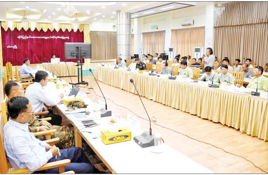
နှင့်ပတ်သက်၍ လမ်းညွှန်ခဲ့ပါ ကြောင်း၊ အဓိကအားဖြင့် စားရေ ရိက္ခာဖူလုံရေးသည် အဓိကဖြစ် ကြောင်း၊ အမိုးအကာအောက် ရောက်ရှိရေးနှင့် ပညာသင်ကြား ရေး၊ ကျန်းမာရေးကိစ္စရပ် များ လစ်လပ်မှုမရှိစေရေးတို့ကို မှာကြားခဲ့ပါကြောင်း၊ မှာကြား ချက်များကို အကောင်အထည် ဖော်ရန် ပြည်ထောင်စုဝန်ကြီးများ နှင့် ဒုတိယဝန်ကြီးများကိုယ်တိုင် အနီးကပ် ကြီးကြပ်ဆောင်ရွက် လျက်ရှိခြင်းကြောင့် အချိန်တို အတွင်း ပြည်နယ်၏ ပြန်လည် ထူထောင်ရေး လုပ်ငန်းများကို ဆောင်ရွက်နိုင်ခဲ့ခြင်းဖြစ်ကြောင်း၊ မြို့နယ်များတွင်လည်း တစ်မတော် အရာရှိကြီးများကို ခန့်အပ်တာဝန် ပေးကာ ပြန်လည်ထူထောင်ရေး လုပ်ငန်းများကို ပူးပေါင်းဆောင် ရွက်လျက်ရှိပါကြောင်း။ ဆွေးနွေးတင်ပြ ဆိုင်ကလုန်းမုန်တိုင်း (မိုခါ) တိုက်ခတ်မှုကြောင့် ပြည်နယ် အတွင်း မွေးမြူရေးလုပ်ငန်း လုပ်ကိုင်သူ တောင်သူများ၊ ကျွဲ နွားများ ထိခိုက်ပျက်စီးခဲ့ကြောင်း၊ ခိုင်းကျွဲ ခိုင်းနွားများ ထိခိုက်ပျက်စီး ခဲ့မှုအတွက် လိုအပ်ချက်များကို ဖြည့်ဆည်းပေးနိုင်ရန် အစီအမံ

စစ်တွေ ဇူလိုင် ၁၂ ရခိုင်ပြည်နယ်အတွင်း မွေးမြူ ရေးဆိုင်ရာလုပ်ငန်းများ ဖွံ့ဖြိုး တိုးတက်ရေး ညှိနှိုင်းအစည်း အဝေးကို ယနေ့နံနက်ပိုင်းက ပြည်နယ်အစိုးရအဖွဲ့ရုံး၌ ကျင်းပ သည်။