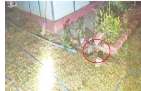
၃-၁-၂၀၂၂ ရက်တွင် ပုသိမ်ကြီးမြို့နယ်ရှိ မြို့နယ်စည်ပင်သာယာရေးအဖွဲ့ရုံးအား အကြမ်းဖက်သူများက လက်လုပ်မိုင်းတစ်လုံးဖြင့် ဖောက်ခွဲခဲ့သည့် မှတ်တမ်းဓာတ်ပုံ။