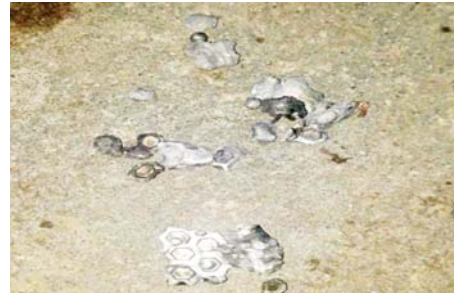
၃-၁-၂၀၂၂ ရက်တွင် ပုသိမ်ကြီးမြို့နယ်ရှိ မြို့နယ်စည်ပင်သာယာရေးအဖွဲ့ရုံးအား အကြမ်းဖက်သူများက လက်လုပ်မိုင်းတစ်လုံးဖြင့် ဖောက်ခွဲခဲ့သည့် မှတ်တမ်းဓာတ်ပုံ။