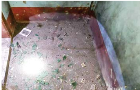
၂-၁၂-၂၀၂၁ ရက်တွင် ပုသိမ်ကြီးမြို့နယ်ရှိ မြို့နယ်လျှပ်စစ်ရုံးအား အကြမ်းဖက်သူများက လက်လုပ်မိုင်းတစ်လုံး လာရောက်ပစ်ခတ်ခဲ့သည့် မှတ်တမ်းဓာတ်ပုံ။