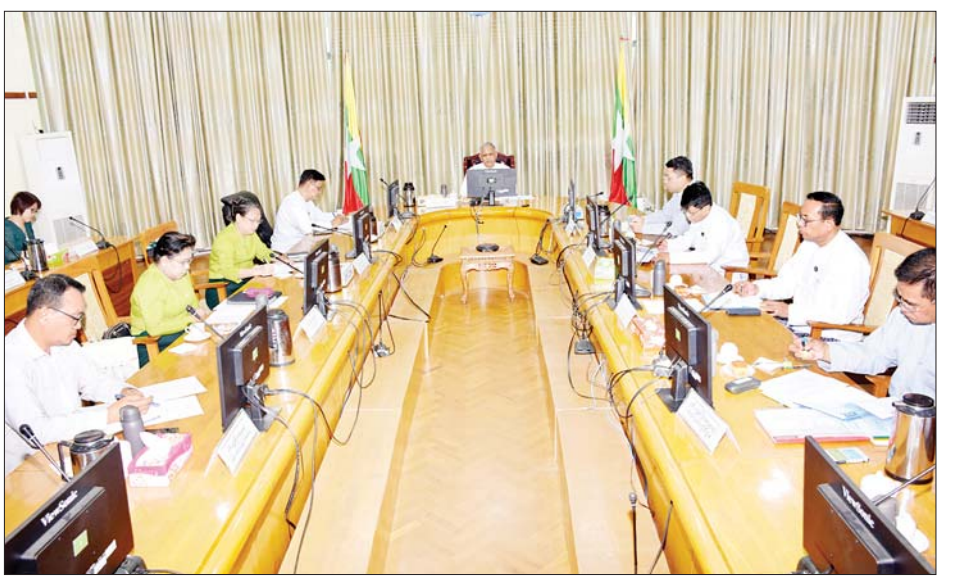
လုပ်ငန်းဆောင်ရွက်မှု အခြေအနေများနှင့် လိုအပ် ပေါင်းစပ်ညှိနှိုင်းဖြည့်ဆည်းပေးခဲ့ကြောင်း သိရသည်။ ချက်များကိုတင်ပြရာ ပြည်ထောင်စုဝန်ကြီးက သတင်းစဉ်

နိုင်ရေးနှင့် ချိတ်ဆက်မှုပိုမိုရရှိစေရေး၊ မိမိနိုင်ငံ အတွက် အကျိုးရှိစေမည့် စီးပွားရေးဆိုင်ရာ သတင်း အချက်အလက်များ ကျယ်ပြန့်စွာရယူ အသုံးပြုနိုင်ရေး၊ ပြည်တွင်းရှိ အသေးစား၊ အငယ်စား၊ အလတ်စား စီးပွားရေးလုပ်ငန်းရှင်များ၏ အကူအညီတောင်းခံမှု များကို Virtual စနစ်ဖြင့် တွေ့ဆုံညှိနှိုင်းကာ လိုအပ် သည့်များ ဆက်လက်ဆောင်ရွက်ပေးရေး၊ သက်ဆိုင်ရာ နိုင်ငံများသို့ မြန်မာနိုင်ငံ၏ ကုန်သွယ်မှုနှင့် ရင်းနှီးမြှုပ်နှံ မှုဆိုင်ရာ သတင်းအချက်အလက်များ ကျယ်ပြန့်စွာ ဖြန့်ဝေပေးနိုင်ရေးနှင့် ရင်းနှီးမြှုပ်နှံမှုမြှင့်တင်ရေး ကိစ္စများကို ထိရောက်စွာဆောင်ရွက်နိုင်ရေး မှာကြား သည်။ ယင်းနောက် ဒုတိယဝန်ကြီး၊ အမြဲတမ်းအတွင်းဝန် နှင့် ညွှန်ကြားရေးမှူးချုပ်များက ကဏ္ဍအလိုက် စီးပွားရေးသံမှူးများ ဆောင်ရွက်ရမည့် လုပ်ငန်းစဉ် များကို ရှင်းလင်းဆွေးနွေးသည်။ ထို့နောက် စီးပွားရေးသံမှူးများက နိုင်ငံအလိုက်