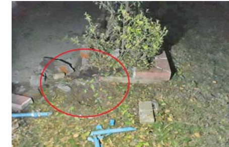
၃-၁-၂၀၂၂ ရက်တွင် ပုသိမ်ကြီးမြို့နယ်ရှိ မြို့နယ်စည်ပင်သာယာရေးအဖွဲ့ရုံးအား အကြမ်းဖက်သူများက လက်လုပ်မိုင်းတစ်လုံးဖြင့် ဖောက်ခွဲခဲ့သည့် မှတ်တမ်းဓာတ်ပုံ။

○ ကျောပုံးမှ အောင်သူသည် ၂၀၁၈ ခုနှစ်ကတည်းက ထိုင်းကလပ်များတွင် ကစားနေခြင်းဖြစ်ပြီး Police Tero အသင်း၊ မြောင်တောင်ယူနိုက်တက်