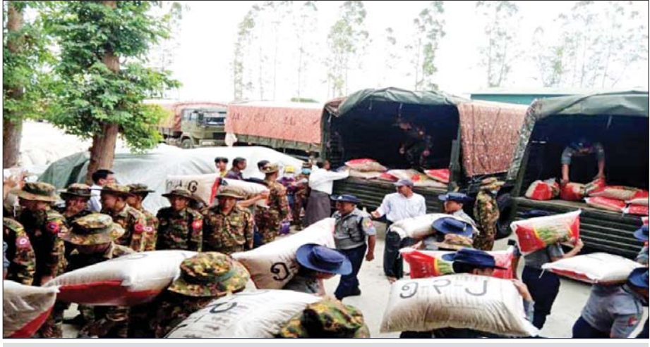
နေပြည်တော်မှ မျိုးစပါးများ ပို့ဆောင်ရန်ဆောင်ရွက်နေမှု။