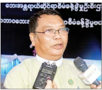
ညွှန်ကြားရေးမှူးချုပ် ဦးသိန်းလွင်

ကြေးရေးကြီးကြပ်စစ်ဆေးရေးဦးစီးဌာန အနေနဲ့ လုပ်ငန်းဆောင်ရွက်ဖို့ လိုအပ်တဲ့ မတည်ချေးငွေရရှိရေးနဲ့ လုပ်ငန်း လုပ်ကိုင်နိုင်ရေး အသေးစားငွေရေး ကြေးရေးအဖွဲ့အစည်းတွေနဲ့ ချိတ်ဆက် ပေးနိုင်ရေး စီမံထားခဲ့ပါတယ်။ ဒါ့အပြင် အသက်မွေးဝမ်းကျောင်းသင်တန်းတွေ ဖွင့်လှစ်ပေးနိုင်ဖို့ စက်မှုပေးပေါင်း ဆောင်ရွက်ရေးဦးစီးဌာန၊ အလုပ်သမား ညွှန်ကြားမှုဦးစီးဌာနနဲ့ အသေးစား စက်မှုလက်မှုလုပ်ငန်း ဦးစီးဌာနတို့က လည်း ကြိုတင်စီမံထားရှိပါတယ်။