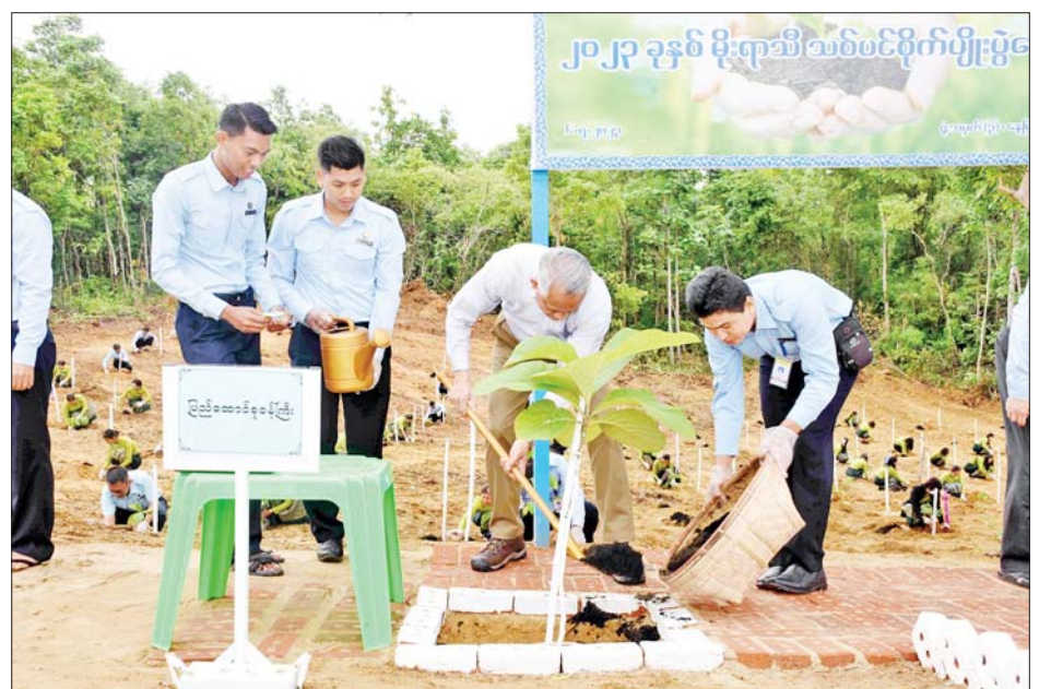
၁၅၀၊ မန်ဂျန်ရှားပင် ၁၅၀၊ ဝါးပိုးဝါးပင် ၁၀၀၀ နှင့် စားသုံးသီးနှံပင်များ အောင်မြင်ဖြစ်ထွန်းလျက်ရှိပန်းအလှပင်များ၊ အရိပ်ရလေကာ နေကာပင်များ၊ ကြောင်း သိရသည်။ သတင်းစဉ်

စီးပွားရေးနှင့် ကူးသန်းရောင်းဝယ်ရေးဝန်ကြီးဌာနသည် မိုးရာသီသစ်ပင်စိုက်ပျိုးပွဲတော်ကို နှစ်စဉ် ကျင်းပဆောင်ရွက်လျက်ရှိပြီး ယခုနှစ် မိုးရာသီသစ်ပင်စိုက်ပျိုးပွဲတော်တွင် ရတနာတန်းဝင်ကျွန်းပင် ၁၀၀၊ ပျဉ်းကတိုးပင် ၁၀၀၊ ဒန့်သလွန်ပင် ၂၀၀ စိုက်ပျိုးမည်ဖြစ်ပြီး ရုံးအမှတ်(၃)နှင့် ရုံးအမှတ်(၅၂)တို့တွင် ယခင်စိုက်ပျိုးပြီးသော စိန်တလုံးသရက်ပင် ၁၀၀၀၊ ပတ္တမြားမောက်သရက်ပင် ၇၀၀၊ ရတနာ တန်းဝင်ကျွန်းပင် ၂၀၀၀၊ ပျဉ်းကတိုးပင် ၃၀၀၊ မဟော်ဂနီပင်