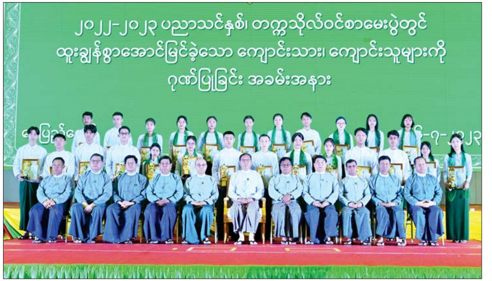
၂၀၂၂-၂၀၂၃ ပညာသင်နှစ် တက္ကသိုလ်ဝင်စာမေးပွဲတွင် ထူးချွန်စွာအောင်မြင်ခဲ့သော ကျောင်းသား၊ ကျောင်းသူများကို ဂုဏ်ပြုခြင်း အခမ်းအနား

ထို့နောက် ပြည်ထောင်စုဝန်ကြီးသည် ဆုရကျောင်းသား ကျောင်းသူများနှင့် မိဘများကို ရင်းရင်းနှီးနှီး တွေ့ဆုံနှုတ်ဆက်ပြီး နံနက်စာ အတူတကွ သုံးဆောင်သည်။