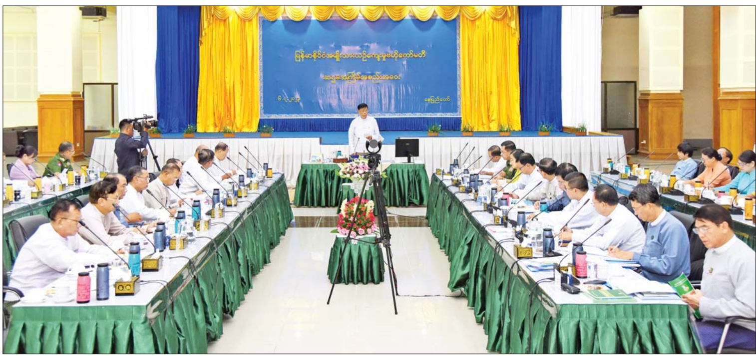
နိုင်ငံတော်စီမံအုပ်ချုပ်ရေးကောင်စီဝင် ဒုတိယဝန်ကြီးချုပ်နှင့် ပြည်ထောင်စုဝန်ကြီး ဗိုလ်ချုပ်ကြီး မြထွန်းဦး မြန်မာနိုင်ငံအမျိုးသားယဉ်ကျေးမှုဗဟိုကော်မတီ၏ ဆဋ္ဌမအကြိမ် အစည်းအဝေးတွင် အမှာစကားပြောကြားစဉ်။

သော ဒြပ်မဲ့ယဉ်ကျေးမှုအမွေအနှစ်များ အနက် မြန်မာနိုင်ငံ၏ ပထမဆုံး ဒြပ်မဲ့ ယဉ်ကျေးမှုအမွေအနှစ်အဖြစ် မြန်မာ့ သနပ်ခါးယဉ်ကျေးမှုလေ့ကို UNESCO သို့ ၂၀၂၀ ပြည့်နှစ်က တင်ပြခဲ့သော်လည်း ပြန်လည်ပြည့်စုံအောင် ရေးသွင်းရမည့် အချက်အလက်အချို့ လိုအပ်နေကြောင်း အကြောင်းကြားလာသည့် အတွက် ပြန်လည်ရေးသားလျက်ရှိကြောင်း။