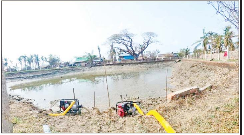
အသက်မွေးဝမ်းကျောင်းလုပ်ငန်းများ ပြန်လည်ထူထောင်ရေးလုပ်ငန်းကော်မတီ၏ ကြိုတင် ပြင်ဆင်မှုကို တွေ့ရစဉ်။