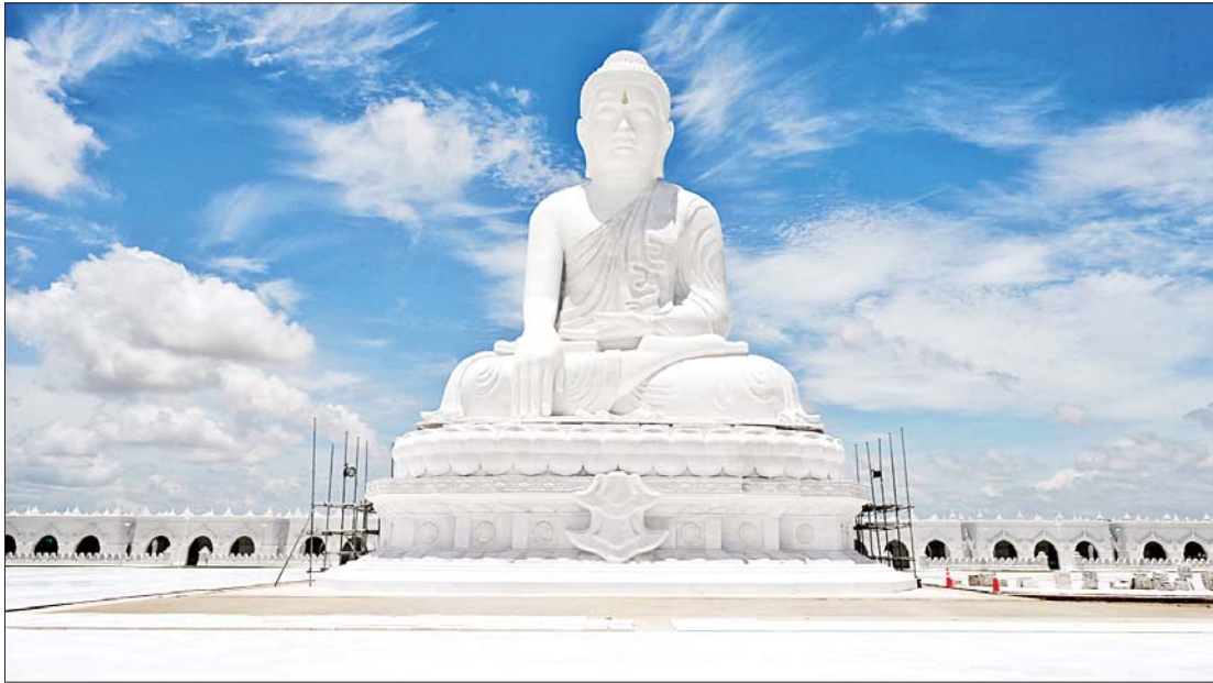
ကမ္ဘာပေါ်ရှိ ထိုင်တော်မူကျောက်ဆစ်ဗုဒ္ဓရုပ်ပွားတော်များအနက် ဉာဏ်တော်အမြင့်ဆုံးဖြစ်လာမည့် မာရဝိဇယ ရုပ်ပွားတော်မြတ်ကြီး။

ကျွန်ုပ်တို့အားလုံးသည် ထေရဝါဒ ဗုဒ္ဓဘာသာစစ်စစ်ကိုးကွယ်သည့်နိုင်ငံမှ ဗုဒ္ဓဘာသာဝင်များပီပီ မိမိဘာသာ သာသနာ ပြန့်ပွားတိုးတက်ရေးအတွက် တာဝန်ရှိသူများဖြစ်သည်ဟု ခံယူထား သူများဖြစ်သည်။ နိုင်ငံစည်ပင်ပြောရေး၊ ငြိမ်းချမ်းရေး၊ ပြည်သူများ၏ လူမှုစီးပွား ဘဝဖွံ့ဖြိုးတိုးတက်ရေးတွင် ကျရာ အခန်းကဏ္ဍမှ ပါဝင်နေသူများလည်း ဖြစ်ပြန်သည်။ အရာရာကို ဘာသာ သာသနာကိုအခြေခံ၍ စဉ်းစားသည်၊ တွေးသည်၊ ပြောသည်၊ လုပ်ကြကိုင်ကြ သည်။ အကြောင်းမှာ ဗုဒ္ဓဘာသာသည် တစ်ဦးချင်း ငြိမ်းချမ်းရေးမှသည် အများ ငြိမ်းချမ်းရေး၊ လောကတစ်ခွင် သာယာ ဝပြောရေးကို ရှေးရှု၍ဖြစ်သည်။ ဤမျှ ရိုးရှင်းသောအချက်ကိုအခြေခံ၍ မြန်မာ ပြည်တစ်ခွင် အပူမှ အအေး၊ အမှောင်မှ အလင်းဆောင်နေသည့် ဂုဏ်ယူဖွယ်ရာ တစ်ခုအနေဖြင့် မာရဝိဇယဗုဒ္ဓရုပ်ပွား တော်မြတ်ကြီး တည်ထားကိုးကွယ်ခြင်း ကို သဒ္ဓါတရားဖြင့် တင်ပြလိုပါသည်။