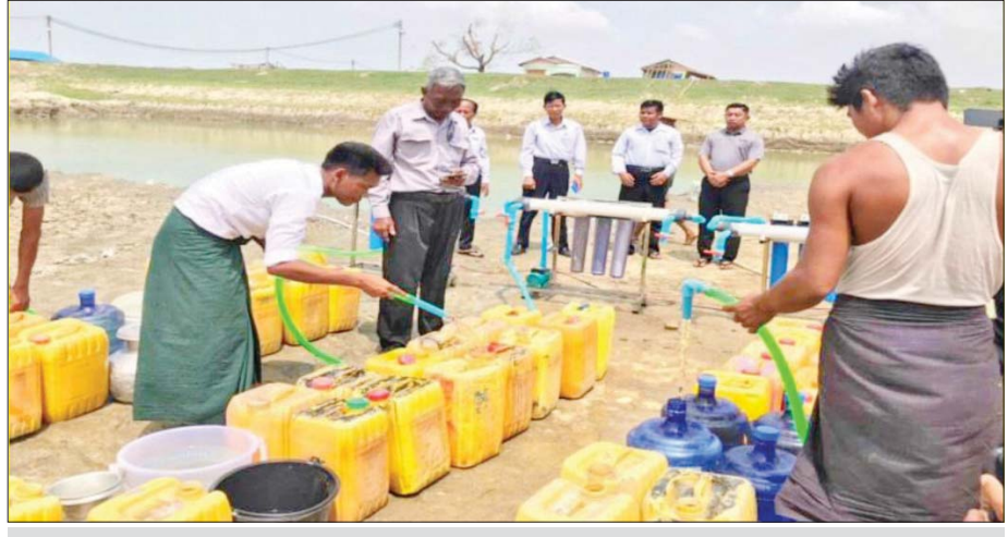
mobile solar ရေသန့်စင်စနစ်များဖြင့် ရေဖြန့်ဝေပေးမှု။

ကျေးလက်ဒေသဖွံ့ဖြိုးတိုးတက်ရေး ဦးစီးဌာန အနေနဲ့ ဆိုလာစနစ်နဲ့ ရွေ့လျားနိုင်တဲ့ ရေသန့်စင် စနစ်တွေကို ၁၀ စုံ ဆောင်ရွက်ပေးခဲ့ပြီး သုံးစုံက မေလ ၃၁ ရက်နေ့က စတင်၍ သောက်သုံးရေကန် တွေက ရေတွေကို သန့်စင်ပေးကာ ကျေးလက်နေ ပြည်သူတွေထံ သန့်ရှင်းတဲ့ သောက်သုံးရေဖြန့်ဝေ ပေးလျက်ရှိပါတယ်။ ကျန်တဲ့ခုနှစ်စုံကလည်း စစ်တွေ မြို့ကို ရောက်ရှိနေပြီး ဇွန်လ ၆ ရက်နေ့မှာ စမ်းသပ် ပေးဝေလျက်ရှိ