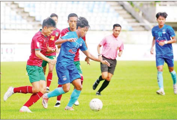
ရတနာပုံအသင်းနှင့် မြဝတီအသင်း ယှဉ်ပြိုင်ကစားစဉ်။

ရခိုင်ပြည်နယ် တောင်ကုတ်မြို့နယ်ရှိ မြန်မာ့သစ်လုပ်ငန်းဆင်ပိုင်းမှ ဆင်မ ဇာနန်းလှ အသက် ၃၃နှစ်က ဆင်ဖြူတော် (အထီး)ကလေးတစ်စီးအား ၂၀၂၂ ခုနှစ် ဇူလိုင် ၂၃ ရက် နံနက် မင်္ဂလာအချိန် ၆ နာရီခွဲတွင် မွေးဖွားခဲ့ပြီး အဆိုပါ ဆင်ဖြူတော်လေးမှာ မွေးဖွားစတွင် အရပ်အမြင့် နှစ်ပေ ၄၀ လက်မ၊ ကိုယ်လုံး လုံးပတ် သုံးပေ တစ်လက်မ၊ ကိုယ်အလေးချိန် ပေါင် ၁၈၀ ခန့်ရှိသည်။ စာမျက်နှာ ၁၆ ကော်လံ ၅ သို့ ၀