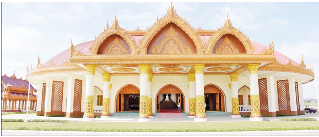
မာရဝိဇယဗုဒ္ဓဥယျာဉ်တော်အတွင်းရှိ သာသနာဗိမာန် အဂ္ဂိမိပတိဝိသုဂါမ သိမ်တော်ကြီးကို တွေ့ရစဉ်။

ရုပ်ပွားတော်မြတ်ကြီး တည်ထား ကိုးကွယ်ခြင်းနှင့် ဗုဒ္ဓဥယျာဉ် တည်ဆောက်ခြင်းလုပ်ငန်းများကို အစီအစဉ်များအဆင့်ဆင့် ချမှတ်ဆောင်ရွက် ခဲ့သည်။ ဥယျာဉ်အတွင်း ချောင်းတူးဖော် ဖောက်လုပ်ခဲ့သလို မန္တလေးရတနာပုံ ခေတ် မင်္ဂလာတံတားပုံစံ တံတား တစ်စင်းကိုပါ ထည့်သွင်းကာ မျက်စိ ပသာဒဖြစ်ဖွယ် တည်ဆောက်ထား သည်။ ရုပ်ပွားတော်မြတ်ကြီး တည်ထား မည့်နေရာတွင် တန်ချိန် ၂၀၀၀၀ ခန့် ရည်ရှိသည့် အောက်ခံခုံ တည်ဆောက် နိုင်ရန် ဘိုးပိုင်များရှိကြ၍ ဆောင်ရွက် ခဲ့ပြီး ပလ္လင်တော်အစိတ်အပိုင်းများ ပင့်ဆောင်နေရာချထားခြင်းနှင့် တွဲဆက် ခြင်းများကိုလည်း စနစ်တကျဆောင်ရွက်