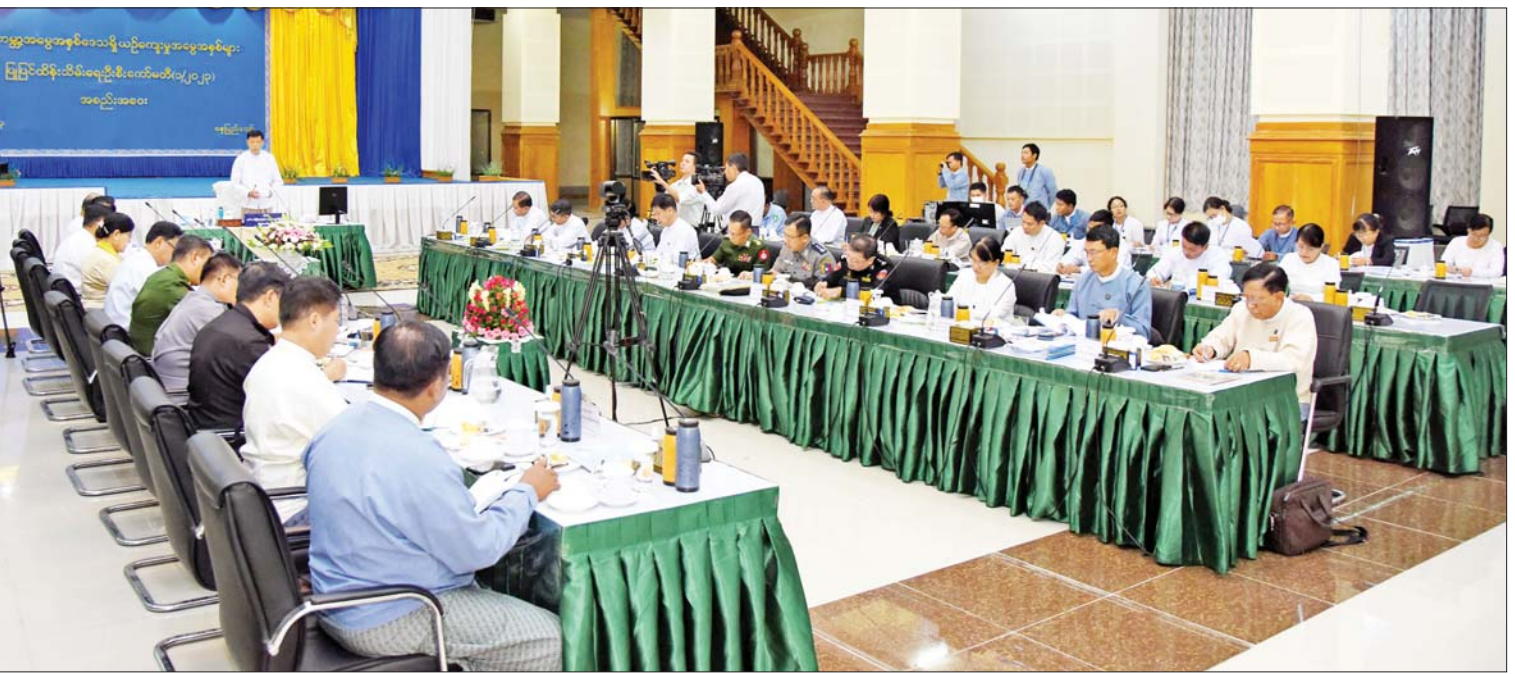
နိုင်ငံတော်စီမံအုပ်ချုပ်ရေးကောင်စီဝင် ဒုတိယဝန်ကြီးချုပ်နှင့် ပြည်ထောင်စုဝန်ကြီး ဗိုလ်ချုပ်ကြီး မြထွန်းဦး ပုဂံကမ္ဘာ့အမွေအနှစ်ဒေသရှိ ယဉ်ကျေးမှုအမွေအနှစ်များ ပြုပြင်ထိန်းသိမ်းရေးဦးစီးကော်မတီ၏ (၁ / ၂၀၂၃) အစည်းအဝေးတွင် အမှာစကား ပြောကြားစဉ်။

နေပြည်တော် ဇူလိုင် ၆ ပုဂံကမ္ဘာ့အမွေအနှစ် ဒေသရှိ ယဉ်ကျေးမှုအမွေအနှစ်များ ပြုပြင်ထိန်းသိမ်းရေးဦးစီးကော်မတီ၏ (၁/၂၀၂၃) အစည်းအဝေးကို ယနေ့နံနက်ပိုင်းတွင် နေပြည်တော်ရှိ သာသနာရေးနှင့် ယဉ်ကျေးမှုဝန်ကြီးဌာန အမျိုးသား စာကြည့်တိုက် ဝန်ဇင်းမင်းရာဇာခန်းမ၌ ကျင်းပရာ ပုဂံကမ္ဘာ့အမွေအနှစ်ဒေသရှိ ယဉ်ကျေးမှုအမွေအနှစ်များ ပြုပြင်ထိန်းသိမ်းရေးဦးစီးကော်မတီဥက္ကဋ္ဌ နိုင်ငံတော် စီမံအုပ်ချုပ်ရေးကောင်စီဝင် ဒုတိယ ဝန်ကြီးချုပ်နှင့် ကာကွယ်ရေးဝန်ကြီးဌာန ပြည်ထောင်စုဝန်ကြီး ဗိုလ်ချုပ်ကြီး မြထွန်းဦး တက်ရောက်အမှာစကား ပြောကြားသည်။