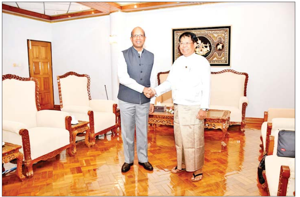
ပြည်ထောင်စုဝန်ကြီး ဦးသန်းဆွေ အိန္ဒိယနိုင်ငံသံအမတ်ကြီး မစ္စတာ ဗိနေးကူးမားအား ရင်းရင်းနှီးနှီးနှုတ်ဆက်စဉ်။