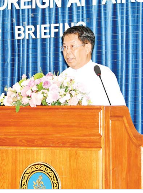
ပြည်ထောင်စုဝန်ကြီး ဦးသန်းဆွေ မြန်မာနိုင်ငံ၏ လက်ရှိ ပြည်တွင်းနိုင်ငံရေးဖြစ်ပေါ်တိုးတက်မှု အခြေအနေများနှင့်ပတ်သက်၍ ရန်ကုန်မြို့အခြေစိုက် သံတမန်များနှင့် ကုလသမဂ္ဂဌာနကော်ယံစားလှယ်တို့အား ရှင်းလင်းပြောကြားစဉ်။