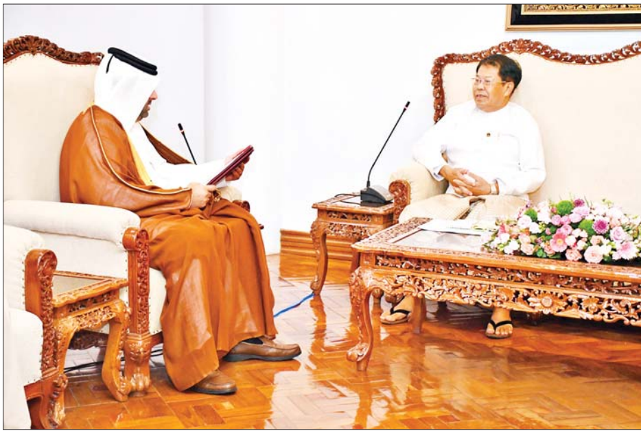
ပြည်ထောင်စုဝန်ကြီး ဦးသန်းဆွေ ကာတာသံရုံး ယာယီတာဝန်ခံ မစ္စတာ ရာရှစ် အက်ဘ်ဒူလာ အမ်.အေ. အယ်လ်-ကူဝါရီအား လက်ခံတွေ့ဆုံစဉ်။