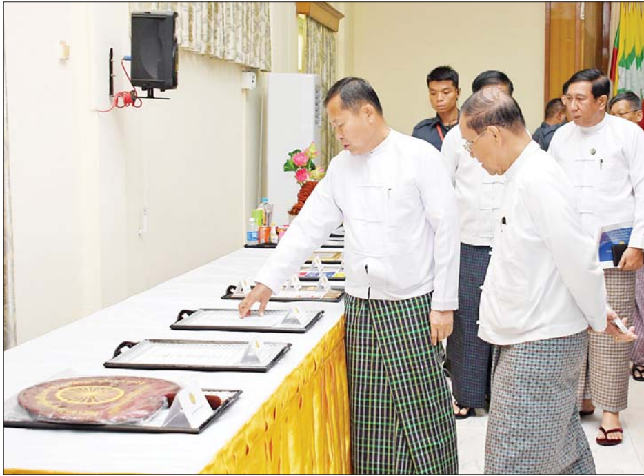
နိုင်ငံတော်စီမံအုပ်ချုပ်ရေးကောင်စီ ဒုတိယဥက္ကဋ္ဌ ဒုတိယဝန်ကြီးချုပ် ဒုတိယဗိုလ်ချုပ်မှူးကြီးစိုးဝင်း နိုင်ငံတော်စီမံအုပ်ချုပ်ရေးကောင်စီ ၂၀၂၃ ခုနှစ် ဝါဆိုသင်္ကန်းဆက်ကပ်လှူဒါန်းပွဲအခမ်းအနား ကျင်းပရေး ဦးစီးကော်မတီ လုပ်ငန်းညှိနှိုင်းအစည်းအဝေးတွင် ခင်းကျင်းပြသထားသည်များကို ကြည့်ရှုစဉ်။

မြတ်စွာဘုရားရှင် ခွင့်ပြုတော်မူအပ်သော ဆွမ်း၊ သင်္ကန်း၊ ကျောင်း၊ ဆေး လေးပါးသော ပစ္စည်းတို့ အနက် ဝါတွင်းကာလအတွင်း သင်္ကန်းဖြင့် မပင်ပန်း ကြစေရန် လှူဒါန်းကြခြင်းဖြစ်သည့်အတွက် သင်္ကန်း လှူဒါန်းကြရသူများအနေဖြင့် “ရွှေရောင် အဆင်း၊ ညစ်ကြေးကင်း၍၊ ပြေပြစ်ခန္ဓာ၊ ရှိန်အဝါနဲ့၊ ကမ္မလာစ၊ သား၊ ဝတ်ထည်များကို၊ ဆင်မြန်းရခြင်း” စသော