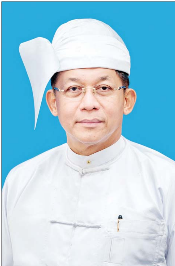
နိုင်ငံတော်စီမံအုပ်ချုပ်ရေးကောင်စီဥက္ကဋ္ဌ နိုင်ငံတော်ဝန်ကြီးချုပ် ဗိုလ်ချုပ်မှူးကြီးမင်းအောင်လှိုင်

သဒ္ဒါဖြူဖွေး ဓလေ့သွေး ပေးလှူမကွာ တို့မြန်မာ ဆောင်းပါး စာမျက်နှာ » ၆