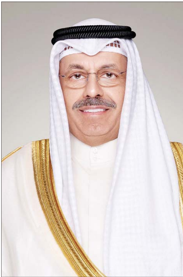
ကူဝိတ်နိုင်ငံ ဝန်ကြီးချုပ် His Highness Sheikh Ahmad Nawaf Al-Ahmad Al-Sabah