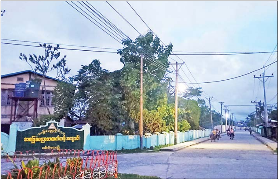
ပေါက်တောမြို့၌ ဓာတ်အားပြန်လည်ဖြန့်ဖြူးပေးထားသည်ကို တွေ့ရစဉ်။