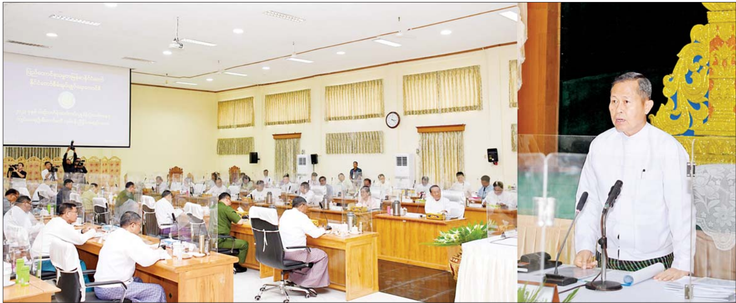
နိုင်ငံတော်စီမံအုပ်ချုပ်ရေးကောင်စီ ဒုတိယဥက္ကဋ္ဌ ဒုတိယဝန်ကြီးချုပ် ဒုတိယဗိုလ်ချုပ်မှူးကြီးစိုးဝင်း နိုင်ငံတော်စီမံအုပ်ချုပ်ရေးကောင်စီ ၂၀၂၃ ခုနှစ် ဝါဆိုသင်္ကန်း ဆက်ကပ်လှူဒါန်းပွဲအခမ်းအနားကျင်းပရေးဦးစီးကော်မတီ လုပ်ငန်းညှိနှိုင်းအစည်းအဝေးတွင် အမှာစကားပြောကြားစဉ်။

နေပြည်တော် ဇူလိုင် ၅ ပြည်ထောင်စုသမ္မတ မြန်မာနိုင်ငံ တော် နိုင်ငံတော်စီမံအုပ်ချုပ်ရေးကောင်စီ ၂၀၂၃ ခုနှစ် ဝါဆိုသင်္ကန်း ဆက်ကပ်လှူဒါန်း ပွဲအခမ်းအနားကျင်းပရေး ဦးစီးကော်မတီ လုပ်ငန်းညှိနှိုင်းအစည်းအဝေးကို ယနေ့ မွန်းလွဲ ၂ နာရီတွင် နေပြည်တော်ရှိ သာသနာရေးနှင့် ယဉ်ကျေးမှုဝန်ကြီးဌာန အစည်းအဝေးခန်းမ၌ ကျင်းပရာ ၂၀၂၃ ခုနှစ် ဝါဆိုသင်္ကန်း ဆက်ကပ်လှူဒါန်းပွဲ အခမ်းအနားကျင်းပရေး ဦးစီးကော်မတီ နာယက နိုင်ငံတော်စီမံအုပ်ချုပ်ရေး ကောင်စီ ဒုတိယဥက္ကဋ္ဌ ဒုတိယဝန်ကြီးချုပ် ဒုတိယဗိုလ်ချုပ်မှူးကြီးစိုးဝင်း တက်ရောက် အမှာစကားပြောကြားသည်။ အစည်းအဝေးသို့ သာသနာရေးနှင့် ယဉ်ကျေးမှုဝန်ကြီးဌာန ပြည်ထောင်စု ဝန်ကြီး ဦးကိုကို၊ နေပြည်တော်ကောင်စီ ဥက္ကဋ္ဌ၊ စာမျက်နှာ ၃ ကော်လံ ၁ သို့ ❖