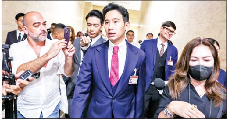
ပီတာ လင်ဂျာရီအန်ရတ်

မေလ ရွေးကောက်ပွဲတွင် ဦးဆောင်ခဲ့သည့် ရှေ့သို့လှမ်းချီပါတီနှင့်ဖွဲ့ထိုင်းပါတီတို့သည် ရှေ့သို့လှမ်းချီပါတီမှ ပီတာ လင်ဂျာရီအန်ရတ်အား ဝန်ကြီးချုပ်သစ်အဖြစ်ထောက်ခံ၍ အမည်စာရင်း တင်သွင်းခဲ့သည်။ ကိုးကား-ဆင်ဟွာ ဘာသာပြန်-စိုးသူရ ❖