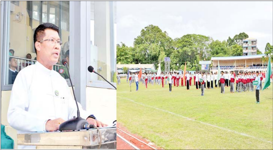
ကြီး ကိုယ်စားပြု ထူးချွန်ထက်မြက်သည့် အမျိုးသမီး ဘောလုံး အားကစားသမားကောင်းများ ပေါ်ထွက် လာစေရေးကို ရည်ရွယ်ပြီး ကျင်းပသည့် ပြိုင်ပွဲဖြစ်ပါကြောင်း၊ ယခုပြိုင်ပွဲမှတစ်ဆင့် မိမိတို့

ခရိုင်အဆင့်၊ တိုင်းဒေသကြီးအဆင့်မှသည် နိုင်ငံ့လက်ရွေးစင်များအထိ ထူးချွန်ထက်မြက်သည့် မျိုးဆက်သစ် အားကစားသမားများ ထွက်ပေါ်လာစေ ရန် ရည်ရွယ်၍ ဧရာဝတီတိုင်းဒေသကြီး ပုသိမ်မြို့၌ ဧရာဝတီတိုင်း ဒေသကြီး ဝန်ကြီးချုပ်ဖလား ရှစ်ခရိုင် အသက် ၁၉ နှစ်အောက် အမျိုးသမီး ဘောလုံးပြိုင်ပွဲ ဖွင့်ပွဲအခမ်းအနားကို ယနေ့ညနေပိုင်းက ကိုးသိန်း အားကစားကွင်း၌ ပြုလုပ်သည်။