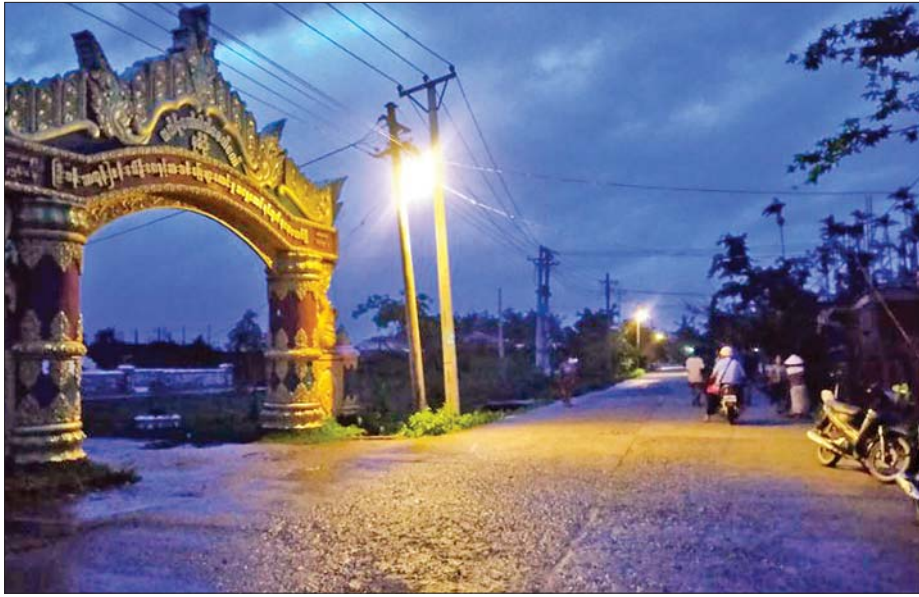
ရသေ့တောင်မြို့၌ ဓာတ်အားပြန်လည်ဖြန့်ဖြူးပေးထားသည်ကို တွေ့ရစဉ်။

တို့အားလည်းကောင်း ဓာတ်အားစနစ်မှ အသီးသီး ဓာတ်အားပြန်လည် ဖြန့်ဖြူးပေးထားပြီး ဖြစ်ပါသည်။ ယခုအခါ ရခိုင်ပြည်နယ် မြောက်ပိုင်းဒေသများအတွင်းရှိ မိုခါ မုန်တိုင်းဒဏ်ကြောင့် ဓာတ်အားလိုင်း၊ ဓာတ်အားခွဲရုံနှင့်ဆက်စပ် ပစ္စည်းများ ပျက်စီးသွားသည့် မြို့နယ်(၁၀)မြို့နယ်အနက် ရှစ်မြို့နယ် အား ဓာတ်အားစနစ်မှ ဓာတ်အား ပြန်လည်ဖြန့်ဖြူးပေးနိုင်ခဲ့ပြီး ဖြစ်ကြောင်းနှင့် ကျန်ရှိသည့်မြို့နယ်နှစ်မြို့နယ်အား အမြန်ဆုံး ဓာတ်အား ပြန်လည်ဖြန့်ဖြူးပေးနိုင်ရေး လျှပ်စစ်စွမ်းအားဝန်ကြီး ဌာနမှ အင်တိုက်အားတိုက် ကြိုးပမ်းဆောင်ရွက်လျက်ရှိကြောင်း သတင်းရရှိပါသည်။