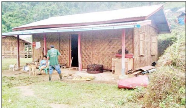
ဝိုင်းမော်မြို့နယ်ဆန်းမြို့ ဆန်းထွေ/အုပ်ယာယီတိုက်ပွဲရှောင်စခန်း မှ အိမ်ထောင်စု ၁၆ စုတို့သည် အမှတ်(၂)ရပ်ကွက်ရှိ တန်ဖိုးနည်း အိမ်ရာသို့ ပြောင်းရွှေ့နေထိုင်စဉ်။