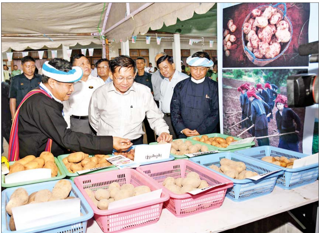
နိုင်ငံတော်စီမံအုပ်ချုပ်ရေးကောင်စီဥက္ကဋ္ဌ နိုင်ငံတော်ဝန်ကြီးချုပ် ဗိုလ်ချုပ်မှူးကြီးမင်းအောင်လှိုင် မေ ၂၃ ရက်က ပအိုဝ်းကိုယ်ပိုင်အုပ်ချုပ်ခွင့်ဒေသအတွင်းရှိ အသေးစား၊ အငယ်စားနှင့် အလတ်စားစီးပွားရေး (MSME) လုပ်ငန်းရှင်များနှင့် တွေ့ဆုံပွဲတွင် ခင်းကျင်းပြသထားသည့် ဒေသထွက်ကုန်ပစ္စည်းများကို ကြည့်ရှုလေ့လာစဉ်။

နိုင်ငံတစ်နိုင်ငံ၏ စီးပွားရေးတိုးတက်မှုအခြေအနေသည် ပြည်ပတင်ပို့မှု၊ တင်သွင်းမှု၊ တင်သွင်းမှုကွာဟချက် တစ်နည်း သွင်းကုန်က ပိုကုန်ထက် များပြားလွန်းလျှင် တိုင်းပြည်စီးပွားရေးတွင် Trade deficit အနုတ်လက္ခဏာကိုသာ မြင်ရမည်။ ကျေးလက်ဒေသနေ တိုင်းပြည်၏ ထုတ်လုပ်မှုအင်အားစုက ၇၀ ရာခိုင်နှုန်းခန့်ရှိနေပြီး မြေပေါ်မြေအောက်၊ ရေပေါ်ရေအောက်သစ်တောသယံဇာတပေါများကြွယ်ဝသော မိမိတို့မြန်မာနိုင်ငံတွင် ခေတ်အဆက်ဆက် ပြည်ပပို့ကုန်ထက် ပြည်ပတင်သွင်းမှုပမာဏ များပြားနေခြင်းသည် လက်ခံနိုင်စရာတစ်ခုမဟုတ်တော့ပါ။ သို့သော် အရေးကြီးကိစ္စရပ်များစွာနှင့်အတူ ပြုပြင်ပြောင်းလဲမှုများဖြင့် ယခုလိုအခြေအနေများတွင် နိုင်ငံတော်အစိုးရအနေဖြင့် ရှေ့လုပ်ငန်းစဉ်များ၊ စီးပွားရေးဦးတည်ချက်များ၊ ဆက်စပ်စီးပွားရေးမူဝါဒများ ချမှတ်ပြီး အရှိန်အဟုန်ဖြင့် ကြိုးပမ်းဆောင်ရွက်