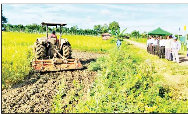
မြို့နယ်(ပြန်/ဆက်)

တောင်သူပေါင်း ၁၀၆၈ ဦး၏ လယ်ဧက ၄၆၀၀ တွင် စိုက်ပျိုးခဲ့ပြီး ဇူလိုင် ၂ ရက်တွင် စိုက်ဧကအားလုံး မြေမြှုပ်ထည့်သွင်း ဆောင်ရွက်ပြီး ကြောင်း သိရသည်။