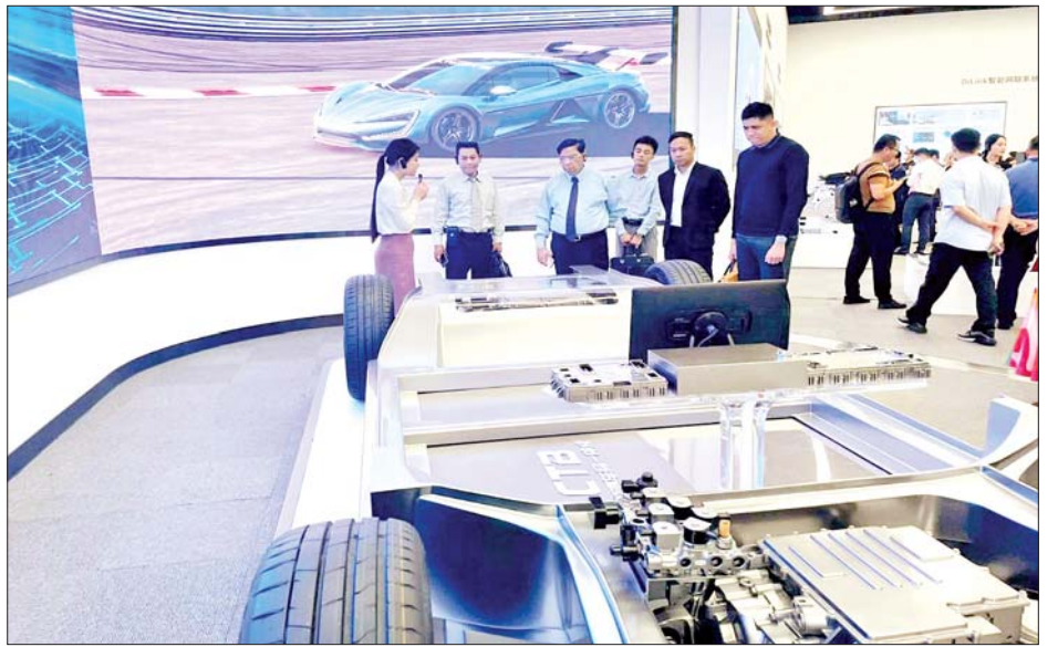
မေးမြန်းဆွေးနွေးပြီး နေရောင်ခြည်စွမ်းအင်သုံး ပစ္စည်းများ ထုတ်လုပ်နေမှုအခြေအနေများကို လှည့်လည်ကြည့်ရှုလေ့လာခဲ့ကြောင်း သိရသည်။ သတင်းစဉ်

ယင်းနောက် ပြည်ထောင်စုဝန်ကြီးက ရှင်းလင်း တင်ပြမှုများနှင့်ပတ်သက်၍ သိရှိလိုသည်များကို