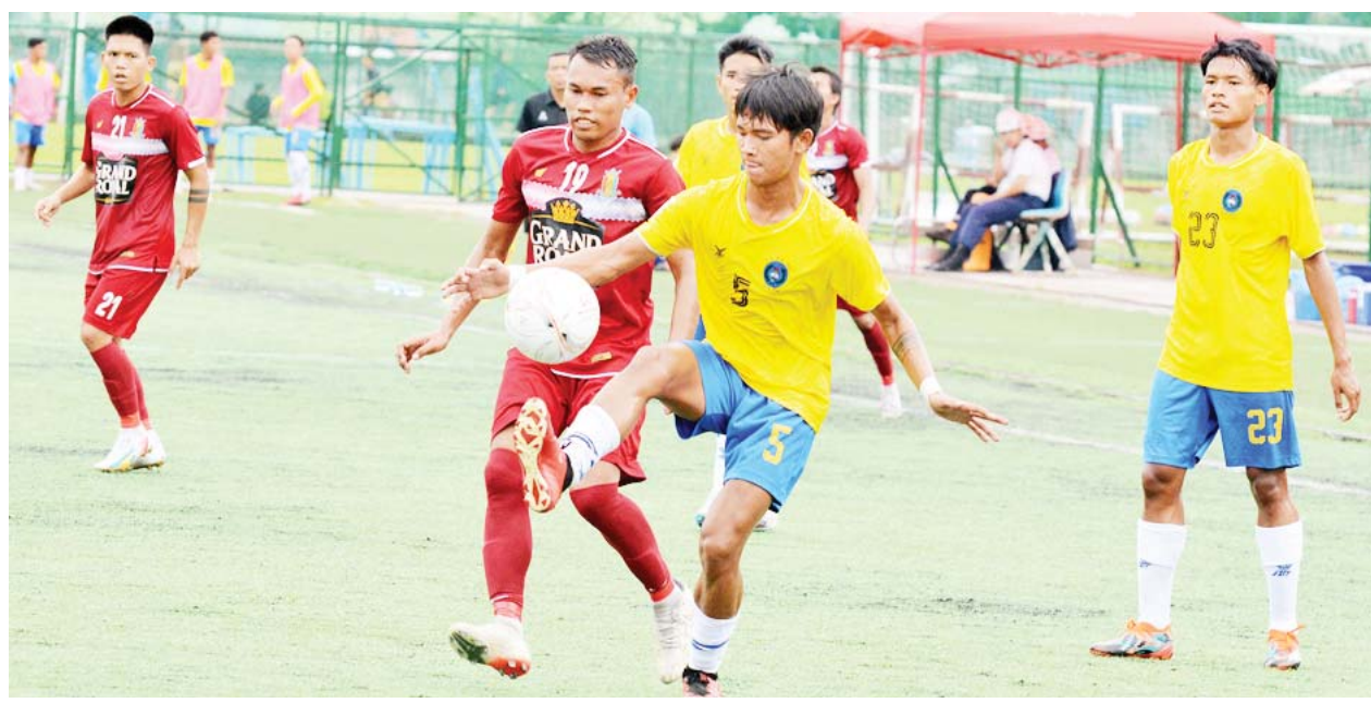
ဟံသာဝတီအသင်းနှင့် အား/ကာသိပွဲအသင်းတို့ ယှဉ်ပြိုင်ကစားကြစဉ်။