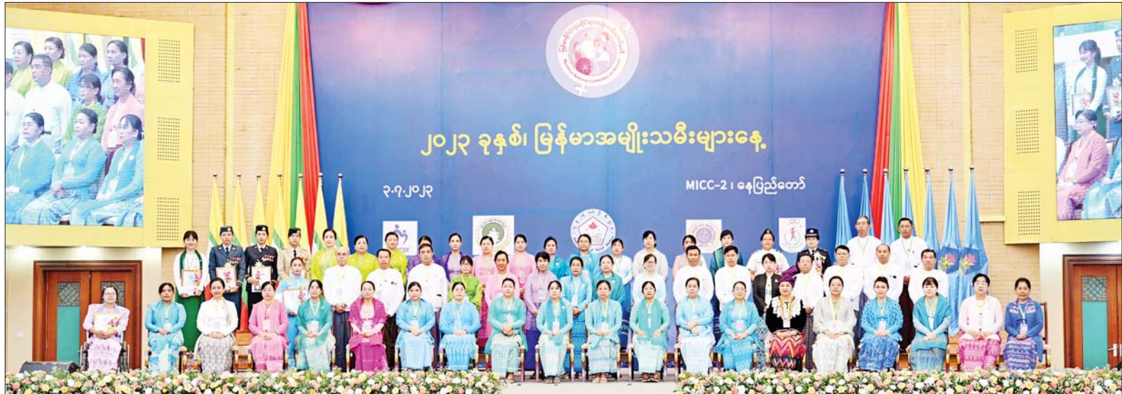
နိုင်ငံတော်စီမံအုပ်ချုပ်ရေးကောင်စီဥက္ကဋ္ဌ နိုင်ငံတော်ဝန်ကြီးချုပ်၏ဇနီး ဒေါ်ကြူကြူလှနှင့် အခမ်းအနားသို့ တက်ရောက်လာကြသူများ စုပေါင်းမှတ်တမ်းတင်ဓာတ်ပုံရိုက်စဉ်။

ဆက်လက်၍ မြန်မာနိုင်ငံလုံးဆိုင်ရာ အမျိုးသမီးကော်မတီဥက္ကဋ္ဌ လှမူဝန်ထမ်း၊ ကယ်ဆယ်ရေးနှင့် ပြန်လည်နေရာချထားရေးဝန်ကြီးဌာန ပြည်ထောင်စုဝန်ကြီးဒေါက်တာ သက်သက်ခိုင်က အမျိုးသမီးများ ဖွံ့ဖြိုးတိုးတက်ရေး၊ အမျိုးသမီးအခွင့်အရေး မြှင့်တင်ဖော်ဆောင်ရေးနှင့် အမျိုးသမီးများအပေါ် အကြမ်းဖက်မှုတုံ့ပြန်တားဆီး ကာကွယ်ရေးဆိုင်ရာ ဆောင်ရွက်ချက်များနှင့် စပ်လျဉ်း၍ အမျိုးသမီးများအား နည်းမျိုးစုံဖြင့် ခွဲခြားမှုပျောက်ရေးဆိုင်ရာ ကုလသမဂ္ဂ ကွန်ဗင်းရှင်း (UNCEDAW)အပေါ် မြန်မာနိုင်ငံက ၁၉၉၇ ခုနှစ်တွင် အဖွဲ့ဝင်နိုင်ငံအဖြစ်ပါဝင်ခဲ့ပြီး အစီရင်ခံစာ တင်သွင်းနိုင်ရေး အတွက် ဆောင်ရွက်လျက်ရှိရာ 2 nd Draft အဆင့်သို့ ရောက်ရှိနေပြီဖြစ်ကြောင်း၊ အာဆီယံဒေသတွင်း ဆောင်ရွက်ချက်များ အဖြစ် ASEAN Ministerial Meeting on Women ကို ၂၀၂၄ ခုနှစ်တွင်