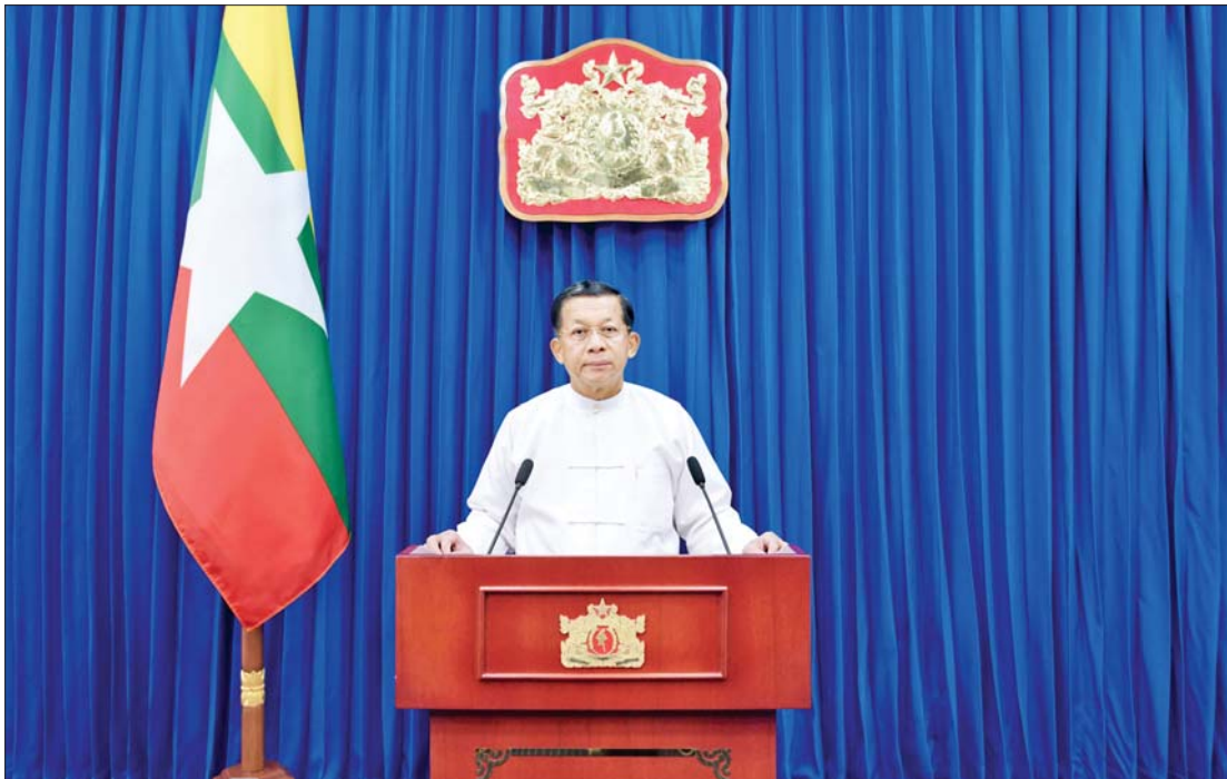
နိုင်ငံတော်စီမံအုပ်ချုပ်ရေးကောင်စီဥက္ကဋ္ဌ နိုင်ငံတော်ဝန်ကြီးချုပ် ဗိုလ်ချုပ်မှူးကြီးမင်းအောင်လှိုင် ၂၀၂၃ ခုနှစ် မြန်မာအမျိုးသမီးများနေ့အခမ်းအနားတွင် Video Message ဖြင့် မိန့်ခွန်းပြောကြားစဉ်။

မြန်မာအမျိုးသမီးများဟာ ရှေးအစဉ်အလာကတည်းက အမျိုးသားများနည်းတူ သာတူညီမျှ လူ့အခွင့်အရေးတွေကို ယနေ့အထိ နိုင်ငံတကာ စံချိန်စံညွှန်းများနဲ့ ကိုက်ညီစွာ ခံစားနေကြရတာ အားလုံးသိရှိပြီးသား ဖြစ်ပါတယ်။ ခေတ်အဆက်ဆက်မှာ မိသားစု၊ လူ့အဖွဲ့အစည်း၊ နိုင်ငံနဲ့လူမျိုး အကျိုးစီးပွား