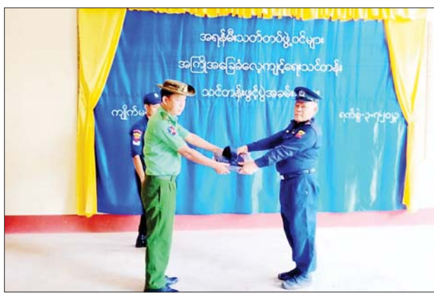
သင်တန်းသို့ သင်တန်းသား ၃၅ ဦး တက်ရောက်ခဲ့ကြောင်း သိရသည်။ မြို့နယ်(ပြန်/ဆက်)