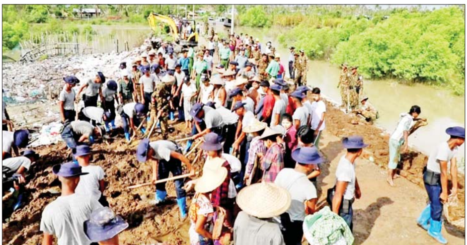
လုပ်ငန်းဆောင်ရွက်နေသူများကို အချို့ရည်ဘူးများနှင့် စားသောက်ဖွယ်ရာများ ပေးအပ်ကာ လိုအပ်

ဝဲ၊ ယာ လမ်းပန်း ပျက်စီးမှုများကို ပြုပြင်ခြင်း၊ နန်းမြေများကို ဖယ်ရှားရှင်းလင်းခြင်း၊ တံတားအောက် ချောင်းရေ ရေစီးရေလာကောင်းမွန်စေရေးအတွက် အမှိုက်များ ဆယ်ယူပေးခြင်း လုပ်ငန်းများကို စက်ယန္တရားများဖြင့် စုပေါင်းဆောင်ရွက်ပေးကြသည်။ ကြည့်ရှုအားပေး ယင်းသို့ဆောင်ရွက်ပေးနေမှုများကို တိုင်းမှူးဗိုလ်ချုပ် ထင်လတ်ဦးနှင့် တာဝန်ရှိသူများက သွားရောက်ကြည့်ရှုအားပေးပြီး လမ်းပြုပြင်ခြင်း