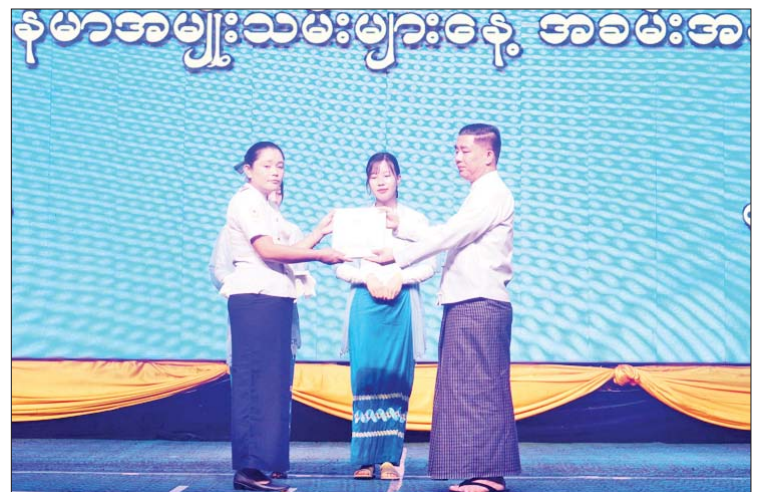
ရေးအသင်းနှင့် စေတနာ့ဝန်ထမ်းအဖွဲ့ နှုတ်ဆက်ခဲ့ကြောင်း သိရသည်။ ပြည်နယ်(ပြန်/ဆက်)

အမှာစကားပြောကြားသည်။ ဆက်လက်၍ တိုင်းဒေသကြီးဝန်ကြီးချုပ်နှင့် တာဝန်ရှိသူများက မြန်မာအမျိုးသမီးများနေ့ အထိမ်းအမှတ် Video Clip ကို ကြည့်ရှုအားပေးကြပြီး အမျိုးသမီးငယ်များက “ပန်းကလေးများ၏ဥယျာဉ်မှ” တေးသီချင်းဖြင့် ကပြဖျော်ဖြေကာ တိုင်းဒေသကြီး လူမှုရေးရာဝန်ကြီးက ဂုဏ်ပြုချီးမြှင့်ငွေများ ပေးအပ်သည်။ ထို့နောက် တိုင်းဒေသကြီး ဝန်ကြီးချုပ်က တာဝန်ရှိသူများနှင့်အတူ စုပေါင်းမှတ်တမ်းတင်ဓာတ်ပုံရိုက်ကြပြီး အခမ်းအနားသို့ တက်ရောက်လာသူများအား ရင်းရင်းနှီးနှီးလိုက်လံ နှုတ်ဆက်အားပေးကာ အခမ်းအနားကို ရပ်သိမ်းခဲ့ကြောင်း သိရသည်။ တိုင်းဒေသကြီး(ပြန်/ဆက်)