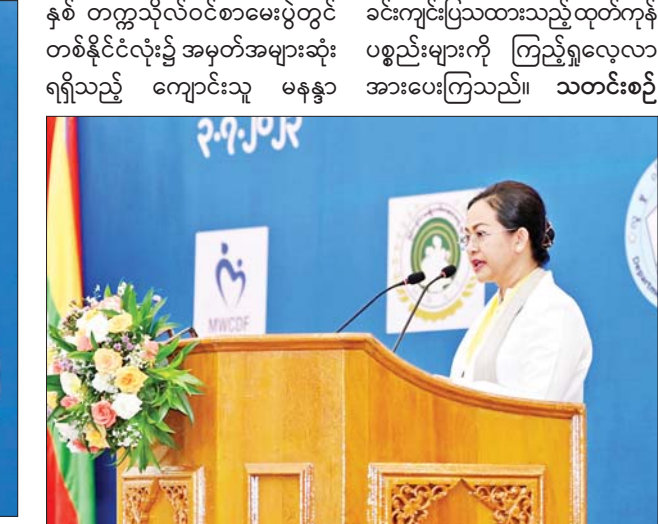
မြန်မာနိုင်ငံလုံးဆိုင်ရာ အမျိုးသမီးကော်မတီဥက္ကဋ္ဌ ပြည်ထောင်စုဝန်ကြီး ဒေါက်တာသက်သက်ခိုင် ရှင်းလင်းတင်ပြစဉ်။