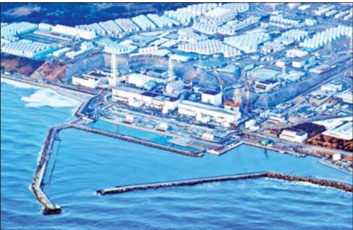
စာမျက်နှာ » ၁၃

ဂျပန်နိုင်ငံ ဖူကူရှီးမားဒိုင်အိချိ နျူကလီးယားဓာတ်အားပေး စက်ရုံမှ စွန့်ပစ်ရေများအား စွန့်ထုတ်မည့်အစီအစဉ်ကို နွေရာသီတွင် ဆောင်ရွက်မည်