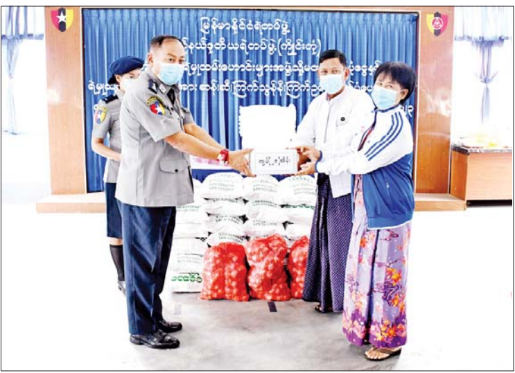
ကျိုင်းတုံမြို့နယ်ရဲမှုထမ်းဟောင်းများအား ကြက်ဥများ ထောက်ပံ့ပေးခဲ့ကြောင်း သိရသည်။ မြို့နယ်(ပြန်/ဆက်)

ဦးစွာ ပြည်နယ်ဒုတိယရဲတပ်ဖွဲ့မှူး (ကျိုင်းတုံ) ရဲမှူးကြီးအေးသိန်းက အမှာစကားပြောကြားပြီး ကျိုင်းတုံမြို့နယ် ရဲမှုထမ်းဟောင်းများအဖွဲ့အား မတည်ရန်ပုံငွေကျပ် သိန်း ၂၀ ထောက်ပံ့ပေးသည်။ ထို့နောက် ပြည်နယ်ဒုတိယရဲတပ်ဖွဲ့ (ကျိုင်းတုံ) စည်းရုံးရေးကော်မတီဥက္ကဋ္ဌ ရဲမှူးကြီးအေးသိန်းနှင့် တာဝန်ရှိသူများက ကျိုင်းတုံမြို့နယ်ရဲမှုထမ်းဟောင်းများအား ကြက်ဥများ ထောက်ပံ့ပေးခဲ့ကြောင်း သိရသည်။ မြို့နယ်(ပြန်/ဆက်)