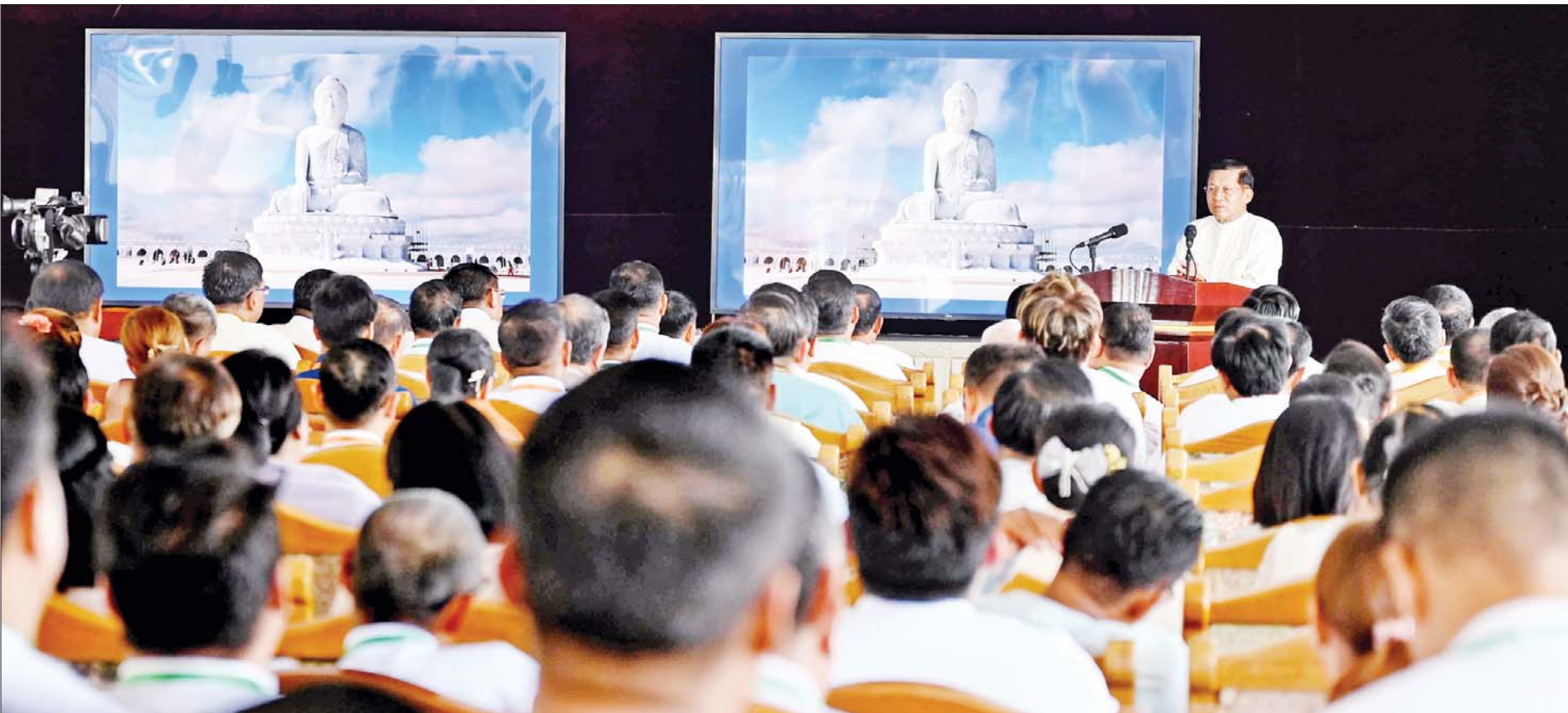
ဦးဆောင်ဘုရားဒါယကာ နိုင်ငံတော်စီမံအုပ်ချုပ်ရေးကောင်စီဥက္ကဋ္ဌ နိုင်ငံတော်ဝန်ကြီးချုပ် ဗိုလ်ချုပ်မှူးကြီးမင်းအောင်လှိုင်က ကမ္ဘာပေါ်ရှိ ထိုင်တော်မူ ကျောက်ဆစ်ဗုဒ္ဓရုပ်ပွားတော်များအနက် ဉာဏ်တော် အမြင့်ဆုံးဖြစ်လာမည့် မာရဝိဇယဗုဒ္ဓရုပ်ပွားတော်မြတ်ကြီး တည်ထားကိုးကွယ်ခြင်းနှင့်ပတ်သက်၍ ရှင်းလင်းပြောကြားစဉ်။