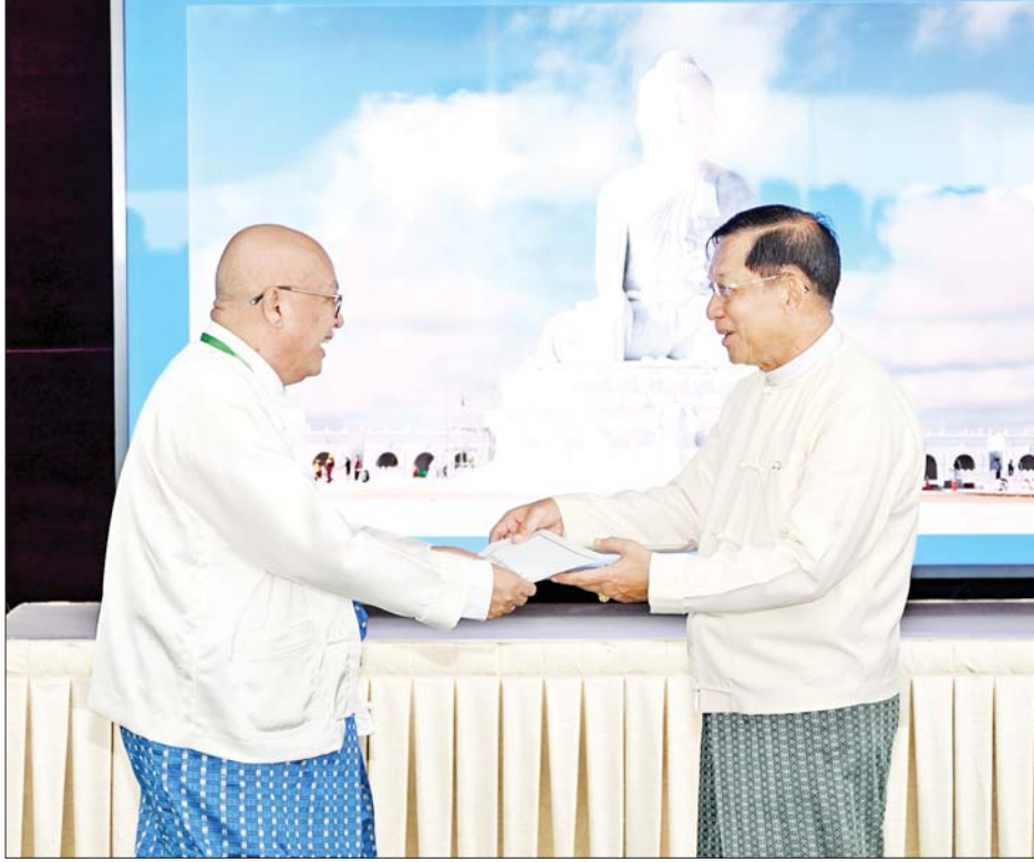
ဦးဆောင်ဘုရားဒါယကာ နိုင်ငံတော်စီမံအုပ်ချုပ်ရေးကောင်စီဥက္ကဋ္ဌ နိုင်ငံတော်ဝန်ကြီးချုပ် ဗိုလ်ချုပ်မှူးကြီးမင်းအောင်လှိုင်ထံ အလှူရှင်တစ်ဦးက အလှူငွေ ပေးအပ်လှူဒါန်းစဉ်။

အသုံးပြုခဲ့ရကြောင်း၊ ဆင်းတုတော်အပိုင်းများ ထည့်သွင်းထားသည့် သံမဏိပန်းတောင်းကို တန်ချိန် ၁၅၀၀ ရှိသည့် သံမဏိမျှော်စင်ကြီးနှင့် တန်ချိန် ၂၅၀ ရှိ အထောက်အကူပြုသံမဏိစင်ကို အသုံးပြု၍ ဆောင်ရွက်ခဲ့ရကြောင်း၊ ထိုသို့ပင့်ထောင်ခြင်း လုပ်ငန်းများနှင့် ပင့်ဆောင်ခြင်းလုပ်ငန်းများကို အမှားအယွင်းများမရှိစေရေး ခက်ခက်ခဲခဲဖြင့် ဆောင်ရွက်ခဲ့ခြင်းဖြစ်ကြောင်း။