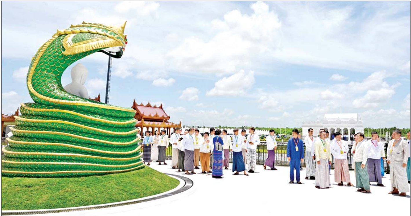
အခမ်းအနားတက်ရောက်လာကြသူများက မာရဝိဇယဗုဒ္ဓရုပ်ပွားတော်အတွင်း လှည့်လည်ကြည့်ရှုဖူးမြော်ကြရာ ဦးဆောင်ဘုရားဒါယကာ နိုင်ငံတော်စီမံအုပ်ချုပ်ရေးကောင်စီဥက္ကဋ္ဌ နိုင်ငံတော်ဝန်ကြီးချုပ် ဗိုလ်ချုပ်မှူးကြီး မင်းအောင်လှိုင် ရှင်းလင်းပြသစဉ်။

မာရဝိဇယဗုဒ္ဓရုပ်ပွားတော်မြတ်ကြီး၏ ဆင်းတုတော်အပိုင်းများ တွဲဆက်ရာတွင် ခိုင်မာမှုရှိစေရေးအတွက် ခေတ်မီနည်းပညာများဖြင့် ဆောင်ရွက်ထားရှိကြောင်း၊ အလားတူ တွဲဆက်ထားသည့် ဆင်းတုတော်အပိုင်းများကို ပင့်ထောင်ခြင်းလုပ်ငန်းများဆောင်ရွက်ရာတွင် မြန်မာနိုင်ငံ အင်ဂျင်နီယာအသင်းနှင့် တပ်မတော်အင်ဂျင်နီယာတပ်ဖွဲ့တို့ ပူးပေါင်းဆောင်ရွက်ခဲ့ကြခြင်းဖြစ်ပြီး ပြည်ပပညာရှင်များ လုံးဝပါရှိခြင်း မရှိကြောင်း၊ တန်ချိန်ပေါင်း ၁၇၀၀ ရှိသည့် ဆင်းတုတော်အပိုင်း(၁၊ ၂) တို့တွဲဆက်ထားသည့်အပိုင်းအား ပင့်ထောင်ခြင်းလုပ်ငန်းများ ဆောင်ရွက်ရန်အတွက် သံမဏိပန်းတောင်းကို