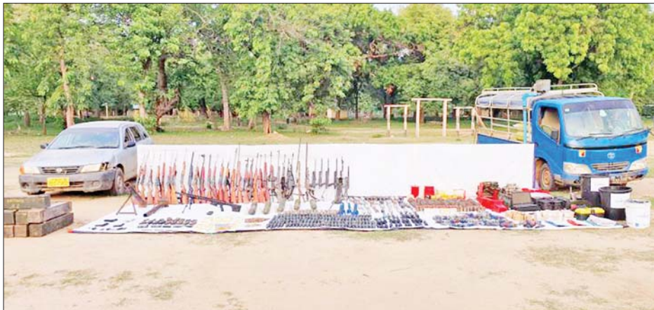
စစ်ကိုင်းတိုင်းဒေသကြီး စစ်နယ်ကျေးရွာ၌ လက်နက်/ခဲယမ်းများ သိမ်းဆည်းရမိမှု မှတ်တမ်းဓာတ်ပုံ။