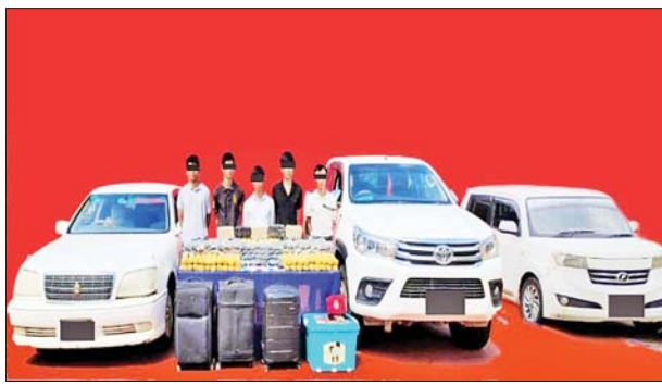
တူးနိုင်၊ ခွန်ဂျက်(ခ)လီဟောက်၊ အားချို(ခ)လျှိုပိန်းချို၊ ယော်ကျိန်ရှန်နှင့် လောက်ရှုံး တို့အား သိမ်းဆည်းရမိသည့် စိတ်ကြွ ရူးသွပ်ဆေးပြားများနှင့်အတူ တွေ့ရစဉ်။

၂၀၂၃-၂၀၂၄ ဘဏ္ဍာနှစ် မြစ်မီးရောင်ကျေးရွာစီမံကိန်းရရှိသော မြောက်ချောကုန်းကျေးရွာနေ ပြည်သူများအား စီမံကိန်း မိတ်ဆက် ရှင်းလင်းခဲ့ကာ ကျေးရွာကြီးကြပ်မှုလုပ်ငန်းအဖွဲ့ ဖွဲ့စည်းပေးခြင်းတို့ကို ဆောင်ရွက်ပေးခဲ့ကြောင်း သိရသည်။ အဆိုပါကျေးရွာတွင် အိမ်ခြေ ၂၅၀၊ အိမ်ထောင်စု ၂၅၅ စု ရှိပြီး မြစ်မီးရောင် အရင်းမပျောက်လည်ပတ်ရန်ပုံငွေ ကျပ်သိန်း ၃၀၀ ထုတ်ချေး ပေးသွားမည်ဖြစ်ကြောင်း သိရသည်။ မြို့နယ်(ပြန်/ဆက်)