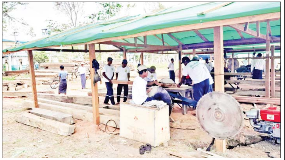
စစ်တွေမြို့သို့ ပို့ဆောင်ပေးထားသော ရွှေ့ပြောင်းသစ်စက်များ။