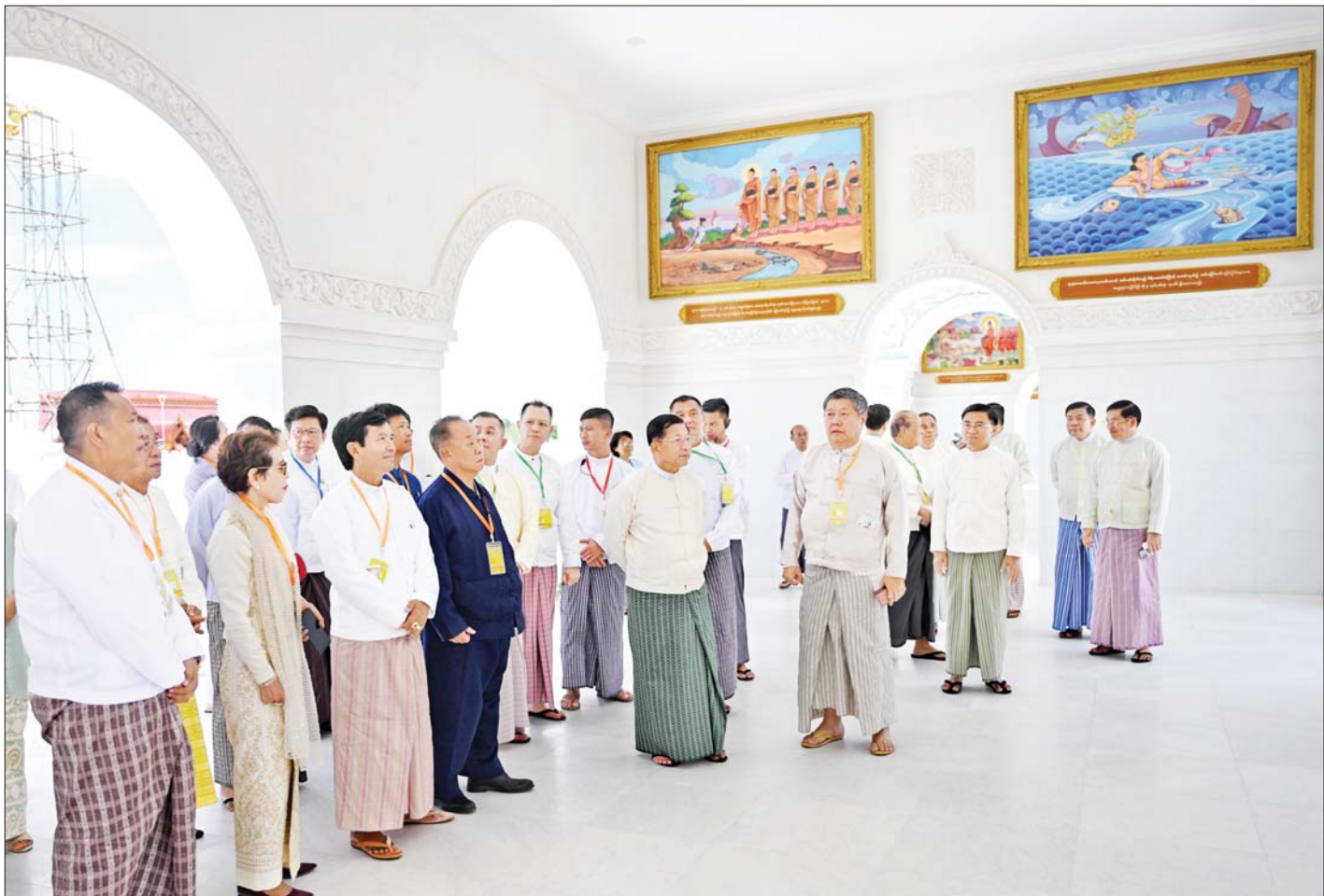
အခမ်းအနားတက်ရောက်လာကြသူများက မာရဝိဇယဗုဒ္ဓဥယျာဉ်တော်အတွင်း လှည့်လည်ကြည့်ရှုကြရာ ဦးဆောင်ဘုရားဒါယကာ နိုင်ငံတော်စီမံအုပ်ချုပ် ရေးကောင်စီဥက္ကဋ္ဌ နိုင်ငံတော်ဝန်ကြီးချုပ် ဗိုလ်ချုပ်မှူးကြီး မင်းအောင်လှိုင်က ရှင်းလင်းပြသစဉ်။

၂၀၂၀ ပြည့်နှစ် ဇူလိုင် ၃ ရက်တွင် ကျောက်တုံး တော်ကြီးများကို စတင်ပင့်ဆောင်ခြင်းအခမ်းအနား ကို ဆောင်ရွက်၍ပင့်ဆောင်ခဲ့ကြောင်း၊ ကျောက်တုံး တော်ကြီးများ ထိခိုက်မှုမရှိစေရေး စနစ်တကျဖြင့် ပင့်ဆောင်ခဲ့ရပြီး စုစုပေါင်းအနေဖြင့် ကိုးကြိမ် ပင့်ဆောင်ခဲ့ရကာ တန်ချိန်အားဖြင့် ၈၁၅၈ တန် သယ်ဆောင်ခဲ့ကြောင်း၊ ရေလမ်းခရီးဖြင့် စတင် ကျောက်တုံးကြီးကို သယ်ဆောင်ခြင်းသည် ကမ္ဘာပေါ် တွင် မှတ်တမ်းဝင်ခဲ့ကြောင်း၊ စက်တင်ဘာ ၁၈ ရက် တွင် ကျောက်တုံးတော်ကြီးများအားလုံး ဆီမီးခုံ ဆိပ်ကမ်းသို့ ရောက်ရှိခဲ့ကြောင်း၊ ဆီမီးခုံဆိပ်ကမ်းမှ စကားအင်းအပိုင်းအကြား ကျောက်တုံးတော်ကြီး များ ချောမွေ့စွာသယ်ယူနိုင်ရေး ၂၂ မိုင် ၅ ဖာလုံ အရှည်လမ်းအား ဆောင်ရွက်ခဲ့ပြီး နေပြည်တော်သို့ ၂၀၂၁ ခုနှစ် ဇန်နဝါရီ ၂၅ ရက်တွင် စတင်ပင့်ဆောင်ခဲ့ ကြောင်း၊ ထိုသို့ပင့်ဆောင်ရာတွင်လည်း တန်ချိန် ၁၅၀၀ နှင့် ၂၀၀၀ ကြား သယ်ဆောင်နိုင်သည့် ကားများ