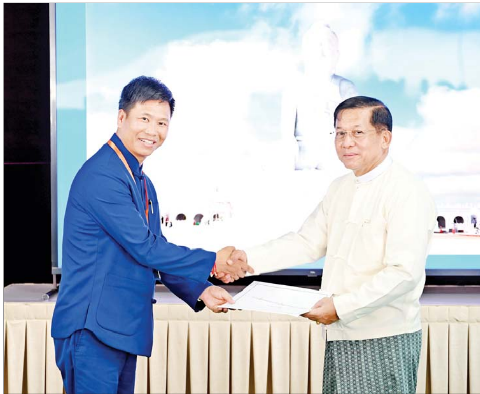
ဦးဆောင်ဘုရားဒါယကာ နိုင်ငံတော်စီမံအုပ်ချုပ်ရေးကောင်စီဥက္ကဋ္ဌ နိုင်ငံတော်ဝန်ကြီးချုပ် ဗိုလ်ချုပ် မှူးကြီးမင်းအောင်လှိုင်ထံ အလှူရှင်တစ်ဦးက အလှူငွေပေးအပ်လှူဒါန်းစဉ်။

သွားလာနိုင်ရေး ရှောင်ကွင်းလမ်းများဖောက်လုပ်ခြင်း နှင့် လမ်းများအဆင့်မြှင့်တင်ခြင်းလုပ်ငန်းများ ဆောင်ရွက်ခဲ့ကြောင်း၊ ထိုသို့ဆောင်ရွက်ရာတွင် အချိန်အားဖြင့် လေးလကြာမြင့်ခဲ့ကြောင်း၊ ကျောက်တော်ကြီးများ ပင့်ဆောင်သည့်အချိန်သည် ကိုဗစ်ကာလဖြစ်ပွားနေချိန်နှင့် နိုင်ငံရေးအရအကျပ် အတည်းများဖြစ်နေသဖြင့် အချို့မှာကျောက်တော် ကြီးများပင့်ဆောင်မှုကို အသေးစိတ်သိရှိမှုနည်းပါး ကြကြောင်း။