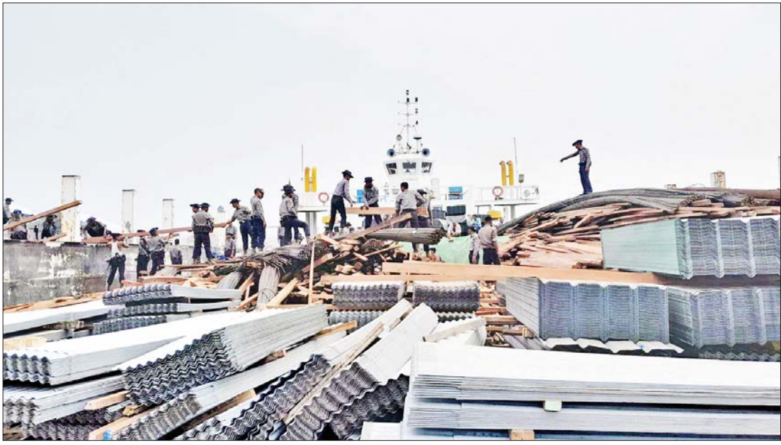
သင်္ဘောကြီးများပေါ်မှ သစ်ခွဲသားများ သယ်ယူနေကြစဉ်။