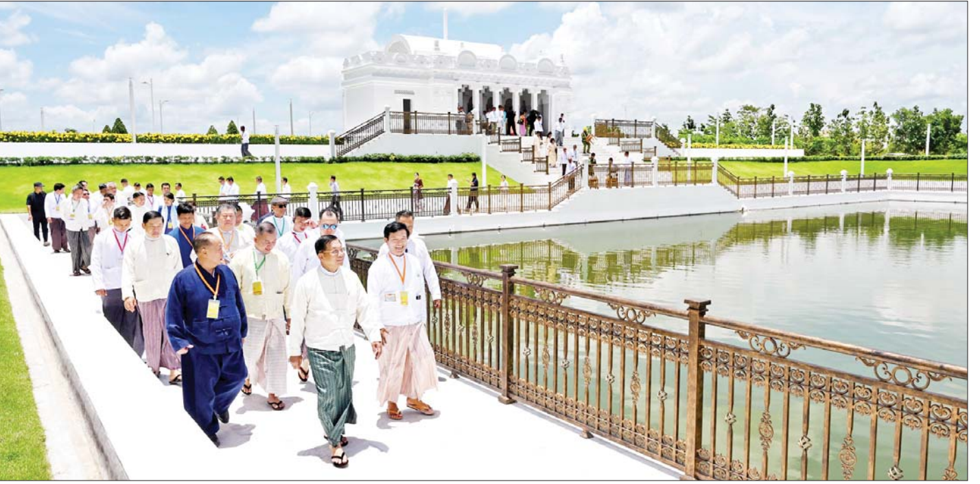
အခမ်းအနားတက်ရောက်လာကြသူများက မာရဝိဇယဗုဒ္ဓရုပ်ပွားတော်အတွင်း လှည့်လည်ကြည့်ရှုကြရာ ဦးဆောင်ဘုရားဒါယကာ နိုင်ငံတော်စီမံအုပ်ချုပ် ရေးကောင်စီဥက္ကဋ္ဌ နိုင်ငံတော်ဝန်ကြီးချုပ် ဗိုလ်ချုပ်မှူးကြီးမင်းအောင်လှိုင်က ရှင်းလင်းပြသစဉ်။

● ရှေးဖိုးမှ ဦးစွာ ဦးဆောင်ဘုရားဒါယကာ နိုင်ငံတော် စီမံအုပ်ချုပ်ရေးကောင်စီဥက္ကဋ္ဌ နိုင်ငံတော်ဝန်ကြီးချုပ် ဗိုလ်ချုပ်မှူးကြီး မင်းအောင်လှိုင်က ကမ္ဘာပေါ်ရှိ ထိုင်တော်မူ ကျောက်ဆစ်ဗုဒ္ဓရုပ်ပွားတော်များအနက် ဉာဏ်တော်အမြင့်ဆုံးဖြစ်လာမည့် မာရဝိဇယ ဗုဒ္ဓရုပ်ပွားတော်မြတ်ကြီး တည်ထားကိုးကွယ်ခြင်း နှင့် ပတ်သက်၍ ရှင်းလင်းပြောကြားရာတွင် ကမ္ဘာပေါ် တွင် စတုရန်းပေပေါင်း ၅၀၀၀ ကျော်ကျော်ဖြင့် ထုဆစ်သည့်ဗုဒ္ဓရုပ်ပွားတော် များတွင် ဉာဏ်တော်အမြင့်ဆုံးဖြစ်လာမည့် မာရဝိဇယ ဗုဒ္ဓရုပ်ပွားတော်မြတ်ကြီး တည်ထားကိုးကွယ်မှု အခြေအနေများနှင့်ပတ်သက်၍ ရှင်းလင်းပြသရန် ဖြစ်ကြောင်း၊ အခမ်းအနားသို့ တက်ရောက်လာကြ သည့် ဓမ္မမိတ်ဆွေများသည် ဘာသာ၊ သာသနာ အားဖြင့်သော်လည်းကောင်း၊ နိုင်ငံ၏ လူမှုစီးပွားဘဝ ဖွံ့ဖြိုးတိုးတက်ရေးလုပ်ငန်းများတွင်လည်းကောင်း တိုးတက်မှုရှိရန် ကျရာအခန်းကဏ္ဍများမှ ပါဝင် ထမ်းဆောင်နေကြသည့် လူပုဂ္ဂိုလ်များဖြစ်ကြကြောင်း၊ ထို့ကြောင့် နိုင်ငံတော်အတွက် ဂုဏ်ယူဖွယ်ရာဖြစ်သည့် နေပြည်တော်တွင် မာရဝိဇယဘုရားကြီး တည်ထား ကိုးကွယ်နေသည့် အခြေအနေများကို သိရှိရန်လိုအပ် သည်ဟု ယူဆပြီး ကုသိုလ်စိတ်ပွားများနိုင်ရေး ရှင်းလင်းပြသခြင်း ဖြစ်ပါကြောင်း။