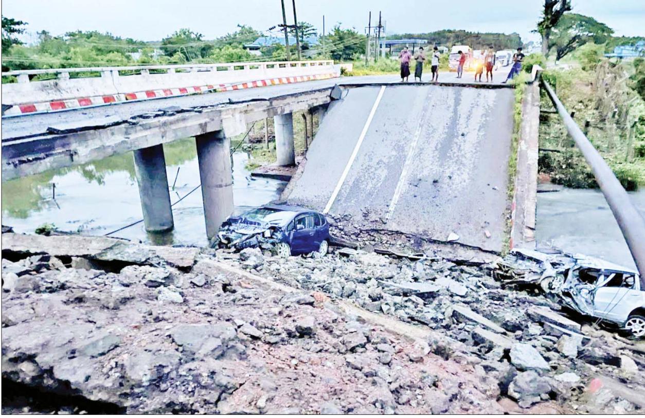
KNLA အဖွဲ့မှ အကြမ်းဖက်မှုလိုလားသူများနှင့် PDF အမည်ခံ အကြမ်းဖက်ပူးပေါင်းအဖွဲ့က မိုင်းထောင်ဖောက်ခွဲဖျက်ဆီးခဲ့သည့် ကျုံအိတ်တံတားကို တွေ့ရစဉ်။