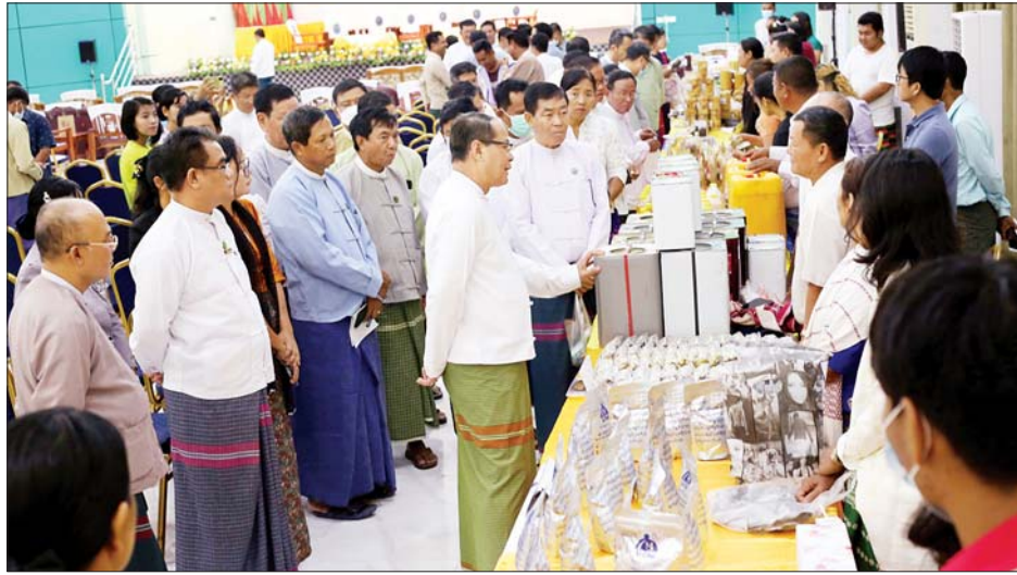
ပြသထားသော စားသောက်ကုန်လုပ်ငန်း၊ ပိုးထည် ဘဏ်လုပ်ငန်း၊ ဆန်စက်လုပ်ငန်း၊ ဆီစက်လုပ်ငန်း၊ နှင့် အဝတ်အထည်လုပ်ငန်း၊ အလှကုန်လုပ်ငန်း၊ ဝါးလက်မှုလုပ်ငန်း၊ ဘီလပ်မြေနှင့်အင်္ဂါတေလုပ်ငန်း၊ ကျောက်မျက်နှာ သတ္တုတွင်းထွက်လုပ်ငန်း၊ စိုက်ပျိုးမွေးမြူရေး ထုတ်ကုန်လုပ်ငန်းအစရှိသည်။

ယင်းနောက် ပြည်နယ်ဝန်ကြီးချုပ်နှင့် တက်ရောက်လာသူများသည် ခန်းမအတွင်းခင်းကျင်း