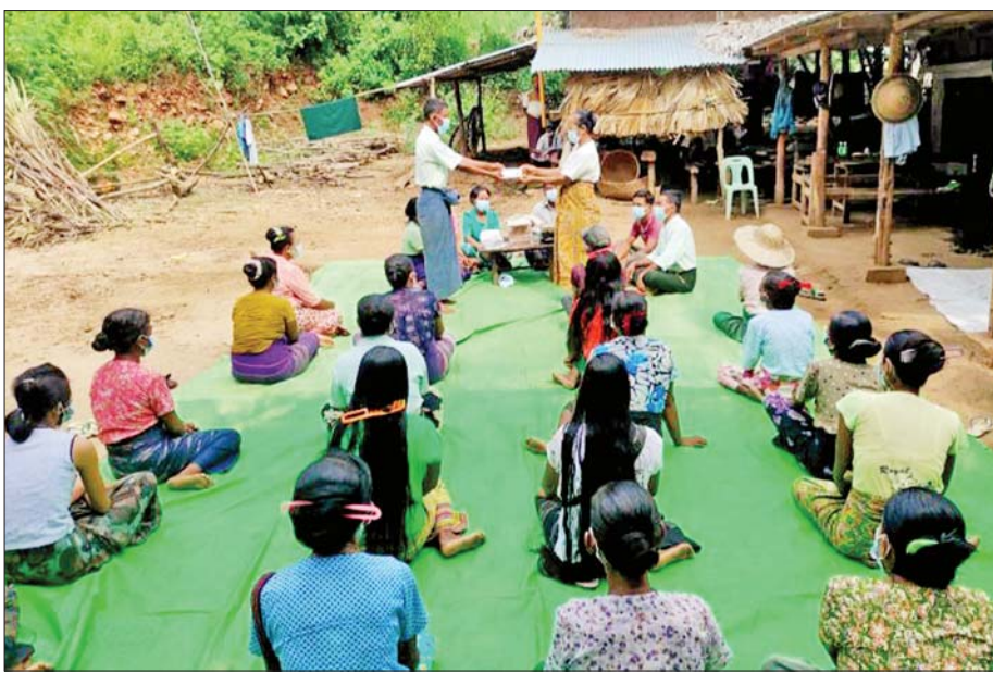
ကျောက်ပန်းတောင်းမြို့နယ် အောင်ချမ်းသာကျေးရွာ၌ မြစ်မီးရောင်ကျေးရွာစီမံကိန်း အရင်းမပျောက် လည်ပတ်ရန်ပုံငွေထုတ်ချေးစဉ်။

ထိုကဲ့သို့ ဆောင်ရွက်ခဲ့ရာ ၃၁-၅-၂၀၂၃ ရက် နေ့အထိ လုပ်ငန်းဆောင်ရွက်မှုအလိုက် ကုန်ထုတ် လုပ်မှုသမဝါယမအသင်း ၃၁၉၉၀ သင်း၊ ဝန်ဆောင် မှုသမဝါယမအသင်း ၃၆၀၄ သင်းနှင့် ကုန်သွယ်မှု သမဝါယမအသင်း ၃၁၁၅ သင်းဖြစ်ပြီး သမဝါယမ အသင်းပေါင်း ၃၈၇၀၉ သင်းကို ဖွဲ့စည်းနိုင်ခဲ့သည်။ အသင်းအမျိုးအစားများအနေဖြင့် ဗဟိုသမဝါယမ အသင်းတစ်သင်း၊ သမဝါယမအသင်းစုချုပ် ၂၂ သင်း၊ သမဝါယမအသင်းစု ၄၄၈ သင်း၊ အခြေခံသမဝါယမ အသင်း ၃၈၂၃၈ သင်း စုစုပေါင်း ၃၈၇၀၉ သင်း