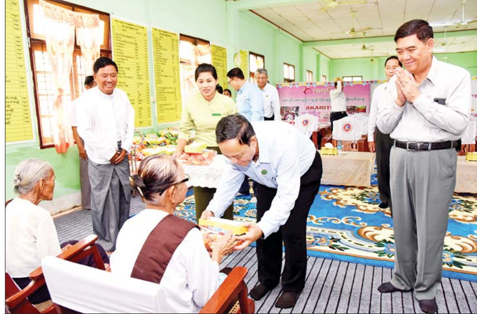
ပြည်ထောင်စုဝန်ကြီးဦးလှမိုး ရခိုင်ပြည်နယ် ဘိုးဘွားရိပ်သာရှိ အဘိုး၊ အဘွားများအတွက် စားသောက် ဖွယ်ရာများနှင့် အလှူငွေများထောက်ပံ့လှူဒါန်းစဉ်။