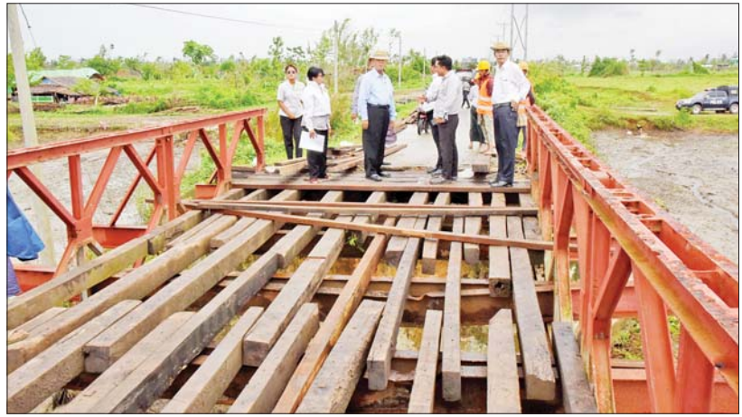
ပြည်ထောင်စုဝန်ကြီးဦးလှမိုးနှင့်အဖွဲ့ အောင်မင်္ဂလာရပ်ကွက်နှင့် ရွာသစ်ကေးကျေးရွာ တို့ကို ဆက်သွယ်ပေးထားသည့် ဘေလီသစ်သားကြမ်းခင်းတံတား ပြန်လည်တည်ဆောက် နေမှုကို ကြည့်ရှုစစ်ဆေးစဉ်။

အစည်းအဝေးသို့ တက်ရောက် ပြီး လုပ်ငန်းကော်မတီအလိုက် တင်ပြသည့် ပြန်လည်ထူထောင် ရေးဆိုင်ရာ လုပ်ငန်းများအပေါ် လိုအပ်သည်များ ပေါင်းစပ်ညှိနှိုင်း ဆောင်ရွက်ပေးသည်။ တက်ရောက် ထိုပြင် စိုက်ပျိုးရေး၊ မွေးမြူရေး နှင့် ဆည်မြောင်းဝန်ကြီးဌာနမှ ရခိုင်ပြည်နယ်အတွင်းရှိ မြို့နယ် များသို့ ဟင်းသီးဟင်းရွက် မျိုးစေ့ များ ပေးအပ်ပွဲအခမ်းအနားကို ယနေ့တွင် ပြည်နယ်စိုက်ပျိုးရေး ဦးစီးဌာန၌ကျင်းပရာ ဒုတိယ ဝန်ကြီး ဒေါက်တာအောင်ကြီး တက်ရောက်သည်။ အခမ်းအနားတွင် ရခိုင်ပြည်နယ် အတွင်းရှိ ခရိုင် စိုက်ပျိုးရေးဦးစီး များများထံ ရုံးပတီ၊ တိုင်ထောင်ပဲ၊ တိုင်လွတ်ပဲ၊ ရွှေဖရုံ၊ ကျောက်ဖရုံ၊ ခရမ်းသီး၊ ခရမ်းကြွပ်သီး၊ သခွား၊ ငရုတ်၊ ချဉ်ပေါင်၊ ကြက်ဟင်းခါး၊ ပဲလင်းမြွေနှင့် ပဲစောင်းလျား စသည့် မျိုးစေ့ထုတ် ၅၈၅၀၀ ကို ဖြန့်ခွဲပေးအပ်ခဲ့ကြောင်း သိရ သည်။ သတင်းစဉ်