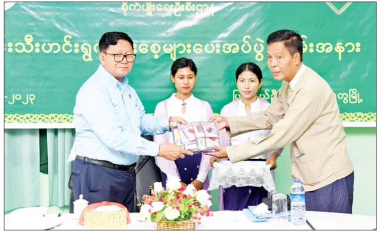
ဒုတိယဝန်ကြီးဦးအောင်ကြီး ခရိုင်စိုက်ပျိုးရေးဦးစီးမှူးထံ မျိုးစေ့များ ပေးအပ်စဉ်။