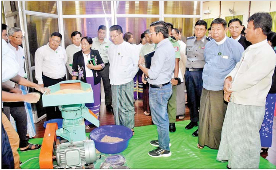
သွားရမည်ဖြစ်ကြောင်း၊ ယခုပြသထားသည့် သည်အထိ ဆောင်ရွက်ရန်လိုကြောင်း၊ တိုင်းဒေသ ကြီး၏ အသေးစား၊ အငယ်စား၊ အလတ်စားလုပ်ငန်း စက်ပစ္စည်းများဖြင့် တစ်နိုင်တစ်ပိုင် ထုတ်လုပ်နိုင်

အခမ်းအနားတွင် တိုင်းဒေသကြီး ဝန်ကြီးချုပ် ဦးတင်မောင်ဝင်းက မွေးမြူရေးလုပ်ငန်းသုံး တိရစ္ဆာန် အစာများ ကြိတ်ခွဲပြုပြင် ထုတ်လုပ်သည့် စက်ပစ္စည်း များကို တိုင်းဒေသကြီးရှိ စိုက်ပျိုး၊ မွေးမြူရေး တောင်သူများ လေ့လာအသုံးပြုနိုင်စေရေးအတွက် ပြသပေးခြင်းဖြစ်ကြောင်း၊ မိမိတို့တိုင်းဒေသကြီး သည် စိုက်ပျိုး၊ မွေးမြူရေးတိုင်းဒေသကြီး ဖြစ်သော် လည်း စိုက်ပျိုးရေးအတွက် မြေဩဇာနှင့် မွေးမြူရေး အတွက် တိရစ္ဆာန်အစားအစာများ ထုတ်လုပ်မှု နည်းပါးနေသေးကြောင်း၊ ဒေသထွက်ကုန်ကြမ်းများဖြင့် တိရစ္ဆာန်အစားအစာများ ပိုမိုထုတ်လုပ်နိုင်ရေးဆောင်ရွက်