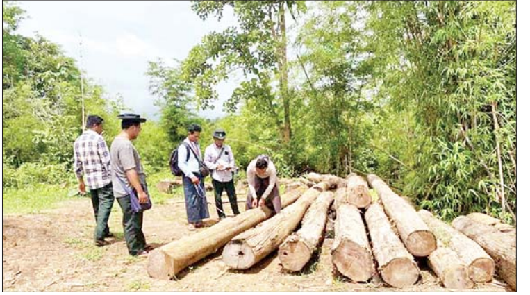
ပဲခူးတိုင်းဒေသကြီး၌ ဖမ်းဆီးရမိမှု။

တိုင်းဒေသကြီး တရားမဝင်ကုန်သွယ်မှု တိုက်ဖျက်ရေး အထူးအဖွဲ့၏ စီမံခန့်ခွဲမှုဖြင့် တာဝန်ကျပူးပေါင်းအဖွဲ့များက စစ်ဆေးမှုများ ဆောင်ရွက်ခဲ့ရာ ဆိပ်ဖြူမြို့နယ် အနော်ရထာတံတားစစ်ဆေးရေးဂိတ်၌ ယာဉ်တစ်စီးနှင့် သုံးဘီးယာဉ်တစ်စီးပေါ်မှ တရားဝင်စာရွက်စာတမ်း အထောက်အထား တင်ပြနိုင်ခြင်း မရှိသည့် နွားထီးခြောက်ကောင်နှင့် နွားမနှစ်ကောင် (ခန့်မှန်းတန်ဖိုးငွေကျပ် ၅၆၅၀၀၀)၊ အဆိုပါနွားများ တင်ဆောင်လာသည့် DONG FANG သုံးဘီးယာဉ်တစ်စီး (ခန့်မှန်းတန်ဖိုးငွေကျပ် ၃၀၀၀၀၀)နှင့် Isuzu ယာဉ်တစ်စီး (ခန့်မှန်းတန်ဖိုးငွေကျပ် ၁၃၅၀၀၀၀)၊ လိုင်စင်မဲ့ မော်တော်ဆိုင်ကယ်တစ်စီး (ခန့်မှန်းတန်ဖိုး ငွေကျပ် ၁၅၀၀၀၀)တို့ကို အရေးကြီးကုန်စည်နှင့် ဝန်ဆောင်မှု ဥပဒေအရလည်းကောင်း၊ မင်းတုန်းမြို့နယ် မင်းတုန်း-မြောက်ပြင် ဆက်သွယ်ရေးလမ်းအနီး၌ တရားမဝင်ကျွန်းသစ် ၂ ဒဿမ ၀၂၂ တန် (ခန့်မှန်းတန်ဖိုးငွေ ၁၃၃၄၆၅၂ ကျပ်)ကို သစ်တောဥပဒေအရ လည်းကောင်း စုစုပေါင်းခန့်မှန်းတန်ဖိုးငွေ ၂၃၆၃၄၆၅၂ ကျပ်ကို သိမ်းဆည်းအရေးယူ ဆောင်ရွက်လျက်ရှိသည်။ ဆက်လက်၍ ဇွန် ၂၆ ရက်တွင် ပဲခူး