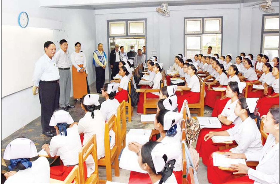
ပြည်ထောင်စုဝန်ကြီးဦးလှမိုးနှင့်အဖွဲ့ သူနာပြုနှင့်သားဖွားသင်တန်းကျောင်း၌ သင်တန်းသား သင်တန်းသူများ စာတွေ့/လက်တွေ့သင်ကြားနေမှုကို ကြည့်ရှုအားပေးစဉ်။

ထူထောင်ရေးလုပ်ငန်းများတွင် အသုံးပြုမည့်ထောက်ပံ့ရေးပစ္စည်း များကို လူအင်အား၊ စက်ယန္တရား အင်အားများအသုံးပြု၍ မှန်တိုင်း ဒဏ်သင့်ဒေသများသို့ စနစ်တကျ ဖြန့်ခွဲပေးပို့နိုင်ရေး စီမံဆောင်ရွက် နေမှုများကို ကြည့်ရှုစစ်ဆေးပြီး တာဝန်ရှိသူများကို လိုအပ်သည် များ မှာကြားသည်။ ဆက်လက်၍ ပြည်ထောင်စု