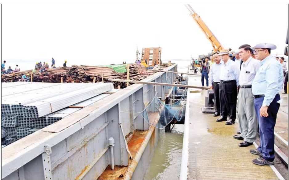
ပြည်ထောင်စုဝန်ကြီးဦးလှမိုးနှင့်အဖွဲ့ စစ်တွေမြို့ ဘက်စုံသုံးဆိပ်ကမ်း၌ ပြန်လည်ထူထောင်ရေး လုပ်ငန်းများတွင်အသုံးပြုမည့် ထောက်ပံ့ရေးပစ္စည်းများ ရောက်ရှိနေမှုကို ကြည့်ရှုစစ်ဆေးစဉ်။

တည်ဆောက်သွားရန် မှာကြား သည်။ မွန်းလွဲပိုင်းတွင် ပြည်ထောင်စု ဝန်ကြီးသည် ပြည်နယ်အစိုးရ ဧည့်ဂေဟာ၌ လယ်ယာအထောက် အကူပြု ယွန်းလျှံကုမ္ပဏီဥက္ကဋ္ဌ ဦးအောင်မျိုးဦးနှင့် တွေ့ဆုံသည်။ တွေ့ဆုံစဉ်ဒေသတွင်းတောင်သူ များအတွက် ထွက်နှုန်းမြင့် GW-11 မျိုးစပါး စိုက်ပျိုးနိုင်ရေး၊ ဒေသ တွင်း မွေးမြူရေးလုပ်ငန်းများ အတွက် တိရစ္ဆာန်အစားအစာ EVER GREEN မြက် စိုက်ပျိုးနိုင် ရေး၊ အချိန်တိုအတွင်း ရှင်သန် ဖြစ်ထွန်းနိုင်သည့် သစ်ပင်များ စိုက်ပျိုးရေးနှင့် စိုက်ပျိုးမွေးမြူရေး နှင့်စပ်လျဉ်းသည့် အသိပညာပေး နိုင်ရေးဆိုင်ရာများကို ဆွေးနွေး