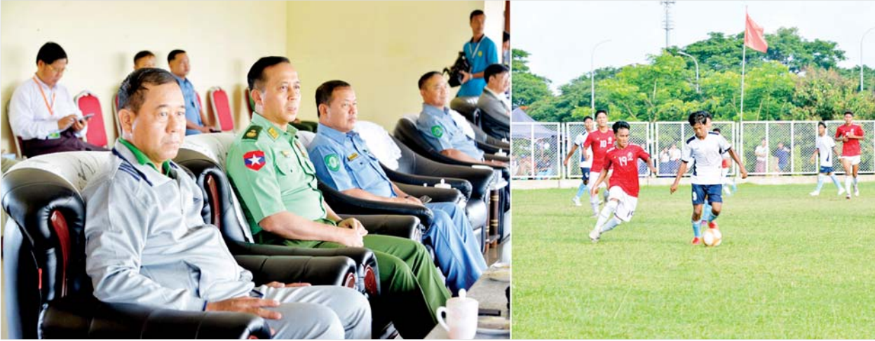
ပြည်ထောင်စုဝန်ကြီး ဒုတိယဗိုလ်ချုပ်ကြီးထွန်းထွန်းနောင် သိပ္ပံနှင့်နည်းပညာဝန်ကြီးဌာန(က)အသင်းနှင့် နယ်စပ်ရေးရာဝန်ကြီးဌာန အသင်းတို့ ယှဉ်ပြိုင်ကစားနေမှုကို ကြည့်ရှုအားပေးစဉ်။