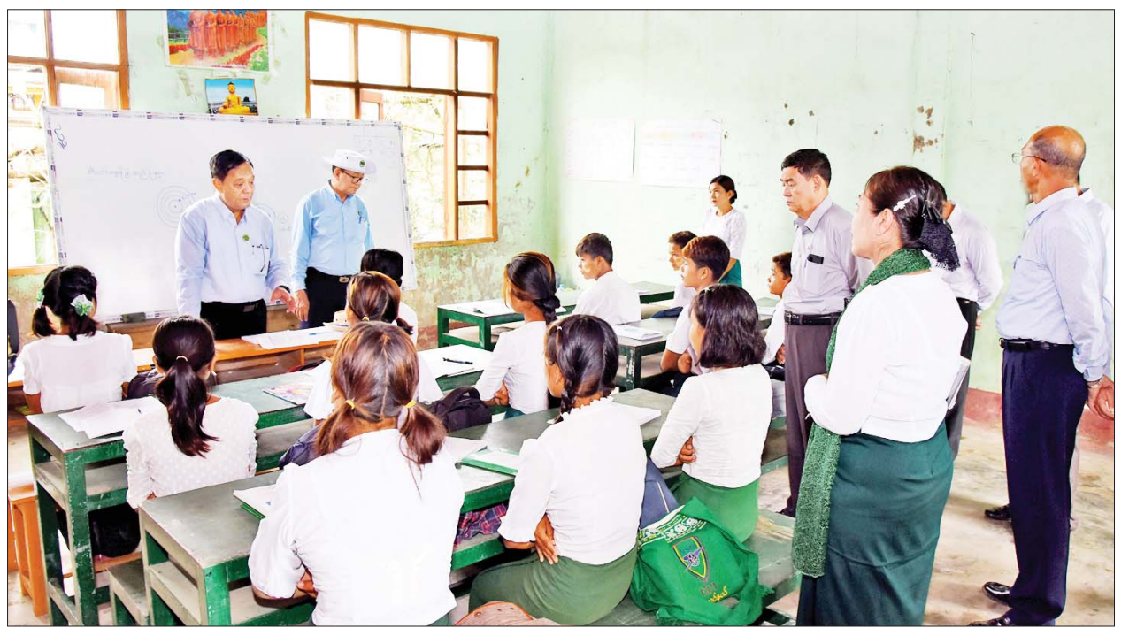
ပြည်ထောင်စုဝန်ကြီး ဦးလှမိုးနှင့်အဖွဲ့ ကျားမသောက်ကျေးရွာ အခြေခံပညာအလယ်တန်းကျောင်းမှ ကျောင်းသား ကျောင်းသူများအား ရင်းရင်းနှီးနှီး တွေ့ဆုံနှုတ်ဆက်စဉ်။

ကြမ်းခင်းအရည်ပေ ၂၅၀၊ အကျယ် ၃၂ ပေ ပျက်စီးနေမှုကို ကြည့်ရှုစစ်ဆေးပြီး ရေရှည်တည်တံ့ခိုင်မြဲအောင် စနစ်တကျပြန်လည်ပြုပြင်တည်ဆောက်သွားရန် မှာကြားသည်။ ထို့နောက်ပြည်ထောင်စုဝန်ကြီးနှင့်အဖွဲ့သည် ကျောက်တန်းကြီးကျေးရွာ အခြေခံပညာမူလတန်းကျောင်း၊ ကျားမသောက်ကျေးရွာအခြေခံပညာ အလယ်တန်းကျောင်း၊ အမှတ်(၈၁) အခြေခံပညာမူလတန်းကျောင်းနှင့် တပ်နယ်အခြေခံပညာမူလတန်းကျောင်းနှင့် တပ်နယ် အခြေခံပညာမူလတန်းကျောင်းတို့သို့ သွားရောက်ကြည့်ရှုစစ်ဆေးပြီး ကျောင်းသား ကျောင်းသူများအား ရင်းရင်းနှီးနှီး တွေ့ဆုံနှုတ်ဆက်ကာ မိုခါမုန်တိုင်းတိုက်ခတ်မှုကြောင့် ထိခိုက်ပျက်စီးခဲ့သည့် စာသင်ဆောင်များ ပြန်လည်ပြင်ဆင်ပြီးစီးမှု၊ ကျောင်းသား ကျောင်းသူများ အေးချမ်းစွာပညာသင်ကြားနေမှု၊ ကျောင်းဥပမိရုပ် ကောင်းမွန်ရေး၊ ကျောင်းနှင့်ကျောင်းပတ်ဝန်းကျင် သန့်ရှင်းသပ်ရပ်မှုများနှင့် ဆက်လက်ပြုပြင်သွားမည့် အစီအမံများကို လိုက်လံ