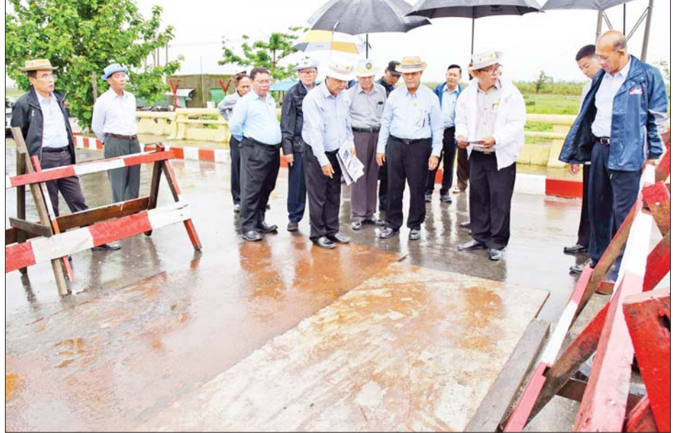
ပြည်ထောင်စုဝန်ကြီး ဦးလှမိုးနှင့်အဖွဲ့ စစ်တွေ-အမ်း-ရန်ကုန်ကားလမ်း မိုင်တိုင်(၁၉၀) ကျောက်တန်းတံတား ကြမ်းခင်းပျက်စီးနေမှုကို ကြည့်ရှုစစ်ဆေးစဉ်။

သဘာဝဘေးအန္တရာယ်ကျရောက်ရာဒေသပံ့ပိုးအဟာရတိုက်ကျွေးရေး စီမံချက်အရ စစ်တွေမြို့ ဘောက်သီးစုရပ်ကွက် အခြေခံပညာမူလတန်းကျောင်းမှ ကျောင်းသား ကျောင်းသူများအား ပံ့ပိုးတိုက်ကျွေးနေမှုကို ကြည့်ရှုအားပေးစဉ်။