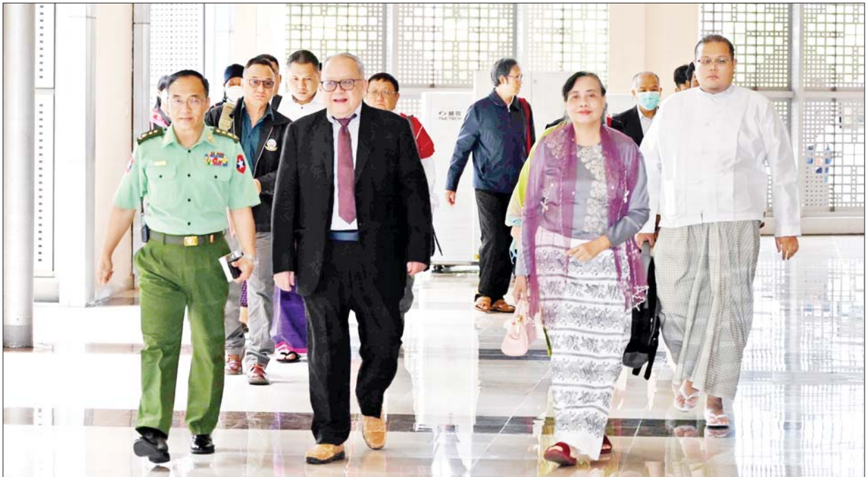
နိုင်ငံတော်၏ငြိမ်းချမ်းရေးဆွေးနွေးရေးအဖွဲ့နှင့် တွေ့ဆုံဆွေးနွေးပွဲသို့ တက်ရောက်လာကြသည့် ALP၊ DKBA ၊ KNU/KNLA-PC၊ LDU၊ PNLO အဖွဲ့တို့မှ ကိုယ်စားလှယ်အဖွဲ့များကို တွေ့ရစဉ်။

နှုတ်ခွန်းဆက်အမှာစကားများပြောကြား တွေ့ဆုံဆွေးနွေးပွဲတွင် ငြိမ်းချမ်းရေးဆွေးနွေးရေးအဖွဲ့ခေါင်းဆောင် ဒုတိယဗိုလ်ချုပ်ကြီးရာပြည့်နှင့် တက်ရောက်လာကြသည့် တိုင်းရင်းသား လက်နက်ကိုင်အဖွဲ့ ၅ ဖွဲ့ ကိုယ်စား ပအိုဝ်းအမျိုးသားလွတ်မြောက်ရေး အဖွဲ့ချုပ်(PNLO) ဦးဆောင်နာယက ဖြားတန်ခွန်ဥက္ကဋ္ဌက နှုတ်ခွန်းဆက် အမှာစကားများ ပြောကြားကြသည်။