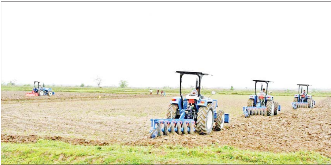
စစ်တွေမြို့နယ် ပျားလည်ချောင်းကျေးရွာ၌ လယ်ယာမြေများအား သရုပ်ပြထွန်ယက်ပေးစဉ်။

ရေချမ်းပြင်သို့ ရောက်ခဲ့သည် ကုလားတန်မြစ်ကို ဂစ္ဆပနဒီ သို့မဟုတ် ကစ္ဆပနဒီမြစ်ဟုခေါ်ကြသည်။ မယူမြစ် သို့မဟုတ် မလ္လာနဒီဟု ရှေးကခေါ်တွင်လာကြသည့် မေယူမြစ် ဆိုသည်ကလည်း ရှိနေသေးသည်။ လေးမြို့မြစ်ကိုမူ အဇ္ဇနဒီဟုခေါ်ဆိုကြကြောင်းသိရသည်။ ရန္နဒီ (ခေါ်) ရန်ချောင်း၊ သီရိမာနဒီ (ခေါ်) သရေချောင်းတို့သည်လည်း ရခိုင်ပြည်နယ်၏ ထင်ရှားသော မြစ်ချောင်းများထဲတွင် ပါဝင်နေကြသည်။ အဆိုပါမြစ်ချောင်း များသည် ရခိုင်ပြည်နယ်၏ အသက် သွေးကြောများဆိုလျှင် မမှားပေ။ ဤမည်သော မြစ်ချောင်းများစွာတို့ကို အမှီပြု၍ စားရေရိက္ခာပေးခြင်းသည် သမိုင်းစဉ်တစ်လျှောက် ဆန်စေ့စပါး ပေးများကြွယ်ဝရာ အရပ်ဒေသဖြစ်ခဲ့ခြင်း ကြောင့် ဓညဝတီဟူ၍ အမည်တွင်ခဲ့ခြင်း ဖြစ်ကြောင်း သုတေသီများက ဆိုကြ သည်။ ထို့ပြင်တဝ ပေ၊ ပုရပိုက်၊ ကျောက် စာများတွင် ပါရှိသည့်အတိုင်း သေလာ ဂီရိ၊ မောရပဗ္ဗတ၊ သီရိဂုတ္တ၊ နီလာပဗ္ဗတ အစရှိသော တောတောင်အမည်နာမများ ဖြင့် ထေရဝါဒဗုဒ္ဓသာသနာယဉ်ကျေးမှု ထွန်းကားရာ၊ သာသနာရောင်ဝါ ထွန်းလင်းတောက်ပရာဒေသဖြစ်ခဲ့ခြင်း ကြောင့်လည်း ဓညဝတီကို ရွှေပြည် ငွေပြည် သို့မဟုတ် ရတနာရွှေမြေဟူ၍ လည်း ခေါ်ဝေါ်သမုတ်ခဲ့ကြကြောင်း မှတ်သားခဲ့ဖူးသည်။ ဝတီလေးရပ် အမည်နာမဖြင့် ထင်ရှားကျော်ကြားခဲ့သော ရခိုင် ပြည်နယ်သို့ ၁၉၉၇ ခုနှစ်တွင် စတင် ရောက်ဖူးခဲ့သည်။ ၂၀၁၃-၂၀၁၄ ခုနှစ် များတွင်မူ ရခိုင်ပြည်နယ်အတွင်း ဆောင်ရွက်ပေးနေသော နယ်စပ်ဖွံ့ဖြိုး ရေးလုပ်ငန်းများကို အကြောင်းပြု၍ မကြာမကြာရောက်ခွင့်ကြုံခဲ့သည်။ မယူ မြစ် (ခေါ်) မေယူမြစ်ကိုဆန်၍ ဘူးသီး တောင်သို့သွားရောက်ကာ ထိုမှတစ်ဆင့် ဘူးသီးတောင် - တောင်ဘဇာလမ်း