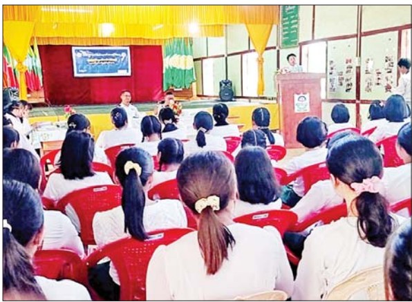
မိုးနဲ ဇွန် ၂၆

ရှမ်းပြည်နယ်(တောင်ပိုင်း) မိုးနဲမြို့နယ်တွင် အပြည်ပြည်ဆိုင်ရာ မူးယစ်ဆေးဝါးအလွဲသုံးမှုနှင့် တရားမဝင်ရောင်းဝယ်မှုတိုက်ဖျက်ရေးနေ့ အထိမ်းအမှတ်အဖြစ် အသိပညာပေးဟောပြောပွဲ၊ နံရံကပ်စာစောင်ပြပွဲနှင့် ဆုပေးပွဲအခမ်းအနားကို မိုးနဲ(အထက) ပုလဲဆောင်ခန်းမနေရာ၌ ယနေ့နံနက် ၉ နာရီခွဲက ကျင်းပသည်။