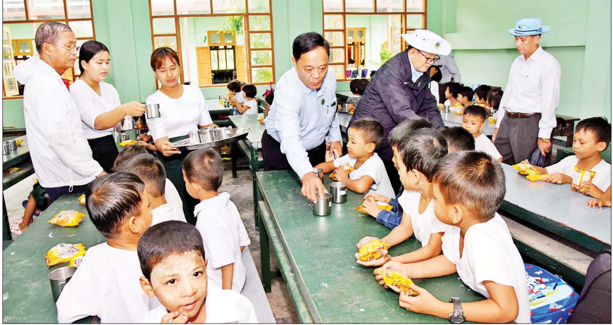
ပြည်ထောင်စုဝန်ကြီး ဦးလှမိုးနှင့်အဖွဲ့ စစ်တွေမြို့ ဘောက်သီးစုရပ်ကွက် အခြေခံပညာမူလတန်းကျောင်းမှ ကျောင်းသား ကျောင်းသူများအား ပံ့ပိုးတိုက်ကျွေးနေမှုကို ကြည့်ရှုအားပေးစဉ်။

ဆက်လက်၍ ပြည်ထောင်စုဝန်ကြီးနှင့်အဖွဲ့သည် စစ်တွေ-အမ်း-ရန်ကုန်ကားလမ်း မိုင်တိုင်(၁၉၀) ကျောက်တန်းတံတားရှိ