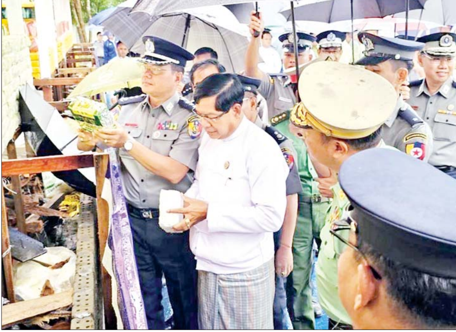
ရန်ကုန်တိုင်းဒေသကြီးဝန်ကြီးချုပ် ဦးစိုးသိန်း မီးရှို့ဖျက်ဆီးမည့် သိမ်းဆည်းရမိ မူးယစ်ဆေးဝါးများ၊ ဓာတုပစ္စည်းများနှင့် ဆက်စပ်ပစ္စည်းများကို ကြည့်ရှုစစ်ဆေးစဉ်။

မန္တလေးမြို့တွင် ပြုလုပ်သော အပြည်ပြည်ဆိုင်ရာ မူးယစ်ဆေးဝါးအလွဲသုံးမှုနှင့် တရားမဝင်ရောင်းဝယ်မှု တိုက်ဖျက်ရေးနေ့အခမ်းအနားနှင့် ဖမ်းဆီးရမိ မူးယစ်ဆေးဝါးများ မီးရှို့ဖျက်ဆီးခြင်းအစီအစဉ်ကို မန္တလေးတိုင်းဒေသကြီး ချမ်းမြသာစည်မြို့နယ် ချမ်းမြသာစည်(တောင်)ရပ်ကွက်ရှိ လေယာဉ်ကွင်းဟောင်း၌ နံနက် ၈ နာရီခွဲတွင် ပြုလုပ်ခဲ့ရာ မန္တလေးတိုင်းဒေသကြီး ဝန်ကြီးချုပ် ဦးမျိုးအောင်နှင့် တိုင်းဒေသကြီးအစိုးရအဖွဲ့ဝင် ဝန်ကြီးများ၊ အလယ်ပိုင်းတိုင်းစစ်ဌာနချုပ်မှ တပ်မတော် အရာရှိကြီးများ၊ မြန်မာနိုင်ငံရဲတပ်ဖွဲ့မှ ဒုတိယရဲချုပ် ရဲဗိုလ်ချုပ် အောင်နိုင်သူနှင့် မြန်မာနိုင်ငံရဲတပ်ဖွဲ့မှ ရဲအရာရှိကြီးများ၊ မန္တလေးမြို့အခြေစိုက် တရုတ်ကောင်စစ်ဝန်ချုပ်ရုံးမှ တရုတ်ကောင်စစ်ဝန်ချုပ် နှင့် မိတ်ဖက်အဖွဲ့အစည်းများမှ ကိုယ်စားလှယ်များ၊ မြန်မာနိုင်ငံ အမျိုး