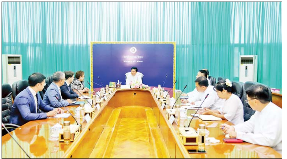
ပူးပေါင်းဆောင်ရွက်မည့် ကိစ္စရပ်များနှင့် ပြည်ပရင်းနှီးငွေလင်းစွာ ဆွေးနွေးခဲ့ကြကြောင်း သိရရောက် မြန်မာရွှေ့ပြောင်းအလုပ်သမားများနှင့် ပတ်သက်၍ ကူညီစောင့်ရှောက်ပေးနိုင်ရေးတို့ကို ရင်းနှီးငွေလင်းစွာ ဆွေးနွေးခဲ့ကြကြောင်း သိရသည်။

Dragan Aleksoski နှင့် တာဝန်ရှိသူများ တက်ရောက်ကြသည်။ တွေ့ဆုံဆွေးနွေးပွဲတွင် အလုပ်သမားဝန်ကြီးဌာန အလုပ်သမားညွှန်ကြားရေးဦးစီးဌာနနှင့် IOM တို့အကြား MoU ကို ၂၀၁၅ ခုနှစ်တွင် ကနဦး သုံးနှစ်သက်တမ်းဖြင့် လက်မှတ်ရေးထိုး အကောင်အထည်ဖော်ဆောင်ရွက်ခဲ့ပြီး ၂၀၁၈ ခုနှစ်တွင် သက်တမ်းတိုးလက်မှတ်ရေးထိုးခဲ့သည့် MoU သည် ၂၀၂၁ ခုနှစ်တွင် သက်တမ်းကုန်ခဲ့သဖြင့် MoU အသစ် လက်မှတ်ရေးထိုးနိုင်ရေး ညှိနှိုင်းဆောင်ရွက်လျက်ရှိရာ MoU ရေးထိုးရေးဆောင်ရွက်လျက်ရှိသည့် လုပ်ငန်းစဉ်များ၊ MoU ပါ လုပ်ငန်းစီမံချက် (Action Plan) တွင် ရွှေ့ပြောင်းအလုပ်သမားရေးရာ ကိစ္စများနှင့် ပတ်သက်၍ ပါဝင်သင့်သည့် အချက်အလက်များ၊ ဝန်ကြီးဌာနနှင့် IOM တို့အကြား နားလည်မှုစာချုပ်လွှာ (MoU) ရေးထိုး၍ ဆောင်ရွက်လျက်ရှိသည့် လုပ်ငန်းအခြေအနေ၊ ဝန်ကြီးဌာနနှင့် IOM တို့ ဆက်လက်၍