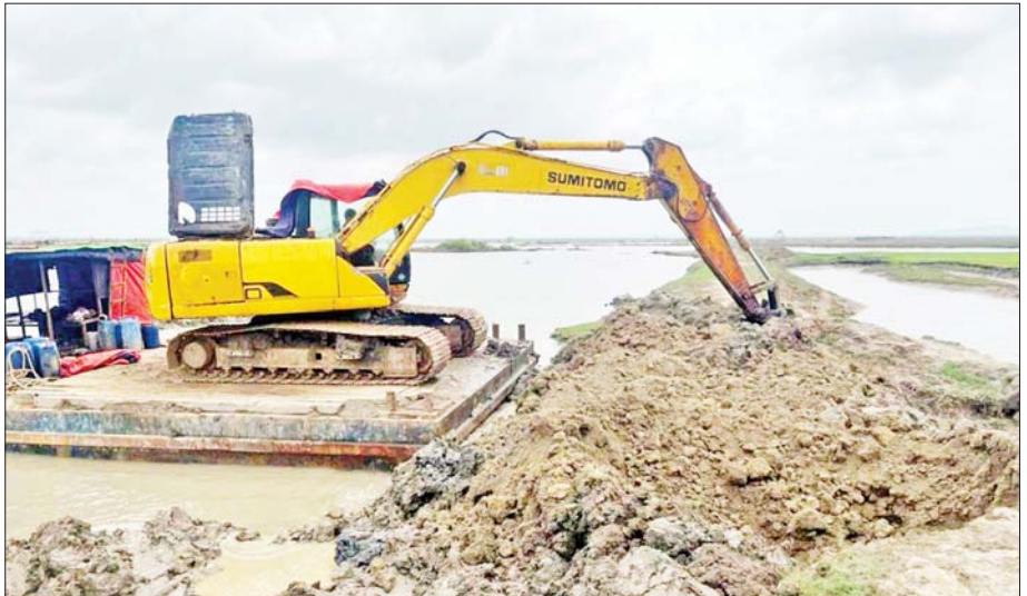
စစ်တွေမြို့နယ် ဝါဘိုလယ်သမားတာအား ပြန်လည်ပြုပြင်ပေးစဉ်။