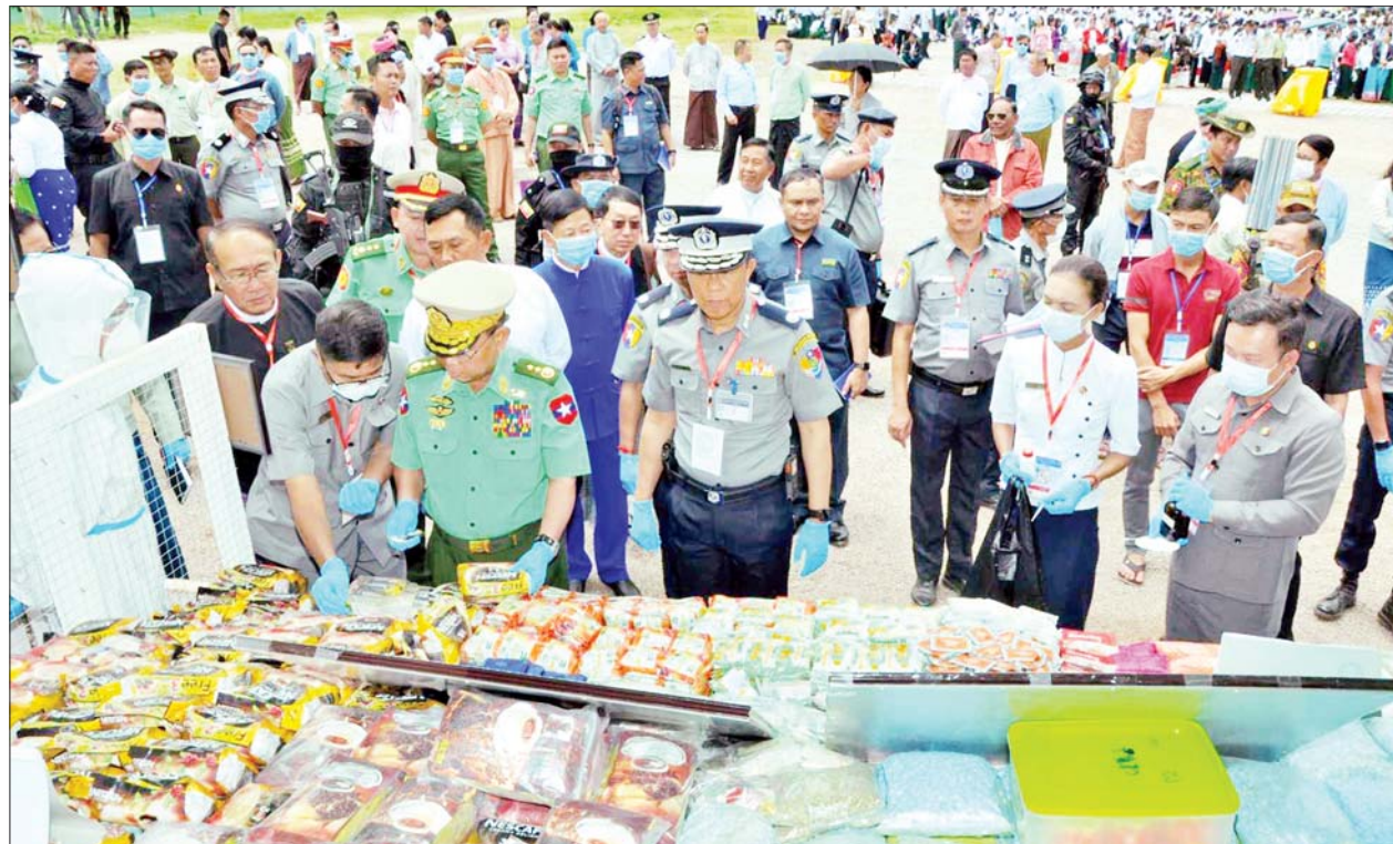
မူးယစ်ဆေးဝါးဆီးကာကွယ်ရေးဗဟိုအဖွဲ့ဥက္ကဋ္ဌ နိုင်ငံတော်စီမံအုပ်ချုပ်ရေးကောင်စီအဖွဲ့ဝင် ဒုတိယဝန်ကြီးချုပ်နှင့် ပြည်ထဲရေးဝန်ကြီးဌာန ပြည်ထောင်စုဝန်ကြီး ဒုတိယဗိုလ်ချုပ်ကြီးစိုးထွဋ် မီးရှို့ဖျက်ဆီးမည့် သိမ်းဆည်းရမိ မူးယစ်ဆေးဝါးများ၊ ဓာတုပစ္စည်းများနှင့် ဆက်စပ်ပစ္စည်းများကို ကြည့်ရှုစစ်ဆေးစဉ်။

အန္တရာယ် တားဆီးကာကွယ်ရေးအဖွဲ့ဥက္ကဋ္ဌက ဖတ်ကြားခြင်း၊ ဧည့်သည်တော်များမှ မီးရှို့ဖျက်ဆီးမည့် ဖမ်းဆီးရမိမူးယစ်ဆေးဝါးများကို လိုက်လံကြည့်ရှုခြင်းတို့ပြုလုပ်ပြီး ရန်ကုန်တိုင်းဒေသကြီး၊ ဧရာဝတီတိုင်းဒေသကြီး၊ ရခိုင်ပြည်နယ်နှင့် မြန်မာနိုင်ငံ အောက်ပိုင်းဒေသများမှ ဖမ်းဆီးရမိသော ဘိန်း ၁၇၆ ဒဿမ ၂၃၂ ကီလိုကျော်၊ ဘိန်းဖြူ ၉၂ ဒဿမ ၅၂၁ ကီလိုကျော်၊ စိတ်ကြွရူးသွပ်ဆေးပြား ၄၅ သန်းကျော်၊ အိုက်စ ၁၂၇၄၈ ဒဿမ ၃၀၅ ကီလိုကျော်၊ ဘိန်းစာမှုန့် ၇၂၈ ဒဿမ ၈၃၈ ကီလိုကျော်၊ ကက်တမင်း ၄၁၆၃ ဒဿမ ၁၃၂ ကီလိုကျော်၊ ဆေးခြောက် ၃၈၅ ဒဿမ ၈၇၇ ကီလိုကျော် အပါအဝင် မူးယစ်ဆေးဝါး ၂၀ မျိုးနှင့် ဓာတုပစ္စည်း ၁၆ မျိုး စုစုပေါင်းတန်ဖိုး မြန်မာငွေကျပ် ၄၃၆ ဒဿမ ၄၅၆ ဘီလီယံကျော် (အမေရိကန် ဒေါ်လာ ၂၀၇ ဒဿမ ၈၃၆၄ သန်းကျော်)ကို ဖျက်ဆီးခဲ့သည်။