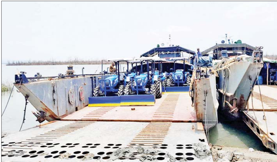
ရေချမ်းပြင်ကူးတို့ဆိပ်၌ လယ်ထွန်စက်ကြီးများအား ကမ်းထိုးရေယာဉ်ပေါ်သို့ တင်ဆောင်နေစဉ်။

တစ်ချိန်က မကြာခဏရောက်ခဲ့ဖူးသော ရေချမ်းပြင် ကူးတို့ဆိပ်သို့ ဇွန်လ ၄ ရက်နေ့က ပြန်လည်ရောက်ခွင့်ကြုံလာခဲ့ သည်။ စိုက်ပျိုးရေး၊ မွေးမြူရေးနှင့် ဆည်မြောင်းဝန်ကြီးဌာန အနေဖြင့် မိုခါမုန်တိုင်းဒဏ်သင့် ရခိုင်ဒေသမြို့နယ်များတွင် မိုးစပါးအမိ ထွန်ယက်စိုက်ပျိုးနိုင်ရန်အတွက် လယ်ထွန်စက် ကြီးများ ပေးပို့လာရာ စစ်တွေမြို့သို့ သင်္ဘောဖြင့် ရောက်ရှိလာ ခဲ့သည်။ ၎င်းထွန်စက်များအနက် ၁၄ စီးကို ရေချမ်းပြင်ဆိပ်တွင် တပ်မတော် ကမ်းထိုးရေယာဉ်များပေါ်သို့ တင်ဆောင်ကာ ရသေ့ တောင်၊ ဘူးသီးတောင်၊ မောင်တောမြို့နယ်တို့သို့ ခွဲဝေပို့ဆောင် ပေးခဲ့