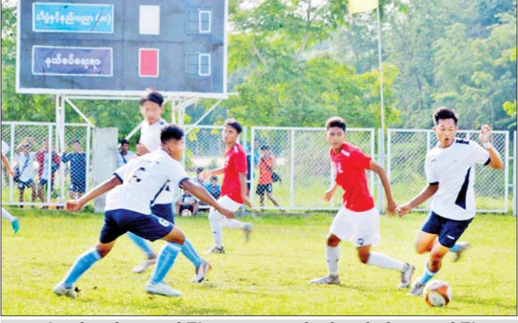
သိပ္ပံနှင့် နည်းပညာဝန်ကြီးဌာန(က)အသင်းနှင့် နယ်စပ်ရေးရာဝန်ကြီးဌာန အသင်းတို့ ယှဉ်ပြိုင်ကစားကြစဉ်။

နေပြည်တော် ဇွန် ၂၆ တက္ကသိုလ်လက်ရွေးစင်မှသည် မြန်မာ့လက်ရွေးစင်ဆီသို့ ဟူသော ဦးတည်ချက် ဖြင့် ကျင်းပလျက်ရှိသည့် ၂၀၂၃ ခုနှစ် ဝန်ကြီးဌာနပေါင်းစုံတက္ကသိုလ်များ ဘောလုံး ပြိုင်ပွဲ ပဉ္စမနေ့ အုပ်စုပွဲစဉ်များအဖြစ် ယနေ့တွင် နေပြည်တော် ဝဏ္ဏသိဒ္ဓိအားကစား ကွင်းရှိ လေ့ကျင့်ရေးကွင်းအမှတ် (၃)၌ ဆက်လက်ယှဉ်ပြိုင်ကစားကြသည်။ အနိုင်ရရှိ နံနက်ပိုင်းတွင် အုပ်စု(က)ပွဲစဉ်အဖြစ် သိပ္ပံနှင့် နည်းပညာဝန်ကြီးဌာန(က)အသင်း နှင့် နယ်စပ်ရေးရာဝန်ကြီးဌာနအသင်းတို့ ယှဉ်ပြိုင်ကစားကြရာ သိပ္ပံနှင့်နည်းပညာ ဝန်ကြီးဌာန (က) အသင်းက နှစ်ဂိုး-ဂိုး မရှိဖြင့် အနိုင်ရရှိခဲ့သည်။ စာမျက်နှာ ၁၇ ကော်လံ ၁ သို့