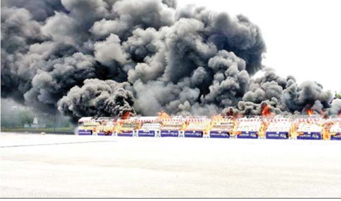
မန္တလေးတိုင်းဒေသကြီးဝန်ကြီးချုပ် ဦးမျိုးအောင်နှင့်တာဝန်ရှိသူများ သိမ်းဆည်းရမိ မူးယစ်ဆေးဝါးများ၊ ဓာတုပစ္စည်းများနှင့် ဆက်စပ်ပစ္စည်းများကို စက်ခလုတ်နှိပ်၍မီးရှို့ဖျက်ဆီးပေးစဉ်။

နိုင်ငံတော် စီမံအုပ်ချုပ်ရေးကောင်စီဥက္ကဋ္ဌ နိုင်ငံတော်ဝန်ကြီးချုပ်၏ လမ်းညွှန်ချက်နှင့်အညီ မူးယစ်ဆေးဝါး တားဆီးနှိမ်နင်းရေးလုပ်ငန်းများကို တပ်မတော်၊ မြန်မာနိုင်ငံရဲတပ်ဖွဲ့၊ အကောက်ခွန်ဦးစီးဌာနနှင့် မူးယစ်ဆေးဝါးတားဆီးနှိမ်နင်းရေးရဲတပ်ဖွဲ့တို့က အရှိန်အဟုန်မြှင့်တင် ကြိုးပမ်းဆောင်ရွက်မှုကြောင့် မူးယစ်ဆေးဝါးနှင့် ဓာတုပစ္စည်းအများအပြား ဖမ်းဆီးရမိဖျက်ဆီးနိုင်ခဲ့ကြောင်း သိရသည်။ သတင်းစဉ်