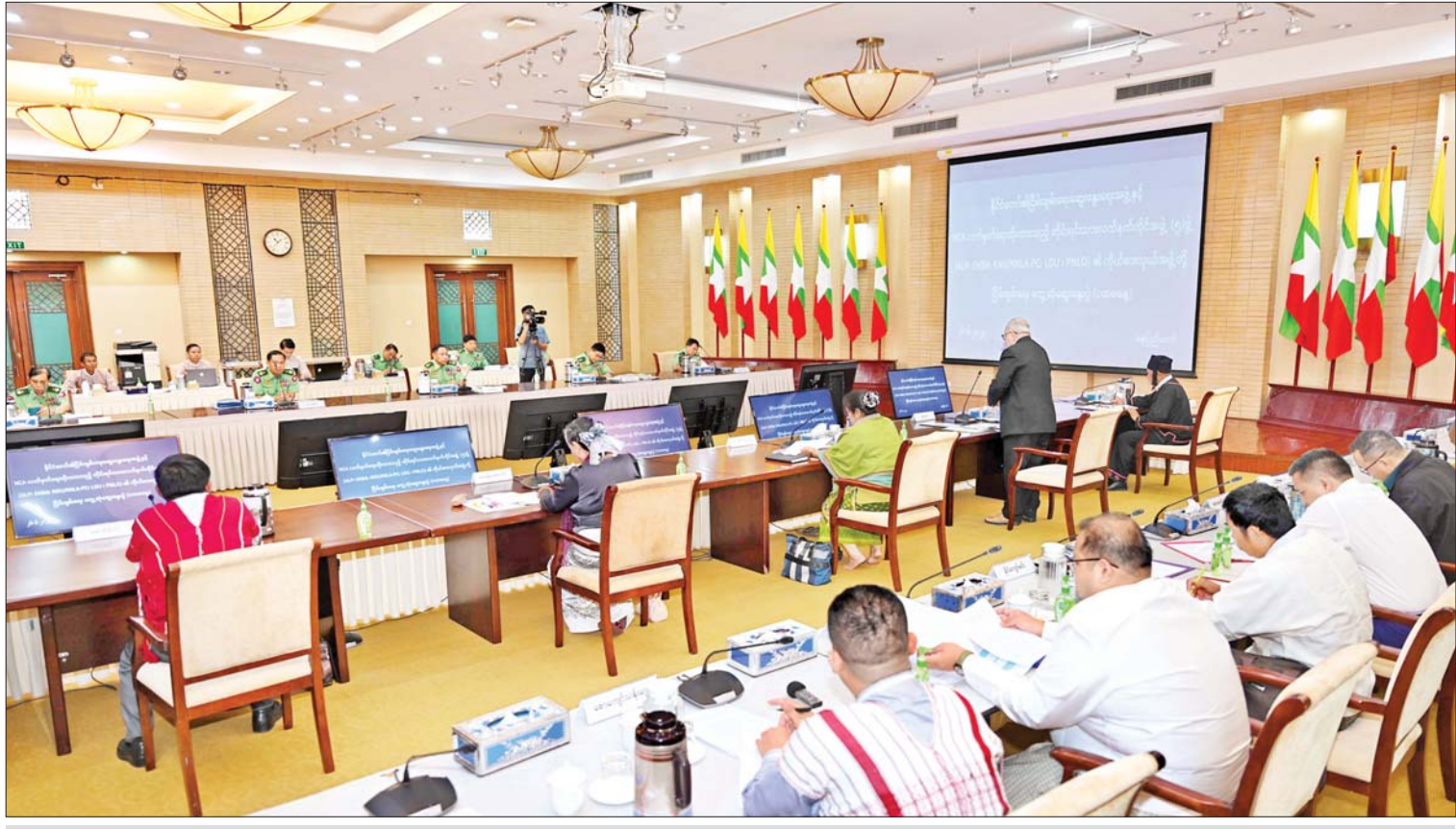
နိုင်ငံတော်၏ငြိမ်းချမ်းရေးဆွေးနွေးရေးအဖွဲ့နှင့် NCA လက်မှတ်ရေးထိုးထားသည့် တိုင်းရင်းသားလက်နက်ကိုင်အဖွဲ့ ၅ ဖွဲ့ (ALP၊ DKBA၊ KNU/KNLA-PC၊ LDU၊ PNLO)၏ ကိုယ်စားလှယ်အဖွဲ့ တွေ့ဆုံဆွေးနွေးစဉ်။

နေပြည်တော် ၅ ဇွန် ၂၆ နိုင်ငံတော်၏ငြိမ်းချမ်းရေးဆွေးနွေးရေးအဖွဲ့နှင့် NCA လက်မှတ်ရေးထိုးထားသည့် PPST အဖွဲ့ဝင် တိုင်းရင်းသားလက်နက်ကိုင်အဖွဲ့ ၅ ဖွဲ့ (ALP၊ DKBA၊ KNU/KNLA-PC၊ LDU၊ PNLO)တို့၏ ကိုယ်စားလှယ်အဖွဲ့ တွေ့ဆုံဆွေးနွေးပွဲကို ယနေ့ နံနက်ပိုင်းတွင် နေပြည်တော်ရှိ အမျိုးသား စည်းလုံးညီညွတ်ရေးနှင့် ငြိမ်းချမ်းရေးဖော်ဆောင်မှု ဗဟိုဌာန၌ ကျင်းပပြုလုပ်ရာ နိုင်ငံတော်စီမံအုပ်ချုပ်ရေးကောင်စီအဖွဲ့ဝင် ပြည်ထောင်စုအစိုးရအဖွဲ့ရုံးဝန်ကြီးဌာန ပြည်ထောင်စုဝန်ကြီးအမျိုးသား စည်းလုံးညီညွတ်ရေးနှင့် ငြိမ်းချမ်းရေးဖော်ဆောင်မှုညွှန်ကြားရေးကော်မတီဥက္ကဋ္ဌ ငြိမ်းချမ်းရေးဆွေးနွေးရေးအဖွဲ့ခေါင်းဆောင် ဒုတိယဗိုလ်ချုပ်ကြီး ရာပြည့်က တွေ့ဆုံဆွေးနွေးပွဲသို့ တက်ရောက်လာကြသည့် ALP၊ DKBA၊ KNU/KNLA-PC၊ LDU၊ PNLO အဖွဲ့တို့မှ ငြိမ်းချမ်းရေးဆွေးနွေးရေး ကိုယ်စားလှယ်အဖွဲ့များကို ရင်းရင်းနှီးနှီး ကြိုဆိုနှုတ်ဆက်သည်။ စာမျက်နှာ ၃ ကော်လံ ၁ သို့ ။