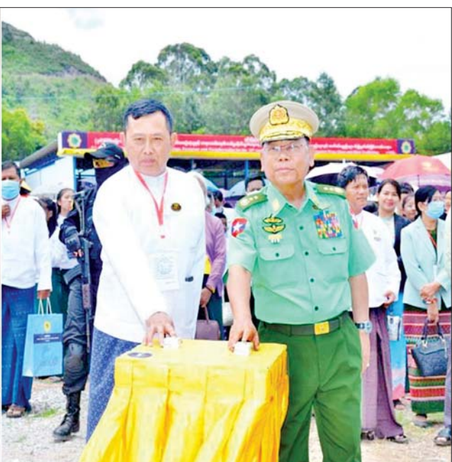
မူးယစ်ဆေးဝါးဆီးကာကွယ်ရေးဗဟိုအဖွဲ့ဥက္ကဋ္ဌ နိုင်ငံတော်စီမံအုပ်ချုပ်ရေးကောင်စီအဖွဲ့ဝင် ဒုတိယဝန်ကြီးချုပ်နှင့် ပြည်ထဲရေးဝန်ကြီးဌာန ပြည်ထောင်စုဝန်ကြီး ဒုတိယဗိုလ်ချုပ်ကြီးစိုးထွဋ်၊ ရှမ်းပြည်နယ်ဝန်ကြီးချုပ် ဦးအောင်ဇော်အေးတို့ ရှမ်းပြည်နယ်နှင့်ကယားပြည်နယ်တို့မှ သိမ်းဆည်းရမိသည့် မူးယစ်ဆေးဝါးများ၊ ဓာတုပစ္စည်းများနှင့် ဆက်စပ်ပစ္စည်းများအား စက်ခလုတ်နှိပ်၍ မီးရှို့ဖျက်ဆီးပေးစဉ်။

တက်ရောက် ယနေ့ကျရောက်သည့် (၃၆) ကြိမ်မြောက် အပြည်ပြည်ဆိုင်ရာ မူးယစ်ဆေးဝါး အလွဲသုံးမှုနှင့် တရားမဝင်ရောင်းဝယ်မှုတိုက်ဖျက်ရေးနေ့တွင် ရှမ်းပြည်နယ်တောင်ကြီးမြို့ အဝေရာမီးပုံးပျံကွင်း၌ နံနက် ၁၁ နာရီတွင် ဖမ်းဆီးရမိ မူးယစ်ဆေးဝါးများ မီးရှို့ဖျက်ဆီးခြင်း အစီအစဉ်ကို ပြုလုပ်ရာမူးယစ်ဆေးဝါးဆီးကာကွယ်ရေးဗဟိုအဖွဲ့ဥက္ကဋ္ဌ နိုင်ငံတော်စီမံအုပ်ချုပ်ရေးကောင်စီ အဖွဲ့ဝင် ဒုတိယဝန်ကြီးချုပ်နှင့် ပြည်ထဲရေးဝန်ကြီးဌာန ပြည်ထောင်စုဝန်ကြီး ဒုတိယ ဗိုလ်ချုပ်ကြီးစိုးထွဋ်၊ ရှမ်းပြည်နယ် ဝန်ကြီးချုပ် ဦးအောင်ဇော်အေးနှင့် ပြည်နယ်