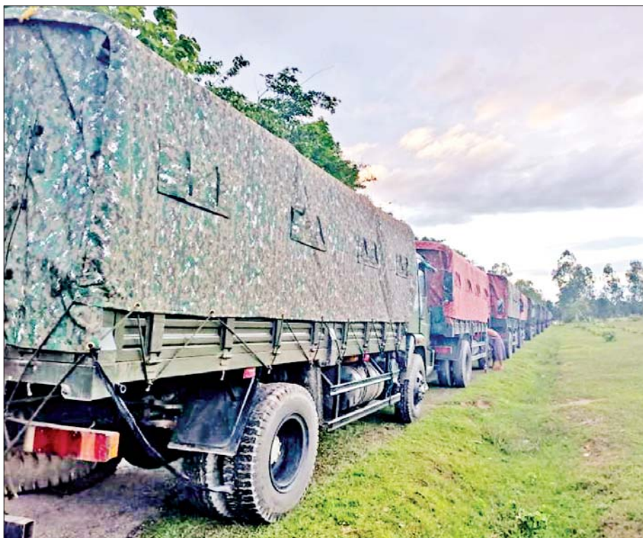
ရခိုင်ပြည်နယ်အတွင်းရှိ မိုခါမုန်တိုင်းဒဏ်သင့် တောင်သူလယ်သမားများ မိုးစပါးအချိန်မီစိုက်ပျိုး နိုင်ရန်အတွက် မျိုးစပါးများကို တပ်မတော်မော်တော်ယာဉ်များဖြင့် ပို့ဆောင်ပေးရန် ဆောင်ရွက်စဉ်။

မေလ ၁၄ ရက်နေ့က ဝင်ရောက် တိုက်ခတ်ခဲ့သော “မိုခါ” မုန်တိုင်းကြောင့် စစ်တွေမြို့ သို့လှောင်ရုံတွင် သိုလှောင် ထားသည့် စပါးမျိုးကောင်းမျိုးသန့် ၂၆၆၅၅ တင်းသည် သိုလှောင်ရုံပြုကျမှု နှင့်အတူ ပျက်စီးဆုံးရှုံးခဲ့ရသည်။ အလား တူ မုန်တိုင်းဒဏ်ကို အများဆုံးခံခဲ့ကြရ သည့် ရခိုင်ပြည်နယ်၁၀ မြို့နယ်အတွင်းရှိ တောင်သူများ၏ မျိုးစပါးများသည်လည်း နေအိမ်များ အမိုးလန်ပျက်စီးမှုနှင့်အတူ ထိခိုက်ဆုံးရှုံးမှုများ ဖြစ်ပေါ်ခဲ့ရသည်။ သို့ဖြစ်၍ စိုက်ပျိုးရေး၊ မွေးမြူရေးနှင့် ဆည်မြောင်းဝန်ကြီးဌာနအနေဖြင့် ရခိုင် ပြည်နယ်အတွင်း ခရိုင်၊ မြို့နယ်များ အလိုက် မျိုးစပါးလိုအပ်မှုအခြေအနေကို ရယူခဲ့ရာ စစ်တွေခရိုင် စစ်တွေမြို့နယ် ကျေးရွာအုပ်စု ၁၂ ခုရှိ တောင်သူ ၇၄၇ ဦးအတွက် မျိုးစပါး တင်း ၂၅၀၀၊ ရသေ့ တောင်မြို့နယ် ကျေးရွာအုပ်စု ၈၅ ခုရှိ တောင်သူ ၆၃၆၃ ဦးအတွက် မျိုးစပါး ၅၄၀၃၃ တင်း၊ ပုဏ္ဏားကျွန်းမြို့နယ် ကျေးရွာအုပ်စု ၃၅ ခုရှိ တောင်သူ ၁၆၄၀ အတွက် မျိုးစပါး ၈၇၄၂ တင်း၊ ပေါက်တောမြို့နယ် ကျေးရွာအုပ်စု ၂၀ ရှိ တောင်သူ ၆၀၇ ဦးအတွက် မျိုးစပါး တင်း ၄၅၀၀၊ မြောက်ဦးခရိုင် မြောက်ဦး မြို့နယ် ကျေးရွာအုပ်စု ၂၂ ခုရှိ တောင်သူ ၃၃၃ ဦးအတွက် မျိုးစပါး ၂၄၀၂ တင်း၊ ကျောက်တော်မြို့နယ် ကျေးရွာအုပ်စု ငါးခုရှိ တောင်သူ ၉၃ ဦးအတွက် မျိုးစပါး တင်း ၄၀၀၊ မောင်တောခရိုင် မောင်တော မြို့နယ်ကျေးရွာအုပ်စု ငါးခုရှိ တောင်သူ ၇၃ ဦးအတွက် မျိုးစပါး တင်း ၄၀၀၊ မောင်တောခရိုင် မောင်တော မြို့နယ်ကျေးရွာအုပ်စု ငါးခုရှိ တောင်သူ ၇၃ ဦးအတွက် မျိုးစပါး တင်း ၄၀၀၊ ဖျာပုံဒေသထွက် ကျားပျံမျိုးစပါး တင်း ၄၀၀၀၊ ရန်ကုန် တိုင်းဒေသကြီး တွဲတေးဒေသထွက်