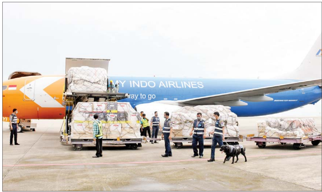
အင်ဒိုနီးရှားနိုင်ငံအစိုးရနှင့် ပြည်သူများက လူသားချင်းစာနာထောက်ထားမှုဖြင့် မိုခါမန်တိုင်းဒဏ်သင့်ပြည်သူများထံသို့ ပေးအပ်သည့် အကူအညီပစ္စည်းများ ရန်ကုန်အပြည်ပြည်ဆိုင်ရာလေဆိပ်သို့ ရောက်ရှိစဉ်။