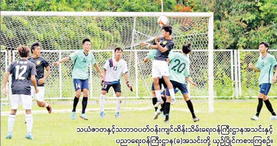
သယံဇာတနှင့်သဘာဝပတ်ဝန်းကျင်ထိန်းသိမ်းရေးဝန်ကြီးဌာနအသင်းနှင့် ပညာရေးဝန်ကြီးဌာန(ခ)အသင်းတို့ ယှဉ်ပြိုင်ကစားကြစဉ်။

နေပြည်တော် ဇွန် ၂၅ နယ်မြေတည်ငြိမ်အေးချမ်းမှုကို ပျက်ပြားစေသော လုပ်ရပ်များနှင့် အကြမ်းဖက်လုပ်ဆောင်မှုများကို လက်ခံ နိုင်ခြင်းမရှိသည့် ဒေသခံပြည်သူအချို့၏ လျှို့ဝှက်ဆက်သွယ် သတင်းပေးပို့မှုအရ NUGI CRPH တို့၏ ဆက်သွယ်ညွှန်ကြားမှု ဖြင့် စစ်ကိုင်းတိုင်းဒေသကြီးအတွင်း အဖျက်အမှောင့်လုပ်ငန်းများ လုပ်ဆောင် နေသည့် PDF အမည်ခံ အကြမ်းဖက် သမားများသည် စစ်ကိုင်းမြို့နယ် ကင်းတော်ကျေးရွာ၊ ဥယျာဉ်ကျေးရွာနှင့် လက်ပံတောကျေးရွာများအနီး လက်နက်၊ ခဲယမ်းများနှင့်အတူ ခိုအောင်းနေကြောင်း သိရှိရသဖြင့် တပ်မတော်စစ်ကြောင်း များက ယနေ့တွင် သွားရောက်ချေမှုန်း စာမျက်နှာ ၁၅ ကော်လံ ၁ သို့ *