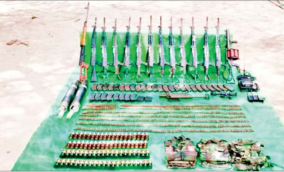
စစ်ကိုင်းမြို့နယ် ကင်းတော်ကျေးရွာအနီး PDF အမည်ခံအကြမ်းဖက်သမားများထံမှ သိမ်းဆည်းရမိ ခဲ့သည့် လက်နက်/ခဲယမ်းများနှင့် ဆက်စပ်ပစ္စည်းများကို တွေ့ရစဉ်။

အမုန်းစကားကို ဆန့်ကျင်ကြ၊ တားဆီးကြရမည် လူမျိုး၊ ကိုးကွယ်ရာဘာသာ၊ ကျား/မ(သို့မဟုတ်) မည်သူမည်ဝါဖြစ်သည်ဆိုသည့် အကြောင်းအရာ တို့အပေါ်အခြေပြု၍ လူပုဂ္ဂိုလ်တစ်ဦး(သို့မဟုတ်) လူအုပ်စုတစ်စုကို မျှတမှုမရှိစွာ ဝေဖန်သည့် (သို့မဟုတ်) မလိုမုန်းထားမှုကို ဖော်ပြသည့် ဆက်ဆံ မှု တစ်မျိုးမျိုးကို ရည်ညွှန်းပြီး အကြမ်းဖက်ရန် လှုံ့ဆော်ခြင်းသည် အမုန်းစကားပင်ဖြစ်သည်။ စေပြီး ဂုဏ်သိက္ခာရှိစွာနေထိုင်ရန်နှင့် ငြိမ်းချမ်းပြီး ညီညွတ်သည့် လူ့အဖွဲ့အစည်းတည်ဆောက်ရန် မျှော်မှန်းချက်တို့ကို ထိခိုက်စေသည့်အပြင် အကျင့် စာရိတ္တကိုလည်း ထိပါးစေသည်။ သို့ဖြစ်၍ ပြည်သူများအနေဖြင့် အမုန်းစကား များကို ရှုတ်ချရန်နှင့် တားဆီးရန် စီမံဆောင်ရွက် ရမည်။ အမုန်းစကားဆန့်ကျင်သည့် လှုပ်ရှား မှုများတွင် အားလုံး ပါဝင်ရန်နှင့် ပံ့ပိုးအားပေးရ မည်။