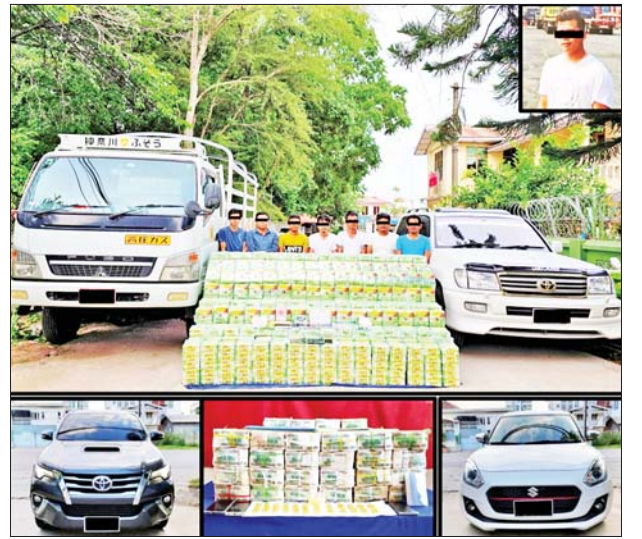
သိမ်းဆည်းရမိ တရားခံများနှင့် သက်သေခံပစ္စည်းများအား တွေ့ရစဉ်။