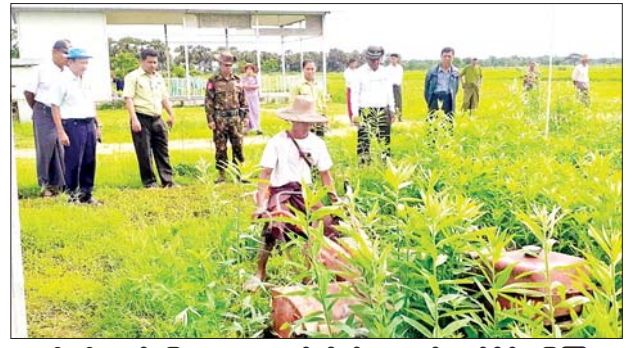
၂၅ ဦး၏ လယ်မြေ ၂၆၈ ဧကတွင် ပိုက်ဆံလျှော်(သစ်စိမ်းမြေသြဇာ) ထည့်သွင်းပြီးဖြစ်ကြောင်း သိရသည်။

မြန်အောင်မြို့နယ်အတွင်း ၂၀၂၃-၂၀၂၄ ခုနှစ် မိုးစပါးမြေဆီလွှာ ဖွံ့ဖြိုးတိုးတက်ရေးအတွက် ပိုက်ဆံလျှော် (သစ်စိမ်းမြေသြဇာ) ဧက ၃၄၀၀ စိုက်ပျိုးထားရှိရာ ယနေ့အထိ ကျေးရွာအုပ်စု ၂၃ အုပ်စုရှိတောင်သူ