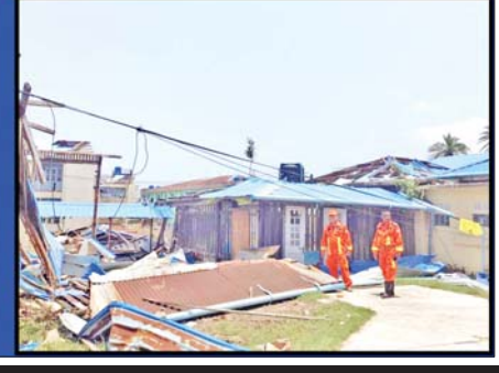
ရခိုင်ပြည်နယ်၊ မြောက်ဦးမြို့နယ်အတွင်းရှိ ကျေးရွာအုပ်စုများမှ ပြည်သူများ ဘေးကင်းရာနေရာများသို့ ရွှေ့ပြောင်း သွားလာရာတွင် ကူညီဆောင်ရွက်ပေးမှု