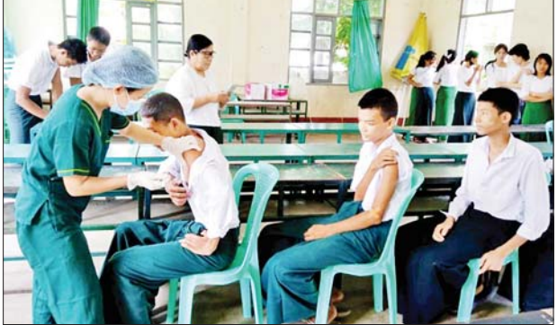
လေးကျောင်းတို့မှ ကျောင်းသား ကျောင်းသူများအား ကိုဗစ်-၁၉ ကာကွယ်ဆေး နေ့စဉ်အလှည့်ကျထိုးနှံပေးသွားမည်ဖြစ်ကြောင်းသိရ သည်။ မြို့နယ်(ပြန်/ဆက်)