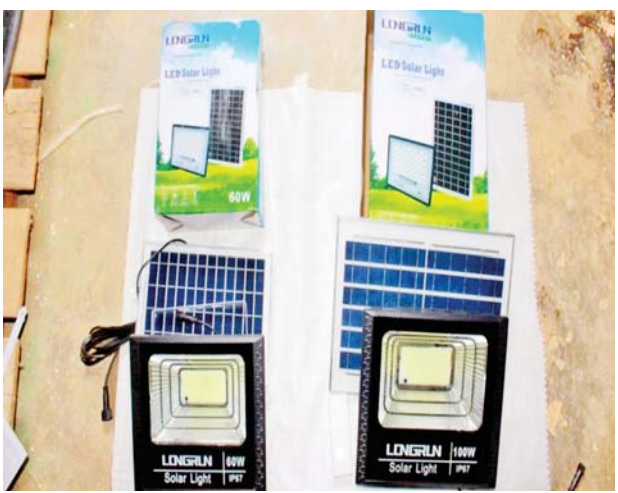
ရမ်းပြည်နယ်၌ သိမ်းဆည်းရမိမှု။

နေပြည်တော် ဇွန် ၂၅ တရားမဝင် ကုန်သွယ်မှု တိုက်ဖျက်ရေး ဦးဆောင် ကော်မတီ၏ ကြီးကြပ်ကွပ်ကဲမှု ဖြင့် တရားမဝင် ကုန်သွယ်မှုများကို ဥပဒေနှင့်အညီ ထိရောက်စွာ တားဆီး အရေးယူနိုင်ရေး ဆောင်ရွက်လျက်ရှိရာ ဇွန် ၁၉ ရက်တွင် ရှမ်းပြည်နယ်တရားမဝင် ကုန်သွယ်မှုတိုက်ဖျက်ရေးအထူး အဖွဲ့၏ စီမံခန့်ခွဲမှုဖြင့် နောင်ချို မြို့နယ်တရားမဝင်ကုန်ပစ္စည်းများ တားဆီးရေးအဖွဲ့က အိုရီယမ်တယ် တိုးဂိတ်၊ ပူးပေါင်းစစ်ဆေးရေးဂိတ် ၌ လျှပ်စစ်ပစ္စည်းများ ရွှေ့ပြောင်း သယ်ဆောင်လာသော ယာဉ်နှစ်စီး အား စိစစ်၍ လားရှိုးမြို့နယ် အကောက်ခွန်ဦးစီးဌာနမှူးရုံးသို့ ပို့ဆောင်ပြီး အသေးစိတ်စစ်ဆေးမှု များ ဆောင်ရွက်ခဲ့ရာ သွင်းကုန် ကြေညာလွှာတွင် ကြေညာထား ခြင်းမရှိသည့် Fujianminy China Silent Diesel Generating Set တစ်စုံအပါအဝင် ကုန်ပစ္စည်း ၅၆ မျိုး၊ (ခန့်မှန်းတန်ဖိုးငွေကျပ် ၃၅၅၉၀၈၆၀)ကို လည်းကောင်း၊ အဆိုပါပစ္စည်းများ တင်ဆောင် လာသည့် Hino Profia Tractor Head တစ်စီးနှင့် နောက်တွဲယာဉ်