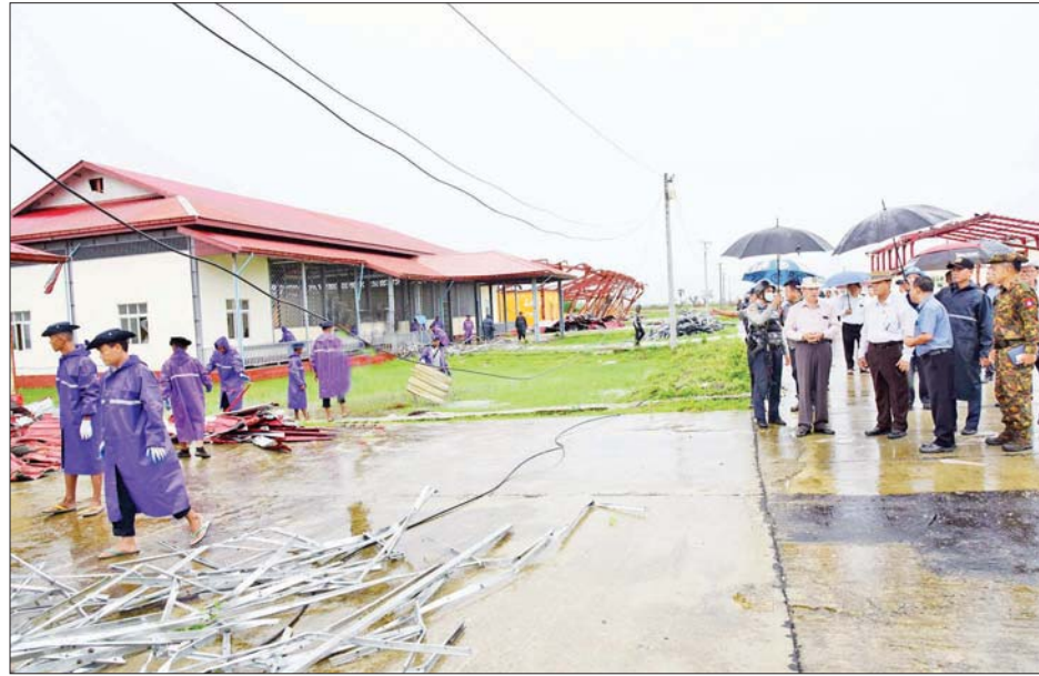
ပြည်ထောင်စုဝန်ကြီး ဦးလှမိုးနှင့်အဖွဲ့ဝင်များ အားကစားနှင့် ကာယပညာသိပ္ပံ(စစ်တွေ)တွင် ကြည့်ရှုစစ်ဆေးစဉ်။