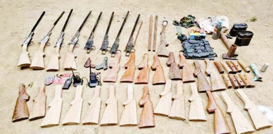
စစ်ကိုင်းမြို့နယ် လက်ပံတောကျေးရွာအနီး PDF အမည်ခံအကြမ်းဖက်သမားများထံမှ သိမ်းဆည်းရမိခဲ့သည့် လက်နက်/ခဲယမ်းများနှင့် ဆက်စပ်ပစ္စည်းများကို တွေ့ရစဉ်။