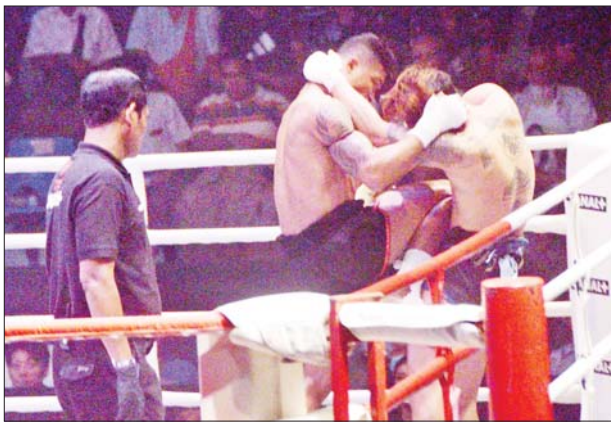
ရာမာန်(မြန်မာ)နှင့် အိုလန်(ထိုင်း)တို့ ယှဉ်ပြိုင်ထိုးသတ်စဉ်။

၅၁-၅၄ ကီလို(ဘန်တမ် ဝိတ်တန်း)လေးချိပြိုင်ပွဲတွင် သားသားနှင့် ဒေါနကျော်ကျော်တို့ပြိုင်ပွဲ၌ ဒိုင်သုံးဦးက ဒေါနကျော်ကျော်ကို