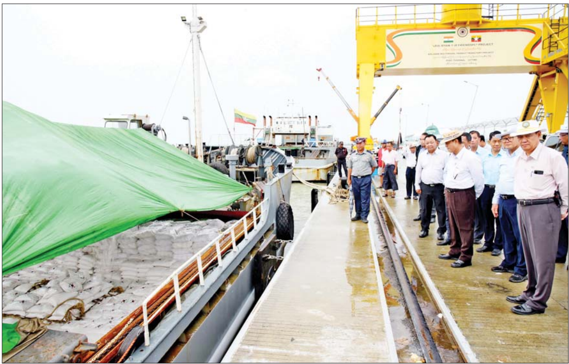
ပြည်ထောင်စုဝန်ကြီး ဦးလှမိုးနှင့်အဖွဲ့ဝင်များ စစ်တွေမြို့ ဘက်စုံသုံးဆိပ်ကမ်း၌ ကူညီကယ်ဆယ်ရေးနှင့် ပြန်လည်ထူထောင်ရေးပစ္စည်းများ ဘေးသင့်ဒေသများသို့ ဖြန့်ခွဲပေးပို့ရန် ဆောင်ရွက်နေမှုကို ကြည့်ရှုစစ်ဆေးစဉ်။

ဖြည့်ဆည်းဆောင်ရွက် ထိုသို့ ကြည့်ရှုစစ်ဆေးစဉ် ပြည်ထောင်စုဝန်ကြီးက မိုးရာသီကာလဖြစ်သဖြင့် ရေစီးရေလာကောင်းမွန်အောင် ဆောင်ရွက်ကြရန်၊ မုန်တိုင်းဒဏ်ခံနိုင်ရန် အရိပ်ရ လေကာပင်များကို ရှင်သန်ကြီးထွားအောင် စနစ်တကျ စိုက်ပျိုးသွားကြရန်၊ ပတ်ဝန်းကျင်စိမ်းလန်းစိုပြည်ရန်နှင့် သန့်ရှင်းသာယာလှပအောင် ဆောင်ရွက်သွားကြရန် မှာကြားပြီး တာဝန်ရှိသူများ၏ ရှင်းလင်းတင်ပြချက်များအပေါ် ညှိနှိုင်းပေါင်းစပ်ဖြည့်ဆည်းဆောင်ရွက်ပေးသည်။ ဆက်လက်၍ ပြည်ထောင်စုဝန်ကြီး