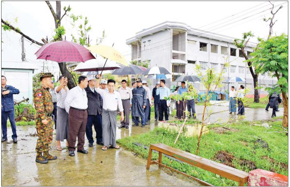
ပြည်ထောင်စုဝန်ကြီး ဦးလှမိုးနှင့်အဖွဲ့ဝင်များ နည်းပညာတက္ကသိုလ်(စစ်တွေ)တွင် ကြည့်ရှုစစ်ဆေးစဉ်။