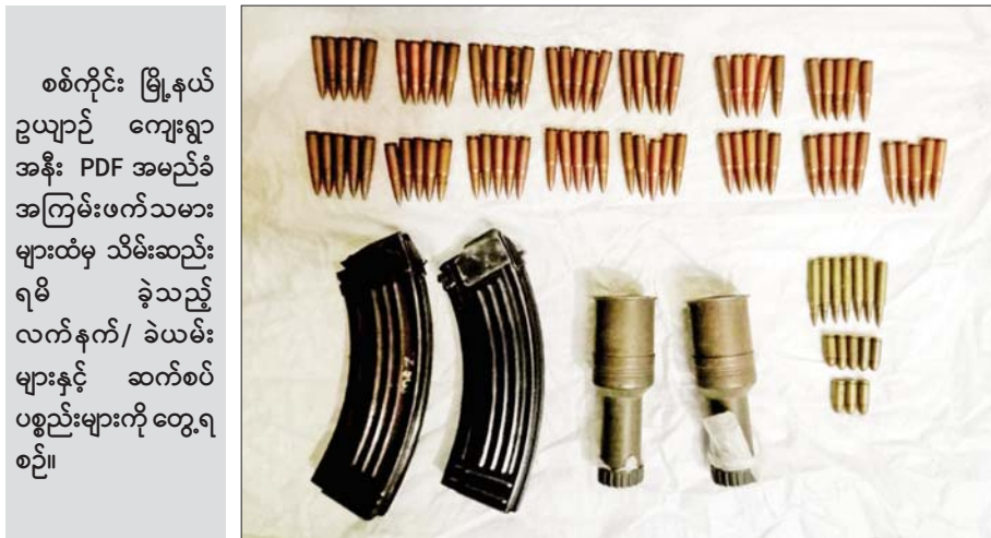
စစ်ကိုင်း မြို့နယ် ဥယျာဉ် ကျေးရွာ အနီး PDF အမည်ခံ အကြမ်းဖက်သမား များထံမှ သိမ်းဆည်း ရမိ ခဲ့သည့် လက်နက်/ ခဲယမ်း များနှင့် ဆက်စပ် ပစ္စည်းများကို တွေ့ရ စဉ်။

ပစ္စည်းများကို လုပ်ထုံးလုပ်နည်းများနှင့်အညီ ဆက်လက်ဆောင်ရွက်သွားမည်ဖြစ်ကြောင်းနှင့် အကြမ်းဖက်အဖွဲ့များအနေဖြင့် အဆိုပါလက်နက် များကို ကိုင်ဆောင်၍ ဒေသခံပြည်သူများကို အနိုင်ကျင့်ဖိုလ်ကျခြင်း၊ နိုင်ငံ့ဝန်ထမ်းများနှင့် အပြစ်မဲ့ ပြည်သူများအပေါ် စိတ်မထင်လျှင် မထင်သလို သတ်ဖြတ်ခြင်းများ ဆောင်ရွက်လျက်ရှိရာ ရပ်ရွာ တည်ငြိမ်အေးချမ်းရေးအတွက် လုံခြုံရေးတပ်ဖွဲ့ဝင် များနှင့်အတူ ပြည်သူ့တစ်ရပ်လုံး ဝိုင်းဝန်းပူးပေါင်း ဆောင်ရွက်ပေးနိုင်ရန် သတင်းထုတ်ပြန်ထားကြောင်း သိရသည်။ သတင်းစဉ်