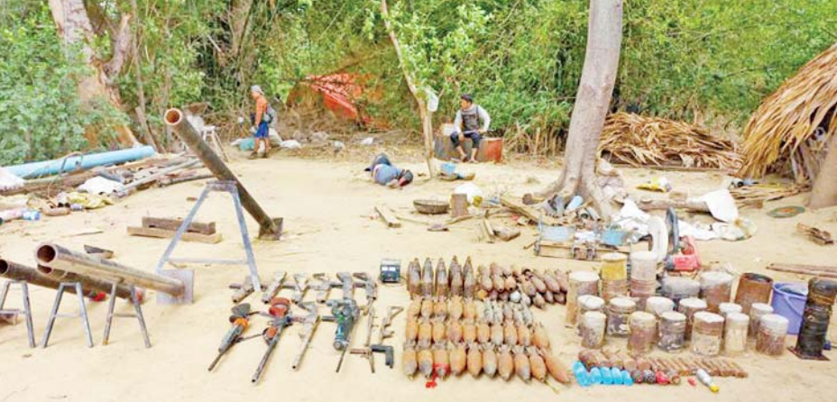
စစ်ကိုင်းမြို့နယ် လက်ပံတောကျေးရွာအနီး PDF အမည်ခံအကြမ်းဖက်သမားများထံမှ သိမ်းဆည်းရမိခဲ့သည့် လက်နက်/ခဲယမ်းများနှင့် ဆက်စပ်ပစ္စည်းများကို တွေ့ရစဉ်။