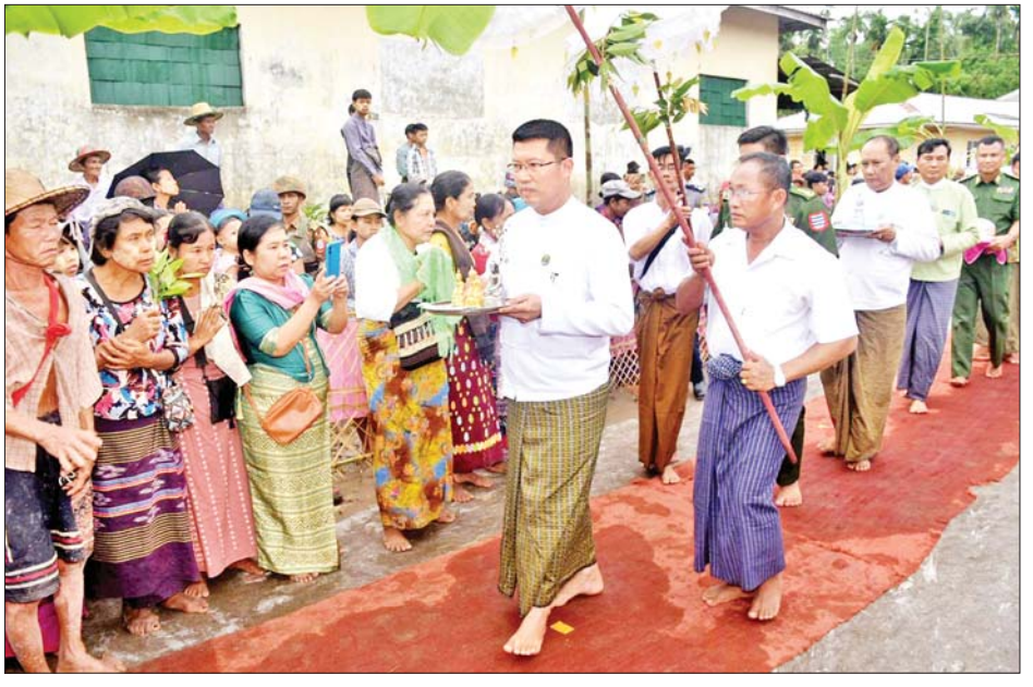
ရှပ်သိမ်း၍ ရတနာ ရွှေမိုးငွေမိုးများ ရွာသွန်းဖြိုးခဲ့ သည်။ ဆက်လက်၍ တိုင်းဒေသကြီး ဝန်ကြီးချုပ်သည် အသောကသီတဂူဘေးမဲ့တောရ ကျောင်းဝင်း အတွင်း၌ ပြုလုပ်သည့် ၂၀၂၃ ခုနှစ် မိုးရာသီသစ်ပင် စိုက်ပျိုးပွဲ တိရစ္ဆာန်အစာပင်စိုက်ပျိုးပွဲနှင့် ကော်ဖီ သီးနှံ စိုက်ပျိုးပွဲအခမ်းအနားသို့ တက်ရောက်ခဲ့ ကြောင်း သိရသည်။ တိုင်းဒေသကြီး(ပြန်/ဆက်)

ထည့်သွင်းပူဇော် ထို့နောက် တိုင်းဒေသကြီးဝန်ကြီးချုပ်၊ ဘုရား ဒါယကာ၊ ဒါယိကာမများက ဘုရားဌာပနာတော် ပစ္စည်းများကို ပင့်ဆောင်ပူဇော်ကြပြီး အမွှေး နံ့သာရည်များပက်ဖျန်း၍ ဌာပနာတိုက်အတွင်း ထည့်သွင်းပူဇော်ကြရာ ဆရာတော်၊ သံဃာတော် အရှင်သူမြတ်များက “ဇယန္တောဗောဓိယာမူလေ” အစရှိသော ဇယမင်္ဂလာ အောင်ဂါထာတော်များကို ရွတ်ဖတ်ပူဇော်ကာ “ဗုဒ္ဓသာသနံစိရံတိဋ္ဌတု” သုံးကြိမ် ရွတ်ဆိုဆုတောင်း၍ မင်္ဂလာအခမ်းအနားကို