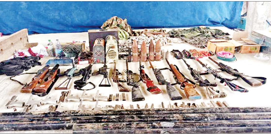
စစ်ကိုင်းမြို့နယ် ဥယျာဉ်ကျေးရွာအနီး PDF အမည်ခံအကြမ်းဖက်သမားများထံမှ သိမ်းဆည်းရမိခဲ့သည့် လက်နက်၊ ခဲယမ်းများနှင့် ဆက်စပ်ပစ္စည်းများကို တွေ့ရစဉ်။

နေပြည်တော် ဇွန် ၂၅ နယ်မြေတည်ငြိမ်အေးချမ်းမှုကို ပျက်ပြားစေသော လုပ်ရပ်များနှင့် အကြမ်းဖက်လုပ်ဆောင်မှုများကို လက်ခံ နိုင်ခြင်းမရှိသည့် ဒေသခံပြည်သူအချို့၏ လျှို့ဝှက်ဆက်သွယ် သတင်းပေးပို့မှုအရ NUGI CRPH တို့၏ ဆက်သွယ်ညွှန်ကြားမှု ဖြင့် စစ်ကိုင်းတိုင်းဒေသကြီးအတွင်း အဖျက်အမှောင့်လုပ်ငန်းများ လုပ်ဆောင် နေသည့် PDF အမည်ခံ အကြမ်းဖက် သမားများသည် စစ်ကိုင်းမြို့နယ် ကင်းတော်ကျေးရွာ၊ ဥယျာဉ်ကျေးရွာနှင့် လက်ပံတောကျေးရွာများအနီး လက်နက်၊ ခဲယမ်းများနှင့်အတူ ခိုအောင်းနေကြောင်း သိရှိရသဖြင့် တပ်မတော်စစ်ကြောင်း များက ယနေ့တွင် သွားရောက်ချေမှုန်း စာမျက်နှာ ၁၅ ကော်လံ ၁ သို့ *