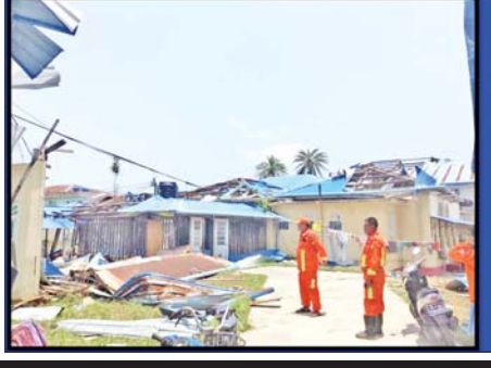
ရှာဖွေကယ်ဆယ်ရေးအထူးတပ်ဖွဲ့ဝင်များ စစ်တွေမြို့၊ ခုတင် ၅၀၀ ဆုံ ပြည်သူ့ဆေးရုံကြီး၌ ထိခိုက် ပျက်စီးမှု အခြေအနေများအား စစ်ဆေးကြည့်ရှုနေပုံ (လုပ်ငန်းမဆောင်ရွက်မီ)

တပ်ဖွဲ့ဝင်တွေအနေနဲ့ နေအိမ် အဆောက်အအုံတွေအပေါ်ကို လဲကျ ပိမိနေတဲ့ သစ်ပင်ကြီးတွေ၊ လမ်းပိတ်ဆို့ နေတဲ့သစ်ပင်၊ သစ်ကိုင်းတွေကို Chain Saw တွေ အသုံးပြုပြီး ရှင်းလင်းဖယ်ရှားရသလို လဲကျနေတဲ့ ဓာတ်တိုင်တွေ၊ ပြိုကျနေတဲ့ သံထည်အဆောက်အအုံတွေ၊ တာဝါတိုင်တွေကို Engine Cutter နဲ့ Hydraulic Cutter တွေ အသုံးပြုပြီး သက်ဆိုင်ရာဌာနတွေက ယာဉ်/စက်ယန္တရားအကူအညီနဲ့ ရှင်းလင်းပေးနိုင်ခဲ့ပါတယ်။ စာမျက်နှာ ၉ သို့