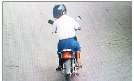
လယ်ဝေးမြို့မရဲစခန်းနှင့် MICC-II ဂိတ်(၂) ဝင်/ထွက်ပေါက်အား လက်ပစ်ဗုံးဖြင့်ပစ်ခတ်ခဲ့သည့် ဖမ်းဆီးရမိတရားခံ မြင့်ကျော်(ခ)အသေးလေး၏ CCTV မှတ်တမ်းဓာတ်ပုံ။