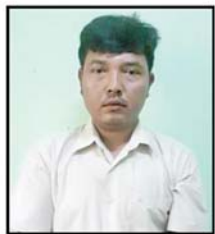
ရန်နိုင်ထွန်း အငှားယာဉ်မောင်း