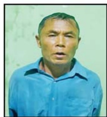
မြင့်ကျော်(ခ) အသေးလေး (လက်ပစ်ဗုံးဖြင့် ပစ်ခတ်ခဲ့သူ)