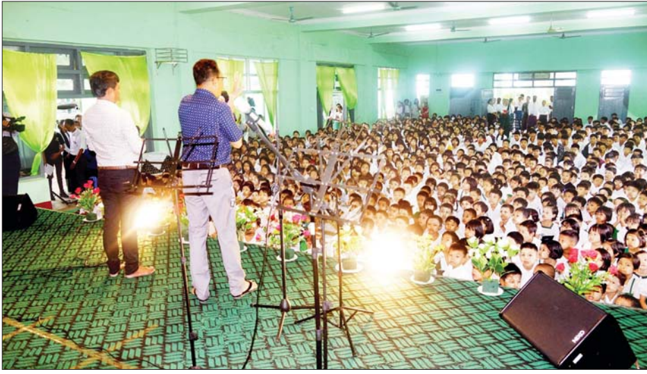
အကယ်ဒမီ အုန်းသီး၊ ဒိန်းဒေါင်နှင့် အနုပညာရှင်များက တေးသီချင်းများဖြင့် ဖျော်ဖြေမှုကို ကျောင်းသား ကျောင်းသူများ ကြည့်ရှုအားပေးကြစဉ်။