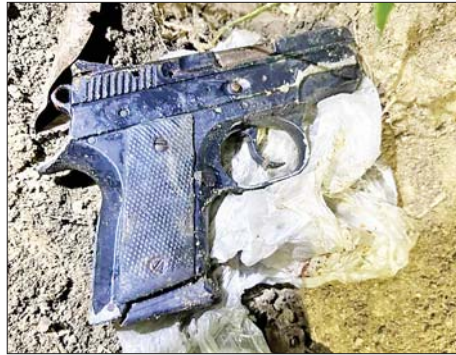
ဇွန် ၂၀၂၃ ခုနှစ် ဖေဖော်ဝါရီ ၂၈ ရက်တွင် မြို့သီရိမြို့နယ် ရှာဖွေရေးအဖွဲ့က ရှာဖွေတွေ့ရှိခဲ့သည့် လက်နက်/ခဲယမ်းများ သွားရောက်ရှာဖွေခဲ့သည့် မှတ်တမ်းဓာတ်ပုံ။