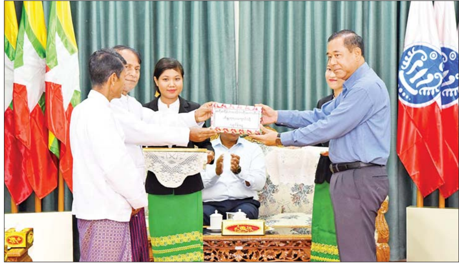
ပြည်ထောင်စုဝန်ကြီး ဒုတိယဗိုလ်ချုပ်ကြီး ထွန်းထွန်းနောင် သျှီရီ သျှီရီမိုဟာဒေဗုံဘာရီ(မဟာသီဝ) ဟိန္ဒူဘုရားကျောင်းများသို့ အလှူငွေများ ပေးအပ်လှူဒါန်းစဉ်။