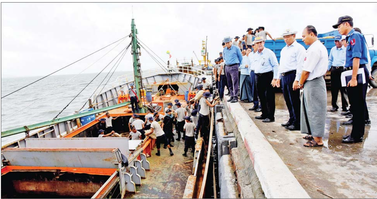
နိုင်ငံတော်စီမံအုပ်ချုပ်ရေးကောင်စီအဖွဲ့ဝင် ဒုတိယဝန်ကြီးချုပ်နှင့် ပြည်ထောင်စုဝန်ကြီး ဗိုလ်ချုပ်ကြီးတင်အောင်စန်းနှင့်အဖွဲ့ ပြန်လည်ထူထောင်ရေးလုပ်ငန်းများတွင် အသုံးပြုမည့်ပစ္စည်းများကို ဘေးသင့်ဒေသများသို့ ဖြန့်ခွဲပေးနိုင်ရေး စီမံဆောင်ရွက်နေမှုကို ကြည့်ရှုစစ်ဆေးစဉ်။

တက်ရောက် ဦးစွာ ဗိုလ်ချုပ်ကြီးတင်အောင်စန်းနှင့်အဖွဲ့သည် ရခိုင်ပြည်နယ်အစိုးရအဖွဲ့ ဝန်ကြီးချုပ်ရုံးဧည့်ခန်းမ၌ ကျင်းပသည့် မိုခါမုန်တိုင်းတိုက်ခတ်မှုကြောင့် ထိခိုက်ပျက်စီးခဲ့သည့် ဘုန်းတော်ကြီးကျောင်းနှင့် ဘုရားရှိခိုးကျောင်းများ ပြုပြင်ရေးအလှူငွေပေးအပ်ခြင်းနှင့် ဘိုးဘွားရိပ်သာများနှင့် လူငယ်ဖွံ့ဖြိုးရေး ပရဟိတဂေဟာများသို့ ထောက်ပံ့ငွေများ ပေးအပ်ခြင်းအခမ်းအနားသို့ တက်ရောက်သည်။