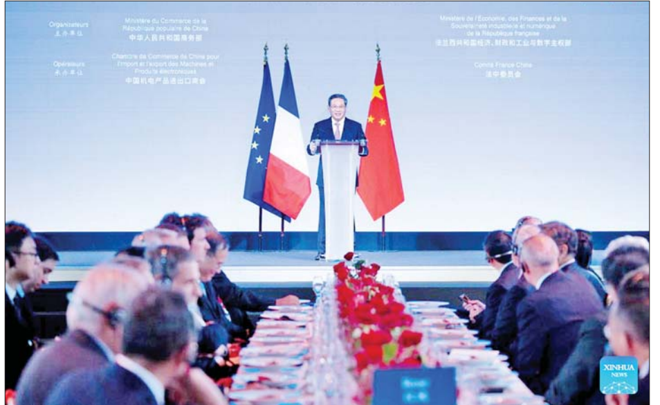
လေကြောင်းလုပ်ငန်းများတွင် တရုတ်နိုင်ငံမှလုပ်ငန်း ဝန်ကြီးဘရူနိုက ပြောကြားသည်။ များနှင့် ပူးပေါင်းဆောင်ရွက်မည်ဖြစ်ကြောင်း ကိုးကား-ဆင်ဟွာ၊ ဘာသာပြန်-စိုးသူရ

ပြင်သစ်နိုင်ငံမှ လုပ်ငန်းများသည် အစားအသောက်၊ ပြန်လည်ပြည့်ဖြိုးမြွှမ်းအင်ကဏ္ဍနှင့်