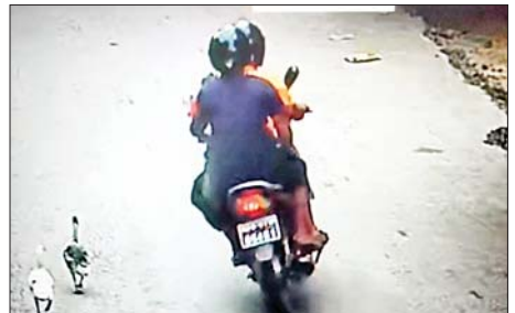
လယ်ဝေးမြို့မရဲစခန်းနှင့် MICC-II ဂိတ်(၂) ဝင်ပေါက်အား လက်ပစ်ဗုံးဖြင့် ပစ်ခတ်သည့်ဖြစ်စဉ်မှ တရားခံ နှစ်ဦး၏ CCTV မှတ်တမ်းဓာတ်ပုံ။