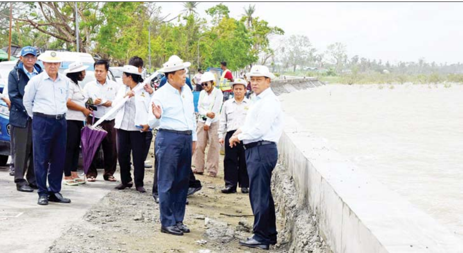
နိုင်ငံတော်စီမံအုပ်ချုပ်ရေးကောင်စီအဖွဲ့ဝင် ဒုတိယဝန်ကြီးချုပ်နှင့် ပြည်ထောင်စုဝန်ကြီး ဗိုလ်ချုပ်ကြီးတင်အောင်စန်းနှင့်အဖွဲ့ စစ်တွေမြို့ ကမ်းနားလမ်း ပြန်လည်ပြုပြင်တည်ဆောက်လျက်ရှိသည့် အခြေအနေများကို ကြည့်ရှုစစ်ဆေးစဉ်။

မွန်းလွဲပိုင်းတွင် ဗိုလ်ချုပ်ကြီးတင်အောင်စန်းနှင့် အဖွဲ့သည် မိုခါမုန်တိုင်းကြောင့် ထိခိုက်ပျက်စီးခဲ့သည့် စစ်တွေမြို့ ကမ်းနားလမ်းရှိ ကျောက်စိမ္မေထိန်းနံရံ၊ ကွန်ကရစ်လမ်း၊ ပလက်ဖောင်းများပျက်စီးနေမှုနှင့် ပြန်လည်ပြုပြင် တည်ဆောက်လျက်ရှိသည့် အခြေအနေများကို