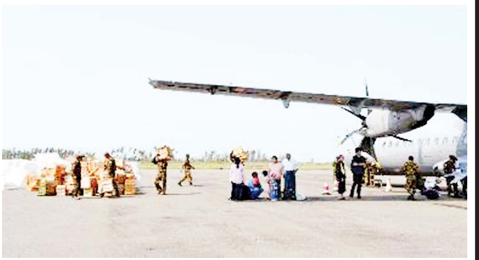
တပ်မတော်လေယာဉ်ကြီးများဖြင့် ကယ်ဆယ်ကူညီထောက်ပံ့ရေးပစ္စည်းများ ပို့ဆောင်ပေးစဉ်။