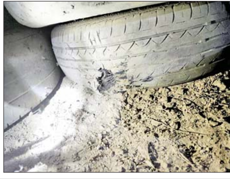
၂၀၂၃ ခုနှစ် မတ် ၂ ရက်တွင် မြို့သီရိမြို့နယ် ချိုင်းရွာလမ်းဆုံရှိ ရဲကင်းစခန်းအား လက်ပစ်ဗုံးဖြင့် ပစ်ခတ်ဖောက်ခွဲခဲ့သည့် မှတ်တမ်းဓာတ်ပုံ။