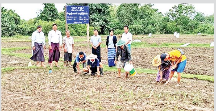
မြို့နယ်(ပြန်/ဆက်)

ကရင်ပြည်နယ် လှိုင်းဘွဲ့မြို့နယ်တွင် မိုးရာသီတိရစ္ဆာန်အစာပင် စိုက်ပျိုး သရုပ်ပြသခြင်းကို ဇွန် ၂၁ ရက် နံနက်ပိုင်းက သမ္မာန်ကျေးရွာအုပ်စု ရွာသာအေးကျေးရွာရှိ တောင်သူဦးပိုင်း ၏ လယ်မြေသုံးဧက၌ ကျင်းပရာ ပြည်နယ်မွေးမြူရေးနှင့်ကုသရေးဦးစီး ဌာနညွှန်ကြားရေးမှူးနှင့်တာဝန်ရှိသူများ ကြည့်ရှုအားပေးစဉ်။