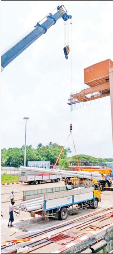
ဆက်သွယ်ရေးကွန်ကရစ်တိုင်များအား ပြန်လည်စိုက်ထူပေးနေစဉ်။

မေလ ၁၄ ရက်နေ့ ရခိုင်ပြည်နယ် အတွင်းသို့ မိုခါဝင်ရောက်လာပြီးနောက် ရခိုင်ပြည်နယ် အိမ်ခြံမြေနှင့် ငင်းနှင့် ဆက်စပ်နယ်မြေ မကွေးတိုင်းဒေသကြီး ငဖဲမြို့နယ်အတွင်း ပင်မဖိုင်ဘာ ကေဘယ်လ်ပြတ်တောက်မှု ငါးနေရာ ဖြစ်ပေါ်ခဲ့သည်။ စစ်တွေ၊ ရသေ့တောင်၊ ပုဏ္ဏားကျွန်းနှင့် မောင်တောမြို့တို့တွင် တာဝါတိုင် ၁၀ တိုင်ပြုလဲခြင်း၊ မြို့တွင်း ဖိုင်ဘာကေဘယ်လ်များ ပြတ်တောက် ခြင်း၊ မြို့တွင်းနှင့် အဝေးဆက်သွယ်ရေး မိုခါခရီးဝှေ့ဆက်ကြောင်းများ ပြတ် တောက်ခြင်းတို့ကြောင့် ဆက်သွယ်ရေး စခန်းများထိခိုက်ပျက်စီးခဲ့သည်။