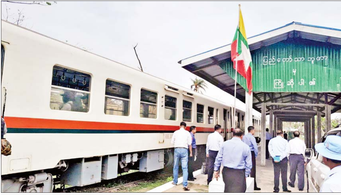
စစ်တွေမြို့မှအထွက် ဒုတိယမြောက် ပြည်တော်သာဘူတာရုံ။

ကြီးမားသောရေယာဉ်ကြီးများ အမှန်ပြောရလျှင် ပင်လယ်ကမ်းနား နှင့် သိပ်မနီးစပ်ခဲ့သော ကျွန်တော့် အနေဖြင့် စစ်ရေယာဉ် မုတ္တမနှင့် အရပ် ဘက်ရေယာဉ်ကြီးများ ဖြစ်ကြသည့် MV Aquarius၊ MV Fortune၊ MV Sunshine တို့ကဲ့သို့သော အလွန်ကြီးမား သည့် ရေယာဉ်ကြီးများနှင့် ရင်းနှီး ကျွမ်းဝင်ခြင်းမရှိခဲ့ပေ။ နီးနီးစပ်စပ် မမြင်ဖူးခဲ့။ ဗိုလ်ချုပ်ကြီးတင်အောင်စန်း ၏ ဖိတ်ကြားခေါ်မှုကြောင့် ကျွန်တော် တို့အားလုံး စစ်ရေယာဉ် မုတ္တမပေါ်သို့ တက်ရောက်လေ့လာခွင့် ရခဲ့သည်။