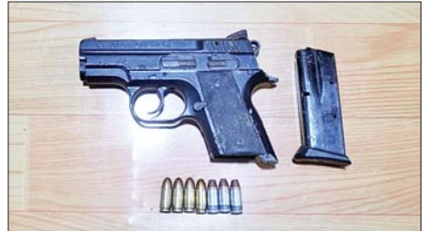
ဧမ္မာသီရိမြို့နယ် ရှားတောရွာနှင့် အလျင်လို ရွာအကြား လမ်းဘေးသစ်ပင်အောက်၌ သိမ်းဆည်း ရမိခဲ့သည့် လက်နက်/ခဲယမ်းများ မှတ်တမ်းဓာတ်ပုံ။