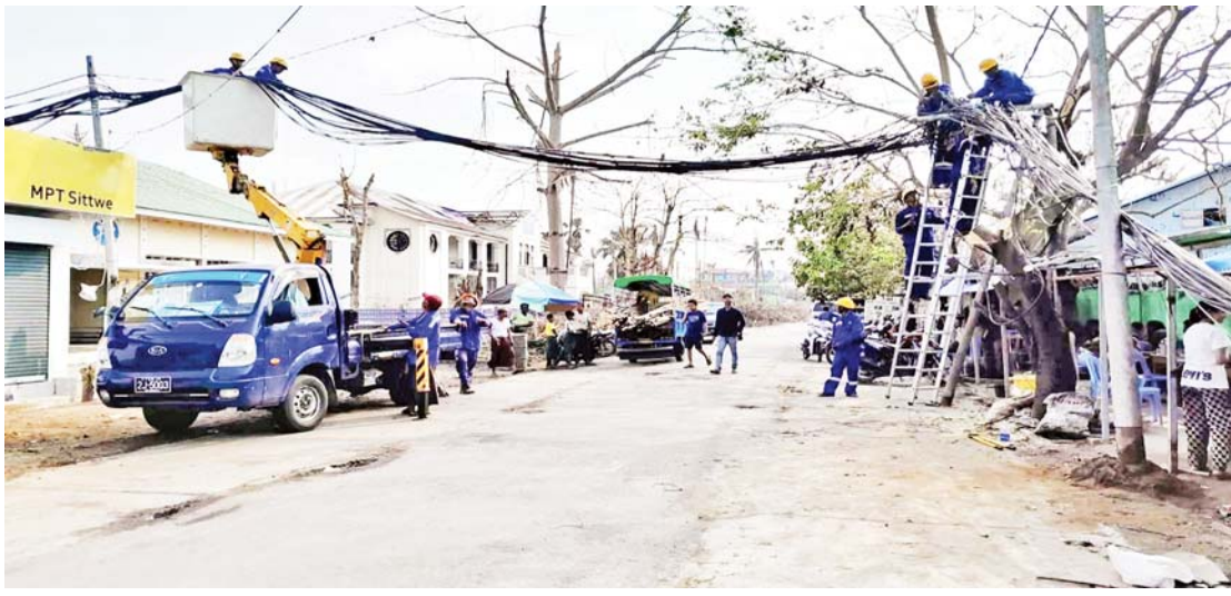
စစ်တွေမြို့တွင်း ဆက်သွယ်ရေးလှိုင်းများအား ပြန်လည်ပြုပြင်ဆောင်ရွက်ပေးနေစဉ်။

ဖျတ်ခနဲ အမှတ်ရလိုက်မိသော မှတ်တမ်းဓာတ်ပုံလေးများ မိုခါမုန်တိုင်းဒဏ်သင့် စစ်တွေမြို့ကြီး မေလ ၁၄ ရက်နေ့မှစ၍ မီးအမှောင်ကျ သွားခဲ့သည်။ တာဝန်ရှိသူများ၏ စီမံ ကွပ်ကဲမှု၊ လျှပ်စစ်စွမ်းအားဝန်ကြီးဌာန ဝန်ထမ်းများ၏ ကြိုးပမ်းမှုတို့ဖြင့် မေလ ၂၅ ရက်နေ့တွင်လောကနန္ဒာစေတီတော် ကြီးအား လျှပ်စစ်မီးပူဇော်နိုင်ခဲ့သလို စစ်တွေမြို့တွင်း လမ်းမကြီးများကို မီးလင်းစေခဲ့သည်။ 500 KVA မီးစက်ဖြင့် ယာယီပေးခဲ့ခြင်းဖြစ်၏။ တစ်ပြိုင်တည်း မှာပင် တယ်လီဖုန်းများ အားသွင်းရန်၊ အိမ်သုံးလျှပ်စစ်မီးအိမ်များ အားသွင်းရန် နေရာ ရှစ်ခုသတ်မှတ်၍ စီစဉ်ဆောင်ရွက် ပေးခဲ့ရာ ညစဉ်ညတိုင်း လာရောက် အားသွင်းသူ ရာထောင်ချီရှိခဲ့သည်။