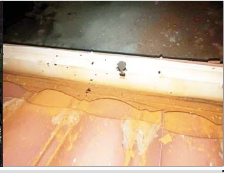
၂၀၂၃ ခုနှစ် ဖေဖော်ဝါရီ ၂၈ ရက်တွင် မြို့သီရိမြို့နယ် ရှာဖွေရေးအဖွဲ့က ရှာဖွေတွေ့ရှိခဲ့သည့် လက်နက်/ခဲယမ်းများ သွားရောက်ရှာဖွေခဲ့သည့် မှတ်တမ်းဓာတ်ပုံ။