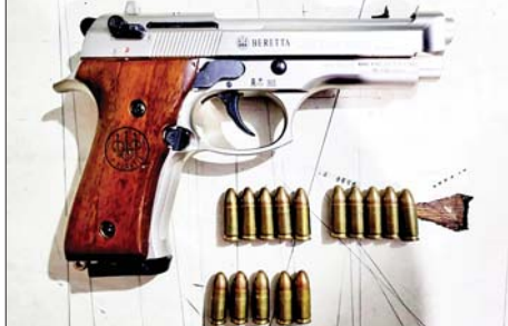
ဒက္ခိဏသီရိမြို့နယ် သီရိမင်္ဂလာကျေးရွာရှိ ဖမ်းဆီးရမိ တရားခံ မြင့်ကျော်(ခ)အသေးလေး၏ နေအိမ်မှ သိမ်းဆည်းရမိခဲ့သည့် လက်နက်/ခဲယမ်း များ မှတ်တမ်းဓာတ်ပုံ။