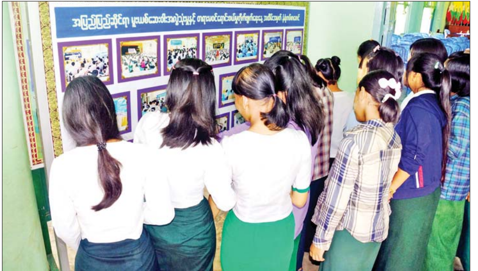
အပြည်ပြည်ဆိုင်ရာ မူးယစ်ဆေးဝါးအလွဲသုံးမှုနှင့် တရားမဝင်ရောင်းဝယ်မှုတိုက်ဖျက်ရေးနေ့အထိမ်းအမှတ် နံရံကပ်စာစောင်ကို ကျောင်းသူများ ကြည့်ရှုလေ့လာကြစဉ်။