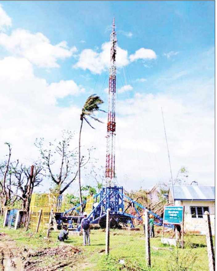
ပြန်လည်ပြုပြင်ဆောင်ရွက်ပြီးစီးခဲ့သော ဆက်သွယ်ရေးတာဝါတိုင်။

ဆက်သွယ်ရေးကဏ္ဍ ကြိုတင်စီစဉ်ဆောင်ရွက်မှုများ မုန်တိုင်း ဝင်ရောက်တိုက်ခတ်ပြီး ဆိုလျှင် လျှပ်စစ်မီးများ ပြတ်တောက် သွားမည်ဖြစ်သလို ဆက်သွယ်ရေးကဏ္ဍ သည်လည်း အနည်းနှင့်အများ ထိခိုက် ပျက်စီးမှုများနှင့် ကြုံတွေ့ရတော့မည်မှာ မလွဲပေ။ သည့်အတွက် ပို့ဆောင်ရေးနှင့် ဆက်သွယ်ရေး ဝန်ကြီးဌာနသည် အကောင်းဆုံး ကြိုတင်ပြင်ဆင်စီမံ ဆောင်ရွက်ပေးနိုင်ခဲ့ကြောင်း တွေ့ရ သည်။ အကယ်၍ မုန်တိုင်းဒဏ်ကြောင့်