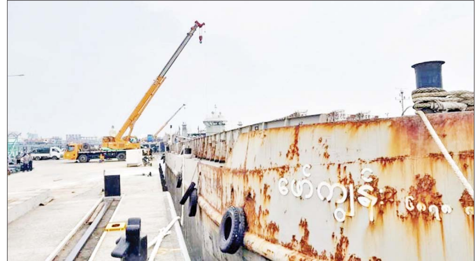
စစ်တွေဆိပ်ကမ်းသို့ ဆိုက်ကပ်လာသည့် ရေယာဉ်ကြီးများပေါ်မှ ကယ်ဆယ်ကူညီ ထောက်ပံ့ရေးပစ္စည်းများချနေစဉ်။