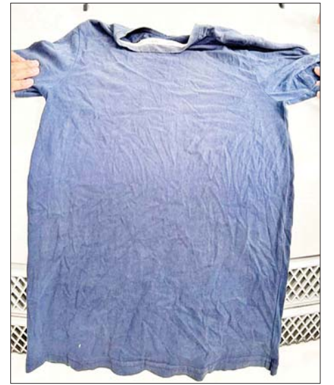
လယ်ဝေးမြို့မရဲစခန်းနှင့် MICC-II ဂိတ်(၂) ဝင်/ထွက်ပေါက်အား လက်ပစ်ဗုံးဖြင့်ပစ်ခတ်သည့် ဖြစ်စဉ်မှ တရားခံဝတ်ဆင်ခဲ့သည့် သက်သေခံ ပစ္စည်းများ မှတ်တမ်းဓာတ်ပုံ။