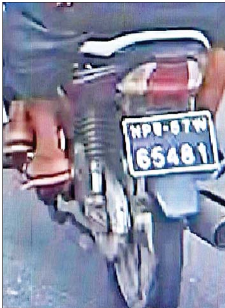
တရားခံများ စီးနင်းသည့် ဆိုင်ကယ်မှတ်တမ်း ဓာတ်ပုံ။