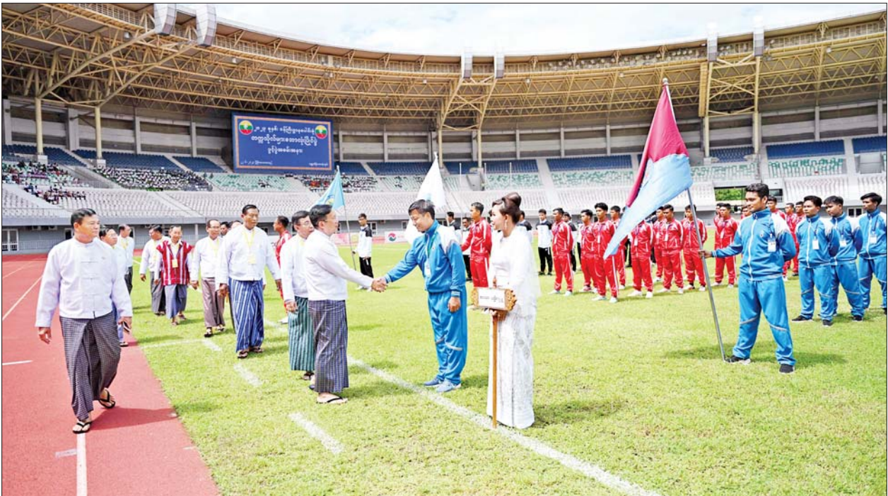
နိုင်ငံတော်စီမံအုပ်ချုပ်ရေးကောင်စီအတွင်းရေးမှူး ဒုတိယဗိုလ်ချုပ်ကြီးအောင်လင်းဒွေးနှင့်အဖွဲ့ဝင်များ ပြိုင်ပွဲဝင်အားကစားသမား များအား ရင်းရင်းနှီးနှီးနှုတ်ဆက်စဉ်။

တတ်သည့်စည်းလုံးရေးစိတ်ဓာတ် ကို ရရှိစေမည်ဖြစ်သည့်အပြင် ထူးချွန်သည့် ဘောလုံးအားကစား သမားများကိုလည်း လာမည့် ၂၀၂၄ ခုနှစ် အင်ဒိုနီးရှားနိုင်ငံတွင် ကျင်းပမည့် (၂၀)ကြိမ်မြောက် အာဆီယံ တက္ကသိုလ်များ အားကစားပြိုင်ပွဲအတွက် ဘောလုံး လက်ရွေးစင် အားကစားသမား များအဖြစ် ရွေးချယ်သွားမည် ဖြစ်ကြောင်း၊ ဝန်ကြီးဌာနအဆင့်မှ နိုင်ငံတော်အဆင့်၊ အရှေ့တောင် အာရှအဆင့်၊ အာရှအဆင့်မှသည် ကမ္ဘာ့အဆင့်အထိ ထိုးဖောက်နိုင် စေရေး ရည်မှန်းချက်ထား၍ မလျှော့သော ဇွဲ၊ လုံ့လ၊ အားမာန်၊ စိတ်ဓာတ်တို့ဖြင့် ကြိုးပမ်း အားထုတ်သွားကြရန် အလေး အနက် တိုက်တွန်းပြောကြား၍ ဝန်ကြီးဌာနပေါင်းစုံ တက္ကသိုလ် များ ဘောလုံးပြိုင်ပွဲကို ဖွင့်လှစ် ပေးသည်။ ထို့နောက် ဝန်ကြီးဌာနပေါင်းစုံ တက္ကသိုလ်များမှ ပြိုင်ပွဲဝင်အသင်း များက အားကစားသမားအဓိဋ္ဌာန် ရွတ်ဆိုကြသည်။