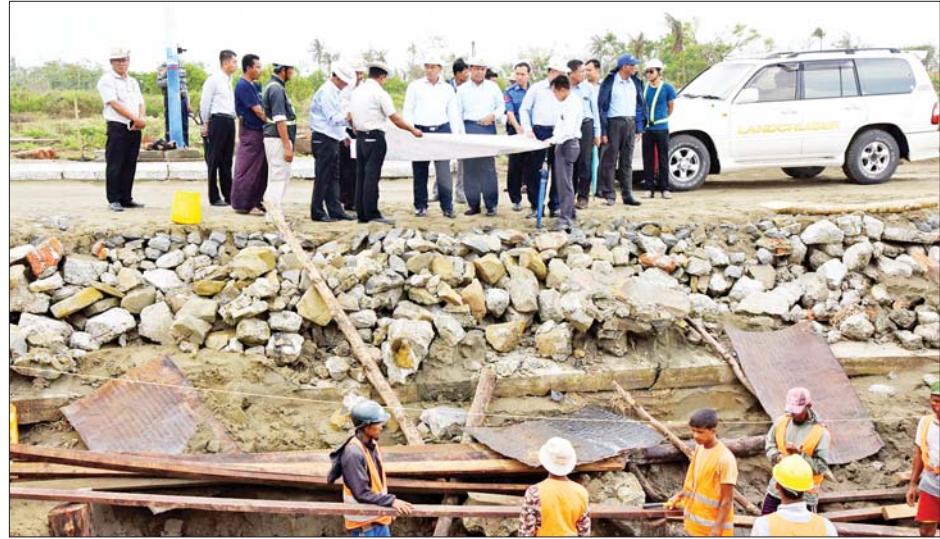
နိုင်ငံတော်စီမံအုပ်ချုပ်ရေးကောင်စီအဖွဲ့ဝင် ဒုတိယဝန်ကြီးချုပ်နှင့် ပြည်ထောင်စုဝန်ကြီး ဗိုလ်ချုပ်ကြီးတင်အောင်စန်းနှင့်အဖွဲ့ စစ်တွေမြို့ ကမ်းနားလမ်း ပြန်လည်ပြုပြင်တည်ဆောက်လျက်ရှိသည့် အခြေအနေများကို ကြည့်ရှုစစ်ဆေးစဉ်။

တင်အောင်စန်း၊ ဒုတိယဗိုလ်ချုပ်ကြီးထွန်းထွန်းနောင်၊ ဦးလှမိုး၊ ဦးမျိုးသန့်၊ ဒေါက်တာသက်သက်ခိုင်၊ ပြည်နယ်ဝန်ကြီးချုပ် ဦးထိန်လင်းနှင့် ဒုတိယဝန်ကြီးများသည် ရခိုင်ပြည်နယ်အစိုးရအဖွဲ့ရုံး၌ ကျင်းပသည့် သဘာဝဘေး ပြန်လည်ထူထောင်ရေးဆိုင်ရာ လုပ်ငန်းညှိနှိုင်းအစည်းအဝေးသို့ တက်ရောက်ကြပြီး လုပ်ငန်းကော်မတီများ အလိုက် ပြန်လည်ထူထောင်ရေးဆိုင်ရာ လုပ်ငန်းများနှင့် စပ်လျဉ်းသည့် အစည်းအဝေး ဆုံးဖြတ်ချက်များအပေါ် လိုက်နာဆောင်ရွက်ပြီးစီးမှုများ၊ ဆက်လက်ဆောင်ရွက်မည့် အစီအမံများနှင့် လုပ်ငန်းတိုးတက်မှုအခြေအနေ ရှင်းလင်းတင်ပြချက်များအပေါ် လိုအပ်သည်များ ပေါင်းစပ်ညှိနှိုင်း ဆောင်ရွက်ပေးခဲ့ကြောင်း သိရသည်။ သတင်းစဉ်