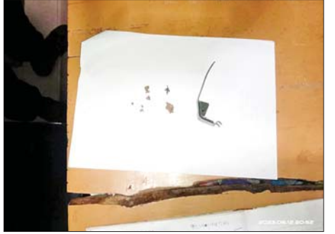
၂၀၂၃ ခုနှစ် ဇွန် ၁၂ ရက်တွင် မြို့သီရိမြို့နယ် ဘောကသိဒ္ဓိရပ်ကွက် ဉာဏအောင်မြေလမ်း MICC-II ဂိတ်(၂) ဝင်ပေါက်အား လက်ပစ်ဗုံးဖြင့် ပစ်ခတ်ခွဲရာမှ ပေါက်ကွဲမှုဖြစ်ပွားခဲ့သည့် မှတ်တမ်းဓာတ်ပုံ။

»» စာမျက်နှာ ၁၄ မှ ■ ဧပြီ ၁၆ ရက်တွင် သက်နိုင်နှင့် ရဲနိုင်တို့ နှစ်ဦးက မြို့သီရိမြို့နယ် အဆင့်မြင့်ဈေးအနောက်ဘက်ရှိ ရဲကင်းစခန်းအား လက်ပစ်ဗုံးဖြင့် ပစ်ခတ်ဖောက်ခွဲခဲ့ရာ တွင် မြင့်ကျော်က အခြေအနေကြည့်ရှုပေးခဲ့ကြောင်း။ ■ မေ ၃ ရက်တွင် သက်နိုင်နှင့် ရဲနိုင်တို့ နှစ်ဦးသည် ဥတ္တရသီရိမြို့နယ် ရာဇသင်္ဂဟလမ်းနှင့် သီရိမဏ္ဍိုင်လမ်းထောင့်ရှိ ရဲကင်းစခန်းအား ပစ္စတိုဖြင့်ပစ်ခတ်၍ လက်ပစ်ဗုံးဖြင့် ပစ်ခတ်ဖောက်ခွဲခဲ့ကြောင်း။ ■ ဇွန် ၁၂ ရက်တွင် သက်နိုင်နှင့် ရဲနိုင်တို့ နှစ်ဦးက လယ်ဝေးမြို့မရဲစခန်းရှေ့တွင် လုံခြုံရေးတပ်ဖွဲ့ဝင်များအား လက်ပစ်ဗုံးဖြင့် ချောင်းမြောင်းပစ်ခတ်ရာတွင် မြင့်ကျော်က အခြေအနေကြည့်ရှုပေးခဲ့ကြောင်း။