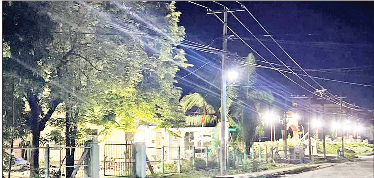
ကျောက်တော်မြို့ ဓာတ်အားခွဲရုံမှ ကျောက်တော်မြို့ပေါ်ရပ်ကွက်များသို့ ဓာတ်အားဖြန့်ဖြူးပေးထားမှုကို တွေ့ရစဉ်။