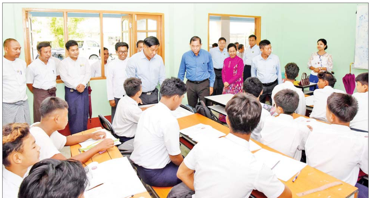
နိုင်ငံတော်စီမံအုပ်ချုပ်ရေးကောင်စီအဖွဲ့ဝင် ဒုတိယဝန်ကြီးချုပ်နှင့် ပြည်ထောင်စုဝန်ကြီး ဗိုလ်ချုပ်ကြီးတင်အောင်စန်းနှင့် အဖွဲ့ အစိုးရနည်းပညာအထက်တန်းကျောင်း(စစ်တွေ)၌ ပညာသင်ကြားနေသော ကျောင်းသား ကျောင်းသူများအား ရင်းရင်းနှီးနှီး နှုတ်ဆက်အားပေးစကားပြောကြားစဉ်။

ဗိုလ်ချုပ်ကြီး တင်အောင်စန်းက မိုခါမုန်တိုင်းတိုက်ခတ်မှု ဖြစ်ပွားခဲ့သည့်နောက်ပိုင်း ကူညီကယ်ဆယ်ရေးနှင့် ပြန်လည်ထူထောင်ရေးလုပ်ငန်းများ ဆောင်ရွက်ရာတွင် ပညာရေး၊ ကျန်းမာရေးနှင့် သာသနိက အဆောက်အအုံများ ပြုပြင်ရေးကို ဦးစားပေးအဆင့် သတ်မှတ်ဆောင်ရွက်ပေးလျက် ရှိကြောင်း၊ ထိုခိုက်ပျက်စီးခဲ့သည့် စေတီပုထိုးများနှင့် သာသနိက အဆောက်အအုံများကို ပြုပြင်ရာတွင် မူလအလှူရှင်များ၊ စေတနာရှင် ပြည်သူများ၏ လှူဒါန်းမှုများအား ဘုရားဂေါပကအဖွဲ့များ၏ အနီးကပ်ကြီးကြပ်မှုဖြင့် အမြန်ဆုံး ပြီးစီးအောင် စနစ်တကျပြုပြင်ဆောင်ရွက်သွားကြရမည် ဖြစ်ကြောင်း၊ ထိုသို့ဆောင်ရွက်ရာတွင် သက်ဆိုင်ရာဝန်ကြီးဌာန၊ ပြည်နယ်အစိုးရအဖွဲ့၊ သံဃာယကအဖွဲ့များနှင့် တွေ့ဆုံသြဝါဒ လမ်းညွှန်မှု ခံယူ၍ ဘက်စုံပြုပြင်ရေးလုပ်ငန်းများကို အမြန်ကောင်းမွန်အောင် ဆောင်ရွက်သွားကြရမည် ဖြစ်ကြောင်း၊ မြန်မာမူလကရာများ