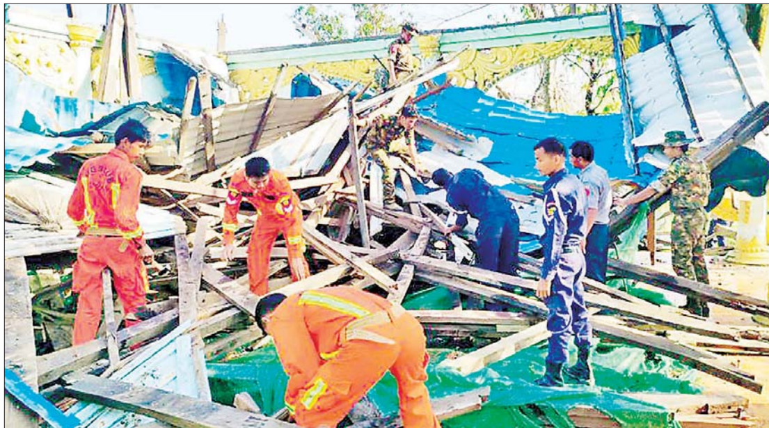
သာသနိကအဆောက်အအုံများပျက်စီးမှုကို ကူညီကယ်ဆယ်ရေးအဖွဲ့များက ရှင်းလင်းဖယ်ရှားပေးနေစဉ်။

ဒါ့အပြင် “တိုင်းပြည်၏ အားသည် ပြည်တွင်းမှာသာရှိသည်” ဆိုတဲ့အတိုင်း ကိုယ့်ပြည်သူတွေ အမှန်တကယ် ဒုက္ခရောက်နေချိန်မှာ အဆင်ပြေတဲ့ ပြည်သူတွေက တစ်ယောက်တစ်လက် ညီညာအားဖြင့် ပေါင်းစုစည်းရုံးကာ လှူဒါန်းပေးမှုတွေ၊ ကာယအားနဲ့ ကူညီ ပေးမှုတွေ၊ အနုပညာအားနဲ့ ကူညီပေးမှု တွေဟာ ကမ္ဘာတည်သရွေ့ သမိုင်း မှတ်တမ်း ဝင်နေဦးမှာဖြစ်ကြောင်း ကယ်ဆယ်ရေးနဲ့ ပြန်လည်ထူထောင်ရေး လုပ်ငန်းတွေမှာ ပါဝင်သူတွေအားလုံးကို “မိုခါအလွန် ကယ်ဆယ်ရေးနှင့် ပြန်လည် ထူထောင်ရေးလုပ်ငန်းများဆီသို့” ဆိုတဲ့ ဆောင်းပါးနဲ့ ဂုဏ်ယူလေးစားကြောင်း ရေးသားဖော်ပြလိုက်ရပါတယ်။