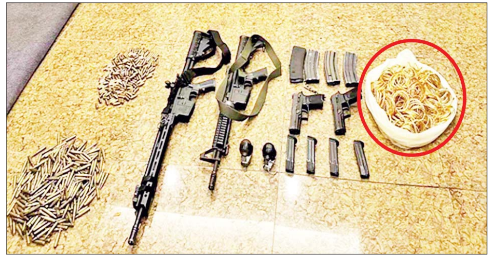
မြောက်ဥက္ကလာပမြို့နယ် ဝေဘာဂီ (၅) ရပ်ကွက် ဗြဟ္မစိုရ်လမ်း တိုက်အမှတ် (၁၀၁)တွင် သိမ်းဆည်းရမိခဲ့သည့် လက်နက်/ခဲယမ်းများနှင့် ရွှေထည်ပစ္စည်းများ၏ မှတ်တမ်းဓာတ်ပုံ။

မြောက်ဥက္ကလာပမြို့နယ် (ဈ)ရပ်ကွက်ရှိ “မြတ်မောင်” စိန်ရွှေရတနာဆိုင် ဓားပြတိုက်လုယက်ခံရသည့် မှတ်တမ်းဓာတ်ပုံ။