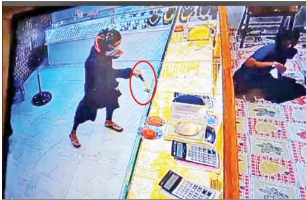
မြောက်ဥက္ကလာပမြို့နယ် (ဈ)ရပ်ကွက်ရှိ “မြတ်မောင်” စိန်ရွှေရတနာဆိုင် ဓားပြတိုက်လုယက်ခံရသည့် CCTV မှတ်တမ်းဓာတ်ပုံ။