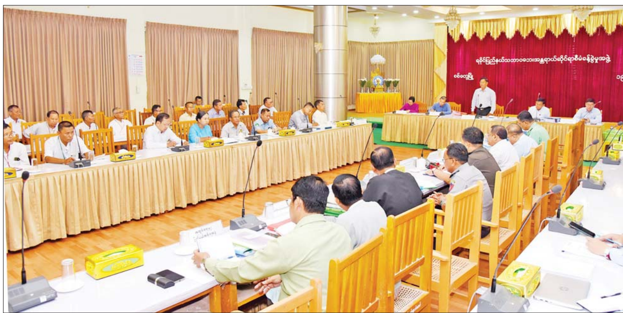
နိုင်ငံတော်စီမံအုပ်ချုပ်ရေးကောင်စီအဖွဲ့ဝင် ဒုတိယဝန်ကြီးချုပ်နှင့် ပြည်ထောင်စုဝန်ကြီး ဗိုလ်ချုပ်ကြီးတင်အောင်စန်း ရခိုင်ပြည်နယ်အတွင်း မိုခါမုန်တိုင်းတိုက်ခတ်မှုဒဏ်ကြောင့် ပျက်စီးခဲ့သည့် သာသနိကအဆောက်အအုံများ ဘက်စုံပြန်လည်ပြုပြင် မွမ်းမံခြင်းဆိုင်ရာ လုပ်ငန်းညှိနှိုင်းအစည်းအဝေးတွင် အမှာစကားပြောကြားစဉ်။

ဆွေးနွေး တင်ပြချက်များနှင့် စပ်လျဉ်း၍ ပေါင်းစပ်ညှိနှိုင်း ဖြည့်ဆည်း ဆောင်ရွက်ပေးခဲ့သည်။