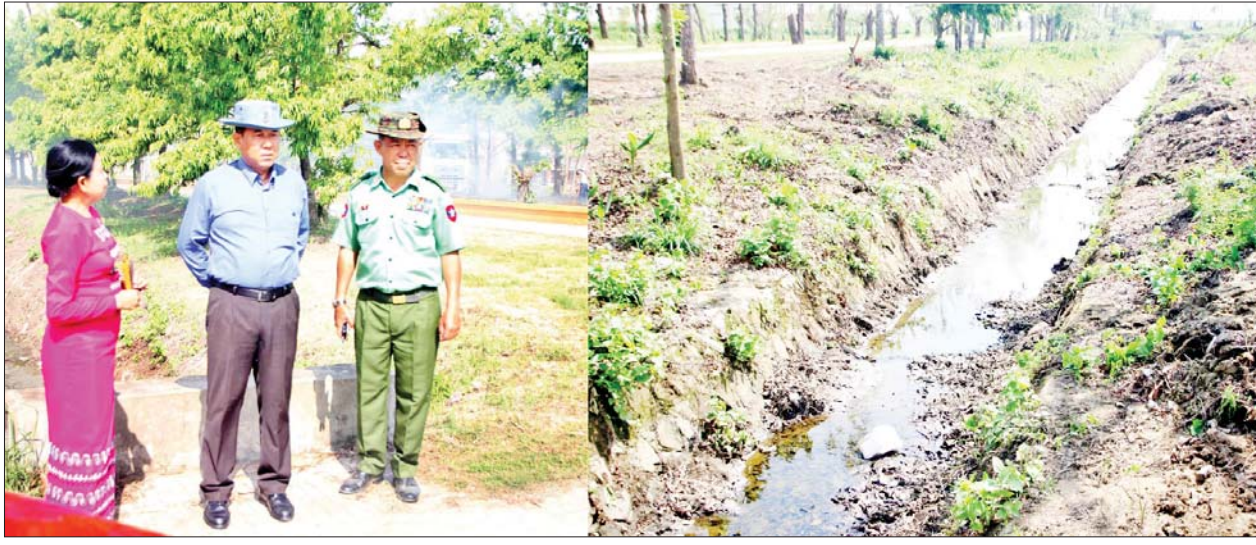
ပြည်ထောင်စုဝန်ကြီး ဒုတိယဗိုလ်ချုပ်ကြီးထွန်းထွန်းနောင် စစ်တွေတက္ကသိုလ်ဝင်းအတွင်း ရေစီးရေလာကောင်းမွန်စေရေးအတွက် ရေနုတ်မြောင်းများ ပြန်လည်တူးဖော်ထားရှိမှုကို ကြည့်ရှုစစ်ဆေးစဉ်။

အတွင်း သန့်ရှင်းသာယာလှပရေးနှင့် တက္ကသိုလ်အင်္ဂါရပ်နှင့်ညီညွတ်ရေးဆောင်ရွက်လျက်ရှိသည့် အခြေအနေများ၊ မိုးတွင်းကာလတွင် တက္ကသိုလ်ဝင်းအတွင်း ရေစီးရေလာကောင်းမွန်စေရေးအတွက် ရေနုတ်မြောင်းများတူးဖော်နေမှုများနှင့် လျှပ်စစ်ဓာတ်အားလိုင်းများ စနစ်တကျဖြစ်စေရေး ဆောင်ရွက်ရမည့် ကိစ္စရပ်များ၊ နယ်စပ်ဒေသ တိုင်းရင်းသားလူငယ်များဖွံ့ဖြိုးရေး သင်တန်းကျောင်း အဆောက်အအုံများ၏ အတွင်းပိုင်းများ ပြန်လည်ပြုပြင်မှု စားရိပ်သာအတွင်း ဆောင်ရွက်ထားရှိမှု၊ ကျောင်းသား ကျောင်းသူများ စည်းစနစ်ကျကျ ကျောင်းတက်ရောက်မှုတို့ကို လိုက်လံကြည့်ရှုစစ်ဆေးပြီး တာဝန်ရှိသူများအား လိုအပ်သည်များ မှာကြားသည်။