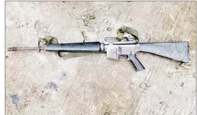
မအူပင်မြို့နယ် ခနောင်အုပ်စု ကျွဲလန်းကျေးရွာတွင် သိမ်းဆည်းရမိခဲ့သည့် M-16 တစ်လက်။