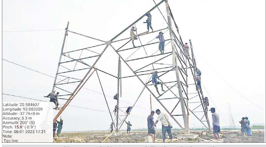
တာဝန်ရှိသူများက လျှပ်စစ်မီးရရှိရေးအတွက် ကြိုးပမ်းဆောင်ရွက်ပေးနေစဉ်။

အဲဒီအချိန်ကနေစပြီး ဇွန်လ ၁၃ ရက်နေ့အထိ တပ်မတော်လေယာဉ်နဲ့ စာမျက်နှာ ၇ သို့