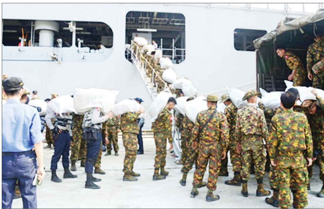
မုန်တိုင်းဒဏ်သင့်ဒေသများအတွက် ကယ်ဆယ်ရေးပစ္စည်းများကို ပေးပို့စဉ်။

လျှပ်စစ်မီးမရခင် အတောအတွင်းမှာ ပြည်သူတွေ လျှပ်စစ်မီးအထိုက်အလျောက် ရရှိစေဖို့အတွက် ၅၀၀ ကေစီအေ မီးစက်ကြီးတွေနဲ့ လမ်းမီးထွန်းခြင်း လုပ်ငန်းတွေကိုလည်း