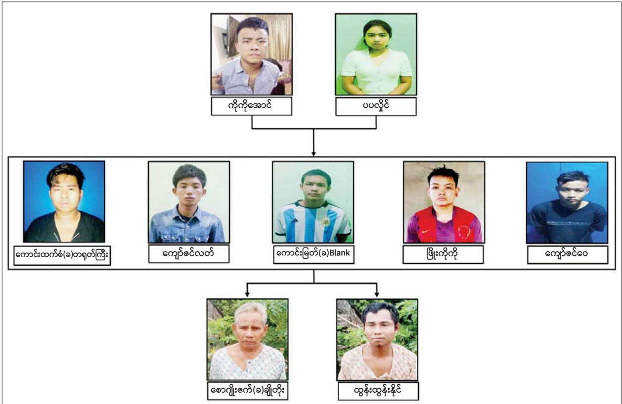
မြောက်ဥက္ကလာပမြို့နယ် (ဈ)ရပ်ကွက်ရှိ “မြတ်မောင်” စိန်ရွှေရတနာဆိုင်အား ဓားပြတိုက်လုယက်ခဲ့သည့် တရားခံများအား ဖမ်းဆီးရမိမှု အခြေပြဇယား

ဖြစ်စဉ်တွင် တရားခံ ကျား ရှစ်ဦး၊ မ တစ်ဦး ပေါင်း ကိုးဦးတို့နှင့်အတူ M-4A1 သေနတ် နှစ်လက်၊ M-16 တစ်လက်၊ Sig Sauer ပစ္စတို နှစ်လက်၊ ကျည်အိမ်မျိုးစုံ ရှစ်ခု၊ 91 လက်ပစ်ဗုံး နှစ်လုံး၊ ၅ ဒဿမ ၅၆ ကျည်အတောင့် ၃၄၀၊ 9MM Luger ကျည်အတောင့် ၂၀၀ တို့ကို ဖမ်းဆီးရမိခဲ့ပြီး ဓားပြတိုက်လုယက်ယူဆောင်သွားသည့် ရွှေထည်ပစ္စည်းများအား ဖြစ်စဉ်ဖြစ်ပွားပြီး ငါးနာရီအတွင်း အကြမ်းဖက်မှုကို မလိုလားသည့် တာဝန်သိပြည်သူများ၏ ပူးပေါင်းပါဝင်ဆောင်ရွက်မှုနှင့် လုံခြုံရေးတပ်ဖွဲ့ဝင်များ၏ နေ့/ညမပြတ် အရှိန်အဟုန်ဖြင့် စစ်ဆေးရှာဖွေမှုများကြောင့် ဖော်ထုတ်ဖမ်းဆီးရမိခဲ့သည်။ အထက်ပါ ဖမ်းဆီးရမိတရားခံများအား ဥပဒေအရ ထိရောက်စွာ