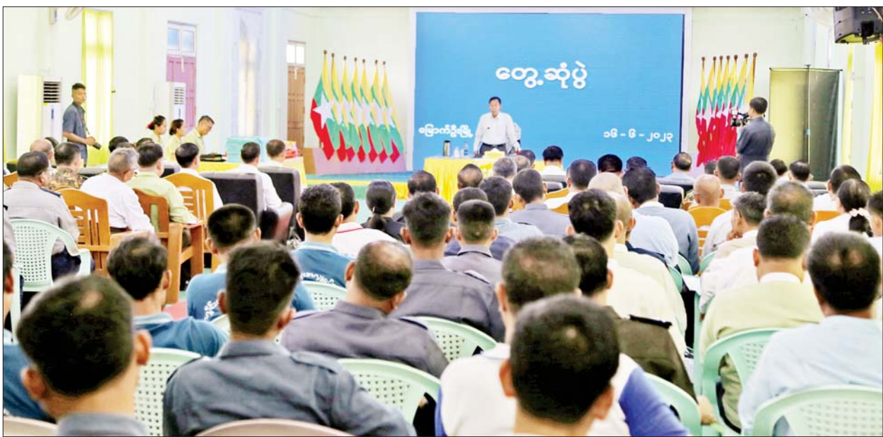
နိုင်ငံတော်စီမံအုပ်ချုပ်ရေးကောင်စီ ဒုတိယဥက္ကဋ္ဌ ဒုတိယဝန်ကြီးချုပ် ဒုတိယဗိုလ်ချုပ်မှူးကြီးစိုးဝင်း မြောက်ဦးမြို့နယ်ရှိ ဌာနဆိုင်ရာများ၊ မြို့မိမြို့ဖများ၊ ကူညီကယ်ဆယ်ရေးအဖွဲ့များနှင့် ပရဟိတအဖွဲ့များအား တွေ့ဆုံအမှာစကား ပြောကြားစဉ်။

တတိယ ဦးစားပေးအနေဖြင့် ကျန်းမာရေးကဏ္ဍတွင် ဆေးရုံ/ ဆေးခန်းများ ပြင်ဆင်ပေးခဲ့ခြင်း ဖြစ်ပြီး ယခုကာလတွင် ကျန်းမာရေး စောင့်ရှောက်မှုများ ပုံမှန်ပြန်လည် ပြုလုပ်ပေးလျက်ရှိကြောင်း။ မြောက်ဦးမြို့သည် သမိုင်း