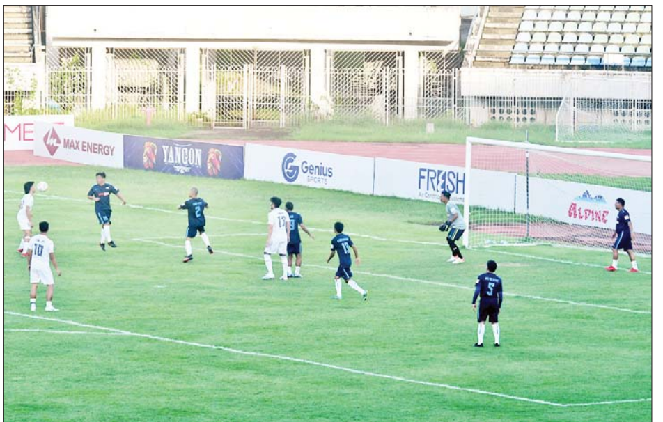
OLD STAR FC အသင်းနှင့် MUSIC FC အသင်းတို့ ယှဉ်ပြိုင်ကစားကြစဉ်။