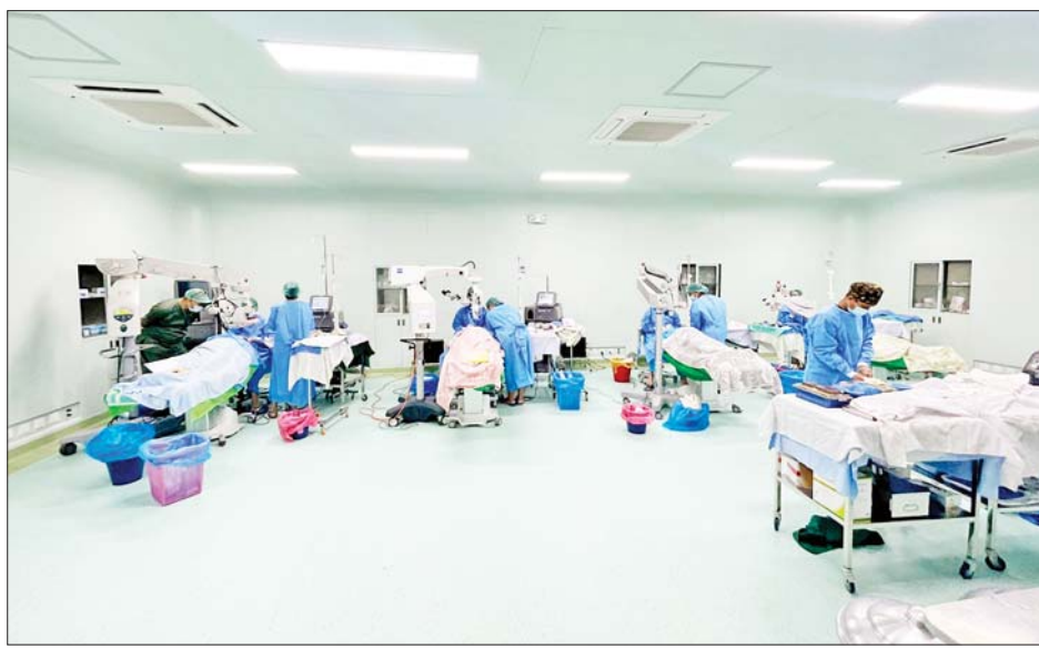
ရေးကို စီစဉ်ဆောင်ရွက်ပေးထားပြီး ဒုတိယအကြိမ် ဒေသကြီးအတွင်း တတိယအကြိမ် ထပ်မံဆောင်ရွက် ပေးသွားမည်ဖြစ်ကြောင်း သိရသည်။ သတင်းစဉ်

နေပြည်တော် ဇွန် ၁၆ နိုင်ငံတော်ဩဝါဒါစရိယ သောဠသမရွှေကျင် သာသနာတော်ပိုင် သီတဂူ ဗုဒ္ဓတက္ကသိုလ်များနှင့် သီတဂူဆေးရုံတော်များ၏ အဓိပတိ အဘိဓဇ မဟာရဋ္ဌဂုရု အဘိဓဇ အဂ္ဂမဟာ သဒ္ဓမ္မဇောတိက ဒေါက်တာ ဘဒ္ဒန္တ ဉာဏိဿရ အရှင်သူမြတ်က မေတ္တာစေတနာ ကရုဏာများစွာဖြင့် ရန်ကုန်တိုင်း ဒေသကြီးအတွင်းရှိ မျက်စိဝေဒနာရှင်များကို သီတဂူ နယ်လှည့်စက္ခုဒါနအဖွဲ့မှ မျက်စိအထူးကုဆရာဝန် များနှင့် အဖွဲ့ဝင်များက ဒုတိယအကြိမ် အမဲ မျက်စိ စမ်းသပ်ခွဲစိတ်ကုသပေးခြင်းများကို ဇွန် ၁၂ ရက်မှ ၁၄ ရက်အထိ စမ်းသပ်စစ်ဆေးပေးခြင်းများ ပြုလုပ်ပေးခဲ့ရာ မျက်စိဝေဒနာရှင် ၁၄၀၅ ဦးအား စမ်းသပ်စစ်ဆေးပေးနိုင်ခဲ့ပြီး ခွဲစိတ်ကုသရန် လိုအပ် သူ မျက်စိဝေဒနာရှင် ၃၀၀ ခန့်အနက်မှ ယနေ့အထိ ၂၅၆ ဦးကို ခွဲစိတ်ကုသပေးနိုင်ခဲ့ကြောင်း သိရ သည်။ အဆိုပါ လာရောက်ကုသသည့် မျက်စိဝေဒနာ ရှင်များနှင့် မိသားစုဝင်များ၏ နေထိုင်စားသောက်