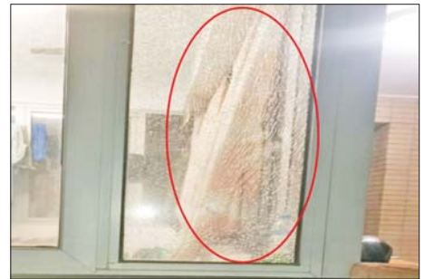
၁၂-၆-၂၀၂၃ ရက်တွင် မြေသီရိမြို့နယ် ဘောဂ သိဒ္ဓိရပ်ကွက် ဉာဏအောင်မြေလမ်း MICC-II ဂိတ်(၂)ဝင်ပေါက်အား လက်ပစ်ဗုံးဖြင့် ပစ်ခတ် ဖောက်ခွဲခံခဲ့ရသည့် မှတ်တမ်းဓာတ်ပုံ။