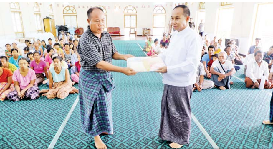
မရှိအောင် တာဝန်ရှိသူများနှင့် ပူးပေါင်းဖြည့်ဆည်း ဆောင်ရွက်ပေးသွားမည်ဖြစ်ကြောင်း အားပေး စကားပြောကြားခဲ့သည်။

မုံရွာ ဇွန် ၁၆ စစ်ကိုင်းတိုင်းဒေသကြီး ဝန်ကြီးချုပ်ဦးမြတ်ကျော် နှင့် တာဝန်ရှိသူများသည် ဇွန် ၁၅ ရက်တွင် မုံရွာမြို့ မဟာဝိဇ္ဇာ သိပ္ပံကျောင်းတိုက်သို့ ရောက်ရှိနေသည့် ဆားလင်းကြီးမြို့နယ် ကျေးရွာလေးရွာမှ ယာယီ တိုက်ပွဲရောင်ပြည့်သူများအား ကျန်းမာရေး စောင့်ရှောက်ပေးနေမှုအား လိုက်လံကြည့်ရှု အားပေးပြီး လိုအပ်သည်များကို တာဝန်ရှိသူများနှင့် ဖြည့်ဆည်းပေးပေးဆောင်ရွက်ပေးခဲ့သည်။ တက်ရောက် ဆက်လက်၍ ယာယီတိုက်ပွဲရောင်ပြည့်သူများ အား ထောက်ပံ့ငွေနှင့် ထောက်ပံ့ပစ္စည်းများ ပေးအပ် ပွဲအခမ်းအနားသို့ တက်ရောက်ကြသည်။ ဦးစွာ တိုင်းဒေသကြီးဝန်ကြီးချုပ်က မိမိတို့ တိုင်းဒေသကြီးအစိုးရအဖွဲ့အနေဖြင့် ယာယီတိုက်ပွဲ ရောင်ပြည့်သူများအတွက် ကျန်းမာရေး၊ စားဝတ် နေရေးနှင့် လုံခြုံရေးကိစ္စရပ်များအား လိုအပ်ချက်များ