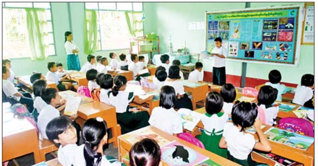
ဦးစီးဌာနမှ အသိပညာပေး နံရံကပ်စာစောင်များ၊ ဓာတ်ပုံများ ခင်းကျင်းပြသထားရာ ကျောင်းသား ကျောင်းသူများက စိတ်ပါဝင်စားစွာကြည့်ရှုလေ့လာခဲ့ကြကြောင်း သိရသည်။ ခရိုင်(ပြန်/ဆက်)

သထုံ ဇွန် ၁၆ မွန်ပြည်နယ် သထုံမြို့နယ် ပြန်ကြားရေးနှင့်ပြည်သူ့ဆက်ဆံရေးဦးစီးဌာနနှင့် ပညာရေးဌာနတို့ပူးပေါင်း၍ ယနေ့ မွန်းလွဲပိုင်းက သိမ်ကုန်းရပ်ကွက် အခြေခံပညာမူလတန်းလွန်ကျောင်း (ဦးဖြူ)၌ မူးယစ်ဆေးဝါးအန္တရာယ်တားဆီးကာကွယ်ရေး အသိပညာပေးဟောပြောပွဲ နံရံကပ်စာစောင်ပြပွဲနှင့် စာဖတ်စွမ်းရည်ပြိုင်ပွဲများ ပြုလုပ်သည်။ အခမ်းအနားတွင် ခရိုင်ပြန်ကြားရေးနှင့်ပြည်သူ့ဆက်ဆံရေးဦးစီးဌာနမှ ဝန်ထမ်းများက ကျောင်းသား ကျောင်းသူများ မူးယစ်ဆေးဝါးအန္တရာယ်သတိပြုကာကွယ်ရေး ဟောပြောဆွေးနွေးပြီး ကျောင်းသားကျောင်းသူများက စာဖတ်စွမ်းရည် ပုံပြင်ပြော၊ ကဗျာရွတ်ဆိုခြင်းတို့ကို ယှဉ်ပြိုင်ခဲ့ကြသည်။ အဆိုပါ အခမ်းအနားတွင် ပြန်ကြားရေးနှင့်ပြည်သူ့ဆက်ဆံရေး