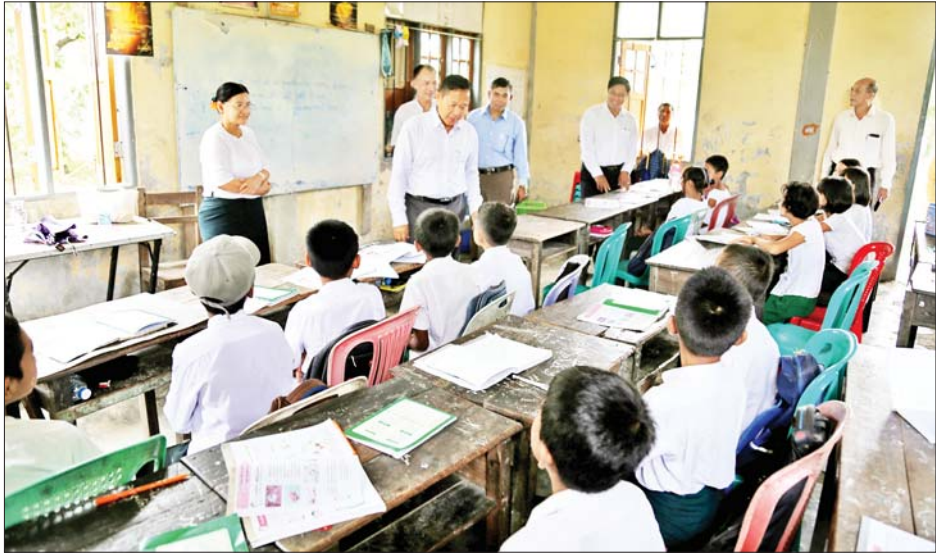
နိုင်ငံတော်စီမံအုပ်ချုပ်ရေးကောင်စီ ဒုတိယဥက္ကဋ္ဌ ဒုတိယဝန်ကြီးချုပ် ဒုတိယဗိုလ်ချုပ်မှူးကြီးစိုးဝင်း မင်းပြားမြို့ရှိ အခြေခံပညာအထက်တန်းကျောင်းတွင် ကျောင်းသား ကျောင်းသူများ တက်ရောက်ပညာ သင်ကြားနေမှုကို ကြည့်ရှုအားပေးစဉ်။