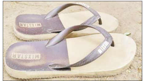
လယ်ဝေးမြို့မရဲစခန်းနှင့် MICC-II ဂိတ်(၂) ဝင်/ထွက်ပေါက်အား လက်ပစ်ဗုံးဖြင့်ပစ်ခတ်သည့်ဖြစ်စဉ်မှ တရားခံဝတ်ဆင်ခဲ့သည့် သက်သေခံပစ္စည်းများ မှတ်တမ်းဓာတ်ပုံ။