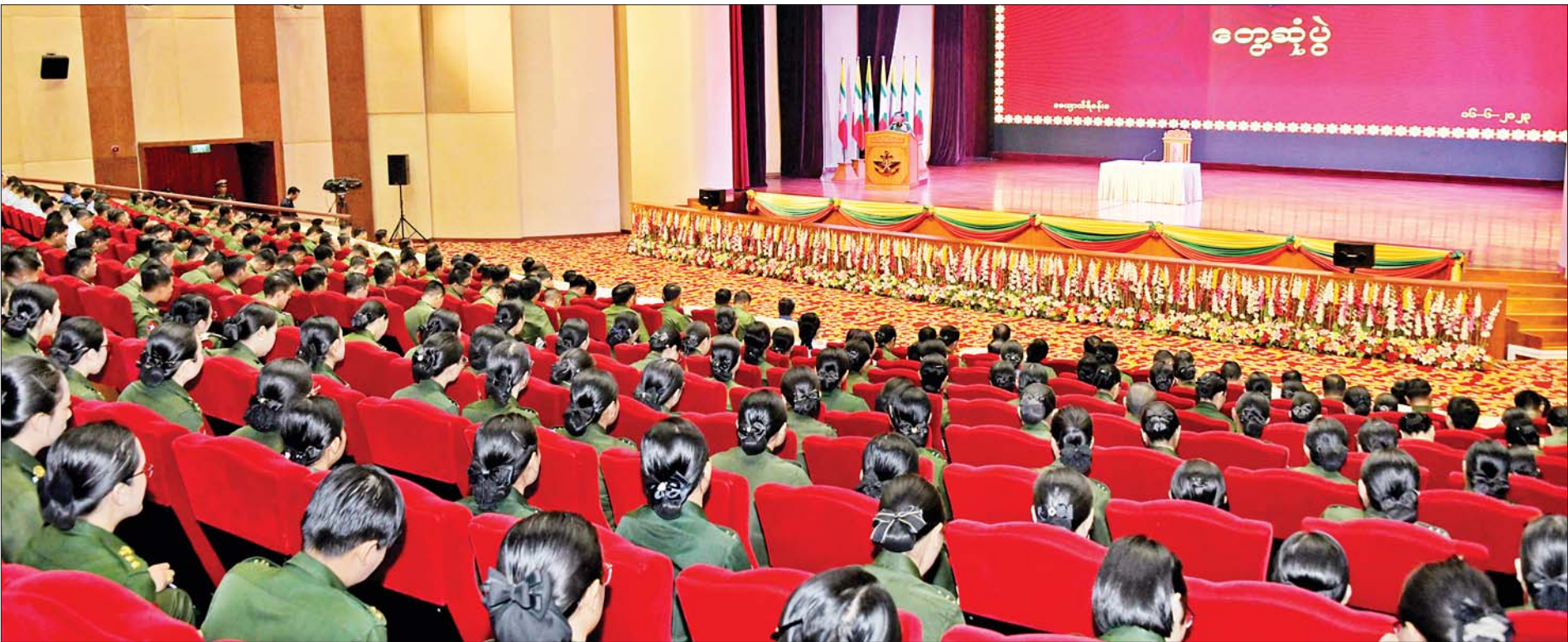
နိုင်ငံတော်စီမံအုပ်ချုပ်ရေးကောင်စီဥက္ကဋ္ဌ တပ်မတော်ကာကွယ်ရေးဦးစီးချုပ် ဗိုလ်ချုပ်မှူးကြီးမင်းအောင်လှိုင် ကာကွယ်ရေးဦးစီးချုပ်ရုံး(ကြည်း) ရုံး၊ ဌာနအသီးသီးမှ အရာရှိငယ်များအား တွေ့ဆုံအမှာစကားပြောကြားစဉ်။