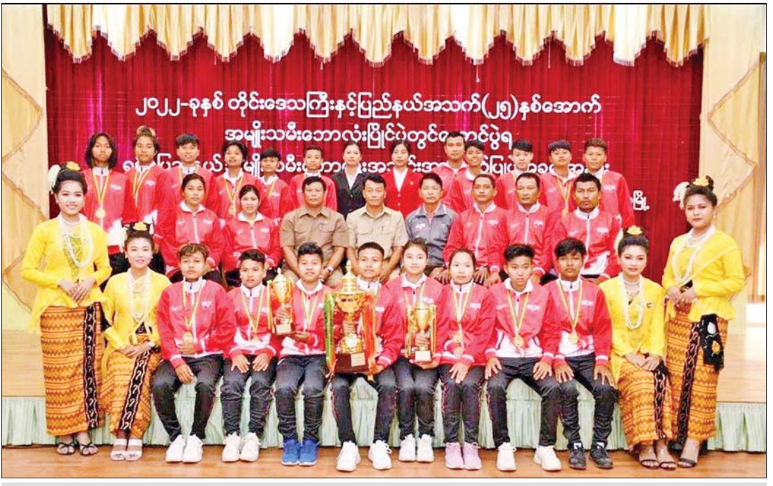
၂၀၂၂ ခုနှစ် ပြည်နယ်နှင့်တိုင်းဒေသကြီး အမျိုးသမီးဘောလုံးပြိုင်ပွဲ၌ ပထမတံဆိပ်ဆုရ ရခိုင်ပြည်နယ်အသင်း၏ အုပ်ချုပ်သူများနှင့် အားကစားသမားများကို တွေ့ရစဉ်။

အားကစားနှင့်လူငယ်ရေးရာဝန်ကြီး ဌာန၏ လမ်းညွှန်ချက်၊ ရခိုင်ပြည်နယ် အစိုးရအဖွဲ့၏ ကြီးကြပ်မှုဖြင့် ပြန်ကြား