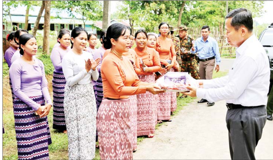
နိုင်ငံတော်စီမံအုပ်ချုပ်ရေးကောင်စီ ဒုတိယဥက္ကဋ္ဌ ဒုတိယဝန်ကြီးချုပ် ဒုတိယဗိုလ်ချုပ်မှူးကြီးစိုးဝင်း ကမ်းနီမြို့နယ် နယ်မြေခံတပ်ရင်းရှိ အရာရှိ စစ်သည်၊ မိသားစုများအတွက် စားသောက်ဖွယ်ရာများပေးအပ်စဉ်။

မုန်တိုင်းဒဏ်ကြောင့် ထိခိုက် များပြားနေသည့် မြို့နယ်များ၏ ပျက်စီးဆုံးရှုံး ခဲ့ရသည့် စာမျက်နှာ ၅ သို့ ❖