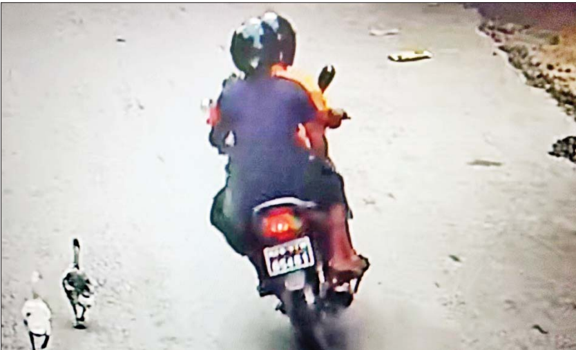
လယ်ဝေးမြို့မရဲစခန်းနှင့် MICC-II ဂိတ်(၂) ဝင်ပေါက်အား လက်ပစ်ဗုံးဖြင့်ပစ်ခတ်သည့် ဖြစ်စဉ်မှ တရားခံနှစ်ဦး၏ CCTV မှတ်တမ်းဓာတ်ပုံ။