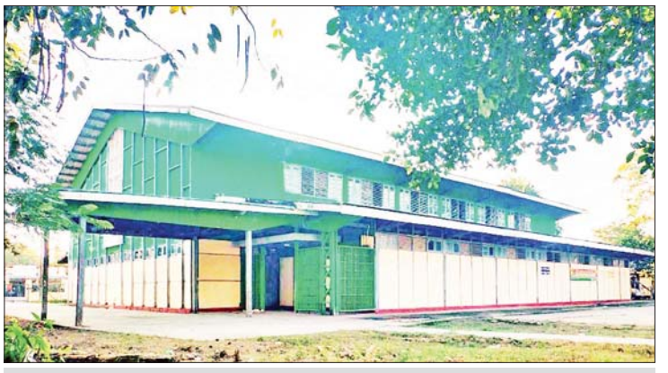
ရခိုင်ပြည်နယ် စစ်တွေမြို့ရှိ မိုးလုံလေလုံအားကစားခန်းမကြီး။

၂၀၂၃-၂၀၂၄ ခုနှစ် အားကစားနှင့် ကာယပညာဦးစီးဌာနက ကျင်းပပြုလုပ် မည့် အားကစားနည်း ၂၃ နည်း၊ အားကစားပြိုင်ပွဲ ၂၅ မျိုးတွင် ရခိုင် ပြည်နယ်အနေဖြင့် အားကစားနည်း ၁၉ နည်း ပါဝင်ယှဉ်ပြိုင်မည်ဖြစ်သည်။ တင်းနစ်နှင့် U-18 ပြေးခုန်ပစ်ပြိုင်ပွဲ များကို ကျင်းပပြီးစီးခဲ့ရာ ပြေးခုန်ပစ် တွင် ရွှေတစ်ခု၊ ငွေတစ်ခု၊ ကြေးတစ်ခု ရရှိခဲ့သည်။ ရခိုင်ပြည်နယ်တွင် မှီခါ မုန့်တိုင်း ဝင်ရောက်တိုက်ခတ်ပြီးနောက် ပြန်လည်ထူထောင်ရေးလုပ်ငန်းများကို မြို့နယ်အလိုက် အားသွန်ခွန်စိုက် ကြိုးပမ်း ဆောင်ရွက်ပေးနေသည်။ ထိုအထဲတွင် အားကစားကဏ္ဍ ဖွံ့ဖြိုး တိုးတက်ရေးအတွက်လည်း အထူး အလေးထား၍ ပြုပြင်စရာရှိသည်များကို ပြုပြင်၊ ပြိုင်စရာရှိသည်များကို ဇွဲ၊ စိတ်ဓာတ်ခိုင်မာစွာဖြင့် သွားရောက် ယှဉ်ပြိုင်လျက်ရှိသည်။ ရခိုင်ပြည်နယ် အားကစားလောက ဖွံ့ဖြိုးတိုးတက် အောင် ဆောင်ရွက်ပေးခြင်းသည် ရခိုင် လူငယ်ထု၏ စိတ်ပိုင်း၊ ရုပ်ပိုင်းဆိုင်ရာ ဖွံ့ဖြိုးတိုးတက်လာအောင် ဆောင်ရွက် ခြင်းပင်ဖြစ်၏။ ရှေးရှေးက မြန်မာ့ လက်ရွေးစင်ကြီးများ၊ ယနေ့ခေတ် အောင်မြင်နေသော ရခိုင်တိုင်းရင်းသား၊ တိုင်းရင်းသူမျိုးဆက်သစ် အားကစား သမားများကို အတူယူလျက် နိုင်ငံ့ဂုဏ် ဆောင်၊ ပြည်နယ်ဂုဏ်ဆောင် လူငယ် လူရွယ်များစွာ ထပ်မံပေါ်ထွက်မည်ဟု အလေးအနက်ယုံကြည်မိပါသည်။ ။