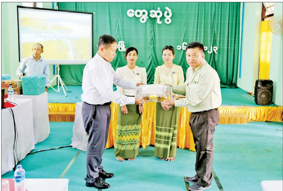
နိုင်ငံတော်စီမံအုပ်ချုပ်ရေးကောင်စီ ဒုတိယဥက္ကဋ္ဌ ဒုတိယဝန်ကြီးချုပ် ဒုတိယဗိုလ်ချုပ်မှူးကြီးစိုးဝင်း မင်းပြားမြို့နယ်ရှိ ဌာနဆိုင်ရာများ၊ ကူညီကယ်ဆယ်ရေးအဖွဲ့များနှင့် ပရဟိတအဖွဲ့များအား စားသောက် ဖွယ်ရာများပေးအပ်စဉ်။

မုန်တိုင်းကြောင့် ထိခိုက်မှု ပြင်းထန်သောမြို့များ၌ ကုန်ထုတ် လုပ်ငန်းများနှင့် ဝန်ဆောင်မှု လုပ်ငန်းများတွင်လည်း ထိခိုက် မှုများ ဖြစ်ပေါ်ခဲ့ရာထိခိုက်မှု မပြင်းထန်သော မြို့များအနေဖြင့် မိမိဒေသ၏ အားသာချက်ကို အသုံးပြု၍ ကုန်ထုတ်မှုစွမ်းအားကို ပုံမှန် အခြေအနေထက်ပို၍ မြှင့်တင် လုပ်ဆောင်ရန်လို