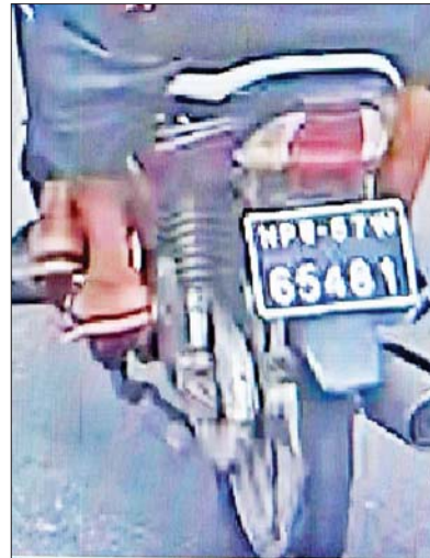
တရားခံများ စီးနင်းသည့် ဆိုင်ကယ်မှတ်တမ်းဓာတ်ပုံ။