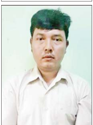
ရန်နိုင်ထွန်း (အငှားယာဉ်မောင်း)