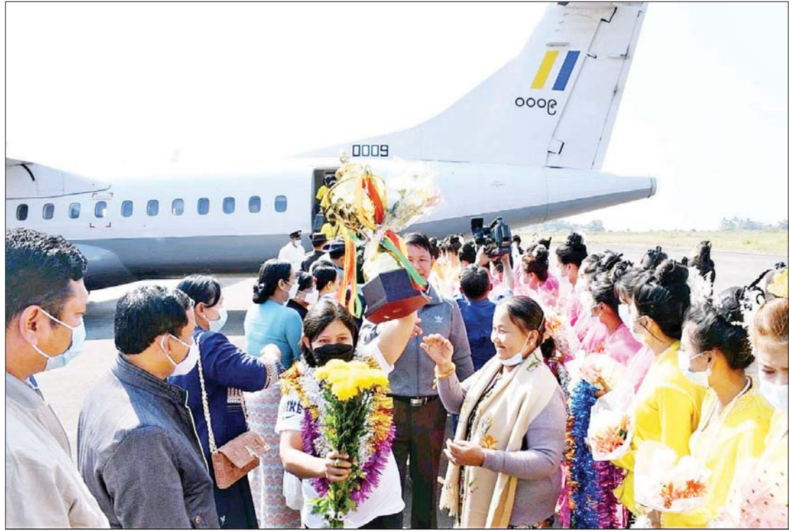
၂၀၂၂ ခုနှစ် ပြည်နယ်နှင့်တိုင်းဒေသကြီး အမျိုးသမီးဘောလုံးပြိုင်ပွဲ၌ ပထမဆုရ ခံစားရခိုင်ပြည်နယ်အသင်းအား စစ်တွေလေဆိပ်တွင် သောင်းသောင်းဖြဖြ ကြိုဆိုကြစဉ်။