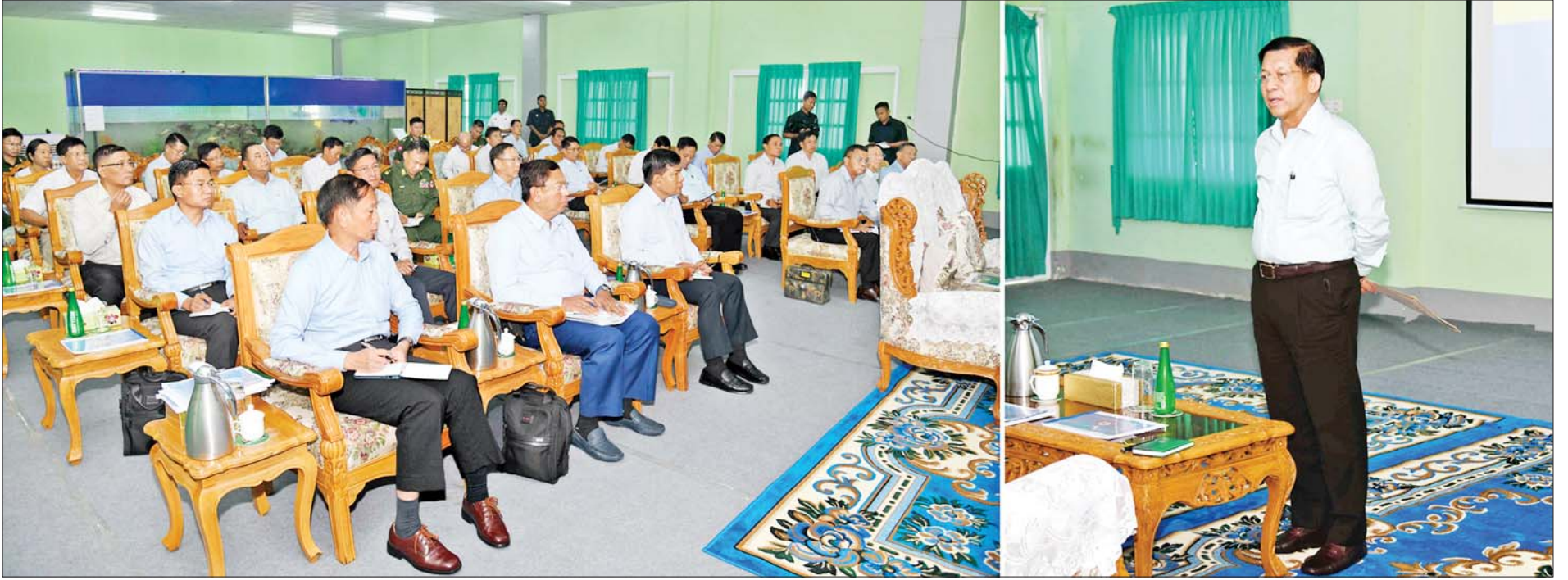
နိုင်ငံတော်စီမံအုပ်ချုပ်ရေးကောင်စီဥက္ကဋ္ဌ နိုင်ငံတော်ဝန်ကြီးချုပ် ဗိုလ်ချုပ်မှူးကြီးမင်းအောင်လှိုင် သီလဝါဘက်စုံစိုက်ပျိုးမွေးမြူရေးဇုန် အကောင်အထည်ဖော်ဆောင်ရွက်နေမှုအခြေအနေများနှင့် ပတ်သက်၍ တာဝန်ရှိသူများအား လိုအပ်သည်များမှာကြားစဉ်။

☆ ရှေ့ဖိုးမှ လုပ်ငန်းများဆောင်ရွက်ထားရှိမှုနှင့် သား၊ ငါး ထုတ်လုပ်မှုအပေါ် စားသုံး နိုင်မှု အခြေအနေများ၊ ရန်ကုန်တိုင်းစစ်ဌာနချုပ်၏ စိုက်ပျိုးမွေးမြူရေး လုပ်ငန်းများ ဆောင်ရွက်လျက်ရှိမှုအခြေအနေများ၊ နိုင်ငံတော်စီမံ အုပ်ချုပ်ရေးကောင်စီဥက္ကဋ္ဌ နိုင်ငံတော်ဝန်ကြီးချုပ်၏ လမ်းညွှန်ချက် များကို အကောင်အထည်ဖော်ဆောင်ရွက်နေမှု အခြေအနေများနှင့် ပတ်သက်၍ အသီးသီးရှင်းလင်းတင်ပြကြသည်။