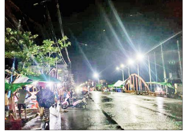
စစ်တွေမြို့ပေါ်ရပ်ကွက်များသို့ ဓာတ်အားဖြန့်ဖြူးပေးထားမှုကို တွေ့ရစဉ်။