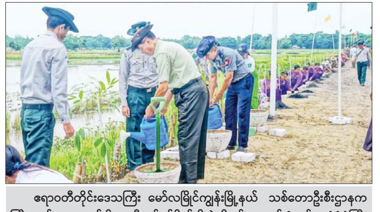
ရာဇဝင်တိုင်းဒေသကြီး မော်လမြိုင်ကျွန်းမြို့နယ် သစ်တောဦးစီးဌာနက ကြီးမှူး၍ ၂၀၂၃ ခုနှစ် မိုးရာသီသစ်ပင်စိုက်ပျိုးပွဲကို ဇွန် ၁၀ ရက် နံနက်က ပုံဂပုံကြီးကျေးရွာအုပ်စု ကျေးရွာချင်းဆက်လမ်းပေါ်တွင်ပြုလုပ်ရာ ပျိုးပင်ပေါင်း ၅၀၀ ကို စုပေါင်းစိုက်ပျိုးကြစဉ်။ မြို့နယ်(ပြန်/ဆက်)

အရှိန်ကြောင့် လေပြင်းတိုက်ခတ်ခြင်း၊ မိုးကြီးခြင်း၊ ရုတ်တရက် ရေကြီးခြင်းနှင့်အတူ မြေပြိုခြင်းများ ဖြစ်ပေါ်နိုင်ပါသဖြင့် ကုန်းမြင့်ဒေသအနီးတွင် နေထိုင်ကြသူများအနေဖြင့် မြေပြိုမှုအန္တရာယ်ကို လည်းကောင်း၊ မြစ်ငယ်၊ ချောင်းငယ်များအနီးတွင် နေထိုင်ကြသူများအနေဖြင့် ရေကြီး၊ ရေလျှံမှုများဖြစ်ပေါ်နိုင်သောကြောင့် ကြိုတင်သတိပြုနေထိုင်ကြပါရန်နှင့် ပြည်တွင်းလေကြောင်းပျံသန်းရေးနှင့် မြန်မာ့ကမ်းရိုးတန်းတစ်လျှောက်နှင့် ကမ်းလွန်ပင်လယ်ပြင်တို့ရှိ ကမ်းနီး၊ ကမ်းဝေး ငါးဖမ်းရေယာဉ်များ၊ သင်္ဘောများအနေဖြင့်လည်း ကြိုတင်သတိပြုနိုင်ပါရန် အသိပေးနှိုးဆော်အပ်ပါသည်။ မိုး/ဇလ