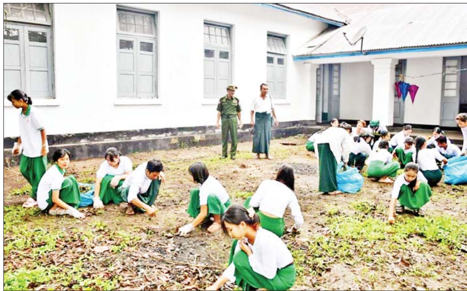
များနှင့်အတူ အမှတ်(၃)အခြေခံပညာအထက်တန်းကျောင်းအတွင်း/အပြင် စုပေါင်းသန့်ရှင်းရေးဆောင်ရွက်နေခြင်းနှင့် မြို့အဝင်ကားလမ်းတစ်လျှောက်အနီးပင်စိုက်ပျိုးနိုင်ရေးအတွက် စုပေါင်းမြေနေရာ

ထိုသို့ ပြန်လည်ထူထောင်ရေးလုပ်ငန်းများ ဆောင်ရွက်ရန်အတွက် ခန့်အပ်တာဝန်ပေးအပ်ထားရှိရာ ယနေ့တွင်ကျောက်ဖြူမြို့သို့ ရောက်ရှိနေသည့် ကာကွယ်ရေးဦးစီးချုပ်ရုံး(ကြည်း)မှ ဒုတိယဗိုလ်ချုပ်ကြီးလူအေးသည် ဌာနဆိုင်ရာတာဝန်ရှိသူများနှင့်အတူ အမှတ်(၃)အခြေခံပညာအထက်တန်းကျောင်းအတွင်း/အပြင် စုပေါင်းသန့်ရှင်းရေးဆောင်ရွက်နေခြင်းနှင့် မြို့အဝင်ကားလမ်းတစ်လျှောက်အနီးပင်စိုက်ပျိုးနိုင်ရေးအတွက် စုပေါင်းမြေနေရာ