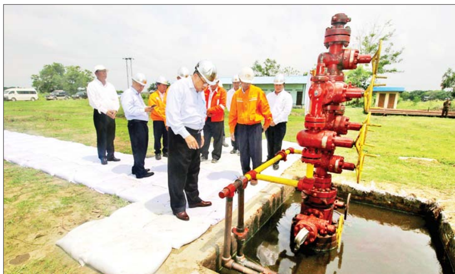
အတွင်း အချိန်မီပြီးစီးရေးနှင့် သဘာဝဓာတ်ငွေ့စဉ်ဆက်မပြတ် ပို့လွှတ်နိုင်ရေးလုပ်ငန်းများကို ကြိုးပမ်းဆောင်ရွက်ကြရန် မှာကြားပြီး ဝန်ထမ်းများအား သစ်သီးခြင်းနှင့် အင်အားဖြည့်အစားအစာများ ပေးအပ်သည်။ ထို့နောက် ပြည်ထောင်စုဝန်ကြီးသည်

စွမ်းအင်ဝန်ကြီးဌာန ပြည်ထောင်စုဝန်ကြီး ဦးမျိုးမြင့်ဦးသည် ရောဂါတိုင်းဒေသကြီးအတွင်းရှိ ညောင်တုန်း-မအူပင် ရေနံနှင့်သဘာဝဓာတ်ငွေ့မြေ၊ သဘာဝဓာတ်ငွေ့ပိုက်လိုင်းများ ပြုပြင်ပြီးစီးမှုအခြေအနေကို ယနေ့တွင် သွားရောက်ကြည့်ရှုစစ်ဆေးသည်။