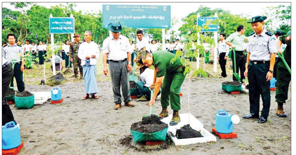
ကြပြီး ပိတောက်ပင် ၁၅၀၊ ကိုကော်ပင် ၁၅၀၊ သင်္ဘောပင် ၁၀၀၊ ခရေပင် ၁၀၀ စသည့် ပျိုးပင်ပေါင်း ၅၀၀ ကို သတ်မှတ်နေရာများတွင် စုပေါင်းစိုက်ပျိုးခဲ့ကြောင်း သိရသည်။ ခရိုင်(ပြန်/ဆက်)

အဆိုပါစုပေါင်းသစ်ပင်စိုက်ပွဲသို့ ဒေသကွပ်ကဲရေးမှူးနှင့်တာဝန်ရှိသူများ၊ ခရိုင်စီမံအုပ်ချုပ်ရေးအဖွဲ့ဥက္ကဋ္ဌ၊ မြို့နယ်စီမံအုပ်ချုပ်ရေးအဖွဲ့ဥက္ကဋ္ဌနှင့် တာဝန်ရှိသူများ၊ ဆရာ ဆရာမများ၊ ခရိုင်နှင့်မြို့နယ်အဆင့်ဌာနဆိုင်ရာဝန်ထမ်းများ၊ မီးသတ်တပ်ဖွဲ့ဝင်များနှင့် ကျောင်းသား ကျောင်းသူများ တက်ရောက်ခဲ့