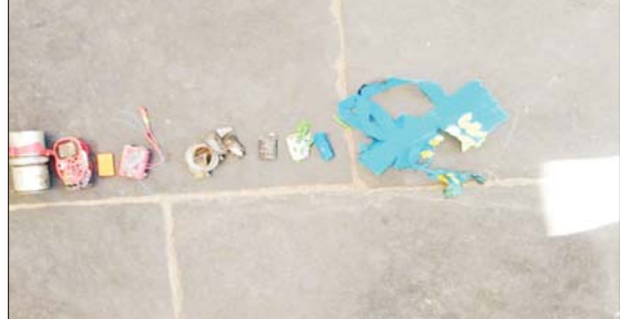
၂၀၂၂ ခုနှစ် ဇူလိုင် ၇ ရက်တွင် အလုံမြို့နယ် အုပ်ချုပ်ရေးမှူးရုံးအား လက်လုပ်ဗုံးဖြင့်ဖောက်ခွဲခဲ့သည့် မှတ်တမ်းဓာတ်ပုံ။

၂၀၂၂ ခုနှစ် ဇူလိုင် ၁၂ ရက်တွင် စမ်းချောင်းမြို့နယ် မြေနီကုန်းမီးပွိုင့် ယာဉ်ထိန်း ရဲရုံးအနီး ရီမုမိုင်းဖောက်ခွဲမှု ကြောင့် သေဆုံး/ ဒဏ်ရာရရှိခဲ့ သူများ၏ မှတ်တမ်းဓာတ်ပုံ များ။