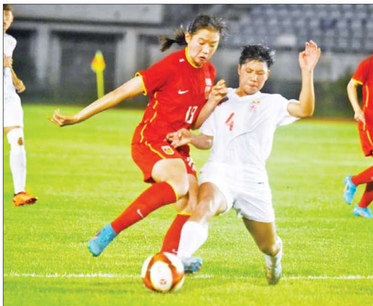
မြန်မာအသင်းနှင့် တရုတ်အသင်းတို့ ယှဉ်ပြိုင်ကစားကြစဉ်။