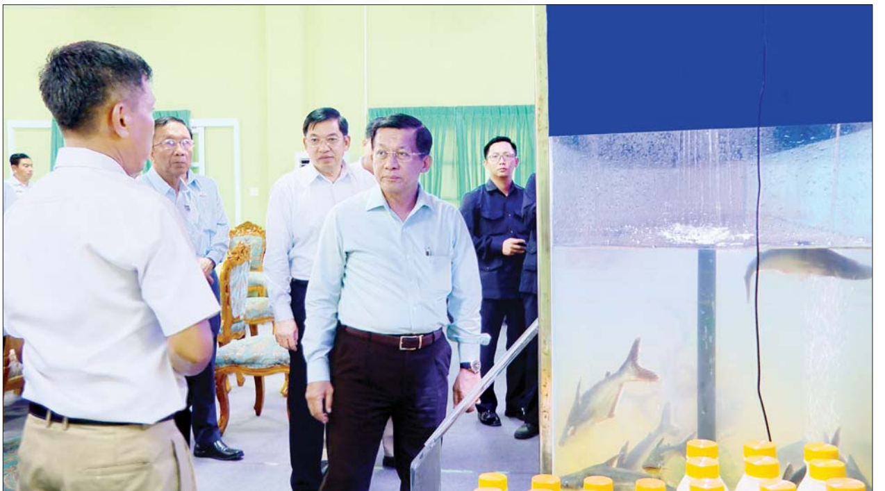
နိုင်ငံတော်စီမံအုပ်ချုပ်ရေးကောင်စီဥက္ကဋ္ဌ နိုင်ငံတော်ဝန်ကြီးချုပ် ဗိုလ်ချုပ်မှူးကြီးမင်းအောင်လှိုင် သီလဝါဘက်စုံစိုက်ပျိုးမွေးမြူရေး ဇုန်တွင် မွေးမြူထားရှိသည့် ငါးအမျိုးအစား နမူနာပြသထားရှိမှုများကို ကြည့်ရှုစဉ်။

ပြည်သူလူထုအနေဖြင့် အခြေခံစားသောက်ကုန်ပစ္စည်းများကို နေ့စဉ် မဖြစ်မနေဝယ်ယူစားသုံးနေရသောကြောင့် အခြေခံစားကုန်များ ဈေးနှုန်းကြီးမြင့်မှုမရှိစေရေး မိမိတို့အနေဖြင့် ကြိုးပမ်းဆောင်ရွက်လျက် ရှိကြောင်း၊ အစိုးရအနေဖြင့် နိုင်ငံစီးပွားမြှင့်တင်ရေးကို အလေးထား