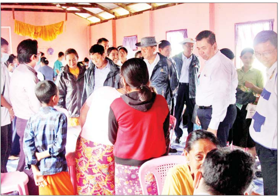
ပြည်ထောင်စုဝန်ကြီး ဒုတိယဗိုလ်ချုပ်ကြီး ထွန်းထွန်းနောင်နှင့် တာဝန်ရှိသူများ စစ်တွေမြို့ သင်ပုန်းတန်းကျေးရွာတွင် အထူးကုဆရာဝန်ကြီးများ ကွင်းဆင်းဆေးကုသနေမှုကို ကြည့်ရှုအားပေးစဉ်။

တို့ကိုမေးမြန်းကာ ဝန်ထမ်းများအား ကြက်ဥ၊ ခေါက်ဆွဲခြောက်နှင့် စားသောက်ဖွယ်ရာများ ချီးမြှင့်ပေးအပ်သည်။ ထို့နောက် ပြည်တော်သာ ရပ်ကွက်ရှိ ဆည်မြောင်းနှင့် ရေအသုံးချမှုစီမံခန့်ခွဲရေး ဦးစီးဌာန ဝန်ထမ်းအိမ်ရာနှင့် မင်းဂရပ်ကွက် ရှိ နယ်စပ်ဒေသနှင့် တိုင်းရင်းသား လူမျိုးများ ဖွံ့ဖြိုးတိုးတက်ရေး ဦးစီးဌာန ဝန်ထမ်းအိမ်ရာတို့သို့ သွားရောက်၍ ဝန်ထမ်းအိမ်ရာများ ပြန်လည်ပြုပြင်ပြီးစီးမှု အခြေအနေကို ကြည့်ရှုစစ်ဆေးပြီး ဝန်ထမ်းများအား ကြက်ဥ၊ ခေါက်ဆွဲခြောက်နှင့် စားသောက်ဖွယ်ရာများ ချီးမြှင့်ပေးအပ်ကာ ရင်းရင်းနှီးနှီးနှုတ်ဆက်၍ အားပေးစကားပြောကြားသည်။ ယင်းနောက် ဒုတိယဗိုလ်ချုပ်ကြီး ထွန်းထွန်းနောင်နှင့် အဖွဲ့သည် စစ်တွေမြို့နယ် သင်ပုန်းတန်းကျေးရွာ သင်ပုန်းတန်းကျောင်း တိုက်သို့ ရောက်ရှိကြပြီး စစ်တွေမြို့ ပြည်သူ့ဆေးရုံကြီးမှ အထူးကုဆရာဝန်ကြီးများနှင့် ဒုတင်(၅၀) ဆုံ စစ်တွေတိုင်းရင်းဆေးရုံမှ သမားတော်ကြီးများ မြေပြင်ကွင်းဆင်း၍ ပြည်သူလူထုအား ကျန်းမာရေး စောင့်ရှောက်မှု လုပ်ငန်းများ ဆောင်ရွက်ပေးနေမှု နှင့် ကျန်းမာရေး အသိပညာပေးနေမှုတို့ကို ကြည့်ရှုအားပေးကြသည်။