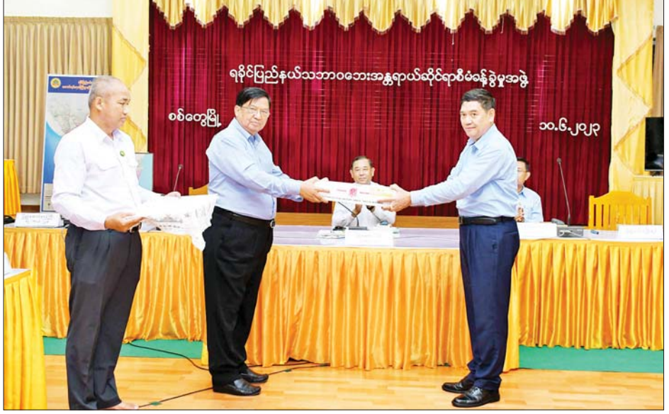
ပြည်ထောင်စုဝန်ကြီး ဒေါက်တာချာလီသန်း မြန်မာနိုင်ငံ ဆေးဝါးစက်ရုံထုတ် ဆေးများအား လေဘေးသင့်ပြည်သူများ ကျန်းမာရေးစောင့်ရှောက်မှုလုပ်ငန်းများတွင် အသုံးပြုနိုင်ရန်အတွက် ပေးအပ်လှူဒါန်းစဉ်။

မရှိစေရေးနှင့် စနစ်တကျ အမှိုက်စွန့်ပစ်သည့် အလေ့အကျင့်ကောင်းများ ဖြစ်ထွန်းစေရေး ပညာပေးဆောင်ရွက်သွားရန် ဖြည့်စွက်ဆွေးနွေးရာကြားပြီး လိုအပ်သည်များ ပေါင်းစပ်ညှိနှိုင်း ဖြည့်ဆည်းဆောင်ရွက်ပေးကာ အစည်းအဝေးကို ရုပ်သိမ်းလိုက်သည်။ ညနေပိုင်းတွင် စက်မှုဝန်ကြီးဌာန ပြည်ထောင်စုဝန်ကြီး ဒေါက်တာချာလီသန်းက မုန်တိုင်းဒဏ်သင့်ဒေသများရှိ ပြည်သူများ၏ ကျန်းမာရေးစောင့်ရှောက်မှု လုပ်ငန်းများတွင် အသုံးပြုရန် စက်မှုဝန်ကြီးဌာန ဆေးဝါးစက်ရုံ (အင်းစိန်)မှ ထုတ်လုပ်သည့် ဆေးဝါးများကို လာရောက်လှူဒါန်းရာ ပြည်နယ်ဝန်ကြီးချုပ် ဦးထိန်လင်းက လက်ခံရယူပြီး ကျေးဇူးတင်စကား ပြန်လည်ပြောကြားသည်။ လျှပ်စစ်စွမ်းအားဝန်ကြီးဌာန အနေဖြင့် ရခိုင်ပြည်နယ်အတွင်း လျှပ်စစ်ဓာတ်အား အမြန်ပြန်လည်ရရှိစေရေးအတွက် မေ ၁၈ ရက်မှ စတင်၍ လူအင်အား၊ စက်ယန္တရား အင်အားများစုဖွဲ့ပြီး အင်တိုက်အားတိုက် ဆောင်ရွက်ခဲ့ရာ ၂၃၀ ကေဗီ အမ်း-မြောက်ဦး- ပုဏ္ဏားကျွန်း ဓာတ်အားလိုင်းနှင့် ၆၆ ကေဗီ ပုဏ္ဏားကျွန်း-စစ်တွေ ဓာတ်အားလိုင်းတို့ကို ဇွန် ၇ ရက်တွင် ရာနန်းပြည့် ပြီးစီးအောင် ဆောင်ရွက်နိုင်ခဲ့သဖြင့် စစ်တွေမြို့နှင့် ပုဏ္ဏားကျွန်းမြို့တို့၌ မေ ၇ ရက်ညပိုင်းမှ စတင်၍ လျှပ်စစ်ဓာတ်အား ပြန်လည်ဖြန့်ဖြူးပေးနိုင်ခဲ့ပြီဖြစ်သည်။ ဆောင်ရွက်ရန် ကျန်ရှိသည့် ၆၆ ကေဗီ ပုဏ္ဏားကျွန်း-ကျောက်တော်၊ ပုဏ္ဏားကျွန်း-မြောက်ဦး၊ ပုဏ္ဏားကျွန်း-ရသေ့တောင်၊ ရသေ့တောင် - ဘူးသီးတောင် ဓာတ်အားလိုင်း ပြင်ဆင်ရေး လုပ်ငန်းများကို ဆက်လက်ဆောင်ရွက်လျက်ရှိရာ ဇွန်လစတုတ္ထပတ်နှင့် ဇူလိုင်လပထမပတ်တို့တွင် ရာနန်းပြည့် ပြီးစီးမည်ဖြစ်၍ မြို့နယ်အားလုံးသို့ လျှပ်စစ်ဓာတ်အားပြန်လည်ဖြန့်ဖြူးပေးနိုင်မည် ဖြစ်ကြောင်း သိရသည်။