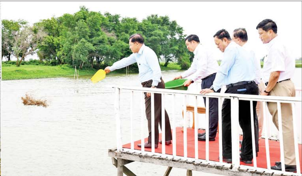
နိုင်ငံတော်စီမံအုပ်ချုပ်ရေးကောင်စီဥက္ကဋ္ဌ နိုင်ငံတော်ဝန်ကြီးချုပ် ဗိုလ်ချုပ်မှူးကြီးမင်းအောင်လှိုင် သီလဝါဘက်စုံစိုက်ပျိုးမွေးမြူရေးဇုန်အတွင်း ငါးများမွေးမြူထားမှုကို ကြည့်ရှုစစ်ဆေးစဉ်။