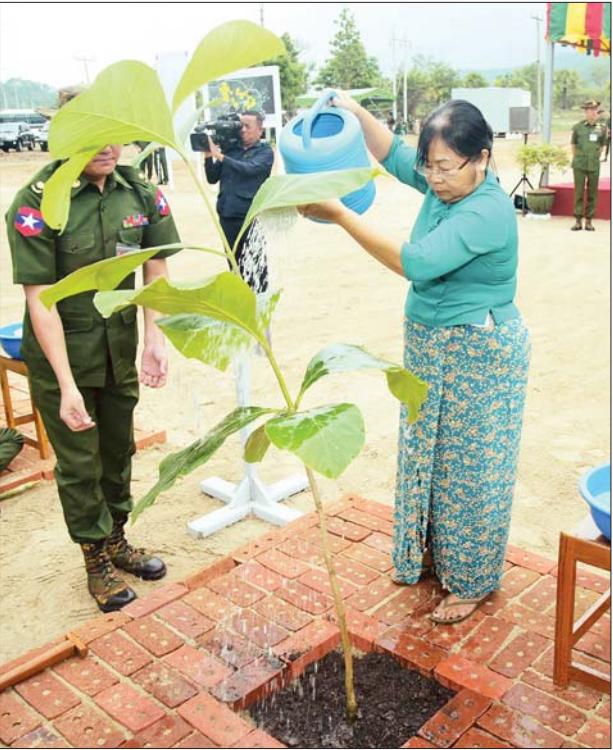
နိုင်ငံတော်စီမံအုပ်ချုပ်ရေးကောင်စီ ဒုတိယဥက္ကဋ္ဌ ဒုတိယ တပ်မတော်ကာကွယ်ရေးဦးစီးချုပ် ကာကွယ်ရေးဦးစီးချုပ် (ကြည်း) ဒုတိယဗိုလ်ချုပ်မှူးကြီးစိုးဝင်း၏ ဇနီး ဒေါ်သန်းသန်းနွယ် ရတနာတန်းဝင်ကျွန်းပင်ကို စိုက်ပျိုးပေးစဉ်။