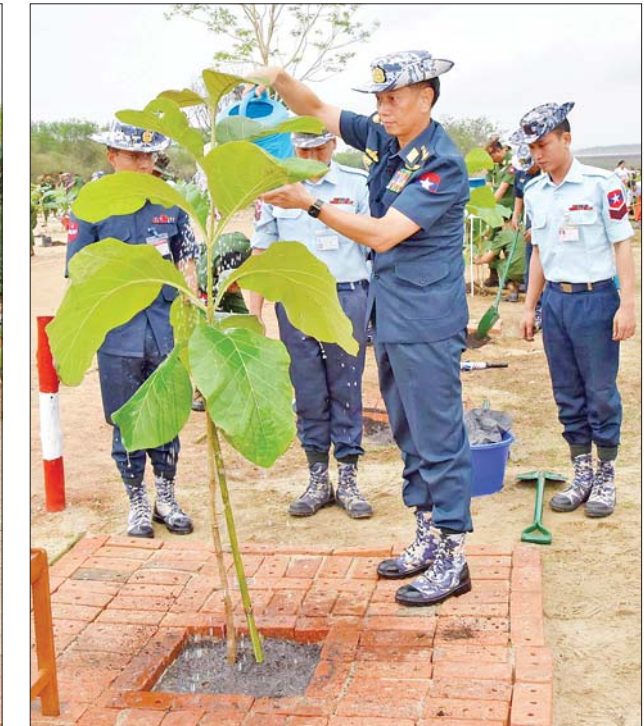
ကာကွယ်ရေးဦးစီးချုပ်(လေ) ဗိုလ်ချုပ်ကြီးထွန်းအောင် ရတနာတန်းဝင်ကျွန်းပင်ကို စိုက်ပျိုးပေးစဉ်။