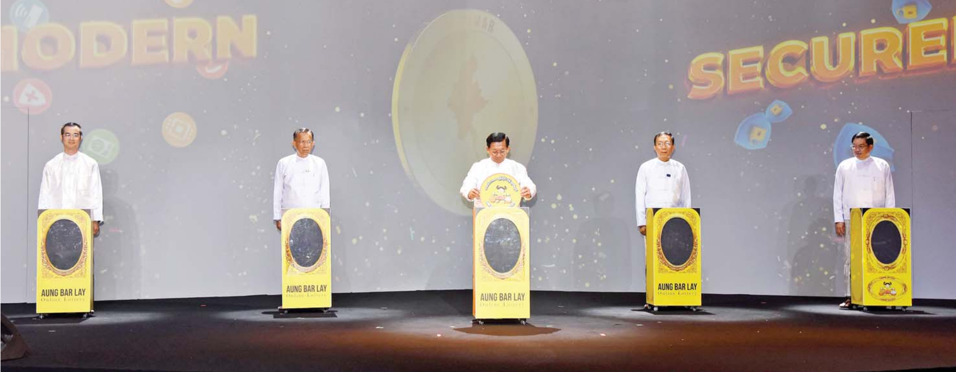
နိုင်ငံတော်စီမံအုပ်ချုပ်ရေးကောင်စီဥက္ကဋ္ဌ နိုင်ငံတော်ဝန်ကြီးချုပ် ဗိုလ်ချုပ်မှူးကြီးမင်းအောင်လှိုင် စုဘူးအတွင်းသို့ အောင်အတိတ်အောင်နိမိတ်ဆောင် အောင်မင်္ဂလာ ရွှေဒင်္ဂါးကိုထည့်သွင်း၍ အောင်ဘာလေ အွန်လိုင်းသိန်းဆုထိစနစ်သစ်ကြီးကို စတင်ဖွင့်လှစ်ပေးစဉ်။