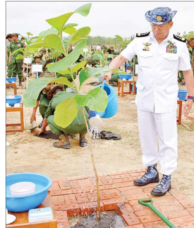
ကာကွယ်ရေးဦးစီးချုပ်(ရေ) ဗိုလ်ချုပ်ကြီးမိုးအောင် ရတနာတန်းဝင်ကျွန်းပင်ကို စိုက်ပျိုးပေးစဉ်။