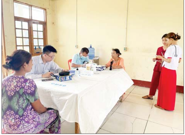
အထူးကုဆေးအဖွဲ့က ဒေသခံပြည်သူများအား ကျန်းမာရေးစောင့်ရှောက်မှုလုပ်ငန်းများ ဆောင်ရွက်ပေးနေစဉ်။