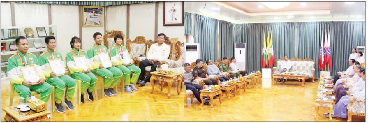
(၃၂)ကြိမ်မြောက် အရှေ့တောင်အာရှ အားကစားပြိုင်ပွဲတွင် ဆုတံဆိပ်များရရှိခဲ့သော ရခိုင်ပြည်နယ်ဂုဏ်ဆောင် အားကစားသမားများအား ထပ်ဆင့်ဂုဏ်ပြု ချီးမြှင့်ခြင်းအခမ်းအနားကျင်းပစဉ်။

ဆက်လက်၍ ဒုတိယဗိုလ်ချုပ်ကြီး ထွန်းထွန်းနောင်နှင့် ပြည်ထောင်စုဝန်ကြီးများ၊ ဒုတိယဝန်ကြီးများသည် ရခိုင်ပြည်နယ်