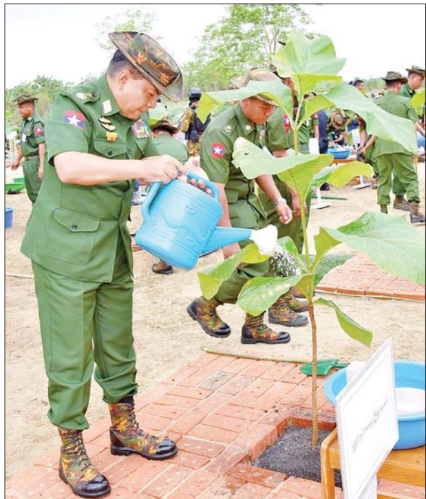
ညိုနှိုင်းကွပ်ကဲရေးမှူး(ကြည်း၊ ရေ၊ လေ) ဗိုလ်ချုပ်ကြီး မောင်မောင်အေး ရတနာတန်းဝင်ကျွန်းပင်ကို စိုက်ပျိုးပေးစဉ်။