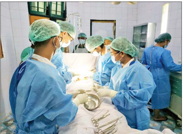
ပေါက်တော အထူးကုအဖွဲ့က ဒေသခံပြည်သူတစ်ဦးအား ခွဲစိတ်ကုသပေးနေစဉ်။