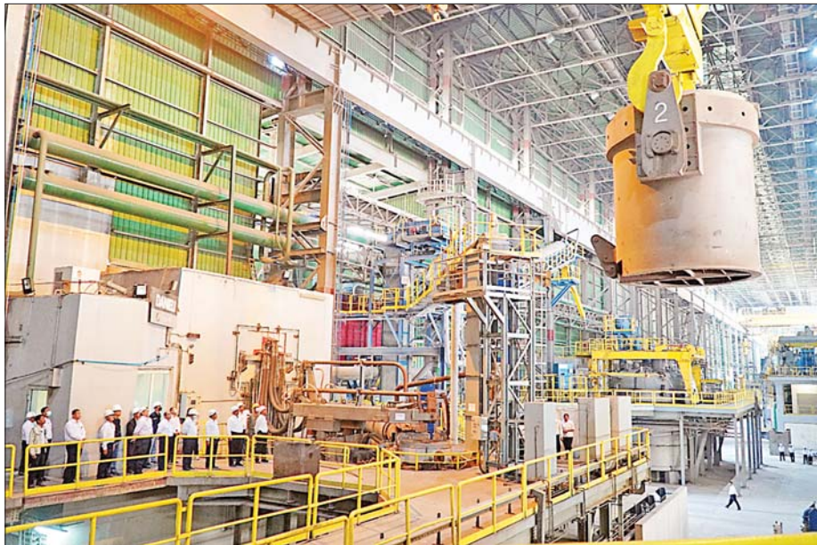
သံမဏိစက်ရုံ(မြင်းခြံ)ပြန်လည်လည်ပတ်နိုင်ရေးဆောင်ရွက်မှုများကို ဖေဖော်ဝါရီ ၁၅ ရက်က တာဝန်ရှိသူများ ကြည့်ရှုစစ်ဆေးစဉ်။

ပြန်ကြည့်မည်ဆိုပါက စမ့်မြစ်ဝှမ်းဒေသတွင် ကြေး ခေတ်၊ သံခေတ်တို့ကို ကျော်ဖြတ်ခဲ့သော သမိုင်း