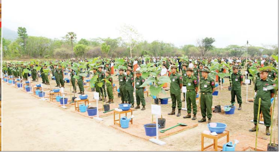
နိုင်ငံတော်စီမံအုပ်ချုပ်ရေးကောင်စီဥက္ကဋ္ဌ တပ်မတော်ကာကွယ်ရေးဦးစီးချုပ် ဗိုလ်ချုပ်မှူးကြီး မင်းအောင်လှိုင် ကာကွယ်ရေးဦးစီးချုပ်ရုံး(ကြည်း၊ ရေ၊ လေ) မိသားစုများ၏ ၂၀၂၃ ခုနှစ် ပထမအကြိမ် မိုးရာသီ သစ်ပင်စိုက်ပျိုးပွဲတွင် အမှာစကား ပြောကြားစဉ်။

နေပြည်တော် ဇွန် ၈ သဘာဝပတ်ဝန်းကျင်အား ထိန်းသိမ်း နိုင်စေရန်နှင့် ရာသီဥတုကို အထောက် အကူဖြစ်စေရန်၊ အရိပ်အာဝါသရရှိစေရန်၊ နိုင်ငံ့စီးပွားရေးအတွက် တစ်ဖက် တစ်လမ်းမှ အထောက်အကူဖြစ်စေရန် ရည်ရွယ်၍ ကာကွယ်ရေးဦးစီးချုပ်ရုံး (ကြည်း၊ ရေ၊ လေ) မိသားစုများနှင့် တိုင်းစစ်ဌာနချုပ်အသီးသီးတို့တွင် ၂၀၁၁ ခုနှစ်မှစ၍ နှစ်စဉ် မိုးရာသီ တစ်အုပ်တစ်မ သစ်ပင်စိုက်ပျိုးပွဲများ ပြုလုပ်လျက်ရှိ သည်။