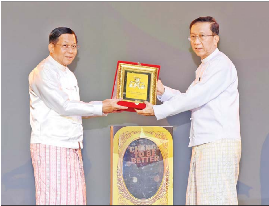
နိုင်ငံတော်စီမံအုပ်ချုပ်ရေးကောင်စီဥက္ကဋ္ဌ နိုင်ငံတော်ဝန်ကြီးချုပ် ဗိုလ်ချုပ်မှူးကြီး မင်းအောင်လှိုင်ထံ အောင်ဘာလေအွန်လိုင်းသိန်းဆုထိစနစ်ဖွင့်ပွဲ အထိမ်းအမှတ် Logo ကို ဒုတိယဝန်ကြီးချုပ်နှင့် ပြည်ထောင်စု ဝန်ကြီး ဦးဝင်းရှိန်က ပေးအပ်စဉ်။

ထို့နောက် နိုင်ငံတော်စီမံအုပ်ချုပ် ရေးကောင်စီဥက္ကဋ္ဌ နိုင်ငံတော် ဝန်ကြီးချုပ်က အဖွင့်အမှာစကား ပြောကြားရာတွင် ယနေ့ဖွင့်ပွဲ ပြုလုပ်ပြီး စတင်ဆောင်ရွက်မည့် “အောင်ဘာလေ” အွန်လိုင်းသိန်းဆု ထိစနစ် အကောင်အထည်ဖော် ရခြင်း၏ ရည်ရွယ်ချက်မှာ စီမံကိန်း နှင့် ဘဏ္ဍာရေးဝန်ကြီးဌာန ပြည်တွင်းအခွန်များဦးစီးဌာနက လက်ရှိ ကျင့်သုံးဆောင်ရွက်နေ သည့် အောင်ဘာလေသိန်းဆု ထိစနစ်များကို ပုံနှိပ်ပြီး ရောင်းချသည့် စနစ်အပြင် ပြောင်းလဲ တိုးတက်လာသည့် ခေတ်စနစ်နှင့်လိုက်လျောညီထွေမှု ရှိစေပြီး ထိကံစမ်းလိုသူ မိဘ ပြည်သူများအနေဖြင့် သတ်မှတ် ဈေးနှုန်းများအတိုင်း အွန်လိုင်းမှ လွယ်ကူစွာ ထိကံစမ်းနိုင်ရန် အတွက်ဖြစ်ပါကြောင်း၊ ယနေ့ အခမ်းအနားတွင် မြန်မာနိုင်ငံ၏ ပထမဦးဆုံး တရားဝင်အသုံးပြု တော့မည့် အောင်ဘာလေ