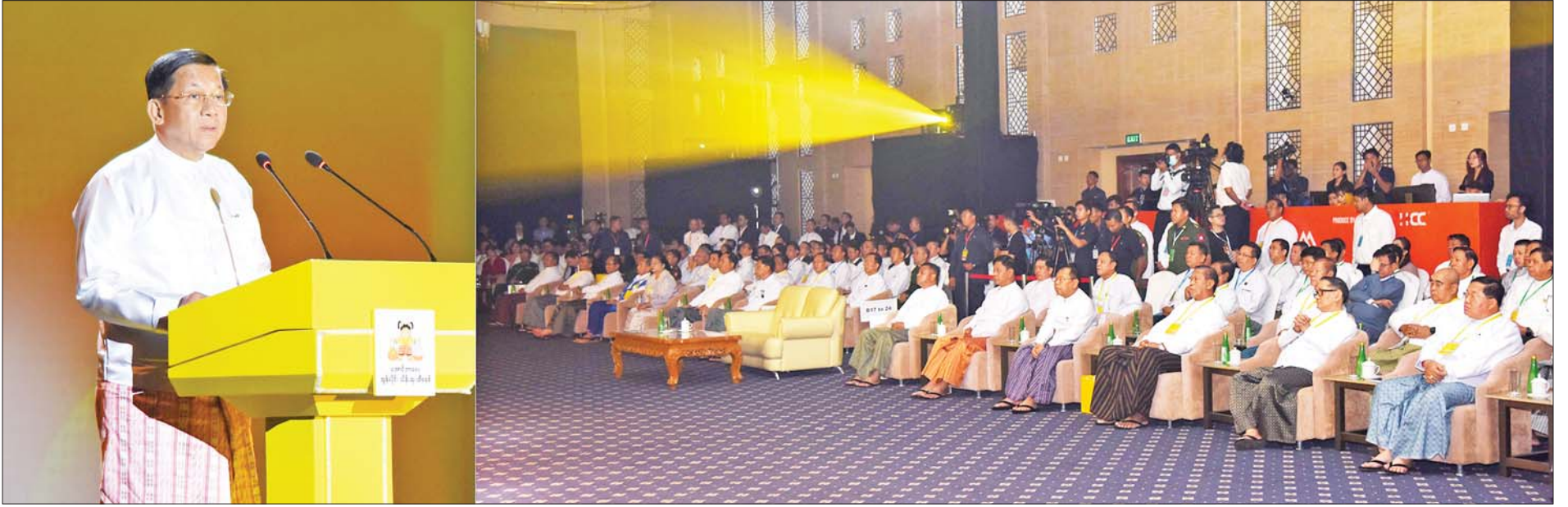
နိုင်ငံတော်စီမံအုပ်ချုပ်ရေးကောင်စီဥက္ကဋ္ဌ နိုင်ငံတော်ဝန်ကြီးချုပ် ဗိုလ်ချုပ်မှူးကြီးမင်းအောင်လှိုင် အောင်ဘာလေအွန်လိုင်းသိန်းဆုထိစနစ်စတင်ခြင်း ဖွင့်ပွဲအခမ်းအနားတွင် အမှာစကားပြောကြားစဉ်။