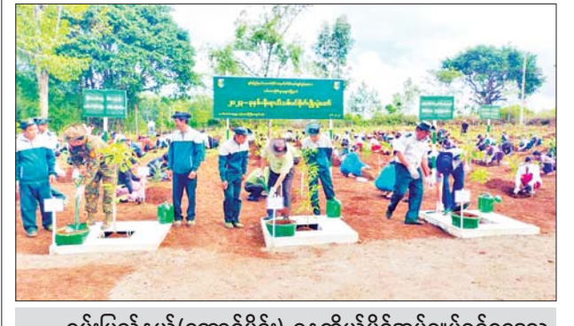
ရှမ်းပြည်နယ်(တောင်ပိုင်း) ဓနကိုယ်ပိုင်အုပ်ချုပ်ခွင့်ဒေသ စီမံအုပ်ချုပ်ရေးအဖွဲ့ဥက္ကဋ္ဌ၏ လမ်းညွှန်မှုဖြင့် ရွာငံမြို့နယ်၌ လူထုပူးပေါင်းပါဝင်သည့် ၂၀၂၃ ခုနှစ် မိုးရာသီသစ်ပင်စိုက်ပျိုးပွဲတော်ကို ဇွန် ၅ ရက်က လက်ပံပင်ကျေးရွာ ဘုန်းတော်ကြီးကျောင်းဝင်း၌ ကျင်းပရာ ကျွန်း၊ ခါတော်မီ၊ စိန်ပန်းနီ၊ စိန်ပန်းပြာ၊ ချယ်ရီ ဖျိုးပင်ပေါင်း ၃၀၀ အား စုပေါင်းစိုက်ပျိုးကြစဉ်။ မြို့နယ်(ပြန်/ဆက်)