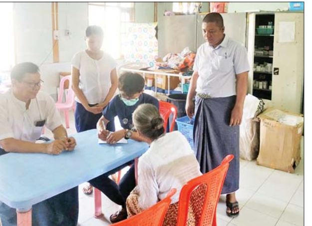
အထူးကုအဖွဲ့က ပေါက်တောဒေသခံပြည်သူများအား ကျန်းမာရေးစောင့်ရှောက်မှုလုပ်ငန်းများ ဆောင်ရွက်ပေးနေစဉ်။