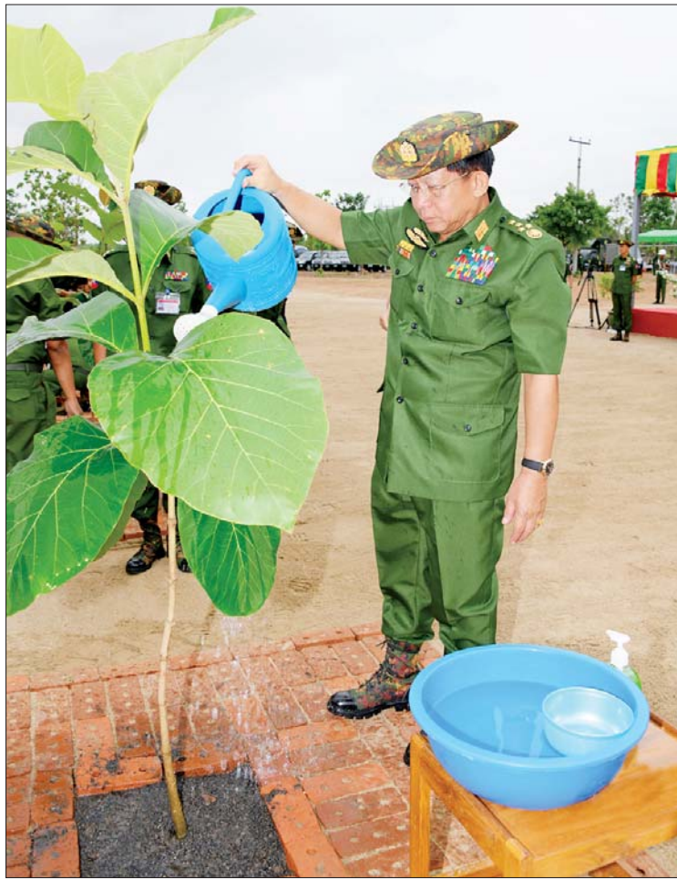
နိုင်ငံတော်စီမံအုပ်ချုပ်ရေးကောင်စီဥက္ကဋ္ဌ တပ်မတော်ကာကွယ်ရေးဦးစီးချုပ် ဗိုလ်ချုပ်မှူးကြီး မင်းအောင်လှိုင် ရတနာတန်းဝင်ကျွန်းပင်ကို ဦးဆောင်စိုက်ပျိုး ပေးစဉ်။

ဦးစွာ နိုင်ငံတော်စီမံအုပ်ချုပ်ရေး ကောင်စီဥက္ကဋ္ဌ တပ်မတော်ကာကွယ်ရေး