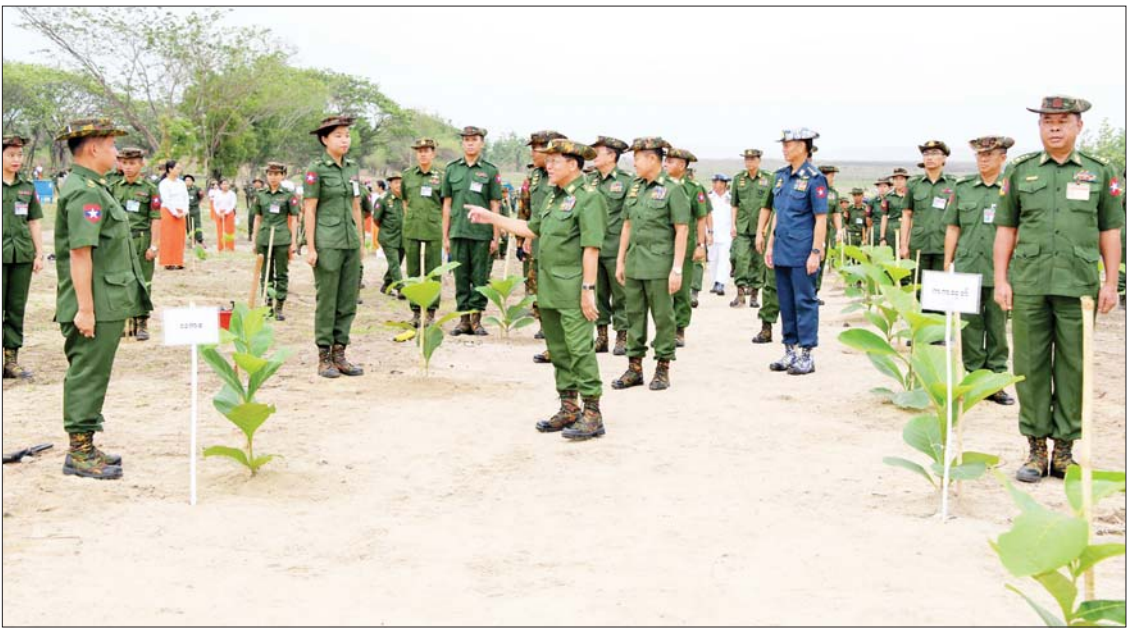
နိုင်ငံတော်စီမံအုပ်ချုပ်ရေးကောင်စီဥက္ကဋ္ဌ တပ်မတော်ကာကွယ်ရေးဦးစီးချုပ် ဗိုလ်ချုပ်မှူးကြီးမင်းအောင်လှိုင်နှင့် အဖွဲ့ဝင်များ အရာရှိစစ်သည်မိသားစုများ၏ စုပေါင်းသစ်ပင်စိုက်ပျိုးနေမှုကို ကြည့်ရှုအားပေးစဉ်။

အလားတူ တိုင်းစစ်ဌာနချုပ်နယ်မြေအသီးသီး၌လည်း မိုးရာသီသစ်ပင်စိုက်ပွဲများ ကျင်းပ၍ ရတနာတန်းဝင်ပင်၊