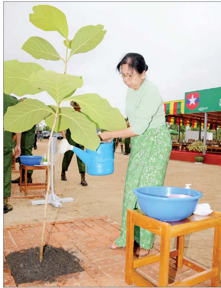
နိုင်ငံတော်စီမံအုပ်ချုပ်ရေးကောင်စီဥက္ကဋ္ဌ တပ်မတော်ကာကွယ်ရေးဦးစီးချုပ် ဗိုလ်ချုပ်မှူးကြီး မင်းအောင်လှိုင်၏ ဇနီး ဒေါ်ကြူကြူလှ ရတနာတန်းဝင်ကျွန်းပင်ကို ဦးဆောင်စိုက်ပျိုးပေးစဉ်။

ဦးစီးချုပ် ဗိုလ်ချုပ်မှူးကြီး မင်းအောင်လှိုင် က အမှာစကား ပြောကြားရာတွင် “သစ်တောနှင့် သစ်ပင် ချစ်ခင်သည့်လူမျိုး၊ သစ်ပင်ကို နှစ်စဉ်စိုက် ရွှေတိုက်ကိုစိုး” ဟူသည့် ဆောင်ပုဒ်အတိုင်း သစ်တောများ နှင့်သစ်ပင်များကို အမြတ်တနိုး တန်ဖိုး ထားပြီး ထိန်းသိမ်းစောင့်ရှောက်ခြင်းနှင့် ထပ်မံစိုက်ပျိုးခြင်းများသည် တိုင်းပြည် တစ်ပြည်အတွက် ကောင်းကျိုးများစွာကို ဖန်တီးပေးခြင်းပင်ဖြစ်ကြောင်း၊ ထို့ကြောင့် လည်း ၂၀၁၁ ခုနှစ်မှစ၍ တပ်မတော်အနေ ဖြင့် မိုးရာသီသစ်ပင်စိုက်ပျိုးပွဲတော်များ ကို နှစ်စဉ်ကျင်းပခဲ့သည်မှာ ယခုဆိုပါက ဆယ်စုနှစ်တစ်ခုကို ကျော်လွန်ခဲ့ပြီဖြစ် ကြောင်း၊ နိုင်ငံတော်၏ သစ်တော သယံဇာတများ ရေရှည်တည်တံ့စေရေး၊