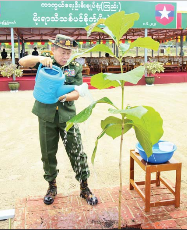
နိုင်ငံတော်စီမံအုပ်ချုပ်ရေးကောင်စီ ဒုတိယဥက္ကဋ္ဌ ဒုတိယ တပ်မတော်ကာကွယ်ရေးဦးစီးချုပ် ကာကွယ်ရေးဦးစီးချုပ် (ကြည်း) ဒုတိယဗိုလ်ချုပ်မှူးကြီးစိုးဝင်း ရတနာတန်းဝင်ကျွန်းပင်ကို စိုက်ပျိုးပေးစဉ်။

တိုင်းစစ်ဌာနချုပ်၌ ၈၇၆၁ ပင်၊ အလယ်ပိုင်းတိုင်းစစ်ဌာနချုပ်၌ အပင် ၃၇၈၈၀ နှင့် တောင်ပိုင်းတိုင်း စစ်ဌာနချုပ်၌ ၆၉၈၂ ပင်တို့ကို တိုင်းမှူးများနှင့် တာဝန်ရှိသူများက စုပေါင်းစိုက်ပျိုးခဲ့ကြပြီး တပ်မတော်တစ်ရပ်လုံးအနေဖြင့် ယနေ့တွင် စုစုပေါင်း သစ်ပင် ၂၁၀၃၉၈ ပင်ကို စိုက်ပျိုးခဲ့ကြကြောင်း သိရသည်။ သတင်းစဉ်