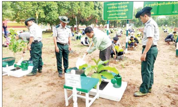
ရန်ကုန်တိုင်းဒေသကြီး တိုက်ကြီးခရိုင် စီမံအုပ်ချုပ်ရေးအဖွဲ့နှင့် တိုက်ကြီးမြို့နယ် သစ်တောဦးစီးဌာနတို့ ပူးပေါင်း၍ ၂၀၂၃ ခုနှစ် မိုးရာသီ သစ်ပင်စိုက်ပျိုးပွဲတော်ကို တိုက်ကြီးမြို့နယ် သနပ်ချောင်းကျေးရွာ မဟာဗောဓိ ဘုရားငါးဆူသာသနာရိပ်သာ၌ ဇွန် ၈ ရက်က ကျင်းပရာ ဖျိုးပင် ၁၀၀၀ ကို စုပေါင်းစိုက်ပျိုးကြစဉ်။ ဉာဏ်ဟိန်း

က အဖွင့်အမှာစကားပြောကြားသည်။ သင်တန်းတွင် ကံပုံကြီးနားကျေးရွာမှ သင်တန်းသား သင်တန်းသူ ၂၀ တက်ရောက်ကြပြီး သင်တန်းကာလ ငါးရက်အတွင်း စာတွေ့၊ လက်တွေ့ ပို့ချမည်ဖြစ်ကြောင်း သိရသည်။ ခရိုင်(ပြန်/ဆက်)