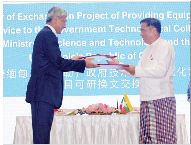
ပြည်ထောင်စုဝန်ကြီး ဒေါက်တာမျိုးသိန်းကျော်နှင့် မြန်မာနိုင်ငံဆိုင်ရာ တရုတ်နိုင်ငံသံအမတ်ကြီး H.E. Mr. Chen Hai တို့ သဘောတူညီချက်ကို လဲလှယ်ကြစဉ်။