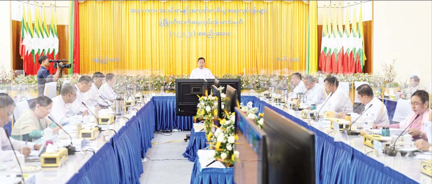
နိုင်ငံတော်စီမံအုပ်ချုပ်ရေးကောင်စီ ဒုတိယဥက္ကဋ္ဌ ဒုတိယဝန်ကြီးချုပ် ဒုတိယဗိုလ်ချုပ်မှူးကြီးစိုးဝင်း အသေးစား၊ အငယ်စားနှင့် အလတ်စားစီးပွားရေးလုပ်ငန်းများ ဖွံ့ဖြိုးတိုးတက်ရေး လုပ်ငန်းကော်မတီအစည်းအဝေး (၁/ ၂၀၂၃) တွင် အမှာစကားပြောကြားစဉ်။

နေပြည်တော် ဇွန် ၈ အသေးစား၊ အငယ်စားနှင့် အလတ်စား စီးပွားရေးလုပ်ငန်းများ ဖွံ့ဖြိုးတိုးတက်ရေးလုပ်ငန်းကော်မတီ အစည်းအဝေး (၁/၂၀၂၃) ကို ယနေ့မနက် ၉ နာရီခွဲတွင် နေပြည်တော်ရှိ စက်မှုဝန်ကြီးဌာန အစည်းအဝေးခန်းမ၌ကျင်းပရာ အသေးစား၊ အငယ်စားနှင့်အလတ်စား စီးပွားရေးလုပ်ငန်းများ ဖွံ့ဖြိုးတိုးတက်ရေးလုပ်ငန်းကော်မတီဥက္ကဋ္ဌ နိုင်ငံတော်စီမံအုပ်ချုပ်ရေးကောင်စီ ဒုတိယဥက္ကဋ္ဌ ဒုတိယဝန်ကြီးချုပ် ဒုတိယဗိုလ်ချုပ်မှူးကြီး စိုးဝင်း တက်ရောက်အမှာစကားပြောကြားသည်။ အစည်းအဝေးသို့ ပြည်ထောင်စုဝန်ကြီးများဖြစ်ကြသည့် ဦးဝင်းရှိန်၊ ဒေါက်တာ ချာလီသန်း၊ ဦးလှမိုး၊ ဦးအောင်နိုင်ဦးနှင့် ဒေါက်တာမျိုးသိန်းကျော်၊ နေပြည်တော်ကောင်စီဥက္ကဋ္ဌ စာမျက်နှာ ၇ ကော်လံ ၁ သို့