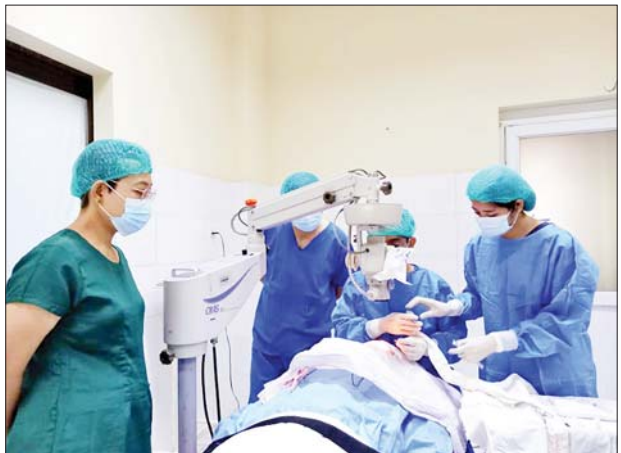
စစ်တွေဆေးရုံတွင် ရန်ကုန်အထူးအဖွဲ့က မျက်စိဝေဒနာရှင် တစ်ဦးအား ဆေးကုသပေးနေစဉ်။