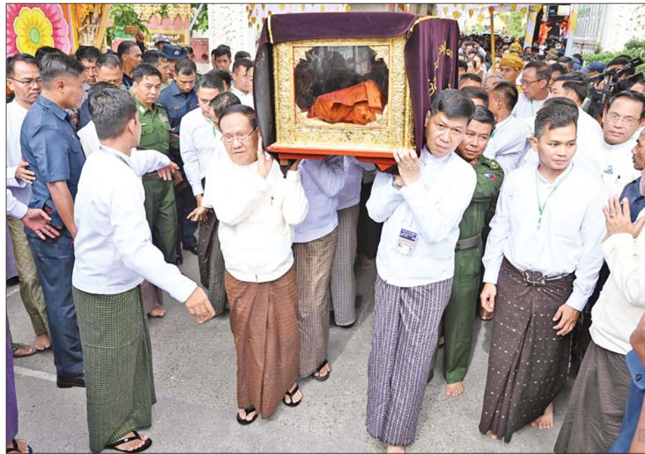
ဦးစီးကော်မတီရှစ်ဦးက ဗန်းမော်ဆရာတော်ဘုရားကြီး၏ ရုပ်ကလာပ်တော်အား သတ်မှတ်နေရာမှ ကရဝိက်ယာဉ်တော်ပေါ်သို့ ပင့်ဆောင်ကြစဉ်။