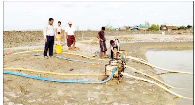
ရခိုင်ပြည်နယ်အတွင်းရှိ သောက်သုံးရေကန်များ၌ ရေငန် ဝင်ရောက်မှုအား ရေစုပ်ထုတ်နေမှုကို တွေ့ရစဉ်။