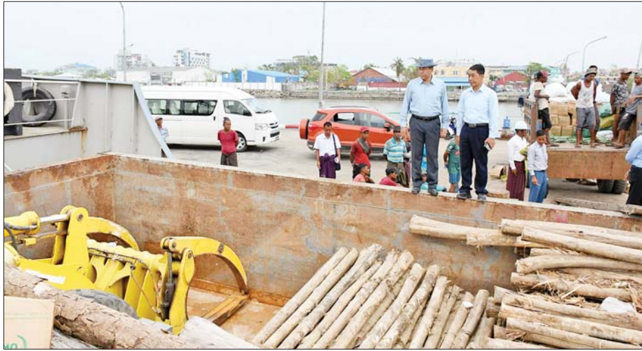
ပြည်ထောင်စုဝန်ကြီး ဒုတိယဗိုလ်ချုပ်ကြီး ထွန်းထွန်းနောင် စစ်တွေမြို့ဖောင်တော်ကြီး ဆိပ်ခံတံတား၌ ရေဘေးသင့် ပြည်သူများအတွက် ထောက်ပံ့မည့် သစ်များကို ကြည့်ရှုစစ်ဆေးစဉ်။

ယင်းနောက် မုန်တိုင်းဒဏ်ကြောင့် ပျက်စီး သွားသော စစ်တွေမြို့ ကမ်းနားလမ်းရှိ ကွန်ကရစ် လမ်း၊ ပလက်ဖောင်းနှင့် ကျောက်စီမြေထိန်းနံရံများကို ဆောက်လုပ်ရေးဝန်ကြီးဌာန စစ်တွေခရိုင် လမ်းဦးစီး ဌာနက လူအင်အား၊ စက်ယန္တရားအင်အားများ အသုံး ပြု၍ ပြည်သူများ အမြန်ဆုံးပြန်လည်အသုံးပြုနိုင်ရေး