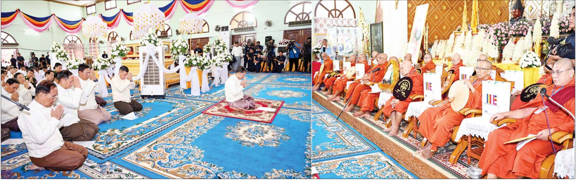
နိုင်ငံတော်စီမံအုပ်ချုပ်ရေးကောင်စီဥက္ကဋ္ဌ နိုင်ငံတော်ဝန်ကြီးချုပ် ဗိုလ်ချုပ်မှူးကြီး မင်းအောင်လှိုင် နိုင်ငံတော်ဗဟိုသံဃာ့ဝန်ဆောင် မန္တလေးမြို့ မစိုးရိမ်တိုက်သစ် မဟာနာယက အဂ္ဂမဟာပဏ္ဍိတ မဟာဓမ္မကထိက ဗဟုဇနဟိတဓရ ဘဒ္ဒန္တ ဝါသေဋ္ဌာဘိဝံသထံမှ ဓမ္မသံဝေဂကထာ တရားနာကြားစဉ်။

၀ ရှေ့ဖုံးမှ သီတဂူကမ္ဘာ့ဗုဒ္ဓတက္ကသိုလ်များ၏ အဓိပတိ အဘိဓမ္မမဟာရဋ္ဌဂုရု အဘိဓမ္မအဂ္ဂမဟာသဒ္ဓမ္မဇောတိက ဒေါက်တာ ဘဒ္ဒန္တ ဉာဏိဿရ အမှူးပြုသော ဆရာတော်ကြီးများ ကြွရောက်တော်မူကြပြီး နိုင်ငံတော် စီမံအုပ်ချုပ်ရေးကောင်စီ ဥက္ကဋ္ဌ နိုင်ငံတော်ဝန်ကြီးချုပ် ဗိုလ်ချုပ်မှူးကြီး မင်းအောင်လှိုင်နှင့် ဇနီး ဒေါ်ကြာကြာလှ၊ ကောင်စီတွဲဖက် အတွင်းရေးမှူး ဒုတိယဗိုလ်ချုပ်ကြီး ရဲဝင်းဦးနှင့် ဇနီး၊ ကောင်စီအဖွဲ့ဝင် ဒုတိယဗိုလ်ချုပ်ကြီး ရာပြည့်၊ ပြည်ထောင်စု ဝန်ကြီးများ၊ မန္တလေးတိုင်းဒေသကြီး ဝန်ကြီး