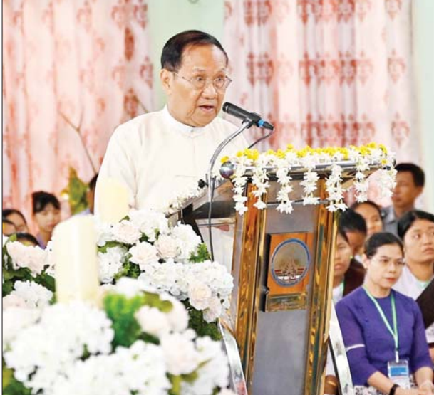
သာသနာရေးနှင့် ယဉ်ကျေးမှုဝန်ကြီးဌာန၏ ဝမ်းနည်းကြောင်း သဝဏ်လွှာကို ပြည်ထောင်စုဝန်ကြီး ဦးကိုကို ဖတ်ကြားပူဇော်စဉ်။

ဘာသာရေးအဖွဲ့ကြီးမှ ပေးပို့သည့် ဝမ်းနည်းကြောင်း သဝဏ်လွှာကို ဦးဝဏ္ဏရွှေကလည်းကောင်း၊ The Buddhist Association of China မှ ပေးပို့သည့် ဝမ်းနည်းကြောင်း သဝဏ်လွှာကိုတိုင်းဒေသကြီး အစိုးရအဖွဲ့မှ တာဝန်ရှိသူ တစ်ဦးကလည်းကောင်း အသီးသီး ဖတ်ကြားပူဇော်ကြသည်။