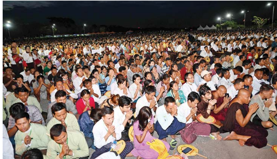
ဗန်းမော်ဆရာတော်ဘုရားကြီး၏ ရုပ်ကလာပ်တော်အား အဂ္ဂိဈာပန တေဇောဓာတ်ဖြင့် ပူဇော်စဉ်။