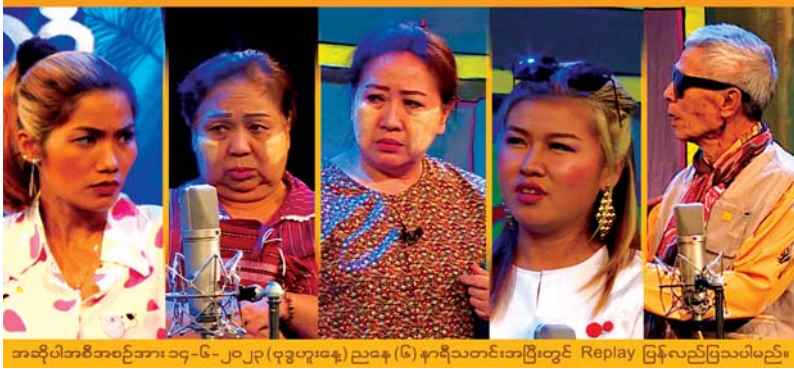
အဆိုပါအစီအစဉ်အား ၁၄-၆-၂၀၂၃ (၃၃၅၅) ညနေ (၆) နာရီသတင်းအချိန်တွင် Replay မြန်မာ့အသံဖြင့် ပြသပါမည်။