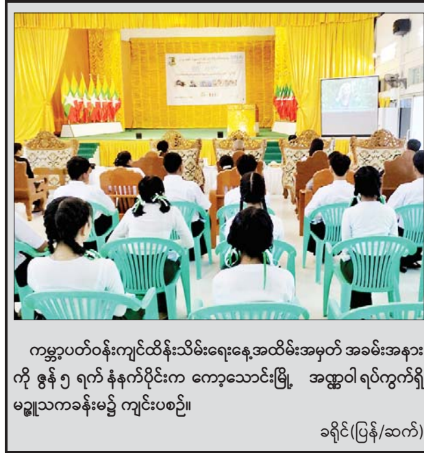
ကမ္ဘာ့ပတ်ဝန်းကျင်ထိန်းသိမ်းရေးအထိမ်းအမှတ် အခမ်းအနားကို ဇွန် ၅ ရက် နံနက်ပိုင်းက ကော့သောင်းမြို့ အထွေထွေရပ်ကွက်ရှိ မဉ္ဇူသကခန်းမ၌ ကျင်းပစဉ်။ ခရိုင်(ပြန်/ဆက်)