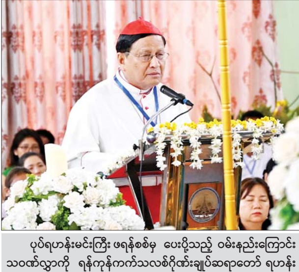
ပုဂံရဟန်းမင်းကြီး ဖရန်စစ်မှ ပေးပို့သည့် ဝမ်းနည်းကြောင်း သဝဏ်လွှာကို ရန်ကုန်ကက်သလစ်ဂိုဏ်းချုပ်ဆရာတော် ရဟန်းအမတ် ကာဒီနယ် ချားလ်စ်ဘို ဖတ်ကြားပူဇော်စဉ်။