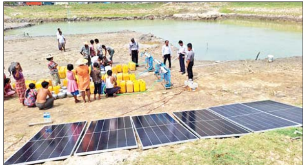
ရခိုင်ပြည်နယ်အတွင်းရှိ မုန်တိုင်းဘေးသင့်ပြည်သူများအတွက် သောက်သုံးရေရရှိရေး ရေသန့်စင်စက်များဖြင့် ပေးဝေနေစဉ်။