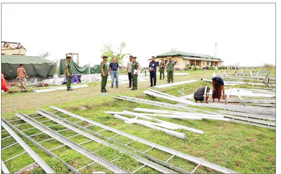
ဓာတ်စေတီတော်မြတ်ကြီးအား မုန်တိုင်းကြောင့် ပျက်စီးခဲ့သည့် သွားရောက်ဖူးမြော်ကြည့်ညီပြီး ဂေါပကအဖွဲ့နှင့် တွေ့ဆုံကာ ကို ပြန်လည်ပြုပြင် တည်ဆောက် ရေးအတွက် လိုအပ်သည်များ ညှိနှိုင်းဆောင်ရွက်ပေးခဲ့ကြောင်း သိရသည်။ သတင်းစဉ်

ထုတ်လုပ် ဆောင်ရွက်နိုင်ရန် လိုအပ်သည်များ ညှိနှိုင်း ဖြည့်ဆည်း ဆောင်ရွက်ပေးသည်။ ဆက်လက်၍ မိုခါမုန်တိုင်း တိုက်ခတ်မှုကြောင့် ပြိုလဲပျက်စီး ခဲ့သည့် မြဝတီရုပ်သံမြင်သံကြား ထပ်ဆင့်လွှင့် တာဝါတိုင်ကို ၆၅ မီတာတာဝါတိုင်အသစ် ပြန်လည် တည်ဆောက်ရန် အတွက် ဆောင်ရွက်နေမှုနှင့် ထပ်ဆင့်လွှင့်ရုပ်သံ အဆောက် အအုံအသစ် ဆောက်လုပ်မည့်မြေ နေရာတို့အား ကြည့်ရှုစစ်ဆေးရာ တာဝန်ရှိသူများက လုပ်ငန်း ဆောင်ရွက်မှု အခြေအနေများနှင့် ပတ်သက်၍ ရှင်းလင်းပြသကြ သည်။ ယင်းနောက် အဖွဲ့ဝင်များသည် စစ်တွေမြို့ရှိ လက်ဝဲသလုံးတော်