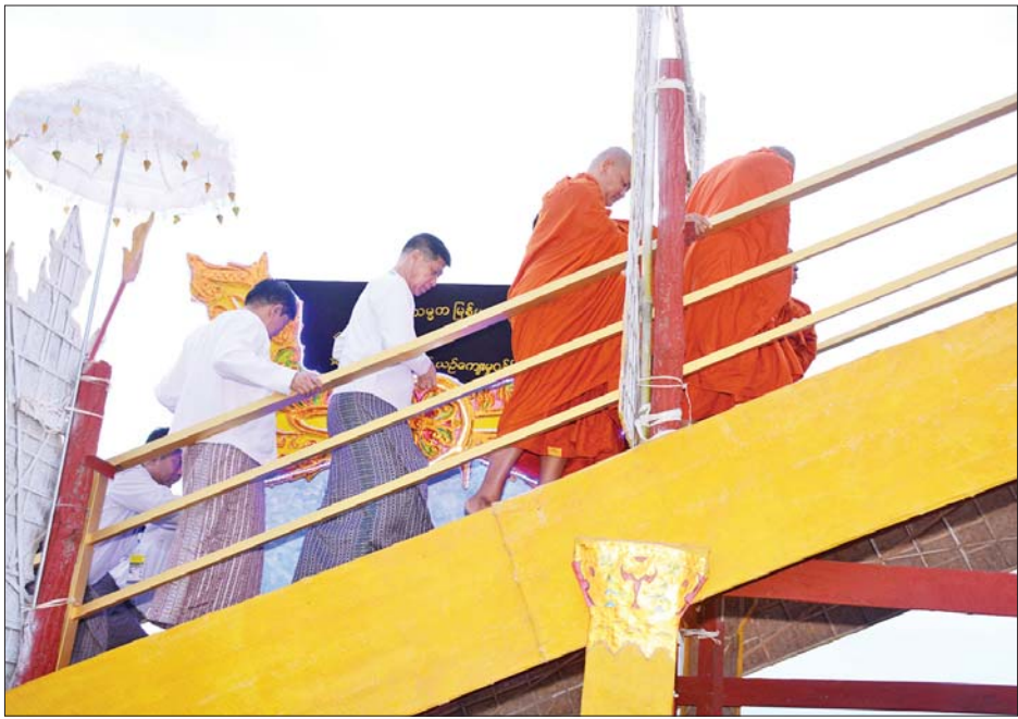
ဗန်းမော်ဆရာတော်ဘုရားကြီး၏ ရုပ်ကလာပ်တော်အား လောင်တိုက်တော်ပေါ်သို့ ပင့်ဆောင်ကြစဉ်။