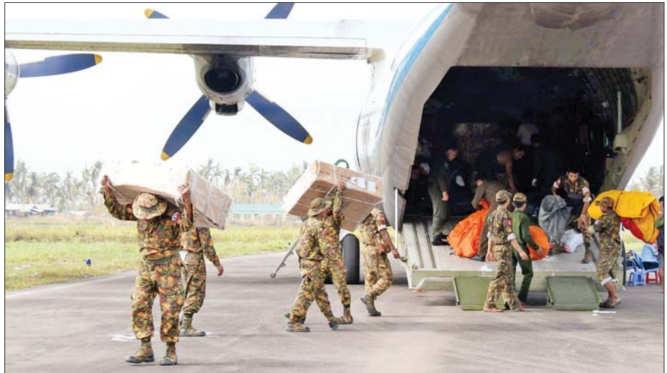
ရခိုင်ပြည်နယ်အတွင်းရှိ မုန်တိုင်းဘေးသင့်ပြည်သူများအတွက် ထောက်ပံ့ရေးပစ္စည်းများရောက်ရှိ လာသည်ကို တွေ့ရစဉ်။