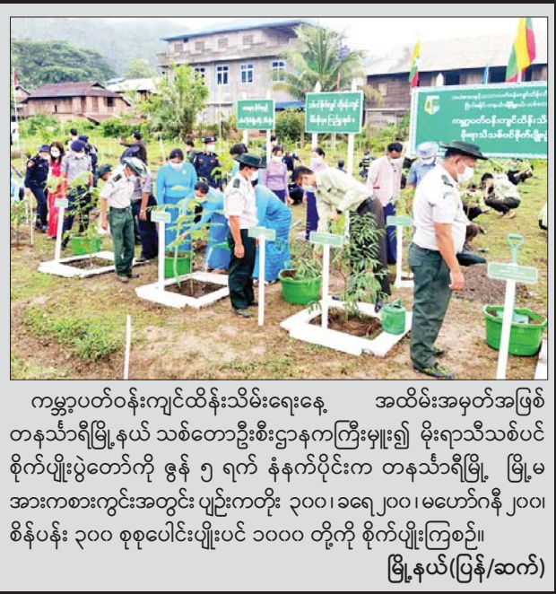
ကမ္ဘာ့ပတ်ဝန်းကျင်ထိန်းသိမ်းရေးအထိမ်းအမှတ်အဖြစ် တနင်္သာရီမြို့နယ် သစ်တောဦးစီးဌာနကကြီးမှူး၍ မိုးရာသီသစ်ပင်စိုက်ပျိုးပွဲတော်ကို ဇွန် ၅ ရက် နံနက်ပိုင်းက တနင်္သာရီမြို့ မြို့မအားကစားကွင်းအတွင်း ပျဉ်းကတိုး ၃၀၀၊ ခရေ ၂၀၀၊ မဟော်ဂန် ၂၀၀၊ စိန်ပန်း ၃၀၀ စုစုပေါင်းပျိုးပင် ၁၀၀၀ တို့ကို စိုက်ပျိုးကြစဉ်။ မြို့နယ်(ပြန်/ဆက်)