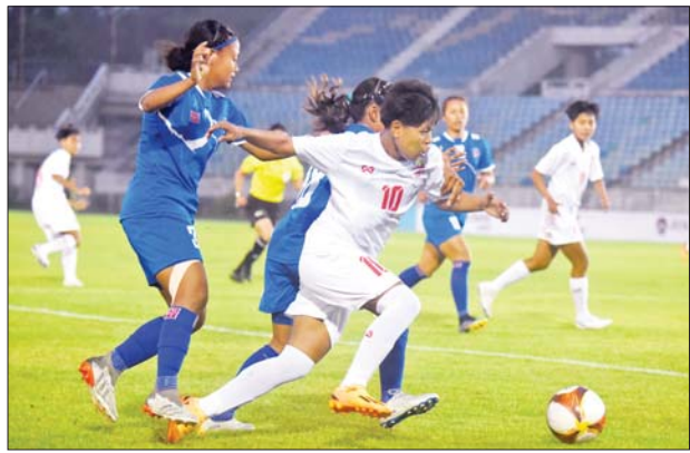
မြန်မာအသင်းနှင့် နီပေါအသင်း ယှဉ်ပြိုင်နေစဉ်။

မြန်မာအသင်းက နီပေါအသင်းကို ငါးဂိုး-ဂိုးမရှိဖြင့် အနိုင်ရခဲ့သည်။ မြန်မာအသင်းသည် နီပေါအသင်းကို ခြေအသာဖြင့်ဖိကစားကာ ပထမ