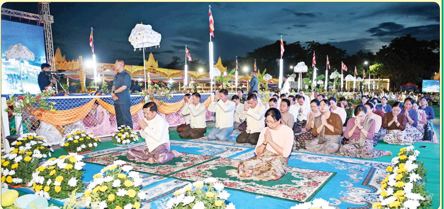
နိုင်ငံတော်သံဃမဟာနာယကအဖွဲ့ဥက္ကဋ္ဌ၊ အဘိဓဇမဟာရဋ္ဌဂုရု၊ အဘိဓဇအဂ္ဂမဟာသဒ္ဓမ္မဇောတိက ဒေါက်တာဘဒ္ဒန္တကုမာရာဘိဝံသ မဟာထေရ်မြတ်ကြီး၏ အန္တိမအဂ္ဂိဈာပနသာဓုကိဋ္ဌန ပူဇာသဘင်အခမ်းအနားသို့ နိုင်ငံတော်စီမံအုပ်ချုပ်ရေးကောင်စီဥက္ကဋ္ဌ နိုင်ငံတော်ဝန်ကြီးချုပ် ဗိုလ်ချုပ်မှူးကြီး မင်းအောင်လှိုင်နှင့် ဇနီး ဒေါ်ကြူကြူလှတို့ တက်ရောက်ပူဇော်စဉ်။