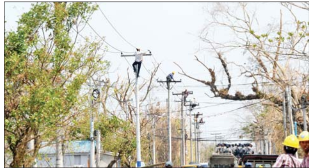
ရခိုင်ပြည်နယ်၌ လျှပ်စစ်ဓာတ်အားများ အမြန်ရရှိရေးအတွက် ဆောင်ရွက်နေသည်ကို တွေ့ရစဉ်။