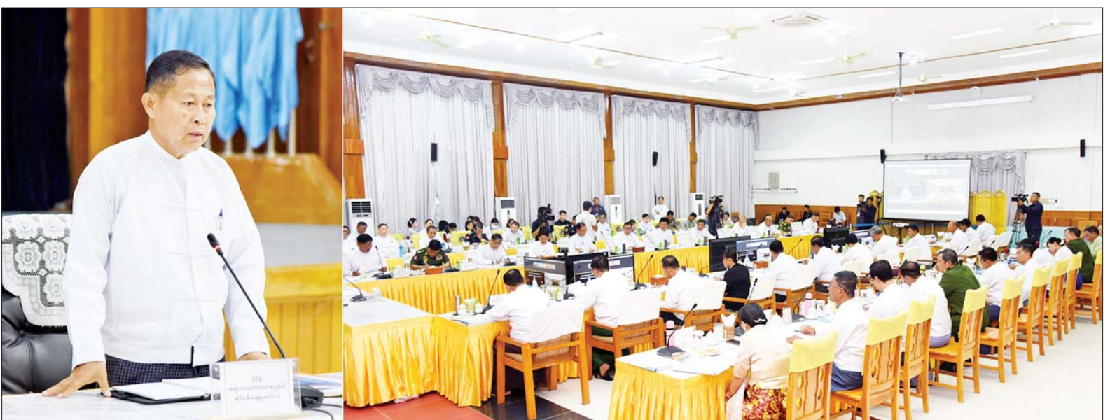
နိုင်ငံတော်စီမံအုပ်ချုပ်ရေးကောင်စီ ဒုတိယဥက္ကဋ္ဌ ဒုတိယဝန်ကြီးချုပ် ဒုတိယဗိုလ်ချုပ်မှူးကြီးစိုးဝင်း အမျိုးသားသဘာဝဘေးအန္တရာယ်ဆိုင်ရာ စီမံခန့်ခွဲမှုကော်မတီ ပြန်လည်ထူထောင်ရေးဆိုင်ရာလုပ်ငန်းညှိနှိုင်းအစည်းအဝေးတွင် အမှာစကားပြောကြားစဉ်။

နေပြည်တော် ဇွန် ၆ အမျိုးသား သဘာဝဘေးအန္တရာယ်ဆိုင်ရာ စီမံခန့်ခွဲမှုကော်မတီ၏ ပြန်လည်ထူထောင်ရေးဆိုင်ရာ လုပ်ငန်းညှိနှိုင်းအစည်းအဝေးကို ယနေ့မွန်လွင်ပြင်တွင် နေပြည်တော်ရှိ လူမှုဝန်ထမ်း၊ ကယ်ဆယ်ရေးနှင့် ပြန်လည်နေရာချထားရေးဝန်ကြီးဌာန စုပေါင်းအစည်းအဝေးခန်းမ၌ ကျင်းပရာ အမျိုးသားသဘာဝဘေးအန္တရာယ်ဆိုင်ရာ စီမံခန့်ခွဲမှုကော်မတီဥက္ကဋ္ဌ နိုင်ငံတော်စီမံအုပ်ချုပ်ရေးကောင်စီဒုတိယဥက္ကဋ္ဌ ဒုတိယဝန်ကြီးချုပ် ဒုတိယဗိုလ်ချုပ်မှူးကြီးစိုးဝင်း တက်ရောက် အမှာစကားပြောကြားသည်။ စာမျက်နှာ ၈ ကော်လံ ၁ သို့ ❖