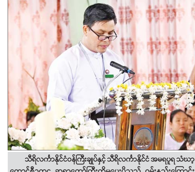
သီရိလင်္ကာနိုင်ငံဝန်ကြီးချုပ်နှင့် သီရိလင်္ကာနိုင်ငံ အမရပူရသံဃာ့ကောင်စီဥက္ကဋ္ဌ ဆရာတော်ကြီးတို့မှပေးပို့သည့် ဝမ်းနည်းကြောင်း သဝဏ်လွှာများကို တိုင်းဒေသကြီးအစိုးရအဖွဲ့မှ တာဝန်ရှိသူတစ်ဦး ဖတ်ကြားပူဇော်စဉ်။

ဖတ်ကြားပူဇော် ယင်းနောက် နိုင်ငံတော်သံဃာမဟာနာယကအဖွဲ့၏ သံဝေဂပွားတော်မူကြောင်း သဝဏ်လွှာကို နိုင်ငံတော်သံဃာမဟာနာယကအဖွဲ့ အကျိုးတော်ဆောင်သန်လျင်မင်းကျောင်း ဆရာတော်ကြီးက ဖတ်ကြားပူဇော်သည်။ ထို့နောက် သာသနာရေးနှင့် ယဉ်ကျေးမှုဝန်ကြီးဌာန၏ ဝမ်းနည်းကြောင်း သဝဏ်လွှာကို ပြည်ထောင်စုဝန်ကြီးက ဖတ်ကြားပူဇော်သည်။ ဆက်လက်ပြီး ပြည်တွင်း၊ ပြည်ပအကြီးအကဲများနှင့် ဘာသာရေးဆိုင်ရာ အဖွဲ့အစည်းအသီးသီးမှ ပေးပို့သည့် ဝမ်းနည်းကြောင်း သဝဏ်လွှာများအနက် သီရိလင်္ကာနိုင်ငံဝန်ကြီးချုပ်မှ ပေးပို့သည့် ဝမ်းနည်းကြောင်း သဝဏ်လွှာနှင့် သီရိလင်္ကာနိုင်ငံ အမရပူရသံဃာ့ကောင်စီဥက္ကဋ္ဌ ဆရာတော်ကြီးမှ ပေးပို့သည့် ဝမ်းနည်းကြောင်း သဝဏ်လွှာကို တိုင်းဒေသကြီးအစိုးရအဖွဲ့မှ တာဝန်ရှိသူ တစ်ဦးကလည်းကောင်း၊ ပုဂံရဟန်းမင်းကြီး ဖရန်စစ်မှ ပေးပို့သည့် ဝမ်းနည်းကြောင်း သဝဏ်လွှာကို ရန်ကုန်ကက်သလစ်ဂိုဏ်းချုပ် ဆရာတော် ရဟန်းအမတ် ကာဒီနယ် ချားလ်စ်ဘိုကလည်းကောင်း၊ မြန်မာနိုင်ငံလုံးဆိုင်ရာ အစ္စလာမ်