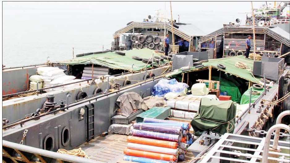
ရခိုင်ပြည်နယ်အတွင်းရှိ မုန်တိုင်းဘေးသင့်ဒေသများသို့ ထောက်ပံ့ရေးပစ္စည်းများ ပို့ဆောင်မည့် ရေယာဉ်ကို တွေ့ရစဉ်။

၁၁ ကေစီနှင့် ၄၀၀ ဗို့ မြို့တွင်းဖြန့်ဖြူးရေး ဓာတ်အားလိုင်းများ ပြုပြင်ပြီးစီးမှုအနေဖြင့် စစ်တွေ စာမျက်နှာ ၁၁ သို့ ၀