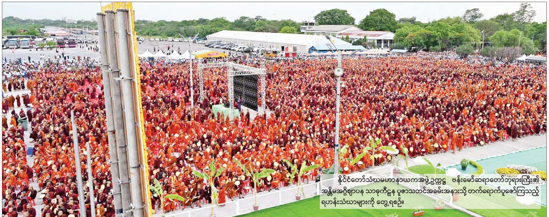
နိုင်ငံတော်သံဃမဟာနာယကအဖွဲ့ဥက္ကဋ္ဌ ဗန်းမော်ဆရာတော်ဘုရားကြီး၏ အန္တိမအဂ္ဂိဈာပန သာဓုကိဋ္ဌန ပူဇော်သဘင်အခမ်းအနားသို့ တက်ရောက်ပူဇော်ကြသည့် ရဟန်းသံဃာများကို တွေ့ရစဉ်။