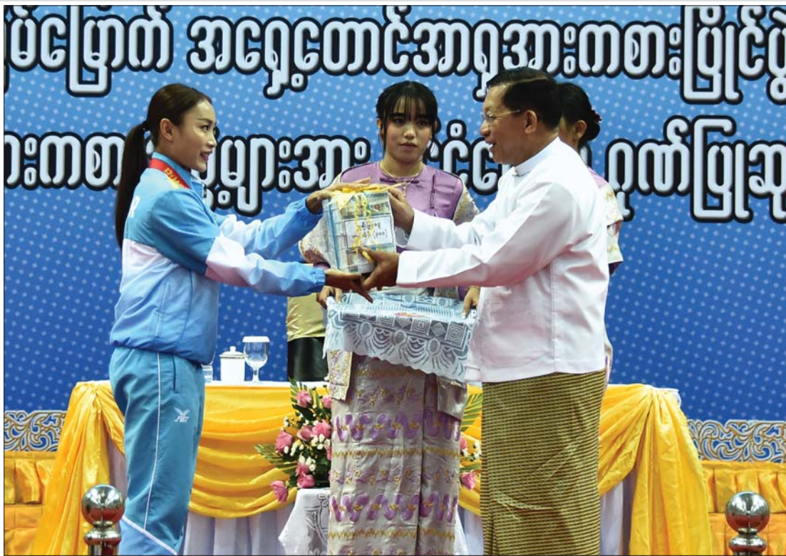
ဇန် ၁ ရက်က နိုင်ငံတော်စီမံအုပ်ချုပ်ရေးကောင်စီဥက္ကဋ္ဌ နိုင်ငံတော်ဝန်ကြီးချုပ် ဗိုလ်ချုပ်မှူးကြီးမင်းအောင်လှိုင် (၃၂)ကြိမ်မြောက် အရှေ့တောင်အာရှအားကစားပြိုင်ပွဲ ဝှူများအားကစားနည်းပြိုင်ပွဲတွင် ရွှေတံဆိပ်ဆုရရှိခဲ့သည့် မစန္ဒီဦးအား ဂုဏ်ပြုချီးမြှင့်ငွေ ပေးအပ်ချီးမြှင့်စဉ်။

အားပေးမှုအခွင့်အလမ်းအောက်မှာ အားသာချက်များတည်ဆောက် အထက်ပါယူဆချက်ကို အောင်မြင် မှုများရရှိခဲ့ကြသည့် နိုင်ငံ့ဂုဏ်ဆောင် အားကစားသမားများအား ဂုဏ်ပြုဆု များချီးမြှင့်ခဲ့သည့် အခမ်းအနားကြီးနှင့် ထိုအခမ်းအနားတွင် နိုင်ငံအကြီးအကဲ၏ ဂုဏ်ပြုမှတ်ချက်စကားနှင့် လမ်းညွှန် မှာကြားချက်များတွင် ထင်ဟပ်နေသည်။ ကာလအတန်ကြာ အားနည်းနေသည့် မြန်မာ့အားကစား ဖွံ့ဖြိုးတိုးတက်ရေးနှင့် ပတ်သက်၍ ဆယ်စုနှစ်တစ်ခုအတွင်း မြန်မာနိုင်ငံ၏ အားကစားအဆင့်အတန်း ကို အဆင့်ဆင့်ပြန်လည်စနစ်တကျ ဆောင်ရွက်ရမည်ဟူသည့် လမ်းညွှန်ချက် ကို ၂၀၂၁ ခုနှစ် ဒီဇင်ဘာလ ၂၆ ရက်နေ့ ကတည်းကပင် မှတ်သားခဲ့ရဖူးသည်။