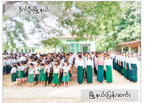
ဒိုက်ဦးမြို့နယ်