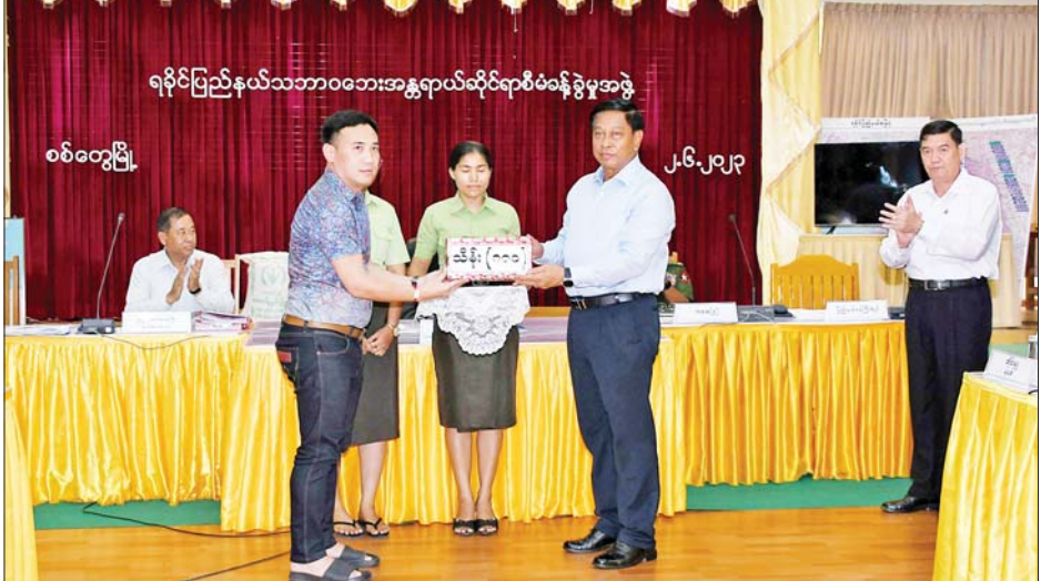
နိုင်ငံတော်စီမံအုပ်ချုပ်ရေးကောင်စီအဖွဲ့ဝင် ဒုတိယဝန်ကြီးချုပ်နှင့် ပြည်ထောင်စုဝန်ကြီး ဗိုလ်ချုပ်ကြီး တင်အောင်စန်း ရခိုင်ပြည်နယ် မုန်တိုင်းဒဏ်သင့်ဒေသများ ပြန်လည်ထူထောင်ရေးအတွက် အလှူရှင်များ၏ လှူဒါန်းငွေများကို လက်ခံစဉ်။

အဆိုပါ ပြည်တော်သာ(စစ် တွေ)-ရေချမ်းပြင် ရထားလမ်း သည် ၁၁ ဒသမ ၄၆ မိုင်ရှိ၍ ၂၀၀၉ ခုနှစ် မေ ၁၉ ရက်တွင် ဖွင့်လှစ်ခဲ့ပြီး လမ်းပိုင်းအတွင်း ပြည်တော်သာ၊ စစ်တွေ၊ ဇောပူဂျာ၊ ရေချမ်းပြင် ဘူတာ လေးဘူတာနှင့် စစ်တွေ တက္ကသိုလ်၊ မင်းဂံ၊ ဒါးပိုင်၊ ငပွန်း ကြီး၊ မဲဇော်ကုန်း ရပ်စခန်း ငါးခု ထားရှိကာကျောင်းသား ကျောင်းသူ များနှင့် ဒေသခံပြည်သူများ၏ ခရီး သွားလာမှု အထောက်အကူဖြစ်စေ ရေးအတွက် ပြည်တော်သာ (စစ်တွေ)-ရေချမ်းပြင် ခရီးစဉ်ကို RBE ရထားဖြင့် နေ့စဉ် အသွား အပြန် နှစ်ခေါက် ပြေးဆွဲပေးလျက်