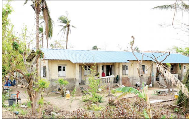
မီးရထားအိမ်ထောင်သည်လှိုင်းများ မှန်တိုင်းတိုက်ခတ်မှုကြောင့် အမိုးလန် ပျက်စီးမှုများ ပြန်လည်ပြုပြင်ပြီးစီးသည်ကို တွေ့ရစဉ်။

တင်ပြချက်များနှင့်စပ်လျဉ်း၍ ဗိုလ်ချုပ်ကြီးတင်အောင်စန်းက စားရေရိက္ခာများ ဖြန့်ခွဲရာတွင် အမှန်တကယ် လိုအပ်ချက်ရှိသော နေရာဒေသများရှိ ဘေးဒဏ်သင့် ပြည်သူများထံသို့ ဦးစားပေးဖြန့်ခွဲ နိုင်ရေး စီမံဆောင်ရွက်ရန်၊ ထောက်ပံ့ရေးပစ္စည်းများ အတင် အချနှင့် ပို့ဆောင်ဖြန့်ခွဲရာတွင် အချိန်ကြန့်ကြာမှု မရှိအောင် ဆောင်ရွက်သွားရန် မှာကြားပြီး ပြန်လည်ထူထောင်ရေးဆိုင်ရာ လုပ်ငန်းများ အရှိန်အဟုန်ဖြင့် ဆောင်ရွက်သွားနိုင်ရေးနှင့် လုပ်ငန်း များ လျင်လျင်မြန်မြန် ပြီးစီးရေး အတွက် လိုအပ်သည်များကို ပေါင်းစပ်ညှိနှိုင်း ဖြည့်ဆည်း ဆောင်ရွက်ပေးကာ အစည်း အဝေးကို ရုပ်သိမ်းလိုက်ကြောင်း သိရသည်။