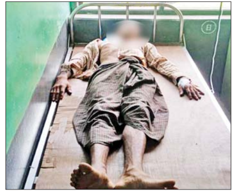
အရပ်သားများ ဒဏ်ရာရရှိမှု မှတ်တမ်းဓာတ်ပုံ။

အဆိုပါရပ်ကွက်ရှိ ဇေတဝန်ဘုန်းတော်ကြီးကျောင်းမှ သံဃာတော်တစ်ပါး ပျံလွန်တော်မူခဲ့ပြီး အပြစ်မဲ့ပြည်သူ သုံးဦးသေဆုံးကာ သုံးဦးထိခိုက်ဒဏ်ရာရရှိခဲ့ကြောင်း နှင့် ထိခိုက်ဒဏ်ရာရရှိခဲ့သူများကို မော်လမြိုင်မြို့ ပြည်သူ့ဆေးရုံသို့ ပို့ဆောင်ဆေးကုသမှုခံယူစေလျက်