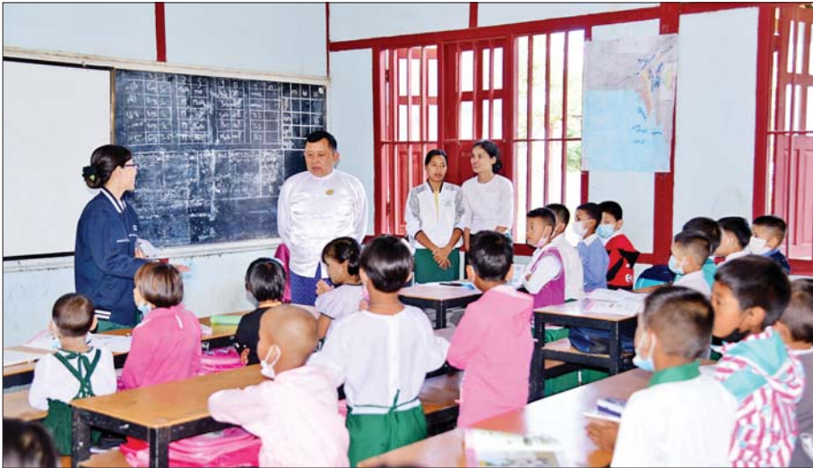
ရှမ်းပြည်နယ်ဝန်ကြီးချုပ် ဦးအောင်ဇော်အေး တောင်ကြီးမြို့ရှိ အခြေခံပညာကျောင်းများ၌ ပညာသင်ကြားနေသော ကျောင်းသား ကျောင်းသူများအား ကြည့်ရှုအားပေးစကားပြောကြားစဉ်။ ပြည်နယ်(ပြန်/ဆက်)

ပညာရေးဝန်ကြီးဌာန အခြေခံပညာဦးစီးဌာနက ၂၀၂၃-၂၀၂၄ ပညာသင်နှစ်အတွက် အခြေခံပညာကျောင်းများကို ဇွန် ၁ ရက်မှစတင်၍ ဖွင့်လှစ်ပြီဖြစ်ရာ ကျောင်းသား ကျောင်းသူများ၏ အေးချမ်းပျော်ရွှင်စွာ ပညာသင်ကြားလျက်ရှိသည့် မြင်ကွင်းကို ဖော်ပြလိုက်ပါသည် -