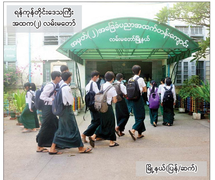
ရန်ကုန်တိုင်းဒေသကြီး အထက(၂) လမ်းမတော်