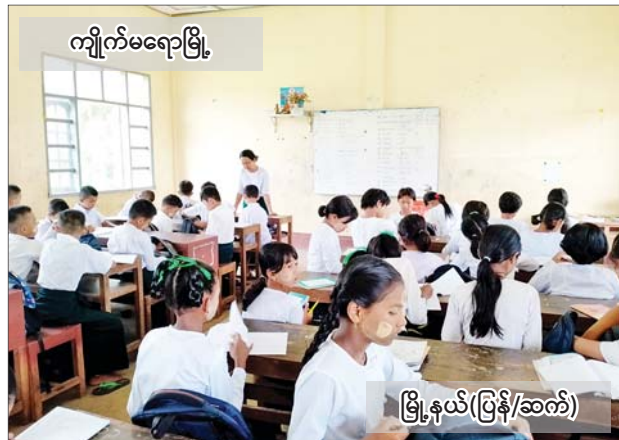
ကျိုက်မရောမြို့