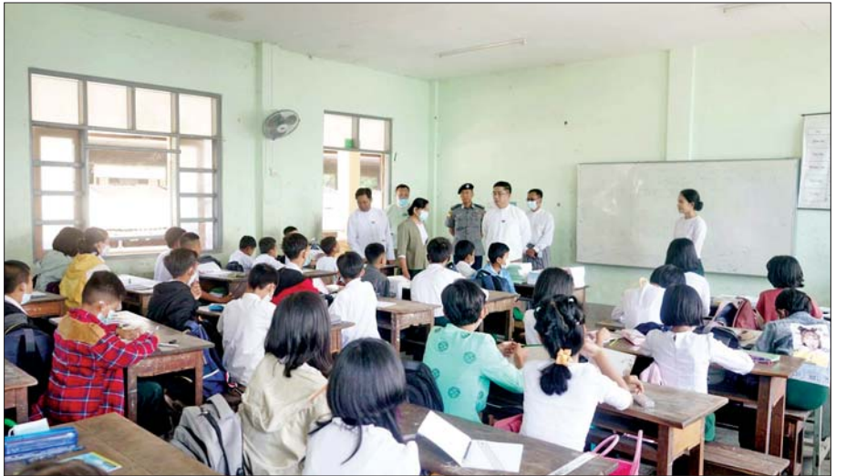
ကယားပြည်နယ်ဝန်ကြီးချုပ် ဦးဇော်မျိုးတင် လွိုင်ကော်မြို့ရှိ အခြေခံပညာကျောင်းများ၌ ကျောင်းသား ကျောင်းသူများ အေးချမ်းပျော်ရွှင်စွာ ပညာသင်ယူနေမှုကို လှည့်လည်ကြည့်ရှုအားပေးစဉ်။ ပြည်နယ်(ပြန်/ဆက်)