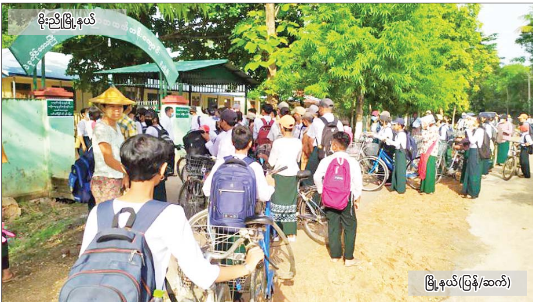
မိုးညိုမြို့နယ်