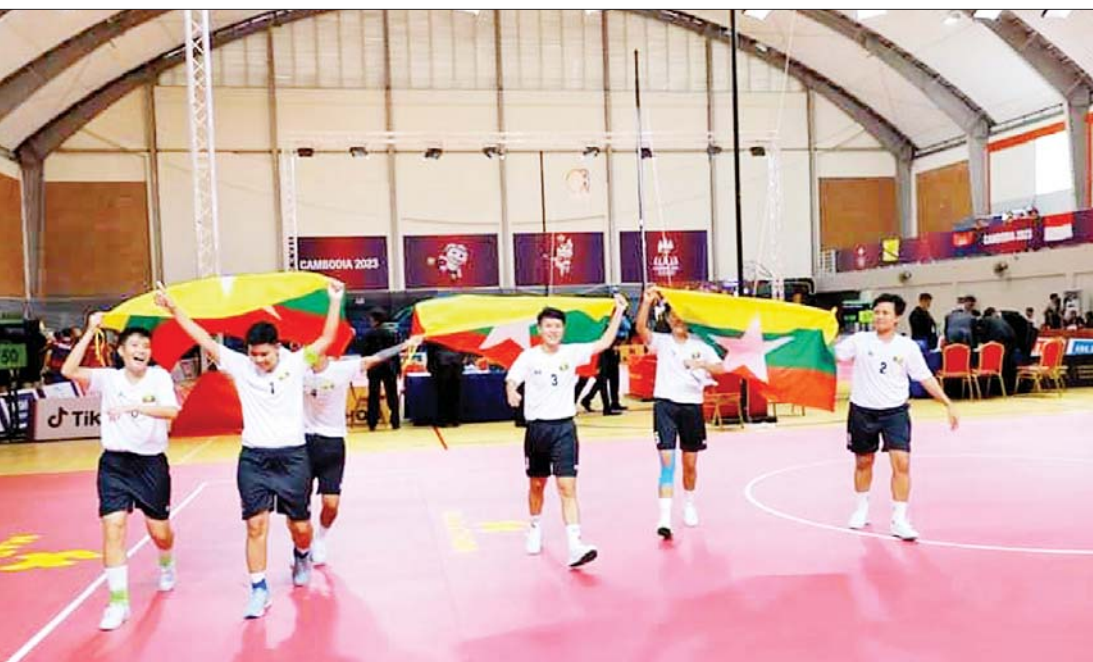
မေ ၁၀ ရက်က ကျင်းပခဲ့သည့် (၃၂)ကြိမ်မြောက် အရှေ့တောင်အာရှ အားကစားပြိုင်ပွဲ ပိုက်ကျော်ခြင်း အားကစားနည်း (အမျိုးသမီး) ကွင်းသွင်းခြင်းခတ်ပြိုင်ပွဲတွင် ရွှေတံဆိပ်ဆုရရှိခဲ့သည့် မြန်မာကစားသမားများ အောင်ပွဲခံနေစဉ်။

တစ်ချိန်က မြန်မာ့အားကစား လောကနှင့်မြန်မာ့အားကစားနည်းအချို့ သည် မြန်မာနှင့် ကမ္ဘာတွင်ပါ လျှမ်းလျှမ်း တောက်အောင်မြင်ခဲ့သည်။ အားကျ အတုယူဖွယ်ရာများရှိခဲ့သည့် အကြောင်း များစွာကို အားကစားမော်ကွန်းများတွင် ရေးထိုးခဲ့ကြဖူးသည့်မှတ်တမ်းများစွာအား တွေ့မြင်ဖူးကြပါလိမ့်မည်။ နောက်တော့ မြန်မာ့အားကစား တဖြည်းဖြည်းပြန်လည် မှေးမှိန်သွားရပြန်သည်မှာ ကာလ အတော်ကြာခဲ့သည်။ ယခုနှစ်ယခုကာလ (၃၂)ကြိမ်မြောက် အရှေ့တောင်အာရှ အားကစားပြိုင်ပွဲမှာတော့ မြန်မာ့ အားကစားလောက ပြန်လည်နိုးထမှု တစ်ခုကို တွေ့မြင်လိုက်ရသလို အားလုံး