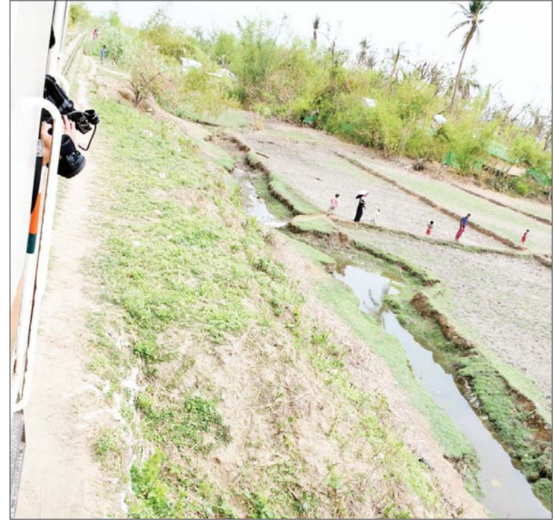
ပြည်တော်သာ - စစ်တွေ-ဇောပူဂျာ-ရေချမ်းပြင် မီးရထားလမ်းတစ်လျှောက် ရေကြီးရေလျှံမှုများဖြစ်ပေါ်ခဲ့သောကြောင့် ရထားလမ်းတာပေါင်များ ပြိုကျပျက်စီးနေ သည်ကို တွေ့ရစဉ်။