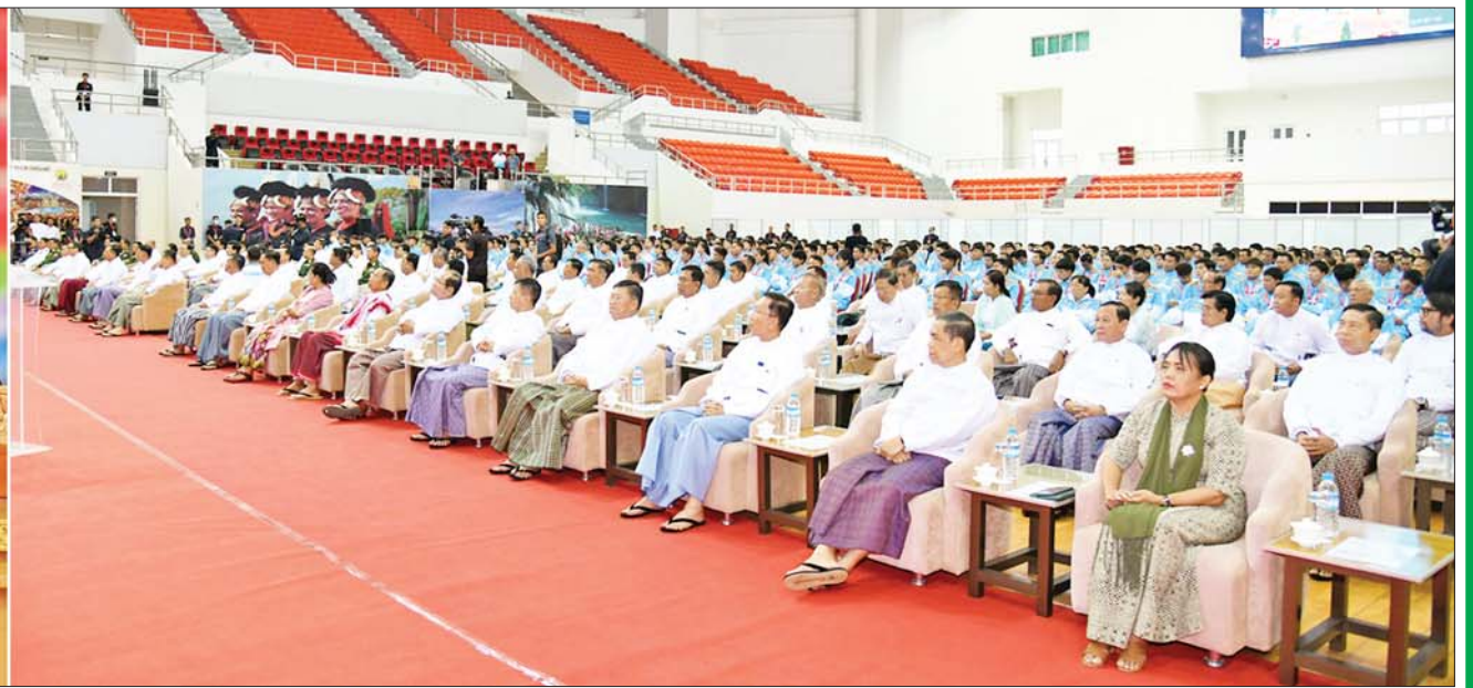
ဇန် ၁ ရက်က နိုင်ငံတော်စီမံအုပ်ချုပ်ရေးကောင်စီဥက္ကဋ္ဌ နိုင်ငံတော်ဝန်ကြီးချုပ် ဗိုလ်ချုပ်မှူးကြီးမင်းအောင်လှိုင် (၃၂)ကြိမ်မြောက် အရှေ့တောင်အာရှအားကစားပြိုင်ပွဲတွင် ဆုတံဆိပ်ရရှိခဲ့သည့် မြန်မာ အားကစားအဖွဲ့များအား နိုင်ငံတော်က ဂုဏ်ပြုဆုချီးမြှင့်ခြင်းအခမ်းအနားတွင် အမှာစကားပြောကြားစဉ်။

★ ရှေ့ဖိုးမှ ရေရှည်ဖွံ့ဖြိုးတိုးတက်မှုကို ရယူမည် ဆိုလျှင် အခြေခံအုတ်မြစ်ကောင်းများ ခိုင်ခံ့အောင် ဦးစွာပြုလုပ်ယူရသည်။ အခြေအနေဖန်တီးနိုင်မှု အပါအဝင် အဘက်ဘက်က အခက်အခဲ၊ အနေနှင့် အယုတ်၊ ထိခိုက်နစ်နာမှု၊ အားနည်းချက် များစွာရှိနေသည့် အခြေအနေမှာဆိုလျှင် ပိုဆိုးသည်။ အရင်းအမြစ်နှင့် သွင်းအားစု inputs တို့ ချို့တဲ့လှသည့်အခြေအနေ များမှာ ရလဒ်ကောင်းများဖြင့် အကောင်း ဆုံး outcomes ကို ရယူနိုင်ဖို့ဆိုလျှင် ဦးဆောင်မှုနှင့် ကောင်းမွန်ထိရောက် သော efficient ဖြစ်သည့် စီမံခန့်ခွဲမှု ကသာ အရေးကြီးဆုံးဖြစ်သည်ကို ပြီးစီး အောင်မြင်ခဲ့သည့် (၃၂)ကြိမ်မြောက် အရှေ့တောင်အာရှအားကစားပြိုင်ပွဲကြီး က ပြသနေပါသည်။