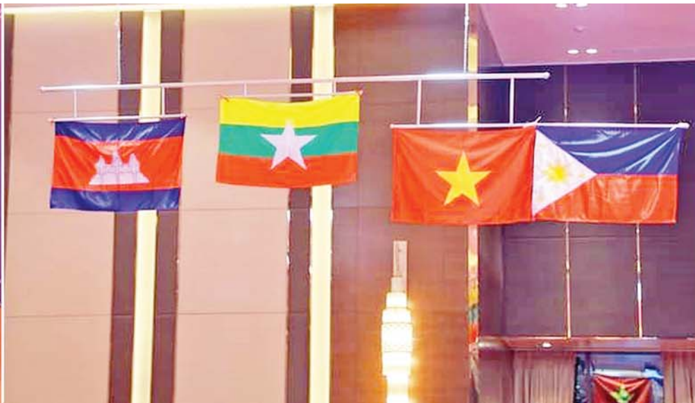
(၃၂)ကြိမ်မြောက် အရှေ့တောင်အာရှအားကစားပြိုင်ပွဲ ဗိုလ်ချုပ်(အားကစား)အမျိုးသားအလွတ်တန်း စွမ်းရည်ပြ အသင်းလိုက်ပြိုင်ပွဲတွင် ရွှေတံဆိပ်ရရှိခဲ့ပြီး မြန်မာနိုင်ငံတော်သီချင်း သီဆိုဂုဏ်ပြုကာ မြန်မာနိုင်ငံတော်အလံ လွှင့်တင်စဉ်။

»» စာမျက်နှာ ၃ မှ မြန်မာပြည်သူတို့ အားပေးမှုအများဆုံး ဘောလုံးပြိုင်ပွဲမှာ အမျိုးသမီးအသင်းက အစဉ်အလာပြိုင်ဘက် ထိုင်းအသင်းကို အနိုင်ယူ ဗိုလ်လုပွဲအထိ တက်လှမ်းနိုင်ခဲ့ ပြီးမှ ဘောလုံးအင်အားကြီး ဗီယက်နမ် ကို အရေးနိမ့်ခဲ့ရသည်။ အမျိုးသား အသင်းကလည်း အကြံဉာဏ်လွန်အထိ တက်လှမ်းနိုင်ခဲ့သည်။ မြန်မာအားကစား တစ်ဖွဲ့လုံးသည် နိုင်သင့်သည့်ပွဲများတွင် ပြိုင်ဘက်များကို ဂုဏ်သိက္ခာရှိရှိ အနိုင်ယူခဲ့ကြသည်ဖြစ်၍ အတိုင်းအတာ တစ်ခုအထိတော့ မြန်မာပြည်သူတို့ ကျေနပ်ခဲ့ကြသည်ဟု ဆိုရပါမည်။