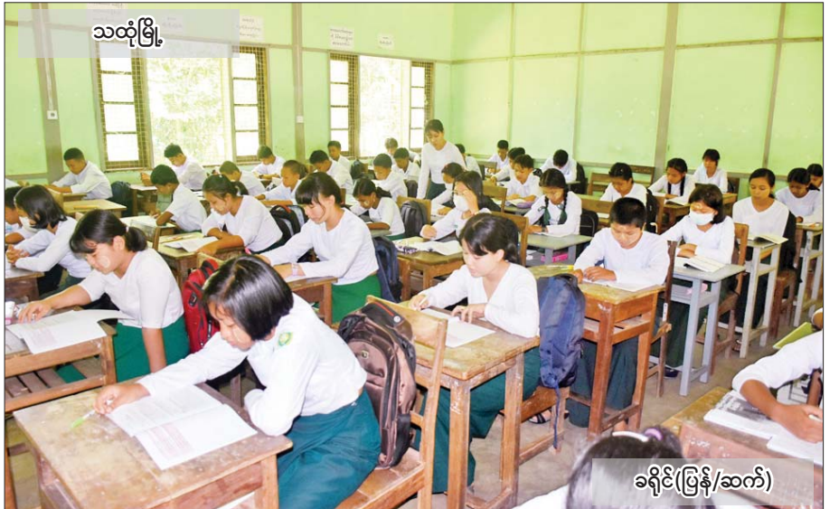
သထုံမြို့