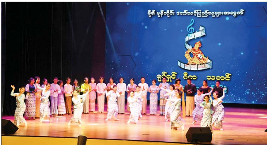
ဒဂုံမြို့နယ်ရှိ အမျိုးသားကဇာတ်ရုံတွင် မိခါမုန့်တိုင်းဒဏ်သင့်ပြည်သူများအတွက် ရုပ်ရှင်၊ ဂီတ၊ သဘင် ပူးပေါင်းတင်ဆက်သည့် ရန်ပုံငွေပဒေသာကပွဲ ဖျော်ဖြေတင်ဆက်စဉ်။

ဖျော်ဖြေတင်ဆက်မှုကို ကြည့်ရှု အားပေးသည်။ ညနေ ၆ နာရီတွင် ဖျော်ဖြေမှု အစီအစဉ်များကို စတင်ရာ မြန်မာနိုင်ငံသဘင်အစည်းအရုံးမှ ဧည့်ခံတီးလုံးဖြင့် စတင်ဖွင့်လှစ်ပြီး ပဏာမ အဖွင့်တီးလုံးဖြင့် ဆက်လက်ဧည့်ခံသည်။