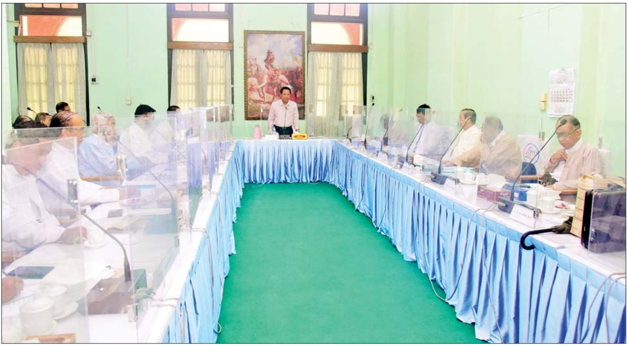
ပြန်ကြားရေးဝန်ကြီးဌာန ပြည်ထောင်စုဝန်ကြီးဦးမောင်မောင်အုန်း အမျိုးသားစာပေဆု စိစစ်ရွေးချယ်ရေးကော်မတီနှင့် စာပေဗိမာန် စာမူဆုရွေးချယ်ရေးအဖွဲ့တို့မှ စာပေပညာရှင်များနှင့် တွေ့ဆုံဆွေးနွေးပွဲတွင် အမှာစကားပြောကြားစဉ်။

ရန်ကုန် ဇွန် ၂ ပြန်ကြားရေး ဝန်ကြီးဌာန ပြည်ထောင်စု ဝန်ကြီး ဦးမောင်မောင်အုန်းသည် ယနေ့ တွင် သက်တော် (၇၉) နှစ်ပြည့် မွေးနေ့အလှူမင်္ဂလာကျင်းပသည့် အလိုတော်ပြည့် ဆရာတော်ကြီး အား ဖူးမြော်ပြီး အမျိုးသားစာပေ ဆုစိစစ်ရွေးချယ်ရေးကော်မတီနှင့် စာပေဗိမာန်စာမူဆု ရွေးချယ်ရေး အဖွဲ့တို့မှ စာပေပညာရှင်များနှင့် တွေ့ဆုံဆွေးနွေးကာ ညပိုင်းတွင် မိခါမုန့်တိုင်းဒဏ်သင့် ပြည်သူများ အတွက် ရုပ်ရှင်၊ ဂီတ၊ သဘင် ပူးပေါင်းတင်ဆက်သည့် ရန်ပုံငွေ ပဒေသာဖျော်ဖြေပွဲတက်ရောက် ကြည့်ရှုအားပေးသည်။