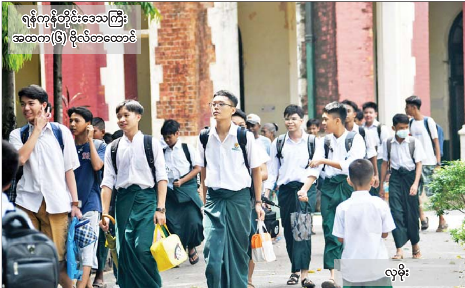
ရန်ကုန်တိုင်းဒေသကြီး အထက(၆) ဗိုလ်တထောင်