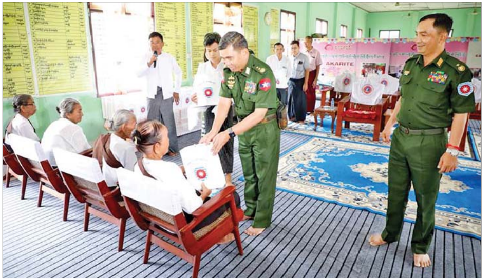
နဝကမ္မအလှူငွေများ ဆက်ကပ်လှူဒါန်းကြသည်။ ယင်းနောက် ဒုတိယဗိုလ်ချုပ်ကြီး ဖုန်းမြတ်နှင့် အဖွဲ့ဝင်များသည် မုန်တိုင်းသင့် စစ်မှုထမ်းဟောင်းအဖွဲ့ဝင်များနှင့် မိသားစုဝင်များအား စစ်တွေတပ်နယ်ရှိ မေဃဝတီခန်းမ၌ ရင်းရင်းနှီးနှီး တွေ့ဆုံအားပေးစကားပြောကြားကာ ဆန်၊ ဆီနှင့် စားသောက်ကုန်ပစ္စည်းများ ထောက်ပံ့ပေးအပ်ပြီး မိသားစုဝင်များ၏ တင်ပြချက်များအပေါ် လိုအပ်သည်များ ပေးပို့ပေးသည့်အပြင် ဖြည့်ဆည်းဆောင်ရွက်ပေးခဲ့ကြောင်း သိရသည်။ သတင်းစဉ်

ထို့နောက် ဒုတိယဗိုလ်ချုပ်ကြီး ဖုန်းမြတ်နှင့် အဖွဲ့ဝင်များက အဘိုးအဘွား ၃၉ ဦးအား စားသောက်ဖွယ်ရာများ၊ တိုင်းရင်းဆေးဝါးများနှင့် ထောက်ပံ့ငွေများကို ပေးအပ်လှူဒါန်းရာ အဘိုးအဘွားများက ဆုတောင်းမေတ္တာစကား ပြန်လည်ပြောကြားသည်။ ထို့ပြင် စစ်တွေတပ်နယ်မှ နယ်မြေခံဆေးကုသရေးအဖွဲ့က အထွေထွေရောဂါများနှင့် ပတ်သက်၍ ရောဂါရှာဖွေစမ်းသပ်ခြင်းများ ဆောင်ရွက်ပေးနေမှုများကို ကြည့်ရှုအားပေးကာ မြန်မာနိုင်ငံလိုဏ်စဉ် ကန်ထရိုက်တာများအသင်းချုပ်(MLCA) က ချက်ပြုတ်လှူဒါန်းသည့် ဒီပေါက်ထမင်း/ဟင်းလျာဘူးများကို အဘိုးအဘွားများနှင့် ရိပ်သာဝန်ထမ်းများအတွက် ပေးအပ်လှူဒါန်းကြသည်။ ဆက်လက်၍ စစ်တွေမြို့ မဟာဇေယျသိဒ္ဓိ အဓိဋ္ဌာန်ကျောင်းတိုက်နှင့် တောင်ရွှေကျောင်းတိုက်တို့သို့ သွားရောက်၍ ဆရာတော်၊ သံဃာတော်များအား ဖူးမြော်ကြည့်သိပြီး လှူဖွယ်ပစ္စည်းများနှင့်