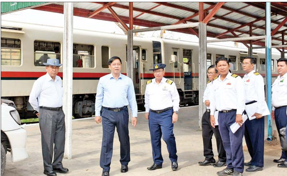
နိုင်ငံတော်စီမံအုပ်ချုပ်ရေးကောင်စီအဖွဲ့ဝင် ဒုတိယဝန်ကြီးချုပ်နှင့် ပြည်ထောင်စုဝန်ကြီး ဗိုလ်ချုပ်ကြီး တင်အောင်စန်း ပြည်တော်သာ(စစ်တွေ) ဘူတာသို့ ရထားပြေးဆွဲမှုနှင့် ရထားလမ်းပိုင်းအခြေအနေများ ကြည့်ရှုစစ်ဆေးစဉ်။

စစ်တွေ ဇွန် ၂ နိုင်ငံတော်စီမံအုပ်ချုပ်ရေး ကောင်စီအဖွဲ့ဝင် ဒုတိယဝန်ကြီး ချုပ်နှင့် ပြည်ထောင်စုဝန်ကြီး ဗိုလ်ချုပ်ကြီး တင်အောင်စန်းသည် ဒုတိယဗိုလ်ချုပ်ကြီး ထွန်းထွန်း နောင်၊ ရခိုင်ပြည်နယ် ဝန်ကြီးချုပ် ဦးထိန်လင်းတို့နှင့်အတူ ယနေ့ နံနက်ပိုင်းတွင် ပြည်တော်သာ (စစ်တွေ)-ရေချမ်းပြင် ရထားလမ်း ပိုင်း၊ စစ်တွေမြို့ရှိ တက္ကသိုလ်များ နှင့် အမှတ်(၁၀) အခြေခံပညာ အထက်တန်းကျောင်းတို့သို့ သွား ရောက်ကြည့်ရှုစစ်ဆေးသည်။