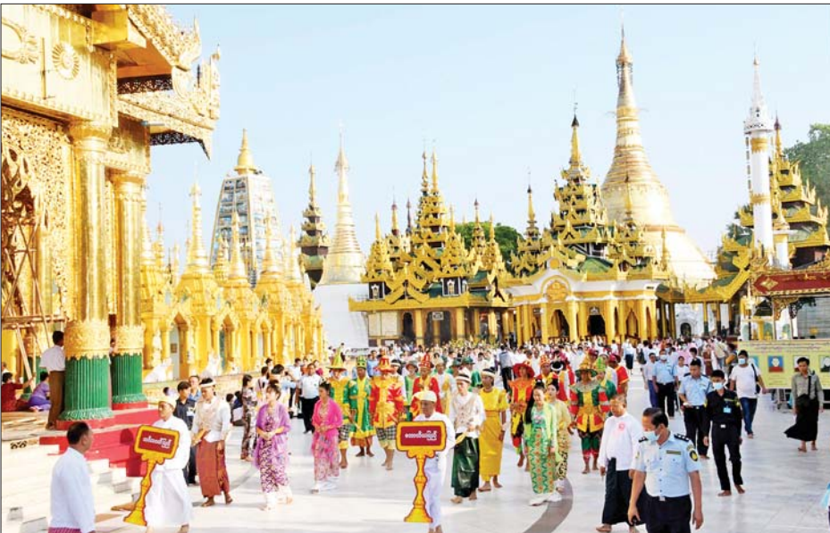
၁၃၈၅ ခုနှစ် နယုန်လပြည့်နေ့(မဟာသမယအခါတော်နေ့) အခမ်းအနား ရွှေတိဂုံစေတီတော်ရင်ပြင်၌ ကျင်းပစဉ်။

ယင်းနောက် နယုန်လပြည့်နေ့(မဟာသမယအခါတော်နေ့) ရေစက်ချပွဲအခမ်းအနားကို ကျင်းပရာ ရွှေတိဂုံစေတီတော်ဘဏ္ဍာတော်ထိန်းဂေါပကအဖွဲ့၊ ဩဝါဒါစရိယ မဟာဝိသုဒ္ဓါရုံတိုက်သစ် ဦးစီးပဓာန နာယက တိပိဋကဓရ တိပိဋကဘဏ္ဍာဂါရိက အဂ္ဂမဟာပဏ္ဍိတ(ယောဆရာတော်)၊ ဘဒ္ဒန္တသီရိန္ဒာ ဘိဝံသထံမှ ဂေါပကအဖွဲ့ဝင်များ၊ ဝန်ထမ်းများနှင့် ဘာသာရေးဝတ်အသင်းအဖွဲ့များက ကိုးပါးသီလ ခံယူဆောက်တည်ကြသည်။