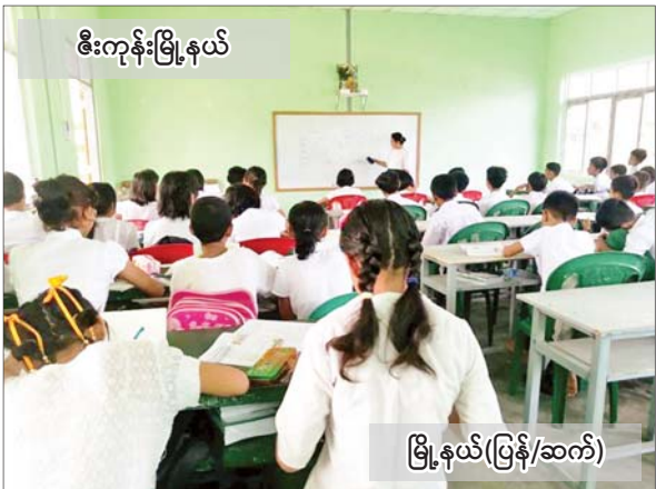
စီးကုန်းမြို့နယ်