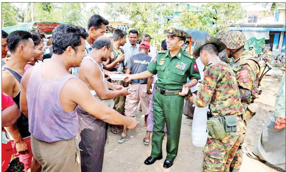
သို့လှောင်ထားရှိမှုများ၊ သောက်သုံးရေ အဆင်ပြေ စေရန်နှင့် လိုအပ်သည့်စားကုန်ပစ္စည်းများ သယ်ယူ ပို့ဆောင်ပေးရန်အတွက် စစ်တွေတပ်နယ်မှ မော်တော်ယာဉ်များ စီစဉ်ဆောင်ရွက်ပေးထားမှု အခြေအနေများကို လိုက်လံရှင်းလင်းပြသကြရာ လိုအပ်သည်များ ညှိနှိုင်းဆောင်ရွက်ပေးခဲ့ကြောင်း သိရသည်။ သတင်းစဉ်

ထို့ပြင် ချက်ပြုတ်ပြင်ဆင် ပေးပို့လှူဒါန်းလျက် ရှိသည့်နေရာများသို့ ကာကွယ်ရေးဦးစီးချုပ်ရုံး (ကြည်း) မှ ဒုတိယဗိုလ်ချုပ်ကြီး ဖုန်းမြတ်၊ အနောက်ပိုင်းတိုင်း စစ်ဌာနချုပ် တိုင်းမှူး ဗိုလ်ချုပ်ထင်လတ်ဦးနှင့် တာဝန်ရှိသူများက သွားရောက်ကြည့်ရှုအားပေးရာ တာဝန်ရှိသူများက ပြင်ဆင်ထုပ်ပိုးရေး၊ ဆန်၊ ကုန်ခြောက်နှင့် ကုန်စိမ်းသီးနှံများ စနစ်တကျ