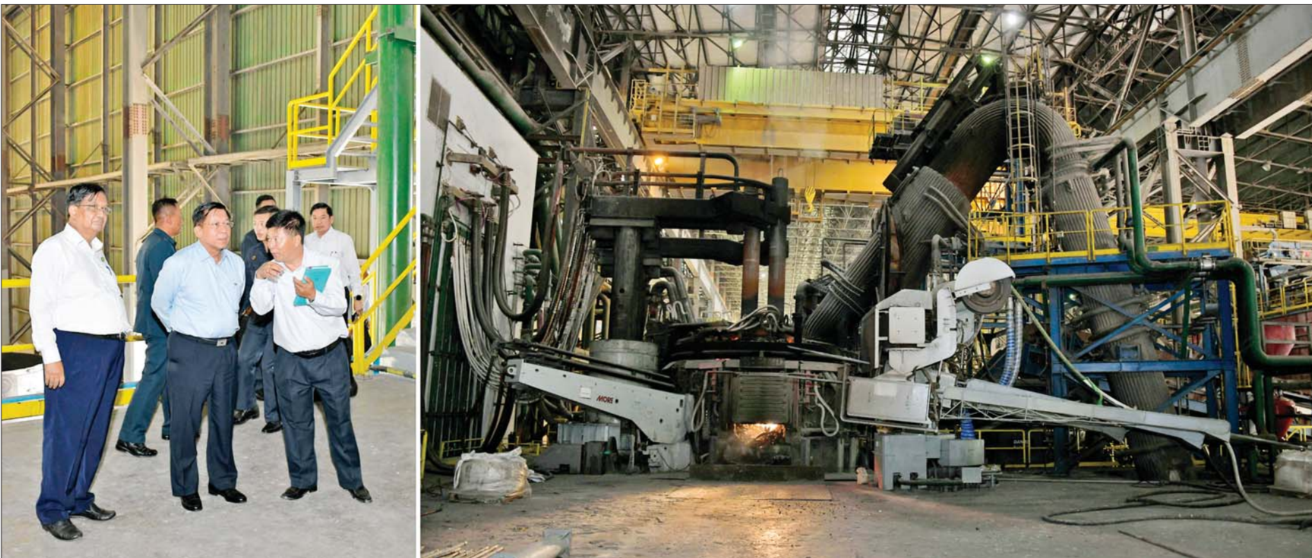
နိုင်ငံတော်စီမံအုပ်ချုပ်ရေးကောင်စီဥက္ကဋ္ဌ နိုင်ငံတော်ဝန်ကြီးချုပ် ဗိုလ်ချုပ်မှူးကြီးမင်းအောင်လှိုင် စက်မှုဝန်ကြီးဌာန အမှတ်(၁)သံမဏိစက်ရုံ(မြင်းခြံ)အတွင်း ကြည့်ရှုစစ်ဆေးစဉ်။