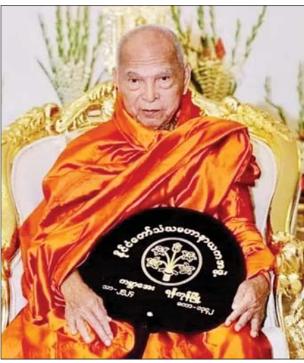
သာသနာ့တက္ကသိုလ်များ၏အဓိပတိအဖြစ်သာသနာ့ တာဝန်တွေကို ဆောင်ရွက်တော်မူခဲ့ပါတယ်။

ဆရာတော်ကြီးဟာ စာပေကျမ်းဂန်တွေ သင်ကြားပို့ချ ရေးသားပြုစုတော်မူခဲ့တဲ့အပြင် သံဃာ့ အဖွဲ့အစည်းတွေမှာလည်း တာဝန်အဆင့်ဆင့် ထမ်းဆောင်တော်မူခဲ့ပြီး ၂၀၀၀ ပြည့်နှစ် ဇူလိုင်လမှ ယခုဘဝနတ်ထံပျံလွန်တော်မူတဲ့အထိ နိုင်ငံတော် သံဃမဟာနာယကအဖွဲ့ဥက္ကဋ္ဌ၊ နိုင်ငံတော်ဗဟို သံဃာ့ဝန်ဆောင်အဖွဲ့ဥက္ကဋ္ဌ၊ နိုင်ငံတော်ပရိယတ္တိ