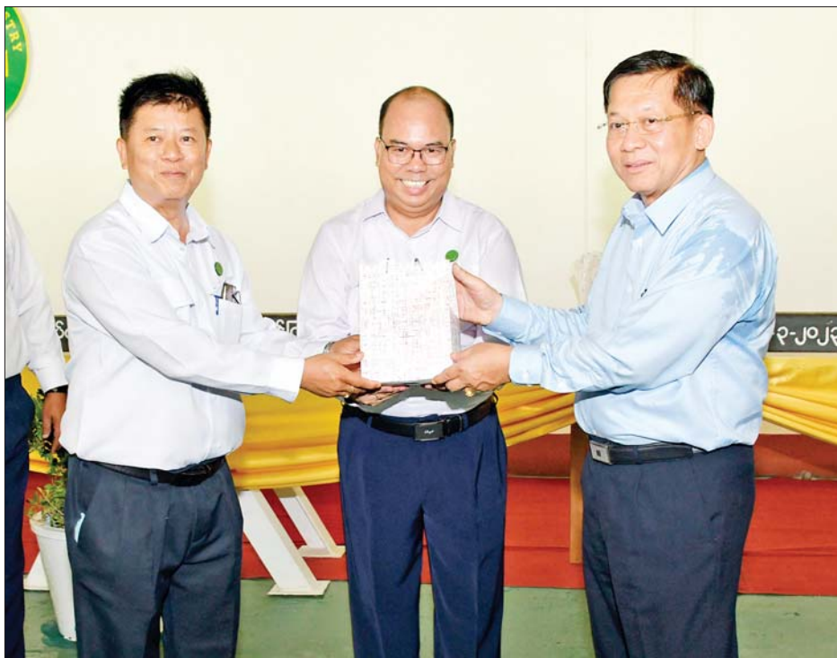
နိုင်ငံတော်စီမံအုပ်ချုပ်ရေးကောင်စီဥက္ကဋ္ဌ နိုင်ငံတော်ဝန်ကြီးချုပ် ဗိုလ်ချုပ်မှူးကြီးမင်းအောင်လှိုင် ထံ စက်မှုဝန်ကြီးဌာန အမှတ်(၁)သံမဏိစက်ရုံ(မြင်းခြံ)မှ တာဝန်ရှိသူများက အမှတ်တရလက်ဆောင် ပစ္စည်း ပေးအပ်စဉ်။