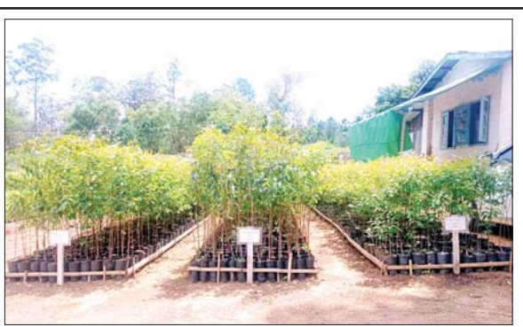
ရှမ်းပြည်နယ်(မြောက်ပိုင်း) ကွတ်ခိုင်မြို့နယ် သစ်တောဦးစီး ဌာနက မိုးရာသီတွင်ရပ်ကွက်/ကျေးရွာများရှိ ပြည်သူလူထုများအား အခမဲ့ပေးအပ်နိုင်ရန် ဆူးထင်းရှူးပင် ၂၀၀၀၊ ရေသင်းဝင်ပင် ၃၀၀၀ ယူကလစ်ပင် ၁၈၀၀၀နှင့် ချယ်ရီပင် ၁၃၀၀၀ စုစုပေါင်း အပင် ၃၆၀၀၀ ကို ကွတ်ခိုင်မြို့နယ် သစ်တောဦးစီးဌာန ပျိုးဥယျာဉ်ခြံတွင် စနစ်တကျ ပျိုးထောင်စိုက်ပျိုးထားစဉ်။ မြို့နယ်(ပြန်/ဆက်)

ပန်းတောင်း မေ ၃၁ ပဲခူးတိုင်းဒေသကြီးအစိုးရအဖွဲ့၏ နိုင်ငံစီးပွားမြှင့်တင်ရေး ရန်ပုံငွေ ဖြင့် စိုက်ပျိုးရေး၊ မွေးမြူရေးနှင့် MSMEs (ယိုစုံ) လုပ်ငန်းရှင်များအား မတည်ထောက်ပံ့ငွေများ ပေးအပ်ခြင်းအခမ်းအနားကို မြို့နယ်အထွေထွေ အုပ်ချုပ်ရေးဦးစီးဌာန အစည်းအဝေးခန်းမ၌ မေ ၂၇ ရက် မွန်းလွဲ ၂ နာရီက ကျင်းပသည်။ အခမ်းအနားတွင် ပြည်ခရိုင်စီမံအုပ်ချုပ်ရေးအဖွဲ့ ဥက္ကဋ္ဌ ဦးသိန်းအောင် က အဖွင့်အမှာစကားပြောကြားပြီး မြို့နယ်စီမံအုပ်ချုပ်ရေးအဖွဲ့ဥက္ကဋ္ဌ ဦးအောင်သူရက နိုင်ငံတော်မှနိုင်ငံစီးပွားမြှင့်တင်ရေး ရန်ပုံငွေဖြင့် စိုက်ပျိုးရေး၊ မွေးမြူရေးနှင့် MSMEs (ယိုစုံ)လုပ်ငန်းရှင်များအား မတည် ငွေများထုတ်ပေးခြင်း အကြောင်းအရာများကို ရှင်းလင်းတင်ပြသည်။ ထို့နောက် နိုင်ငံစီးပွားမြှင့်တင်ရေး ရန်ပုံငွေ စုစုပေါင်းငွေကျပ် ၁၃၈၄ သိန်းတို့အား မတည်ထောက်ပံ့ လွှဲပြောင်းပေးအပ်ခဲ့ကြောင်း သိရသည်။ အောင်မြင်(ပန်းတောင်း)