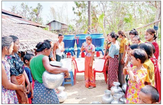
ပုဏ္ဏားကျွန်းမြို့နယ်၌ Life Straw ရေသန့်စက်များ ဖြန့်ဝေပေးထားမှုကို တွေ့ရစဉ်။