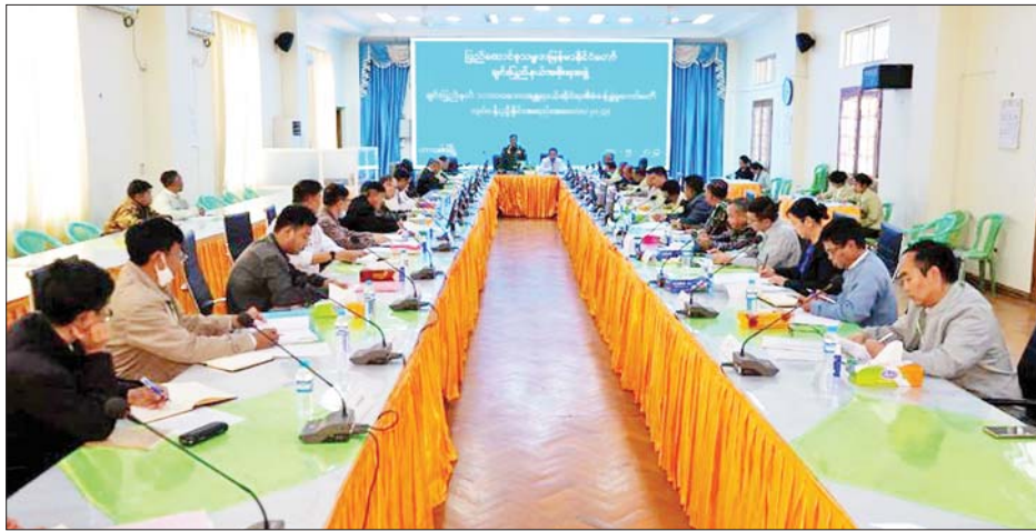
ချင်းပြည်နယ် သဘာဝဘေးအန္တရာယ်ဆိုင်ရာ စီမံခန့်ခွဲမှုအဖွဲ့ လုပ်ငန်းညှိနှိုင်းအစည်းအဝေးတွင် ဒုတိယဗိုလ်ချုပ်ကြီးမင်းနိုင် အမှာစကားပြောကြားစဉ်။

ဦးစွာ ပြည်နယ်ဝန်ကြီးချုပ်နှင့် ဒုတိယ ဗိုလ်ချုပ်ကြီးမင်းနိုင်တို့က အဖွဲ့အမှတ်စဉ်များ အသီးသီးပြောကြားသည်။ ထို့နောက်တာဝန်ရှိသူများ