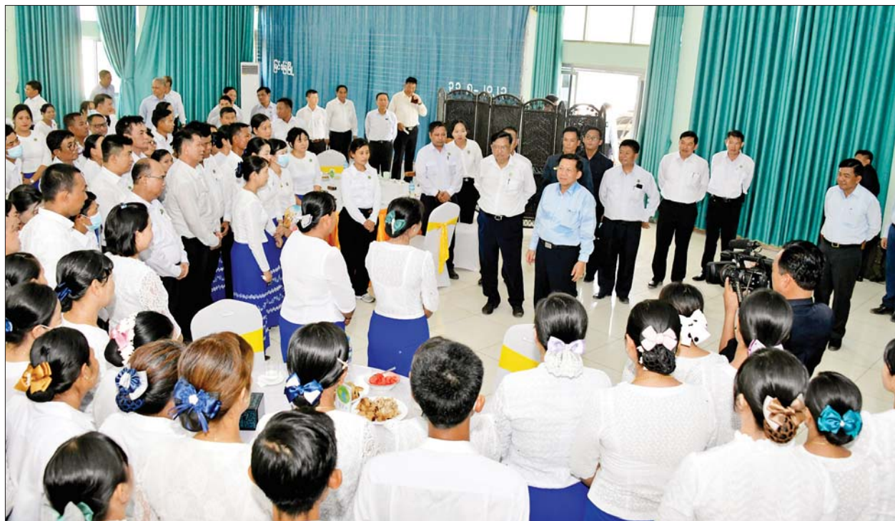
နိုင်ငံတော်စီမံအုပ်ချုပ်ရေးကောင်စီဥက္ကဋ္ဌ နိုင်ငံတော်ဝန်ကြီးချုပ် ဗိုလ်ချုပ်မှူးကြီးမင်းအောင်လှိုင် စက်မှုဝန်ကြီးဌာန အမှတ်(၁)သံမဏိ စက်ရုံ(မြင်းခြံ)မှ ဝန်ထမ်းများကို သံမဏိထုတ်လုပ်မှုများ တိုးတက်စေရေး အားပေးစကားပြောကြားကာ ရင်းရင်းနှီးနှီး နှုတ်ဆက်စဉ်။

ကောင်းများ ရရှိရေးအတွက်လည်း ဆောင်ရွက်သွားရန်နှင့် မွေးထုတ် သွားရန်လိုကြောင်း၊ ဝန်ထမ်းများ ၏ နေထိုင်စားသောက်မှု အဆင် ပြေစေရေးအတွက်လည်း စီမံ ဆောင်ရွက်ပေးရန် လိုကြောင်း၊ နောင်အနာဂတ်တွင် စက်ရုံသို့