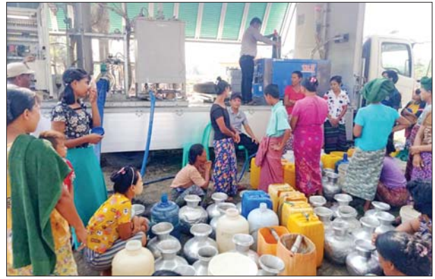
ရသေ့တောင်မြို့နယ်၌ ရေသန့်စင်ကားဖြင့် သောက်သုံးရေဖြန့်ဝေပေးနေမှုကို တွေ့ရစဉ်။