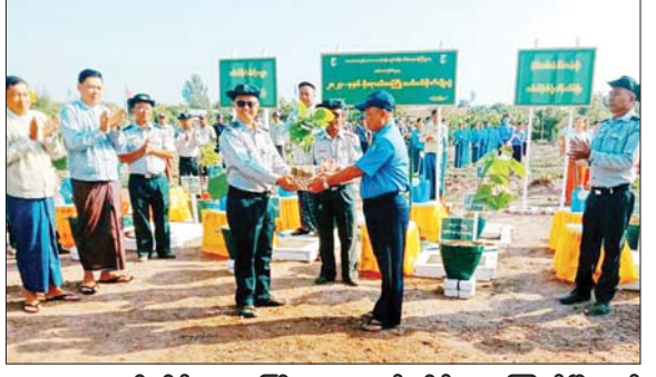
ဧရာဝတီတိုင်းဒေသကြီး ကျိုပျော်ခရိုင် ရေကြည်မြို့နယ် ငါးသိုင်းချောင်းမြို့ မိသားစုကျေးရွာအုပ်စု ၃၄၄ အမြောက်တပ်ရင်း ပိုင်မြေအတွင်း၌ မြို့နယ်သစ်တောဦးစီးဌာနမှဦးဆောင်၍ မေ ၂၉ ရက် နံနက် ၉ နာရီက မိုးရာသီအကြိုသစ်ပင်စိုက်ပျိုးပွဲကျင်းပစဉ်။ (ခရိုင်/မြို့နယ်အဆင့် တာဝန်ရှိသူများ၊ နယ်မြေခံတပ်နယ်မှ တပ်ဖွဲ့ဝင်များ၊ လူမှုရေးအသင်းအဖွဲ့များက ကျွန်းပျိုးပင် ၁၀၀၊ မန်ဂျန်ရှား ပျိုးပင် ၉၀၀ စုစုပေါင်းပျိုးပင် ၁၀၀၀ တို့ကို စုပေါင်း စိုက်ပျိုးကြသည်။ မြို့နယ်(ပြန်/ဆက်)