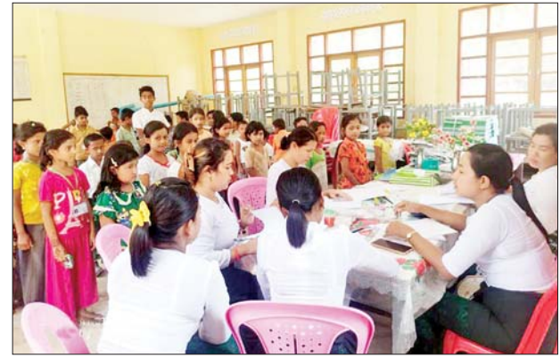
မောင်တောမြို့နယ် ကျောက်လှေကား (မူလွန်)၌ ကျောင်းအပ်လက်ခံမှုကို တွေ့ရစဉ်။