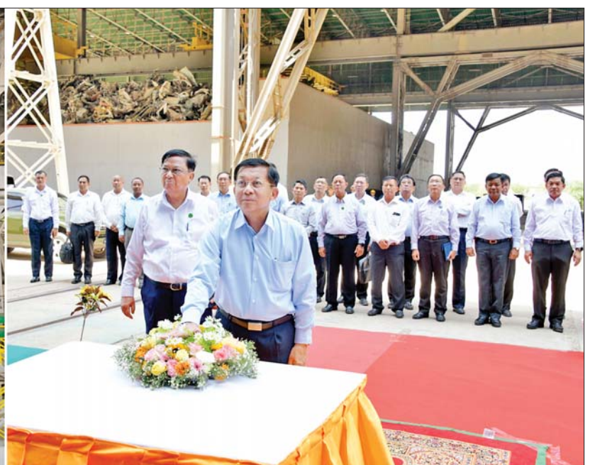
နိုင်ငံတော်စီမံအုပ်ချုပ်ရေးကောင်စီဥက္ကဋ္ဌ နိုင်ငံတော်ဝန်ကြီးချုပ် ဗိုလ်ချုပ်မှူးကြီးမင်းအောင်လှိုင် Melt shop-1 သံရည်ကျိုခြင်းနှင့် လေးထောင့်သံမဏိတုံး Billet ထုတ်လုပ် ခြင်းလုပ်ငန်းအား စက်ခလုတ်နှိပ် ဖွင့်လှစ်ပေးစဉ်။

လိုအပ်ချက်အနေဖြင့် နှစ်စဉ် တန်ချိန်နှစ်သန်းခန့်ရှိပြီး ပြည်ပဌေး များစွာ သုံးစွဲနေကြောင်း၊ ထို့ကြောင့် ယခင်အစိုးရလက်ထက် က ရပ်တန့်ခဲ့သည့် စက်ရုံအား ပြန်လည် လည်ပတ်နိုင်ရေး ဆောင်ရွက်ခဲ့ခြင်း ဖြစ်ကြောင်း၊ သံမဏိထုတ်လုပ်ရေး အတွက်