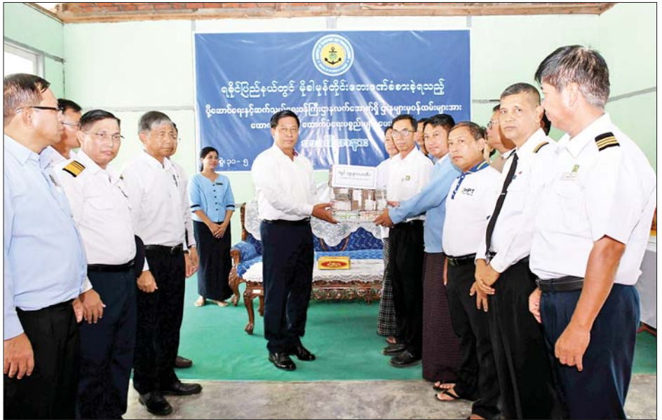
နိုင်ငံတော်စီမံအုပ်ချုပ်ရေးကောင်စီအဖွဲ့ဝင် ဒုတိယဝန်ကြီးချုပ်နှင့် ပြည်ထောင်စုဝန်ကြီး ဗိုလ်ချုပ်ကြီး တင်အောင်စန်း ပို့ဆောင်ရေးနှင့် ဆက်သွယ်ရေးဝန်ကြီးဌာနလက်အောက်ရှိ ဌာနများမှ ဝန်ထမ်းများအား ထောက်ပံ့ငွေနှင့် ထောက်ပံ့ပစ္စည်းများ ပေးအပ်စဉ်။

စစ်တွေမြို့ပေါ်ရှိ ရပ်ကွက်များ၌ လှည့်လည် သန့်စင်ဖြန့်ဝေပေးလျက်ရှိပြီး အဆိုပါရေသန့်စက်များသည် တစ်နာရီလျှင် ဂါလန် ၃၀၀ ခန့် သန့်စင်ပေးနိုင်သည်။ ထို့ပြင် ဆိုလာစနစ်သုံး ရေသန့်စက် ၁၇လုံး ထပ်မံရောက်ရှိလာမည်ဖြစ်ပြီး မုန်တိုင်းဒဏ်သင့် မြို့နယ်များအတွင်းရှိ ကျေးရွာများသို့ ဆက်လက်ဖြန့်ခွဲပေးပို့သွားမည်ဖြစ်သည်။ ၂၀၂၃-၂၀၂၄ ပညာသင်နှစ်အတွက် အခြေခံပညာကျောင်းများကို ဇွန် ၁ ရက်တွင် စတင်ဖွင့်လှစ်မည်ဖြစ်ပြီး မေ ၂၃ ရက်မှ ၃၁ ရက်အထိ ကျောင်းအပ်နှံရေးရက်သတ္တပတ်အဖြစ် သတ်မှတ်၍ တစ်နိုင်ငံလုံး အတိုင်းအတာဖြင့် ကျောင်းအပ်နှံ လက်ခံမှုများ ဆောင်ရွက်လျက်ရှိရာ ရခိုင်ပြည်နယ်အတွင်းရှိ အခြေခံပညာကျောင်းများ၊ ကိုယ်ပိုင်ကျောင်းများ၊ ဘုန်းတော်ကြီးသင်ပညာရေးကျောင်းများ၌ ယနေ့အထိ အခြေခံပညာ (အထက်တန်း၊ အလယ်တန်း၊ မူလတန်း) ကျောင်းအပ်နှံမှုအခြေအနေမှာ မြို့နယ် ၁၇ မြို့နယ်တွင် စုစုပေါင်း ၃၇၄၉၀၄ ဦး ကျောင်းအပ်နှံခဲ့ပြီးဖြစ်ကြောင်းနှင့် ရခိုင်ပြည်နယ်အတွင်းရှိ အထက်တန်း၊ အလယ်တန်းနှင့် မူလတန်းကျောင်းများ အားလုံး တစ်ပြိုင်တည်း ဖွင့်လှစ်သွားမည်ဖြစ်ကြောင်း သိရသည်။