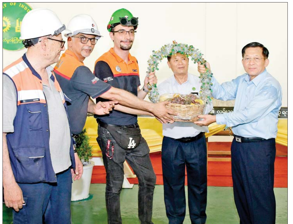
နိုင်ငံတော်စီမံအုပ်ချုပ်ရေးကောင်စီဥက္ကဋ္ဌ နိုင်ငံတော်ဝန်ကြီးချုပ် ဗိုလ်ချုပ်မှူးကြီးမင်းအောင်လှိုင် စက်မှုဝန်ကြီးဌာန အမှတ်(၁)သံမဏိစက်ရုံ(မြင်းခြံ)တွင် တာဝန်ထမ်းဆောင်လျက်ရှိသည့် ပြည်ပညာရှင် များအား သစ်သီးခြင်း ပေးအပ်စဉ်။

ယင်းနောက် နိုင်ငံတော်စီမံ အုပ်ချုပ်ရေးကောင်စီဥက္ကဋ္ဌ နိုင်ငံ တော်ဝန်ကြီးချုပ်နှင့် အဖွဲ့ဝင်များ သည် Melt Shop-1 အတွင်း လျှပ်စစ်သံရည်ကျိုဌာန၌ သံရည် ကျိုလုပ်ငန်းများ ဆောင်ရွက်နေမှု၊ စဉ်ဆက်မပြတ် သံရည်ကျို ပုံလောင်းဌာနမှ ၉ မီတာအရှည်ရှိ သံမဏိလေးထောင့်တုံး (Steel Billet)များ ထုတ်လုပ်နေမှုကို တစ်ခုချင်း အသေးစိတ်ကြည့်ရှု စစ်ဆေးရာ ဌာနအလိုက် တာဝန် ရှိသူများ၏ ရှင်းလင်းတင်ပြမှုများ အပေါ် နိုင်ငံတော်စီမံအုပ်ချုပ်ရေး ကောင်စီဥက္ကဋ္ဌ နိုင်ငံတော်ဝန်ကြီး ချုပ်က လိုအပ်သည်များလမ်းညွှန် မှာကြားသည်။