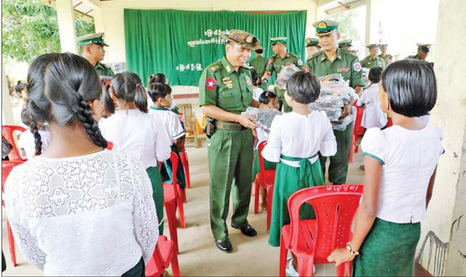
တိုင်းရန်အောင်ခန်းမနှင့် ကွပ်ကဲမှုအောက် တပ်နယ် အသီးသီးတို့၌ လည်းကောင်း၊ ရန်ကုန်တိုင်းစစ်ဌာနချုပ် အနောက်ပိုင်းတိုင်းစစ်ဌာနချုပ် စစ်တွေတပ်နယ်ရှိ မေဃဝတီခန်းမနှင့် ကွပ်ကဲမှုအောက် တပ်နယ် အသီးသီးတို့၌ လည်းကောင်း၊ အလေးတူကမ်းရိုးတန်းဒေသ တိုင်းစစ်ဌာနချုပ်