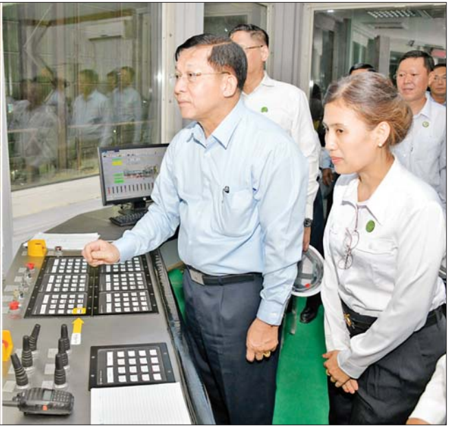
နိုင်ငံတော်စီမံအုပ်ချုပ်ရေးကောင်စီဥက္ကဋ္ဌ နိုင်ငံတော်ဝန်ကြီးချုပ် ဗိုလ်ချုပ်မှူးကြီးမင်းအောင်လှိုင် လျှပ်စစ်သံရည်ကျိုဌာနရှိ သံရည်ကျိုလုပ်ငန်းအား စက်ခလုတ်နှိပ်၍ စတင်လည်ပတ်ပေးစဉ်။