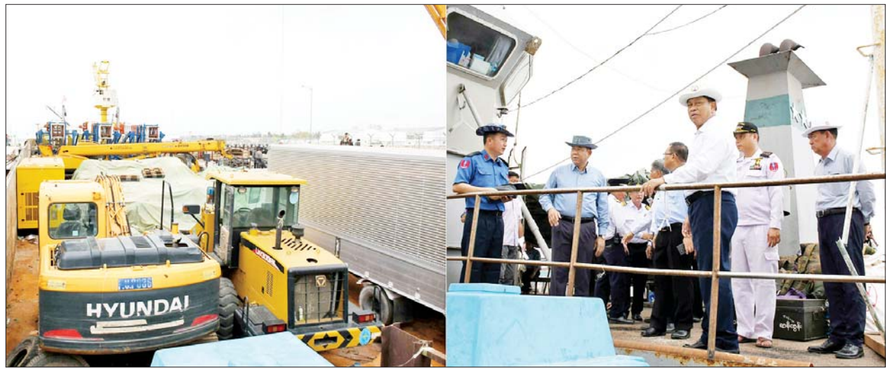
နိုင်ငံတော်စီမံအုပ်ချုပ်ရေးကောင်စီအဖွဲ့ဝင် ဒုတိယဝန်ကြီးချုပ်နှင့် ပြည်ထောင်စုဝန်ကြီး ဗိုလ်ချုပ်ကြီးတင်အောင်စန်းနှင့် အဖွဲ့ဝင်များ စစ်တွေမြို့ ဖောင်တော်ကြီးဆိပ်ခံတံတား၌ ပြန်လည်ထူထောင်ရေးလုပ်ငန်းများတွင် အသုံးပြုမည့်ပစ္စည်းများကို ကြည့်ရှုစစ်ဆေးစဉ်။

တွင်လည်း အုပ်ချုပ်မှုအဆောက်အအုံများ၊ လူနေအဆောက်အအုံများ ထိခိုက်ပျက်စီးမှုရှိခဲ့ကြောင်း၊ ကူညီကယ်ဆယ်ရေးနှင့် ပြန်လည်ထူထောင်ရေးပစ္စည်းများ ခွဲဝေရရှိမှုအပေါ်မူတည်၍ ဦးစားပေးအစီအစဉ်အလိုက် ဆက်လက်ဖြည့်ဆည်း ဆောင်ရွက်ပေးသွားမည်ဖြစ်ကြောင်း၊ ယခုပေးအပ်သည့် ထောက်ပံ့ငွေများသည် လတ်တလော အရေးပေါ်သုံးစွဲရမည့် ကိစ္စရပ်များအတွက် အထောက်အပံ့ဖြစ်စေရန် ပေးအပ်ခြင်းဖြစ်ကြောင်း၊ ထို့ကြောင့် မုန်တိုင်းဒဏ်သင့် အခြားဒေသများသို့ ဆောလျင်စွာပေးပို့ ထောက်ပံ့သွားရန် လိုအပ်ကြောင်း ပြောကြားသည်။ ပေးအပ်ထိုနေ့က ဗိုလ်ချုပ်ကြီး တင်အောင်စန်းသည် ထောက်ပံ့ငွေနှင့် ထောက်ပံ့ပစ္စည်းများကို ပေးအပ်ရာ ဌာနအလိုက် တာဝန်ရှိသူများက လက်ခံရယူကြပြီး ဝန်ထမ်းတစ်ဦးက ကျေးဇူးတင်စကား ပြန်လည်ပြောကြားသည်။ ယင်းနေ့က မြန်မာ့ဆိပ်ကမ်း အာဏာပိုင် ဖောင်တော်ကြီးဆိပ်ခံတံတား၌ AQUARIUS သင်္ဘောပေါ်မှ ပြန်လည်ထူထောင်ရေး လုပ်ငန်းများတွင် အသုံးပြုမည့် ပစ္စည်းများကို စက်ယန္တရားကြီး