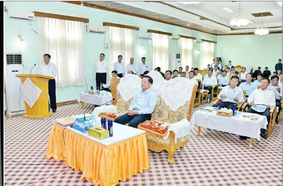
နိုင်ငံတော်စီမံအုပ်ချုပ်ရေးကောင်စီဥက္ကဋ္ဌ နိုင်ငံတော်ဝန်ကြီးချုပ် ဗိုလ်ချုပ်မှူးကြီးမင်းအောင်လှိုင်အား ပြည်ထောင်စုဝန်ကြီး ဒေါက်တာချာလီသန်းက ရင်းလင်းတင်ပြစဉ်။

☆ ရှေ့ဖို့မှ ဦးစားပေး ဆောင်ရွက်လျက်ရှိမှု များကိုလည်းကောင်း၊ ဒုတိယ ဝန်ကြီး ဦးရင်မောင်ညွန့်က အမှတ်(၁) သံမဏိစက်ရုံ (မြင်းခြံ) ၏ လုပ်ငန်းဆောင်ရွက်နေမှုများ၊ သံရည်ကျိုအလုပ်ရုံ Melt Shop-1 ဆိုင်ရာ အချက်အလက်များ၊ ၂၀၁၇ ခုနှစ်နောက်ပိုင်း စက်ရုံ စီမံကိန်း ရပ်တန့်ခဲ့ကြောင်း စက်ရုံပြန်လည်လည်ပတ်နိုင်ရေး ဆောင်ရွက်ရာတွင် ပြင်ဆင် ထိန်းသိမ်း ဆောင်ရွက်ခဲ့မှုများ၊ ၂၀၂၃ ခုနှစ် မတ်လ ၂၄ ရက်မှစ၍ သံရည်ကျိုလုပ်ငန်းဆောင်ရွက်ခဲ့မှု များ၊ စီမံကိန်းအကောင်အထည် ဖော်ရာတွင် ကြုံတွေ့ရသည့် အခက်အခဲများနှင့် စီမံဆောင်ရွက် ထားရှိမှု အခြေအနေများနှင့် ဆက်လက် ဆောင်ရွက်သွားမည့် အစီအစဉ်များကို ရင်းလင်းတင်ပြ သည်။