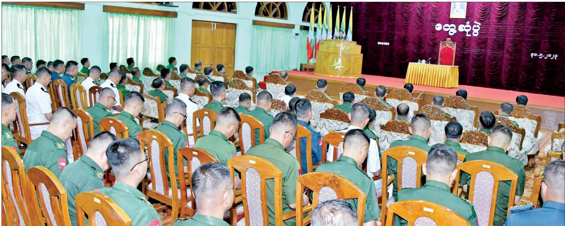
နိုင်ငံတော်စီမံအုပ်ချုပ်ရေးကောင်စီဥက္ကဋ္ဌ တပ်မတော်ကာကွယ်ရေးဦးစီးချုပ် ဗိုလ်ချုပ်မှူးကြီးမင်းအောင်လှိုင် စစ်ဦးစီးတက္ကသိုလ်မှ နည်းပြအရာရှိကြီးများနှင့် သင်တန်းသားအရာရှိကြီးများအား တွေ့ဆုံအမှာစကား ပြောကြားစဉ်။