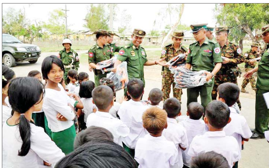
လိုင်စင်ရကန်ထရိုက်တာများ အသင်းချုပ်(MMCA) နှင့် အလှူရှင်များ၏ စုပေါင်းလှူဒါန်းမှုဖြင့် ချက်ပြုတ်ပေးပို့လှူဒါန်းသည့် ဒံပေါက်ထမင်းဘူးများ၊ စားသောက်ဖွယ်ရာပစ္စည်းများနှင့် လူသုံးကုန်ပစ္စည်းများ ထောက်ပံ့ပေးအပ်သည်။ ယင်းနောက် အခြေခံပညာကျောင်းများသို့

နေပြည်တော် မေ ၃၀ ရခိုင်ပြည်နယ် စစ်တွေ၊ မင်းပြား၊ မြောက်ဦးတပ်နယ်တို့ရှိ နယ်မြေခံတပ်များသို့ ယနေ့တွင် ကာကွယ်ရေးဦးစီးချုပ်(ကြည်း)မှ ဒုတိယဗိုလ်ချုပ်ကြီး ဖုန်းမြတ်၊ အနောက်ပိုင်းတိုင်းစစ်ဌာနချုပ်တိုင်းမှူး ဗိုလ်ချုပ်ထင်လတ်ဦးနှင့် အဖွဲ့ဝင်များက သွားရောက်ကြည့်ရှုစစ်ဆေးရာ တာဝန်ရှိသူများက ပြန်လည်တည်ဆောက်ရေးလုပ်ငန်းများ ဆောင်ရွက်နေမှု၊ သောက်သုံးရေလုံလောက်စွာ ရရှိရေးနှင့် စိုက်ပျိုး/မွေးမြူရေး ဆောင်ရွက်ထားရှိမှုတို့ကို လိုက်လံရှင်းလင်းပြသကြသည်။ ထို့နောက် ကာကွယ်ရေးဦးစီးချုပ်ရုံး(ကြည်း)မှ ဒုတိယဗိုလ်ချုပ်ကြီး ဖုန်းမြတ်နှင့်အဖွဲ့ဝင်များသည် မင်းပြားမြို့နှင့် မြောက်ဦးမြို့တို့ရှိ နယ်မြေခံတပ်ရင်းများမှ တပ်မတော်သားများနှင့် မိသားစုဝင်များ၊ မြန်မာနိုင်ငံရဲတပ်ဖွဲ့ဝင်များ၊ မီးသတ်တပ်ဖွဲ့ဝင်များနှင့် ဒေသခံပြည်သူများအား ရင်းရင်းနှီးနှီးတွေ့ဆုံနှုတ်ဆက် အားပေးစကားပြောကြားပြီး မြန်မာနိုင်ငံ