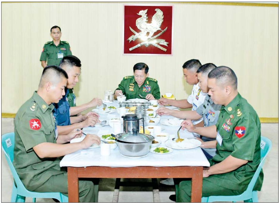
နိုင်ငံတော်စီမံအုပ်ချုပ်ရေးကောင်စီဥက္ကဋ္ဌ တပ်မတော်ကာကွယ်ရေးဦးစီးချုပ် ဗိုလ်ချုပ်မှူးကြီး မင်းအောင်လှိုင် စစ်ဦးစီးတက္ကသိုလ်မှ နည်းပြအရာရှိကြီးများ၊ သင်တန်းသား အရာရှိကြီးများနှင့်အတူ နေ့လယ်စာ အတူတကွ သုံးဆောင်ကြစဉ်။

ထို့နောက် နိုင်ငံတော်စီမံအုပ်ချုပ်ရေးကောင်စီ ဥက္ကဋ္ဌ တပ်မတော်ကာကွယ်ရေးဦးစီးချုပ်နှင့် အဖွဲ့ဝင်များသည် အခမ်းအနားသို့ တက်ရောက်လာကြသည့် နည်းပြအရာရှိကြီးများနှင့် သင်တန်းသား