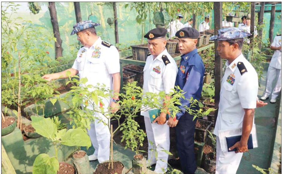
ပေးခဲ့သည်။ ထို့နောက် မဒေးဆိပ်ကမ်းသို့ ရေနံတင်သင်္ဘောကြီးများ ဝင်ရောက်လျက်ရှိသည့် ရေလမ်းကြောင်းအခြေအနေများကို လှည့်လည်ကြည့်ရှုစစ်ဆေးခဲ့ကြောင်း သိရသည်။ သတင်းစဉ်

ရေပိုမိုသိုလှောင်စုဆောင်းနိုင်ရန် ပြုပြင်ထိန်းသိမ်းမှုများ ဆောင်ရွက်သွားရေးတို့ကို မှာကြားခဲ့ပြီး လိုအပ်သည်များ ဖြည့်ဆည်းဆောင်ရွက်ပေးခဲ့သည်။ ဆက်လက်၍ နယ်မြေခံရတပ်စခန်းဌာနချုပ်ကွပ်ကဲမှုအောက်တပ်သို့ သွားရောက်ပြီး ငါးခူမွေးမြူရေး ဆောင်ရွက်ထားရှိမှုအား ကြည့်ရှုခြင်း၊ ဥစားကြက်ခြံ၊ DYL ဝက်မွေးမြူရေးခြံ၊ ဒေသနွားမွေးမြူရေးခြံနှင့် ဒေသဆိတ်မွေးမြူရေးခြံများအား ကြည့်ရှုစစ်ဆေးခြင်းတို့ ဆောင်ရွက်ခဲ့သည်။ ထို့နောက် ပင်လယ်ကမ်းခြေတစ်လျှောက် အုန်းပင်နှင့်ဒီရေရောက်တောများ စိုက်ပျိုးဖြစ်ထွန်းအောင်မြင်မှုကို ကြည့်ရှုစစ်ဆေးခဲ့ပြီး ယခုနစ်မိုးရာသီတွင် ကြိုတင်စုဆောင်းထားသည့် အုန်းပင်၊ လမုပင်များနှင့် အရိပ်ရလေကာပင်များ ထပ်မံစိုက်ပျိုးနိုင်ရေးမှာကြား၍ နယ်မြေခံ ရတပ်စခန်းဌာနချုပ်ရှိ အရာရှိ၊ စစ်သည်၊ မိသားစုဝင်များအား တွေ့ဆုံအားပေးစကားပြောကြားကာ ထောက်ပံ့ပစ္စည်းများ ပေးအပ်ပြီး လိုအပ်သည်များ ဖြည့်ဆည်းဆောင်ရွက်