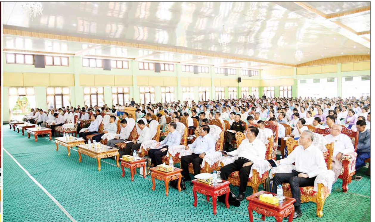
နိုင်ငံတော်စီမံအုပ်ချုပ်ရေးကောင်စီဥက္ကဋ္ဌ နိုင်ငံတော်ဝန်ကြီးချုပ် ဗိုလ်ချုပ်မှူးကြီး မင်းအောင်လှိုင် ဓနကိုယ်ပိုင်အုပ်ချုပ်ခွင့်ရဒေသအတွင်းရှိ အသေးစား၊ အငယ်စားနှင့် အလတ်စား စီးပွားရေး(MSME) လုပ်ငန်းရှင်များအား တွေ့ဆုံအမှာစကားပြောကြားစဉ်။