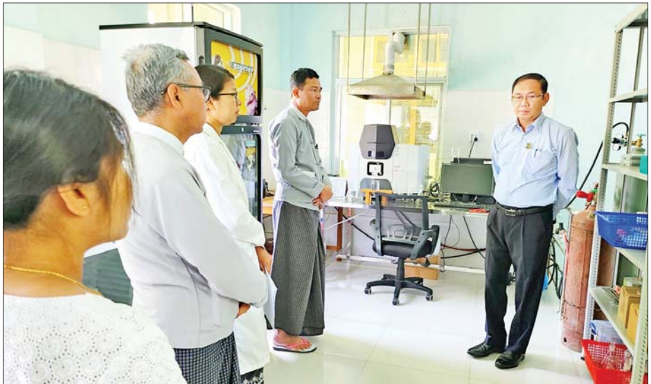
တိုင်းတာရေးစက်ဖြင့် လေထုအရည်အသွေး ကြောင်း သိရသည်။ တိုင်းတာဆောင်ရွက်နေမှုများကို ကြည့်ရှုစစ်ဆေးခဲ့

ရှင်းလင်းတင်ပြပြီး ပြည်ထောင်စုဝန်ကြီးက လိုအပ် သည်များ မှာကြားသည်။ ကြည့်ရှုစစ်ဆေး ထို့နောက် ပြည်ထောင်စုဝန်ကြီးသည် ပြည်နယ် ပတ်ဝန်းကျင်ထိန်းသိမ်းရေး ဦးစီးဌာနရုံးတွင် တပ်ဆင်ထားသော လေထုအရည်အသွေး တိုင်းတာ ရေးစက်ဖြင့် လေထုအရည်အသွေး တိုင်းတာဆောင် ရွက်နေမှု၊ ဓာတ်ခွဲခန်းအတွင်း အင်းလေးကန်နှင့် တောင်ကြီးဒေသ ရေထွက်မှ ရေနမူနာနှင့် စက်ရုံ၊ အလုပ်ရုံများမှထွက်ရှိသော ရေနမူနာများ ဓာတ်ခွဲ စမ်းသပ်နေမှု၊ ရွှေလျားလေထု အရည်အသွေး