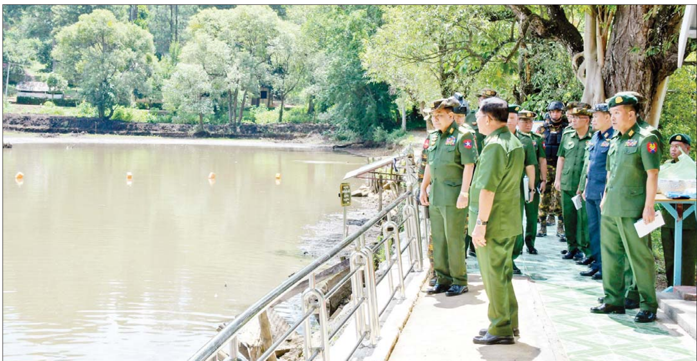
နိုင်ငံတော်စီမံအုပ်ချုပ်ရေးကောင်စီဥက္ကဋ္ဌ တပ်မတော်ကာကွယ်ရေးဦးစီးချုပ် ဗိုလ်ချုပ်မှူးကြီးမင်းအောင်လှိုင် နယ်မြေခံတပ်အတွင်းရှိ နတ်ရေကန်ရေထွက် ရေကန်သန့်ရှင်းရေးဖော်ခြင်းလုပ်ငန်းဆောင်ရွက်ရန် ပြင်ဆင်ထားရှိမှုအား ကြည့်ရှုစစ်ဆေးစဉ်။

မိမိတို့ တစ်ဦးချင်းစီ၏ မျှော်မှန်းချက်၊ ရည်မှန်းချက်များ မပျောက်ပျက်စေရေး စဉ်ဆက်မပြတ်သော ကြိုးစားအားထုတ်မှုရှိရမည် ဦးစွာ နိုင်ငံတော်စီမံအုပ်ချုပ်ရေးကောင်စီဥက္ကဋ္ဌ တပ်မတော်ကာကွယ်ရေးဦးစီးချုပ်က အမှာစကား ပြောကြားရာတွင် စစ်ဦးစီးတက္ကသိုလ်သည် လက်ရုံး ရည်၊ စာမျက်နှာ ၅ သို့ *