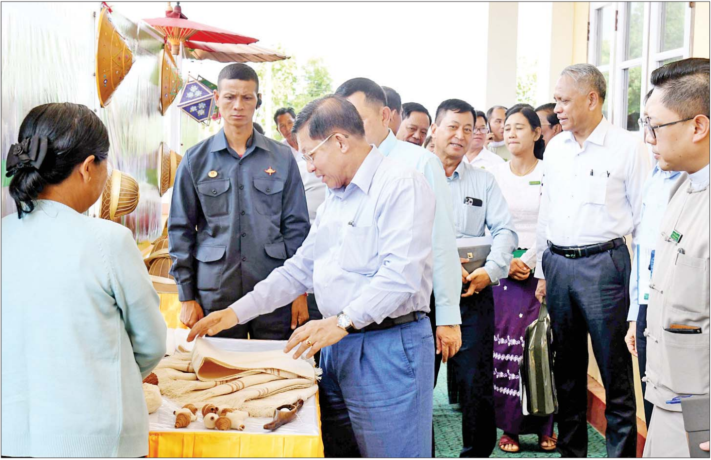
နိုင်ငံတော်စီမံအုပ်ချုပ်ရေးကောင်စီဥက္ကဋ္ဌ နိုင်ငံတော်ဝန်ကြီးချုပ် ဗိုလ်ချုပ်မှူးကြီး မင်းအောင်လှိုင် ဓနကိုယ်ပိုင်အုပ်ချုပ်ခွင့်ရဒေသ ထုတ်ကုန်ပစ္စည်းများခင်းကျင်းပြသထားရှိမှုကို ကြည့်ရှုလေ့လာစဉ်။

ပြည်ထောင်စုဝန်ကြီးများက သက်ဆိုင်ရာကဏ္ဍအလိုက် ပြန်လည်ရှင်းလင်းဆွေးနွေး ဆက်လက်ပြီး လုပ်ငန်းရှင်များ၏ တစ်ဦးချင်းရှင်းလင်းတင်ပြမှုများနှင့်ပတ်သက်၍ ပြည်ထောင်စုဝန်ကြီးများက နိုင်ငံစီးပွားဖွံ့ဖြိုးတိုးတက်ရေးအတွက် အသေးစား၊ အငယ်စားနှင့် အလတ်စား စီးပွားရေး (MSME) လုပ်ငန်းများကို အားပေးဆောင်ရွက်လျက်ရှိမှု၊ နိုင်ငံစီးပွားမြှင့်တင်ရေးရန်ပုံငွေမှ ရင်းနှီးမတည်ငွေများကို ထုတ်ချေးပေးထားမှု၊ ဖွံ့ဖြိုးတိုးတက်ရေး