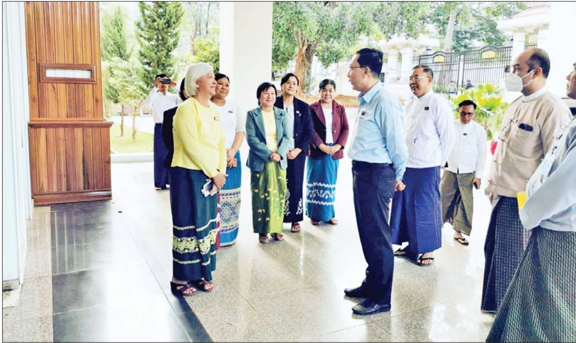
ရှမ်းပြည်နယ် တောင်ကြီးမြို့ရှိ စီမံကိန်း ဝန်ထမ်းများအနေဖြင့် စီမံကိန်းလျာထား အထည်ဖော်ရေးနှင့် စစ်ဆေးကြပ်မတ် ပြည်ထောင်စုဝန်ကြီး ဦးဝင်းရှိန်က နှင့် ဘဏ္ဍာရေးဝန်ကြီးဌာနမှ နိုင်ငံ ချက်များအား အောင်မြင်စွာအကောင် ဆောင်ရွက်ရေး၊ အရည်အသွေးပြည့်မီ

နေပြည်တော် မေ ၃၀ ဒုတိယဝန်ကြီးချုပ်နှင့် စီမံကိန်းနှင့် ဘဏ္ဍာရေးဝန်ကြီးဌာန ပြည်ထောင်စု ဝန်ကြီး ဦးဝင်းရှိန်သည် ယမန်နေ့ နံနက်ပိုင်းတွင် ရှမ်းပြည်နယ် တောင်ကြီး မြို့ရှိ ရသုံးမှန်းခြေငွေစာရင်းဦးစီးဌာန (ပြည်နယ်ရုံး)သို့ သွားရောက်၍ ဝန်ကြီး ဌာနလက်အောက်မှ စီမံကိန်းရေးဆွဲရေး ဦးစီးဌာန၊ ဗဟိုစက်ပစ္စည်း၊ စာရင်းအင်းနှင့် စစ်ဆေးရေးဦးစီးဌာန၊ မြန်မာ့စီးပွားရေး ဘဏ်၊ မြန်မာ့လယ်ယာဖွံ့ဖြိုးရေးဘဏ်၊ မြန်မာ့အာမခံလုပ်ငန်း၊ ရသုံးမှန်းခြေ ငွေစာရင်းဦးစီးဌာန၊ ပြည်တွင်းအခွန်များ ဦးစီးဌာန၊ အကောက်ခွန်ဦးစီးဌာန၊ ငွေရေးကြေးရေး ကြီးကြပ်စစ်ဆေးရေး ဦးစီးဌာနနှင့် ပင်စင်ဦးစီးဌာနတို့မှ ဝန်ထမ်းများကို ရင်းရင်းနှီးနှီး တွေ့ဆုံ နှုတ်ဆက်သည်။