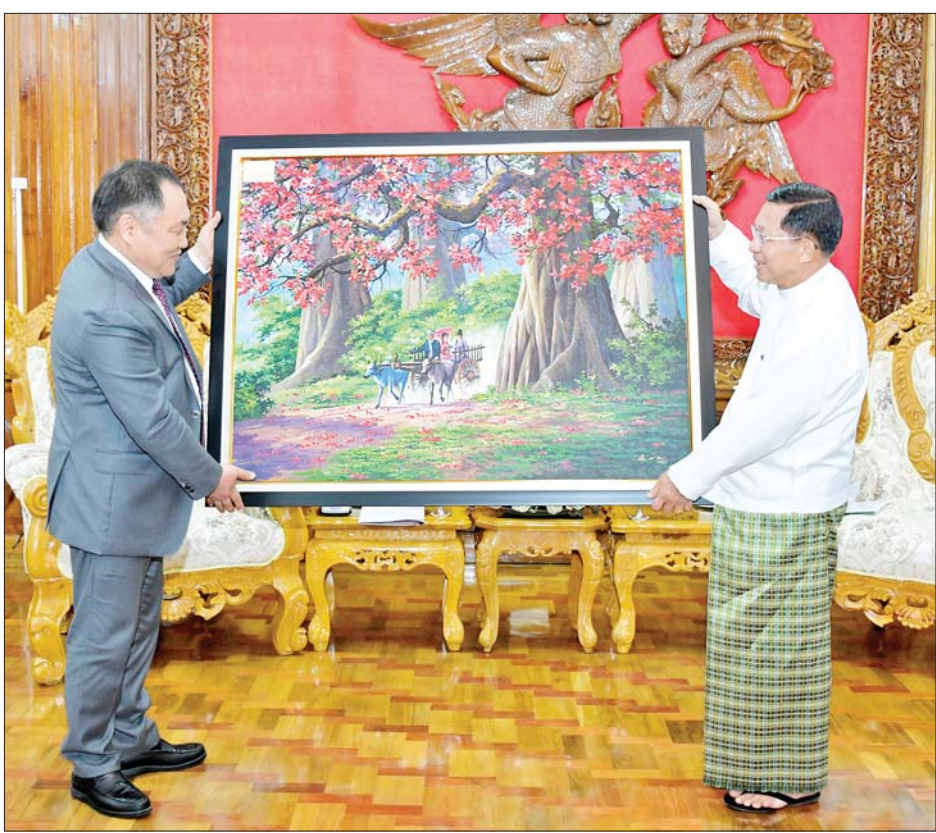
နိုင်ငံတော်စီမံအုပ်ချုပ်ရေးကောင်စီဥက္ကဋ္ဌ နိုင်ငံတော်ဝန်ကြီးချုပ် ဗိုလ်ချုပ်မှူးကြီးမင်းအောင်လှိုင် ရုရှားဖက်ဒရေးရှင်းနိုင်ငံ ဒူးမားလွတ်တော် ဒုတိယဥက္ကဋ္ဌ H.E. Mr.Sholban Kara-Ool အား အမှတ်တရ လက်ဆောင်ပစ္စည်း ပေးအပ်စဉ်။

လက်ဆောင်ပစ္စည်းများ အပြန်အလှန်ပေးအပ် တွေ့ဆုံပွဲအပြီးတွင် နိုင်ငံတော်စီမံအုပ်ချုပ်ရေးကောင်စီဥက္ကဋ္ဌ နိုင်ငံတော်ဝန်ကြီးချုပ်နှင့် ရုရှားဖက်ဒရေးရှင်းနိုင်ငံ ဒူးမားလွတ်တော် ဒုတိယဥက္ကဋ္ဌတို့သည် အမှတ်တရ လက်ဆောင်ပစ္စည်းများ အပြန်အလှန်ပေးအပ်ပြီး မှတ်တမ်းတင်ဓာတ်ပုံရိုက်ခဲ့ကြကြောင်း သိရသည်။ သတင်းစဉ်