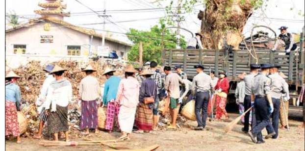
စစ်တွေမြို့၌ မြို့အင်္ဂါရပ်နှင့်အညီ သန့်ရှင်းသာယာလှပစေရေး စုပေါင်းသန့်ရှင်းရေးလုပ်ငန်းများ ဆောင်ရွက်နေစဉ်။