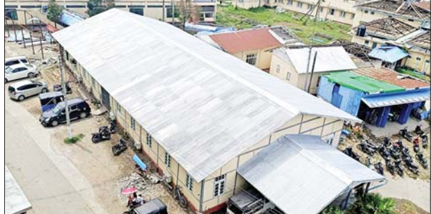
စစ်တွေပြည်သူ့ဆေးရုံကြီး ကျောက်ကပ်ဆေးဆောင် ပြန်လည်ပြုပြင်ဆောင်ရွက်ပြီးစီးမှုကို တွေ့ရစဉ်။