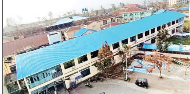
စစ်တွေပြည်သူ့ဆေးရုံကြီး မွေးခန်းနှင့် မွေးလူနာဆောင် ပြန်လည်ပြုပြင်ဆောင်ရွက်ပြီးစီးမှုကို တွေ့ရစဉ်။