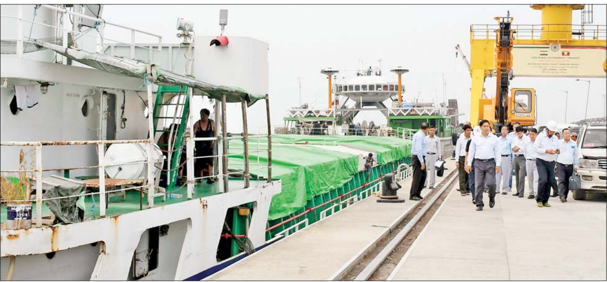
နိုင်ငံတော်စီမံအုပ်ချုပ်ရေးကောင်စီအဖွဲ့ဝင် ဒုတိယဝန်ကြီးချုပ်နှင့် ပြည်ထောင်စုဝန်ကြီး ဗိုလ်ချုပ်ကြီးတင်အောင်စန်း ဘက်စုံသုံးဆိပ်ကမ်း၌ ကူညီကယ်ဆယ်ရေးနှင့် ပြန်လည်ထူထောင်ရေးပစ္စည်းများ ထပ်မံရောက်ရှိလာမှုကို ကြည့်ရှုစစ်ဆေးစဉ်။

သန့်ရှင်းရေးလုပ်ငန်းများကို မကြာခဏ စုပေါင်းဆောင်ရွက်သွားကြရန်နှင့် ပြည်သူလူထု အင်တိုက်အားတိုက် ပူးပေါင်းပါဝင်ဆောင်ရွက်လာရေး စည်းရုံးဆောင်ရွက်သွားကြရန် မှာကြားသည်။ ယင်းနောက် အတုလမာရဇိန်ပြည်လုံးချမ်းသာဘုရားကြီးအား ဖူးမြော်ကြည့်ညိုပြီး ဘုရားကြီးဘက်စုံ ပြုပြင်မွမ်းမံရန်အတွက် အလှူငွေများကို ဂေါပကအဖွဲ့ထံ ပေးအပ်လှူဒါန်း၍ မိုခါမန်တိုင်းဒဏ်ကြောင့် ထိခိုက်ပျက်စီးခဲ့သည့် ဘုရားကြီး သိမ်တော်အား လှည့်လည်ကြည့်ရှုကာ ပြန်လည်ပြုပြင်နိုင်ရေး လိုအပ်သည်များ ဖြည့်ဆည်းဆောင်ရွက်ပေးသည်။ ဆက်လက်၍ ဗိုလ်ချုပ်ကြီးတင်အောင်စန်းနှင့် အဖွဲ့သည် စစ်တွေမြို့ဘက်စုံသုံးဆိပ်ကမ်း၌ ကူညီကယ်ဆယ်ရေးနှင့် ပြန်လည်ထူထောင်ရေး ပစ္စည်းများ သယ်ဆောင်လာသည့် MCL - 5 Yangon သင်္ဘော ဆိုက်ကပ်ရောက်ရှိမှု၊ For Tune သင်္ဘောပေါ်မှ လျှပ်စစ်ပိုင်းဆိုင်ရာ ပြန်လည်ထူထောင်ရေး ပစ္စည်းများအား စက်ယန္တရားကြီးများဖြင့် မော်တော်ယာဉ်များပေါ်သို့ တင်ဆောင်နေမှု၊ မြန်မာ့ဆိပ်ကမ်း အာဏာပိုင်ဖောင်တော်ကြီး ဆိပ်ခံတံတား၌ AQUARIUS သင်္ဘောပေါ်မှ ပြန်လည် ထူထောင်ရေးလုပ်ငန်းများတွင် အသုံးပြုမည့် သစ်ခွဲသားများအား မော်တော်ယာဉ်များပေါ်သို့ မြန်မာနိုင်ငံရဲတပ်ဖွဲ့ဝင်များက တင်ဆောင်ပေးနေမှုကို ကြည့်ရှု