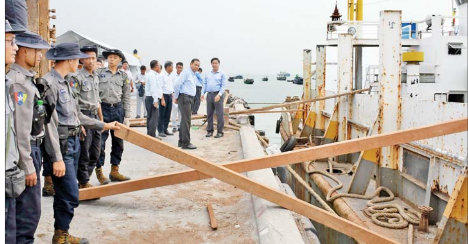
နိုင်ငံတော်စီမံအုပ်ချုပ်ရေးကောင်စီအဖွဲ့ဝင် ဒုတိယဝန်ကြီးချုပ်နှင့် ပြည်ထောင်စုဝန်ကြီး ဗိုလ်ချုပ်ကြီးတင်အောင်စန်း မော်တော်ကြီးဆိပ်ခံတံတား၌ ကူညီကယ်ဆယ်ရေးနှင့် ပြန်လည်ထူထောင်ရေးပစ္စည်းများ ထပ်မံရောက်ရှိလာမှုကို ကြည့်ရှုစစ်ဆေးစဉ်။