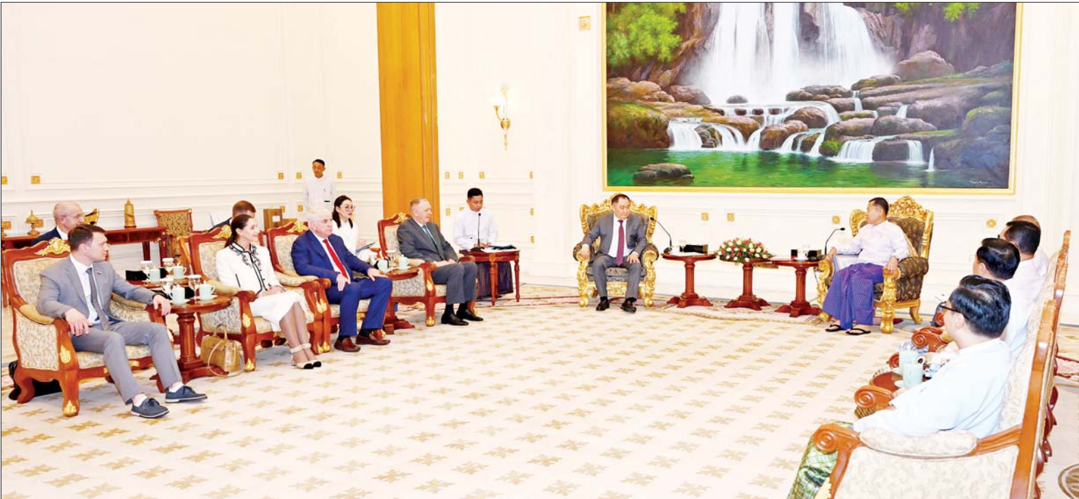
နိုင်ငံတော်စီမံအုပ်ချုပ်ရေးကောင်စီ ဒုတိယဥက္ကဋ္ဌ ဒုတိယဝန်ကြီးချုပ် ဒုတိယဗိုလ်ချုပ်မှူးကြီးစိုးဝင်း ရုရှားဖက်ဒရေးရှင်းနိုင်ငံ ဒူးမားလွတ်တော် ဒုတိယဥက္ကဋ္ဌ H.E.Mr. Sholban Kara-Ool ဦးဆောင်သည့် ကိုယ်စားလှယ်အဖွဲ့အား လက်ခံတွေ့ဆုံသည်။

နေပြည်တော် မေ ၃၀ နိုင်ငံတော် စီမံအုပ်ချုပ်ရေး ကောင်စီ ဒုတိယဥက္ကဋ္ဌ ဒုတိယ ဝန်ကြီးချုပ် ဒုတိယဗိုလ်ချုပ်မှူးကြီး စိုးဝင်းသည် ရုရှားဖက်ဒရေးရှင်း နိုင်ငံ ဒူးမားလွတ်တော် ဒုတိယ ဥက္ကဋ္ဌ H.E.Mr.Sholban Kara-Ool ဦးဆောင်သည့် ကိုယ်စားလှယ်အဖွဲ့ အား ယနေ့ မွန်းလွဲ ၁ နာရီတွင် နေပြည်တော်ရှိ နိုင်ငံတော်စီမံ အုပ်ချုပ်ရေးကောင်စီ ဥက္ကဋ္ဌရုံး သံတမန်ဆောင် ဧည့်ခန်းမ၌ လက်ခံတွေ့ဆုံသည်။ ရင်းနှီးပွင့်လင်းစွာဆွေးနွေး တွေ့ဆုံစဉ် ဆိုင်ကလုန်း မုန်တိုင်း(မိခါ)နှင့် စပ်လျဉ်းသည့် ပြန်လည် ထူထောင်ရေးဆိုင်ရာ ကိစ္စရပ်များ၊ မြန်မာ-ရုရှား နှစ်နိုင်ငံခရီးသွားလုပ်ငန်း ပူးပေါင်း ဆောင်ရွက်ရေးနှင့် ခရီးသွားကဏ္ဍ စာမျက်နှာ ၇ ကော်လံ ၁ သို့ ၀