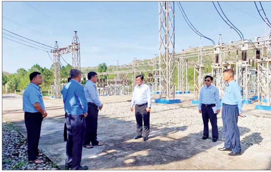
တစ်ဆင့် လက်ခံဖြန့်ဖြူးမည့် ၁၃၂ ကေစီ Switch Bay တိုးချဲ့တည်ဆောက်မည့်နေရာတို့နှင့် လက်ရှိဓာတ်အားလိုင်းများနှင့် ထရန်စဖော်မာများ၏ ဝန်အား

ဦးစွာ ပြည်ထောင်စုဝန်ကြီးသည် တောင်ကြီးပင်မဓာတ်အားခွဲရုံသို့ ရောက်ရှိပြီး Switchyard အတွင်း တောင်ကြီးမြို့၏ တိုးတက်သုံးစွဲလာသော လျှပ်စစ်ဓာတ်အားကို လုံလောက်စွာ သယ်ပို့ဖြန့်ဖြူးနိုင်ရေးနှင့် တည်ငြိမ်သော လျှပ်စစ်ဓာတ်အားရရှိသုံးစွဲနိုင်ရေးအတွက် လိုအပ်လျက်ရှိသည့် ၁၃၂/၆၆/၁၁ ကေစီ ၁၀၀ အမ်ပီအေ ထရန်စဖော်မာ တိုးချဲ့တပ်ဆင် တည်ဆောက်မည့်နေရာ၊ အထက်ကျိုင်းတောင်း ရေအားလျှပ်စစ်စီမံကိန်းပြီးစီးပါက ထွက်ရှိလာမည့်လျှပ်စစ်ဓာတ်အားကို အထက်ကျိုင်းတောင်း-နမ့်စန်-တောင်ကြီး မဟာဓာတ်အားလိုင်းမှ