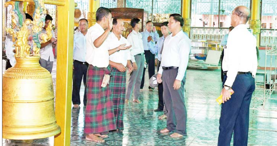
နိုင်ငံတော်စီမံအုပ်ချုပ်ရေးကောင်စီအဖွဲ့ဝင် ဒုတိယဝန်ကြီးချုပ်နှင့် ပြည်ထောင်စုဝန်ကြီး ဗိုလ်ချုပ်ကြီးတင်အောင်စန်း အတုလမာရဇိန်ပြည်လုံးချမ်းသာဘုရားကြီးအား ပြန်လည်ပြုပြင်မွမ်းမံနိုင်ရေး လှည့်လည်ကြည့်ရှုစဉ်။

ဆောင်ကို ပြင်ဆင်ဆောင်ရွက်ပြီးဖြစ်သည်။ ပြင်ဆင်ဆောင်ရွက်လျက်ရှိ ထိုပြင် ပြည်သူ့ကျန်းမာရေးဦးစီးဌာနရှိ ပြည်နယ်ပြည်သူ့ကျန်းမာရေးမှူးရုံးနှင့် ဆေးသိုလှောင်ရုံ စုပေါင်းအဆောင်လေးဆောင်ကို ပြင်ဆင်ဆောင်ရွက်လျက်ရှိရာ ဆေးသိုလှောင်ရုံ နှစ်ဆောင် ရာနှုန်းပြည့် ပြင်ဆင်ဆောင်ရွက်ပြီးစီးပြီဖြစ်ပြီး သူနာပြုသင်တန်းကျောင်းရှိ စာသင်ဆောင်၊ အိပ်ဆောင်နှင့် ဝန်ထမ်းအိမ်ရာကို ဆောင်ကို ပြင်ဆင်ဆောင်ရွက်လျက်ရှိရာ ဝန်ထမ်းအိမ်ရာတစ်ဆောင် ပြင်ဆင်ဆောင်ရွက်ပြီးဖြစ်ကြောင်း သိရသည်။ သတင်းစဉ်