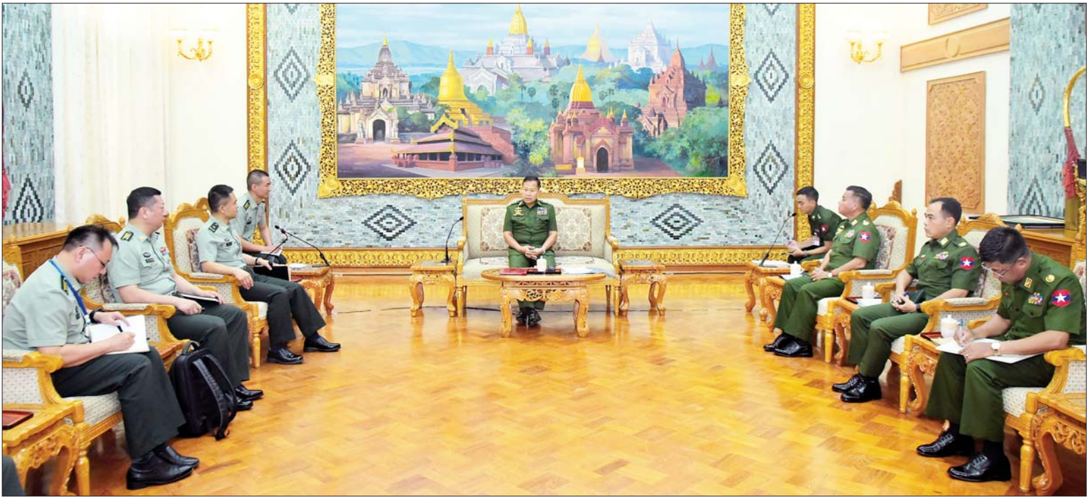
နိုင်ငံတော်စီမံအုပ်ချုပ်ရေးကောင်စီ ဒုတိယဥက္ကဋ္ဌ ဒုတိယတပ်မတော်ကာကွယ်ရေးဦးစီးချုပ် ကာကွယ်ရေးဦးစီးချုပ်(ကြည်း) ဒုတိယဗိုလ်ချုပ်မှူးကြီးစိုးဝင်း တရုတ်ဗဟိုစစ်ကော်မရှင် ပူးတွဲစစ်ဦးစီးဌာန ခေတ္တစစ်ဘက်ထောက်လှမ်းရေးညွှန်ကြားရေးမှူးချုပ် Major General Yang Yang ဦးဆောင်သောကိုယ်စားလှယ်အဖွဲ့အား လက်ခံတွေ့ဆုံသည်။

နေပြည်တော် မေ ၃၀ နိုင်ငံတော် စီမံအုပ်ချုပ်ရေးကောင်စီ ဒုတိယဥက္ကဋ္ဌ ဒုတိယတပ်မတော်ကာကွယ်ရေး ဦးစီးချုပ် ကာကွယ်ရေးဦးစီးချုပ် (ကြည်း) ဒုတိယဗိုလ်ချုပ်မှူးကြီး စိုးဝင်းသည် တရုတ်ပြည်သူ့သမ္မတနိုင်ငံ ဗဟိုစစ်ကော်မရှင် ပူးတွဲစစ်ဦးစီးဌာန ခေတ္တစစ်ဘက်ထောက်လှမ်းရေးညွှန်ကြားရေးမှူးချုပ် Major General Yang Yang ဦးဆောင်သော ကိုယ်စားလှယ်အဖွဲ့အား ယနေ့ နံနက်ပိုင်းတွင် နေပြည်တော်ရှိ ဘုရင့်နေောင်ရိပ်သာဧည့်ခန်းမ၌ လက်ခံတွေ့ဆုံသည်။