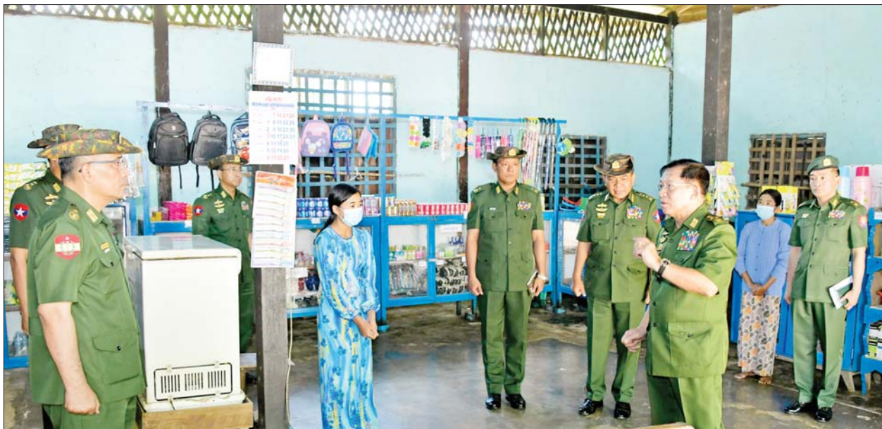
နိုင်ငံတော်စီမံအုပ်ချုပ်ရေးကောင်စီဥက္ကဋ္ဌ တပ်မတော်ကာကွယ်ရေးဦးစီးချုပ် ဗိုလ်ချုပ်မှူးကြီးမင်းအောင်လှိုင် ကလေးတပ်နယ်ရှိ တပ်တွင်းအရောင်းဆိုင်၌ စားသောက်ကုန်ပစ္စည်းများနှင့် လူသုံးကုန်ပစ္စည်းများကို သက်သာသောဈေးနှုန်းများဖြင့် ရောင်းချပေးနေမှုများကို ကြည့်ရှုစစ်ဆေးစဉ်။