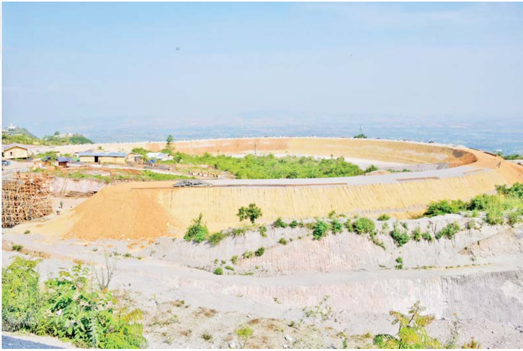
နိုင်ငံတော်စီမံအုပ်ချုပ်ရေးကောင်စီဥက္ကဋ္ဌ နိုင်ငံတော်ဝန်ကြီးချုပ် ဗိုလ်ချုပ်မှူးကြီး မင်းအောင်လှိုင် ထိသိမ်ဘူတာအနီးတွင် ထည့်သွင်းဖောက်လုပ်နေသည့် ရထားလမ်းအပိုင်းပတ်နေရာ စီမံကိန်းဧရိယာအတွင်း လှည့်လည်ကြည့်ရှုစဉ်။

အကျိုးဖြစ်ထွန်းစေမည့် သယ်ယူပို့ဆောင်ရေးစနစ်ပင်ဖြစ်ကြောင်း ပြောကြားသည်။ ထို့နောက် နိုင်ငံတော်စီမံအုပ်ချုပ်ရေးကောင်စီ ဥက္ကဋ္ဌ