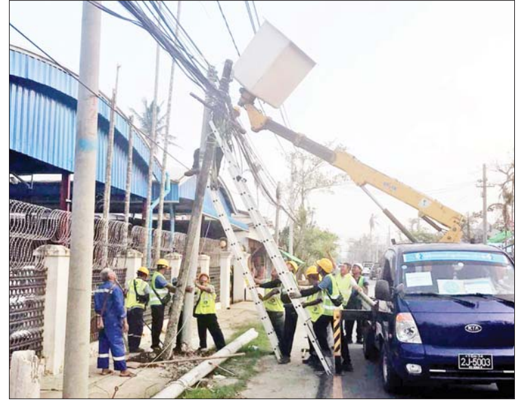
ရခိုင်ပြည်နယ်၌ မုန်တိုင်းတိုက်ခတ်မှုကြောင့် ဆက်သွယ်ရေးအော်ပရေတာများ ပြတ်တောက်မှုများကို ပြန်လည်ပြုပြင်ဆောင်ရွက်နေစဉ်။