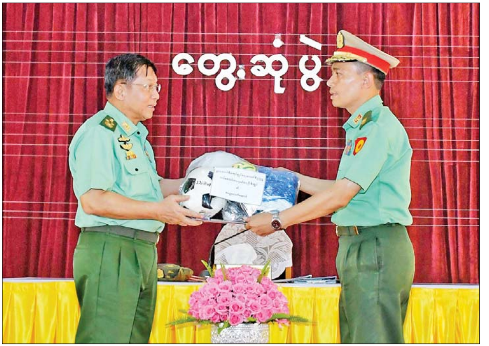
နိုင်ငံတော်စီမံအုပ်ချုပ်ရေးကောင်စီဥက္ကဋ္ဌ တပ်မတော်ကာကွယ်ရေးဦးစီးချုပ် ဗိုလ်ချုပ်မှူးကြီး မင်းအောင်လှိုင် သင်တန်းသားများအတွက် အားကစားပစ္စည်းများပေးအပ်စဉ်။

သင်တန်းဆင်းပြီးသည့် သင်တန်း သားများအားလုံး အရည်အချင်း ပြည့်စုံသူများ ဖြစ်လာစေရေး အတွက် နည်းပြများက ကြပ်မတ် လေ့ကျင့် သင်ကြားပေးသွားရန် လိုကြောင်း၊ သင်တန်းသားများ အားလုံး စစ်အတတ်ပညာနှင့် လုပ်ငန်း အတတ်ပညာများတွင် အရည်အချင်း ပြည့်စုံသူများ ဖြစ်ရန် လိုကြောင်း။ တီထွင်ကြံဆလုပ်ဆောင် ပညာဟူသည်မှာ သင်တန်း ကျောင်းမှ သင်ကြားပေးလိုက် သည်နှင့် မပြီးဆုံးဘဲ ကိုယ်တိုင် လည်း အမြဲမပြတ်လေ့လာနေရန် လိုကြောင်း၊ ထို့ကြောင့် လုပ်ငန်း ပမာဏများ ကျယ်ပြန့်လာသည် နှင့်အမျှ ပိုမိုလေ့လာအားထုတ် ကြိုးပမ်းရန်လည်း လိုအပ်မည်ဖြစ် ကြောင်း၊ မိမိတာဝန်ယူဆောင်ရွက်