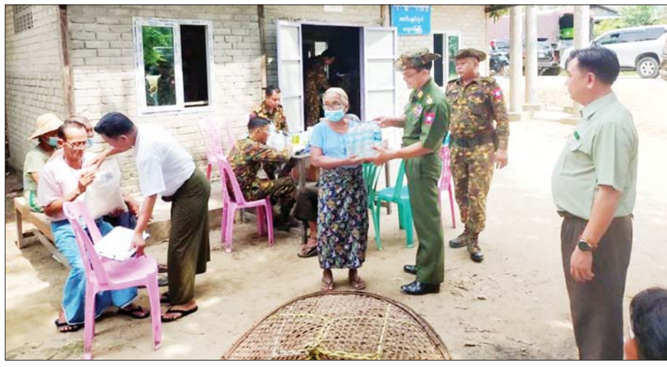
ဒုတိယဗိုလ်ချုပ်ကြီးလူအေး ကျောက်ဖြူမြို့နယ်ရှိ ဒေသပြည်သူများအား သောက်သုံးရေများပေးအပ်စဉ်။

နေပြည်တော် မေ ၂၉ နိုင်ငံတော်စီမံအုပ်ချုပ်ရေးကောင်စီအနေဖြင့် ဆိုင်ကလုန်းမုန်တိုင်း(မိုခါ) တိုက်ခတ်မှုကြောင့် ထိခိုက်ပျက်စီးခဲ့သည့် ဒေသများကို သဘာဝဘေးအန္တရာယ်ဆိုင်ရာစီမံခန့်ခွဲမှုဥပဒေပုဒ်မ ၁၁ အရ သဘာဝဘေးအန္တရာယ်ကျရောက်သော ဒေသများအဖြစ်ကြေညာချက်များ ထုတ်ပြန်၍ ယင်းကြေညာချက်များပါ ဒေသများတွင် ပြန်လည်ထူထောင်ရေးလုပ်ငန်းများ ဆောင်ရွက်နိုင်ရန် ဒေသအလိုက် တပ်မတော်အရာရှိကြီးများကို ခန့်အပ်တာဝန်ပေးထားပြီးဖြစ်သည်။