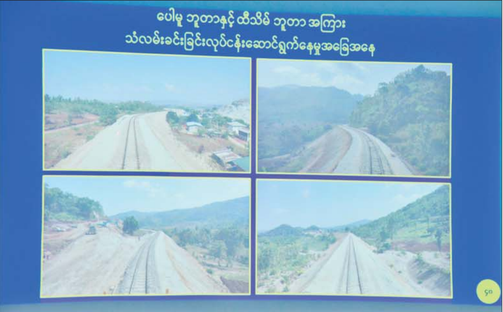
နိုင်ငံတော်စီမံအုပ်ချုပ်ရေးကောင်စီဥက္ကဋ္ဌ နိုင်ငံတော်ဝန်ကြီးချုပ် ဗိုလ်ချုပ်မှူးကြီး မင်းအောင်လှိုင်အား ပို့ဆောင်ရေးနှင့်ဆက်သွယ်ရေးဝန်ကြီးဌာန ဒုတိယဝန်ကြီး ဦးအောင်မြိုင်က ရှင်းလင်းတင်ပြစဉ်။