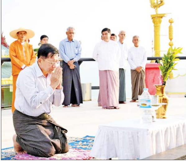
နိုင်ငံတော်စီမံအုပ်ချုပ်ရေးကောင်စီဥက္ကဋ္ဌ နိုင်ငံတော် ဝန်ကြီးချုပ်ဗိုလ်ချုပ်မှူးကြီးမင်းအောင်လှိုင် ရွှေဘုန်းပွင့်စေတီတော် မြတ်ကြီးအား ပန်း၊ ရေချမ်း ကပ်လှူပူဇော်စဉ်။

ပအိုဝ်းဒေသအတွင်း၌ တိရစ္ဆာန် အစားအစာများ ထုတ်လုပ်နိုင်သည့် စိုက်ပျိုးရေးထွက်ကုန်များ ထွက်ရှိ ပြီးဖြစ်ကြောင်း၊ ထို့ကြောင့် ဒေသ တွင်း မွေးမြူရေးအစားအစာများ ထုတ်လုပ်နိုင်ရေး ဆောင်ရွက်ပြီး မွေးမြူရေး လုပ်ငန်းများကို တိုးတက် ကောင်းမွန်အောင် ဆောင်ရွက်နိုင်ကြောင်း၊ မွေးမြူ ရေးစားသောက်ကုန်များ ဈေးနှုန်း မြင့်မားခြင်းမှာ ရောင်းလိုအား နှင့် ဝယ်လိုအား မမျှတခြင်း၊ ထုတ်လုပ်မှု ကုန်ကျစရိတ်များ မြင့်မားခြင်းများကြောင့်ပင်ဖြစ် ကြောင်း၊ ပအိုဝ်းဒေသအတွင်း မွေးမြူရေး လုပ်ငန်းများကို အောင်မြင်အောင် ဆောင်ရွက်၍ ထုတ်ကုန်များကို ပိုမိုဈေးနှုန်း သက်သာစွာ ဖြန့်ဖြူးနိုင်ရေး ဆောင်ရွက်ကြစေလိုကြောင်း၊ လိုအပ်သည့် ကုန်ကြမ်းများနှင့် ပတ်သက်၍ ပအိုဝ်းဒေသအတွင်း အများအပြား ထုတ်လုပ်နိုင်ရေး