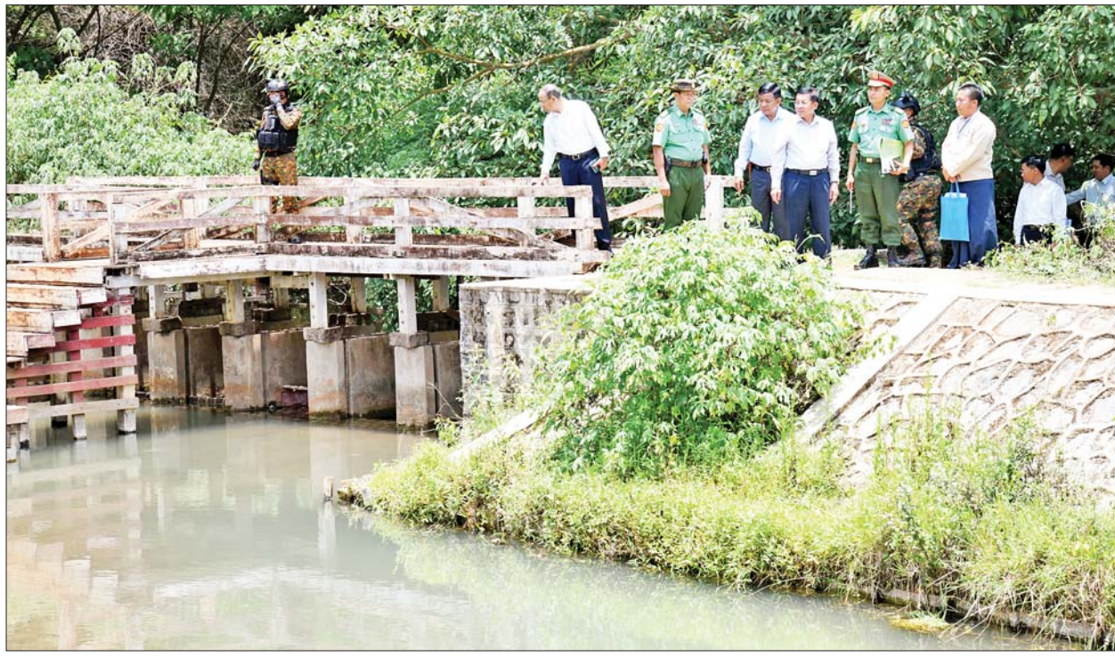
နိုင်ငံတော်စီမံအုပ်ချုပ်ရေးကောင်စီဥက္ကဋ္ဌ နိုင်ငံတော်ဝန်ကြီးချုပ် ဗိုလ်ချုပ်မှူးကြီးမင်းအောင်လှိုင် ဟိုပုံးမြို့ရှိ ဟိုပုံးရေထွက်ကြီးတွင် ရေထွက်ထိန်းသိမ်းထားရှိမှု အခြေအနေများကို ကြည့်ရှုစစ်ဆေးစဉ်။

မိမိတို့အနေဖြင့် ပအိုဝ်းဒေသ တွင် လုပ်ဆောင်လျက်ရှိသည့် MSME လုပ်ငန်းများ ဖွံ့ဖြိုးတိုးတက် စေရေး လိုအပ်သည်များကို ညှိနှိုင်း ဖြည့်ဆည်းဆောင်ရွက်ပေးနိုင်ရန် လာရောက်ခြင်း ဖြစ်ကြောင်း၊ စီးပွားရေးလုပ်ငန်းများ ဖွံ့ဖြိုး တိုးတက်ရေးအတွက် အဓိက အားဖြင့် အလုပ်လုပ်ရန်ဖြစ် ကြောင်း၊ အလုပ်လုပ်ရန်အတွက် လူသာလျှင် ပဓာနဖြစ်ကြောင်း၊ ထို့ကြောင့် ပအိုဝ်းဒေသဖွံ့ဖြိုး တိုးတက်ရေးအတွက် ဒေသ အတွင်း နေထိုင်ကြသူများအနေဖြင့် ပိုင်းဝန်းကြိုးပမ်း ဆောင်ရွက်ကြ စေလိုကြောင်း ပြောကြားသည်။ ထို့နောက် နိုင်ငံတော်စီမံအုပ်ချုပ် ရေးကောင်စီဥက္ကဋ္ဌ နိုင်ငံတော် ဝန်ကြီးချုပ်သည် တက်ရောက် လာကြသည့် အသေးစား၊ အငယ် စားနှင့် အလတ်စားစီးပွားရေး စာမျက်နှာ ၅ သို့ »»