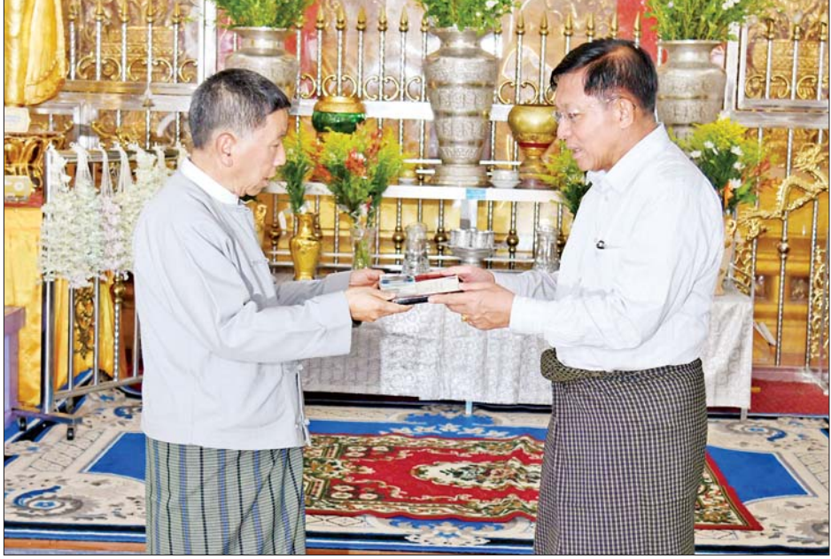
နိုင်ငံတော်စီမံအုပ်ချုပ်ရေးကောင်စီဥက္ကဋ္ဌ နိုင်ငံတော်ဝန်ကြီးချုပ် ဗိုလ်ချုပ်မှူးကြီး မင်းအောင်လှိုင် တောင်ကြီးမြို့ ကျက်သရေဆောင် စုဌာနမှ လောကချမ်းသာစေတီတော်ကြီးအတွက် ဘက်စုံအလှူငွေများ ပေးအပ်လှူဒါန်းစဉ်။

အပန်းဖြေ အနားယူနိုင်ရေး ဆောင်ရွက်ပေးရန်လိုကြောင်း မှာကြားကာ ရေကန်အား လှည့်လည်ကြည့်ရှုခဲ့ကြသည်။ အလားတူ နိုင်ငံတော်စီမံအုပ်ချုပ်ရေးကောင်စီဥက္ကဋ္ဌ နိုင်ငံတော်ဝန်ကြီးချုပ် ဗိုလ်ချုပ်မှူးကြီး မင်းအောင်လှိုင်နှင့် အဖွဲ့ဝင်များသည် မေ ၂၈ ရက် ညနေပိုင်းက ရှမ်းပြည်နယ် (တောင်ပိုင်း) တောင်ကြီးမြို့ ကျက်သရေဆောင်စုဌာနမှ လောကချမ်းသာစေတီတော်နှင့် ရွှေဘုန်းပွင့်စေတီတော် မြတ်ကြီးတို့သို့ သွားရောက်ဖူးမြော်ကြည့်ညှိပြီး ပန်း၊ ရေချမ်းများ ကပ်လှူပူဇော်သည်။ ယင်းနောက် အလှူငွေများပေးအပ်လှူဒါန်းပြီး စေတီတော်ကြီးများအား လက်ယာရစ် လှည့်လည်ဖူးမြော်ကြည့်ညှိ၍ တာဝန်ရှိသူများ၏ တင်ပြချက်များအပေါ် စေတီတော်ကြီးများအား ရေရှည်တည်တံ့ခိုင်မြဲပြီး ကြည့်ညှိသပွယ်ဖွယ် ဖြစ်စေရေးထိန်းသိမ်း