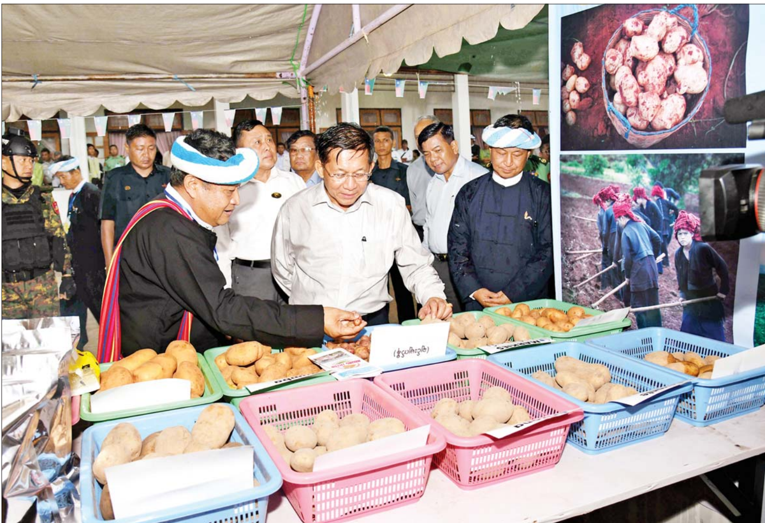
နိုင်ငံတော်စီမံအုပ်ချုပ်ရေးကောင်စီဥက္ကဋ္ဌ နိုင်ငံတော်ဝန်ကြီးချုပ် ဗိုလ်ချုပ်မှူးကြီးမင်းအောင်လှိုင် ခင်းကျင်းပြသထားသည့် ဒေသထွက်ကုန်ပစ္စည်းများကို ကြည့်ရှုလေ့လာစဉ်။

နေပြည်တော် မေ ၂၉ နိုင်ငံတော်စီမံအုပ်ချုပ်ရေးကောင်စီ ဥက္ကဋ္ဌ နိုင်ငံတော်ဝန်ကြီးချုပ် ဗိုလ်ချုပ်မှူးကြီး မင်းအောင်လှိုင်သည် ယနေ့ မွန်းလွဲပိုင်းတွင် ပအိုဝ်းကိုယ်ပိုင်အုပ်ချုပ်ခွင့်ရဒေသအတွင်းရှိ အသေးစား၊ အငယ်စားနှင့် အလတ်စား စီးပွားရေး(MSME) လုပ်ငန်းရှင်များအား ဟိုပုံးမြို့ရှိ ပအိုဝ်းကိုယ်ပိုင်အုပ်ချုပ်ခွင့်ရဒေသခန်းမ၌ တွေ့ဆုံ၍ ဒေသဖွံ့ဖြိုးတိုးတက်ရေးဆိုင်ရာများနှင့် စီးပွားရေးလုပ်ငန်း ဖွံ့ဖြိုးတိုးတက်ရေးဆိုင်ရာများကို ဆွေးနွေးပြောကြားသည်။ တက်ရောက် အဆိုပါ တွေ့ဆုံပွဲသို့ နိုင်ငံတော်စီမံအုပ်ချုပ်ရေးကောင်စီဥက္ကဋ္ဌ နိုင်ငံတော်ဝန်ကြီးချုပ်နှင့်အတူ နိုင်ငံတော်စီမံအုပ်ချုပ်ရေးကောင်စီဝင်ဦးခွန်စံလွင်၊ ပြည်ထောင်စုဝန်ကြီးများ၊ ရှမ်းပြည်နယ်ဝန်ကြီးချုပ်၊ ညှိနှိုင်းကွပ်ကဲရေးမှူး(ကြည်း၊ ရေ၊ လေ) ဗိုလ်ချုပ်ကြီး မောင်မောင်အေးနှင့် ကာကွယ်ရေးဦးစီးချုပ်ရုံးမှ တပ်မတော်အရာရှိကြီးများ၊ အရှေ့ပိုင်းတိုင်းစစ်ဌာနချုပ်တိုင်းမှူးနှင့် တာဝန်ရှိသူများ၊ ပြည်နယ်အဆင့် ဌာနဆိုင်ရာတာဝန်ရှိသူများ၊ ပအိုဝ်းကိုယ်ပိုင်အုပ်ချုပ်ခွင့်ရဒေသ စီမံအုပ်ချုပ်ရေးအဖွဲ့မှ တာဝန်ရှိသူများ၊ မြို့မိမြို့ဖများ၊ အသေးစား၊ အငယ်စားနှင့် အလတ်စား စီးပွားရေး(MSME) လုပ်ငန်းရှင်များနှင့် တာဝန်ရှိသူများ တက်ရောက်ကြသည်။ စာမျက်နှာ ၃ ကော်လံ ၁ သို့ ❖