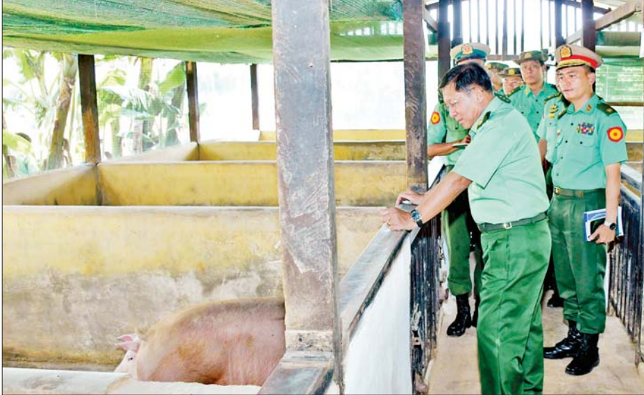
နိုင်ငံတော်စီမံအုပ်ချုပ်ရေးကောင်စီဥက္ကဋ္ဌ တပ်မတော်ကာကွယ်ရေးဦးစီးချုပ် ဗိုလ်ချုပ်မှူးကြီး မင်းအောင်လှိုင် ဟိုပုံးတပ်နယ်ရှိ တပ်မတော်ကွန်ပျူတာနှင့် နည်းပညာသိပ္ပံသင်တန်းကျောင်းအတွင်း မွေးမြူရေးဆောင်ရွက်ထားရှိမှုကို ကြည့်ရှုစစ်ဆေးစဉ်။

လေ့ကျင့်သင်ကြားပေးနေ ဦးစွာ နိုင်ငံတော်စီမံအုပ်ချုပ်ရေး ကောင်စီဥက္ကဋ္ဌ တပ်မတော် ကာကွယ်ရေးဦးစီးချုပ်က အမှာ စကား ပြောကြားရာတွင် တပ်မတော်အနေဖြင့် သင်တန်း ကျောင်းများအလိုက် သက်ဆိုင်ရာ စစ်သည်တော်များကို မွေးထုတ် ပေးလျက်ရှိကြောင်း၊ ယခုသင်တန်း တွင် တက်ရောက်နေကြသူများကို တပ်မတော် အင်ဂျင်နီယာကဏ္ဍ စွမ်းပကားများ တိုးတက်မြင့်မား လာစေရေး လေ့ကျင့်သင်ကြား ပေးနေခြင်းဖြစ်ကြောင်း၊ သို့ဖြစ်၍ သင်တန်းသားများ အနေဖြင့် သင်ကြားပေးသည့် အင်ဂျင်နီယာ ဘာသာရပ်များကို အမှန်တကယ် ကျွမ်းကျင် တတ်မြောက်အောင် လေ့ကျင့်သင်ယူကြရန် လို ကြောင်း၊ သင်တန်းကျောင်းအား အဆင့်မြှင့်တင်မှုလုပ်ငန်းများကို ဆောင်ရွက်ပေးထားပြီး ဖြစ်ပြီး ပတ်ဝန်းကျင် ကောင်းများကို