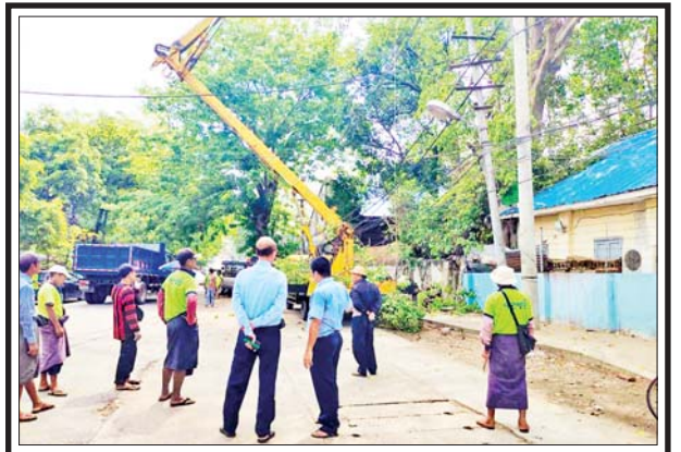
ရန်ကုန်တိုင်းဒေသကြီး အလုံမြို့နယ် ကမ်းနားလမ်း တစ်လျှောက်ရှိ ကောင်းကင်ဓာတ်အားလိုင်းနှင့် လွှတ်ကင်းမှုမရှိသော သစ်ပင်သစ်ကိုင်းများ ခုတ်ထွင်ရှင်းလင်းခြင်းကို မေ ၂၈ ရက်က ဆောင်ရွက်စဉ်။

ထို့ပြင် တပ်မတော်အကြီးအကဲ၏ လမ်းညွှန်မှုများအရ ကာကွယ် ရေးဦးစီးချုပ်ရုံး (ကြည်း)၊ ဆေးဝန်ထမ်းတပ်ဖွဲ့ညွှန်ကြားရေးမှူးရုံး ကွပ်ကဲမှုအောက်မှ ဆေးတပ်ဖွဲ့ဝင်များဖြင့် ဖွဲ့စည်းထားသည့် အထူး ဆေးကုသရေးအဖွဲ့သည် စစ်တွေမြို့ ဆတ်ရိုးကျရပ်ကွက်၌ ယာယီ ဆေးရုံဖွင့်လှစ်၍ နယ်မြေခံကျန်းမာရေးအဖွဲ့များနှင့် ပူးပေါင်းကာ ဒေသခံပြည်သူများအား လိုအပ်သည့် ကျန်းမာရေးစောင့်ရှောက်မှု လုပ်ငန်းများ ဆောင်ရွက်ပေးလျက်ရှိကြောင်း သိရသည်။ သတင်းစဉ်