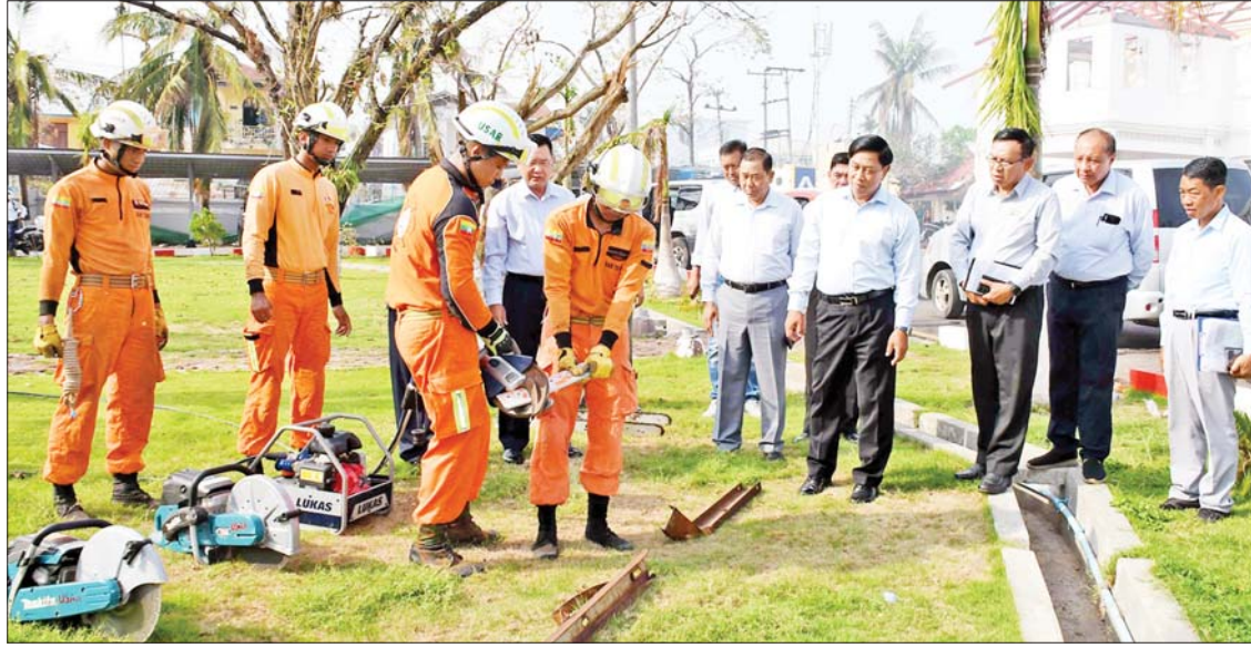
နိုင်ငံတော်စီမံအုပ်ချုပ်ရေးကောင်စီအဖွဲ့ဝင် ဒုတိယဝန်ကြီးချုပ်နှင့် ပြည်ထောင်စုဝန်ကြီး ဗိုလ်ချုပ်ကြီးတင်အောင်စန်းနှင့် တာဝန်ရှိသူများ မြန်မာနိုင်ငံမီးသတ်တပ်ဖွဲ့၏ သံဖြတ်စက်ဖြင့် လက်တွေ့အသုံးချသရုပ်ပြမှုကို ကြည့်ရှုစဉ်။

ပြောင်းလဲ ချိတ်ဆက်ခြင်းနှင့် မိုတိုင်းစခန်း ပြုပြင်ခြင်းများ ဆောင်ရွက်လျက်ရှိရာ မေ ၂၉ ရက်အထိ မိုတိုင်းစခန်းစုစုပေါင်း ၇၉၃ စခန်း ပြန်လည်ပြုပြင်နိုင်ခဲ့သဖြင့် စုစုပေါင်း မိုတိုင်းစခန်း ၁၁၂၂ စခန်း ရာခိုင်နှုန်းအားဖြင့် ၉၁ ရာခိုင်နှုန်းဖြင့် ဆက်သွယ်ရေးဝန်ဆောင်မှုများ ပြန်လည်ဆောင်ရွက်ပေးနိုင်ပြီဖြစ်သည်။ သတင်းစဉ်