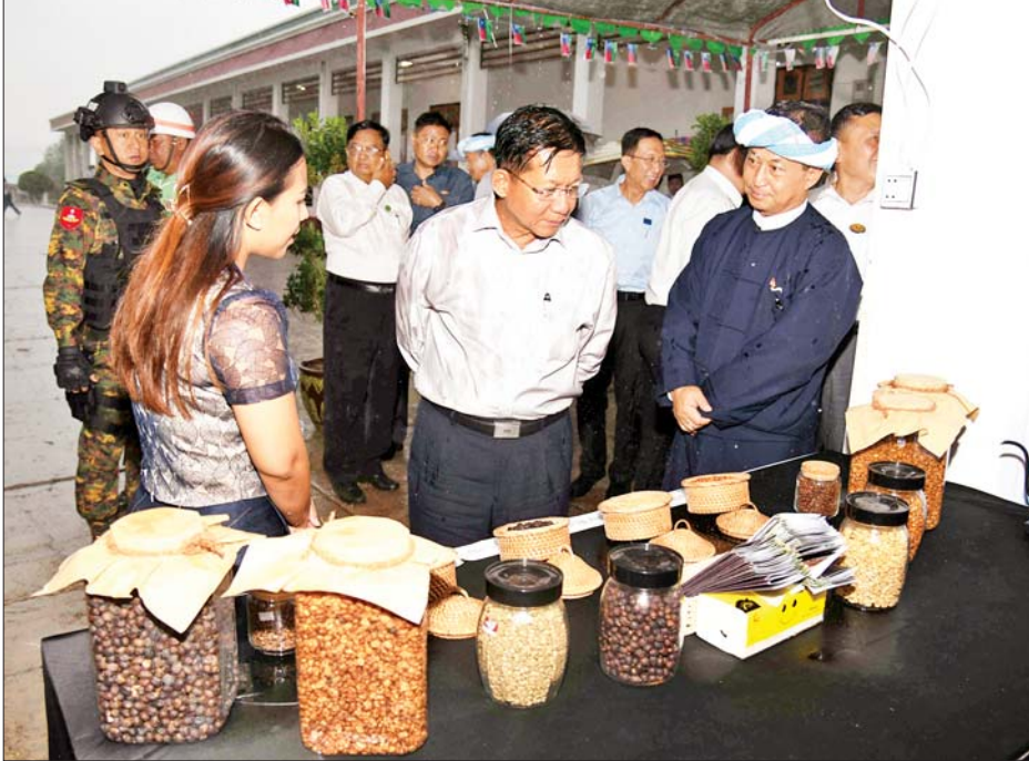
နိုင်ငံတော်စီမံအုပ်ချုပ်ရေးကောင်စီဥက္ကဋ္ဌ နိုင်ငံတော်ဝန်ကြီးချုပ် ဗိုလ်ချုပ်မှူးကြီးမင်းအောင်လှိုင် ခင်းကျင်းပြသထားသည့် ဒေသထွက်ကုန်ပစ္စည်းများကို ကြည့်ရှုလေ့လာစဉ်။

များ တိုးတက်စေရေးအတွက် စက်ရုံတိုးချဲ့မှုများ ဆောင်ရွက်ရန် ရင်းနှီးမြှုပ်နှံမှုချေးငွေများ ထုတ်ချေး ပေးစေလိုမှု၊ ကုန်ထုတ်လုပ်ငန်း များအတွက် လိုအပ်လျက်ရှိသည့် လျှပ်စစ်မီး လိုအပ်ချက်များကို ဖြည့်ဆည်းပေးစေလိုမှုနှင့် ဒေသ ဖွံ့ဖြိုးရေးအတွက် လိုအပ်ချက်များ ကို အသီးသီးတင်ပြဆွေးနွေးကြ ရာ နိုင်ငံတော်စီမံအုပ်ချုပ်ရေး ကောင်စီဥက္ကဋ္ဌ နိုင်ငံတော် ဝန်ကြီးချုပ်က လိုအပ်သည်များ ပြန်လည်မေးမြန်း ဆွေးနွေး ပြောကြားသည်။ ပြည်ထောင်စုဝန်ကြီးများက သက်ဆိုင်ရာကဏ္ဍအလိုက် ပြန်လည်ရှင်းလင်းဆွေးနွေး ဆက်လက်ပြီး လုပ်ငန်းရှင်များ ၏ တစ်ဦးချင်း ရှင်းလင်းတင်ပြမှု များနှင့် ပတ်သက်၍ ပြည်ထောင်စု ဝန်ကြီးများက ဝန်ကြီးဌာနအလိုက် လုပ်ငန်း အကောင်အထည်ဖော် ဆောင်ရွက်လျက်ရှိမှု၊ နိုင်ငံတော် အနေဖြင့် ချေးငွေများကို ခေါင်းစဉ်