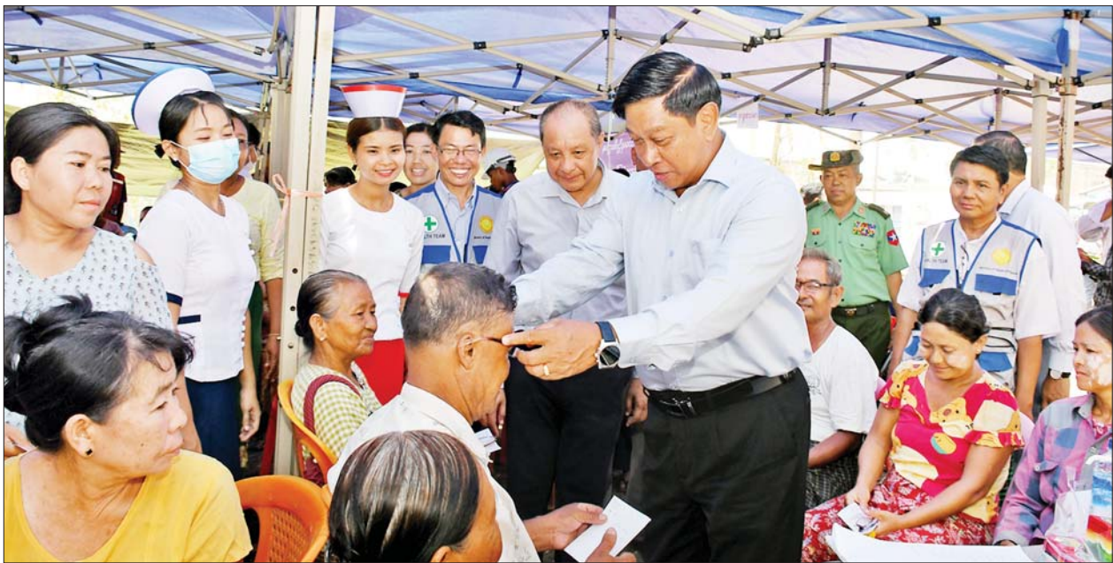
နိုင်ငံတော်စီမံအုပ်ချုပ်ရေးကောင်စီအဖွဲ့ဝင် ဒုတိယဝန်ကြီးချုပ်နှင့် ပြည်ထောင်စုဝန်ကြီး ဗိုလ်ချုပ်ကြီးတင်အောင်စန်း စစ်တွေမြို့ရှိ ဒေသခံပြည်သူများအား ကျန်းမာရေးစောင့်ရှောက်မှုများကို ကြည့်ရှုအားပေးစဉ်။

ပေးနေမှုနှင့် ကျန်းမာရေးအသိပညာပေးနေမှုတို့ကို ကြည့်ရှုအားပေးသည်။ စားသောက်ဖွယ်ရာများ ပေးအပ်ယင်းနောက် ဗိုလ်ချုပ်ကြီးတင်အောင်စန်းနှင့် အဖွဲ့သည် ကျန်းမာရေး စောင့်ရှောက်မှု လာရောက်ခံယူကြသည့် လူနာများ၏ ကျန်းမာရေးအခြေအနေများကို မေးမြန်းပြီး အားပေးစကားပြောကြားကာ စားသောက်ဖွယ်ရာများ ပေးအပ်သည်။ အဆိုပါ ကျန်းမာရေးစောင့်ရှောက်မှုပေးနေသည့် အဖွဲ့တွင် စစ်တွေ ပြည်သူ့ဆေးရုံကြီးမှ သမားတော်ကြီး၊ မျက်စိ၊ နား၊ နှာခေါင်း၊ လည်ချောင်း၊ သွား၊ အရိုး၊ သားဖွားမီးယပ်၊ ကလေး၊ ခွဲစိတ်နှင့် စိတ်ကျန်းမာရေး အထူးကုဆရာဝန်ကြီးများနှင့်အတူ ကျန်းမာရေးဝန်ကြီးဌာနမှ Medical Team နှင့် မြန်မာနိုင်ငံကြက်ခြေနီအသင်းမှ တပ်ဖွဲ့ဝင်များ ပူးပေါင်းပါဝင်၍ စစ်တွေမြို့ရှိ ဒေသခံပြည်သူများအား ကျန်းမာရေးစောင့်ရှောက်မှုပေးလျက်ရှိသည်။ ဆက်လက်၍ ဆိုင်ကလုန်း မုန်တိုင်းမိုခါ တိုက်ခတ်မှုကြောင့် စစ်တွေမြို့ ကမ်းနားလမ်းရှိ ကျောက်စီ မြေထိန်းနံရံများ