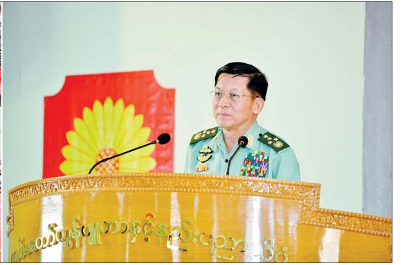
နိုင်ငံတော်စီမံအုပ်ချုပ်ရေးကောင်စီဥက္ကဋ္ဌ တပ်မတော်ကာကွယ်ရေးဦးစီးချုပ် ဗိုလ်ချုပ်မှူးကြီးမင်းအောင်လှိုင် အရှေ့ပိုင်းတိုင်းစစ်ဌာနချုပ် ဟိုပုံးတပ်နယ်ရှိ တပ်မတော်ကွန်ပျူတာနှင့် နည်းပညာသိပ္ပံမှ နည်းပြ အရာရှိများနှင့် သင်တန်းသားများအား တွေ့ဆုံအမှာစကားပြောကြားစဉ်။