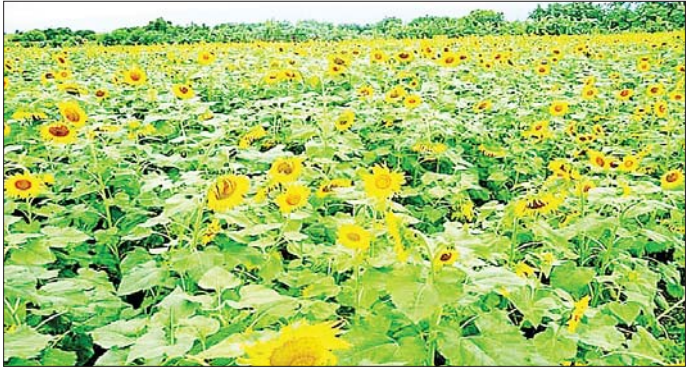
ဖြစ်ကြောင်း ယခုနှစ် နေကြာ(မိုးကြို) စိုက်ပျိုးချိန်တွင် တောင်သူများသည် မိုးရွာ သွန်းမှုမရှိသေးသော်လည်း ဆည်ရေသောက်ရေတင်စနစ်ဖြင့် စိုက်ပျိုးခဲ့ပြီး ယခုအချိန်တွင် မိုးရွာသွန်းမှုကောင်းသောကြောင့် နေကြာ(မိုးကြို)များ အောင်မြင် ဖြစ်ထွန်းလျက်ရှိကြောင်း သိရသည်။

ကျောက်ဆည် မေ ၂၉ မန္တလေးတိုင်းဒေသကြီး ကျောက်ဆည်ခရိုင်တွင် နေကြာသီးနှံ (မိုးကြို)ကို ၂၀၂၃-၂၀၂၄ ဘဏ္ဍာနှစ်တွင် ၁၁၉၉ ဧကစိုက်ပျိုးရန် လျာထားခဲ့သော်လည်း စဉ်ကိုင်မြို့နယ်တွင် ၁၃၃၅ ဧကနှင့် မြစ်သားမြို့နယ်တွင် ၂၀၀ ဧက စုစုပေါင်း ၁၅၃၄ ဧက စိုက်ပျိုးနိုင်ခဲ့ကြောင်း စိုက်ပျိုးရေးဦးစီးဌာန၏ စာရင်းများအရ သိရသည်။ နေကြာ(မိုးကြို)ကိုမတ်လနှင့် ဧပြီလများတွင် စတင်စိုက်ပျိုးကြပြီး ဇွန်လနှင့် ဇူလိုင်လများတွင် စတင်ရိတ်သိမ်းကြောင်း၊ နေကြာသီးနှံ တစ်ဧက ကုန်ကျစရိတ်အနေဖြင့် ကျပ် ၂၇၀၀၀၀ ခန့်ကုန်ကျကြောင်း သိရသည်။ ဈေးနှုန်းများအနေဖြင့် ယခင်နှစ်၌ နေကြာတစ်တင်းလျှင် ကျပ် ၁၈၀၀၀၊ နေကြာဆီ တစ်ပိဿာလျှင် ကျပ် ၉၀၀၀ ခန့်ရှိပြီး ယခုနှစ်တွင် နေကြာတစ်တင်း လျှင် ကျပ် ၃၄၀၀၀ ၊ နေကြာဆီ တစ်ပိဿာလျှင် ကျပ် ၁၂၀၀၀ ဈေးနှုန်းများဖြင့် ရောင်းဝယ်လျက်ရှိကြောင်း၊ နေကြာသီးနှံသည် သက်တမ်းတိုမျိုးဖြစ်ပြီး ကုန်ကျ စရိတ်သက်သာကာ စားသုံးဆီဖူလုံမှုရရှိသည့်အတွက် တောင်သူများ သီးထပ်၊ သီးညှပ်အပြင် သီးသန့်အနေဖြင့်ပါ အများဆုံးစိုက်ပျိုးသင့်သော သီးနှံတစ်မျိုး