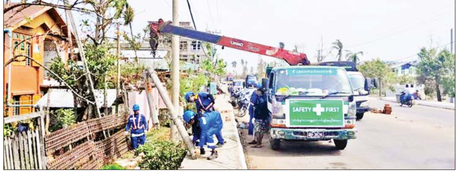
ရခိုင်ပြည်နယ်၌ မုန်တိုင်းတိုက်ခတ်မှုကြောင့် လဲကျနေသည့်ဓာတ်တိုင်များအား ပြန်လည်ပြုပြင်ဆောင်ရွက်နေစဉ်။

နိုင်ငံတော်စီမံအုပ်ချုပ်ရေးကောင်စီအဖွဲ့ဝင် ဒုတိယဝန်ကြီးချုပ်နှင့် ပြည်ထောင်စုဝန်ကြီး ဗိုလ်ချုပ်ကြီးတင်အောင်စန်းနှင့် တာဝန်ရှိသူများ စစ်တွေမြို့ ကမ်းနားလမ်းရှိ ကျောက်စီမြေထိန်းနံရံများ ပြန်လည်ပြုပြင်ဆောင်ရွက်မည့် အခြေအနေများကို ကြည့်ရှုစစ်ဆေးစဉ်။