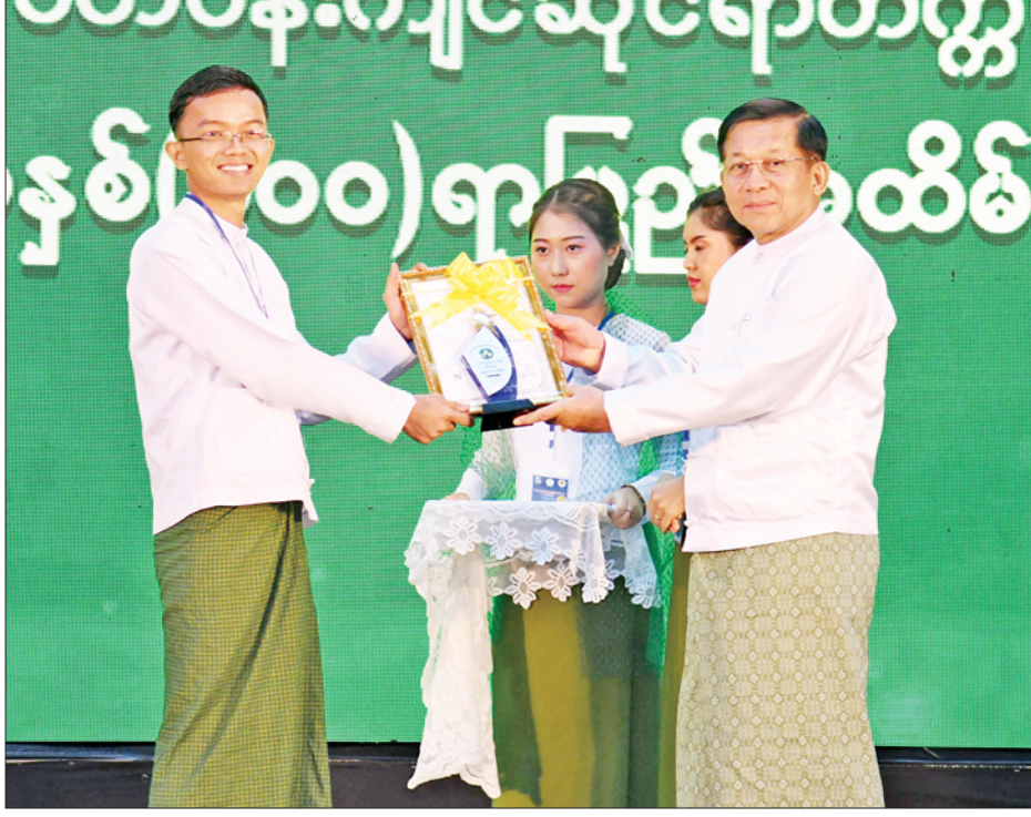
နိုင်ငံတော်စီမံအုပ်ချုပ်ရေးကောင်စီဥက္ကဋ္ဌ နိုင်ငံတော်ဝန်ကြီးချုပ် ဗိုလ်ချုပ်မှူးကြီး မင်းအောင်လှိုင် သစ်တောပညာနစ်(၁၀၀)ရာပြည့်အထိမ်းအမှတ် တက္ကသိုလ်အဆင့်နှင့် အထက်တန်းအဆင့် ကဗျာ၊ ဆောင်းပါး၊ ဉာဏ်စမ်းပပေးဦး၊ စာစီစာကုံးပြိုင်ပွဲများတွင် ပထမဆုရရှိသူတစ်ဦးအား ဆုပေးအပ်ချီးမြှင့်စဉ်။

သစ်တောနှင့် ပတ်ဝန်းကျင် ဆိုင်ရာတက္ကသိုလ်မှ မွေးထုတ်ပေး လိုက်သည့် သစ်တောသိပ္ပံဘွဲ့ရ များသည် အမေရိကန်၊ ဂျာမနီ၊ ဩစတြေးလျ၊ နယ်သာလန်၊ ဂျပန်၊ ကိုရီးယားအပါအဝင် ပြည်ပ နိုင်ငံများမှာ မဟာသိပ္ပံဘွဲ့သင်တန်း များနှင့် ပါရဂူဘွဲ့သင်တန်းများကို စာမျက်နှာ ၈ သို့ ❖