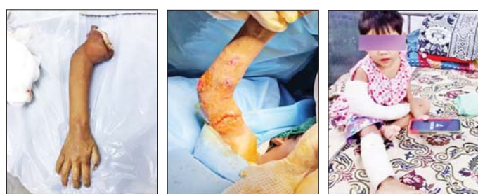
စာမျက်နှာ » ၁၇

ရန်ကုန်ပြည်သူ့ဆေးရုံကြီး၌ ညာဘက်လက်မောင်း ပြတ်တောက်သွားသောလက်အား ပြန်လည်ဆက်ပေး သည့် ခွဲစိတ်ကုသမှုအောင်မြင်