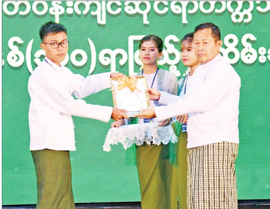
နိုင်ငံတော်စီမံအုပ်ချုပ်ရေးကောင်စီဒုတိယဥက္ကဋ္ဌ ဒုတိယဝန်ကြီးချုပ် ဒုတိယဗိုလ်ချုပ်မှူးကြီး စိုးဝင်း သစ်တောပညာ နှစ်(၁၀၀)ရာပြည့်အထိမ်းအမှတ် တက္ကသိုလ်အဆင့်နှင့် အထက်တန်းအဆင့် ကဗျာ၊ ဆောင်းပါး၊ ဉာဏ်စမ်းပဟေဠိ၊ စာစီစာကုံးပြိုင်ပွဲများတွင် ဒုတိယဆုရရှိသူတစ်ဦးအား ဆုပေးအပ် ချီးမြှင့်စဉ်။

ကျွမ်းကျင်ပိုင်နိုင်မှု၊ လေ့ကျင့် သင်ကြားမှုစွမ်းဆောင်ရည်များ သည် မည်မျှမြင့်မားသည်၊ နိုင်ငံ တကာနှင့် အဆင့်မီသည်ဆိုသည် ကိုလည်း သက်သေပြနေခြင်းပင် ဖြစ်ပါကြောင်း၊ ထို့အတွက်လည်း အစဉ်အဆက် တာဝန်ယူ ဆောင်ရွက်ခဲ့ကြသည့် ဆရာကြီး ဆရာမကြီးများကိုလေးစားစွာဖြင့် ချီးကျူးဂုဏ်ပြုသည်ကို မှတ်တမ်း တင် ပြောကြားလိုပါကြောင်း၊ တက္ကသိုလ်ဆိုသည်မှာ ပညာရှင် များ မွေးထုတ်ပေးရာဌာနလည်း ဖြစ်ပါကြောင်း၊ သစ်တောပညာ သင်ကြားရေးတွင် ဘွဲ့ကြို၊ ဘွဲ့လွန် နှင့် ဒီပလိုမာဘွဲ့ရများစွာ မွေးထုတ် ပေးနိုင်ခဲ့သည့်အပြင် ပြည်ပနိုင်ငံ အသီးသီး၌ ပါရဂူဘွဲ့ရများစွာ သင်ယူနိုင်ခဲ့သူများ၊ စနစ်ကျသည့်