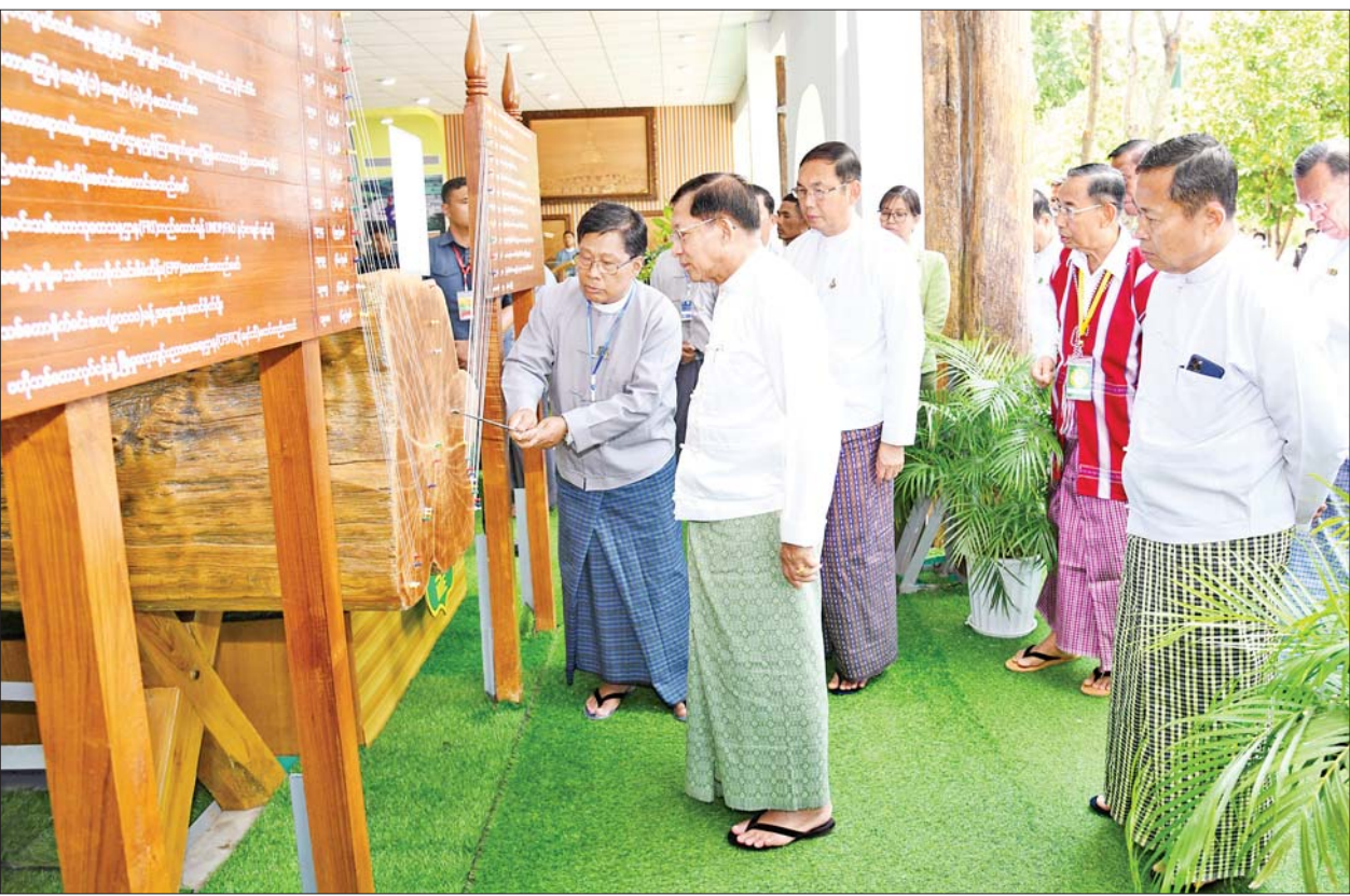
နိုင်ငံတော်စီမံအုပ်ချုပ်ရေးကောင်စီဥက္ကဋ္ဌ နိုင်ငံတော်ဝန်ကြီးချုပ် ဗိုလ်ချုပ်မှူးကြီးမင်းအောင်လှိုင် သယံဇာတနှင့် သဘာဝပတ်ဝန်းကျင် ထိန်းသိမ်းရေးဝန်ကြီးဌာနပြခန်းကို ကြည့်ရှုစဉ်။

လုပ်ငန်းခွင် အတွေ့အကြုံများစွာ ရှိပြီးဖြစ်သည့်အတွက် သစ်တော နှင့်ပတ်ဝန်းကျင်ဆိုင်ရာတက္ကသိုလ် အနေဖြင့် ပါရဂူပညာရှင်များ မွေးထုတ်ပေးနိုင်မည့် အခြေခံ ကောင်းများရှိနေပြီဟု မိမိအနေ ဖြင့်ယုံကြည်ပါကြောင်း၊ ထို့ကြောင့် နိုင်ငံတကာနှင့် ရင်ပေါင်တန်းနိုင် သည့်အထိ အပူပိုင်းနှင့် မုတ်သုံ ဒေသကို အဓိကထားသည့် ပညာရှင်များကို မွေးထုတ်မြှင့်တင် ဆောင်ရွက်ပေးရန် တိုက်တွန်း လိုပါကြောင်း။ ဦးစားပေးဆောင်ရွက်နေ ယနေ့ ကမ္ဘာပေါ်တွင်ရှိသည့် နိုင်ငံအများစုသည် လူသားများ အမှီပြုနေထိုင်ကြသည့် တစ်ခု တည်းသောကမ္ဘာမြေကို ပိုမို ရေရှည်တည်တံ့စေရန်အတွက် ပတ်ဝန်းကျင်နှင့် ညီညွတ်သည့် လူနေမှုဘဝများကို ဖြစ်နိုင်သမျှ ပြောင်းလဲ ဖော်ဆောင်နိုင်ရန် ဦးစားပေးဆောင်ရွက်နေကြပြီ