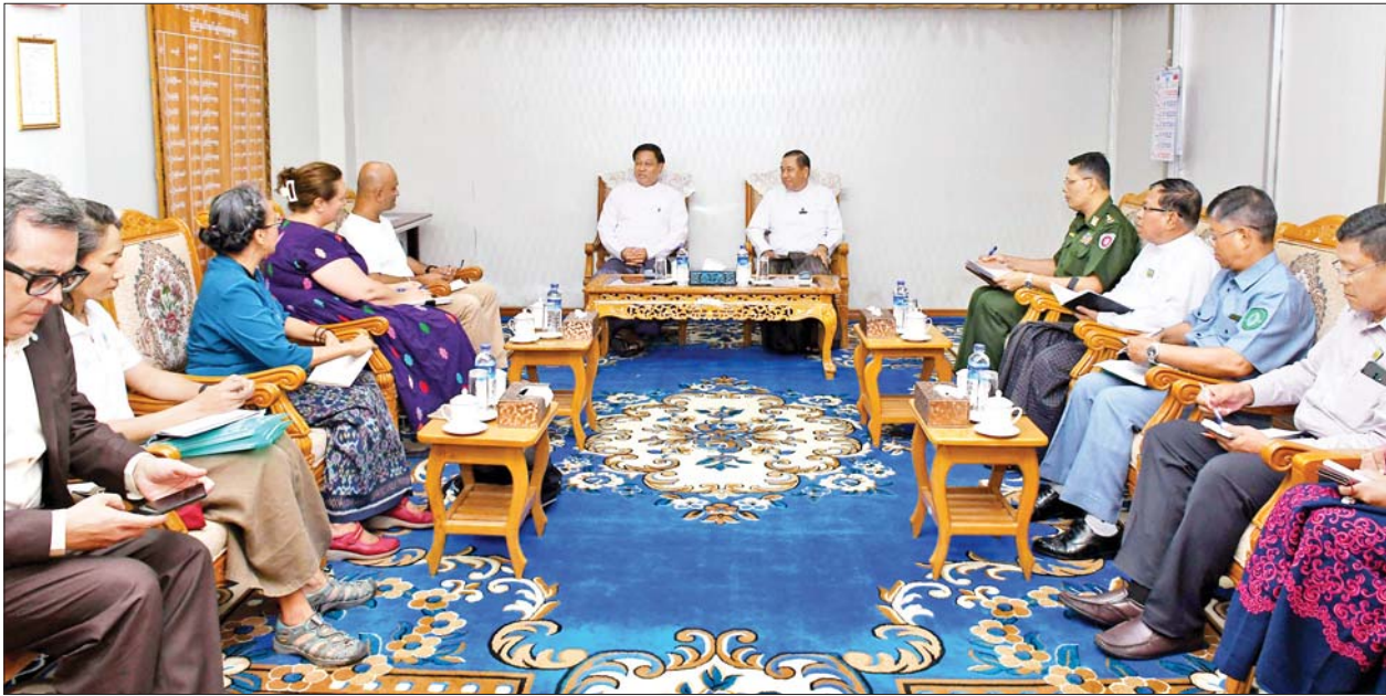
နိုင်ငံတော်စီမံအုပ်ချုပ်ရေးကောင်စီအဖွဲ့ဝင် ဒုတိယဝန်ကြီးချုပ်နှင့် ပြည်ထောင်စုဝန်ကြီး ဗိုလ်ချုပ်ကြီးတင်အောင်စန်း၊ ပြည်ထောင်စုဝန်ကြီး ဒုတိယဗိုလ်ချုပ်ကြီး ထွန်းထွန်းနောင်တို့ ကုလသမဂ္ဂလူသားချင်းစာနာမှုဆိုင်ရာ ညှိနှိုင်းရေးမှူးရုံး (UNRCD)မှ ယာယီညှိနှိုင်းရေးမှူးနှင့်အဖွဲ့အား လက်ခံတွေ့ဆုံစဉ်။

ဆွေးနွေး တွေ့ဆုံစဉ်ဆိုင်ကလုန်းမုန်တိုင်း မိခါ တိုက်ခတ်ခဲ့မှုနှင့်စပ်လျဉ်း၍ ကုလသမဂ္ဂ၏ ကူညီထောက်ပံ့ရေး အစီအစဉ်များအပေါ် ပေါင်းစပ် ညှိနှိုင်း ဆောင်ရွက်ရေးဆိုင်ရာ ကိစ္စရပ်များကို ဆွေးနွေးကြသည်။ မုန်းလွဲပိုင်းတွင် ဗိုလ်ချုပ်ကြီး တင်အောင်စန်း၊ ဒုတိယ ဗိုလ်ချုပ်ကြီး ထွန်းထွန်းနောင်၊ ပြည်နယ်ဝန်ကြီးချုပ် ဦးထိန်လင်း နှင့် ဒုတိယဗိုလ်ချုပ်ကြီးဖုန်းမြတ် တို့သည် ရခိုင်ပြည်နယ် အစိုးရ