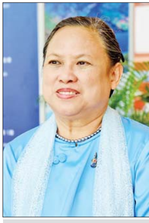
ဒေါ်နော်မူတာကပေါ