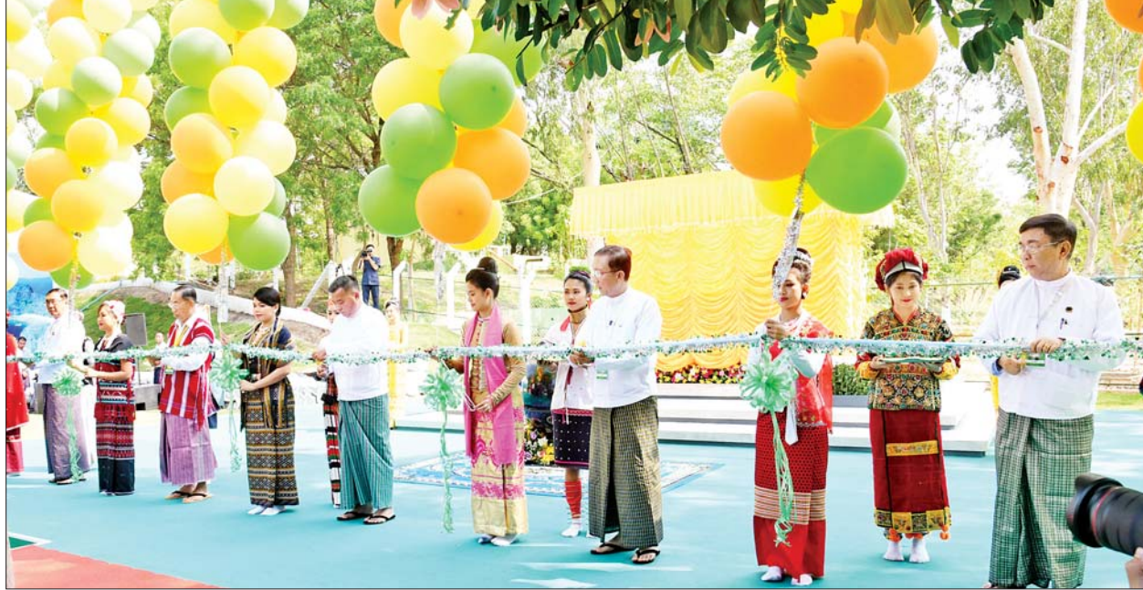
နိုင်ငံတော်စီမံအုပ်ချုပ်ရေးကောင်စီတွဲဖက်အတွင်းရေးမှူး ဒုတိယဗိုလ်ချုပ်ကြီး ရဲဝင်းဦး၊ ကောင်စီဝင် မန်းငြိမ်းမောင်၊ ဒုတိယဝန်ကြီးချုပ်နှင့် စီမံကိန်းနှင့်ဘဏ္ဍာရေးဝန်ကြီးဌာန ပြည်ထောင်စုဝန်ကြီး ဦးဝင်းရှိန်၊ သယံဇာတနှင့်သဘာဝပတ်ဝန်းကျင်ထိန်းသိမ်းရေးဝန်ကြီးဌာန ပြည်ထောင်စုဝန်ကြီး ဦးခင်မောင်ရီ၊ ပညာရေးဝန်ကြီးဌာန ပြည်ထောင်စုဝန်ကြီး ဒေါက်တာညွန့်ဖေတို့က သစ်တောပညာနှစ်(၁၀၀) ရာပြည့်အထိမ်းအမှတ်အခမ်းအနားကို ဖဲကြီးဖြတ်ဖွင့်လှစ်ပေးကြောင်းကို ဖော်ပြထားပါသည်။

အရေးကြီးလှပါကြောင်း၊ ထိုသို့ အရေးကြီးသော သစ်တောဆိုင်ရာ ပညာရပ်များ သင်ကြားပို့ချပေးနေသည့် မြန်မာနိုင်ငံ တက္ကသိုလ် အဆင့် သစ်တောပညာသည် နှစ်တစ်ရာတိုင် ပြည့်မြောက် ခဲ့ပြီဖြစ်သဖြင့် ရာပြည့်အထိမ်းအမှတ်အခမ်းအနားကို ကျင်းပ နိုင်ခြင်းသည် ဝမ်းမြောက်ဂုဏ်ယူ ရမည့် အခမ်းအနား၊ မင်္ဂလာရှိ သည့်နေ့ တစ်နေ့ပင်ဖြစ်ပါ ကြောင်း၊ သစ်တောသစ်ပင်များ ရေရှည်တည်တံ့ ကောင်းမွန် စေရေးအတွက် စနစ်တကျစီမံ အုပ်ချုပ်လုပ်ကိုင်နိုင်ရန် သစ်တော ပညာရှင်များ၏ အခန်းကဏ္ဍသည် လွန်စွာအရေးကြီးလှပါကြောင်း။ များစွာအထောက်အကူပြုခဲ့ ၁၉၂၃ ခုနှစ်မှစတင်ပြီး ရန်ကုန် တက္ကသိုလ်တွင် သစ်တောပညာ ဌာနကို ဖွင့်လှစ်နိုင်ခဲ့ခြင်းဖြစ် သဖြင့် သစ်တောပညာဌာနသည် ၁၉၂၀ ပြည့်နှစ်တွင် ဖွင့်လှစ်ခဲ့သည့် ရန်ကုန်တက္ကသိုလ်နှင့် မရေး မနှောင်း ဖွင့်လှစ်နိုင်ခဲ့သည်ကို တွေ့မြင်ရမည်ဖြစ်ပါကြောင်း၊ ယခုကဲ့သို့ သစ်တောပညာရပ်ကို သင်ကြားပို့ချပေးပြီး နှစ်ပေါင်း များစွာ ရေရှည်အသုံးပြုလာနိုင်ခဲ့ သည့်အတွက်လည်း မြန်မာနိုင်ငံ၏ သစ်တောသစ်ပင်များထိန်းသိမ်း ကာကွယ်ရေးနှင့် စီမံအုပ်ချုပ်မှု လုပ်ငန်းများတွင် များစွာအထောက် အကူပြုခဲ့သည်ကို တွေ့ရှိရမည် ဖြစ်ပါကြောင်း။