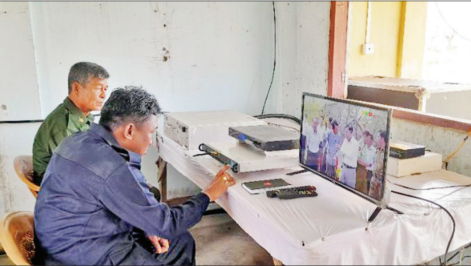
ကောင်းမွန်စွာထုတ်လွှင့်နိုင်ရေးအတွက် လိုအပ်သည့် ဆက်စပ်ပစ္စည်းများ အမြန်ပို့ဆောင်၍ ပြင်ဆင် ဆောင်ရွက်မှုများကို ဆောင်ရွက်လျက်ရှိကြောင်း၊ ထိုသို့ဆောင်ရွက်စဉ်ကာလအတွင်း ယာယီထုတ်လွှင့် သတင်းစဉ်

အလွန်အားကောင်းသော ဆိုင်ကလုနီးမုန့်တိုင်း “မိုခါ”(MOCHA)တိုက်ခတ်မှုကြောင့် ရခိုင်ပြည်နယ် အတွင်းရှိ ကျေးရွာ/ ရပ်ကွက်များမှ လူနေအဆောက် အအုံများ၊ ဘာသာရေးဆိုင်ရာအဆောက်အအုံများ၊ ဌာနဆိုင်ရာအဆောက်အအုံများ ပြိုကျပျက်စီးခြင်း များဖြစ်ပေါ်ခဲ့သည့်အပြင် စစ်တွေမြို့ရှိ မြဝတီ ထပ်ဆင့်လွှင့်စက်ရုံနှင့် သဇင် FM ထပ်ဆင့်လွှင့်စက်ရုံ များမှာလည်း မုန့်တိုင်းဒဏ်ကြောင့် ပြိုကျပျက်စီး ခဲ့ပြီး မီတာ ၁၀၀ လေးချောင်းထောက် တာဝါတိုင်နှင့် ဆက်စပ်ပစ္စည်းများ လဲကျပျက်စီးခဲ့သဖြင့် ရခိုင် ပြည်နယ်အတွင်း ရုပ်သံထုတ်လွှင့်မှုများ ခေတ္တ ရပ်ဆိုင်းခဲ့ရသည်။