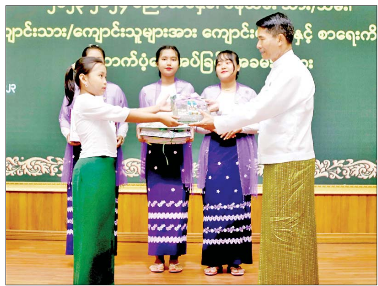
တက်ရောက်သင်ယူကြမည့် နိုင်ငံ့ဝန်ထမ်း သိန်း ၆၀၀ ကျော် တန်ဖိုးရှိ ကျောင်းဝတ်စုံ နှင့် စာရေးကိရိယာများ ထောက်ပံ့ပေးအပ် ခဲ့ခြင်းဖြစ်ကြောင်း သိရသည်။ သတင်းစဉ် စုစုပေါင်း ၂၃၀၀ ကျော်အတွက် ငွေကျပ်

မိမိဘဝ မိမိအနာဂတ်ရည်မှန်းချက်များ ပေါက်မြောက်အောင်မြင်ရေး ကြိုးပမ်း အားထုတ်သွားကြရန် တိုက်တွန်းပါ ကြောင်း ပြောကြားသည်။ ထို့နောက် ပြည်ထောင်စုဝန်ကြီး၊ အမြဲတမ်းအတွင်းဝန်နှင့် ညွှန်ကြားရေးမှူး ချုပ်များ၊ ပါမောက္ခချုပ်များက ကျောင်း ဝတ်စုံနှင့် စာရေးကိရိယာများ ထောက်ပံ့ ပေးအပ်ကြရာ ကျောင်းသား ကျောင်းသူ ကိုယ်စားလှယ်များက လက်ခံရယူခဲ့ကြ သည်။ ယနေ့ကျင်းပသည့် စိုက်ပျိုးရေး၊ မွေးမြူရေးနှင့် ဆည်မြောင်းဝန်ကြီးဌာန အောက်ရှိ ဦးစီးဌာနများ၊ တက္ကသိုလ်များ၌ တာဝန် ထမ်းဆောင်လျက်ရှိကြသော နေပြည်တော် ရှစ်မြို့နယ်အတွင်း ၂၀၂၃- ၂၀၂၄ ပညာသင်နှစ်တွင် မူလတန်း၊ အလယ်တန်း၊ အထက်တန်းပညာ