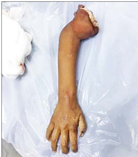
ပြတ်တောက်သွားသည့် ညာလက်ကို တွေ့မြင် ရစဉ်။(၂၀-၃-၂၀၂၃)

မကွေးတိုင်းဒေသကြီး အောင်လံမြို့တွင် နေထိုင် သည့် အသက်(၃)နှစ်အရွယ် မိန်းကလေးသည် မတ် ၂၀ ရက် နံနက် ၉ နာရီတွင် မိဘများနှင့် ဆိုင်ကယ် စီးလာရာ မျက်နှာချင်းဆိုင်မှ ထော်လာဂျီနှင့် တိုက်မိ သောကြောင့် ညာဘက်လက်မောင်း ပြတ်တောက် သွားသည့်ဒဏ်ရာ(Amputated Right Arm)ဖြင့် ပြည်သူ့ဆေးရုံ အောင်လံမြို့မှတစ်ဆင့် ရန်ကုန် ပြည်သူ့ဆေးရုံကြီးသို့ ယင်းနေ့ညနေ ၄ နာရီတွင် ရောက်ရှိလာခဲ့ရာ အဆိုပါကလေးငယ်၏ပြတ်တောက် သွားသောလက်ကို ပြန်လည်ဆက်ပေးသည့် ခွဲစိတ် ကုသမှုကို ညနေ ၅ နာရီမှ စတင်ခဲ့ပြီး ည ၁၀ နာရီ မိနစ် ၂၀ တွင် အောင်မြင်စွာ ဆောင်ရွက်ပြီးစီးခဲ့သည်။