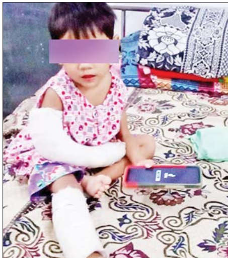
မေ ၁၆ ရက်တွင် ပြတ်တောက်သွားသော အာရုံကြောများဆက်သည့် နောက်ဆက်တွဲ ခွဲစိတ် မှုပြီးနောက် တွေ့ရသည့်ကလေးငယ်။

နောက်ဆက်တွဲကုသမှုဖြစ်သည့် ပြတ်တောက်သွား သော အာရုံကြောများဆက်ခြင်း(Sural Nerve Graft) ခွဲစိတ်ကုသမှုကို ဆောင်ရွက်နိုင်ခဲ့ကာ လေ့ကျင့်ခန်း ဆက်လက်ပြုလုပ်လျက်ရှိပြီး ကလေးငယ်၏လက် အခြေအနေ ကောင်းမွန်လျက်ရှိသည်။ ထိုလက်ပြတ်တောက်သွားသည့် လူနာကဲ့သို့ ပြတ်တောက်သွားသောလက်ကို ခွဲစိတ်ကုသမှု ဆောင်ရွက်ရန်အတွက် ပြည်သူ့ဆေးရုံကြီးများသို့ လွှဲပြောင်းပေးပို့မည်ဆိုပါက ပြတ်တောက်သွား သောလက်အား ရေသန့်သန့် သို့မဟုတ် အကြော ဆေးရည် (Normal Saline or Ringer Lactate)