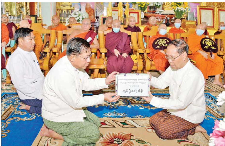
နိုင်ငံတော်စီမံအုပ်ချုပ်ရေးကောင်စီဥက္ကဋ္ဌ နိုင်ငံတော်ဝန်ကြီးချုပ် ဗိုလ်ချုပ်မှူးကြီးမင်းအောင်လှိုင် ဗန်းမော်ဆရာတော်ဘုရားကြီး၏ အန္တိမအဂ္ဂိဈာပနပူဇာသဘင်အခမ်းအနား ကျင်းပနိုင်ရေးအတွက် နိုင်ငံတော်စီမံအုပ်ချုပ်ရေးကောင်စီနှင့် တပ်မတော်(ကြည်း၊ ရေ၊ လေ) အရာရှိ၊ စစ်သည်၊ မိသားစုများမှ လှူဒါန်းသည့် အလှူငွေများ ပေးအပ်လှူဒါန်းစဉ်။

၂၀၁၀ ပြည့်နှစ်မှစ၍ သာသနာ့ဦးညှောင် တာဝန်များကို ထမ်းဆောင်ခဲ့သည့် ဗန်းမော်ဆရာတော်ဘုရားကြီး ပျံလွန်တော်မူခဲ့ခြင်းသည် သာသနာ့တော်နှင့် နိုင်ငံတော်အတွက် ကြီးမားသည့်