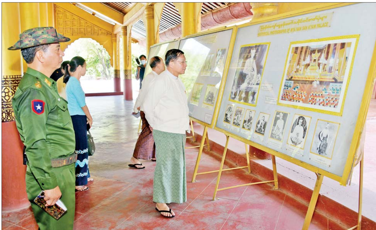
နိုင်ငံတော်စီမံအုပ်ချုပ်ရေးကောင်စီဥက္ကဋ္ဌ နိုင်ငံတော်ဝန်ကြီးချုပ် ဗိုလ်ချုပ်မှူးကြီး မင်းအောင်လှိုင် မန္တလေးနန်းမြို့တွင်းရှိ မြန်နန်းစံကျော်ရွှေနန်းတော်ကြီး သမိုင်းဝင်မှတ်တမ်းဓာတ်ပုံများ ပြသထားမှုကို ကြည့်ရှုစဉ်။

မှန်နန်းဆောင် အတွင်းရှိ တိုင်လုံးများအပေါ်တွင် မှန်စီရွှေချခြင်းများကို သပ်ရပ်မှုရှိအောင် ပြန်လည် ဆောင်ရွက်သွားရန် လိုကြောင်း၊ ပလ္လင်တော်အပါအဝင် အချို့သော အသုံးအဆောင်ပစ္စည်းများကို ရေရှည်တည်တံ့ခိုင်မြဲစေရေးအတွက် မှန်ကာရံခြင်းများကို ဆောင်ရွက်သွားရန် လိုကြောင်း၊ နန်းဆောင်အချင်းချင်း ဆက်သွယ်ထားသည့် လမ်းများကိုလည်း မူလပုံစံများအတိုင်း အတတ်နိုင်ဆုံး ဖြစ်အောင် ဆောင်ရွက်သွားရန် လိုကြောင်း၊ ရှေးဟောင်း အမွေအနှစ်လက်ရာများဖြစ်သည့် အတွက် အထူးဂရုပြု ထိန်းသိမ်းစောင့်ရှောက်သွားရန် လိုကြောင်းနှင့် သန့်ရှင်းသပ်ရပ်မှုရှိအောင် ထိန်းသိမ်းဆောင်ရွက်မည်ဆိုပါက လာရောက်လေ့လာသူများကိုလည်း ပိုမိုဆွဲဆောင်နိုင်မည်ဖြစ်ကြောင်း မှာကြားသည်။