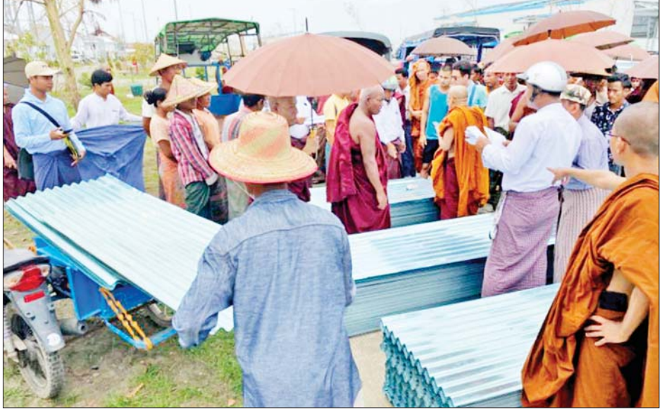
မုန်တိုင်းတိုက်ခတ်မှုကြောင့် ပျက်စီးမှုများဖြစ်ပေါ်ခဲ့သည့် စစ်တွေမြို့ပေါ်ရှိ ဘုန်းတော်ကြီးကျောင်း များအတွက် သွပ်များလှူဒါန်းပေးအပ်စဉ်။