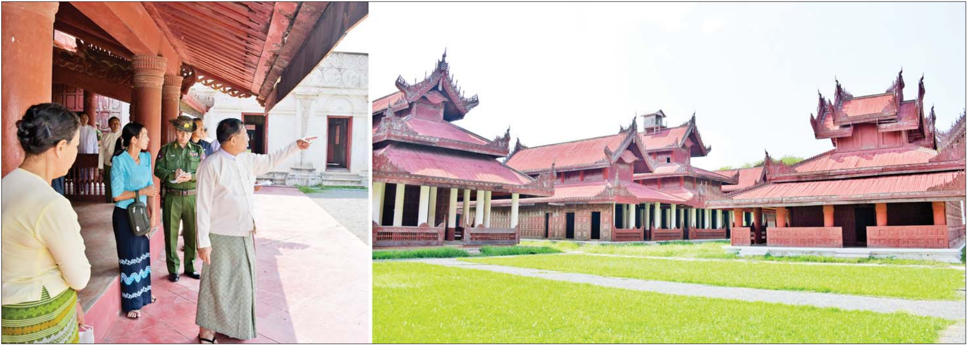
နိုင်ငံတော်စီမံအုပ်ချုပ်ရေးကောင်စီဥက္ကဋ္ဌ နိုင်ငံတော်ဝန်ကြီးချုပ် ဗိုလ်ချုပ်မှူးကြီး မင်းအောင်လှိုင် မန္တလေးနန်းမြို့တွင်းရှိ မြန်နန်းစံကျော်ရွှေနန်းတော်ကြီး ထိန်းသိမ်းထားရှိမှုများအား ကြည့်ရှုစစ်ဆေးစဉ်။