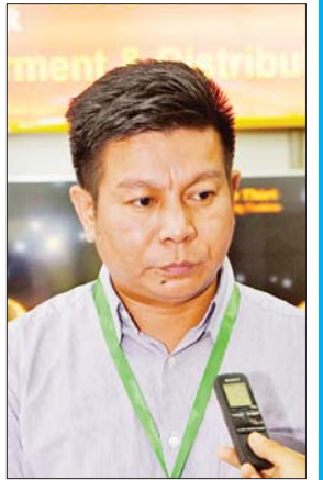
ဦးမြိုးသူ