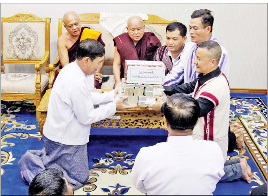
ကရင်ပြည်နယ် နယ်ခြားစောင့်တပ်မိသားစုနှင့် မြိုင်ကြီးငူ အထူးဒေသမိသားစုများကိုယ်စား တာဝန် ရှိသူများက အလှူငွေများ ပေးအပ်လှူဒါန်းရာ ရခိုင်ပြည်နယ်ဝန်ကြီးချုပ်က လက်ခံရယူစဉ်။

ပေးအပ်လှူဒါန်း အခမ်းအနားတွင် ကရင်ပြည်နယ် နယ်ခြားစောင့်တပ် မိသားစုနှင့် မြိုင်ကြီးငူအထူး ဒေသမိသားစုများ ကိုယ်စား တာဝန်ရှိသူများက အလှူငွေစုစုပေါင်း ငွေကျပ်သိန်း ၁၅၀၀ ကို ပေးအပ်လှူဒါန်းရာ ပြည်နယ်ဝန်ကြီးချုပ်နှင့် အနောက် ပိုင်းတိုင်းစစ်ဌာနချုပ် တိုင်းမှူး တို့က လက်ခံရယူကြပြီး ဂုဏ်ပြု မှတ်တမ်းလွှာများ ပြန်လည်ပေး အပ်ကြသည်။ ယင်းနောက် ဗိုလ်ချုပ်ကြီး တင်အောင်စန်း၊ ဒုတိယဗိုလ်ချုပ်ကြီး ထွန်းထွန်းနောင်နှင့် ပြည်နယ်