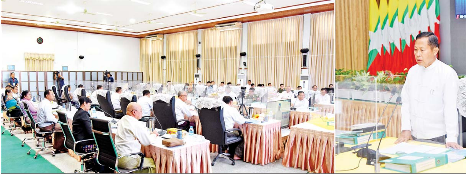
နိုင်ငံတော်စီမံအုပ်ချုပ်ရေးကောင်စီ ဒုတိယဥက္ကဋ္ဌ ဒုတိယဝန်ကြီးချုပ် ဒုတိယဗိုလ်ချုပ်မှူးကြီး စိုးဝင်း တရားမဝင်ကုန်သွယ်မှုတိုက်ဖျက်ရေးဦးဆောင်ကော်မတီလုပ်ငန်း ညှိနှိုင်းအစည်းအဝေး (၃/၂၀၂၃)တွင် အမှာစကားပြောကြားစဉ်။

အစည်းအဝေးတွင် နိုင်ငံတော် စီမံအုပ်ချုပ်ရေးကောင်စီ ဒုတိယ ဥက္ကဋ္ဌ ဒုတိယဝန်ကြီးချုပ်က စာမျက်နှာ ၉ ကော်လံ ၁ သို့ ၁၇