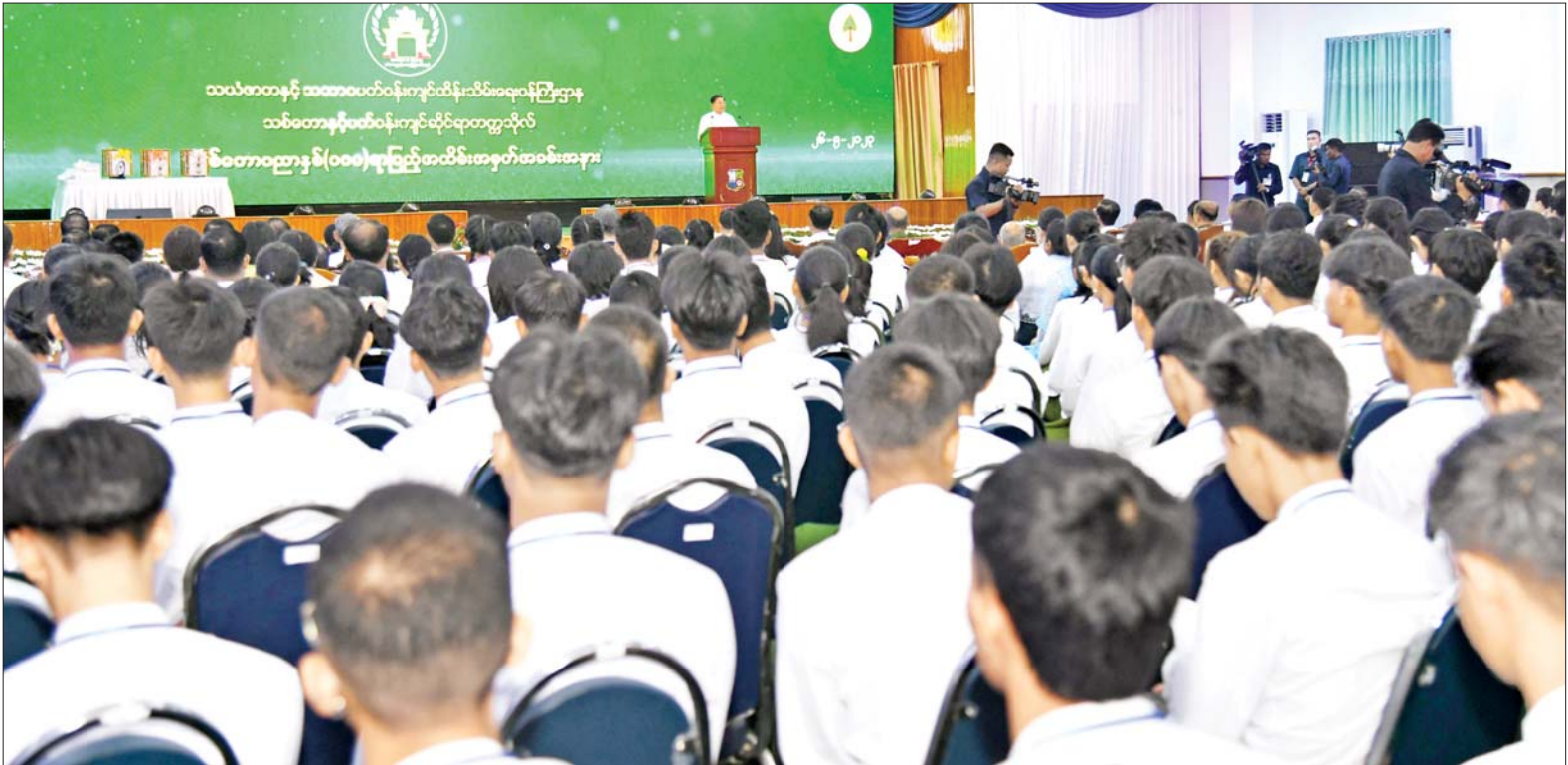
နိုင်ငံတော်စီမံအုပ်ချုပ်ရေးကောင်စီဥက္ကဋ္ဌ နိုင်ငံတော်ဝန်ကြီးချုပ် ဗိုလ်ချုပ်မှူးကြီးမင်းအောင်လှိုင် သစ်တောပညာနစ်(၁၀၀) ရာပြည့်အထိမ်းအမှတ်အခမ်းအနားတွင် အမှာစကားပြောကြားစဉ်။

❖ စာမျက်နှာ ၆ မှ မတူကွဲပြားခြားနားသည့် သဘာဝ သစ်တောသစ်ပင်များ၊ ဇီဝမျိုးစုံမျိုးကွဲများ၊ မြစ်ချောင်း အင်းအိုင်များ၊ ရေမြေတောတောင် များနှင့် ဂေဟစနစ်များ စုံလင်လှပစွာ တည်ရှိနေသကဲ့သို့ ပင်လယ် ကမ်းခြေဒီရေတော၊ ပဲခူးရိုးမ ရွက်ပြတ်ရောနှောတော၊ အပူပိုင်း ဒေသ မြောက်ပိုင်း၊ မြောက်ပိုင်း တောင်ပေါ်ဒေသ အအေးပိုင်း တောများ စသည့် သစ်တောမျိုးစုံ ပေါက်ရောက်နေသည်ကိုလည်း တွေ့ရှိရမည်ဖြစ်ပါကြောင်း။ အခြေခံအုတ်မြစ်ကောင်းများဖြစ် မြန်မာ့သစ်တောများသည် မြန်မာနိုင်ငံကြီး ရေရှည်စဉ်ဆက် မပြတ်ဖွံ့ဖြိုးတိုးတက်ရေးအတွက် အခြေခံ အုတ်မြစ်ကောင်းများ ဖြစ်သည့်အပြင် ဒေသခံပြည်သူ များ၏ လူမှုစီးပွားဘဝဖွံ့ဖြိုး တိုးတက်ရန်နှင့် အလုပ်အကိုင် အခွင့်အလမ်းများစွာကို ဖြစ်ပေါ် စေရန် ဖန်တီးပေးနိုင်သည်ကို အားလုံးအသိပင်ဖြစ်ပါကြောင်း။ သစ်တောပညာဌာန စတင်ခဲ့ သည့် သမိုင်းကြောင်းကို ပြန်ကြည့်မည်ဆိုပါက ၁၈၅၆ ခုနှစ်တွင် ဒေါက်တာဘရန်းဒစ်က စတင်မျိုးစေ့ချ တည်ထောင်ပေး ခဲ့သည့် မြန်မာ့သစ်တောများ သိပ္ပံနည်းကျ စီမံအုပ်ချုပ်မှု စနစ်မှစ၍ သန္တတည်ခဲ့သည်ဟု ဆိုရမည်ဖြစ်ပါကြောင်း၊ အဆိုပါ