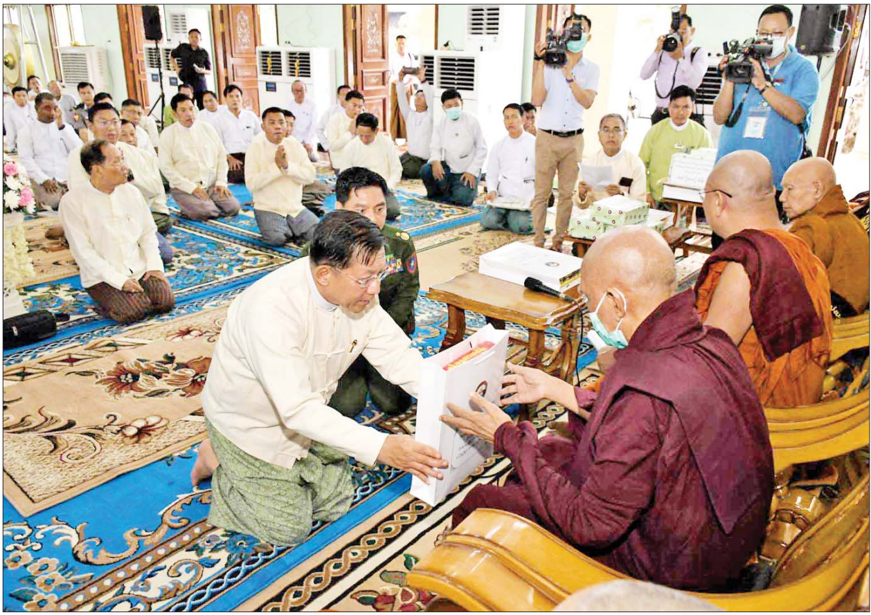
နိုင်ငံတော်စီမံအုပ်ချုပ်ရေးကောင်စီဥက္ကဋ္ဌ နိုင်ငံတော်ဝန်ကြီးချုပ် ဗိုလ်ချုပ်မှူးကြီးမင်းအောင်လှိုင် နိုင်ငံတော်သံဃမဟာနာယကအဖွဲ့အကျိုးတော်ဆောင် သန်လျင်မင်းကျောင်းဆရာတော်ကြီးထံ လှူဖွယ်ပစ္စည်းများ ဆက်ကပ်လှူဒါန်းစဉ်။

ဆုံးရှုံးမှုဖြစ်သည့်အတွက် များစွာ ကြေကွဲ ဝမ်းနည်းမိပါကြောင်း၊ ဆရာတော် ဘုရားကြီး၏