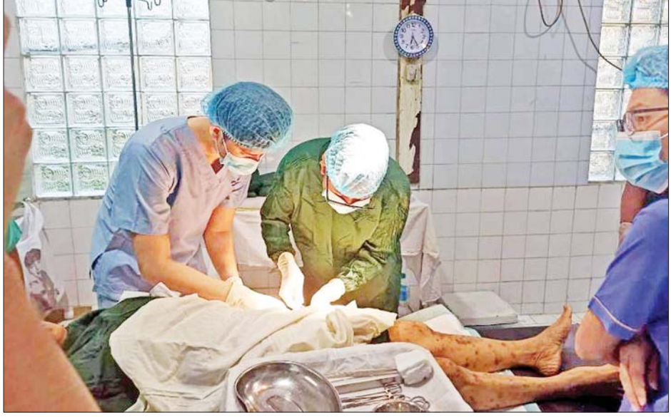
မုန်တိုင်းဒဏ်သင့်ပြည်သူများအား ကျန်းမာရေးစောင့်ရှောက်မှုလုပ်ငန်းများ ဆောင်ရွက်ပေးစဉ်။