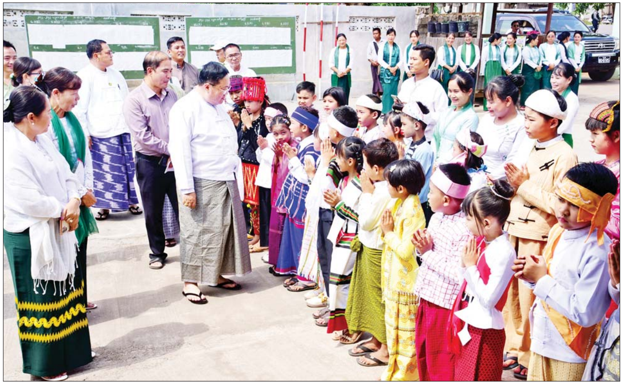
နိုင်ငံတော်စီမံအုပ်ချုပ်ရေးကောင်စီအဖွဲ့ဝင် ဒေါက်တာကျော်ထွန်း၊ အေးသာယာမြို့ စက်မှုဇုန်အခြေခံပညာအထက်တန်းကျောင်း၌ ကျောင်းသား ကျောင်းသူများအား ရင်းရင်းနှီးနှီး နှုတ်ဆက်စဉ်။

ထို့နောက် ဟဲဟိုးမြို့အမှတ်(၄)အခြေခံပညာအထက်တန်းကျောင်း၊ ကျောင်းအုပ်ဆရာမကြီးက ကျောင်းပြင်ထိန်းကိစ္စရပ်များ ရှင်းလင်းတင်ပြရာ နိုင်ငံတော်စီမံအုပ်ချုပ်ရေးကောင်စီအဖွဲ့ဝင်က ပြန်လည်ဖြည့်စွက်ပြောကြားပြီး ကျောင်းဖွံ့ဖြိုးရေးအတွက် နိုင်ငံတော်စီမံအုပ်ချုပ်ရေးကောင်စီအဖွဲ့ဝင်၊ ရှမ်းပြည်နယ်ဝန်ကြီးချုပ်တို့က ထောက်ပံ့ငွေပေးအပ်ရာ ကျောင်းအုပ်ဆရာမကြီးနှင့်ကျောင်းအကျိုးတော်ဆောင်ဥက္ကဋ္ဌ ဦးမျိုးမင်းဦးတို့က လက်ခံရယူ၍ နိုင်ငံတော်စီမံအုပ်ချုပ်ရေးကောင်စီအဖွဲ့ဝင်က နိဂုံးချုပ်စကားပြောကြားပြီး ဆရာ ဆရာမများ၊ ရပ်မိရပ်ဖများ၊ ကျောင်းသား ကျောင်းသူများအား ရင်းရင်းနှီးနှီး လိုက်လံနှုတ်ဆက်