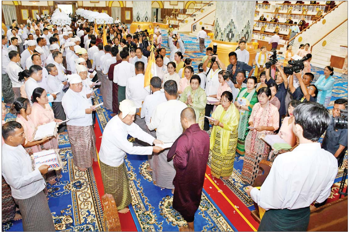
နိုင်ငံတော်စီမံအုပ်ချုပ်ရေးကောင်စီဒုတိယဥက္ကဋ္ဌ ဒုတိယဝန်ကြီးချုပ် ဒုတိယဗိုလ်ချုပ်မှူးကြီးစိုးဝင်းနှင့်ဇနီး ဒေါ်သန်းသန်းနွယ် အမျိုးပြုသော ဧည့်ပရိသတ် များက တိပိဋကဓရ တိပိဋကကောဝိဒ ရွေးချယ်ရေးစာမေးပွဲတွင် အောင်မြင်တော်မူကြသည့် သာသနာ့အာဇာနည် အရှင်သူမြတ်များအား ဆွမ်းဆန်စိမ်းနှင့် လှူဖွယ်ဝတ္ထုပစ္စည်းများ လောင်းလှူကြစဉ်။

ယင်းနောက် နိုင်ငံတော်သံဃမဟာနာယက အဖွဲ့ ဒုတိယဥက္ကဋ္ဌဆရာတော် မန္တလေးမြို့ မစိုးရိမ် တိုက်သစ် မဟာနာယကချုပ် အဂ္ဂမဟာပဏ္ဍိတ၊ အဂ္ဂမဟာသဒ္ဓမ္မဇောတိကဓဇဘဒ္ဒန္တကေသရာဘိဝံသ ထံမှ နိုင်ငံတော်စီမံအုပ်ချုပ်ရေးကောင်စီ ဒုတိယ ဥက္ကဋ္ဌ ဒုတိယဝန်ကြီးချုပ် ဒုတိယဗိုလ်ချုပ်မှူးကြီး စိုးဝင်းနှင့် ဧည့်ပရိသတ်များက အနုမောဒနာတရား နာယုကြပြီး လှူဒါန်းမှုအစုစုတို့အတွက် ရေစက် သွန်းလောင်းအမျှပေးဝေကြကာ သံဃာတော်များ အား လှူဖွယ်ဝတ္ထုပစ္စည်းများ ဆက်ကပ်လှူဒါန်း ကြသည်။ ထို့နောက် နိုင်ငံတော်စီမံအုပ်ချုပ်ရေးကောင်စီ