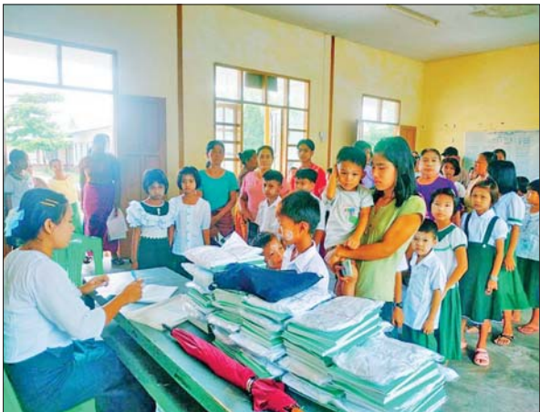
မွန်ပြည်နယ် ပေါင်မြို့နယ် အခြေခံပညာကျောင်း၌ မေ ၂၃ ရက်က ကျောင်းအပ်လက်ခံစဉ်။ မြို့နယ်(ပြန်/ဆက်)

ဧရာဝတီ တိုင်းဒေသကြီး ဝန်ကြီးချုပ် ဦးတင်မောင်ဝင်း မေ ၂၃ ရက်က ပုသိမ်မြို့ပေါ်ရှိ အခြေခံပညာ ကျောင်းများ၌ ကျောင်းအပ်လက်ခံမှု အခြေအနေများကို ကြည့်ရှုစစ်ဆေးစဉ်။ တိုင်းဒေသကြီး(ပြန်/ဆက်)