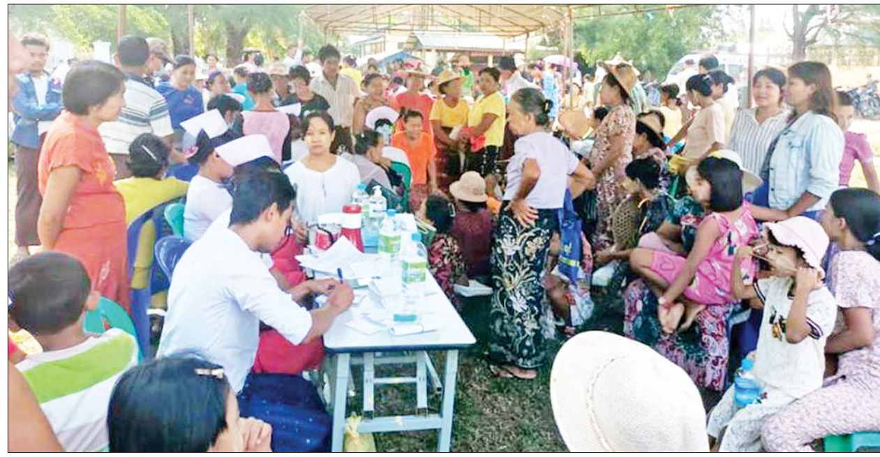
မာန်အောင်မြို့နယ်၌ နယ်လှည့်အထူးကုဆေးအဖွဲ့က ကျန်းမာရေးစောင့်ရှောက်မှုပေးနေစဉ်။

ကျန်းမာရေးဝန်ကြီးဌာနသည် ဆိုင်ကလုန်းမုန့်တိုင်း မိခင်ဘေးအန္တရာယ် ကျရောက်သည့်ဒေသများတွင် မေ ၁၅ ရက်မှစတင်၍ ကျန်းမာရေး စောင့်ရှောက်မှုများ ဆောင်ရွက် ပေးလျက်ရှိရာ ကျန်းမာရေးဝန်ကြီးဌာနအောက်ရှိ နယ်လှည့်အထူးကုဆေးအဖွဲ့များ၊ အရေးပေါ်တုံ့ပြန်ဆောင်ရွက်ရေးအဖွဲ့များနှင့် ဆေးအဖွဲ့များက တိုက်နယ်ဆေးရုံ၊ ကျေးလက်ကျန်းမာရေးဌာန၊ ကျေးလက်ကျန်းမာရေး ဌာနခွဲများမှသည် ကျေးလက်ဒေသများသို့ ရောက်ရှိသည်အထိ ကွင်းဆင်းဆောင်ရွက်ခြင်း၊ ပြည်သူ့ဆေးရုံများတွင် ပြင်ပလူနာများ ကြည့်ရှုကုသခြင်း၊ အတွင်းလူနာများအား ကုသပေးခြင်းနှင့် ခွဲစိတ်ရန်လိုအပ်သည့် လူနာများအား ယာယီခွဲစိတ်ခန်းများ ဖွင့်လှစ်၍ ကုသပေးခြင်းများ ဆောင်ရွက်လျက်ရှိသည်။