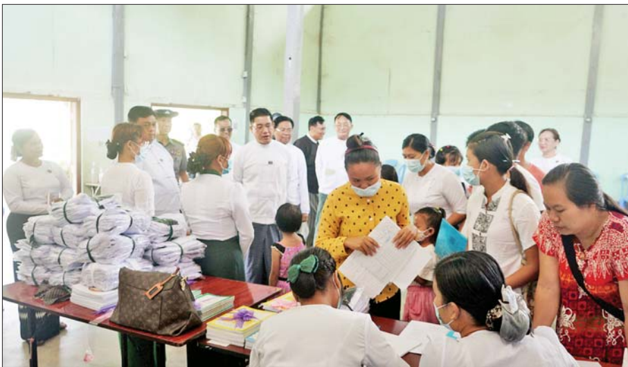
ကယားပြည်နယ်ဝန်ကြီးချုပ် ဦးဇော်မျိုးတင် မေ ၂၃ ရက်က လှိုင်ကော်မြို့နယ်အတွင်းရှိ အခြေခံပညာအထက်တန်းကျောင်းများ၌ ကျောင်းအပ်လက်ခံနေမှုကို ကြည့်ရှုအားပေးစဉ်။