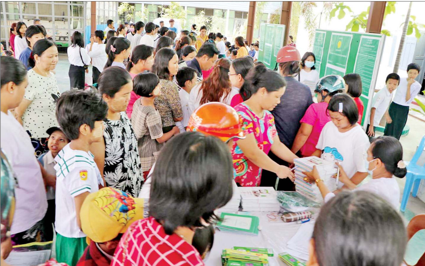
မန္တလေးတိုင်းဒေသကြီး ချမ်းအေးသာစံမြို့နယ်ရှိ အမှတ် (၁၄) အခြေခံပညာအထက်တန်းကျောင်းတွင် ကျောင်းလားရောက်အပ်နှံနေကြသည့် ကျောင်းသား မိဘများနှင့် ကျောင်းသား ကျောင်းသူများအား တွေ့ရစဉ်။

မန္တလေး မေ ၂၃ ၂၀၂၃-၂၀၂၄ ပညာသင်နှစ်အတွက် အခြေခံပညာ (အထက်တန်း၊ အလယ်တန်း၊ မူလတန်း)ကျောင်းများ ကို ဇွန် ၁ ရက်တွင် စတင်ဖွင့်လှစ်မည်ဖြစ်သည့်အတွက် “ကျောင်းနေရွယ် ကလေးအားလုံး ပညာရေး မဝေးဖို့ ကျောင်းအမြန်အပ်နှံဖို့” ဆောင်ပုဒ်ဖြင့် ကျောင်းအပ်နှံရေး ရက်သတ္တပတ်ကို မေ ၂၃ ရက်မှ ၃၁ ရက်အထိ သတ်မှတ်ထားရာ ယနေ့တွင် ကျောင်းအပ်နှံရေးလုပ်ငန်းစဉ်များကို တစ်နိုင်ငံလုံး အတိုင်းအတာဖြင့် စတင်ဆောင်ရွက်လျက်ရှိသည်။ ကြီးကြပ်ဆောင်ရွက် အလားတူ မန္တလေးမြို့ရှိ အခြေခံပညာကျောင်း များတွင်လည်း ယနေ့နံနက်ပိုင်းမှစတင်၍ ကျောင်းအပ်နှံရေးလုပ်ငန်းစဉ်များကို စတင် ဆောင်ရွက်လျက်ရှိရာ တာဝန်ကျ ဆရာ ဆရာမ များက ကျောင်းသားမိဘများနှင့် ကျောင်းသား ကျောင်းသူများ ကျောင်းလာရောက်အပ်နှံရတွင် ကိုဗစ်-၁၉ ရောဂါကာကွယ်ရေး စည်းမျဉ်း၊ စည်းကမ်း များနှင့်အညီဖြစ်စေရေးနှင့် ကျောင်းသားစာရင်း ပေးသွင်းရာတွင် အဆင်ပြေချောမွေ့စေရေးတို့ အတွက် ကြီးကြပ်ဆောင်ရွက်ပေးကြသည်။ “ကျွန်ုပ်တို့ရဲ့ ကျောင်းအပ်နှံရေးရက်သတ္တပတ် က မေ ၂၃ ရက်ကနေ ၃၁ ရက်အထိပါ။ ကာလသတ်မှတ် ထားပေးမယ့်လည်း ကျောင်းဖွင့်တဲ့ ဇွန်လအထိ လက်ခံ ပေးသွားမှာပါ။ ကလေးဆိုတာ ကျောင်းနေရမယ့် အရွယ်ပါ။ စာမျက်နှာ ၁၀ ကော်လံ ၁ သို့ ☺