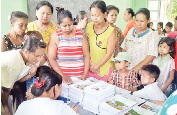
မွန်ပြည်နယ် သထုံမြို့နယ် အခြေခံပညာကျောင်း၌ မေ ၂၃ ရက်က ကျောင်းအပ်လက်ခံစဉ်။ ခရိုင်(ပြန်/ဆက်)