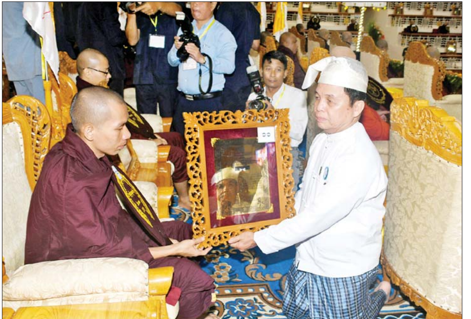
ပြည်ထောင်စုဝန်ကြီး ဦးမြင့်ကြိုင် ဘွဲ့တံဆိပ်တော်ရ ဆရာတော်အား ဘွဲ့တံဆိပ်တော်နှင့် အောင်လက်မှတ်တို့ကို ဆက်ကပ်လှူဒါန်းစဉ်။

ငါးပါးသီလခံယူဆောက်တည် ရွေးဦးစွာ တိပိဋကဓရ တိပိဋကကောဝိဒ ရွေးချယ်ရေးစာမေးပွဲ ဩဝါဒါစရိယအဖွဲ့ ဒုတိယ ဥက္ကဋ္ဌ ဧရာဝတီတိုင်းဒေသကြီး ဟင်္သာတမြို့ မိုးကောင်းကျောင်းတိုက် ပဓာနနာယက အဘိဓဇ မဟာရဋ္ဌဂုရု အဘိဓဇအဂ္ဂမဟာသဒ္ဓမ္မဇောတိက ဘဒ္ဒန္တသုဓမ္မာစာရာဘိဝံသ မဟာထေရ်မြတ်ကြီးထံမှ