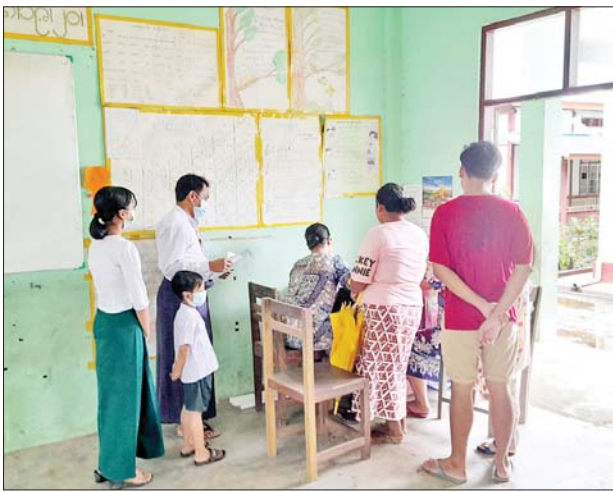
တနင်္သာရီတိုင်းဒေသကြီး သရက်ချောင်းမြို့နယ် အခြေခံပညာကျောင်း၌ မေ ၂၃ ရက်က ကျောင်းအပ်လက်ခံစဉ်။ မြို့နယ်(ပြန်/ဆက်)