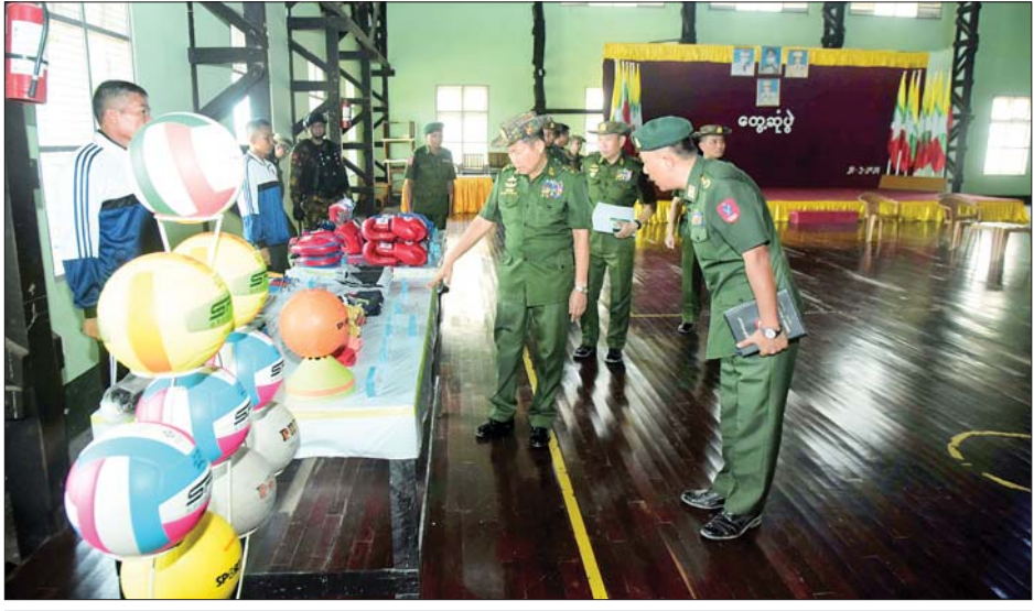
နိုင်ငံတော်စီမံအုပ်ချုပ်ရေးကောင်စီဒုတိယဥက္ကဋ္ဌ ဒုတိယတပ်မတော်ကာကွယ်ရေးဦးစီးချုပ်(ကြည်း) ဒုတိယဗိုလ်ချုပ်မှူးကြီး စိုးဝင်း ရဲမှန်တပ်မြို့ရှိ တပ်မတော်ကိုယ်ခံပညာနှင့်အားကစားသိပ္ပံ အားကစားရုံအတွင်း အားကစားပစ္စည်းဆိုင်ရာ သင်ထောက်ကူပစ္စည်းများကို ကြည့်ရှုစဉ်။

ထို့နောက် နိုင်ငံတော်စီမံအုပ်ချုပ်ရေးကောင်စီ ဒုတိယဥက္ကဋ္ဌ ဒုတိယတပ်မတော်ကာကွယ်ရေးဦးစီးချုပ်(ကြည်း)နှင့် အဖွဲ့ဝင်များသည် ဆေးရုံတွင် တက်ရောက်ဆေးကုသမှု ခံယူလျက်ရှိသည့် အရာရှိ၊ စစ်သည်၊ မိသားစုများအား လိုက်လံကြည့်ရှု၍ တစ်ဦးချင်း၏ ရောဂါဖြစ်ပွားမှု အခြေအနေများအား လိုက်လံမေးမြန်းအားပေးစကားပြောကြားကာ စားသောက်ဖွယ်ရာများနှင့် ထောက်ပံ့ပစ္စည်းများ ပေးအပ်သည်။ ထို့နောက် နိုင်ငံတော်စီမံအုပ်ချုပ်ရေးကောင်စီ ဒုတိယဥက္ကဋ္ဌ ဒုတိယတပ်မတော်ကာကွယ်ရေးဦးစီးချုပ်(ကြည်း)သည် ဆေးရုံတွင် တာဝန်ထမ်းဆောင်လျက်ရှိသည့် ကျန်းမာရေးဝန်ထမ်းများအတွက် ချီးမြှင့်ငွေများကို ပေးအပ်ရာ တာဝန်ရှိသူများက လက်ခံရယူခဲ့ကြကြောင်း သတင်းရရှိသည်။ သတင်းစဉ်