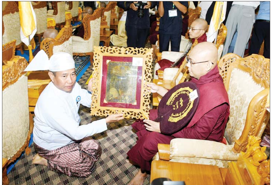
ကာကွယ်ရေးဦးစီးချုပ်ရုံး(ကြည်း)မှ ဒုတိယဗိုလ်ချုပ်ကြီး သက်ပုံ ဘွဲ့တံဆိပ်တော်ရဆရာတော်အား ဘွဲ့တံဆိပ်တော်နှင့် အောင်လက်မှတ်တို့ကို ဆက်ကပ်လှူဒါန်းစဉ်။