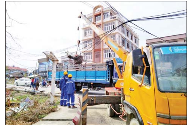
စစ်တွေမြို့ မေယုလမ်းနှင့် ပြည်ထောင်စုလမ်းထောင့်၌ တယ်လီဖုန်းတိုင်များ ပြန်လည်ပြုပြင်နေမှုကို တွေ့ရစဉ်။

ဒေသခံ ပြည်သူလူထုအနေဖြင့် စစ်တွေမြို့သို့ အချိန်မရွေး အလွယ်တကူ သွားလာနိုင်မည် ဖြစ်သည့်အပြင် ကုန်စည်စီးဆင်းမှုများ လွယ်ကူလျင်မြန်စွာ ဆောင်ရွက်နိုင်မည်ဖြစ်သည်။ မွန်းလွဲပိုင်းတွင် ဗိုလ်ချုပ်ကြီးတင်အောင်စန်းနှင့် အဖွဲ့သည် တည်ဆောက်ရေးပစ္စည်းများနှင့် စားသောက်ကုန် ပစ္စည်းများ တင်ဆောင်ထားသည့် ကုလားတန် ၄၊ ၅၊ ၆ ရေယာဉ်သုံးစင်းဖြင့် စစ်တွေမြို့ မြန်မာ့ဆိပ်ကမ်းအာဏာပိုင်ဖောင်တော်ကြီးဆိပ်ခံတံတားမှ စတင်ထွက်ခွာမှုကို သွားရောက်ကြည့်ရှုသည်။ ကုလားတန် ၄ ရေယာဉ်သည် တည်ဆောက်ရေး ပစ္စည်းနှင့် စားသောက်ကုန်ပစ္စည်း စုစုပေါင်း