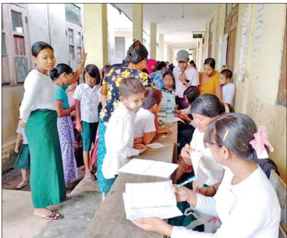
မွန်ပြည်နယ် ကျိုက်မရောမြို့နယ် အခြေခံပညာကျောင်း၌ မေ ၂၃ ရက်က ကျောင်းအပ်လက်ခံစဉ်။ မြို့နယ်(ပြန်/ဆက်)