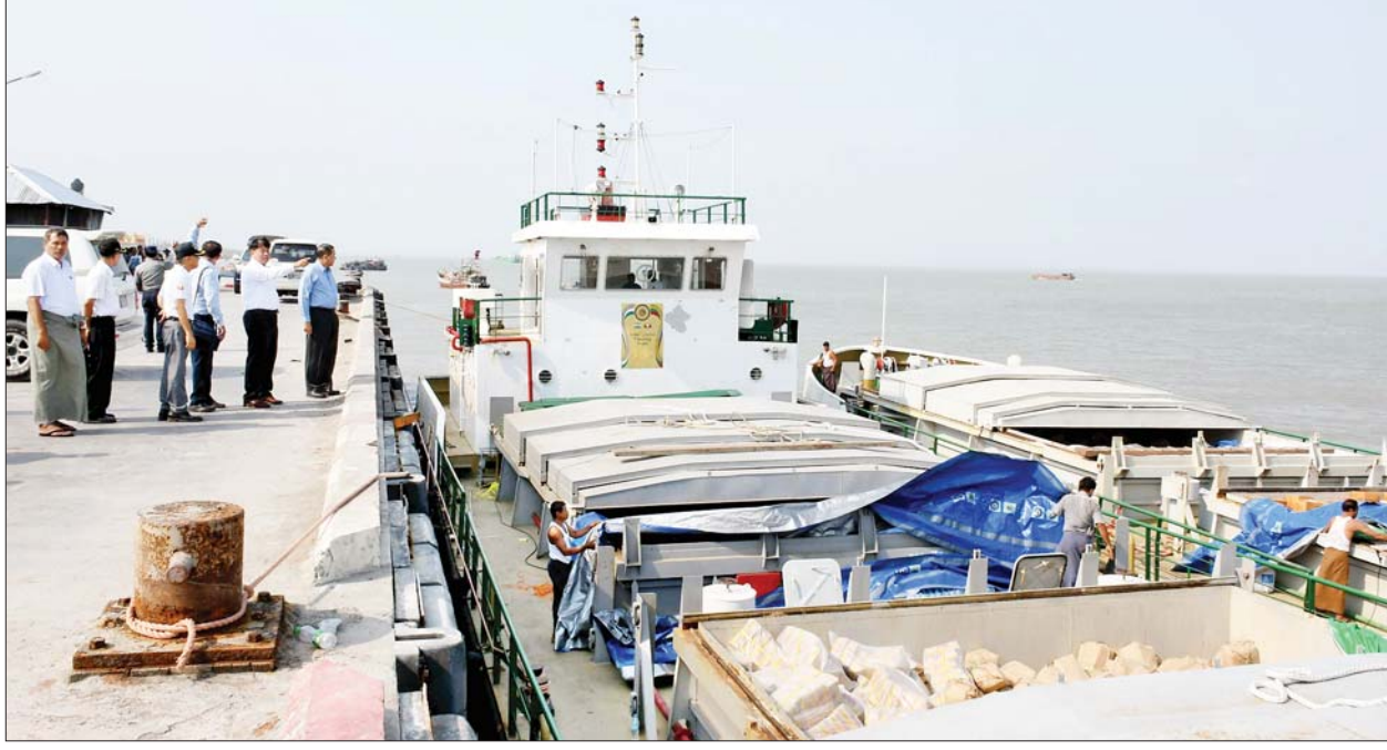
နိုင်ငံတော်စီမံအုပ်ချုပ်ရေးကောင်စီအဖွဲ့ဝင် ဒုတိယဝန်ကြီးချုပ်နှင့် ပြည်ထောင်စုဝန်ကြီး ဗိုလ်ချုပ်ကြီးတင်အောင်စန်းနှင့်အဖွဲ့ဝင်များ စစ်တွေမြို့ဖောင်တော်ကြီးဆိပ်ခံတံတားမှ ထွက်ခွာသည့် တည်ဆောက်ရေးပစ္စည်းများနှင့် စားသောက်ကုန်များတင်ဆောင်ထားသော ရေယာဉ်အား ကြည့်ရှုစဉ်။

နှင့်စပ်လျဉ်း၍ ဆောင်ရွက်ပြီးစီးမှုအခြေအနေနှင့် ဆက်လက်ဆောင်ရွက်သွားမည့် လုပ်ငန်းအစီအမံများကို ရှင်းလင်းတင်ပြကြပြီး လိုအပ်ချက်များကို အကြံပြု ဖြည့်စွက်ဆွေးနွေးကြသည်။ ဖြည့်ဆည်းဆောင်ရွက်ပေးထိုနေက် ဗိုလ်ချုပ်ကြီးတင်အောင်စန်းက ပြန်လည်ထူထောင်ရေး လုပ်ငန်းများ မြန်မြန်ဆန်ဆန် အကောင်အထည်ဖော်ပြီးစီးနိုင်ရေးအတွက် လူအင်အား၊ စက်ယန္တရားအင်အားနှင့် အခြားလိုအပ်ချက်များကို ပေါင်းစပ်ညှိနှိုင်းဖြည့်ဆည်း ဆောင်ရွက်ပေးပြီး အစည်းအဝေးကို ရုပ်သိမ်းလိုက်သည်။ မိခါမုန်တိုင်း ဘေးအန္တရာယ်မကျရောက်မီ ရခိုင်ပြည်နယ်အတွင်းတွင် ဆက်သွယ်ရေးအော်ပရေတာလေးခု၏ မိုဘိုင်းစခန်း ၁၂၃၃ စခန်းရှိသည့်အနက် ဆိုင်ကလုန်းမုန်တိုင်း “မိခါ” ကြောင့် မိုဘိုင်းစခန်း ၉၀၄ စခန်း ဆက်သွယ်မှု ပြတ်တောက်ခဲ့ရာ ဆက်သွယ်မှု ပြန်လည်ရရှိစေရေးအတွက် ချို့ယွင်းပြတ်တောက်ခဲ့သည့် မြေပေါ်/မြေအောက်ဖိုက်ဘာကေဘယ်လ်ဆက်ကြောင်းများ၊ မိုက္ကရိုဝေ့စက်ကြောင်းများနှင့် မြို့တွင်း ကေဘယ်လ်ကွန်ရက်များ ပြန်လည်ပြုပြင်ခြင်း၊ ပျက်စီးသွားသော မိုဘိုင်းဆက်သွယ်ရေးစခန်းများ ပြန်လည်ပြုပြင်ခြင်း စသည့်လုပ်ငန်းများကို ဒေသခံနှင့် အခြားတိုင်းဒေသကြီးနှင့် ပြည်နယ်များမှ လာရောက်သည့် ဆက်သွယ်ရေးဝန်ထမ်း စုစုပေါင်းအင်အား ၄၀၀ကျော်ဖြင့် ပြန်လည်ကောင်းမွန်အောင် ဆောင်ရွက်ခဲ့ရာ ယနေ့အထိ မိုဘိုင်းစခန်းစုစုပေါင်း ၆၄၇ စခန်း ပြန်လည်ပြုပြင်နိုင်ခဲ့သောကြောင့် မိုဘိုင်းစခန်းစုစုပေါင်း ၉၇၆ စခန်း ရာခိုင်နှုန်းအားဖြင့် ၇၉ ဒသမ ၁၆ ရာခိုင်နှုန်းဖြင့် ရခိုင်ပြည်နယ်အတွင်း ဆက်သွယ်ရေးဝန်ဆောင်မှုများ ပြန်လည်ပေးနိုင်ပြီဖြစ်ကြောင်း သိရသည်။ သတင်းစဉ်