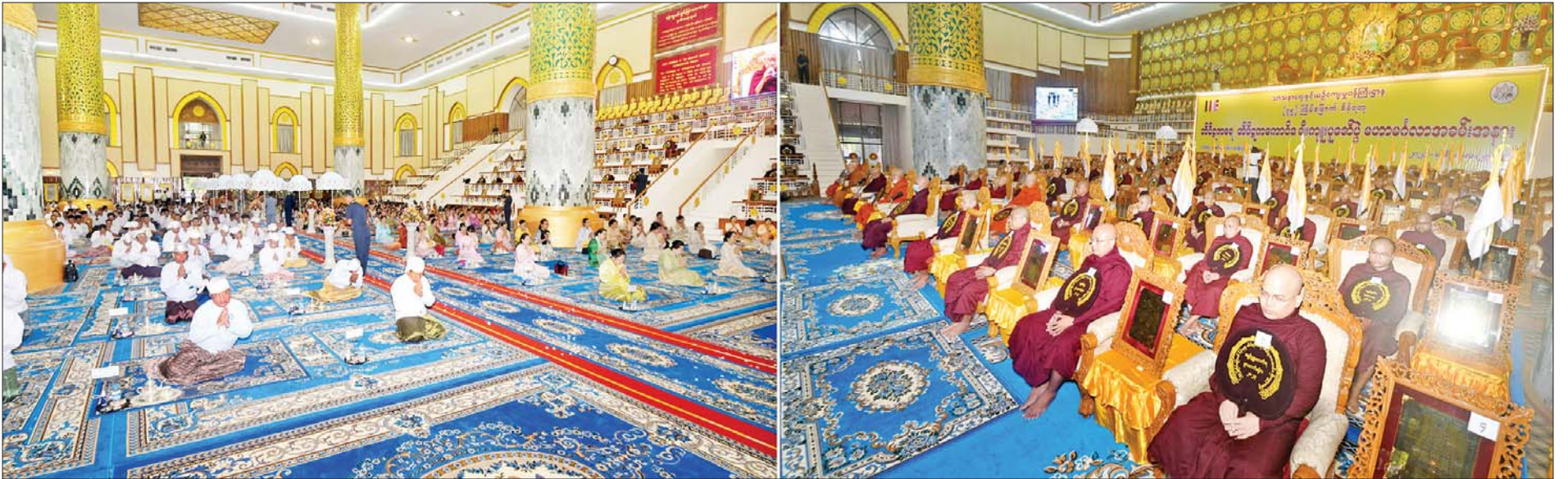
တိပိဋကဓရ တိပိဋကကောဝိဒ ရွေးချယ်ရေးစာမေးပွဲ ဩဝါဒါစရိယအဖွဲ့ ဒုတိယဥက္ကဋ္ဌ ဧရာဝတီတိုင်းဒေသကြီး ဟင်္သာတမြို့ မိုးကောင်းကျောင်းတိုက် ပဓာနနာယက အဘိဓဇမဟာရဋ္ဌဂုရု အဘိဓဇ အဂ္ဂမဟာသဒ္ဓမ္မဇောတိက ဘဒ္ဒန္တသုဓမ္မာစာရာဘိဝံသ မဟာထေရ်မြတ်ကြီးထံမှ နိုင်ငံတော်စီမံအုပ်ချုပ်ရေးကောင်စီဒုတိယဥက္ကဋ္ဌ ဒုတိယဝန်ကြီးချုပ် ဒုတိယဗိုလ်ချုပ်မှူးကြီး စိုးဝင်း အမှူးပြုသော ဧည့်ပရိသတ်များက ငါးပါးသီလ ခံယူဆောက်တည်ကြစဉ်။

ဝရှေ့ဖုံးမှ တိပိဋကကောဝိဒ ရွေးချယ်ရေးအဖွဲ့၏ ဩဝါဒါစရိယ ဆရာတော်ကြီးများ၊ တိပိဋက ဓမ္မဘဏ္ဍာဂါရိက ဆရာတော်ကြီးများ၊ တိပိဋကဓရ တိပိဋကကောဝိဒ ဆရာတော်များ၊ တိပိဋက ပုစ္ဆကဆရာတော်များ၊ ကြီးကြပ်ရေးဆရာတော်များ၊ (၇၅) ကြိမ်မြောက် စိန်ရတု တိပိဋကဓရ တိပိဋကကောဝိဒ ရွေးချယ်ရေး စာမေးပွဲတွင် အာဂုံသဘောရေးဖြေအောင်မြင်တော် မူကြသည့် သာသနာ့အာဇာနည်အရှင်သူမြတ်များ ကြွရောက်တော်မူကြပြီး နိုင်ငံတော်စီမံအုပ်ချုပ်ရေး ကောင်စီဒုတိယဥက္ကဋ္ဌ ဒုတိယဝန်ကြီးချုပ် ဒုတိယ ဗိုလ်ချုပ်မှူးကြီး စိုးဝင်းနှင့်ဇနီး ဒေါ်သန်းသန်းနွယ်၊ နိုင်ငံတော်စီမံအုပ်ချုပ်ရေးကောင်စီအဖွဲ့ဝင် ဒေါက်တာ ကျော်ထွန်း၊ ပြည်ထောင်စုဝန်ကြီးများ ဖြစ်ကြသည့် ဦးကိုကို၊ ဦးမြင့်ကြိုင်နှင့် ဒေါက်တာသက်ခိုင်ဝင်း၊ ရန်ကုန်တိုင်းဒေသကြီး ဝန်ကြီးချုပ် ဦးစိုးသိန်း၊ ကာကွယ်ရေးဦးစီးချုပ်ရုံးမှ တပ်မတော်အရာရှိကြီး များ၊ ရန်ကုန်တိုင်းစစ်ဌာနချုပ်တိုင်းမှူးနှင့် ရန်ကုန် တိုင်းဒေသကြီး အစိုးရအဖွဲ့ဝန်ကြီးများ၊ ဌာနဆိုင်ရာ တာဝန်ရှိသူများနှင့် ဖိတ်ကြားထားသူများ တက်ရောက် ကြည့်ညိကြသည်။