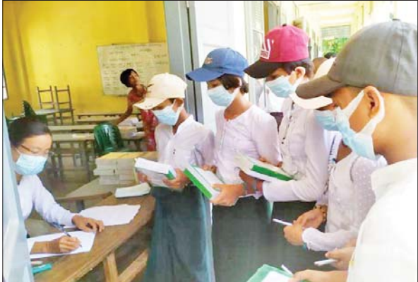
ပဲခူးတိုင်းဒေသကြီး ပေါက်ခေါင်းမြို့နယ် အခြေခံပညာကျောင်း၌ မေ ၂၃ ရက်က ကျောင်းအပ်လက်ခံစဉ်။ မြို့နယ်(ပြန်/ဆက်)