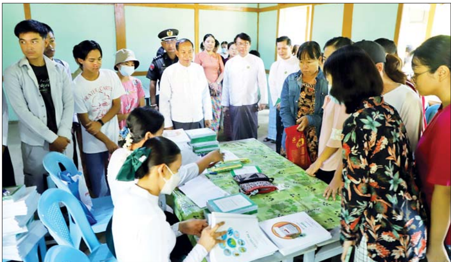
စစ်ကိုင်းတိုင်းဒေသကြီးဝန်ကြီးချုပ် ဦးမြတ်ကျော် မေ ၂၃ ရက် နံနက်ပိုင်းက မုံရွာမြို့ အမှတ်(၂) အခြေခံပညာအထက်တန်းကျောင်း၌ ကျောင်းအပ်လက်ခံနေမှုကို ကြည့်ရှုအားပေးစဉ်။ တိုင်းဒေသကြီး (ပြန်/ဆက်)