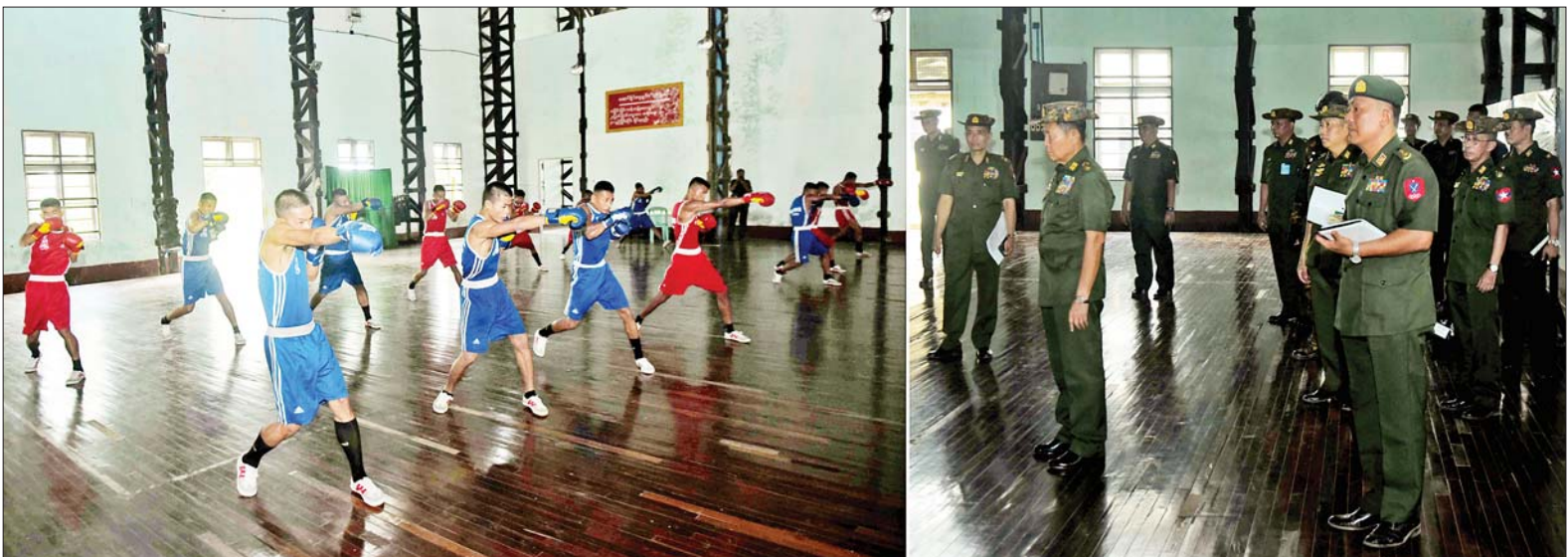
နိုင်ငံတော်စီမံအုပ်ချုပ်ရေးကောင်စီဒုတိယဥက္ကဋ္ဌ ဒုတိယတပ်မတော်ကာကွယ်ရေးဦးစီးချုပ်(ကြည်း) ဒုတိယဗိုလ်ချုပ်မှူးကြီး စိုးဝင်း ရဲမှန်တပ်မြို့ရှိ တပ်မတော်ကိုယ်ခံပညာနှင့် အားကစားသိပ္ပံ အားကစားရုံအတွင်း သင်တန်းသားများ၏ လေ့ကျင့်နေမှုကို ကြည့်ရှုအားပေးစဉ်။

ကြည့်ရှုစစ်ဆေး ဦးစွာ နိုင်ငံတော်စီမံအုပ်ချုပ်ရေးကောင်စီ ဒုတိယဥက္ကဋ္ဌ ဒုတိယတပ်မတော်ကာကွယ်ရေးဦးစီးချုပ်(ကြည်း) နှင့် အဖွဲ့ဝင်များသည် ရဲမှန်တပ်မြို့ရှိ တပ်မတော်ကိုယ်ခံပညာနှင့် အားကစားသိပ္ပံသို့ သွားရောက်ကြည့်ရှုစစ်ဆေးရာ ကျောင်းအုပ်ကြီးက ကျောင်းဌာနချုပ်ရုံးအစည်းအဝေးခန်းမတွင် တပ်တည်ဆောက်ရေးလုပ်ငန်းကြီး(၄)ရပ် အကောင်အထည်ဖော်ဆောင်ရွက်ထားရှိမှု ဆိုင်ရာများနှင့် လေ့ကျင့်ရေးနစ်အလိုက် သင်တန်းများ ဖွင့်လှစ်သင်ကြားပို့ချနေမှုဆိုင်ရာများအား ရှင်းလင်းတင်ပြရာ နိုင်ငံတော်စီမံအုပ်ချုပ်ရေးကောင်စီ ဒုတိယဥက္ကဋ္ဌ ဒုတိယတပ်မတော်ကာကွယ်ရေးဦးစီးချုပ်(ကြည်း) က လမ်းညွှန်အမှာစကားပြောကြားရာတွင် ကျောင်းရည်မှန်းချက်တာဝန်ဖြစ်သော တပ်မတော်(ကြည်း)၊ ရေ၊ လေ)မှ စစ်သည်များကို အားကစားနှင့် ကိုယ်ခံပညာ အခြေခံသင်တန်းများ၊ အဆင့်မြင့်သင်တန်းများ ဖွင့်လှစ်သင်ကြား လေ့ကျင့်ပေးခြင်းဖြင့် တပ်မတော် လက်ရွေးစင်အားကစားသမားများ ပေါ်ထွက်လာစေပြီး ထူးချွန်အားကစားသမားစစ်သည်များကို မြန်မာ့လက်ရွေးစင်အဖြစ် မွေးထုတ်၍ နိုင်ငံတော်၏ အားကစားအဆင့်အတန်းမြှင့်တင်ရာအတွက် အကျိုးပြုနိုင်ရမည်ဟူသည့် အချက်ကို အလေးထားအကောင်အထည်ဖော်ရန်လိုကြောင်း၊ ကျောင်းစတင်ဖွင့်လှစ်သည့် ၁၉၉၇-၁၉၉၈ မှ ၂၀၂၂-၂၀၂၃ အထိ ကိုယ်ခံပညာနှင့် အားကစားသင်တန်း ၃၇ မျိုး ဖွင့်လှစ်ခဲ့ရာ ထူးချွန်အားကစားသမားအဖြစ် တပ်မတော် (ကြည်း၊ ရေ၊ လေ) လက်ရွေးစင်အပါအဝင် မြန်မာ့လက်ရွေးစင် ၄၂၂ ဦးတို့ကို မွေးထုတ်နိုင်ခဲ့သည်ကို တွေ့ရှိရကြောင်း၊ ကျောင်းအုပ်ကြီးအနေဖြင့်လည်း မိမိတာဝန်ထမ်းဆောင်