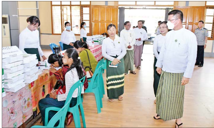
ရခိုင်ပြည်နယ် မင်းပြားမြို့နယ် အခြေခံပညာကျောင်း၌ မေ ၂၃ ရက်က ကျောင်းအပ်လက်ခံစဉ်။ သိန်းနုအောင်

ဧရာဝတီ တိုင်းဒေသကြီး ဝန်ကြီးချုပ် ဦးတင်မောင်ဝင်း မေ ၂၃ ရက်က ပုသိမ်မြို့ပေါ်ရှိ အခြေခံပညာ ကျောင်းများ၌ ကျောင်းအပ်လက်ခံမှု အခြေအနေများကို ကြည့်ရှုစစ်ဆေးစဉ်။ တိုင်းဒေသကြီး(ပြန်/ဆက်)