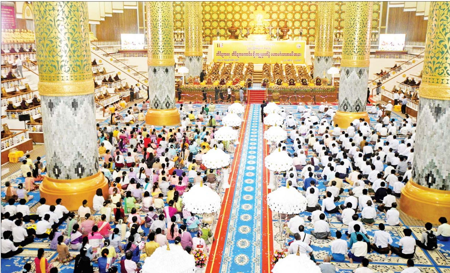
(၇၅)ကြိမ်မြောက် စိန်ရတုတိပိဋကဓရ တိပိဋကကောဝိဒ ရွေးချယ်ရေးစာမေးပွဲတွင် အောင်မြင်တော်မူကြသည့် သာသနာ့အာဇာနည် အရှင်သူမြတ် အပါး ၁၅ ပါးတို့အား ချီးကျူးပူဇော်ပွဲနှင့် အောင်လက်မှတ် ဆက်ကပ်လှူဒါန်းပွဲ မဟာမင်္ဂလာအခမ်းအနားကျင်းပစဉ်။