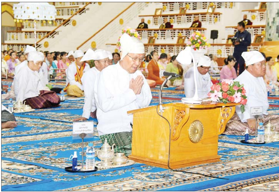
ပြည်ထောင်စုဝန်ကြီး ဦးကိုကို သာသနာရေးဆိုင်ရာများကို လျှောက်ထားစဉ်။