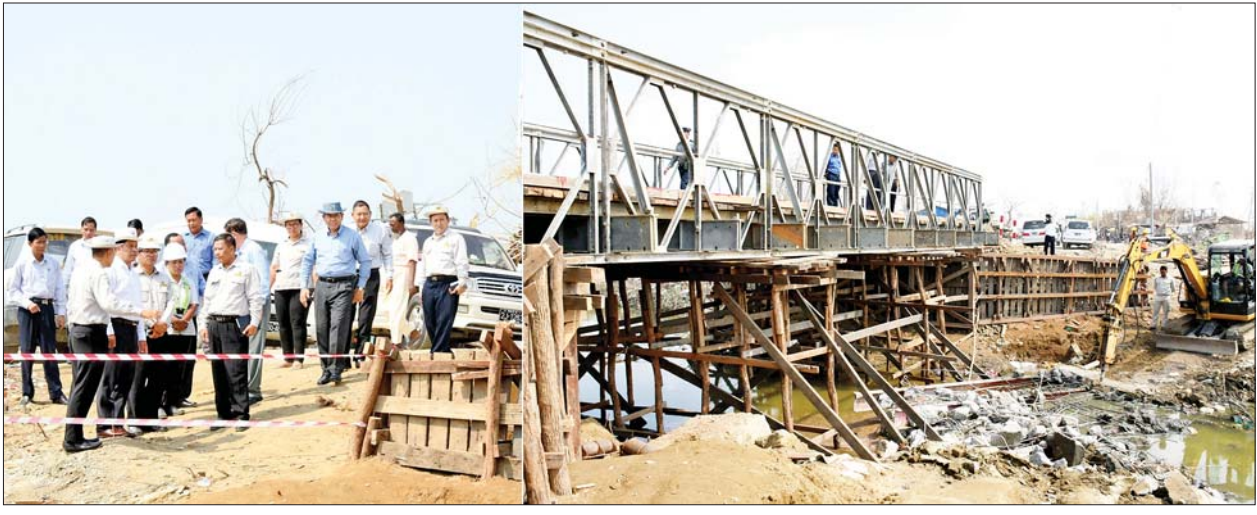
နိုင်ငံတော်စီမံအုပ်ချုပ်ရေးကောင်စီအဖွဲ့ဝင် ဒုတိယဝန်ကြီးချုပ်နှင့် ပြည်ထောင်စုဝန်ကြီး ဗိုလ်ချုပ်ကြီးတင်အောင်စန်းနှင့်အဖွဲ့ဝင်များ မုန်တိုင်းဒဏ်ကြောင့် ထိခိုက်ပျက်စီးခဲ့သည့် ဒါးပိုင်တံတားနေရာ၌ တစ်လွှာတစ်ထပ် ဘေလီတံတားတည်ဆောက်ပြီးစီးမှုကို ကြည့်ရှုစစ်ဆေးစဉ်။

စစ်တွေ မေ ၂၃ နိုင်ငံတော် စီမံအုပ်ချုပ်ရေးကောင်စီအဖွဲ့ဝင် ဒုတိယဝန်ကြီးချုပ်နှင့် ပြည်ထောင်စုဝန်ကြီး ဗိုလ်ချုပ်ကြီးတင်အောင်စန်းသည် ပြည်ထောင်စုဝန်ကြီး ဒုတိယ ဗိုလ်ချုပ်ကြီး ထွန်းထွန်းနောင်၊ ရခိုင်ပြည်နယ် ဝန်ကြီးချုပ် ဦးထိန်လင်းတို့နှင့်အတူ ယနေ့ နံနက်ပိုင်းတွင် စစ်တွေတက္ကသိုလ် သို့ ရောက်ရှိကြပြီး မုန်တိုင်းဒဏ်ကြောင့် ပျက်စီးခဲ့သည့် အပျက်အစီးများ ရှင်းလင်းပြီးစီးမှုနှင့် စာသင်ဆောင်များ အမိုးမိုးခြင်း လုပ်ငန်းဆောင်ရွက်နေမှု အခြေအနေကို ကြည့်ရှုစစ်ဆေးရာ စစ်တွေတက္ကသိုလ် ပါမောက္ခချုပ်နှင့် တာဝန်ရှိသူများက လုပ်ငန်းဆောင်ရွက်နေမှု အခြေအနေများကို ရှင်းလင်းတင်ပြကြသည်။ ဦးစားပေးပြုပြင်ကြည့်ရှုစစ်ဆေးစဉ် ဗိုလ်ချုပ်ကြီးတင်အောင်စန်းက စာသင်ကျောင်းများ မဖွင့်လှစ်မီ ဦးစားပေး ပြုပြင်