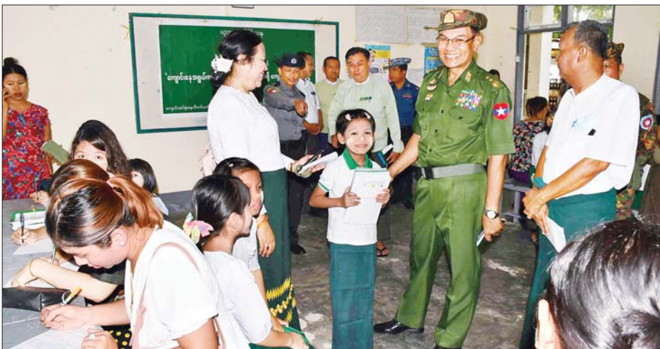
ဒုတိယဗိုလ်ချုပ်ကြီးလူအေး ရခိုင်ပြည်နယ် ကျောက်ဖြူမြို့နယ်ရှိ စာသင်ကျောင်းများသို့ သွားရောက် ကြည့်ရှုစစ်ဆေးစဉ်။

နေပြည်တော် မေ ၂၃ နိုင်ငံတော် စီမံအုပ်ချုပ်ရေး ကောင်စီအနေဖြင့် ဆိုင်ကလုန်း မုန်တိုင်း(မိခါ) တိုက်ခတ်မှုကြောင့် ထိခိုက်ပျက်စီးခဲ့သည့် ဒေသများ ကို သဘာဝဘေးအန္တရာယ်ဆိုင်ရာ စီမံခန့်ခွဲမှုဥပဒေပုဒ်မ ၁၁ အရ သဘာဝဘေးအန္တရာယ်ကျရောက် သော ဒေသများအဖြစ် ကြေညာ ချက်များထုတ်ပြန်၍ ယင်းကြေညာ ချက်များပါ ဒေသများတွင် ပြန်လည်ထူထောင်ရေးလုပ်ငန်း များ ဆောင်ရွက်နိုင်ရန် ဒေသ အလိုက် တပ်မတော်အရာရှိကြီး များကိုခန့်အပ်တာဝန်ပေးထားပြီး ဖြစ်သည်။