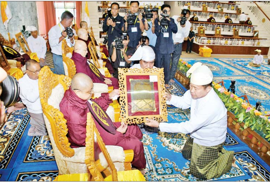
နိုင်ငံတော်စီမံအုပ်ချုပ်ရေးကောင်စီဒုတိယဥက္ကဋ္ဌ ဒုတိယဝန်ကြီးချုပ် ဒုတိယဗိုလ်ချုပ်မှူးကြီး စိုးဝင်း မူလအဘိဓမ္မိက အောင်မြင်တော်မူသည့် စစ်ကိုင်းတိုင်းဒေသကြီး စစ်ကိုင်းမြို့ မိုးမိတ်ကုန်းမြေ မင်းကွန်း တိပိဋကနိကာယကျောင်းတိုက်မှ ဆရာတော် အရှင်ဝါသဝါလင်္ကာရအား ဘွဲ့တံဆိပ်တော်နှင့် အောင်လက်မှတ်တို့ကို ဆက်ကပ်လှူဒါန်းစဉ်။

ဝရှေ့ဖုံးမှ တိပိဋကကောဝိဒ ရွေးချယ်ရေးအဖွဲ့၏ ဩဝါဒါစရိယ ဆရာတော်ကြီးများ၊ တိပိဋက ဓမ္မဘဏ္ဍာဂါရိက ဆရာတော်ကြီးများ၊ တိပိဋကဓရ တိပိဋကကောဝိဒ ဆရာတော်များ၊ တိပိဋက ပုစ္ဆကဆရာတော်များ၊ ကြီးကြပ်ရေးဆရာတော်များ၊ (၇၅) ကြိမ်မြောက် စိန်ရတု တိပိဋကဓရ တိပိဋကကောဝိဒ ရွေးချယ်ရေး စာမေးပွဲတွင် အာဂုံသဘောရေးဖြေအောင်မြင်တော် မူကြသည့် သာသနာ့အာဇာနည်အရှင်သူမြတ်များ ကြွရောက်တော်မူကြပြီး နိုင်ငံတော်စီမံအုပ်ချုပ်ရေး ကောင်စီဒုတိယဥက္ကဋ္ဌ ဒုတိယဝန်ကြီးချုပ် ဒုတိယ ဗိုလ်ချုပ်မှူးကြီး စိုးဝင်းနှင့်ဇနီး ဒေါ်သန်းသန်းနွယ်၊ နိုင်ငံတော်စီမံအုပ်ချုပ်ရေးကောင်စီအဖွဲ့ဝင် ဒေါက်တာ ကျော်ထွန်း၊ ပြည်ထောင်စုဝန်ကြီးများ ဖြစ်ကြသည့် ဦးကိုကို၊ ဦးမြင့်ကြိုင်နှင့် ဒေါက်တာသက်ခိုင်ဝင်း၊ ရန်ကုန်တိုင်းဒေသကြီး ဝန်ကြီးချုပ် ဦးစိုးသိန်း၊ ကာကွယ်ရေးဦးစီးချုပ်ရုံးမှ တပ်မတော်အရာရှိကြီး များ၊ ရန်ကုန်တိုင်းစစ်ဌာနချုပ်တိုင်းမှူးနှင့် ရန်ကုန် တိုင်းဒေသကြီး အစိုးရအဖွဲ့ဝန်ကြီးများ၊ ဌာနဆိုင်ရာ တာဝန်ရှိသူများနှင့် ဖိတ်ကြားထားသူများ တက်ရောက် ကြည့်ညိကြသည်။