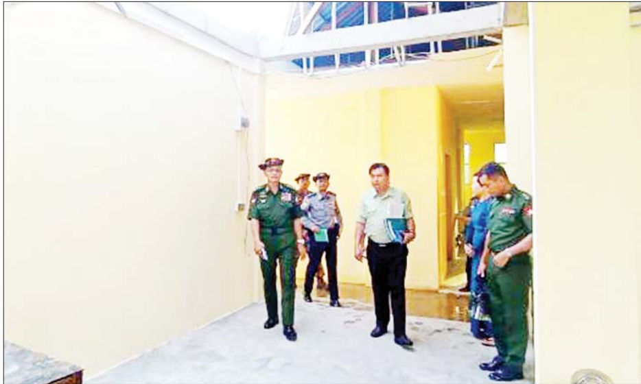
ထို့နောက် ဒုတိယဗိုလ်ချုပ်ကြီးလူအေးနှင့် တာဝန်ရှိသူများသည် ကျောက်ဖြူခရိုင်အထွေထွေအုပ်ချုပ်ရေးဦးစီးဌာနရုံး အစည်းအဝေးခန်းမသို့ ရောက်ရှိရာ ကျောက်ဖြူခရိုင်စီမံအုပ်ချုပ်ရေးအဖွဲ့ ဥက္ကဋ္ဌ ဦးရဲလင်းမောင်က သဘာဝဘေးကြိုတင်စီမံဆောင်ရွက်ထားရှိမှုနှင့် သဘာဝဘေးကျရောက်ပြီး

ဒုတိယဗိုလ်ချုပ်ကြီးလူအေး၊ ဗိုလ်မှူးချုပ် ဇော်မင်းအေးနှင့် တာဝန်ရှိသူများသည် ယနေ့ မွန်းလွဲပိုင်းတွင် ကျောက်ဖြူမြို့၌ ဆိုင်ကလုန်းမုန်တိုင်း မိုခါကြောင့် ထိခိုက်ပျက်စီးမှုများအား ပြန်လည်ထူထောင်ရေးလုပ်ငန်းများ ဆောင်ရွက်ရန်ရောက်ရှိလာပြီး သဘာဝဘေးအန္တရာယ်စီမံခန့်ခွဲမှုကော်မတီဝင်များနှင့် တွေ့ဆုံကာ မုန်တိုင်းဒဏ်ကြောင့် ပျက်စီးဆုံးရှုံးသည့်နေရာများအား လှည့်လည်ကြည့်ရှုစစ်ဆေးသည်။