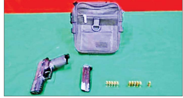
၂၀၂၃ ခုနှစ် မေ ၁၂ ရက်တွင် မြောက်ဥက္ကလာပမြို့နယ် ရွှေပေါက်မြို့သစ် အမှတ်(၁၁)ရပ်ကွက် ပုလဲရွှေဝါလမ်းသွယ်(၂) အိမ်အမှတ်(၆၂၀)၌ သိမ်းဆည်းရမိခဲ့သည့် လက်နက်/ခဲယမ်းများ မှတ်တမ်းဓာတ်ပုံ။