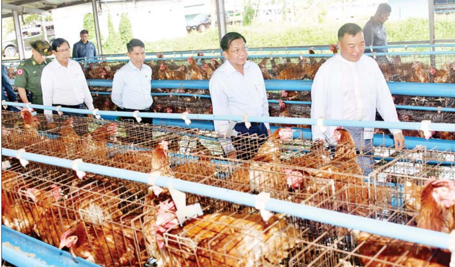
နိုင်ငံတော်စီမံအုပ်ချုပ်ရေးကောင်စီဥက္ကဋ္ဌ နိုင်ငံတော်ဝန်ကြီးချုပ် ဗိုလ်ချုပ်မှူးကြီးမင်းအောင်လှိုင် ညောင်နှစ်ပင်စိုက်ပျိုးမွေးမြူရေးဇုန်အတွင်း ပုဂ္ဂလိက ဥစားကြက်မွေးမြူရေးခြံကို ကြည့်ရှုစစ်ဆေးစဉ်။

အတွင်း ဥစားကြက်များမွေးမြူ ထားရှိမှု၊ ငါးမွေးမြူထားရှိမှုနှင့် ဒူးရင်းပင်အပါအဝင် နှစ်ရည်သီးနှံ ပင်များ စိုက်ပျိုးထားရှိမှုအခြေ အနေများကို လှည့်လည်ကြည့်ရှု ပြီး တာဝန်ရှိသူများ၏ တင်ပြချက် များအပေါ် သိရှိလိုသည်များ မေးမြန်းပြီး လိုအပ်သည်များကို အကြံပြုဆွေးနွေးပြောကြားသည်။ ထို့နောက် နိုင်ငံတော်စီမံအုပ်ချုပ် ရေးကောင်စီဥက္ကဋ္ဌ နိုင်ငံတော် ဝန်ကြီးချုပ်နှင့် အဖွဲ့ဝင်များသည် ညောင်နှစ်ပင်စိုက်ပျိုးမွေးမြူရေး အထူးဇုန်အတွင်း ခေတ်မီမွေးမြူ ရေးစနစ်ဖြင့် မွေးမြူထားရှိသည့် ပုဂ္ဂလိက ဥစားကြက်မွေးမြူရေး ခြံနှင့် တိုင်းဒေသကြီးအစိုးရအဖွဲ့ အစီအစဉ်ဖြင့် မွေးမြူထားရှိသည့် ဆိတ်မွေးမြူရေးခြံနှင့် စိုက်ပျိုးခြံ များကို သွားရောက်ကြည့်ရှုစစ်ဆေး ပြီး တာဝန်ရှိသူများ၏ တင်ပြချက် များအပေါ် လိုအပ်သည်များ လမ်းညွှန်မှာကြားပြီး ဟင်းသီး ဟင်းရွက်လက်ကားဈေး ဈေးရုံ အမှတ်(၂)၌ ဒေသခံပြည်သူများ ဟင်းသီးဟင်းရွက်ရောင်းချနေမှု များကို ကြည့်ရှုအားပေးခဲ့ကြောင်း သိရသည်။ သတင်းစဉ်