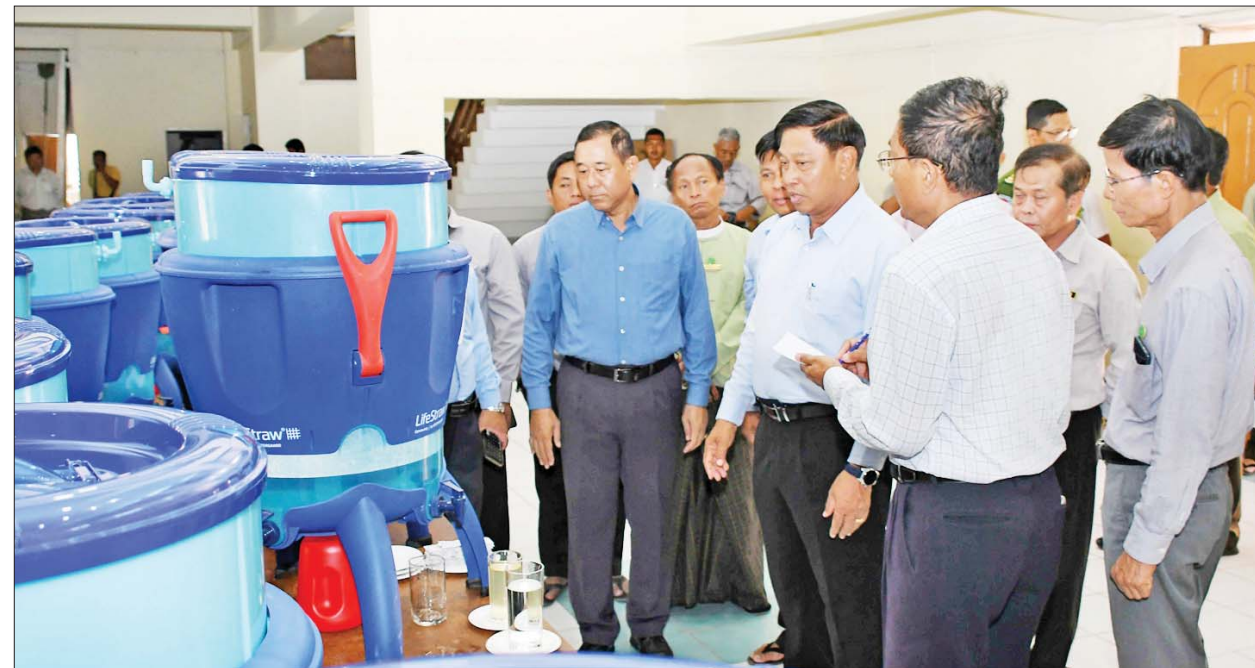
နိုင်ငံတော်စီမံအုပ်ချုပ်ရေးကောင်စီအဖွဲ့ဝင် ဒုတိယဝန်ကြီးချုပ်နှင့် ပြည်ထောင်စုဝန်ကြီး ဗိုလ်ချုပ်ကြီးတင်အောင်စန်းနှင့်အဖွဲ့ လှုပ်စစ်ဓာတ်အားသုံးစွဲရန်မလိုဘဲ ရွှေ့ပြောင်းသယ်ယူအသုံးပြုနိုင်သည့် Life Straw ရေသန့်စင်စက်များကို ကြည့်ရှုစစ်ဆေးစဉ်။

မြို့နယ်များသို့ပေးပို့ရန် သယ်ယူပို့ဆောင်နေမှုကို ကြည့်ရှုစစ်ဆေးကာ ပစ္စည်းသယ်ယူမှု ပိုမိုမြန်ဆန်ရေး လိုအပ်သောအင်အား ထပ်မံဖြည့်တင်းဆောင်ရွက်ရန် စီစဉ်မှာကြားခဲ့သည်။ ရှင်းလင်းတင်ပြထို့နောက် ဗိုလ်ချုပ်ကြီး တင်အောင်စန်းနှင့် အဖွဲ့သည် စစ်တွေမြို့ ခုတင်(၅၀၀)ဆို့ ပြည်သူ့ဆေးရုံကြီး၌ ဆောက်လုပ်ရေးဝန်ကြီးဌာန ဒုတိယဝန်ကြီးနှင့် ကျန်းမာရေးဦးစီးဌာန ညွှန်ကြားရေးမှူးချုပ်တို့က ဆေးရုံကြီးအား ပြန်လည် ပြုပြင်ပြီးစီးမှုနှင့် ဆက်လက်ဆောင်ရွက်မည့် အစီအစဉ်များကို ရှင်းလင်းတင်ပြကြရာ ထပ်မံလိုအပ်သည့်သွပ်ပြားများဖြည့်ဆည်းပေးပြီး ဆေးရုံအား အမြန်ပြုပြင်ပြီးရေးနှင့် သူနာပြုသင်တန်းကျောင်း ပျက်စီးမှုများကို လည်း အမြန်ပြုပြင်ကာ ရပ်နားထားသောသင်တန်းများ ပြန်လည် ဖွင့်လှစ်နိုင်ရေး ဆောင်ရွက်ရန် မှာကြားသည်။