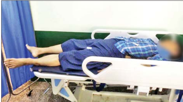
၂၀၂၃ ခုနှစ် ဧပြီ ၂၂ ရက်တွင် သယံဇာတကျွန်းမြို့နယ် (၁၆/၂) ရပ်ကွက် ဝေဇယန္တာလမ်းပေါ်၌ လုပ်ကြံသတ်ဖြတ်ခံခဲ့ရသည့် ပြည်ထောင်စုရွေးကောက်ပွဲကော်မရှင် ဒုတိယညွှန်ကြားရေးမှူးချုပ် ဦးစိုင်းကျော်သူ (သေဆုံး)၏ မှတ်တမ်းဓာတ်ပုံ။