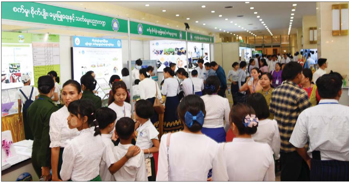
မြန်မာနိုင်ငံလုံးဆိုင်ရာ ပညာရေးညီလာခံ၌ ခင်းကျင်းပြသထားသည့် ပြခန်းများတွင် လာရောက်လေ့လာကြသူများဖြင့် စည်ကားလျက်ရှိသည်ကို တွေ့ရစဉ်။

ညီလာခံဆိုင်ရာ သတင်းအချက် အလက်ပြခန်း၊ စက်မှု၊ စိုက်ပျိုး၊ မွေးမြူရေး နှင့် သက်မွေးပညာကဏ္ဍပြခန်း၊ ပို့ဆောင် ရေးနှင့် ဆက်သွယ်ရေးဝန်ကြီးဌာနပြခန်း၊