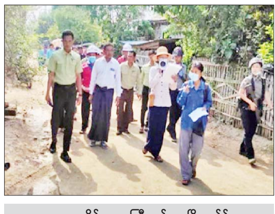
မကွေးတိုင်းဒေသကြီး မင်းဘူးမြို့နယ်၌ ကျန်းမာရေးပညာပေးနေစဉ်။