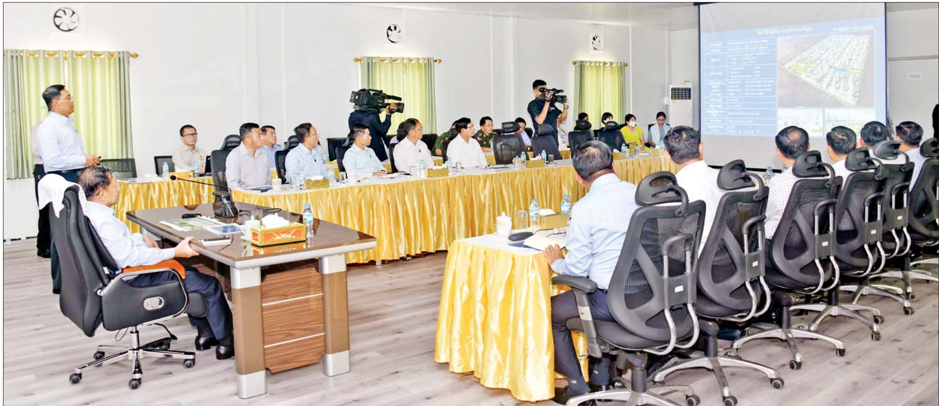
နိုင်ငံတော်စီမံအုပ်ချုပ်ရေးကောင်စီဥက္ကဋ္ဌ နိုင်ငံတော်ဝန်ကြီးချုပ် ဗိုလ်ချုပ်မှူးကြီး မင်းအောင်လှိုင်အား Korea- Myanmar Industrial Complex(KMIC) စီမံကိန်းလုပ်ငန်း အကောင်အထည်ဖော်ဆောင်ရွက်နေမှုအခြေအနေများကို ပြည်ထောင်စုဝန်ကြီး ဦးမျိုးသန့်က ရှင်းလင်းတင်ပြစဉ်။