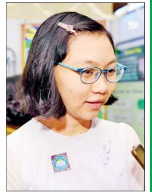
မဖြူဖြူစိုး