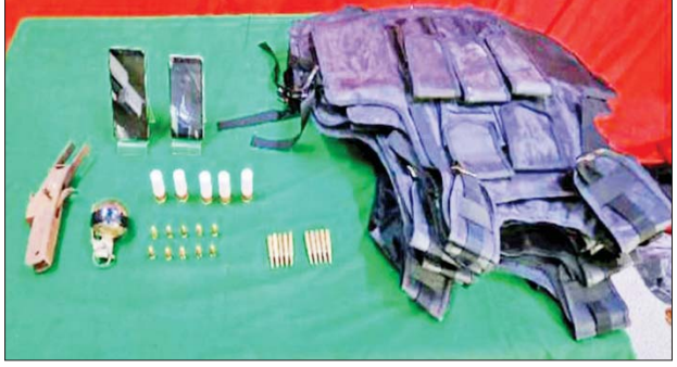
၂၀၂၃ ခုနှစ် မေ ၁၂ ရက်တွင် မြောက်ဥက္ကလာပမြို့နယ် အမှတ်(၁)ရပ်ကွက် သုမိတ္တာ(၁၀)လမ်း အိမ်အမှတ်(၄၀၇)၌ သိမ်းဆည်းရမိခဲ့သည့် လက်နက်/ခဲယမ်းနှင့် ဆက်စပ်ပစ္စည်းများ မှတ်တမ်းဓာတ်ပုံ။