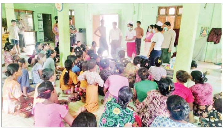
ရခိုင်ပြည်နယ် ပုဏ္ဏားကျွန်းမြို့နယ်၌ ကျန်းမာရေးစောင့်ရှောက်မှုပေးနေစဉ်။