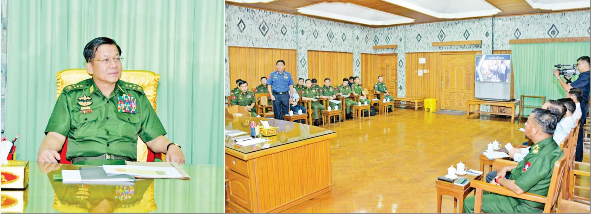
နိုင်ငံတော်စီမံအုပ်ချုပ်ရေးကောင်စီဥက္ကဋ္ဌ နိုင်ငံတော်ဝန်ကြီးချုပ် ဗိုလ်ချုပ်မှူးကြီး မင်းအောင်လှိုင် ဦးဆောင်၍ သဘာဝဘေးဒဏ်သင့်ဒေသများ၌ ကူညီကယ်ဆယ်ရေးနှင့် ပြန်လည်ထူထောင်ရေးလုပ်ငန်းများ ဆောင်ရွက်နိုင်ရေး ညှိနှိုင်းအစည်းအဝေး ကျင်းပစဉ်။