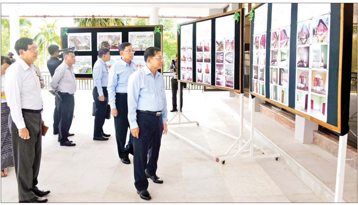
နိုင်ငံတော်စီမံအုပ်ချုပ်ရေးကောင်စီဥက္ကဋ္ဌ နိုင်ငံတော်ဝန်ကြီးချုပ် ဗိုလ်ချုပ်မှူးကြီး မင်းအောင်လှိုင်နှင့် အဖွဲ့ဝင်များ အမျိုးသားညီလာခံကျင်းပခဲ့သည့် ပြည်ထောင်စုခန်းမကြီးနှင့် အနော်ရထာရိပ်သာတို့အား ပြန်လည်ပြုပြင် ထိန်းသိမ်းဆောင်ရွက်ခဲ့မှု မှတ်တမ်းဓာတ်ပုံများကို လှည့်လည်ကြည့်ရှုစဉ်။

နေပြည်တော် မေ ၂၀ နိုင်ငံတော် စီမံအုပ်ချုပ်ရေးကောင်စီဥက္ကဋ္ဌ နိုင်ငံတော်ဝန်ကြီးချုပ် ဗိုလ်ချုပ်မှူးကြီး မင်းအောင်လှိုင်သည် ခရီးစဉ်တွင် လိုက်ပါလာသည့် အဖွဲ့ဝင်များ၊ ရန်ကုန်တိုင်းဒေသကြီး ဝန်ကြီးချုပ် ဦးစိုးသိန်း၊ ရန်ကုန်တိုင်းစစ်ဌာနချုပ်တိုင်းမှူးနှင့် တာဝန်ရှိသူများလိုက်ပါ၍ ယနေ့မွန်းလွဲပိုင်းတွင် ရန်ကုန်တိုင်းဒေသကြီးလှည်းကူးမြို့နယ် ညောင်နှစ်ပင်ကျေးရွာအနီးရှိ Korea- Myanmar Industrial Complex(KMIC) စီမံကိန်းဆောင်ရွက်ရန် လျာထားမှုအခြေအနေများကို သွားရောက်ကြည့်ရှုစစ်ဆေးသည်။