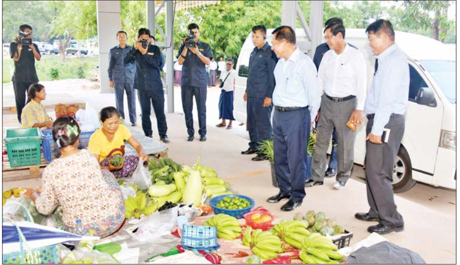
နိုင်ငံတော်စီမံအုပ်ချုပ်ရေးကောင်စီဥက္ကဋ္ဌ နိုင်ငံတော်ဝန်ကြီးချုပ် ဗိုလ်ချုပ်မှူးကြီးမင်းအောင်လှိုင် ဈေးရုံအမှတ်(၂)၌ ဒေသခံပြည်သူများ ဟင်းသီးဟင်းရွက်ရောင်းချနေမှုကို ကြည့်ရှုအားပေးစဉ်။

နိုင်ငံတော် စီမံအုပ်ချုပ်ရေး ကောင်စီဥက္ကဋ္ဌ နိုင်ငံတော် ဝန်ကြီးချုပ်က ဇုန်အတွင်း စိုက်ပျိုးမွေးမြူရေး ဆောင်ရွက် ရန်အတွက် ခွင့်ပြုပေးထားသည့် မြေများကို ပြည့်ဝစွာစိုက်ပျိုး မွေးမြူရန်နှင့် စိုက်ပျိုးမွေးမြူ ရေးနှင့် မသက်ဆိုင်သည့် မြေ အသုံးချမှုများမရှိစေရေး တာဝန် ရှိသူများက စနစ်တကျ ကြပ်မတ် ဆောင်ရွက်ရန် လိုကြောင်း၊ ပုဂ္ဂလိက စီးပွားရေးလုပ်ကိုင်သူ များအနေဖြင့် နိုင်ငံတော်မှ ခွင့်ပြု ပေးထားသည့် စိုက်ပျိုးမွေးမြူ ရေးမြေနေရာများပေါ်တွင် အမှန် တကယ် စိုက်ပျိုးမွေးမြူမှုများ ဆောင်ရွက်စေရေး စည်းကမ်းနှင့် အညီ ကြပ်မတ်ဆောင်ရွက်ရန် လိုကြောင်း၊ စိုက်ပျိုးရေးမြေများ ကို အကျိုးရှိရှိ အသုံးချစေရမည် ဖြစ်ကြောင်း၊ စိုက်ပျိုးရေးလုပ်ငန်း များကို ဆောင်ရွက်ရာတွင် မိရိုး ဖလာစိုက်ပျိုးခြင်းထက် ခေတ်မီ စိုက်ပျိုးရေးစနစ်များကို အသုံးပြု ကျစ်ကျစ်လျစ်လျစ်ဖြင့် ပြည့်ဝစွာ စိုက်ပျိုး ထုတ်လုပ်နိုင်ရန်လို ကြောင်း၊ ထိုသို့ဆောင်ရွက်ရာတွင် လည်း နိုင်ငံတကာ စံချိန်စံညွှန်း