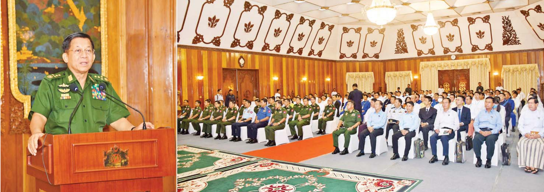
နိုင်ငံတော်စီမံအုပ်ချုပ်ရေးကောင်စီဥက္ကဋ္ဌ နိုင်ငံတော်ဝန်ကြီးချုပ် ဗိုလ်ချုပ်မှူးကြီးမင်းအောင်လှိုင် သဘာဝဘေးဒဏ်သင့်ဒေသများ၌ ကူညီကယ်ဆယ်ရေးနှင့် ပြန်လည်ထူထောင်ရေးလုပ်ငန်းများ ဆောင်ရွက်ရာတွင် အသုံးပြုနိုင်ရေး စေတနာရှင်၊ အလှူရှင်များက အလှူငွေများပေးအပ်လှူဒါန်းပွဲတွင် အမှာစကားပြောကြားစဉ်။