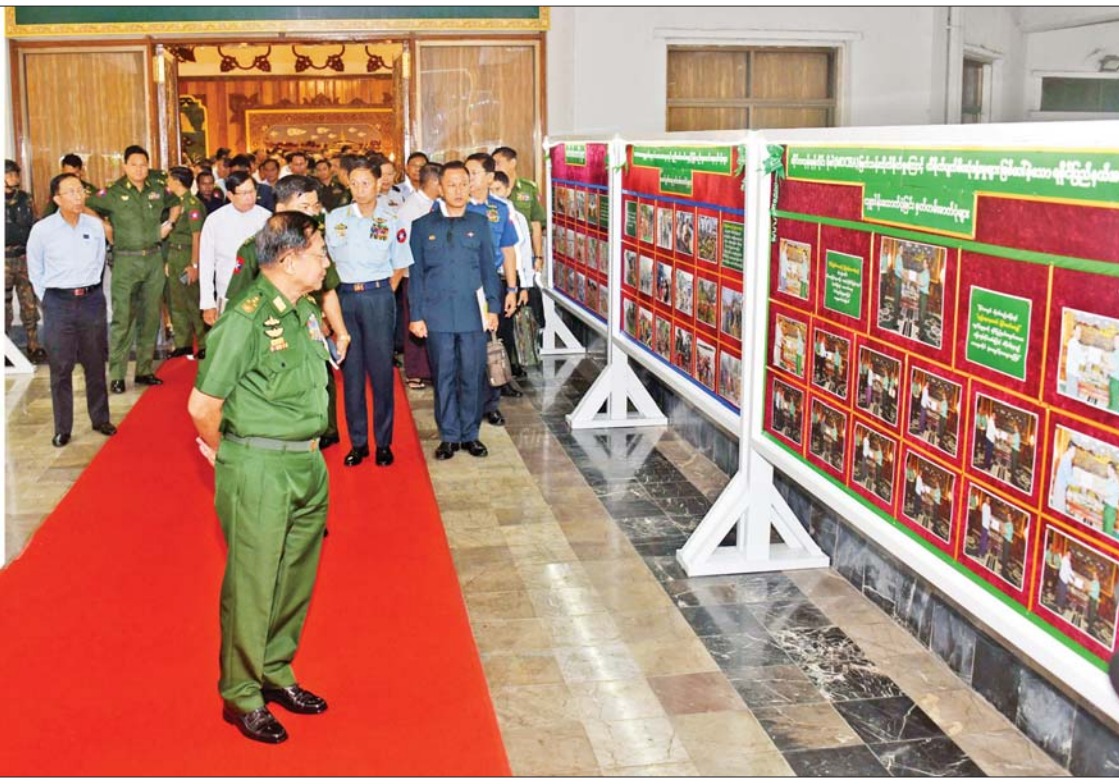
နိုင်ငံတော်စီမံအုပ်ချုပ်ရေးကောင်စီဥက္ကဋ္ဌ နိုင်ငံတော်ဝန်ကြီးချုပ် ဗိုလ်ချုပ်မှူးကြီးမင်းအောင်လှိုင် မှတ်တမ်းဓာတ်ပုံများကို ကြည့်ရှုစဉ်။

ယနေ့ အလှူရှင်များ လာရောက် လှူဒါန်းသည့် အလှူငွေများ၊ ပစ္စည်း များဖြင့် ဆောင်ရွက်ရမည်ဖြစ်ကြောင်း၊ မေ ၁၅ ရက် မိမိတို့ရခိုင်ပြည်နယ် စစ်တွေမြို့သို့သွားရောက်စဉ် အလှူငွေ ကျပ်သိန်းပေါင်း ၇၀၀၀၀ ကို ပြည်နယ် ဝန်ကြီးချုပ်ထံ တစ်ပါတည်းလွှဲပြောင်း ပေးခဲ့ကြောင်း၊ သဘာဝဘေးဒဏ်သင့် ပြည်သူများ ထပ်မံထိခိုက်သေဆုံးမှုမရှိ စေရေး၊ စားရေရိက္ခာမပြတ်လပ်စေရေးကို ဦးစွာဆောင်ရွက်ပေးရန် မှာကြားခဲ့ ကြောင်း၊ ထို့နောက် လမ်းပန်းဆက်သွယ်မှု များ ပြန်လည်ရရှိအောင် ဦးစားပေး ဆောင်ရွက်ရန်မှာကြားခဲ့ကြောင်း၊ ပြည် လမ်းကြောင်းနှင့် မကွေးလမ်းကြောင်း တို့မှ မော်တော်ယာဉ်များနှင့် ကူညီ ထောက်ပံ့ရေးပစ္စည်းများ ပို့ဆောင်နိုင်ရေး