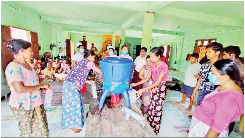
ရခိုင်ပြည်နယ် မင်းပြားမြို့နယ်၌ ရေစစ်ပုံးအသုံးပြုနေမှုကို တွေ့ရစဉ်။

ရန်ကုန်မြို့မှ ရခိုင်ပြည်နယ်ရှိမြို့နယ်များတွင် သွားရောက်တာဝန်ထမ်းဆောင်နေသည့် အရေးပေါ် တုံ့ပြန်ဆောင်ရွက်ရေးဆေးအဖွဲ့များအဖြစ် စစ်တွေ မြို့နယ်တွင် ဆေးတက္ကသိုလ်(၁)နှင့် ဆေးတက္ကသိုလ် (၂)တို့မှ အထူးကုဆရာဝန်ကြီးများ ပါဝင်သည့် အထူးကုဆေးအဖွဲ့များအပါအဝင် ဆေးအဖွဲ့ ၁၀ ဖွဲ့ ရောက်ရှိတာဝန်ထမ်းဆောင်လျက်ရှိပြီး အထူးကု ဆရာဝန်ကြီးများသည် အထူးကုဆေးအဖွဲ့များနှင့် အတူ စစ်တွေမြို့ပေါ်ရှိ လေဘေးသင့်ဘုန်းတော်ကြီး ကျောင်းများ၊ သီလရှင်ကျောင်းများ၊ ရပ်ကွက်ကျေးရွာ များသို့သွားရောက်၍ အထူးကုနယ်လှည့် ဆေးကုသ မှုများ ဆောင်ရွက်လျက်ရှိသည်။ ရခိုင်ပြည်နယ်ရှိမြို့နယ်များတွင် အရေးပေါ် တုံ့ပြန်ဆောင်ရွက်ရေး အထူးကုဆေးအဖွဲ့များနှင့် ဆေးအဖွဲ့များအနေဖြင့် မင်းပြားမြို့နယ်တွင် ဆေးအဖွဲ့ ၅ ဖွဲ့၊ ရသေ့တောင်မြို့နယ်တွင် ဆေးအဖွဲ့ ၃ ဖွဲ့၊ ပုဏ္ဏားကျွန်းမြို့နယ်တွင် ဆေးအဖွဲ့ ၃ ဖွဲ့၊ ပေါက်တောမြို့နယ်တွင် ဆေးအဖွဲ့ ၃ ဖွဲ့၊ မာန်အောင် မြို့နယ်တွင် ဆေးအဖွဲ့ ၅ ဖွဲ့၊ မြေပုံမြို့နယ်တွင် ဆေး အဖွဲ့ ၁၁ ဖွဲ့၊ ကျောက်ဖြူမြို့နယ်တွင် ဆေးအဖွဲ့ ကိုးဖွဲ့၊ ရမ်းဗြဲမြို့နယ်တွင် ဆေးအဖွဲ့သုံးဖွဲ့တို့သည် သက်ဆိုင်ရာ မြို့နယ်ကျန်းမာရေးဦးစီးဌာနမှူးများ ဦးဆောင်သည့် မြို့နယ်ပြည်သူ့ကျန်းမာရေး ဝန်ထမ်း များနှင့်အတူ ပူးပေါင်း၍ ပြည်သူလူထုအတွင်း ဝမ်းပျက်ဝမ်းလျှောရောဂါများ မဖြစ်ပွားစေရေး အတွက် သောက်ရေကန်၊ သုံးရေကန်များနှင့် ရေတွင်း ရေကန်များကို ကလိုရင်းဆေးခတ်ခြင်း၊ မုန်တိုင်း