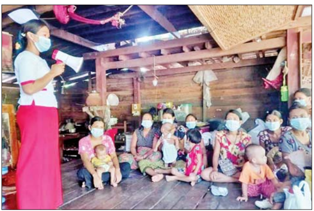
ရခိုင်ပြည်နယ် သံတွဲမြို့၌ ကျန်းမာရေးပညာပေးနေစဉ်။