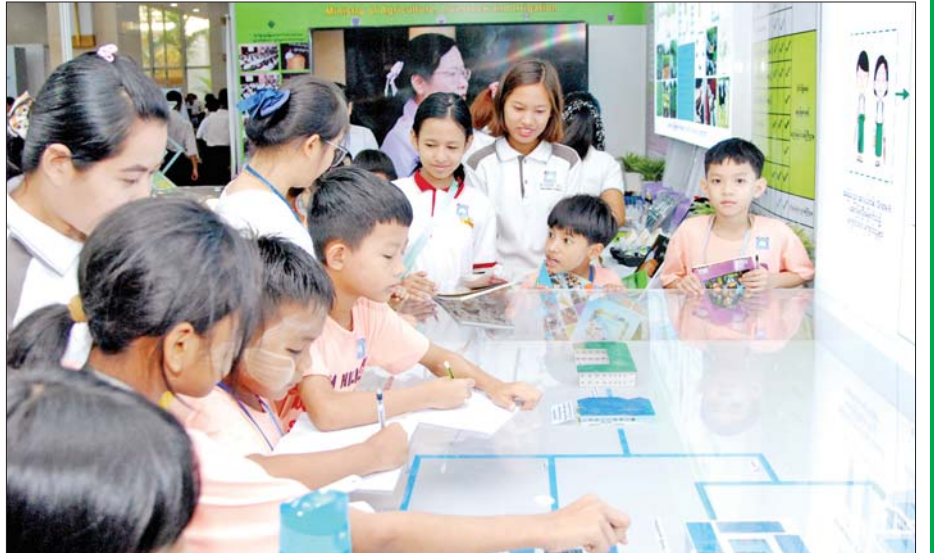
မြန်မာနိုင်ငံလုံးဆိုင်ရာ ပညာရေးညီလာခံသို့ လာရောက်လေ့လာကြသူများကို တွေ့ရစဉ်။