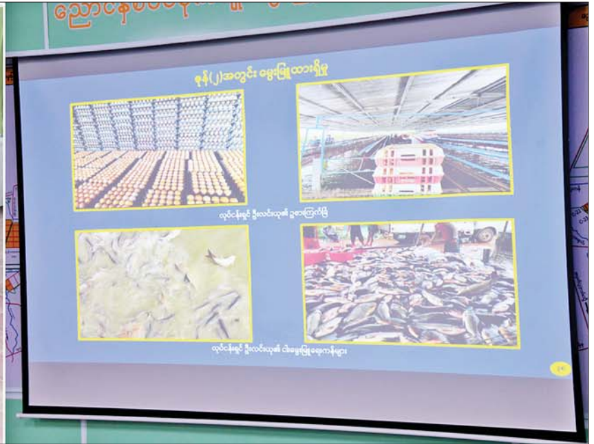
နိုင်ငံတော်စီမံအုပ်ချုပ်ရေးကောင်စီဥက္ကဋ္ဌ နိုင်ငံတော်ဝန်ကြီးချုပ် ဗိုလ်ချုပ်မှူးကြီးမင်းအောင်လှိုင်အား ညောင်နှစ်ပင်စိုက်ပျိုးမွေးမြူရေးဇုန်အတွင်း စိုက်ပျိုးမွေးမြူရေးဆောင်ရွက်ထားရှိမှုအခြေအနေများကို ရန်ကုန်တိုင်းဒေသကြီးဝန်ကြီးချုပ်က ရှင်းလင်းတင်ပြစဉ်။