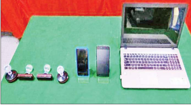
၂၀၂၃ ခုနှစ် မေ ၁၂ ရက်တွင် ဒဂုံမြို့သစ်(တောင်ပိုင်း)မြို့နယ် အမှတ်(၆၃)ရပ်ကွက် ရွှေတောင်ကြား(၅)လမ်း အိမ်အမှတ်(၉၆၄၀)၌ သိမ်းဆည်းရမိခဲ့သည့်ပစ္စည်းများ မှတ်တမ်းဓာတ်ပုံ။