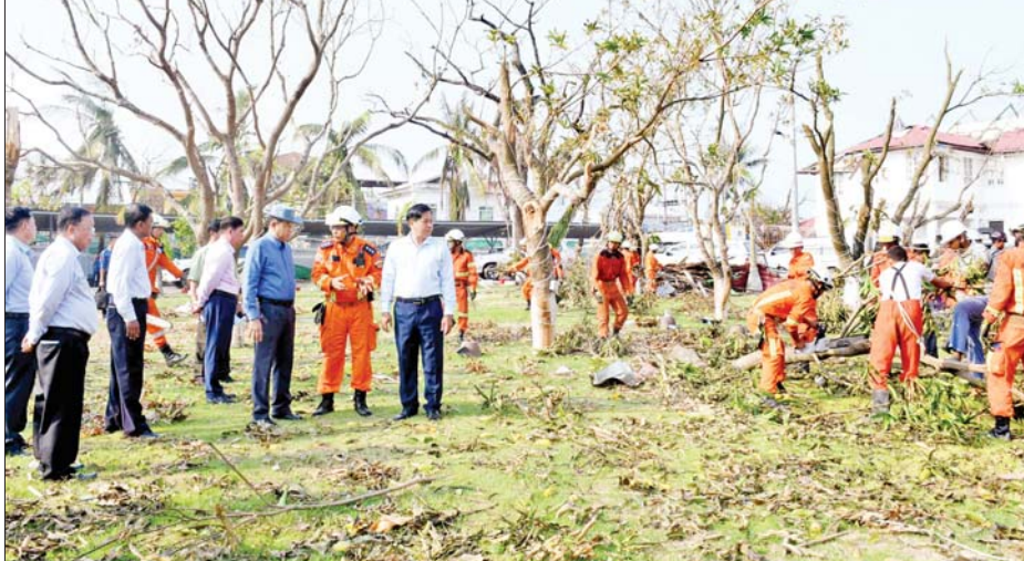
နိုင်ငံတော်စီမံအုပ်ချုပ်ရေးကောင်စီအဖွဲ့ဝင် ဒုတိယဝန်ကြီးချုပ်နှင့် ပြည်ထောင်စုဝန်ကြီး ဗိုလ်ချုပ်ကြီး တင်အောင်စန်းနှင့်အဖွဲ့ ပြည်နယ်အစိုးရအဖွဲ့ဧည့်ရိပ်သာ၌ မုန်တိုင်းကြောင့်ပြိုလဲနေသော သစ်ပင် သစ်ကိုင်းများ ရှင်းလင်းနေမှုကို ကြည့်ရှုစစ်ဆေးစဉ်။