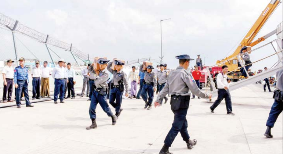
နိုင်ငံတော်စီမံအုပ်ချုပ်ရေးကောင်စီအဖွဲ့ဝင် ဒုတိယဝန်ကြီးချုပ်နှင့် ပြည်ထောင်စုဝန်ကြီး ဗိုလ်ချုပ်ကြီး တင်အောင်စန်းနှင့်အဖွဲ့ စစ်ရေယာဉ်(မုတ္တမ)ပေါ်မှ ထောက်ပံ့ရေးပစ္စည်းများအား သက်ဆိုင်ရာမြို့နယ်များသို့ ပေးပို့ရန် သယ်ယူပို့ဆောင်နေမှုကို ကြည့်ရှုစစ်ဆေးစဉ်။