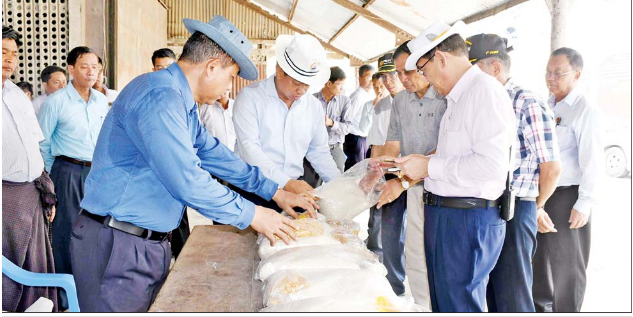
နိုင်ငံတော်စီမံအုပ်ချုပ်ရေးကောင်စီအဖွဲ့ဝင် ဒုတိယဝန်ကြီးချုပ်နှင့် ပြည်ထောင်စုဝန်ကြီး ဗိုလ်ချုပ်ကြီးတင်အောင်စန်းနှင့်အဖွဲ့ ဆန်၊ ဆီနှင့် ရိက္ခာထုပ်များ သိုလှောင်ထားရှိမှုကို ကြည့်ရှုစစ်ဆေးစဉ်။

ပြီးလိုအပ်သည်များ ဖြည့်ဆည်းဆောင်ရွက်ပေးခဲ့သည်။ ရေသန့်စင်စက်ကြည့်ရှု မွန်းလွဲပိုင်းတွင် ဗိုလ်ချုပ်ကြီး တင်အောင်စန်းနှင့် အဖွဲ့သည် အစိုးရအဖွဲ့ရုံး၌ သမဝါယမနှင့် ကျေးလက်ဖွံ့ဖြိုးရေးဝန်ကြီးဌာန ကျေးလက်ဒေသဖွံ့ဖြိုးတိုးတက်ရေးဦးစီးဌာနက မုန်တိုင်းဒဏ်ခံရသော ပြည်သူများအတွက် သောက်သုံးရေသန့်ရှင်းရေး လှုပ်စစ်ဓာတ်အားသုံးစွဲရန် မလိုဘဲ ရွှေ့ပြောင်းသယ်ယူအသုံးပြုနိုင်သည့် Life Straw ရေသန့်စင်စက်များကို ကြည့်ရှုစစ်ဆေးသည်။ ၎င်းစက်များဖြင့် စစ်တွေမြို့ ဆတ်ရိုးကျ ချောင်းအတွင်းမှ သဘာဝရေကို သန့်စင်ရာကြည့်လင်သန့်ရှင်းသည့် သောက်သုံးရေကို ရနိုင်ပြီး တစ်နာရီလျှင် ၁၅ လီတာမှ လီတာ ၂၀ အထိ သန့်စင်ပေးနိုင်ကာ တစ်ရက်လျှင် လူဦးရေ ၁၀၀ အတွက်သောက်သုံးရေ လုံလောက်စွာ ထုတ်ပေးနိုင်ကြောင်း သိရသည်။ စာမျက်နှာ ၉ သို့ *