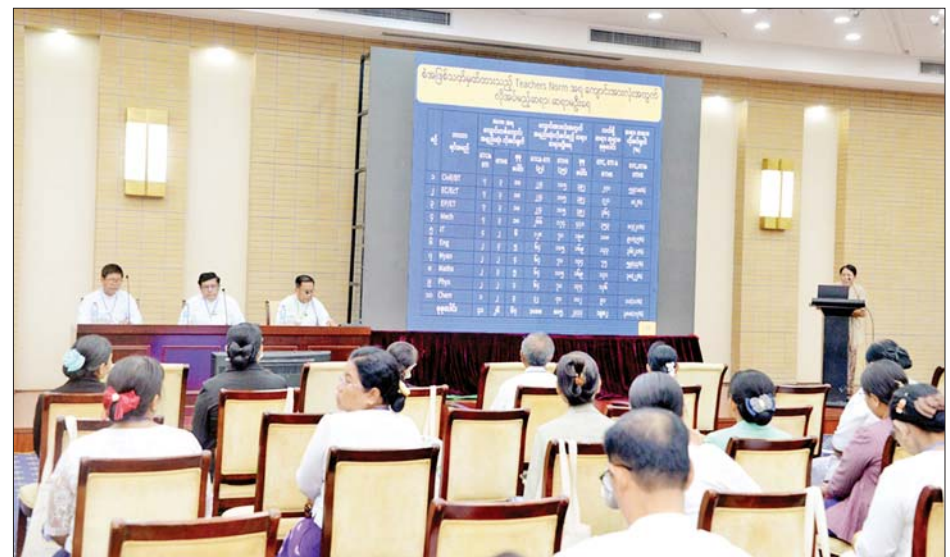
“KG+9 ပြီးမြောက်အောင်မြင်သူ လူငယ်လူရွယ်များကို စက်မှု၊ စိုက်ပျိုး၊ မွေးမြူရေးနှင့် အသက်မွေးဝမ်းကျောင်းပညာရပ်များရရှိရေးအတွက် ဆောင်ရွက်သင့်သည့်နည်းလမ်းများဖော်ထုတ်ရေး” ခေါင်းစဉ်ဖြင့် ဆွေးနွေးကြစဉ်။