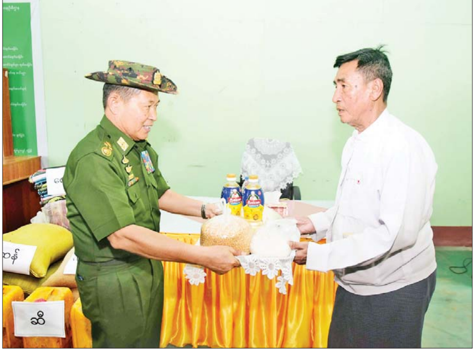
နိုင်ငံတော်စီမံအုပ်ချုပ်ရေးကောင်စီဒုတိယဥက္ကဋ္ဌ ဒုတိယတပ်မတော်ကာကွယ်ရေးဦးစီးချုပ် ကာကွယ်ရေးဦးစီးချုပ် (ကြည်း) ဒုတိယဗိုလ်ချုပ်မှူးကြီးစိုးဝင်း ရသေ့တောင်မြို့နယ်ရှိ မုန်တိုင်းသင့်ပြည်သူများနှင့် ဌာနဆိုင်ရာဝန်ထမ်းများအတွက် အခြေခံစားသောက်ကုန်ပစ္စည်းများ ထောက်ပံ့ပေးအပ်စဉ်။