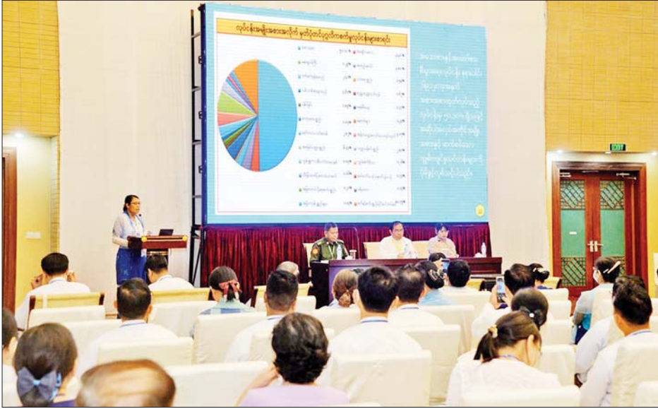
“လုပ်ငန်းခွင်လက်တွေ့ အသုံးကျမည့် နည်းပညာနှင့် သက်မွေးပညာရပ်များကို ထိရောက်စွာသင်ကြား ဤ လူ့စွမ်းအားအရင်းအမြစ်များ လေ့ကျင့်မွေးထုတ်ရေး” ခေါင်းစဉ်ဖြင့် ဆွေးနွေးကြစဉ်။