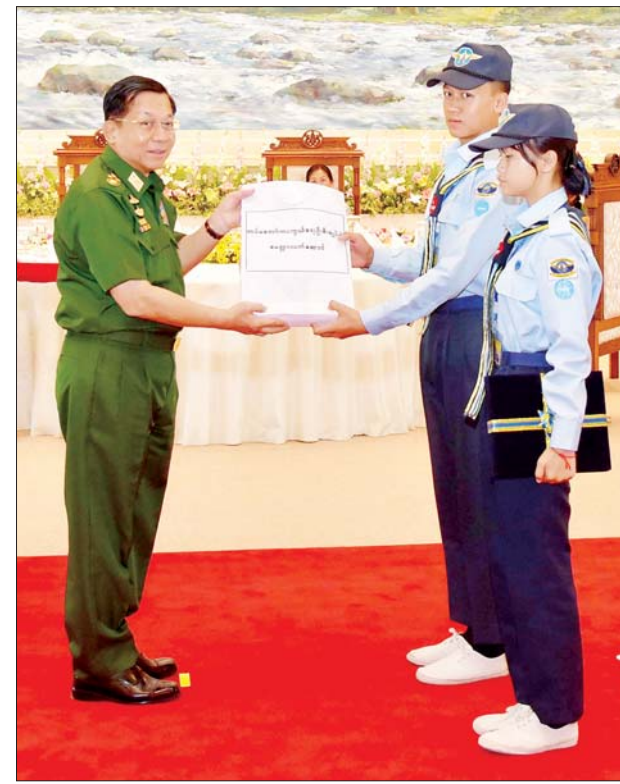
နိုင်ငံတော်စီမံအုပ်ချုပ်ရေးကောင်စီဥက္ကဋ္ဌ တပ်မတော်ကာကွယ်ရေးဦးစီးချုပ် ဗိုလ်ချုပ်မှူးကြီးမင်းအောင်လှိုင် လေကြောင်းလူငယ်မောင်မယ်များအတွက် အမှတ်တရလက်ဆောင်ပစ္စည်းများ ပေးအပ်စဉ်။

မျိုးဆက်သစ်လူငယ်များ ပေါ်ထွန်းလာစေရန်ရည်ရွယ်ပြီး ယခုလို သင်တန်းများကို တပ်မတော်အနေဖြင့် ဖွင့်လှစ်ပေးနေခြင်းပင်ဖြစ်ကြောင်း။ ပြည့်အင်အားဟူသည်ပြည်တွင်း၌သာရှိသောကြောင့် မောင်တို့မယ်တို့သည်လည်း အနာဂတ်ကြောင်း၊ ကျန်းမာသန်စွမ်းဖျတ်လတ်မှုများနှင့် ပြည့်စုံနေသည့် လူငယ်ဘဝတွင် မိမိတို့ဝါသနာပါကြသည့် ပညာရပ်အသီးသီးကို လေ့လာပြီး နွေရာသီကျောင်းပိတ်ရက်ကာလများကို အကျိုးရှိရှိအသုံးချခဲ့သည့်အတွက် မိဘဆွေမျိုးများအနေဖြင့်လည်း ဝမ်းသာဂုဏ်ယူနေကြမည်ဆိုသည်