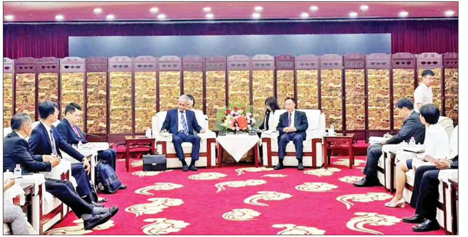
ကိုယ်စားလှယ်အဖွဲ့သည် လင်ချန်းမြို့ စီမံကိန်း ပြတိုက်နှင့် ဝမ်ယောင်ကျေးရွာရှိ ကြွေထည်မြေထည် ထုတ်လုပ်သည့် လုပ်ငန်းတို့သို့ သွားရောက်လေ့လာခဲ့ရာ တာဝန်ရှိသူများက လိုက်လံရှင်းလင်းပြသခဲ့ကြောင်း သိရသည်။ သတင်းစဉ်