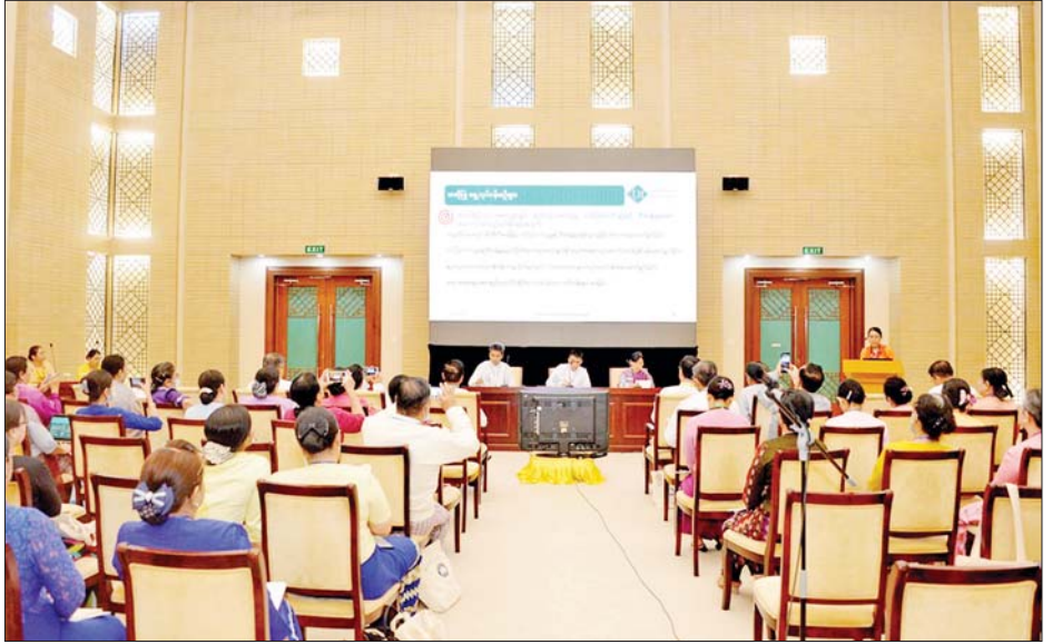
“အဆင့်မြင့်ပညာကဏ္ဍ တိုးတက်ရေးနှင့် အသိပညာရှင်၊ အတတ်ပညာရှင်များ မွေးထုတ်ရေး” ခေါင်းစဉ်ဖြင့် ဆွေးနွေးကြစဉ်။