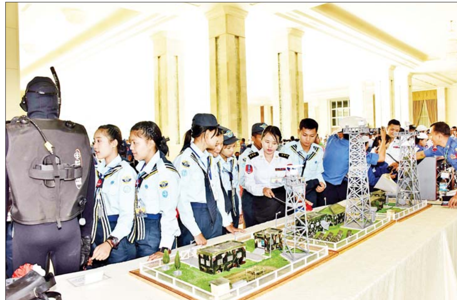
ရေကြောင်းနှင့် လေကြောင်း လူငယ်မောင်မယ်များ နေပြည်တော် ဇေယျာသီရိဗိမာန်အတွင်း ခင်းကျင်းပြသထားသော ပြခန်းများကို ကြည့်ရှုလေ့လာကြစဉ်။