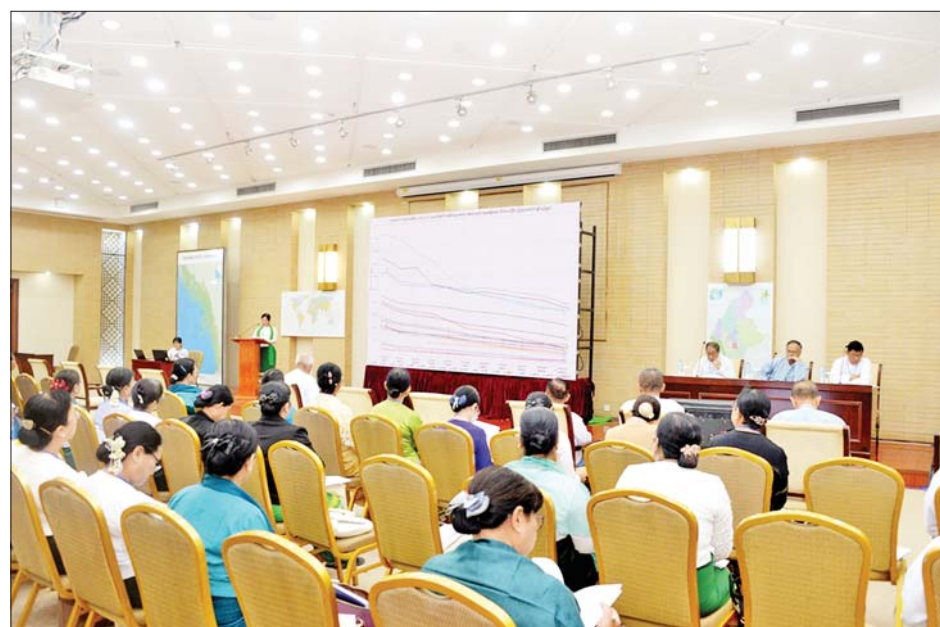
“KG+9 ပြီးမြောက်ရေးကို အမျိုးသားရေးကိစ္စတစ်ရပ်အဖြစ် ဆောင်ရွက်ရေး” ခေါင်းစဉ်ဖြင့် ဆွေးနွေးကြစဉ်။