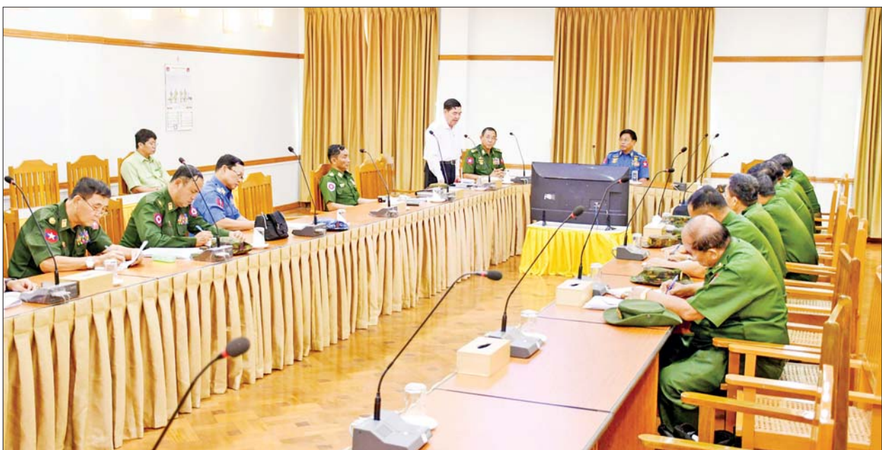
မှာကြားသည်။

တွေ့ဆုံပွဲတွင် ဗိုလ်ချုပ်ကြီး တင်အောင်စန်းက တပ်မတော်အရာရှိကြီးများအနေဖြင့် တာဝန်ကျရာမြို့နယ်များသို့ ရောက်ရှိပါက မုန်တိုင်းဒဏ်ကြောင့် ပျက်စီးမှုများ ဦးစားပေးရှင်းလင်းပြီး လျှပ်စစ်မီးရရှိရေး၊ ဆက်သွယ်မှုကောင်းမွန်ရေး၊ သောက်ရေသန့်ရရှိရေး၊ အခြေခံပညာကျောင်းများကို ကျောင်းဖွင့်ချိန်အထိ ပြုပြင်ပေးနိုင်ရေး၊ ဆေးရုံများ၊ ဘုန်းကြီးကျောင်းများကို ဦးစားပေးပြုပြင်နိုင်ရေး၊ နိုင်ငံတော်မှ ပေးပို့နေသည့် ရိက္ခာ၊ ဆေးဝါးနှင့် ဆေးပစ္စည်းများ၊ ဆောက်လုပ်ရေးပစ္စည်းများကို မုန်တိုင်းဒဏ်ခံခဲ့ရသော ပြည်သူများထံသို့ စနစ်တကျနှင့် မြန်မြန်ဆန်ဆန် ဖြန့်ဝေထောက်ပံ့ရေး၊ စာရင်းဇယားများ မှန်ကန်မှုရှိစေရေး ကြီးကြပ်ဆောင်ရွက်ပေးရန်နှင့် အခြားအရေးတကြီး ဆောင်ရွက်ပေးရန်များရှိပါကလည်း အချိန်နှင့်တစ်ပြေးညီ တင်ပြကြရန် မှာကြားသည်။