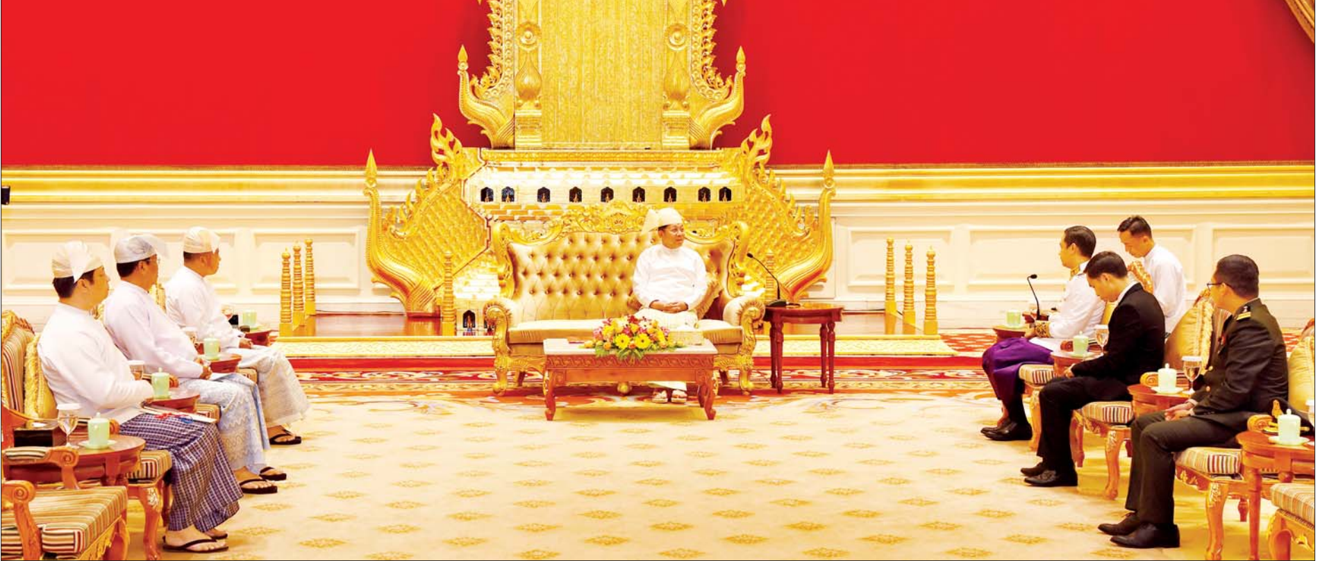
နိုင်ငံတော်စီမံအုပ်ချုပ်ရေးကောင်စီဥက္ကဋ္ဌ နိုင်ငံတော်ဝန်ကြီးချုပ် ဗိုလ်ချုပ်မှူးကြီးမင်းအောင်လှိုင် မြန်မာနိုင်ငံဆိုင်ရာ ကမ္ဘောဒီးယားနိုင်ငံသံအမတ်ကြီး H.E. Mr. CHUM Angvichet အား လက်ခံတွေ့ဆုံစဉ်။