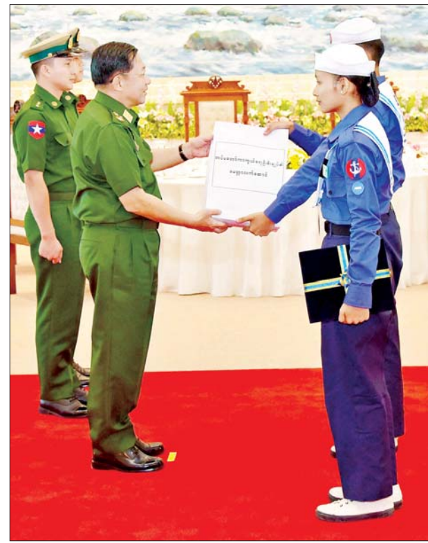
နိုင်ငံတော်စီမံအုပ်ချုပ်ရေးကောင်စီဥက္ကဋ္ဌ တပ်မတော်ကာကွယ်ရေးဦးစီးချုပ် ဗိုလ်ချုပ်မှူးကြီးမင်းအောင်လှိုင် ရေကြောင်းလူငယ်မောင်မယ်များအတွက် အမှတ်တရလက်ဆောင်ပစ္စည်းများ ပေးအပ်စဉ်။

ဦးစီးချုပ်၏ဇနီး ဒေါ်ကြူကြူလှ၊ နိုင်ငံတော်စီမံအုပ်ချုပ်ရေးကောင်စီ ဒုတိယဥက္ကဋ္ဌ ဒုတိယဝန်ကြီးချုပ် ဒုတိယဗိုလ်ချုပ်မှူးကြီးစိုးဝင်းနှင့် ဇနီး ဒေါ်သန်းသန်းနွယ်၊ ညှိနှိုင်းကွပ်ကဲရေးမှူး (ကြည်း၊ ရေ လေ) ဗိုလ်ချုပ်ကြီး မောင်မောင်အေး၊ ကာကွယ်ရေးဦးစီးချုပ် (ရေ) ဗိုလ်ချုပ်ကြီးမိုးအောင်နှင့် ဇနီး၊ ကာကွယ်ရေးဦးစီးချုပ် (လေ) ဗိုလ်ချုပ်ကြီးထွန်းအောင်နှင့် ဇနီး၊ ကာကွယ်ရေး ဦးစီးချုပ်ရုံးမှ တပ်မတော် အရာရှိကြီးများနှင့် ဇနီးများ၊ ပြည်ထောင်စုအဆင့် ပုဂ္ဂိုလ်များနှင့် ဇနီးများ၊ ရေကြောင်းလူငယ်၊ လေကြောင်း လူငယ်မောင်မယ်များ၊ အုပ်ချုပ်သူနည်းပြများနှင့် ဖိတ်ကြားထားသည့် ဧည့်သည်တော်ကြီးများ တက်ရောက်ကြသည်။ ရေကြောင်းပညာနှင့် လေကြောင်းပညာ ကျွမ်းကျင်သည့် အနာဂတ်မျိုးဆက်သစ် လူငယ်များ ပေါ်ထွန်းလာစေရန် ရည်ရွယ် ဦးစွာ နိုင်ငံတော်စီမံအုပ်ချုပ်ရေးကောင်စီဥက္ကဋ္ဌ တပ်မတော်ကာကွယ်ရေးဦးစီးချုပ်က ဂုဏ်ပြုအမှာစကား ပြောကြားရာတွင် နွေရာသီ ကျောင်းပိတ်ရက်ကာလများတွင် မိမိတို့၏ ကိုယ်ပိုင်အချိန်များကို အကျိုးမဲ့ မဖြစ်စေဘဲ အနာဂတ်ကာလတွင် မိမိ၏ နိုင်ငံတော်အတွက် အကျိုးဖြစ်ထွန်းစေမည့် ရေကြောင်းနှင့် လေကြောင်း ပညာရပ်ဆိုင်ရာ သင်တန်းအသီးသီးတက်ရောက်ခဲ့ကြသည့် မောင်မယ်များကို တွေ့ဆုံဂုဏ်ပြု အမှာစကားပြောကြားရသည့်အတွက် ဝမ်းသာပီတိဖြစ်ကြောင်းကိုဦးစွာပြောကြားလိုကြောင်း၊ ကျောင်းသားကျောင်းသူ မျိုးဆက်သစ်လူငယ်မောင်မယ်များကို ရေကြောင်းပညာနှင့် လေကြောင်းပညာ ကျွမ်းကျင်သည့် အနာဂတ်