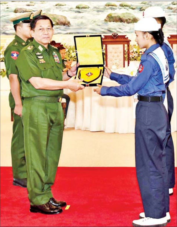
နိုင်ငံတော်စီမံအုပ်ချုပ်ရေးကောင်စီဥက္ကဋ္ဌ တပ်မတော်ကာကွယ်ရေး ဦးစီးချုပ် ဗိုလ်ချုပ်မှူးကြီးမင်းအောင်လှိုင်ထံ ရေကြောင်းလူငယ် မောင်မယ်များက ဂါရဝပြုလက်ဆောင်ပစ္စည်း ပေးအပ်စဉ်။

တိုင်းပြည်က အားကိုးအားထားပြု ရမည့် မျိုးဆက်သစ်မောင်မယ်များ ဖြစ်ကြပါစေကြောင်း ပြောကြား သည်။ ယင်းနောက် တပ်မတော် ကာကွယ်ရေး ဦးစီးချုပ်က ရေကြောင်းနှင့် လေကြောင်း လူငယ် မောင်မယ်များအတွက် အမှတ်တရ လက်ဆောင်ပစ္စည်း များ ပေးအပ်ပြီး လူငယ်မောင်မယ် များက တပ်မတော်ကာကွယ်ရေး ဦးစီးချုပ်အား ဂါရဝပြုလက်ဆောင် ပစ္စည်းများ ပြန်လည်ပေးအပ်သည်။ ၎င်းနောက် ရေကြောင်းလူငယ် သင်တန်းမှ မကေဇင်သွယ်နှင့် လေကြောင်း လူငယ်သင်တန်းမှ မနန်းမိုခမ်းတို့က ရေကြောင်း လူငယ်အခြေခံနှင့် တန်းမြင့် သင်တန်း အမှတ်စဉ်(၁/၂၀၂၃)နှင့် အခြေခံလေကြောင်း လူငယ် သင်တန်း(အကြီးတန်းအဆင့်)နှင့် (အငယ်တန်းအဆင့်) (၁/၂၀၂၃) တို့တွင် တက်ရောက်သင်ကြားခဲ့ရ သည့် ရေကြောင်း၊ လေကြောင်း ဆိုင်ရာ အတွေ့အကြုံများ၊ သင်တန်းမှရရှိခဲ့သည့် ဗဟုသုတ များနှင့် အကျိုးကျေးဇူးများကို ဦးစွာရှင်းလင်းပြောကြားကြသည်။ ထို့နောက် ယခုကဲ့သို့ အားလပ် သည့် နွေရာသီ ကျောင်းပိတ်ရက် ကာလအတွင်း အချိန်ကို အကျိုးရှိ စွာ ကုန်ဆုံးစေပြီး ဒေသန္တရ ဗဟုသုတများစွာ ရရှိနိုင်စေရေး အတွက် ရေကြောင်း၊ လေကြောင်း လူငယ်သင်တန်းများကို ဖွင့်လှစ်