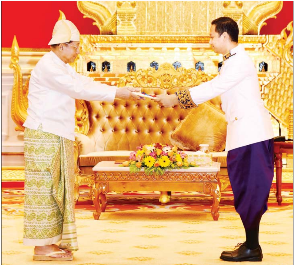
နိုင်ငံတော်စီမံအုပ်ချုပ်ရေး ကောင်စီဥက္ကဋ္ဌ နိုင်ငံတော် ဝန်ကြီးချုပ် ဗိုလ်ချုပ်မှူးကြီး မင်းအောင်လှိုင်ထံ မြန်မာနိုင်ငံ ဆိုင်ရာ ကမ္ဘောဒီးယားနိုင်ငံ သံအမတ်ကြီး H.E. Mr. CHUM Angvichet က ၎င်း၏ သံအမတ် ခန့်အပ်လွှာကို ပေးအပ်စဉ်။

* ရှေ့ပုံးမှ ထို့နောက် ကမ္ဘောဒီးယားနိုင်ငံအနေဖြင့် မြန်မာနိုင်ငံဘက်မှ ရပ်တည်နေမှုနှင့် မြန်မာနိုင်ငံ၏ တည်ငြိမ်အေးချမ်းရေးဖော်ဆောင် နေမှုအပေါ် ကမ္ဘောဒီးယားနိုင်ငံမှ ယုံကြည်မှုရှိသည့်အခြေအနေများ၊ နှစ်နိုင်ငံသံတမန် ဆက်ဆံရေး၊ ချစ်ကြည်ရင်းနှီးမှုနှင့် ပူးပေါင်းဆောင်ရွက် မှုများ တိုးမြှင့်ဆောင်ရွက်သွားမည့်ကိစ္စရပ်များ၊ မြန်မာနိုင်ငံတွင် ကိုဗစ် - ၁၉ ရောဂါ ဖြစ်ပွားချိန်၌ ကမ္ဘောဒီးယားနိုင်ငံမှ အကူအညီများ ပေးခဲ့မှုနှင့် ကိုဗစ်-၁၉ ကာကွယ်ဆေးများ ထပ်မံပေးအပ်သွားမည့် အခြေ အနေ၊ နှစ်နိုင်ငံခရီးသွားလုပ်ငန်းများ ဖွံ့ဖြိုးတိုးတက်ရေးအတွက် လေကြောင်းတိုက်ရိုက်ပျံသန်းပြေးဆွဲမှု တိုးချဲ့ရေးကိစ္စရပ်များ၊ သာသနာ ရေး၊ ပညာရေးနှင့် ကုန်သွယ်မှုကဏ္ဍများတွင် ပူးပေါင်း ဆောင်ရွက်မှုများ မြှင့်တင်ဆောင်ရွက်သွားမည့် ကိစ္စရပ်များနှင့်ပတ်သက်၍ ရင်းရင်းနှီးနှီး ဆွေးနွေးခဲ့ကြသည်။ တွေ့ဆုံပွဲအပြီးတွင် နိုင်ငံတော်စီမံအုပ်ချုပ်ရေးကောင်စီဥက္ကဋ္ဌ နိုင်ငံတော်ဝန်ကြီးချုပ်နှင့် မြန်မာနိုင်ငံဆိုင်ရာ ကမ္ဘောဒီးယားနိုင်ငံ သံအမတ်ကြီးတို့သည် မှတ်တမ်းတင်ဓာတ်ပုံရိုက်ကြသည်။ အဆိုပါ သံအမတ်ခန့်အပ်လွှာပေးအပ်ပွဲသို့ ကောင်စီတွဲဖက် အတွင်းရေးမှူး ဒုတိယဗိုလ်ချုပ်ကြီးရဲဝင်းဦး၊ နိုင်ငံခြားရေးဝန်ကြီးဌာန ပြည်ထောင်စုဝန်ကြီးဦးသန်းဆွေ၊ သံတမန်ရေးရာဦးစီးဌာန ညွှန်ကြား ရေးမှူးချုပ်ဦးဝဏ္ဏဟန်နှင့် မြန်မာနိုင်ငံဆိုင်ရာ ကမ္ဘောဒီးယားနိုင်ငံသံရုံး နှင့် စစ်သံရုံးတို့မှ တာဝန်ရှိသူများတက်ရောက်ခဲ့ကြကြောင်း သိရ သည်။ သတင်းစဉ်