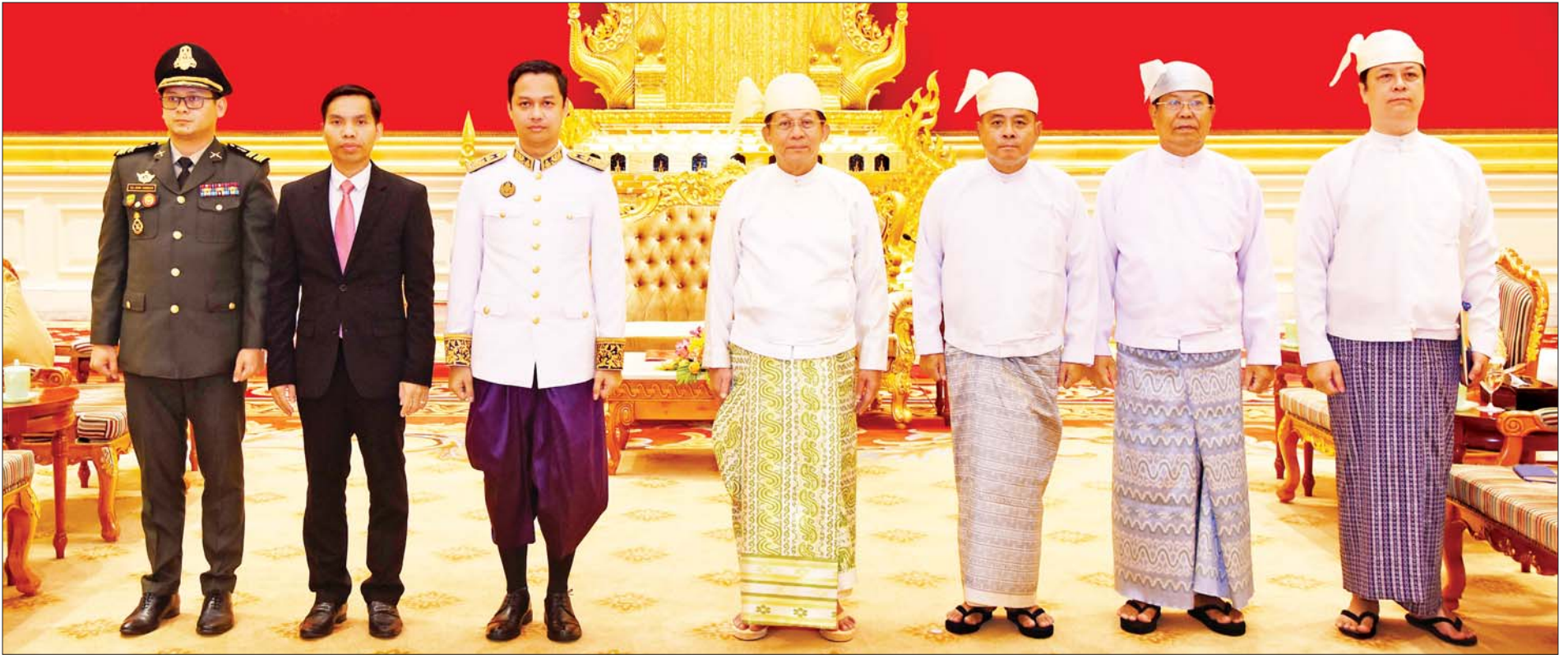
နိုင်ငံတော်စီမံအုပ်ချုပ်ရေးကောင်စီဥက္ကဋ္ဌ နိုင်ငံတော်ဝန်ကြီးချုပ် ဗိုလ်ချုပ်မှူးကြီးမင်းအောင်လှိုင်နှင့် မြန်မာနိုင်ငံဆိုင်ရာ ကမ္ဘောဒီးယားနိုင်ငံသံအမတ်ကြီး H.E. Mr. CHUM Angvichet တို့ အဖွဲ့ဝင်များနှင့်အတူ စုပေါင်းမှတ်တမ်းတင်ဓာတ်ပုံရိုက်စဉ်။

* ရှေ့ပုံးမှ ထို့နောက် ကမ္ဘောဒီးယားနိုင်ငံအနေဖြင့် မြန်မာနိုင်ငံဘက်မှ ရပ်တည်နေမှုနှင့် မြန်မာနိုင်ငံ၏ တည်ငြိမ်အေးချမ်းရေးဖော်ဆောင် နေမှုအပေါ် ကမ္ဘောဒီးယားနိုင်ငံမှ ယုံကြည်မှုရှိသည့်အခြေအနေများ၊ နှစ်နိုင်ငံသံတမန် ဆက်ဆံရေး၊ ချစ်ကြည်ရင်းနှီးမှုနှင့် ပူးပေါင်းဆောင်ရွက် မှုများ တိုးမြှင့်ဆောင်ရွက်သွားမည့်ကိစ္စရပ်များ၊ မြန်မာနိုင်ငံတွင် ကိုဗစ် - ၁၉ ရောဂါ ဖြစ်ပွားချိန်၌ ကမ္ဘောဒီးယားနိုင်ငံမှ အကူအညီများ ပေးခဲ့မှုနှင့် ကိုဗစ်-၁၉ ကာကွယ်ဆေးများ ထပ်မံပေးအပ်သွားမည့် အခြေ အနေ၊ နှစ်နိုင်ငံခရီးသွားလုပ်ငန်းများ ဖွံ့ဖြိုးတိုးတက်ရေးအတွက် လေကြောင်းတိုက်ရိုက်ပျံသန်းပြေးဆွဲမှု တိုးချဲ့ရေးကိစ္စရပ်များ၊ သာသနာ ရေး၊ ပညာရေးနှင့် ကုန်သွယ်မှုကဏ္ဍများတွင် ပူးပေါင်း ဆောင်ရွက်မှုများ မြှင့်တင်ဆောင်ရွက်သွားမည့် ကိစ္စရပ်များနှင့်ပတ်သက်၍ ရင်းရင်းနှီးနှီး ဆွေးနွေးခဲ့ကြသည်။ တွေ့ဆုံပွဲအပြီးတွင် နိုင်ငံတော်စီမံအုပ်ချုပ်ရေးကောင်စီဥက္ကဋ္ဌ နိုင်ငံတော်ဝန်ကြီးချုပ်နှင့် မြန်မာနိုင်ငံဆိုင်ရာ ကမ္ဘောဒီးယားနိုင်ငံ သံအမတ်ကြီးတို့သည် မှတ်တမ်းတင်ဓာတ်ပုံရိုက်ကြသည်။ အဆိုပါ သံအမတ်ခန့်အပ်လွှာပေးအပ်ပွဲသို့ ကောင်စီတွဲဖက် အတွင်းရေးမှူး ဒုတိယဗိုလ်ချုပ်ကြီးရဲဝင်းဦး၊ နိုင်ငံခြားရေးဝန်ကြီးဌာန ပြည်ထောင်စုဝန်ကြီးဦးသန်းဆွေ၊ သံတမန်ရေးရာဦးစီးဌာန ညွှန်ကြား ရေးမှူးချုပ်ဦးဝဏ္ဏဟန်နှင့် မြန်မာနိုင်ငံဆိုင်ရာ ကမ္ဘောဒီးယားနိုင်ငံသံရုံး နှင့် စစ်သံရုံးတို့မှ တာဝန်ရှိသူများတက်ရောက်ခဲ့ကြကြောင်း သိရ သည်။ သတင်းစဉ်