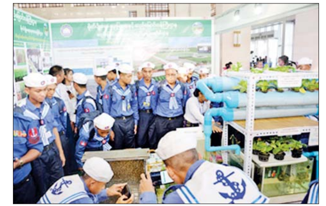
မြန်မာနိုင်ငံလုံးဆိုင်ရာ ပညာရေးညီလာခံ(၂၀၂၃)ရှိ ပညာရေးနှင့်ဆက်စပ်ဝန်ကြီးဌာနများ၏ ပညာရေးပြခန်းများသို့ ရေကြောင်းလူငယ်၊ လေကြောင်းလူငယ် သင်တန်းသား သင်တန်းသူများ လာရောက်လေ့လာကြစဉ်။