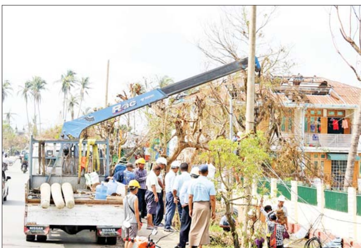
စစ်တွေမြို့၌ လျှပ်စစ်ဓာတ်တိုင်များစိုက်ထူခြင်း၊ ကြိုးများသွယ်တန်းခြင်း ပြုလုပ်နေမှုကို တွေ့ရစဉ်။

မေ ၁၄ ရက်က တိုက်ခတ်ခဲ့သည့် မုန်တိုင်းကြောင့် သဘာဝဘေးအန္တရာယ် ကျရောက်ခဲ့သည့် ရခိုင်ပြည်နယ်အတွင်း ပြန်လည်ထူထောင်ရေး လုပ်ငန်းများ ဆောင်ရွက်လျက်ရှိရာ ယနေ့နံနက်ပိုင်းတွင် စစ်တွေမြို့ လမ်းမကြီးများနှင့် မြို့ပေါ်ရပ်ကွက်များအတွင်း သွားလာဆက်သွယ်ရေးလမ်းကြောင်းများ ပုံမှန်ကောင်းမွန်ရေး၊ ပြုလဲပျက်စီးမှုများ ရှင်းလင်းရေးနှင့် ပြန်လည်ထူထောင်ရေးလုပ်ငန်းများကို တပ်မတော်၊ မြန်မာနိုင်ငံရဲတပ်ဖွဲ့၊ မီးသတ်တပ်ဖွဲ့တို့မှ တပ်ဖွဲ့ဝင်များ၊ ဌာနဆိုင်ရာ ဝန်ထမ်းများနှင့် ဒေသခံများက အင်တိုက်အားတိုက် ဆောင်ရွက်လျက်ရှိကြသည်။