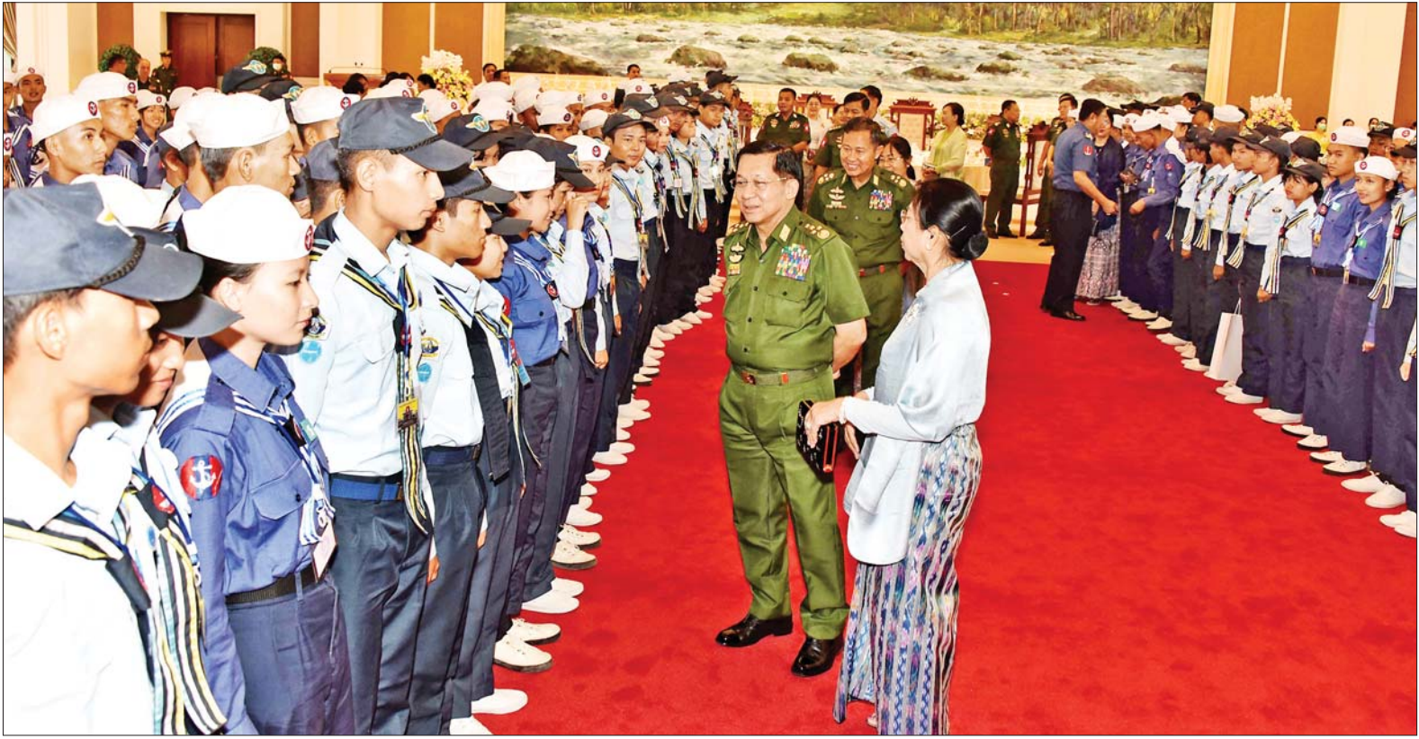
နိုင်ငံတော်စီမံအုပ်ချုပ်ရေးကောင်စီဥက္ကဋ္ဌ တပ်မတော်ကာကွယ်ရေးဦးစီးချုပ် ဗိုလ်ချုပ်မှူးကြီးမင်းအောင်လှိုင်နှင့် ဇနီး ဒေါ်ကြူကြူလှတို့ ရေကြောင်းလူငယ်အခြေခံနှင့် တန်းမြင့်သင်တန်း အမှတ်စဉ်(၁/၂၀၂၃)နှင့် အခြေခံလေကြောင်းလူငယ်သင်တန်း(အကြီးတန်းအဆင့်)နှင့် (အငယ်တန်းအဆင့်) (၁/၂၀၂၃)မှ သင်တန်းသား သင်တန်းသူများနှင့် အုပ်ချုပ်သူနည်းပြများအား ရင်းရင်းနှီးနှီး နှုတ်ဆက်စဉ်။

»» စာမျက်နှာ ၄ မှ ခက်ခဲနက်နဲမှုများရှိလေလေ ရရှိသည့်အောင်မြင်မှု အသီးအပွင့်များသည်လည်း တန်ဖိုးရှိလေလေ ဖြစ်ခြင်းကြောင့် မောင်တို့မယ်တို့အနေဖြင့် သင်တန်းကနေရရှိခဲ့သည့် အတွေ့အကြုံကောင်းများကို ဆက်လက်အသုံးပြုနိုင်ရန် တိုက်တွန်းမှာကြားလိုကြောင်း၊ ယခုလို သင်တန်းတက်ရောက်ခွင့် ရသည့်အတွက်ကြောင့် တပ်မတော်၏ နိုင်ငံတော်ကာကွယ်ရေးတာဝန် ဆောင်ရွက်မှုများကိုပါ မောင်တို့မယ်တို့ မျက်ဝါးထင်ထင် မြင်တွေ့ခဲ့ကြပြီးဖြစ်ကြောင်း၊ နိုင်ငံ၏ ရေပြင်/ဝေဟင်တန်ဖိုးကို သိနားလည်၍ ပင်လယ်ကမ်းရိုးတန်းပိုင်ဆိုင်သည့် နိုင်ငံများသည် ရေကြောင်းနှင့် လေကြောင်း ပညာရပ်များကို စဉ်ဆက်မပြတ် ခေတ်နှင့်အညီ လေ့လာဖော်ထုတ် သုတေသနပြုပြီး ကာကွယ်ရေး စွမ်းအားအတွက် သာမက အမျိုးသား အကျိုးစီးပွားအတွက် ပါ မြှင့်တင်နိုင်အောင် ယှဉ်ပြိုင် ကြိုးစားလျက်ရှိကြောင်း၊ ကာကွယ်ရေးစွမ်းအား တောင့်တင်းခိုင်မာခြင်းသည် နိုင်ငံတော်ဖွံ့ဖြိုးတိုးတက်ရေးကို တစ်ဖက်တစ်လမ်းက အထောက်အကူပြုလျက်ရှိနေခြင်းကြောင့် မောင်တို့မယ်တို့ သင်ယူခဲ့ရသည့် ပညာရပ်အသီးသီး၏