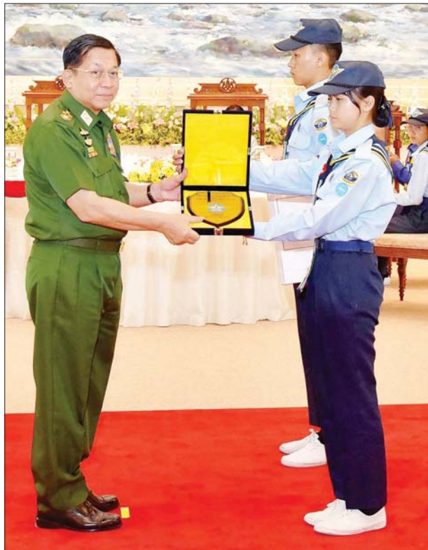
နိုင်ငံတော်စီမံအုပ်ချုပ်ရေးကောင်စီဥက္ကဋ္ဌ တပ်မတော်ကာကွယ်ရေး ဦးစီးချုပ် ဗိုလ်ချုပ်မှူးကြီးမင်းအောင်လှိုင်ထံ လေကြောင်းလူငယ် မောင်မယ်များက ဂါရဝပြုလက်ဆောင်ပစ္စည်း ပေးအပ်စဉ်။

သင်ကြားပေးကာ တိုင်းရင်းသား ညီအစ်ကိုမောင်နှမများ ချစ်ကြည် ရင်းနှီးစွာ အတူတကွ တွေ့ဆုံ၍ သင်တန်းတက်ရောက်ခွင့်ရခဲ့သည့် အတွက် နိုင်ငံတော်စီမံအုပ်ချုပ်ရေး ကောင်စီဥက္ကဋ္ဌ တပ်မတော် ကာကွယ်ရေး ဦးစီးချုပ်အား လူငယ်မောင်မယ်များ ကိုယ်စား အထူးပင် ကျေးဇူးတင်ရှိကြောင်း၊ ယခုသင်တန်းများသည် မိမိတို့