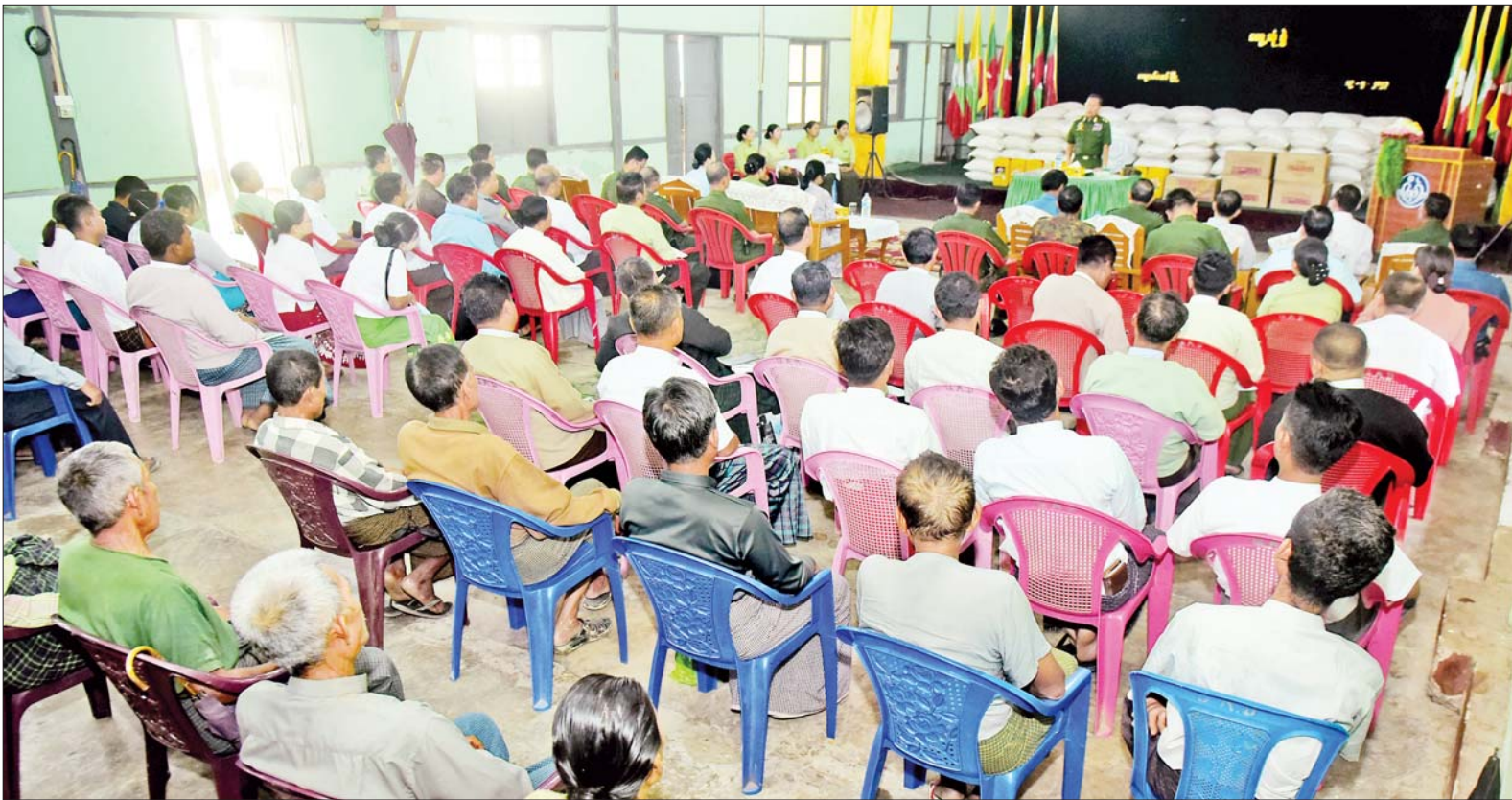
အမျိုးသားသဘာဝဘေးအန္တရာယ်ဆိုင်ရာ စီမံခန့်ခွဲမှုကော်မတီဥက္ကဋ္ဌ နိုင်ငံတော်စီမံအုပ်ချုပ်ရေးကောင်စီဒုတိယဥက္ကဋ္ဌ ဒုတိယတပ်မတော်ကာကွယ်ရေးဦးစီးချုပ် ကာကွယ်ရေးဦးစီးချုပ်(ကြည်း) ဒုတိယဗိုလ်ချုပ်မှူးကြီး စိုးဝင်း ကျောက်တော်မြို့နယ်ရှိ ဌာနဆိုင်ရာများ၊ ရပ်မိရပ်ဖများနှင့် တွေ့ဆုံအားပေးစကားပြောကြားစဉ်။

နေပြည်တော် မေ ၁၉ ရခိုင်ပြည်နယ် စစ်တွေမြို့၌ ရောက်ရှိနေသော အမျိုးသား သဘာဝဘေးအန္တရာယ်ဆိုင်ရာ စီမံခန့်ခွဲမှုကော်မတီဥက္ကဋ္ဌ နိုင်ငံတော်စီမံအုပ်ချုပ်ရေးကောင်စီ ဒုတိယဥက္ကဋ္ဌ ဒုတိယတပ်မတော် ကာကွယ်ရေးဦးစီးချုပ် ကာကွယ်ရေးဦးစီးချုပ်(ကြည်း) ဒုတိယဗိုလ်ချုပ်မှူးကြီး စိုးဝင်းသည် ဇနီး ဒေါ်သန်းသန်းနွယ်၊ ပြည်ထောင်စု ဝန်ကြီးများ၊ ပြည်နယ်ဝန်ကြီးချုပ်၊ ကာကွယ်ရေး ဦးစီးချုပ်ရုံးမှ တပ်မတော် အရာရှိကြီးများ၊ အနောက်ပိုင်းတိုင်းစစ်ဌာနချုပ် တိုင်းမှူးနှင့် တာဝန်ရှိသူများ လိုက်ပါ၍ ယနေ့ နံနက်ပိုင်းတွင် ဆိုင်ကလုန်းမုန်တိုင်း(မိခါ)ကျ ရောက်မှုကြောင့် ပျက်စီးမှုများ ဖြစ်ပေါ်ခဲ့သည့် ကျောက်တော်မြို့နှင့် ရသေ့တောင်မြို့များသို့ သွားရောက် ကြည့်ရှုပြီး ဒေသခံတိုင်းရင်း သားပြည်သူများ၊ ဌာနဆိုင်ရာများ၊ တပ်မတော်သားများနှင့် မိသားစု ဝင်များအား သီးခြားစီ တွေ့ဆုံ အားပေးစကား ပြောကြားသည်။ စာမျက်နှာ ၇ ကော်လံ ၁ သို့ ✨