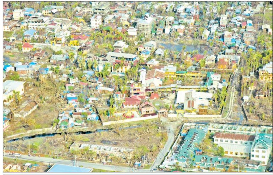
မိုခါမုန်တိုင်းတိုက်ခတ်မှုကြောင့် ထိခိုက်ပျက်စီးခဲ့မှုများကို ဝေဟင်မှတွေ့မြင်ရစဉ်။

တကျ မှန်မှန်ကန်ကန် မြန်မြန် ဆန်ဆန်ဆောင်ရွက်ကြရမည်ဖြစ်ကြောင်း၊ သို့မှသာ လိုအပ်သည့် ကူညီကယ်ဆယ်ရေး ပစ္စည်းများကို သက်ဆိုင်ရာတာဝန်ရှိသူများက စနစ်တကျစီမံခန့်ခွဲ၍ ပို့ဆောင်ပေးနိုင်မည် ဖြစ်ကြောင်း၊ နိုင်ငံတော် စီမံအုပ်ချုပ်ရေးကောင်စီအနေဖြင့် မုန်တိုင်းကြောင့် ထိခိုက်ပျက်စီးခဲ့သည့် ဒေသများကို သဘာဝဘေးအန္တရာယ်ဆိုင်ရာ စီမံခန့်ခွဲမှုဥပဒေပုဒ်မ ၁၁ အရ သဘာဝဘေးအန္တရာယ်ကျရောက်သော ဒေသများအဖြစ် ကြေညာချက်များ ထုတ်ပြန်၍ ယင်းကြေညာချက်များပါ ဒေသများတွင် ပြန်လည်ထူထောင်ရေးလုပ်ငန်းများ ဆောင်ရွက်နိုင်ရန် ဒေသအလိုက် တပ်မတော်အရာရှိကြီးများကို ခန့်အပ်တာဝန်ပေးထားပြီးဖြစ်ကြောင်း၊ ယခုမုန်တိုင်းလွန်ပြီးနောက် ပြန်လည်ထူထောင်ရေး လုပ်ငန်းများ