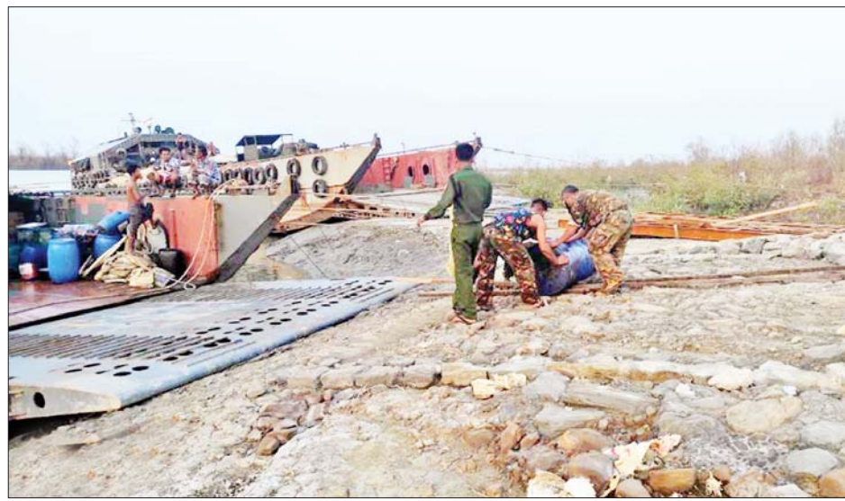
ဓာတ်ဆီ ငါးလုံး စုစုပေါင်း ၁၀ တန်တို့ကို ရေချမ်းရသေ့တောင်သို့ မေ ၁၉ ရက် နံနက်ပိုင်းတွင် ရောက်ရှိပြင်ချောင်းဝအနီးမှတင်ဆောင်ပြီး ထွက်ခွာလာခဲ့ရာ ခဲ့သည်။

နေပြည်တော် မေ ၁၉ အလွန်အားကောင်းသော ဆိုင်ကလုန်းမုန်တိုင်း မိုခါ(MOCHA) ဖြတ်သန်းတိုက်ခတ်မှုကြောင့် ထိခိုက်ပျက်စီးဆုံးရှုံးမှုများ ဖြစ်ပေါ်ခဲ့သော ရခိုင်ပြည်နယ်အတွင်းရှိ မုန်တိုင်းဒဏ်သင့်ပြည်သူများကို လိုအပ်သောပစ္စည်းများ ကူညီထောက်ပံ့မှုများပေးနိုင်ရန် တပ်မတော်(ရေ)မှ ၂၉ မီတာ ကမ်းထိုးရေယာဉ် တစ်စင်းသည် အမျိုးသားသဘာဝဘေးအန္တရာယ် စီမံခန့်ခွဲရေးကော်မတီမှ World Bank မိုးကာလိပ် ၆၀၊ World Bank (5.5m x 6m) မိုးကာစ ၅၀၊ World Bank မိုးကာတဲ ကိုးလုံး၊ စင်ကာပူ မိုးကာတဲအလုံး ၃၀၊ ကျားဝတ်လုံချည်အထည် ၁၀၀၀၊ မဝတ်လုံချည်အထည် ၁၀၀၀၊ တီရှပ်အထည် ၂၀၀၀၊ စောင်အထည် ၁၀၀၀၊ တဘက်အထည် ၁၀၀၀၊ ခြင်ထောင်အထည် ၁၀၀၀၊ ဆပ်ပြာတောင့် ၁၀၀၀၊ ကလေး(ကျား) ကျောင်းဝတ်စုံ ၁၀၀၀၊ ကလေး(မ) ကျောင်းဝတ်စုံ ၁၀၀၀၊ ထောက်ပံ့နှင့်ပို့ဆောင်ရေးတပ်မှ ဒီဇယ်ဆီအလုံး ၂၀၊