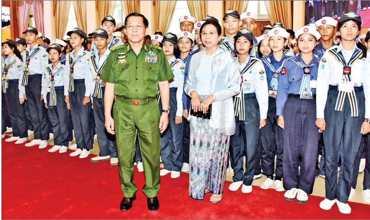
နိုင်ငံတော်စီမံအုပ်ချုပ်ရေးကောင်စီဥက္ကဋ္ဌ တပ်မတော်ကာကွယ်ရေးဦးစီးချုပ် ဗိုလ်ချုပ်မှူးကြီးမင်းအောင်လှိုင်နှင့် ဇနီး ဒေါ်ကြူကြူလှတို့ ရေကြောင်းလူငယ်အခြေခံနှင့် တန်းမြင့်သင်တန်းအမှတ်စဉ်(၁/၂၀၂၃)နှင့် အခြေခံလေကြောင်းလူငယ်သင်တန်း(အကြီးတန်းအဆင့်)နှင့် (အငယ်တန်းအဆင့်) (၁/၂၀၂၃)မှ သင်တန်းသား သင်တန်းသူများနှင့် အုပ်ချုပ်သူနည်းပြများနှင့်အတူ စုပေါင်းမှတ်တမ်းတင်ဓာတ်ပုံရိုက်စဉ်။

နေမှု၊ ရာသီဥတု သုံးမျိုးစလုံးနှင့် ကိုက်ညီစွာ စိုက်ပျိုးမွေးမြူရေး လုပ်ငန်းများ လုပ်ကိုင်နိုင်သည့် ရေခဲမြေခဲကောင်းများ ရှိပြီးဖြစ်ကြောင်း၊ ယခုလို အခြေခံကောင်းများကို အကျိုးရှိစွာ အသုံးပြုနိုင်ရန် လူသားအရင်းအမြစ်များ ရှိမှသာ တိုင်းပြည်၏ စီးပွားသည်လည်း ယခုထက်မက အဆပေါင်းများစွာ တိုးပွားလာမှာပင်ဖြစ်ကြောင်း။