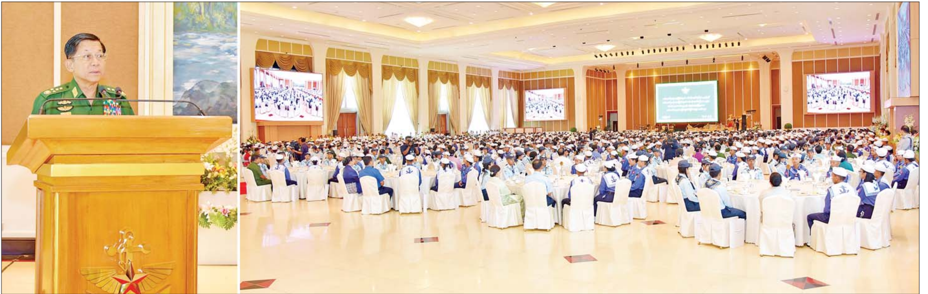
နိုင်ငံတော်စီမံအုပ်ချုပ်ရေးကောင်စီဥက္ကဋ္ဌ တပ်မတော်ကာကွယ်ရေးဦးစီးချုပ် ဗိုလ်ချုပ်မှူးကြီးမင်းအောင်လှိုင် ရေကြောင်းလူငယ်အခြေခံနှင့် တန်းမြင့်သင်တန်းအမှတ်စဉ်(၁/၂၀၂၃)နှင့် အခြေခံလေကြောင်းလူငယ်သင်တန်း(အကြီးတန်းအဆင့်)နှင့် (အငယ်တန်းအဆင့်)(၁/၂၀၂၃)မှ သင်တန်းသား သင်တန်းသူများနှင့် အုပ်ချုပ်သူနည်းပြများအား တွေ့ဆုံအမှာစကားပြောကြားစဉ်။