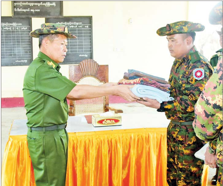
နိုင်ငံတော်စီမံအုပ်ချုပ်ရေးကောင်စီဒုတိယဥက္ကဋ္ဌ ဒုတိယတပ်မတော်ကာကွယ်ရေးဦးစီးချုပ် ကာကွယ်ရေးဦးစီးချုပ် (ကြည်း) ဒုတိယဗိုလ်ချုပ်မှူးကြီးစိုးဝင်း ရသေ့တောင်နယ်မြေခံတပ်ရင်းမိသားစုများအတွက် စားသောက်ဖွယ်ရာများ ထောက်ပံ့ပေးအပ်စဉ်။

ဆောင်ရွက်ရာတွင် အမြန်ဆုံးမူလအခြေအနေထက် သာလွန်ကောင်းမွန်စေရေး အတွက် သက်ဆိုင်ရာ မြို့နယ်များအလိုက် အားလုံး ဝိုင်းဝန်းပူးပေါင်း ဆောင်ရွက်ကြရမည်ဖြစ်ကြောင်း ပြောကြားသည်။ ရှင်းလင်းတင်ပြ ထို့နောက် တက်ရောက်လာကြသည့် မြို့နယ်အလိုက် ဌာနဆိုင်ရာ တာဝန်ရှိသူများနှင့် မြို့မိမြို့ဖများက ဆိုင်ကလုန်းမုန်တိုင်း (မိုခါ)တိုက်ခတ်မှုကြောင့် နေအိမ်အဆောက်အအုံများ၊ စာသင်ကျောင်းများ၊ ဆေးရုံများနှင့် ဌာနဆိုင်ရာအဆောက်အအုံများ ပျက်စီးဆုံးရှုံးခဲ့မှုအခြေအနေများနှင့် အခြားလိုအပ်သည်များကို ရှင်းလင်းတင်ပြကြရာ အမျိုးသားသဘာဝဘေးအန္တရာယ်ဆိုင်ရာ စီမံခန့်ခွဲမှုကော်မတီ ဥက္ကဋ္ဌ နိုင်ငံတော် စီမံအုပ်ချုပ်ရေးကောင်စီဒုတိယဥက္ကဋ္ဌ ဒုတိယ တပ်မတော် ကာကွယ်ရေးဦးစီးချုပ် ကာကွယ်ရေးဦးစီးချုပ်