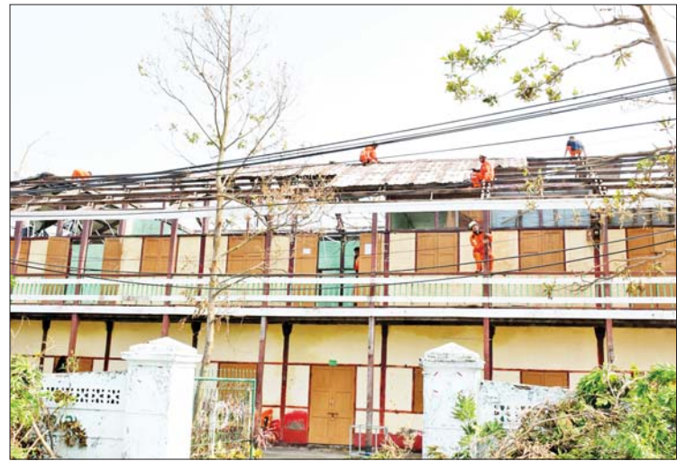
စစ်တွေမြို့ အထက(၁)၌ အမိုးများ ပြုပြင်နေမှုကို တွေ့ရစဉ်။