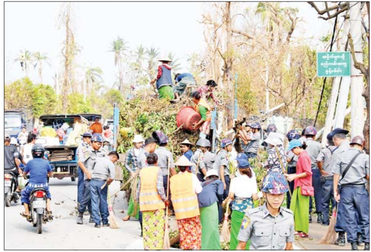
စစ်တွေမြို့ လမ်းမကြီးများ၌ ပြုလဲပျက်စီးနေမှုကို စုပေါင်းရှင်းလင်းစဉ်။