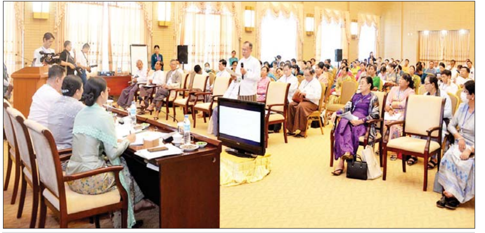
“အရည်အသွေးရှိသော ဆရာဆရာမများ ဖြည့်ဆည်းလေ့ကျင့်ပျိုးထောင်ရေး”ခေါင်းစဉ်ဖြင့် ဆွေးနွေးကြစဉ်။