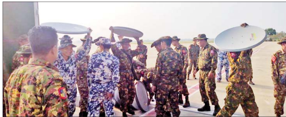
DTH စနစ်အစုံ ၅၀၀ နှင့် ဆက်စပ်ပစ္စည်းများ စစ်တွေမြို့သို့ ပို့ဆောင်ရန် နေပြည်တော်လေဆိပ်တွင် ပြင်ဆင်နေစဉ်။

ပင်မအဆောက်အအုံမှ ခေါင်မိုးသွပ်များနှင့် ဒိုင်း/ မြားသံချောင်းများ ပြုတ်ထွက်ပျက်စီးမှုကို ကြည့်ရှု စစ်ဆေးပြီး ယင်းနေရာအောက်တွင် တိုက်ရိုက် (Live) ရိုက်ကူးထုတ်လွှင့်သောစတူဒီယို(အေ) ရှိနေသဖြင့် မိုးရေများစိမ့်ဝင်ပြီး ထိခိုက်ပျက်စီးမှုများ