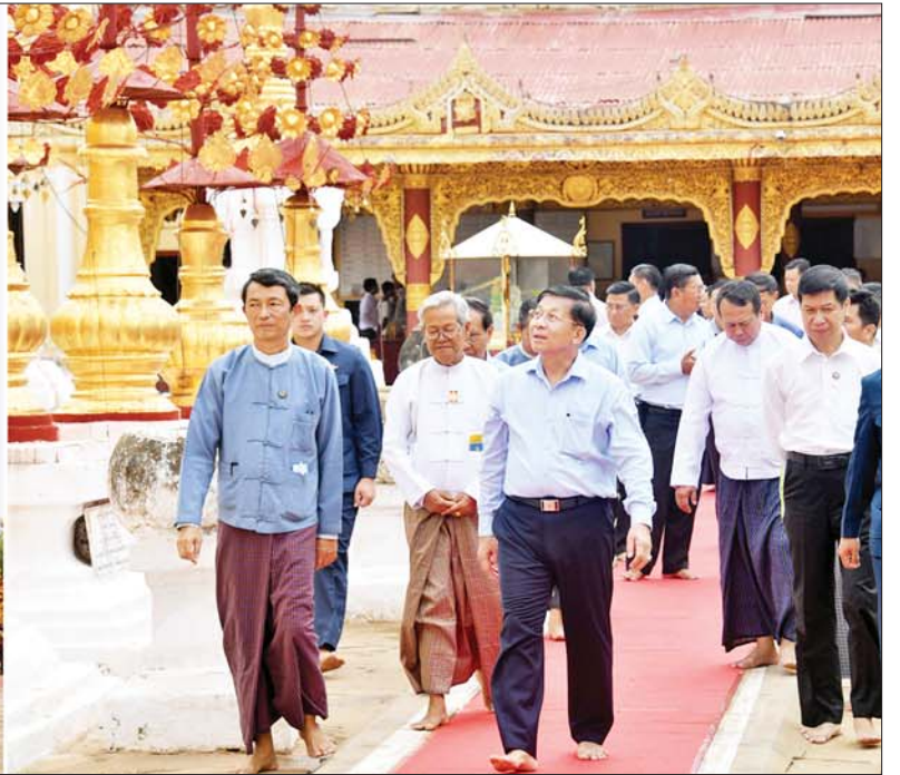
နိုင်ငံတော်စီမံအုပ်ချုပ်ရေးကောင်စီဥက္ကဋ္ဌ နိုင်ငံတော်ဝန်ကြီးချုပ် ဗိုလ်ချုပ်မှူးကြီးမင်းအောင်လှိုင်နှင့်အဖွဲ့ဝင်များ ရွှေစည်းခုံစေတီတော်မြတ်ကြီးအား ဖူးမြော်ကြည့်ညိစဉ်။