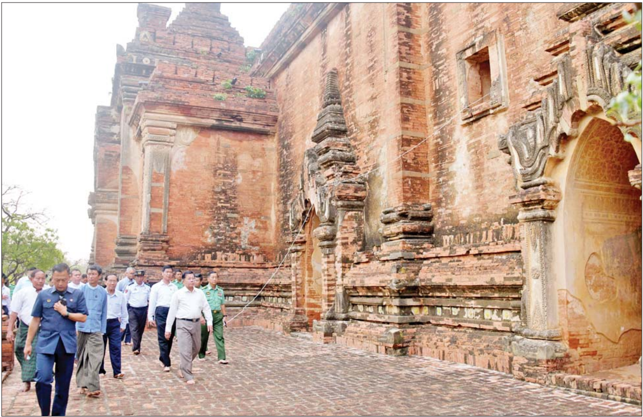
နိုင်ငံတော်စီမံအုပ်ချုပ်ရေး ကောင်စီဥက္ကဋ္ဌ နိုင်ငံတော် ဝန်ကြီးချုပ် ဗိုလ်ချုပ်မှူးကြီး မင်းအောင်လှိုင် ဗုဒ္ဓမဏိ ဂူဘုရားကြီးတွင် လှည့်လည် ကြည့်ရှုစဉ်။

ရေဖုံးမှ ဦးစွာ နိုင်ငံတော်စီမံအုပ်ချုပ်ရေး ကောင်စီဥက္ကဋ္ဌ နိုင်ငံတော် ဝန်ကြီးချုပ်နှင့် အဖွဲ့ဝင်များသည် ညောင်ဦးလေဆိပ်သို့ ရောက်ရှိ ကြရာ မန္တလေးတိုင်းဒေသကြီး ဝန်ကြီးချုပ် ဦးမျိုးအောင်၊ အလယ်ပိုင်းတိုင်း စစ်ဌာနချုပ် တိုင်းမှူး ဗိုလ်ချုပ်ကိုကိုဦးနှင့် တာဝန်ရှိသူများက ကြိုဆိုနှုတ်ဆက် ကြသည်။ ထို့နောက် နိုင်ငံတော် စီမံအုပ်ချုပ်ရေးကောင်စီ ဥက္ကဋ္ဌ နိုင်ငံတော် ဝန်ကြီးချုပ်သည် သဘာဝဘေးအန္တရာယ်ဖြစ်ပေါ်မှု ကြောင့် ရေဝင်၊ ရေဝပ်မှုများ ဖြစ်ပေါ်လျက်ရှိသည့် ပုဂံ ရှေးဟောင်း ယဉ်ကျေးမှုနယ်မြေ အတွင်း မော်တော်ယာဉ်များဖြင့် လှည့်လည်ကြည့်ရှုစစ်ဆေးသည်။