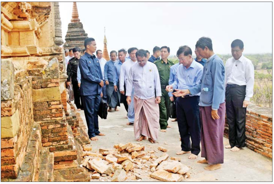
နိုင်ငံတော်စီမံအုပ်ချုပ်ရေးကောင်စီဥက္ကဋ္ဌ နိုင်ငံတော်ဝန်ကြီးချုပ် ဗိုလ်ချုပ်မှူးကြီးမင်းအောင်လှိုင် ထီးလိုမင်းလိုဘုရားကြီးအထက်ပစ္စယံ၌ သဘာဝဘေးအန္တရာယ်ကြောင့် ထိခိုက်ပျက်စီးခဲ့မှုအခြေအနေကို ကြည့်ရှုစစ်ဆေးစဉ်။

ပျက်စီးမှုဖြစ်ပေါ်ခဲ့သည့် အခြေ အနေများကို သွားရောက်ကြည့်ရှု စစ်ဆေးပြီး လိုအပ်သည်များ မှာကြားစဉ် ဘက်စုံအလှူငွေများ ပေးအပ်လှူဒါန်းခဲ့ပြီး ဘုရားဖူးလာ ပြည်သူများအား ရင်းရင်းနှီးနှီး နှုတ်ဆက်ခဲ့သည်။ မန္တလေး တိုင်းဒေသကြီး ညောင်ဦးခရိုင် ပုဂံရှေးဟောင်း ယဉ်ကျေးမှု နယ်မြေအတွင်း သဘာဝဘေးအန္တရာယ်ကျရောက် ခဲ့မှုကြောင့် ရွှေစည်းခုံစေတီ၊ အာနန္ဒာဘုရား၊ ဓမ္မရုံကြီးဘုရား၊ စူဠာမဏိဘုရား၊ ဓမ္မရာဇကဘုရား၊ ဆင်ဖြူရှင်ကွန်းလက်၊ ခေမင်္ဂ ဘုရား၊ သပိတ်မှောက်ဘုရား၊ ထီးလိုမင်းလိုဘုရား၊ လေးမျက်နှာ ဘုရား၊ ဆင်ပေါင်းအုတ်ကျောင်း၊ ဓမ္မရာဇကအနီးရှိဘုရား၊ ပုဂံမျှော် ဘုရား၊ ရွာဟောင်းကြီးဘုရား၊ ရွှေနန်းရင်တောဘုရား တို့၌ ရေဝင်ရောက်မှုများ ဖြစ်ပေါ်ခဲ့ပြီး ရှေးဟောင်းဘုရား/ အဆောက် အအုံ ရှစ်ခုတို့တွင် ထိခိုက်ပျက်စီးမှု အနည်းငယ်ဖြစ်ပေါ်ခဲ့ကြောင်းနှင့် ရှေးလက်ရာမပျက်အမြန်ပြန်လည် ပြုပြင် ထိန်းသိမ်းနိုင်ရေး ဆောင်ရွက်လျက်ရှိကြောင်း သိရ သည်။ သတင်းစဉ်