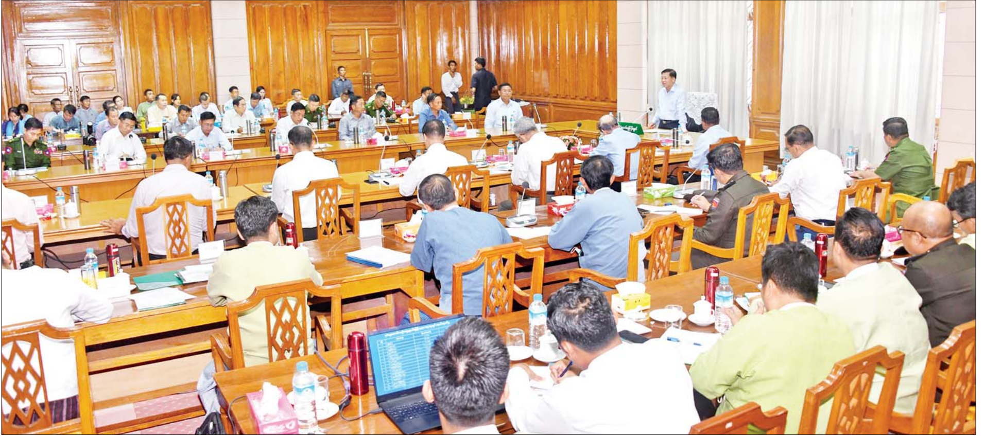
နိုင်ငံတော်စီမံအုပ်ချုပ်ရေးကောင်စီဥက္ကဋ္ဌ နိုင်ငံတော်ဝန်ကြီးချုပ် ဗိုလ်ချုပ်မှူးကြီးမင်းအောင်လှိုင် ညောင်ဦးခရိုင်အတွင်း သဘာဝဘေးအန္တရာယ်ထိခိုက်မှုနှင့်ပတ်သက်သည့်အစည်းအဝေးတွင် အမှာစကား ပြောကြားစဉ်။