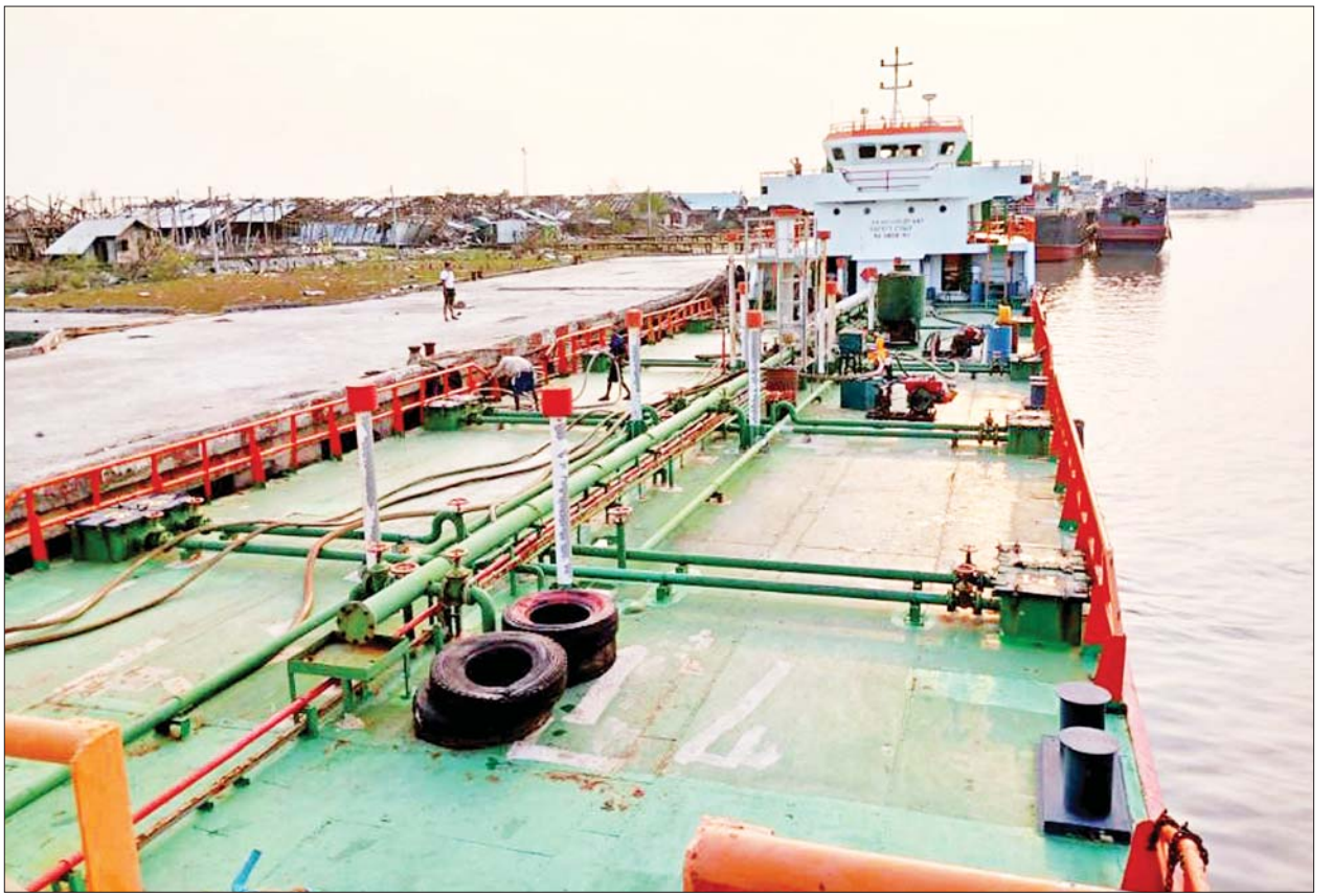
မြို့ သီလဝါဆိပ်ကမ်းဒေသမှ MT Khine Khine Phyo-34 ကမ်းရိုးဖြင့် ဒီဇယ်ဆီ ဂါလန် ၂၅၀၀၀၀၊ MT Khine Khine Phyo-33၊ MT တန်းသွား စက်သုံးဆီ Tanker များ ဓာတ်ဆီ 92 RON ဂါလန် ၂၀၀၀၀၀

မေ ၁၆ ရက်တွင် MT ဇေမျှ တန်ဆောင် ဆီတင်ရေယာဉ်ဖြင့် ပရီမီယံဒီဇယ်ဆီ ဂါလန် ၂၀၀၀၀၀ ကို သယ်ယူပို့ဆောင်ပေးခဲ့ရာ စစ်တွေမြို့ ရွှေမင်းဂံဆိပ်ကမ်းသို့ ဆိုက်ရောက်၍ စက်သုံးဆီ ချယူခြင်းနှင့် ဖြန့်ဖြူးခြင်းလုပ်ငန်းများကို ဆောင်ရွက်နေပြီဖြစ်ပြီး သီလဝါမှပေးပို့သော ဆီတင်ယာဉ် ဘောက်ဆာတစ်စီး မှာလည်း စစ်တွေမြို့သို့ ဝင်ရောက်ပြီဖြစ်သည်။ ထို့အပြင် ထပ်မံ၍ ရန်ကုန်