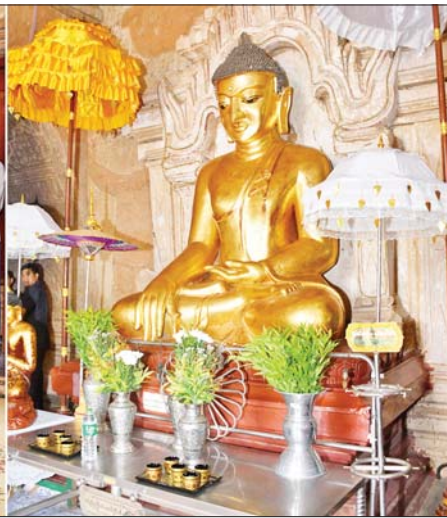
နိုင်ငံတော်စီမံအုပ်ချုပ်ရေးကောင်စီဥက္ကဋ္ဌ နိုင်ငံတော်ဝန်ကြီးချုပ် ဗိုလ်ချုပ်မှူးကြီးမင်းအောင်လှိုင်နှင့်အဖွဲ့ဝင်များ ထီးလိုမင်းလိုဘုရားအား ဖူးမြော်ကြည့်ညိစဉ်။

»» စာမျက်နှာ ၃ မှ ထီးလိုမင်းလိုဘုရားကြီး ယင်းနောက် နိုင်ငံတော်စီမံ အုပ်ချုပ်ရေးကောင်စီဥက္ကဋ္ဌ နိုင်ငံ တော်ဝန်ကြီးချုပ်နှင့် အဖွဲ့ဝင်များ သည် ထီးလိုမင်းလိုဘုရားကြီးသို့ ရောက်ရှိကြပြီး ဘုရားကြီးအတွင်း၊ အပြင်နှင့် အထက်ပစ္စယံတို့၌ သဘာဝဘေးအန္တရာယ်ကြောင့် ထိခိုက်ပျက်စီးခဲ့မှုအခြေအနေများ ကို လိုက်လံကြည့်ရှုပြီး တာဝန် ရှိသူများ၏ တင်ပြချက်များအပေါ် ပုဂံရှေးဟောင်း ယဉ်ကျေးမှု