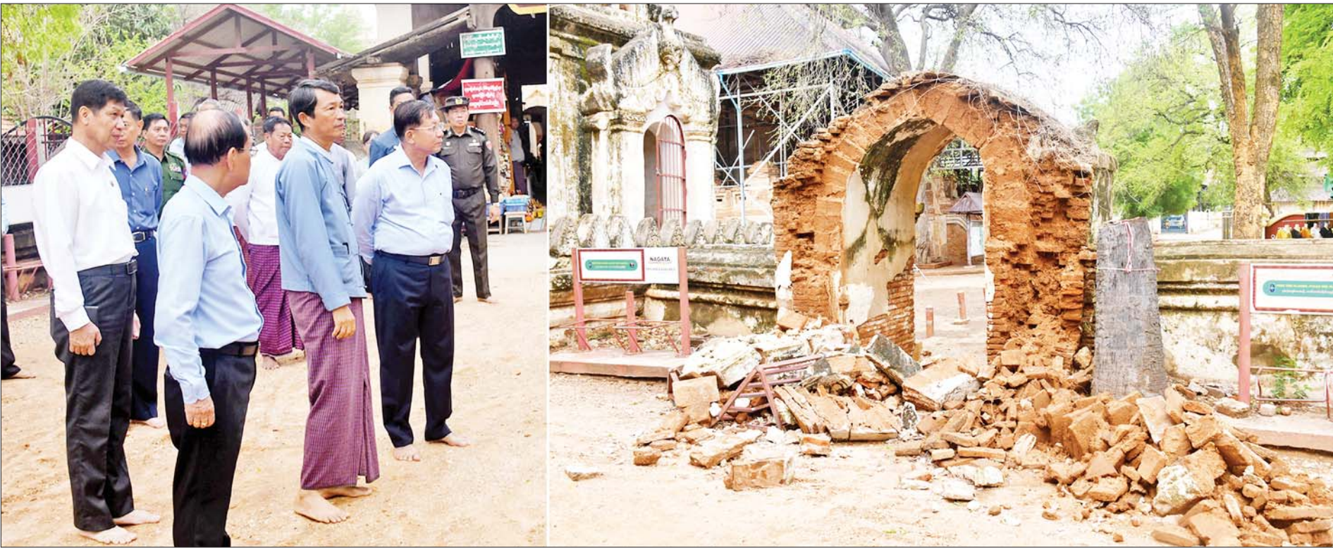
နိုင်ငံတော်စီမံအုပ်ချုပ်ရေးကောင်စီဥက္ကဋ္ဌ နိုင်ငံတော်ဝန်ကြီးချုပ် ဗိုလ်ချုပ်မှူးကြီးမင်းအောင်လှိုင် သဘာဝဘေးအန္တရာယ်ဖြစ်ပေါ်မှုကြောင့် အာနန္ဒာအုတ်ကျောင်းမုခ်ဦး ထိခိုက်ပျက်စီးမှုအခြေအနေများကို ကြည့်ရှုစစ်ဆေးစဉ်။