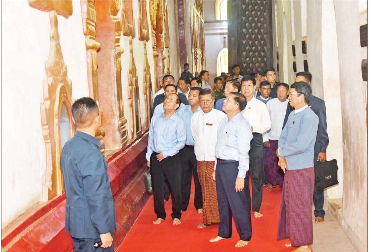
ရေဝင်ရောက်ခဲ့မှုနှင့် ထိခိုက် ပျက်စီးမှုဖြစ်ပေါ်ခဲ့သည့် အခြေ အနေများကို သွားရောက်ကြည့်ရှု သည်။

အတွင်း မြေညိုခြင်းနှင့် မြေဖိုခြင်း များကို ဆောင်ရွက်သွားရန်နှင့် နောင်တွင် ယခုကဲ့သို့ ရေဝင်ရောက် မှုများ မဖြစ်စေရေး ရေထွက် ပေါက်များကိုလည်း စနစ်တကျ တွက်ချက်ထည့်သွင်းတည်ဆောက် သွားရန်လိုကြောင်း၊ ဘုရားကြီး၏ အတွင်းအပြင်အား ထိန်းသိမ်းရာ တွင် သမိုင်းဝင်တန်ဖိုးကြီး အမွေ အနှစ်ဖြစ်သည့်အတွက် စနစ်တကျ ဖြင့်ဆောင်ရွက်သွားရန်လိုကြောင်း နှင့် ရှေးဟောင်းလက်ရာ နံရံ ဆေးရေးပန်းချီများ ရေရှည် တည်တံ့စေရေးအတွက် မှန်ဖြင့် ကာရံနိုင်ရေး ဆောင်ရွက်သွားရန် လိုကြောင်း မှာကြားခဲ့ပြီး စူဠာမဏိ ဘုရားကြီးအား ဖူးမြော်ကြည့်ညို သည်။