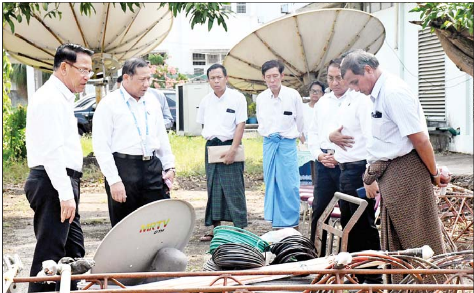
ပြည်ထောင်စုဝန်ကြီး ဦးမောင်မောင်အုန်း စစ်တွေမြို့သို့ ပို့ဆောင်မည့် ရုပ်သံထုတ်လွှင့်မှုဆိုင်ရာ ပစ္စည်းများ ထုပ်ပိုးပြင်ဆင်နေမှုကို ကြည့်ရှုစစ်ဆေးစဉ်။

ထို့နောက် ပြည်ထောင်စုဝန်ကြီးသည် မြန်မာ့အသံနှင့် ရုပ်မြင်သံကြား ဂီတဌာနခွဲမှ ဝန်ထမ်းများနှင့် တွေ့ဆုံ၍ ဆောင်ရွက်ပြီးစီးခဲ့သည့် မြန်မာ့ရုပ်ရှင်