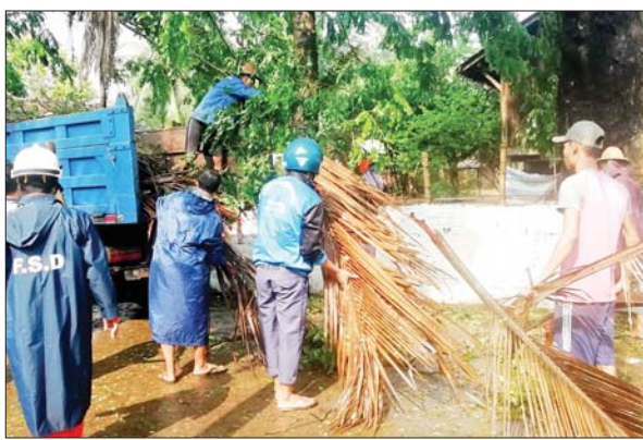
မာန်အောင်မြို့နယ်၌ လေပြင်းတိုက်ခတ်မှုကြောင့် သစ်ပင်သစ်ကိုင်းများကျိုးကျနေမှုကို တာဝန်ရှိသူများက ဖယ်ရှားရှင်းလင်းပေးစဉ်။ မြို့နယ်(ပြန်/ဆက်)