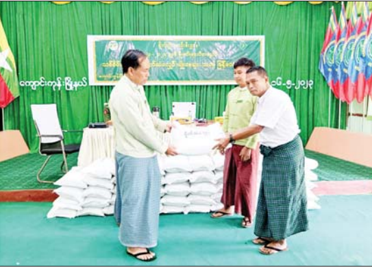
ရရှိစေကြောင်း ရှင်းလင်းပြောကြားခဲ့သည်။ ထို့နောက် သစ်စိမ်းမြေဩဇာ(ပိုက်ဆံလျှော်)မျိုးစေ့များကို တာဝန်ရှိသူများက ထောက်ပံ့ပေးအပ်ရာ ရပ်ကွက်/ကျေးရွာ အုပ်ချုပ်ရေးမှူးများက လက်ခံရယူခဲ့ကြောင်း သိရသည်။ မြို့နယ်(ပြန်/ဆက်)

ကျောင်းကုန်း မေ ၁၆ ၂၀၂၃-၂၀၂၄ ခုနှစ် မိုးစပါးရာသီအတွက် သစ်စိမ်းမြေဩဇာ (ပိုက်ဆံလျှော်)မျိုးစေ့များပေးအပ်ပွဲ အခမ်းအနားကို အထွေထွေ အုပ်ချုပ်ရေးဦးစီးဌာနရုံး အေးချမ်းသာယာခန်းမ၌ ယနေ့မွန်းလွဲ ၂ နာရီက ကျင်းပသည်။