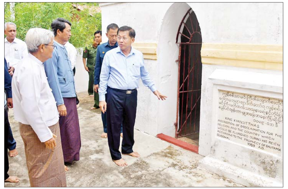
နိုင်ငံတော်စီမံအုပ်ချုပ်ရေးကောင်စီဥက္ကဋ္ဌ နိုင်ငံတော်ဝန်ကြီးချုပ် ဗိုလ်ချုပ်မှူးကြီးမင်းအောင်လှိုင် ရွှေစည်းခုံစေတီတော်မြတ်ကြီးရှိ ကျန်စစ်သားမင်းကြီးအတ္ထုပ္ပတ္တိကျောက်စာကို ကြည့်ရှုစဉ်။