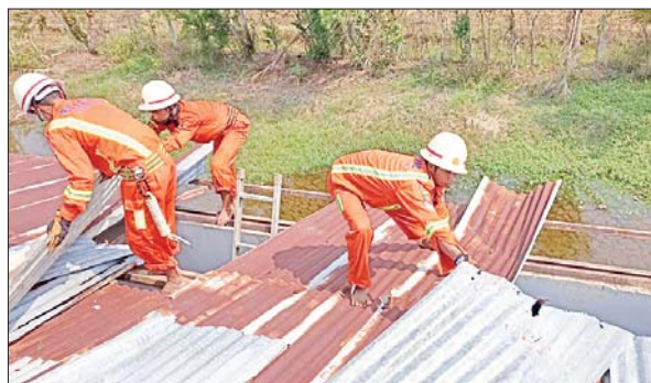
ဒေးဒရဲမြို့နယ်၌ လေပြင်းတိုက်ခတ်မှုကြောင့် ပျက်စီးသွားသော နေအိမ်များကို တာဝန်ရှိသူများက ကူညီဆောင်ရွက်ပေးစဉ်။ မြို့နယ်(ပြန်/ဆက်)