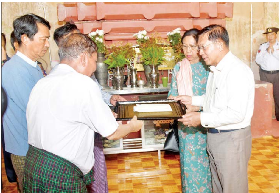
နိုင်ငံတော်စီမံအုပ်ချုပ်ရေးကောင်စီဥက္ကဋ္ဌ နိုင်ငံတော်ဝန်ကြီးချုပ် ဗိုလ်ချုပ်မှူးကြီး မင်းအောင်လှိုင် နှင့် ဇနီး ဒေါ်ကြူကြူလှတို့ စူဠာမဏိဂူဘုရားကြီးအတွက် ဘက်စုံသုံးအလှူငွေများ ပေးအပ်လှူဒါန်းစဉ်။

အမြား ပါရှိသည့်အတွက် ကြည့်ရှု လေ့လာသူများနှင့် သဘာဝ ဘေးဒဏ်တို့ကြောင့် ပျက်စီးဆုံးရှုံး မှုများ မဖြစ်ပေါ်စေရေး စနစ်တကျ တွက်ချက်မွမ်းမံဆောင်ရွက်ရန် လိုကြောင်း၊ လက်ရှိပြုပြင်ထိန်းသိမ်း မှုများ ဆောင်ရွက်ပြီးပါက အများ ပြည်သူများ နံရံဆေးရေးပန်းချီများ ကို လေ့လာရာတွင် အဆင်ပြေ စေရေး တိုက်ရိုက်မဟုတ်သော မီးအလင်းပေးမှုကို ဆောင်ရွက် ပေးရန်လိုကြောင်း၊ အာနန္ဒာ အုတ်ကျောင်းသည်လည်း တန်ဖိုး မြင့်နိုင်သည့် ရှေးဟောင်း ယဉ်ကျေးမှု လက်ရာများ အမြောက်အမြား ပါရှိသည့်အတွက် အုတ်ကျောင်းကြီး တစ်ခုလုံးကို ခြံငုံနိုင်သည့် အမိုးပါ အဆောက် အအုံတစ်ခု တည်ဆောက်ကာရံ နိုင်ရေး ပညာရှင်များနှင့် ဆွေးနွေး တိုင်ပင် ဆောင်ရွက်သွားရန်လို ကြောင်း မှာကြားပြီး အုတ်ကျောင်း အား လှည့်လည်ကြည့်ရှုသည်။