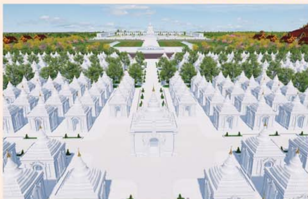
ကျောက်စာရုံစေတီ(၁၂ x ၁၂ x ၁၈)ပေ ၁ ဆူ တန်ဖိုး- ၂၇၉ သိန်း