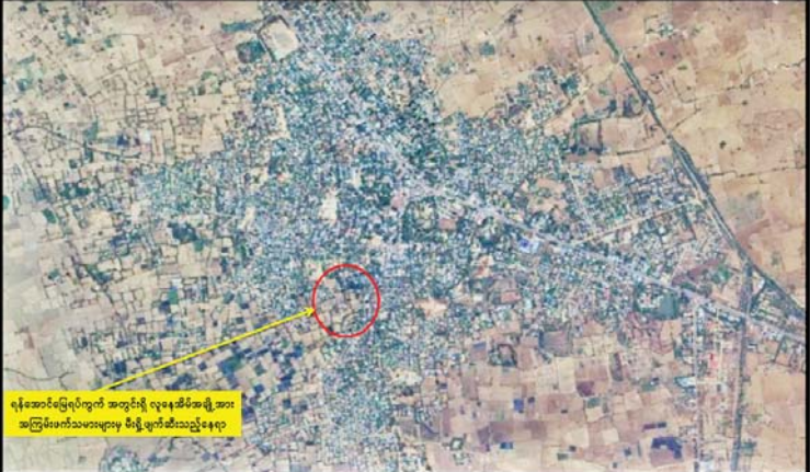
ရန်အောင်မြေရပ်ကွက် အတွင်းရှိ လူနေအိမ်အဖွဲ့အား အကြမ်းဖက်သမားများက မီးရှို့ဖျက်ဆီးခဲ့ရာ ဖြင့် အကြမ်းဖက်သမားများက ရန်အောင် မြေရပ်ကွက်အတွင်းရှိ လူနေအိမ် အချို့အား မီးရှို့ဖျက်ဆီးခဲ့ကြောင်း သိရ သည်။ မီးလောင်ရာနေရာသို့ မြန်မာနိုင်ငံရဲ့ တပ်ဖွဲ့ဝင်များနှင့် မီးသတ်တပ်ဖွဲ့ဝင်များ က မီးသတ်ယာဉ် သုံးစီး၊ ရေသယ်ယာဉ် လေးစီးတို့ဖြင့် ပိုင်းဝန်းဖြိုခွဲသတ်ခဲ့သဖြင့် နံနက် ၄ နာရီ ၁၅ မိနစ်ခန့်တွင် မီးငြိမ်း သွားခဲ့ပြီး မီးလောင်မှုကြောင့် နေအိမ် အလုံး ၂၀ မီးလောင်ပျက်စီးခဲ့သည်။ ထိုသို့ အပြစ်မဲ့အရပ်သားပြည်သူ များ၏ နေအိမ်များကို မီးရှို့ဖျက်ဆီးခဲ့ သည့်အကြမ်းဖက်သမားများအား ဖမ်းဆီး အရေးယူနိုင်ရေးနှင့် နယ်မြေဒေသ တည်ငြိမ်အေးချမ်းရေးအတွက် လုံခြုံရေး တပ်ဖွဲ့ဝင်များက လိုအပ်သည့်လုံခြုံရေး လုပ်ငန်းစဉ်များ ဆက်လက်ဆောင်ရွက် လျက်ရှိကြောင်း သိရသည်။ သတင်းစဉ်

နေပြည်တော် မေ ၁၂ စစ်ကိုင်းတိုင်းဒေသကြီး ချောင်းဦး မြို့ ရန်အောင်မြေရပ်ကွက်အတွင်းရှိ နေအိမ်များအား PDF အမည်ခံ အကြမ်းဖက်သမားများက ယနေ့နံနက် ပိုင်းတွင် မီးရှို့ဖျက်ဆီးခဲ့ကြောင်း သိရ သည်။ ဖြစ်စဉ်မှာ ချောင်းဦးမြို့အတွင်း နယ်မြေလုံခြုံရေး ဆောင်ရွက်နေသည့် တပ်ဖွဲ့ဝင်များအား ယနေ့နံနက် ၃ နာရီ ၁၅ မိနစ်ခန့်တွင် PDF အမည်ခံအကြမ်းဖက် သမားများက မြန်မာ့စီးပွားရေးဘဏ်၏ အနောက်ဘက် မိတာ ၃၀၀ ခန့်အကွာမှ နေ၍ လက်နက်ငယ်များဖြင့် လာရောက် ပစ်ခတ်တိုက်ခိုက်သဖြင့် လုံခြုံရေးတပ်ဖွဲ့ ဝင်များက ပြန်လည်ခုခံပစ်ခတ်ခဲ့ရာ အကြမ်းဖက်သမားများသည်တောင်ဘက် သို့ ဆုတ်ခွာထွက်ပြေးသွားခဲ့ကြောင်း၊ ထိုသို့ဆုတ်ခွာထွက်ပြေးစဉ် လုံခြုံရေး အဖွဲ့များက နေအိမ်များအား မီးရှို့သည် ဟု အထင်မြင်လွဲမှားစေရန် ရည်ရွယ်ချက်