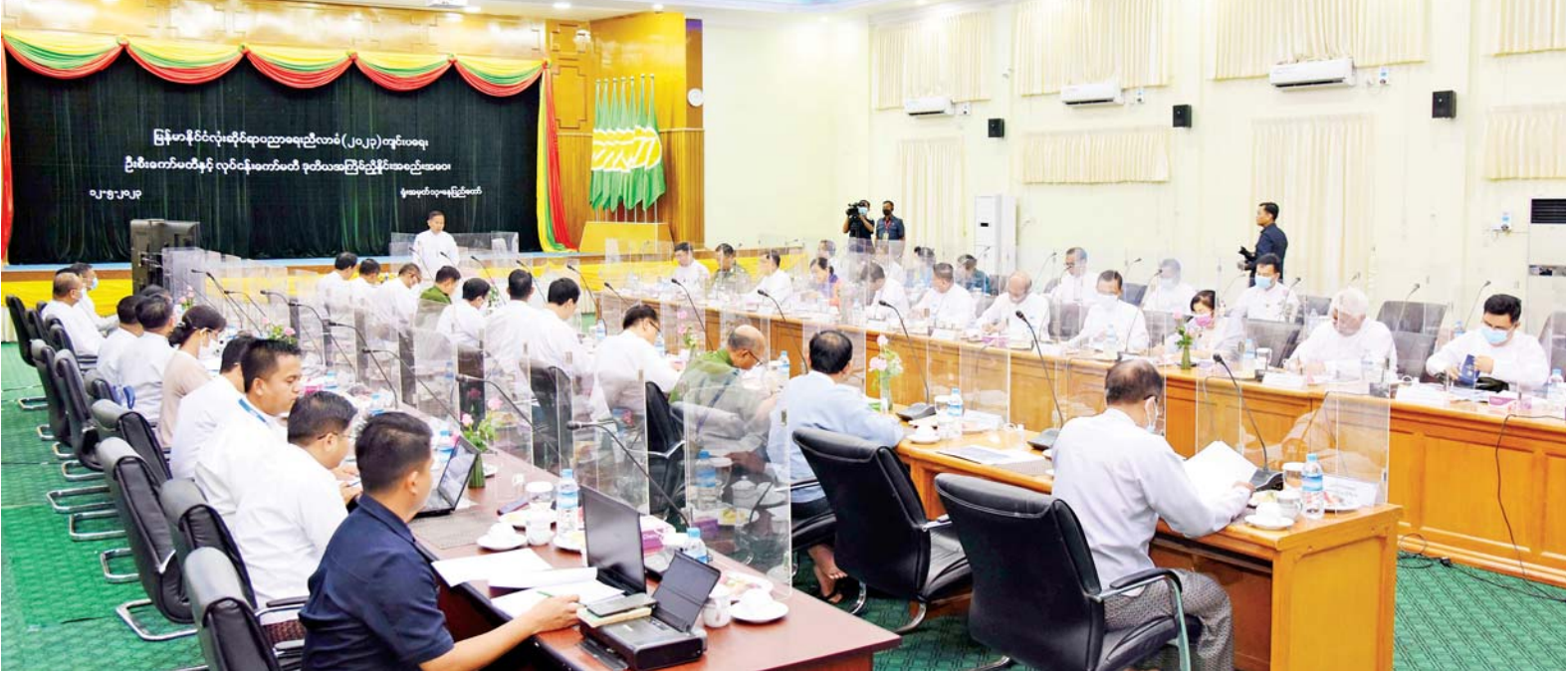
နိုင်ငံတော်စီမံအုပ်ချုပ်ရေးကောင်စီ ဒုတိယဥက္ကဋ္ဌ ဒုတိယဝန်ကြီးချုပ် ဒုတိယဗိုလ်ချုပ်မှူးကြီးစိုးဝင်း မြန်မာနိုင်ငံလုံးဆိုင်ရာပညာရေးညီလာခံ(၂၀၂၃)ကျင်းပရေးဦးစီးကော်မတီ နှင့် လုပ်ငန်းကော်မတီ ဒုတိယအကြိမ် ညှိနှိုင်းအစည်းအဝေးတွင် အမှာစကားပြောကြားစဉ်။

နေပြည်တော် မေ ၁၂ မြန်မာနိုင်ငံလုံးဆိုင်ရာပညာရေးညီလာခံ(၂၀၂၃) ကျင်းပရေး ဦးစီးကော်မတီနှင့် လုပ်ငန်းကော်မတီ ဒုတိယအကြိမ် ညှိနှိုင်းအစည်းအဝေးကို ယနေ့မွန်းလွဲ ၂ နာရီတွင် နေပြည်တော်ရှိ ပညာရေးဝန်ကြီးဌာန အစည်းအဝေးခန်းမ၌ ကျင်းပရာ မြန်မာနိုင်ငံလုံးဆိုင်ရာပညာရေးညီလာခံ(၂၀၂၃)ကျင်းပရေးဦးစီးကော်မတီ ဥက္ကဋ္ဌ နိုင်ငံတော်စီမံအုပ်ချုပ်ရေးကောင်စီဒုတိယဥက္ကဋ္ဌ ဒုတိယဝန်ကြီးချုပ် ဒုတိယဗိုလ်ချုပ်မှူးကြီးစိုးဝင်း တက်ရောက်အမှာစကားပြောကြားသည်။ အစည်းအဝေးသို့ ပြည်ထောင်စုဝန်ကြီးများဖြစ်ကြသည့် ဒေါက်တာညွန့်ဖေနှင့် ဒေါက်တာသက်ခိုင်ဝင်း၊ နေပြည်တော်ကောင်စီဥက္ကဋ္ဌ၊ ဒုတိယဝန်ကြီးများ၊ စာမျက်နှာ ၇ ကော်လံ ၁ သို့မဟုတ်