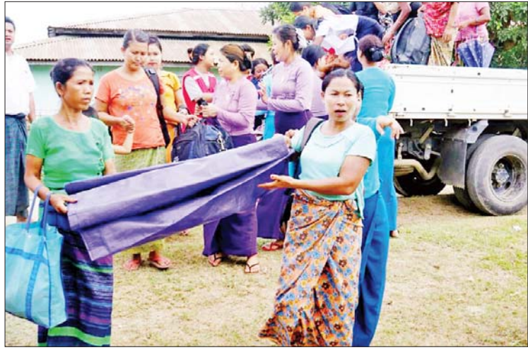
မောင်တောမြို့၌ မုန်တိုင်းအန္တရာယ်ကျရောက်နိုင်သည့်ကျေးရွာများမှ ပြည်သူများ မုန်တိုင်းဘေးလွတ်ရာ ယာယီခိုလှုံရာစခန်းများသို့ ရွှေ့ပြောင်းစဉ်။