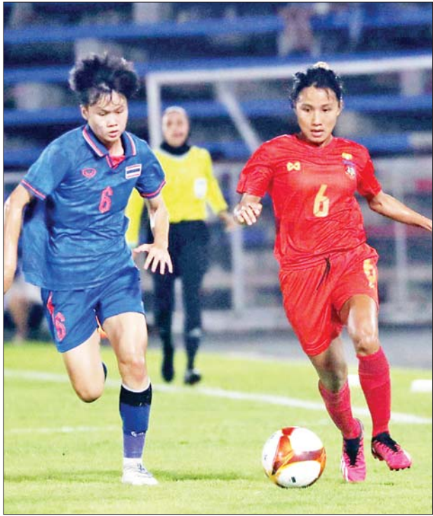
မြန်မာအသင်းနှင့် ထိုင်းအသင်း ယှဉ်ပြိုင်စဉ်။