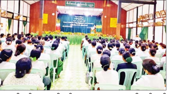
က သင်တန်းသား သင်တန်းသူ ဆရာ ဆရာမများကို လမ်းညွှန် အမှာစကားပြောကြားသည်။ အဆိုပါသင်တန်းကို မေ ၁၂ ရက်မှ ၁၆ ရက်အထိ သင်ကြားပို့ချ ပေးသွားမည်ဖြစ်ပြီး သင်တန်းသို့ စုစုပေါင်း သင်တန်းသား ဆရာ ဆရာမ ၂၀၆ ဦးတို့ တက်ရောက်ကြောင်း သိရသည်။ ခရိုင်(ပြန်/ဆက်)

ရန်ကုန် မေ ၁၂ ရန်ကုန်တိုင်းဒေသကြီး ကမာရွတ်မြို့နယ် အမှတ်(၁၀) ရပ်ကွက် အခြေခံပညာအမှတ်(၁)အထက်တန်းကျောင်းခန်းမ၌ ယနေ့ နံနက်ပိုင်းက ၂၀၂၃-၂၀၂၄ ပညာသင်နှစ် Grade-9 (ပန်းချီ ဂီတ၊ စာရိတ္တနှင့်ပြည်သူ့နီတိ၊ ကာယ) ဘာသာရပ်များ နည်းပြဆင့်ပွားသင်တန်း ဖွင့်ပွဲအခမ်းအနားကို ကျင်းပသည်။ တက်ရောက် အဆိုပါအခမ်းအနားသို့ ရန်ကုန်တိုင်းဒေသကြီး တိုင်းပညာရေးမှူးနှင့် တာဝန်ရှိသူများ၊ ခရိုင်ပညာရေးမှူးနှင့် တာဝန်ရှိသူများ၊ မြို့နယ်ပညာရေးမှူးနှင့် တာဝန်ရှိသူများနှင့် သင်တန်းသားဆရာ ဆရာမများတက်ရောက်ကြသည်။ အခမ်းအနားတွင် ရန်ကုန်တိုင်းဒေသကြီးပညာရေးမှူး ဒုတိယညွှန်ကြားရေးမှူးချုပ်က အဖွင့်အမှာစကားပြောကြားပြီး ရန်ကုန်တိုင်းဒေသကြီး ပညာရေးမှူး ညွှန်ကြားရေးမှူး(ပညာ)