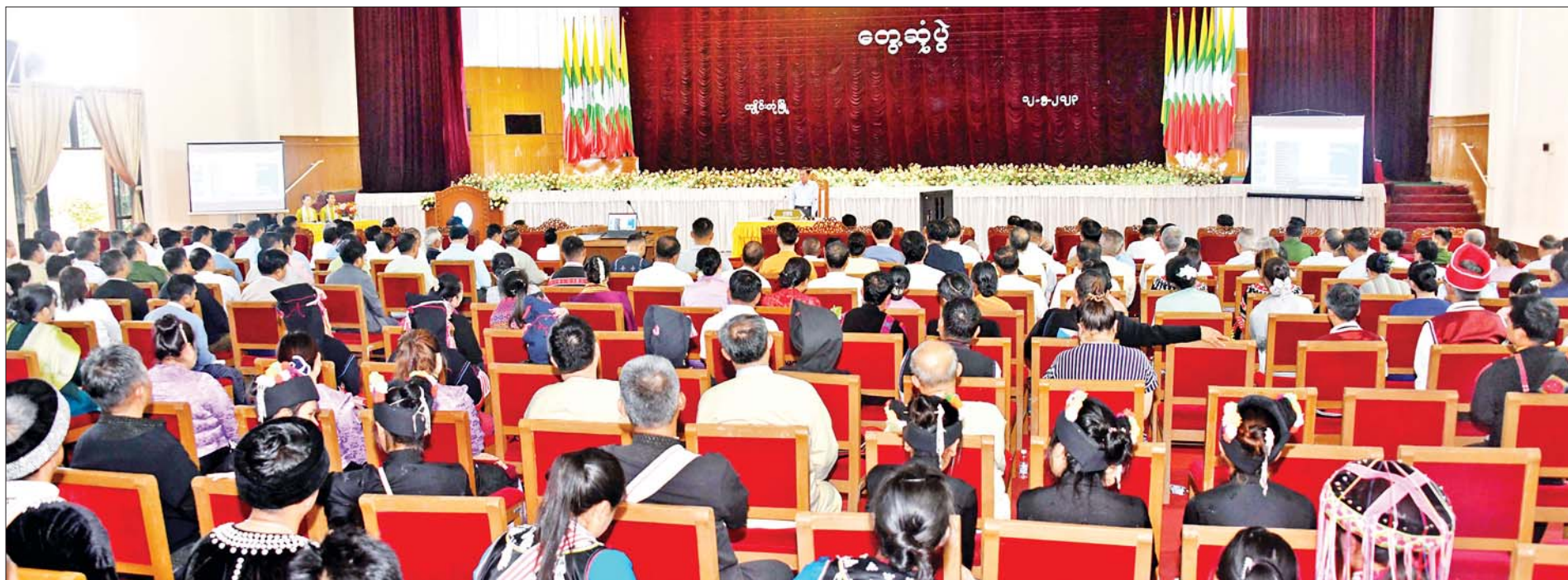
နိုင်ငံတော်စီမံအုပ်ချုပ်ရေးကောင်စီဥက္ကဋ္ဌ နိုင်ငံတော်ဝန်ကြီးချုပ် ဗိုလ်ချုပ်မှူးကြီး မင်းအောင်လှိုင် ရှမ်းပြည်နယ်(အရှေ့ပိုင်း) ကျိုင်းတုံမြို့ရှိ ပြည်နယ်၊ ခရိုင်၊ မြို့နယ်အဆင့်ဌာနဆိုင်ရာ တာဝန်ရှိသူများ၊ မြို့မ၊ မြို့ဖများ၊ အသေးစား၊ အငယ်စားနှင့် အလတ်စား စီးပွားရေး(MSME) လုပ်ငန်းရှင်များအား တွေ့ဆုံဆွေးနွေးပြောကြားစဉ်။