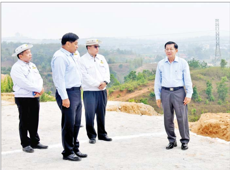
နိုင်ငံတော်စီမံအုပ်ချုပ်ရေးကောင်စီဥက္ကဋ္ဌ နိုင်ငံတော်ဝန်ကြီးချုပ် ဗိုလ်ချုပ်မှူးကြီးမင်းအောင်လှိုင်နှင့် အဖွဲ့ဝင်များ ကျိုင်းတုံမြို့ရှောင်လမ်းဖောက်လုပ်ထားရှိမှု အခြေအနေများကို ကြည့်ရှုစစ်ဆေးစဉ်။