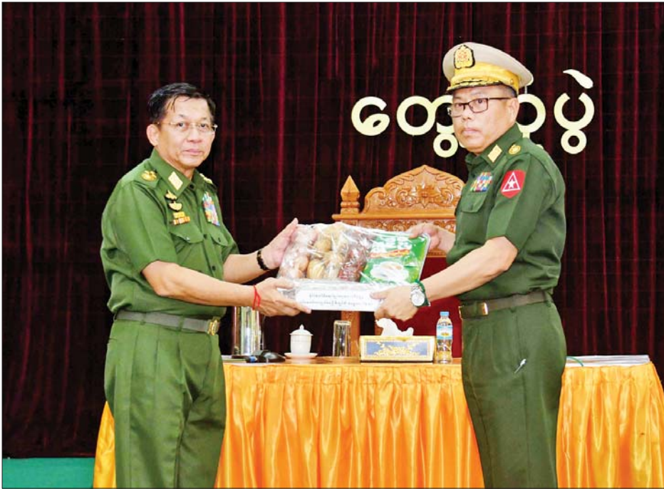
နိုင်ငံတော်စီမံအုပ်ချုပ်ရေးကောင်စီဥက္ကဋ္ဌ တပ်မတော်ကာကွယ်ရေးဦးစီးချုပ် ဗိုလ်ချုပ်မှူးကြီး မင်းအောင်လှိုင် ကြိုဂံဒေသတိုင်းစစ်ဌာနချုပ် ကျိုင်းတုံတပ်နယ်မှ အရာရှိ၊ စစ်သည်၊ မိသားစုများအတွက် စားသောက်ဖွယ်ရာပစ္စည်းများ ပေးအပ်စဉ်။