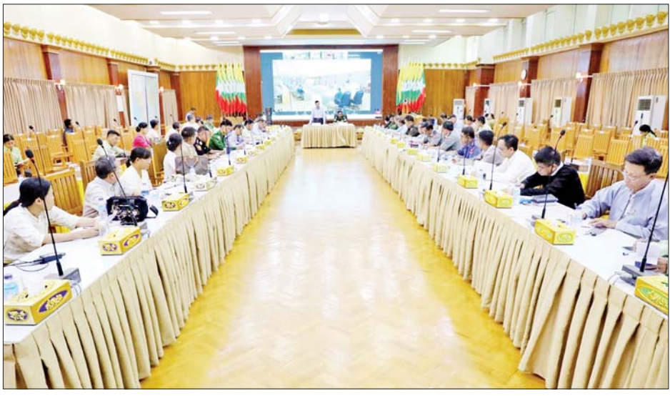
ရခိုင်ပြည်နယ်ဝန်ကြီးချုပ် ဦးထိန်လင်း သဘာဝဘေးအန္တရာယ်ဆိုင်ရာစီမံခန့်ခွဲမှုအဖွဲ့ လုပ်ငန်းညှိနှိုင်းအစည်းအဝေးတွင် အမှာစကားပြောကြားစဉ်။

နေပြည်တော် မေ ၁၂ ဘင်္ဂလားပင်လယ်အော် အရှေ့တောင်ပိုင်းနှင့် ယင်းနှင့် ဆက်စပ်လျက် ရှိသော ကပ္ပလီပင်လယ်ပြင်တောင်ပိုင်း တွင် ဖြစ်ပေါ်လျက်ရှိသည့် လေဖိအားနည်း ရပ်ဝန်းသည် တဖြည်းဖြည်းအားကောင်းလာကာ ဆိုင်ကလုန်းမုန်တိုင်းအဖြစ်သို့ ရောက်ရှိလာနိုင်ပြီး ခန့်မှန်းချက်များအရ မြန်မာနိုင်ငံသို့ ဖြတ်သန်းဝင်ရောက်နိုင်သည့် အခြေအနေရှိနေသဖြင့် သဘာဝဘေးအန္တရာယ် ကျရောက်လာပါက အရေးပေါ်စီမံခန့်ခွဲခြင်း၊ တုံ့ပြန်ခြင်း၊ ကယ်ဆယ်ရေးနှင့် ပူးပေါင်းဆောင်ရွက်ခြင်း၊ အသင့်ပြင်ဆင်စုဖွဲ့ထားရှိခြင်း၊ ပြန်လည်ထူထောင်ရေးဆိုင်ရာ ကိုယ်စီလုပ်ငန်း တာဝန်များအား ဇာတ်တိုက်လေ့ကျင့်ခြင်းများကို တိုင်းဒေသကြီးနှင့် ပြည်နယ်အသီးသီး၌ ဆောင်ရွက်လျက်ရှိသည်။ ထိုသို့ ဆောင်ရွက်လျက်ရှိရာ ယနေ့