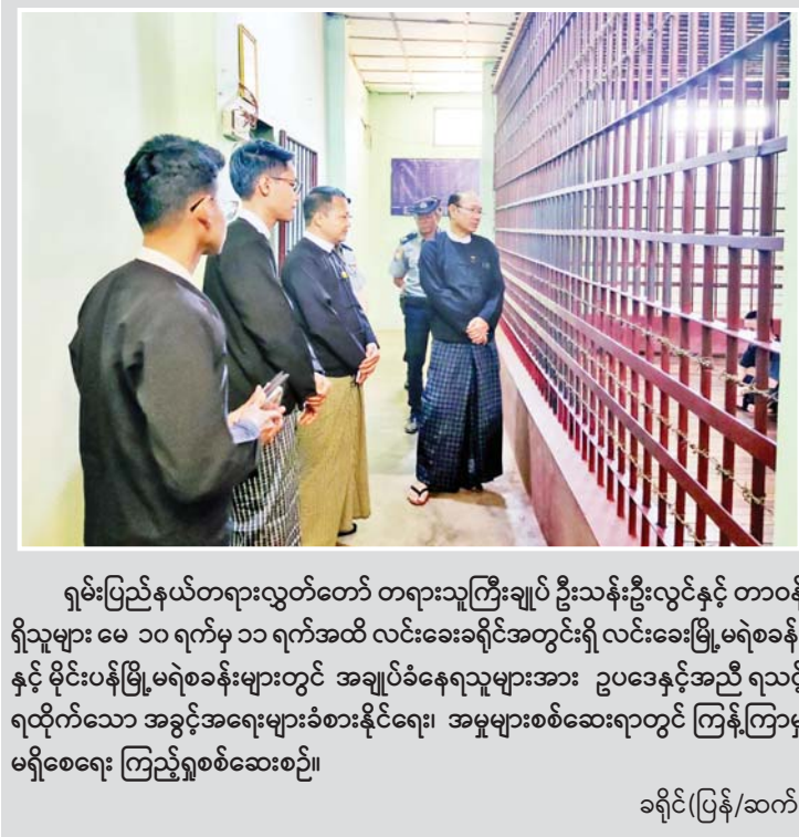
ရမ်းပြည်နယ်တရားလွှတ်တော် တရားသူကြီးချုပ် ဦးသန်းဦးလွင်နှင့် တာဝန် ရှိသူများ မေ ၁၀ ရက်မှ ၁၁ ရက်အထိ လင်းခေးခရိုင်အတွင်းရှိ လင်းခေးမြို့မရဲစခန်း နှင့် မိုင်းပန်မြို့မရဲစခန်းများတွင် အချုပ်ခံနေရသူများအား ဥပဒေနှင့်အညီ ရသင့် ရထိုက်သော အခွင့်အရေးများခံစားနိုင်ရေး၊ အမှုများစစ်ဆေးရာတွင် ကြန့်ကြာမှု မရှိစေရေး ကြည့်ရှုစစ်ဆေးစဉ်။ ခရိုင်(ပြန်/ဆက်)

အရေးယူခြင်းများ ဆောင်ရွက်ခဲ့ရသည်။ ထိုကဲ့သို့ CRPH၊ NUG နှင့် ယင်းတို့၏ လက်အောက်ခံအဖွဲ့အစည်းများ၊ ယင်းတို့နှင့် ဆက်သွယ်နေသော အဖွဲ့အစည်းများ၊ လူပုဂ္ဂိုလ်များ သည် နိုင်ငံတော်တည်ငြိမ်အေးချမ်းရေးကို ပျက်ပြား စေရန်နှင့် အစိုးရယန္တရားများ ပျက်ပြားစေရန် ရည်ရွယ်လျက် လှုံ့ဆော်ခြင်း၊ ဝါဒဖြန့်ခြင်းများ ပြုလုပ်ခဲ့မှုအပေါ် အားပေးကူညီခြင်းပြုလုပ်ခဲ့သူများ အား ဥပဒေနှင့်အညီ ထိရောက်စွာအရေးယူသွားမည် ဖြစ်ကြောင်း သိရသည်။ သတင်းစဉ်