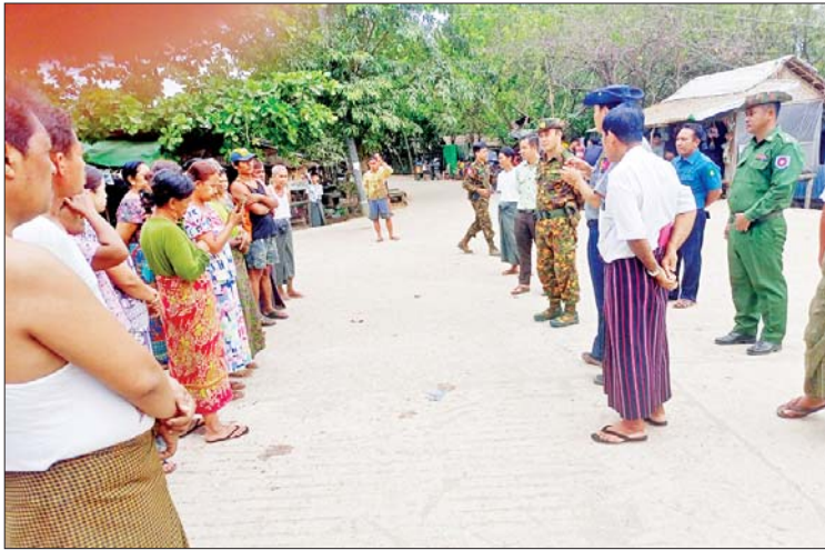
မြေပုံမြို့နယ်၌ မုန်တိုင်းအန္တရာယ်ကျရောက်နိုင်သည့်နေရာများမှ ပြည်သူများ နှင့် ပစ္စည်းများကို ဘေးလွတ်ရာသို့ ကြိုတင်ပြောင်းရွှေ့နိုင်ရေး တာဝန်ရှိသူများက ကွင်းဆင်းဆောင်ရွက်စဉ်။

ပြည်ထဲရေးဝန်ကြီးဌာန ကွပ်ကဲမှု အောက်ရှိမြန်မာနိုင်ငံရတပ်ဖွဲ့၊ အထွေထွေ အုပ်ချုပ်ရေးဦးစီးဌာနနှင့် မီးသတ် ဦးစီးဌာနတို့မှ မုန်တိုင်းဘေးအန္တရာယ် ကျရောက်လာပါက ကူညီကယ်ဆယ်ရေး လုပ်ငန်းများ၊ အရေးပေါ်ရှာဖွေကယ်ဆယ် ရေးလုပ်ငန်းများနှင့် အရေးပေါ်ပြုစုခြင်း၊ အရေးပေါ် ရွှေ့ပြောင်းပေးခြင်းလုပ်ငန်း များကို လျင်မြန်စွာတုံ့ပြန်ဆောင်ရွက်နိုင် ရေးအတွက် တိုင်းဒေသကြီး/ ပြည်နယ် အသီးသီး၌ ကြိုတင်ပြင်ဆင်ခြင်းလုပ်ငန်း များ၊ ဘေးအန္တရာယ်ကျရောက်နိုင်သော နေရာများမှ ပြည်သူများအား ကြိုတင် ရွှေ့ပြောင်းပေးခြင်း၊ ရှာဖွေကယ်ဆယ် ရေးလုပ်ငန်းသုံး ပစ္စည်းကိရိယာများ၊ ရိက္ခာများ အသင့်စုဖွဲ့ထားရှိခြင်းများ အရှိန်အဟုန်ဖြင့် ဆောင်ရွက်လျက် ရှိသည်။