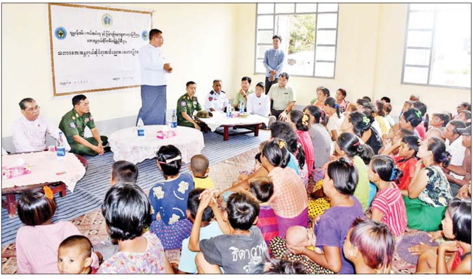
မွန်ပြည်နယ်ဝန်ကြီးချုပ် ဦးအောင်ကြည်သိန်း ချောင်းဆုံမြို့နယ် နတ်မှော်ကျေးရွာရှိ ဒေသခံပြည်သူများအား တွေ့ဆုံအားပေးစဉ်။