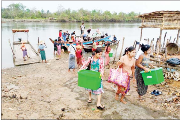
တောင်ကုတ်မြို့နယ်၌ မုန်တိုင်းအန္တရာယ်ကျရောက်နိုင်သည့်ကျေးရွာများမှ ပြည်သူများ မုန်တိုင်းဘေးလွတ်ရာ ယာယီခိုလှုံရာစခန်းများသို့ ရွှေ့ပြောင်းစဉ်။

ထိုသို့ဆောင်ရွက်လျက်ရှိရာ ယနေ့ တွင် ချင်းပြည်နယ် ဟားခါးမြို့နယ်တွင် လည်းကောင်း၊ တနင်္သာရီတိုင်းဒေသကြီး