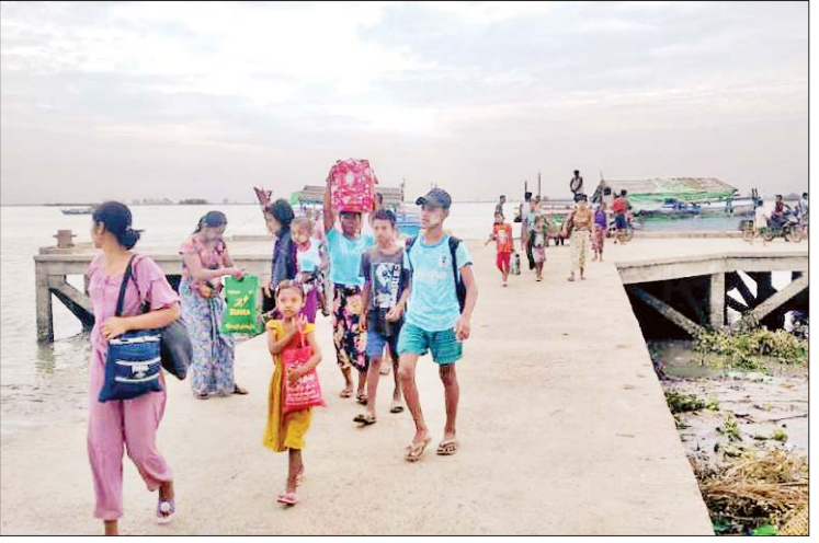
ပေါက်တောမြို့နယ်၌ မုန်တိုင်းအန္တရာယ်ကျရောက်နိုင်သည့်ကျေးရွာများမှ ပြည်သူများ မုန်တိုင်းဘေးလွတ်ရာ ယာယီခိုလှုံရာစခန်းများသို့ ရွှေ့ပြောင်းစဉ်။