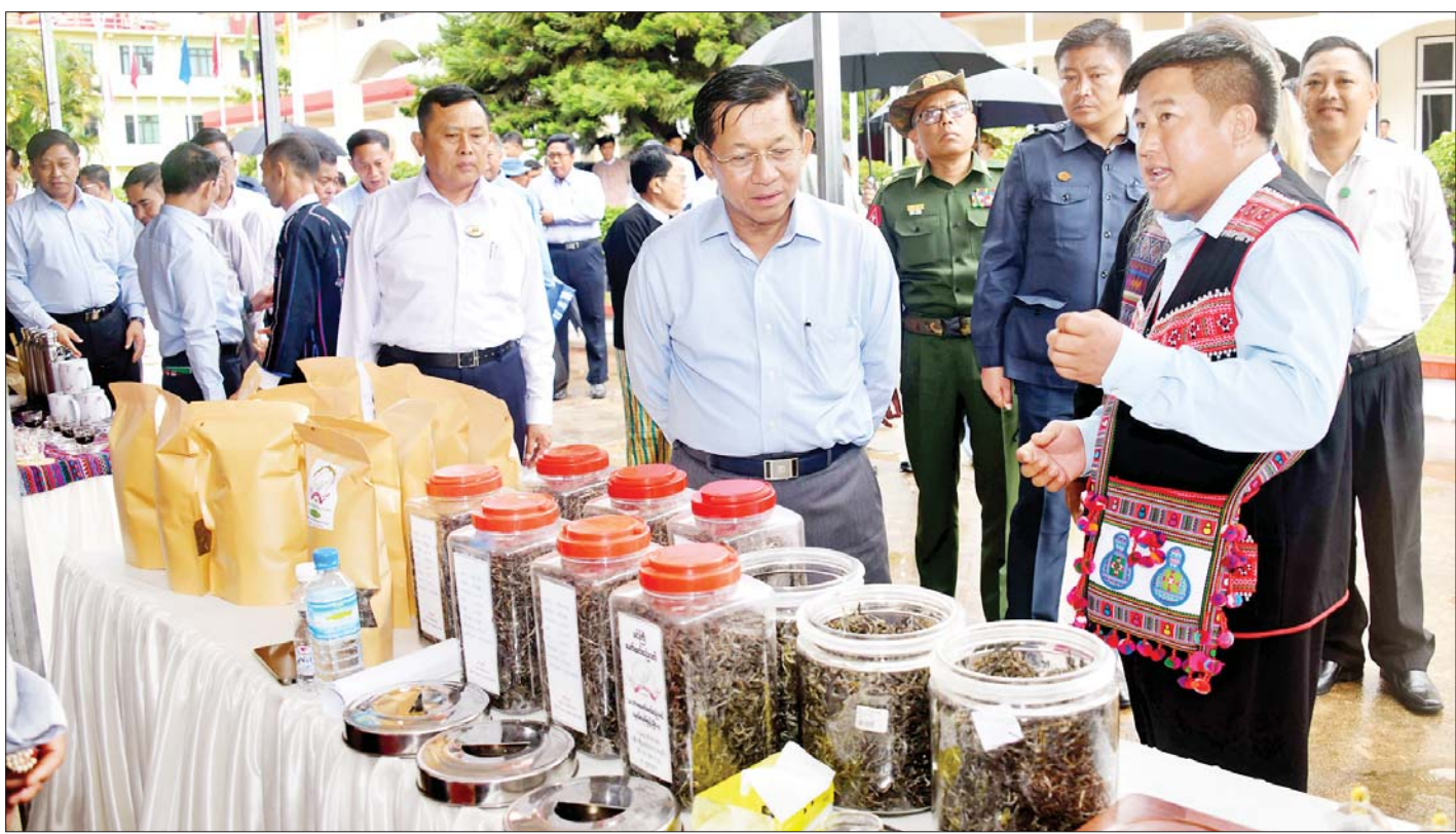
နိုင်ငံတော်စီမံအုပ်ချုပ်ရေးကောင်စီဥက္ကဋ္ဌ နိုင်ငံတော်ဝန်ကြီးချုပ် ဗိုလ်ချုပ်မှူးကြီးမင်းအောင်လှိုင် ခင်းကျင်းပြသထားသည့် ထုတ်ကုန်ပစ္စည်းများကို ကြည့်ရှုလေ့လာစဉ်။

လူသားအရင်းအမြစ်များ ဖွံ့ဖြိုးတိုးတက်ရေးအတွက် ပညာတတ်များ မွေးထုတ်ပေးရန်လိုကြောင်း၊ နိုင်ငံတော်အနေဖြင့် လူသားအရင်းအမြစ်များ ရရှိရေးအတွက် ခရိုင် ၅၀ တွင် စိုက်ပျိုးမွေးမြူရေး အထက်တန်းကျောင်းများကို ဖွင့်လှစ်ရန်ဆောင်ရွက် လျက်ရှိကြောင်း၊ ထိုမှတစ်ဆင့် အဆင့်မြင့်ပညာရပ်