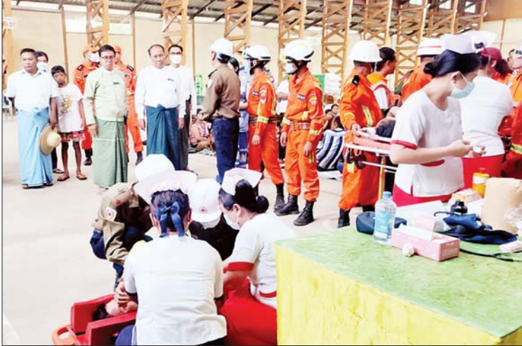
ရော့ဝတီတိုင်းဒေသကြီး သယံဇာတရေးရာဝန်ကြီး ဦးအုန်းမြင့်နှင့်တာဝန်ရှိသူများ ညောင်တုန်းမြို့နယ်၌ သဘာဝဘေးဖြစ်ပေါ်လာပါက ကာကွယ်နိုင်ရေး ဇာတ်တိုက်လေ့ကျင့်နေမှုအား ကြည့်ရှုစစ်ဆေးစဉ်။

ရော့ဝတီတိုင်းဒေသကြီး ဝန်ကြီးချုပ် ဦးတင်မောင်ဝင်း ဟိုင်းကြီး ကျွန်းမြို့ရှိ ရေဘေးရှောင်ပြည်သူများအား ထောက်ပံ့ရေးပစ္စည်းများ ပေးအပ်ပွဲတွင် အားပေးနှစ်သိမ့်စကားပြောကြားစဉ်။