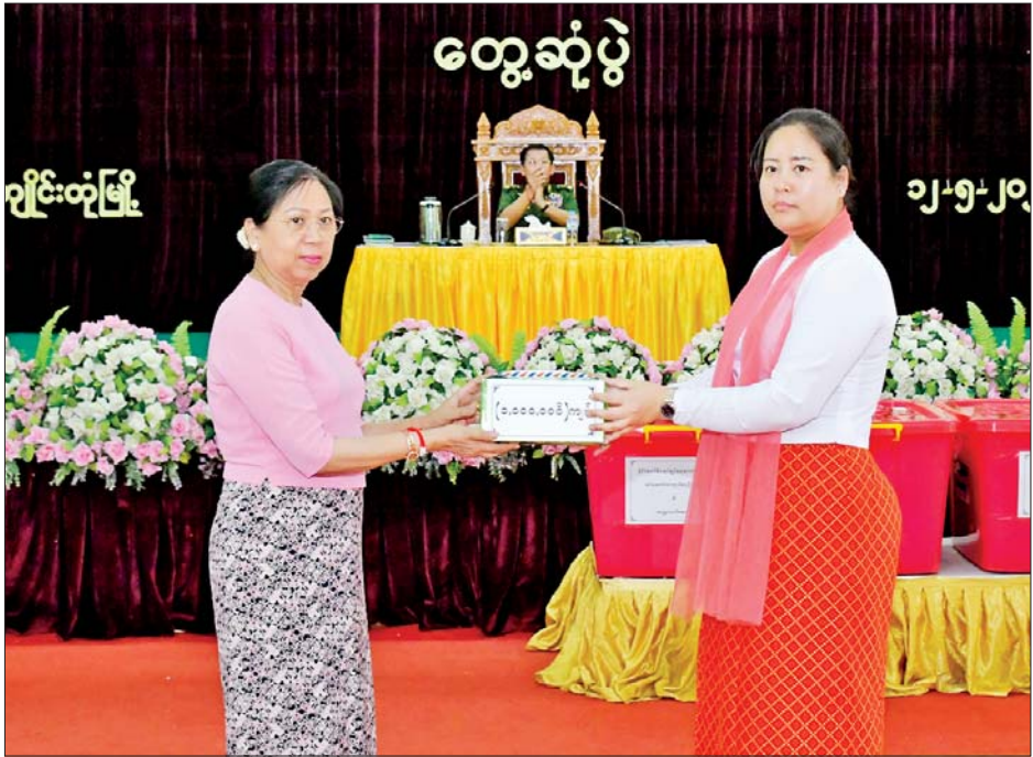
နိုင်ငံတော်စီမံအုပ်ချုပ်ရေးကောင်စီဥက္ကဋ္ဌ တပ်မတော်ကာကွယ်ရေးဦးစီးချုပ် ဗိုလ်ချုပ်မှူးကြီး မင်းအောင်လှိုင်၏ဇနီး ဒေါ်ကြူကြူလှ ကြိုဂံဒေသတိုင်းစစ်ဌာနချုပ် ကျိုင်းတုံတပ်နယ် မိခင်နှင့်ကလေး စောင့်ရှောက်ရေးအသင်းအတွက် ချီးမြှင့်ငွေပေးအပ်စဉ်။

★ ရှေ့ဖုံးမှ ယခုကဲ့သို့ တွေ့ဆုံရသည့်အတွက် ဝမ်းမြောက်မိပါကြောင်း၊ နိုင်ငံတော် တွင်ဖြစ်ပေါ်ခဲ့သည့် အခြေအနေ များအရ တပ်မတော်အနေဖြင့် နိုင်ငံတော်၏ တာဝန်များကို ထမ်းဆောင်ခဲ့ရပြီး ယင်းကာလ သည် ကိုဗစ်-၁၉ ရောဂါ ဖြစ်ပွားမှု များ ပြင်းထန်ချိန်၊ စီးပွားရေး ကျဆင်းနေချိန် ဖြစ်ကြောင်း၊ အလားတူနိုင်ငံရေးအရမတည်ငြိမ် မှုများ ဖြစ်ပေါ်နေချိန်လည်းဖြစ် ကြောင်း၊ ယေဘုယျအားဖြင့် ဒီမိုကရေစီစနစ်ကို ကျင့်သုံးနေချိန် ဖြစ်သဖြင့် စီးပွားရေးကောင်းမွန် သည်ဟု ထင်ရသော်လည်း နိုင်ငံတော်အနေဖြင့် ပြည်ပ ကြွေးမြီများ များပြားလျက်ရှိ ကြောင်း၊ စီမံခန့်ခွဲမှုအားနည်းခဲ့မှု များကြောင့် နိုင်ငံ၏စီးပွားရေးမှာ အနုတ်လက္ခဏာအထိရှိခဲ့ကြောင်း၊ ထို့ကြောင့်မိမိတို့တာဝန်ယူရသည့် အချိန်တွင် နိုင်ငံစီးပွားမြှင့်တင်ရေး အတွက် အလေးပေးဆောင်ရွက်ခဲ့ ကြောင်း၊ ကိုဗစ် - ၁၉ ရောဂါ ကာကွယ်၊ ကုသ၊ ထိန်းချုပ်ရေး လုပ်ငန်းများကိုလည်း အရှိန် အဟုန်ဖြင့် ကြိုးပမ်းဆောင်ရွက် ခဲ့ပြီး တာဝန်ကျေပွန်သည့် ကျန်းမာရေးဝန်ထမ်းများ၊ လူမှုရေး အဖွဲ့အစည်းများနှင့် ပြည်သူများ အားလုံးက ဝိုင်းဝန်းပါဝင် ဆောင်ရွက်မှုများ၊ အိမ်နီးချင်းနိုင်ငံ များနှင့်မိတ်ဆွေနိုင်ငံများ၏ ကူညီ ပေးမှုများကြောင့် အချိန်အတိုင်း အတာတစ်ခုအတွင်း ထိန်းချုပ် နိုင်ခဲ့ကြောင်း။