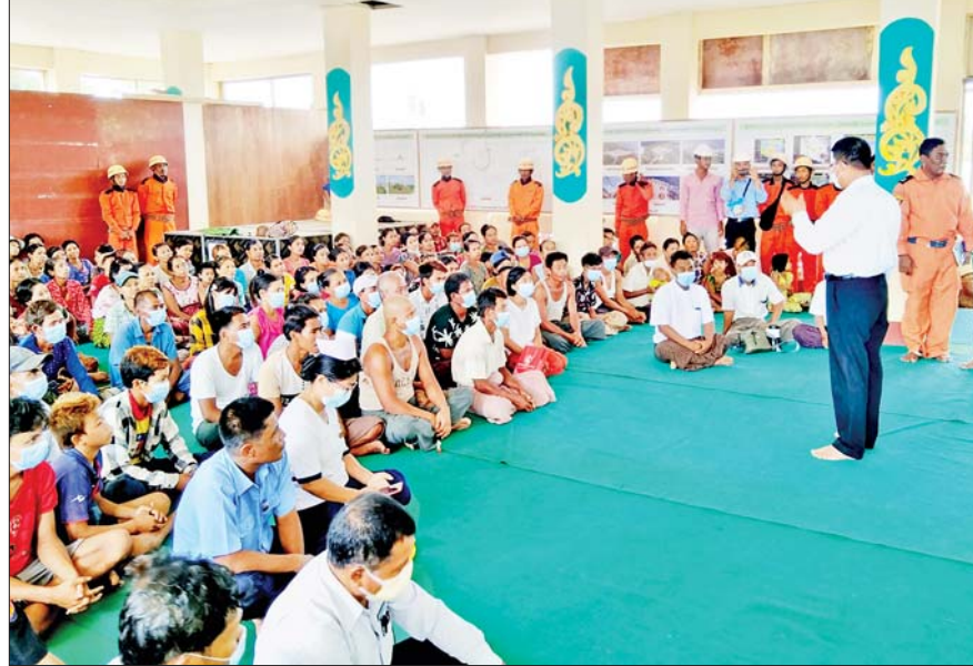
သွားရောက် ကြည့်ရှုအားပေးကြပြီး သဘာဝဘေးအန္တရာယ်ကြိုတင်ကာကွယ်ရေးပစ္စည်းများနှင့် အထောက်အကူပြုပစ္စည်းများကို ထောက်ပံ့ပေးအပ်ကာ လိုအပ်သည်များ ညှိနှိုင်းဆောင်ရွက်ပေးသည်။

တွင် ရှမ်းပြည်နယ်(တောင်ပိုင်း) ပင်လောင်းမြို့နယ် ကံသာဦးရပ်ကွက်ရှိ ပင်လောင်းမြို့နယ်အားကစားကွင်း၌ လည်းကောင်း၊ မွန်ပြည်နယ် ချောင်းဆုံမြို့နယ်ရှိ နတ်မှော်ကျေးရွာ ဆိုင်ကလုန်းစင်တာ၌ လည်းကောင်း၊ စစ်ကိုင်းတိုင်းဒေသကြီး ခန္တီးတပ်နယ်၌ လည်းကောင်း စုဖွဲ့၍ နယ်မြေခံတပ်မတော်သားများက ပြည်သူ့စစ်(ဌာန) တပ်ဖွဲ့ဝင်များ၊ မြန်မာနိုင်ငံရဲတပ်ဖွဲ့ဝင်များ၊ မီးသတ်တပ်ဖွဲ့ဝင်များ၊ ကြက်ခြေနီတပ်ဖွဲ့ဝင်များ၊ လူမှုကယ်ဆယ်ရေးအဖွဲ့များ၊ ဒေသခံတိုင်းရင်းသားပြည်သူများနှင့် ပူးပေါင်း၍ ဇာတ်တိုက်လေ့ကျင့်မှုများ၊ ပြင်ဆင်စုဖွဲ့မှုများကို ဆောင်ရွက်ကြသည်။ ယင်းသို့ ဆောင်ရွက်နေမှုများကို သက်ဆိုင်ရာတိုင်းဒေသကြီးနှင့် ပြည်နယ်များမှ ဝန်ကြီးချုပ်များ၊ တိုင်းစစ်ဌာနချုပ်များမှ တိုင်းမှူးများနှင့် တာဝန်ရှိသူများက