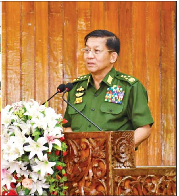
နိုင်ငံတော်စီမံအုပ်ချုပ်ရေးကောင်စီဥက္ကဋ္ဌ တပ်မတော်ကာကွယ်ရေးဦးစီးချုပ် ဗိုလ်ချုပ်မှူးကြီးမင်းအောင်လှိုင် ကျင်းပတိုက်ပွဲအရပ်မှ အရာရှိ၊ စစ်သည်၊ မိသားစုများအား တွေ့ဆုံ အမှာစကားပြောကြားစဉ်။