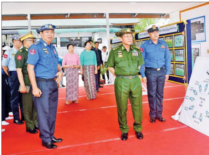
နိုင်ငံတော်စီမံအုပ်ချုပ်ရေးကောင်စီဥက္ကဋ္ဌ တပ်မတော်ကာကွယ်ရေးဦးစီးချုပ် ဗိုလ်ချုပ်မှူးကြီးမင်းအောင်လှိုင် ကျိုင်းတုံမြို့ နောင်တုံကန်အတွင်း၌ တပ်မတော်(ရေ) ရေကြောင်းလူငယ်အခြေခံသင်တန်း ကျိုင်းတုံစခန်းမှ သင်တန်းသား သင်တန်းသူများ၏ လေ့ကျင့်ရေးဆောင်ရွက်မှုကို ကြည့်ရှုစဉ်။

ထို့နောက် နိုင်ငံတော်စီမံအုပ်ချုပ် ရေးကောင်စီဥက္ကဋ္ဌ တပ်မတော် ကာကွယ်ရေးဦးစီးချုပ်က ကျိုင်းတုံ တပ်နယ်မှ အရာရှိ၊ စစ်သည်၊ မိသားစုများအတွက် စားသောက် ဖွယ်ရာပစ္စည်းများကို ပေးအပ်ရာ တိုင်းမှူးက လည်းကောင်း၊